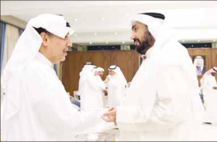
... وترحيب بالشيخ باسل الصباح