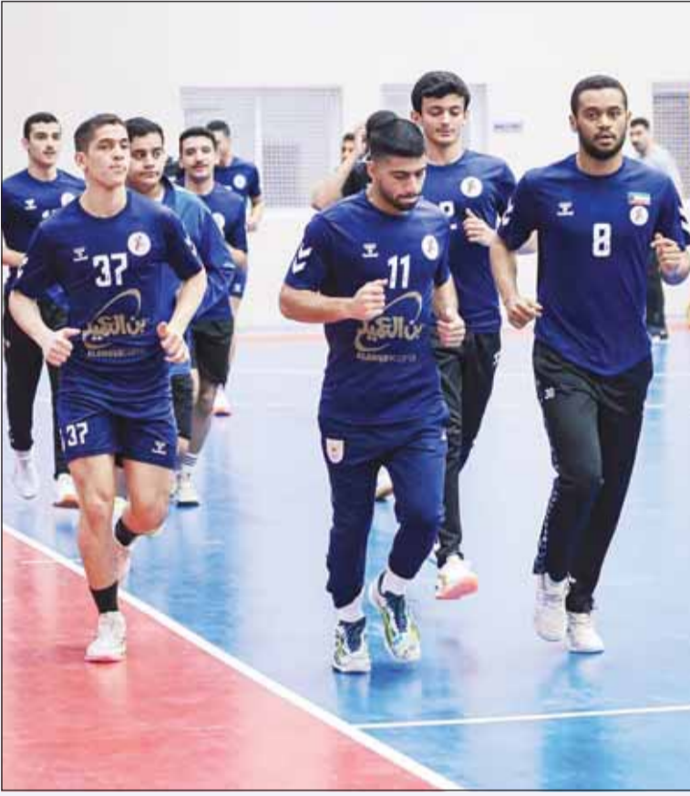
جانب من تدريبات منتخبنا الوطني