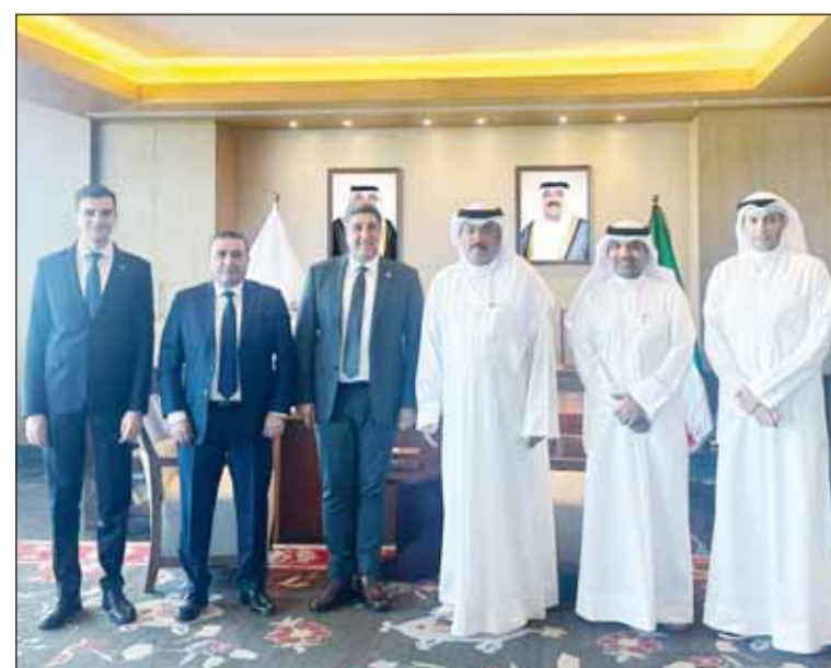
وزير التربية سيد جلال الطيباني، مستقبلاً سفير أرمينيا د. أرسين أراكليان والوفد المرافق

بحث وزير التربية سيد جلال الطيباني، أمس، مع سفير جمهورية أرمينيا الصديقة لدى دولة الكويت الدكتور أرسين أراكليان تعزيز سبل التعاون التربوي بين البلدين. وقالت الوزارة في بيان إن الجانبين بحثا عدداً من الموضوعات ذات الاهتمام المشترك في المجالات التربوية والتعليمية بما يخدم العملية التعليمية إلى جانب التأكيد على أهمية الدور التربوي والثقافي للمؤسسات التعليمية في تعزيز التواصل الحضاري والثقافي. وأكد الجانبان أهمية تعزيز أواصر التعاون وتبادل الخبرات بما يسهم في دعم العلاقات الثنائية وتطوير مجالات العمل التربوي والتعليمي بين البلدين الصديقين. رافق السفير السكرتير الثالث في السفارة فلاديمير بارسيفيان ومدير المدرسة الأرمينية في الكويت الدكتور ترسييس سركيسيان.