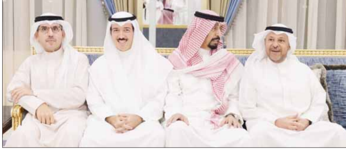
الشيخ عذبة العذبة والشيخ علي الخالد والشيخ أحمد الجابر والشيخ د. أحمد الناصر