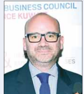
السفير الفرنسي أوليفييه غوفان