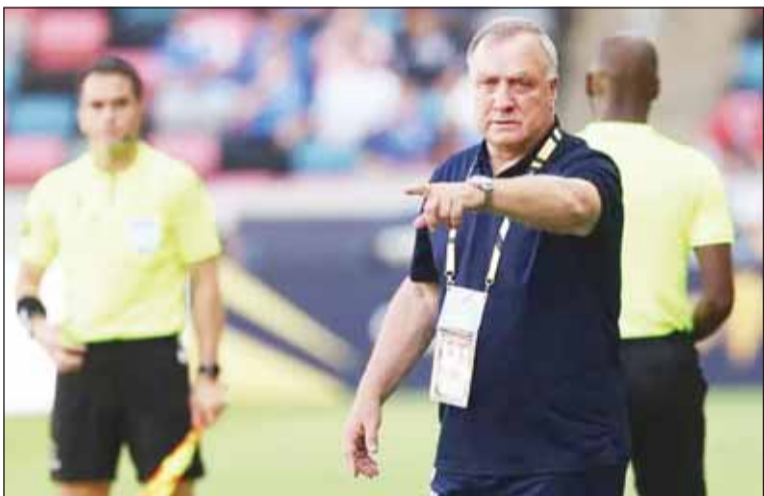
أدفوكات سيصبح أكبر مدربي هولندا

لكنهم من أصول كوراساوية، وقد لعب عدد منهم لمنتخب هولندا في فئات الشباب. تأهل الفريق للبطولة الموسعة التي تضم 48 منتخباً بعد تصدده مجموعة في اتحاد الكونكاف ضمت جامايكا، وترينيداد وتوباغو، وبرمودا. وفي مؤتمر صحفي أول من أمس، كشف رئيس اتحاد كوراساو، جيلبرت مارتينا، أن أدفوكات، الذي كان يحظى بشعبية لدى اللاعبين، سيعود لقيادة الفريق، وكما ذكرت وكالة رويترز، قال مارتينا إن صحة ابنة أدفوكات قد تحسنت.