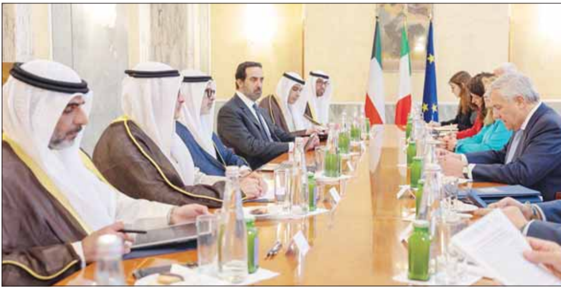
وزير الخارجية الشيخ جابر الجابر خلال لقائه نظيره الإيطالي أنطونيو تياياني

بعث سمو أمير البلاد الشيخ مشعل الأحمد، برسالة خطية إلى رئيسة وزراء الجمهورية الإيطالية الصديقة جورجيا ميلوني، تتعلق بأواصر العلاقات التاريخية الوثيقة التي تربط البلدين والشعبين الصديقين، وأطر تعزيزها وتنميتها، إلى جانب التطورات الراهنة في المنطقة. وقام بتسليم الرسالة، وزير الخارجية الشيخ جراح الجابر، إلى أنطونيو تياياني، نائب رئيس الوزراء وزير الخارجية والتعاون الدولي بالجمهورية الإيطالية الصديقة، خلال الاجتماع الذي تم بينهما أمس في إطار الزيارة الرسمية التي قام بها إلى العاصمة الإيطالية، روما.