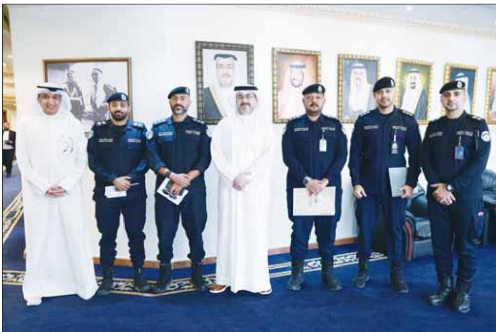
محافظ العاصمة الشيخ عبدالله بن سالم الخاطر مع مسؤولي قيادة المرور بالمحافظة خلال اللقاء

أكد محافظ العاصمة الشيخ عبدالله سالم العلي الصباح أهمية الدور الحيوي الذي تضطلع به الإدارة العامة للمرور باعتبارها إحدى الركائز الأساسية في منظومة الأمن والسلامة وتنظيم الحركة المرورية وتحقيق الانسيابية في مختلف الطرق والشوارع، بما يسهم في الحفاظ على أرواح المواطنين والمقيمين وتحقيق السلامة العامة.