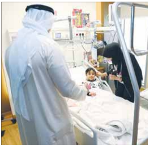
تقديم هدية إلى أحد الأطفال

تضمنت مجموعة "الساير"، وأضفت، "لا يقتصر دور KIB على الرعاية فحسب، بل يمتد إلى الدعم الإعلامي والمعنوي ومواكبة مشاركة الرياضيين الكويتيين ميدانياً، بما يعكس إيماننا بأهمية تكامل جهود القطاعين العام والخاص لدعم الرياضة الوطنية وإبراز الكويت بأفضل صورة في مختلف المحافل".