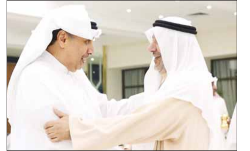
الشيخ حمد مرحباً بالشيخ فهد الجابر