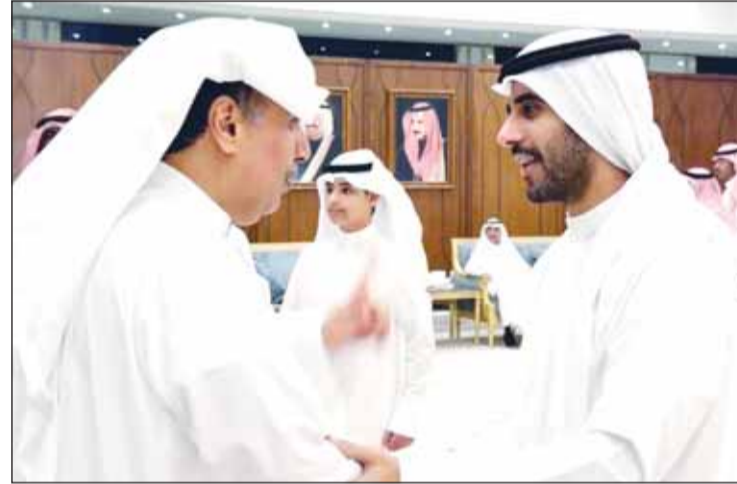
... ومرحباً بالشيخ مبارك فهد الجابر