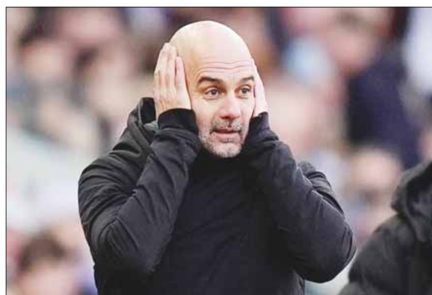
بيب غوارديولا مدرب مانشستر سيتي

شبه بيب غوارديولا، مدرب مانشستر سيتي، نظام حكم الفيديو المساعد برمي العملة المعدنية، موضحاً أن على فريقه أن يلعب بشكل جيد بما يكفي لتجنب أي تأثير للقرارات التي تتخذ ضدهم. خضعت تقنية الفيديو المساعد لتدقيق متجدد هذا الأسبوع بعد إلغاء هدف التعادل المتأخر لوست هام يونايتد في رمي أرسنال متصدر الدوري الإنجليزي الممتاز، وهو قرار قد يجتث أنه حاسم في سياق اللقب.