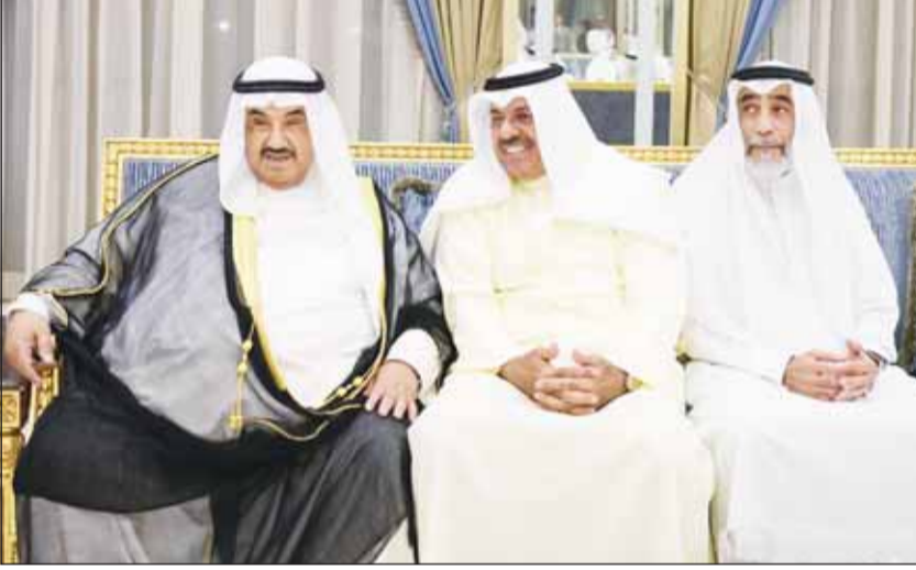
سمو الشيخ ناصر المحمد وسمو الشيخ أحمد النواف والشيخ حمد الخالد

استقبل وزير شؤون الديوان الأميري الشيخ حمد جابر العلي، في ديوانه بسلاوي، سمو الشيخ ناصر المحمد وسمو الشيخ أحمد النواف، إلى جانب عدد من الشيوخ والشخصيات والأصدقاء ورواد الديوان، وذلك في أجواء اجتماعية وندية عكست روح الألفة والتواصل التي تتميز بها الدواوين الكويتية. ورحب الشيخ حمد بالحضور، مؤكداً أهمية هذه اللقاءات الاجتماعية في تعزيز الترابط بين أبناء المجتمع الكويتي، وضرورة استمرار الدور الذي تؤديه الدواوين في توثيق العلاقات وتبادل الآراء في مختلف القضايا والشؤون العامة. حضور الديوان وما دار فيه من أحاديث ودية اتسمت بالمحبة والتقدير، أكت مجدداً المكانة الاجتماعية التي تحظى بها الدواوين الكويتية، باعتبارها ملتقى يجمع الأهل والأصدقاء، ويعمق روح الأسرة الكويتية الواحدة.