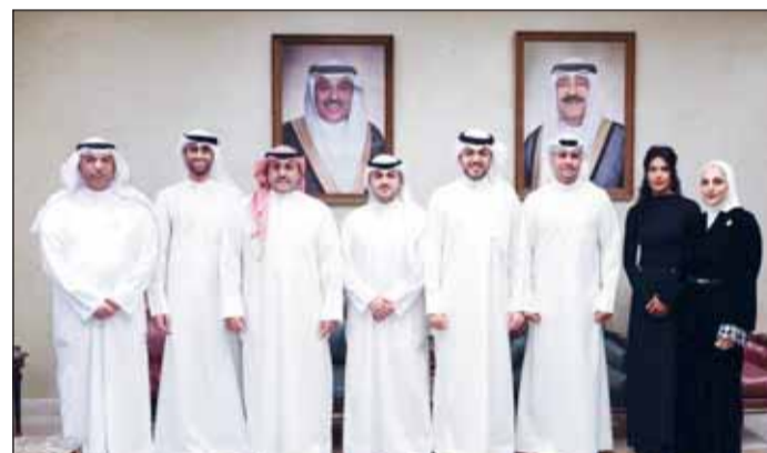
فريق البنك المشارك في الفعاليات مع أعضاء السفارة

تضمنت مجموعة "الساير"، وأضفت، "لا يقتصر دور KIB على الرعاية فحسب، بل يمتد إلى الدعم الإعلامي والمعنوي ومواكبة مشاركة الرياضيين الكويتيين ميدانياً، بما يعكس إيماننا بأهمية تكامل جهود القطاعين العام والخاص لدعم الرياضة الوطنية وإبراز الكويت بأفضل صورة في مختلف المحافل".