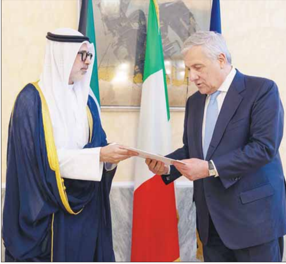
وزير الخارجية الشيخ جابر الجابر يسلم رسالة الأمير إلى نظيره الإيطالي