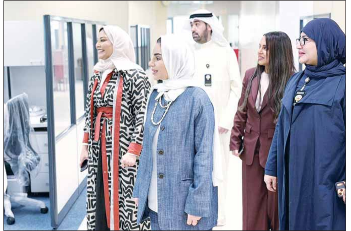
وزيرة الشؤون د. أمثال الحويلة خلال تفقدها إدارات التعاون في مجمع الوزارات

دعم جميع الخطوات الرامية إلى تطوير القطاع ورفع كفاءته الإدارية والرقابية