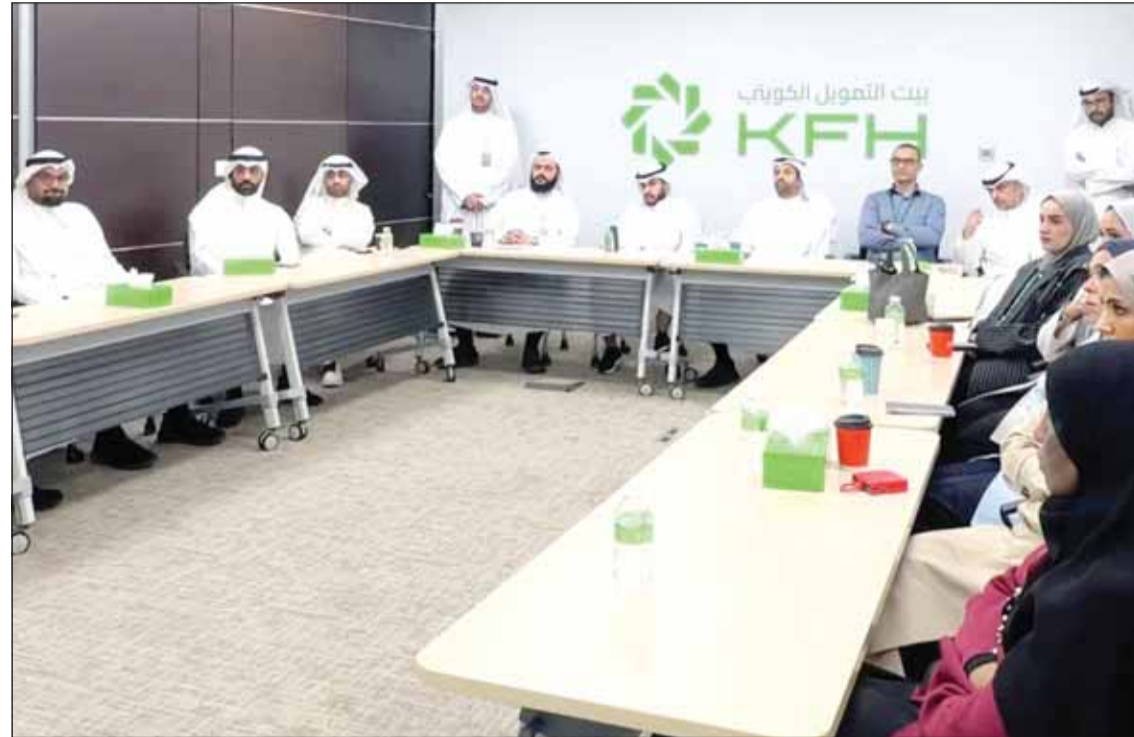
جانب من ورشة العمل

تعزيز وعي الموظفين بدوافع وأساليب ارتكاب جرائم الاحتيال، من خلال عرض نماذج وحوالات واقعية، مع التأكيد على أهمية حماية خصوصية البيانات، وضرورة عدم التفاعل مع أي تواصل مشبوه أو الاستجابة لطلبات غير رسمية. وشدد على ضرورة عدم مشاركة كلمات المرور أو رموز التحقق أو الأرقام السرية للبطاقات الائتمانية، مؤكداً أهمية التحلي بالحيطه والحذر من الرسائل الاحتيالية التي تنتقل صفة جهات رسمية وتدعو إلى الضغط على روابط مشبوهة أو مشاركة رمز التحقق (OTP) لجميع عملاء بيت التمويل الكويتي وكافة الجمهور. وأوضح أن تجاهل هذه الرسائل الإلكترونية مجهولة المصدر وعدم التفاعل معها يُعد خط الدفاع الأول للوقاية من الوقوع ضحية لعمليات الاحتيال، ويسهم في حماية أموال وبيانات العملاء. كما حذر الزمامي الجمهور من أساليب الاحتيال التي تعتمد على استخدام تقنيات الذكاء الاصطناعي لتقليد أصوات أشخاص حقيقيين بدقة عالية، ثم التواصل مع معارف أصحاب هذا الصوت من خلال مكالمات هاتفية أو عبر وسائل التواصل الاجتماعي وإقناعهم بتحويل أموال بشكل عاجل، مما يضيء مصداقية على عملية الاحتيال. ويواصل بيت التمويل الكويتي جهوده ومبادراته لتوعية موظفيه والجمهور ضد أساليب الاحتيال الجديدة، وذلك في إطار برنامج المسؤولية المجتمعية الذي يقدم من خلاله دوراً رائداً في التوعية المجتمعية وبناء مجتمع مالي أكثر أماناً.