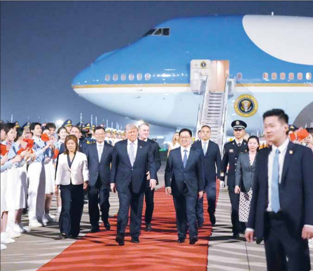
الرئيس الأميركي دونالد ترامب لده وصوله إلى بكين أمس حيث كان نائب الرئيس الصيني هان تشنغ في مقدمة مسقبيه في مطار بكين الدولي

واشنطن، طهران، عواصم - وكالات، فيما تتجه الأنظار إلى القمة المرتقبة بينه وبين الرئيس الصيني شي جين بينغ، على أمل أن تحمل أخبارا سارة للعالم بشأن حل الأزمة المتصاعدة بين أميركا وإيران والتي تنذر بعودة الحرب، أكد الرئيس الأميركي دونالد ترامب أن بلاده ليست بحاجة لمساعدة الصين لإنهاء الحرب مع إيران، وقبيل مغادرته العاصمة واشنطن متوجها إلى بكين التي وصلها أمس، قال ترامب إنه يرتبط بعلاقات جيدة جدا مع نظيره الصيني، مضيفا "لكنني لا أعتقد أنني سأحتاج مساعدة الصين فيما يتعلق بإيران وسننتصر بطريقة أو بأخرى"، متعبا أنه والزعيم الصيني سيحدثان حول الكثير من الأمور ويطلعان لأن يكون اللقاء رفعا لبلديهما، مشيرا إلى أن نظيره الصيني سيزور الولايات المتحدة في وقت لاحق من هذا العام، مجددا أن "إيران لا يمكن أن تمتلك سلما نوويا وهم وافقوا على ذلك"، مندرا النظام الإيراني بأن يفعل ما هو مطلوب منه أو "أننا سنهني المهمة"، وشدد مجددا على أن إيران هزمت عسكريا والنصار المحكم عليها فعال 100 بالمئة، مؤكدا أنه يسعى فقط لإبرام اتفاق جيد، متوقفا أن تنخفض أسعار النفط بشدة بعد الانتهاء من الحرب التي لن تكون طويلة، مشيرا إلى أن سفن الطاقة العالقة في مضيق هرمز سيتم الإفراج عنها وستتوفر كميات هائلة من النفط للسوق العالمي.