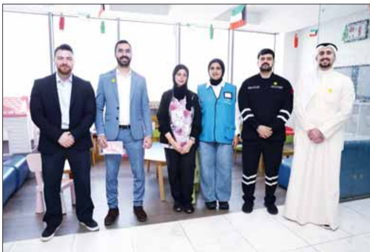
فريق الساير خلال الزيارة