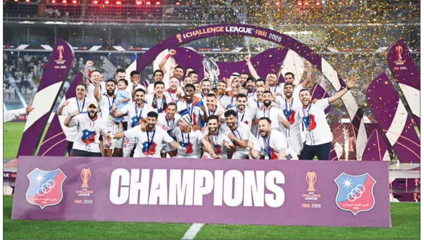
تنوير نادي الكويت بلقب دوري التحدي الآسيوي

وكان اتحاد اليد، قد باشر تدريبات المنتخبات الوطنية، بعد الإعلان عن عودة النشاط الرياضي الذي توقف منذ 28 فبراير الماضي بسبب الأعداء في منطقة الخليج العربي، كما يشارك الاتحاد حالياً في دورة الألعاب الخليجية الرابعة في العاصمة القطرية "الدوحة" بمنتخب الريفي، والذي يضم عدداً من لاعبي منتخب الشباب، وذلك لتجريب اللاعبين بالصورة المناسبة قبل الدخول في الاستحقاقات الخارجية على المستوى الآسيوي، في ظل ترحيل ما تبقى من منافسات الدوري وكأس الاتحاد العام لشهر أكتوبر المقبل، واعتماد نتائج الدوري للمراحل السنوية للموسم الحالي.