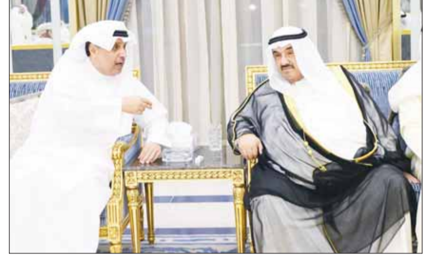
سمو الشيخ ناصر المحمد والشيخ حمد جابر العلي

استقبل وزير شؤون الديوان الأميري الشيخ حمد جابر العلي، في ديوانه بسلاوي، سمو الشيخ ناصر المحمد وسمو الشيخ أحمد النواف، إلى جانب عدد من الشيوخ والشخصيات والأصدقاء ورواد الديوان، وذلك في أجواء اجتماعية وندية عكست روح الألفة والتواصل التي تتميز بها الدواوين الكويتية. ورحب الشيخ حمد بالحضور، مؤكداً أهمية هذه اللقاءات الاجتماعية في تعزيز الترابط بين أبناء المجتمع الكويتي، وضرورة استمرار الدور الذي تؤديه الدواوين في توثيق العلاقات وتبادل الآراء في مختلف القضايا والشؤون العامة. حضور الديوان وما دار فيه من أحاديث ودية اتسمت بالمحبة والتقدير، أكت مجدداً المكانة الاجتماعية التي تحظى بها الدواوين الكويتية، باعتبارها ملتقى يجمع الأهل والأصدقاء، ويعمق روح الأسرة الكويتية الواحدة.