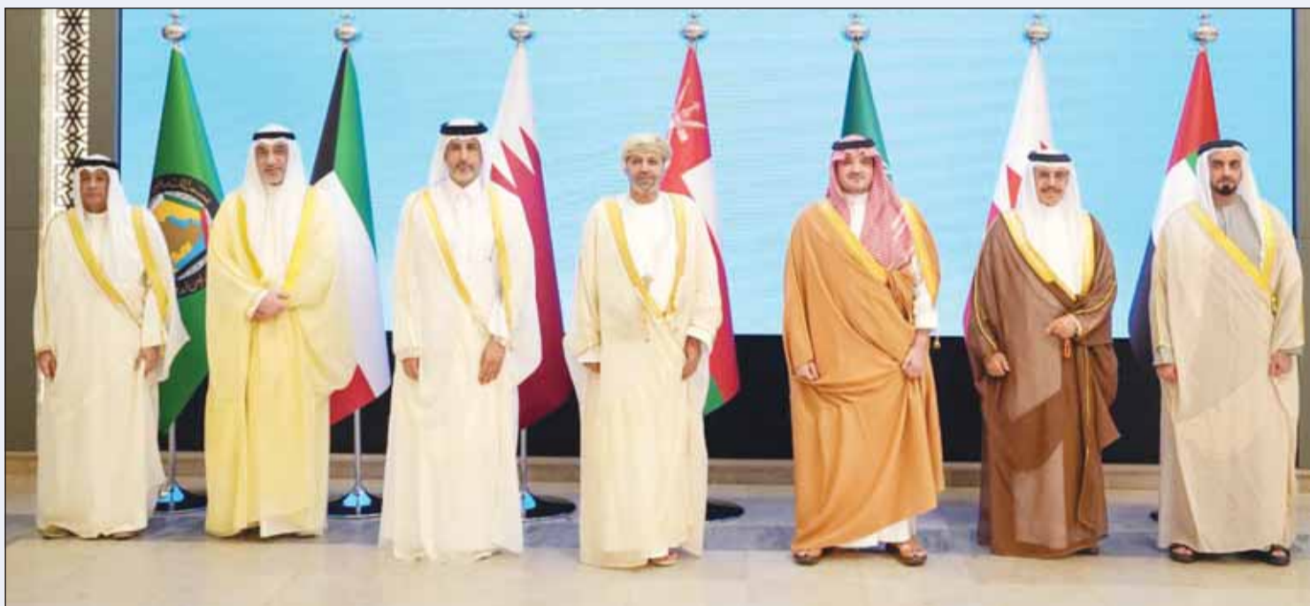
الأمين العام لمجلس التعاون جاسم البديوي ووزراء داخلية الخليجية خلال الاجتماع الطارئ في الرياض

□ ضبط خلايا الحرس الثوري يعكس كفاءة ويقظة الأجهزة الأمنية الخليجية وجاهزيتها