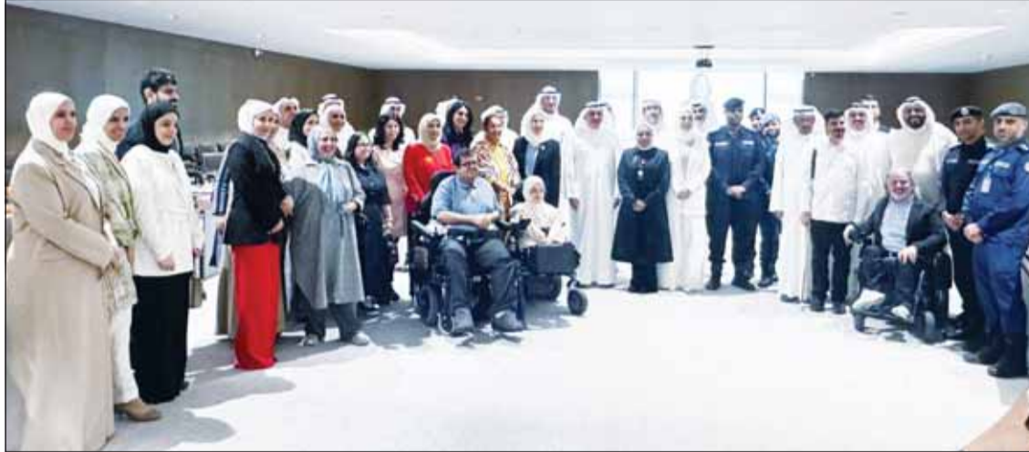
المشاركون في ورشة العمل

أثناء حالات الطوارئ، إلى جانب إشراك الجهات المختصة لوضع حلول عملية وآليات تنفيذ قابلة للتطبيق، تسهم في رفع جاهزية المنشآت وتعزيز إجراءات السلامة، وشددت على أهمية كود الكويت لإمكانية الوصول وفق التصميم العام، والذي أصبح تطبيقه إلزامياً بعد صدور القرار الوزاري رقم (696) لسنة 2024، ومبيحة أن الورشة سلطت الضوء على الجوانب المتعلقة بالتأهب والإخلاء في حالات الطوارئ ضمن الكود. كما أكدت الرمي أن سلامة الأشخاص ذوي الإعاقة مسؤولية وطنية مشتركة تتطلب تضافر الجهود بين مختلف الجهات، مشيرة إلى أن الورشة فرحت بعدد من التوصيات التي تسهم في تطوير خطط الإخلاء وتعزيز جاهزية المنشآت وضمان سلامة الجميع دون استثناء. وفي ختام الورشة، تقدمت اللجنة بالشكر والتقدير لجميع المشاركين، متمنة مشاركتهم البناءة وجهودهم في الخروج بتوصيات تدعم سلامة الأشخاص ذوي الإعاقة وتعزز دمجهم في المجتمع.