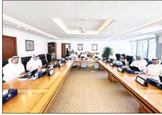
وزير التعليم العالي والبحث العلمي د.نادر الجلال مترئسا الاجتماع

عقد مجلس الجامعات الحكومية اجتماعه رقم (1/2026)، برئاسة وزير التعليم العالي والبحث العلمي الدكتور نادر الجلال، وبحضور أعضاء المجلس.