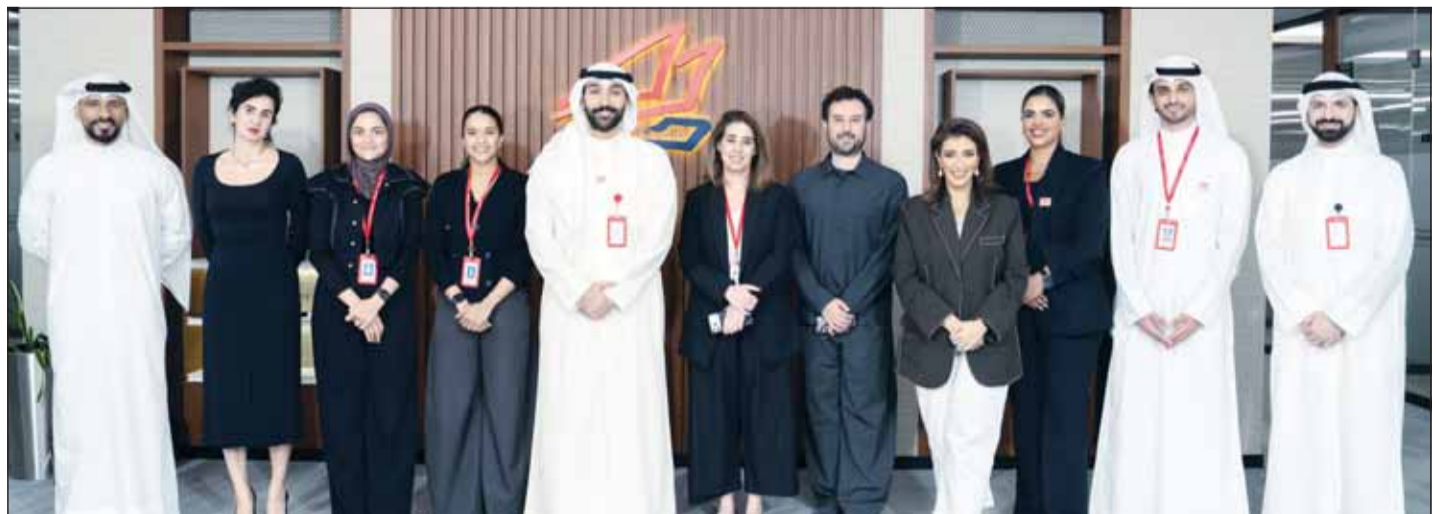
صورة جماعية لفريق بنك الخليج

3,500,000 دينار، وتشمل الجائزة الكبرى 1,500,000 دينار، وجائزة بقيمة 1,000,000 دينار، إضافة إلى خمسة فائزين بجائزة قدرها 200,000 دينار لكل منهم، في خمس سحبيات مختلفة على مدار العام. ويعد حساب "مليونير الدانة" أحد أبرز حسابات التوفير المرتبطة بالجوائز في دولة الكويت، إذ يواصل منذ إنطلاقه عام 1998 تمكين العملاء من بناء مستقبل مالي أكثر استقراراً. وقد صمّم الحساب لتعزيز ثقافة الادخار، ليكون خياراً مناسباً لشراحي المجتمع، من الأطفال إلى البالغين، ومن مختلف الجنسيات.