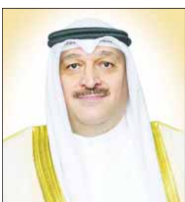
الوزير د. أحمد العوضي

أصدر وزير الصحة الدكتور أحمد العوضي قرارات وزارية بإلغاء ترخيص صيدليتين أهليتين وإيقاف صيدلية ثلاثة لمخالفات قانونية وتنظيمية في إطار حرص الوزارة على تعزيز الرقابة الدوائية وضمان الالتزام بالقوانين واللوائح المنظمة لمزاولة مهنة الصيدلة وتداول الأدوية. ونكرت وزارة الصحة في بيان، أمس، أن الوزير العوضي أصدر عدداً من القرارات بحق صيدليات أهلية مخالفة وذلك استناداً إلى توصيات اللجنة المختصة بالنظر في مخالفات المراكز الصيدلية وتداول الأدوية والمنتجات الطبية في اجتماعها الثالث لعام 2026. وأوضحت أن القرارات تضمنت إلغاء ترخيص صيدليتين بالمطابق أهلية وإلغاء كافة التراخيص الصادرة للصيدلية المزاولين لمهنة الصيدلة العاملين فيها وإلغاء كافة