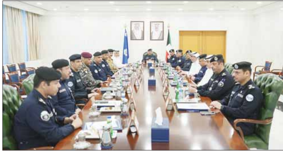
اللواء عبدالوهاب الوهيب مترأساً اجتماعاً أمنياً فاعياً للوزارة

ترأس وكيل وزارة الداخلية اللواء عبدالوهاب الوهيب، أمس الأربعاء، اجتماعاً أمنياً وتنسيقياً موسعاً في مقر الوزارة، حضره وكلاء الوزارة المساعدون وروساء القطاعات، وذلك للاطلاع على مستجدات الأوضاع الأمنية وتعزيز مستوى الجاهزية الرقابية في البلاد، إلى جانب متابعة سير المنظومة الأمنية والإدارية، وبحث سبل الارتقاء بالأداء المؤسسي. وفي مستهل الاجتماع نقل اللواء الوهيب تحيات وتقدير النائب الأول لرئيس مجلس الوزراء وزير الداخلية الشيخ فهد اليوسف إلى منتسبي القطاعات كافة.