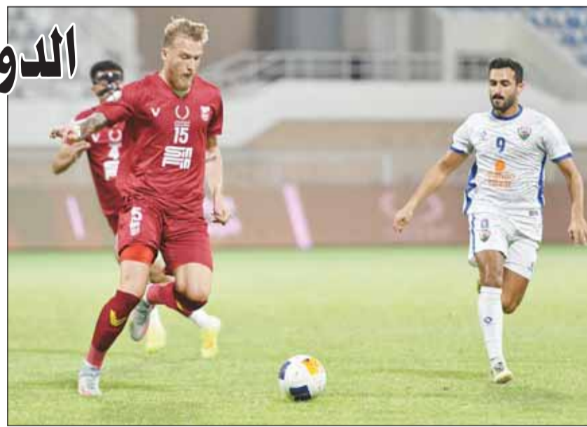
استئناف دوري "زين" بمواجهة الجهراء والنصر

تعود اليوم عجلة دوري زين الممتاز إلى الدوران مجدداً، بعد توقف دام 80 يوماً بسبب الظروف الراهنة التي مرت بها المنطقة منذ نهاية فبراير الماضي، وتقام مساء اليوم مباراة واحدة في الجولة الخامسة عشرة من البطولة، تجمع الجهراء والنصر على استاد مبارك العيار في الساعة 05:40 مساءً. وتستكمل الجولة غداً بلقاء الشباب وكاظمة في "الأحمدي"، وبعد غد بمواجهة القادسية والسالمية في "حولي"، فيما تأجلت مواجهتي العربي مع التضامن، الكويت مع الفحيحيل، وذلك بسبب فوض "الأبيض" و"الأخضر" نهائي كأس ولي العهد المقرر الاثنين المقبل. ويتصدر الكويت ترتيب البطولة برصيد 36 نقطة، ويشارك 12 نقطة عن