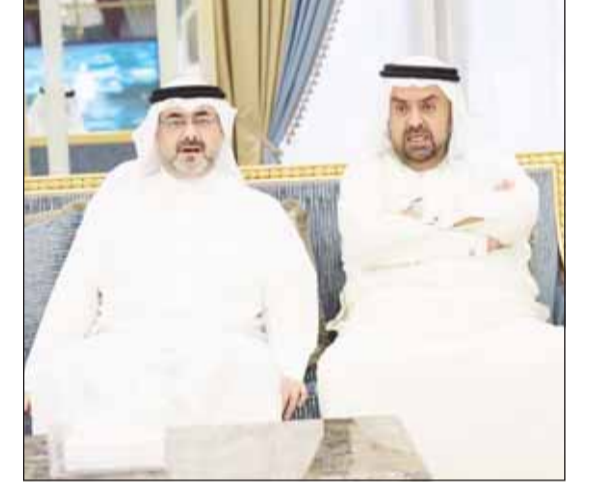
الشيخ خالد بدر المحمد والشيخ عبدالله سالم العلي