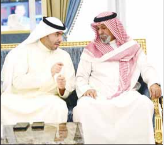
الشيخ سالم النواف والشيخ نواف أحمد النواف