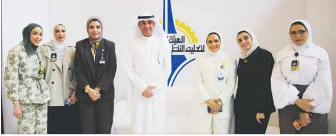
د.حسن الفجاءم خلال زيارته جناح الهيئة في معرض "دراستي"

الاستفسارات المتعلقة بالمسارات الدراسية والتدريبية. وقام مدير عام الهيئة العامة للتعليم التطبيقي والتدريب د. حسن الفجاءم بزيارة جناح الهيئة في المعرض، وأطلع على جهود فرق العمل المشاركة في استقبال الطلبة والزوار، مؤكداً حرص الهيئة المستمر على تعزيز التواصل المباشر مع الطلبة وتعريفهم بمختلف التخصصات الأكاديمية والتدريبية الحديثة، إضافة إلى إبراز الفرص التعليمية والتأهيلية التي توفرها الهيئة لإعداد كوادر وطنية قادرة على تلبية احتياجات سوق العمل في مختلف القطاعات. وأشاد د. الفجاءم بالجهود التنظيمية التي بذلتها الفرق المشاركة، والدور الإرشادي الذي قامت به في توجيه الطلبة ومساعدتهم على اتخاذ قراراتهم التعليمية والمهنية المستقبلية بالشكل الأمثل.