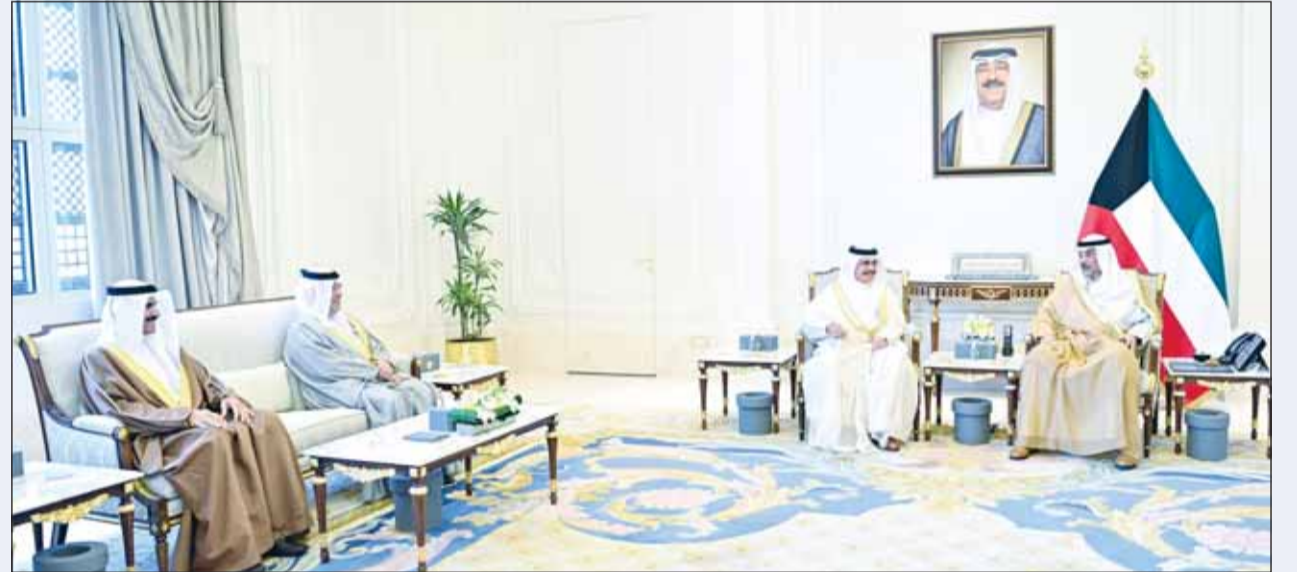
سمو ولي العهد الشيخ صباح الخالد مستقبلاً وزير الداخلية البحرينية الفريق أول الشيخ راشد بن عبدالله آل خليفة والوفد المرافق