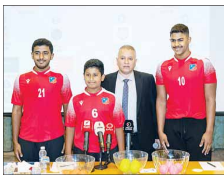
عجال مدوه ساهموا بعملية إجراء قرعة البطولة

ونوه الرشيدى، إلى أن نادي الكويت يعمل ضمن نظام احترافي شامل، وأن الرئيس الفخري مرزوق الغانم ورئيس النادي خالد الغانم هم من رسخوا هذا النظام لجميع الفرق، وأن "الأبيض" يدخل كل بطولة