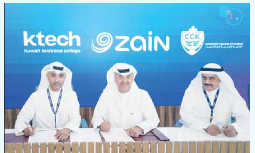
خلال توقيع الشراكة

شراكات استراتيجية مع مؤسسات رائدة في القطاع الخاص. ويأتي هذا التعاون ليعزز قدرتنا على تطوير بيئة تعليمية تستجيب للتحولات المتسارعة في سوق العمل، بما يسهم في إعداد طلبة قادرين على تقديم حلول مبتكرة ودعم مسارات التنمية في دولة الكويت من خلال التعليم التطبيقي الفعّال.