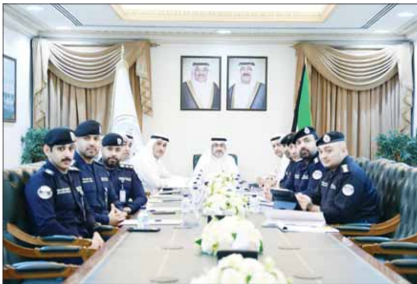
محافظ العاصمة ومحافظ الأحمدية خلال اجتماع اللجنة التنسيقية المشتركة

واصلت اللجنة التنسيقية المشتركة أعمالها، برئاسة محافظ العاصمة الشيخ عبدالله سالم العلي، حيث عقدت أمس اجتماعاً في ديوان المحافظة، بحضور محافظ الأحمدية الشيخ حمود جابر الأمد وعدد من المسؤولين وممثلي الجهات المعنية، لمتابعة الملفات المشتركة وتعزيز التعاون والتنسيق بين الجهات الحكومية ذات الصلة. ونوقشت في الاجتماع موضوعات تنظيمية وإدارية، في إطار متابعة ما تم التوصل إليه خلال الاجتماع السابق، إلى جانب بحث آليات تطوير العمل المشترك وتعزيز التعاون بين الجهات المشاركة. وأكد محافظ العاصمة حرص اللجنة على مواصلة أعمالها بصورة دورية، بما يعزز التكامل الموسمي ويسهم في تسريع إنجاز المعاملات والموضوعات المشتركة وفق الأطر القانونية والتنظيمية المعمدة، بما يحقق الأهداف التنموية ويخدم الصالح العام. وأشار إلى أن استمرار انعقاد اللجنة يعكس التزام الجهات المشاركة بتعزيز التعاون البناء وتبادل الخبرات والروى، بما يدعم تطوير منظومة العمل الحكومي ويرتقي بجودة الخدمات المقدمة. وفي ختام الاجتماع، ثمن المحافظ جهود أعضاء اللجنة وممثلي الجهات المشاركة في متابعة الملفات المطروحة وتقديم الأفكار والمقترحات البناءة، مؤكداً أهمية مواصلة التنسيق والعمل المشترك بما يحقق المزيد من الإنجازات ويوكل طلعات الدولة نحو التنمية المستدامة.