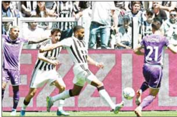
خسارة صعبة لليوفينس بالهولة قبل الأخيرة

وتلقت فريق يوفنتوس هزيمة صادمة على أرضه ضد ضيفه فيورنتينا 2-0 صفر أمس ضمن منافسات الجولة السابعة والثلاثين وقبل الأخيرة من الدوري الإيطالي لكرة القدم. وسجل شير دنور هدف التقدم في الدقيقة 34، وأضاف رولاندو ماندرافورا الهدف الثاني في الدقيقة 83 للضيوف.