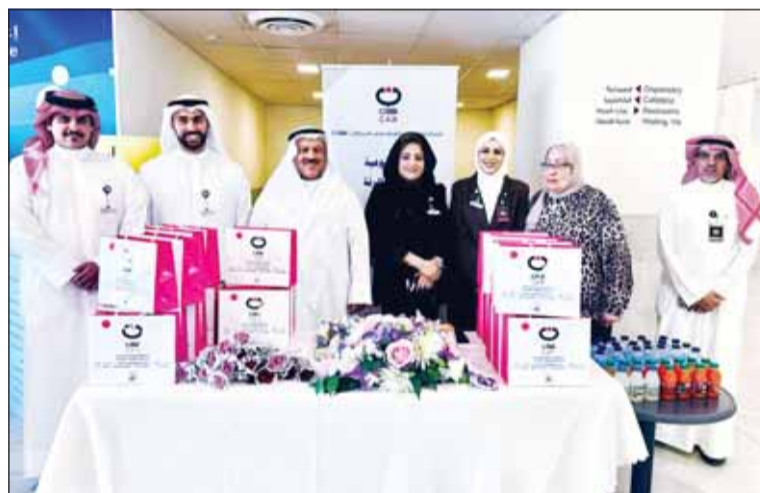
مشاركة "كان" في الحملة

واصلت اللجنة التنسيقية المشتركة أعمالها، برئاسة محافظ العاصمة الشيخ عبدالله سالم العلي، حيث عقدت أمس اجتماعاً في ديوان المحافظة، بحضور محافظ الأحمدية الشيخ حمود جابر الأمد وعدد من المسؤولين وممثلي الجهات المعنية، لمتابعة الملفات المشتركة وتعزيز التعاون والتنسيق بين الجهات الحكومية ذات الصلة. ونوقشت في الاجتماع موضوعات تنظيمية وإدارية، في إطار متابعة ما تم التوصل إليه خلال الاجتماع السابق، إلى جانب بحث آليات تطوير العمل المشترك وتعزيز التعاون بين الجهات المشاركة. وأكد محافظ العاصمة حرص اللجنة على مواصلة أعمالها بصورة دورية، بما يعزز التكامل الموسمي ويسهم في تسريع إنجاز المعاملات والموضوعات المشتركة وفق الأطر القانونية والتنظيمية المعمدة، بما يحقق الأهداف التنموية ويخدم الصالح العام. وأشار إلى أن استمرار انعقاد اللجنة يعكس التزام الجهات المشاركة بتعزيز التعاون البناء وتبادل الخبرات والروى، بما يدعم تطوير منظومة العمل الحكومي ويرتقي بجودة الخدمات المقدمة. وفي ختام الاجتماع، ثمن المحافظ جهود أعضاء اللجنة وممثلي الجهات المشاركة في متابعة الملفات المطروحة وتقديم الأفكار والمقترحات البناءة، مؤكداً أهمية مواصلة التنسيق والعمل المشترك بما يحقق المزيد من الإنجازات ويوكل طلعات الدولة نحو التنمية المستدامة.