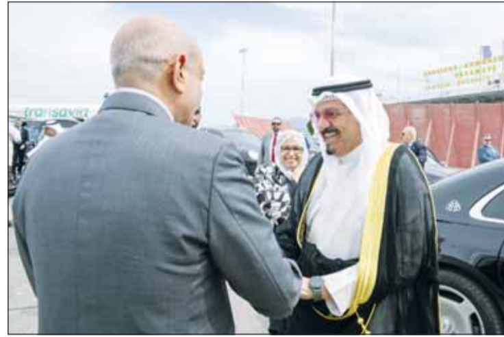
ممثل سمو الأمير سمو رئيس مجلس الوزراء مصافحا مودعيه لدم مغادرته اليونان

أثينا - "كونا" استقبال ممثل سمو أمير البلاد الشيخ مشعل الأحمد سمو رئيس مجلس الوزراء الشيخ أحمد العبدالله الصديقة رئيسة وزراء جمهورية إيطاليا الصديقة جورجيا ميلوني والوفد المرافق لها على هامش أعمال القمة الأوروبية - الخليجية الجيوسياسية والاستثمارية الأولى المنعقدة بجمهورية اليونان الصديقة. وتسلم سمو رئيس مجلس الوزراء خلال اللقاء رسالة موجهة إلى سمو أمير البلاد الشيخ مشعل الأحمد من رئيسة وزراء جمهورية إيطاليا تتعلق بالعلاقات الثنائية المتميزة بين البلدين. و جرى خلال اللقاء بحث سبل تعزيز العلاقات الوثيقة بين الكويت وجمهورية إيطاليا الصديقة في مختلف المجالات بما يخدم مصالح البلدين والشعبين، إضافة إلى تبادل وجهات النظر حول عدد من القضايا ذات الاهتمام المشترك. حضر اللقاء وزير الخارجية الشيخ جراح الجابر ومدير هيئة