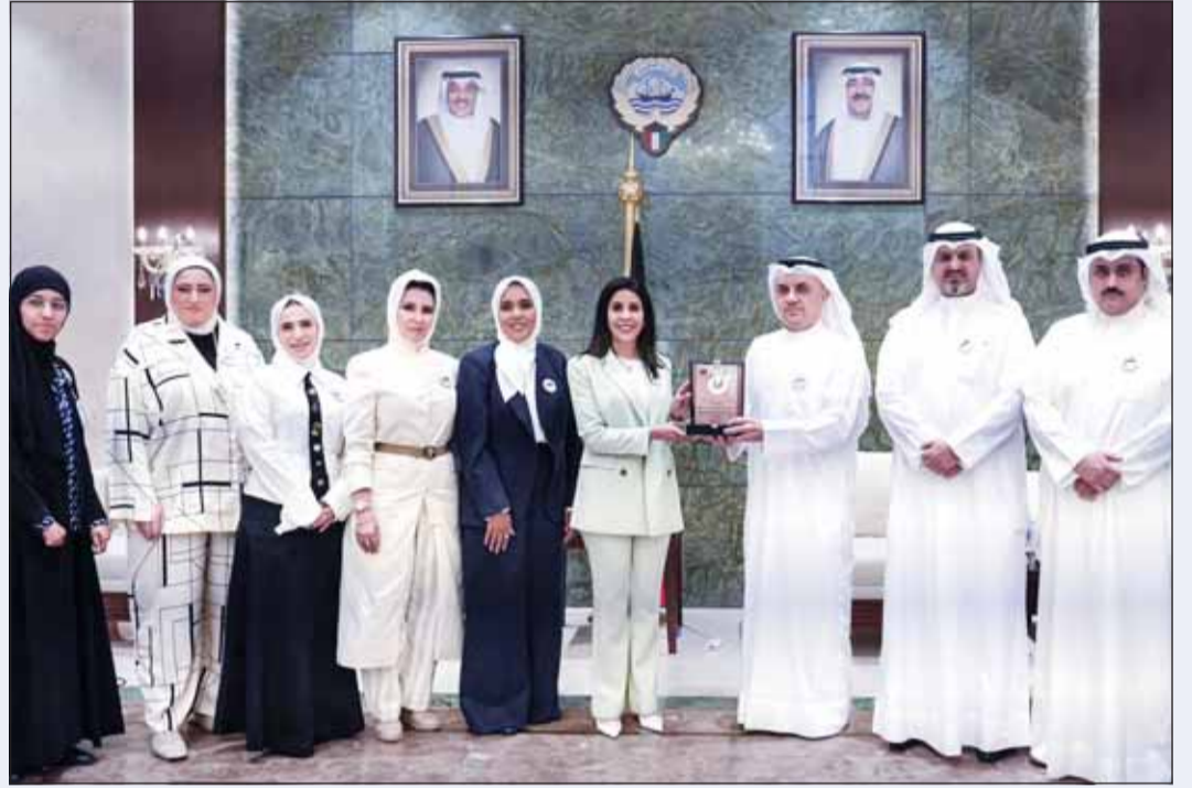
درع تكريمية للوزيرة د.نورة المشعان من هيئة مكافحة الفساد بانتقاله إلى المستوى الفضي في "الأداء"

قطار إصلاح الطرق يدخل 45 منطقة جديدة منها 8 مواقع بـ "السريعة"