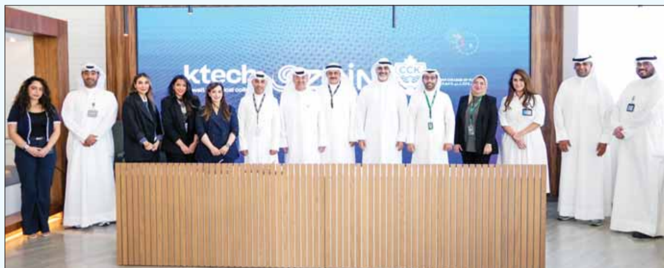
صورة جماعية بعد توقيع الشراكة

قادرين على المنافسة وصناعة أثر في اقتصاد المعرفة بالدولة