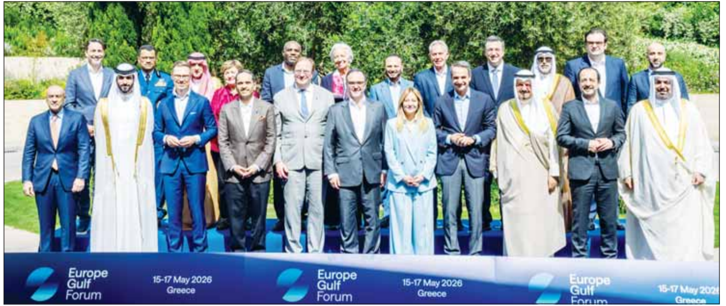
ممثل سمو أمير البلاد الشيخ مشعل الأحمد سمو رئيس مجلس الوزراء الشيخ أحمد العبدالله والمشاركون في القمة الأوروبية - الخليجية الجيوسياسية والاستثمارية الأهم