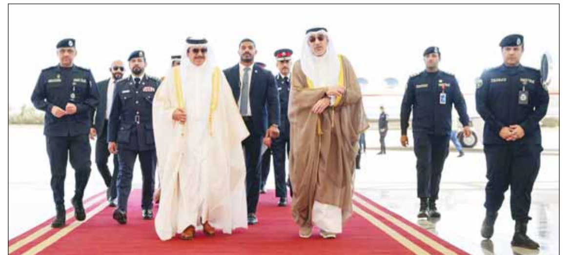
النائب الأول الشيخ فهد اليوسف مستقبلاً وزير الداخلية البحرينية الشيخ راشد آل خليفة

وتعزيز مسيرة العمل الأمني الخليجي المشترك. وذكر أن الجانبين أكدا حرص البلدين الشقيقين على دعم كل ما من شأنه ترسيخ دعائم الأمن والاستقرار وتحقيق المصالح المشتركة بما يلبي تطلعات قيادتي وشعبي البلدين الشقيقين نحو المزيد من التعاون والتكامل. وعقب الاجتماع غادر الفريق أول ركن الشيخ راشد بن عبدالله آل خليفة البلاد حيث كان في وداعه بمطار الكويت الدولي الشيخ فهد يوسف سعود الصباح وعدد من القيادات الأمنية.