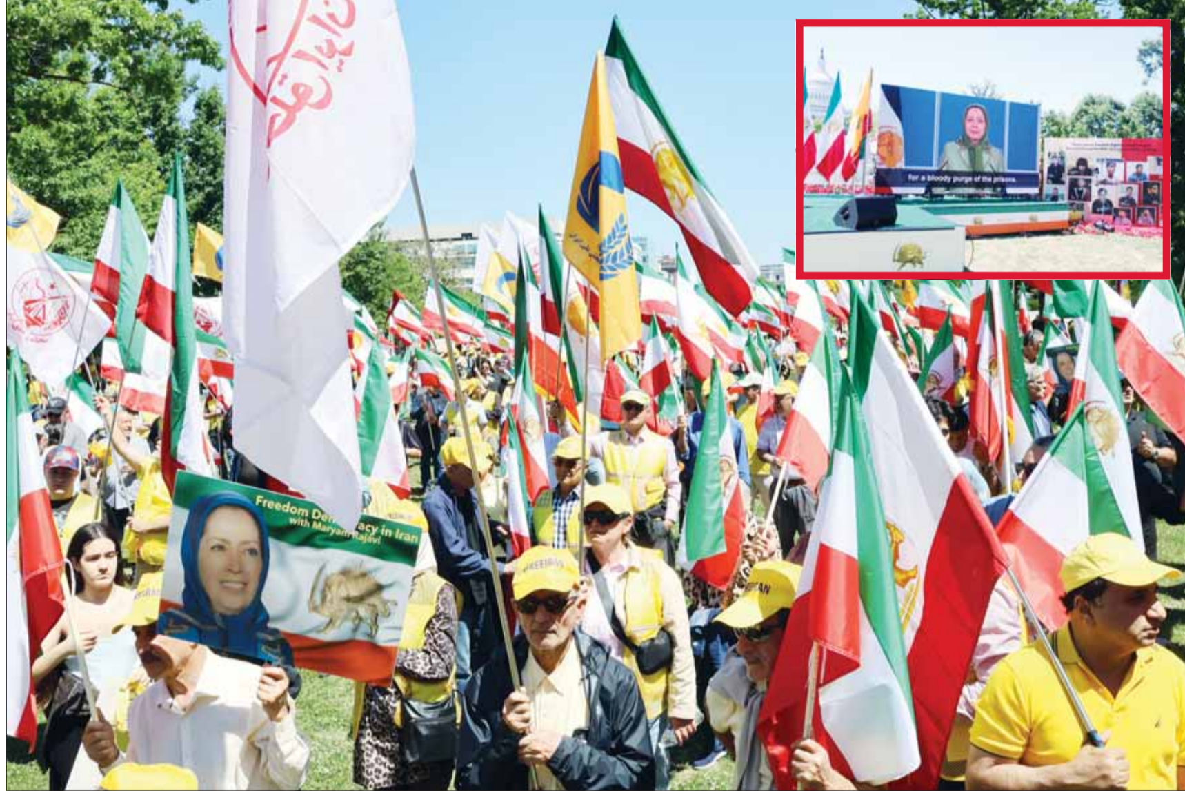
أصوات المقاومة الإيرانية يرفسون العالم ويريدون الأشعارات خلال تجمع ومسيرة حاشدة أمام "الكونغرس" الأميركي وهي الإطار الرئيسية المنتخبة للمقاومة الإيرانية مريم رجوي تلقي كلمتها

وافتمت فعالية واشنطن بمسيرة في شوارع العاصمة الأميركية، رفع خلالها المشاركون الأعلام الإيرانية وشعارات الحرية ووقف الإعدامات، ومن واشنطن إلى باريس، بدأ أن رسالة الإيرانيين تتجاوز حدود الاحتجاج السياسي، لتؤكد أن معركة الشعب الإيراني ضد الملاي في جوهرها معركة من أجل الحرية في الداخل والسلام في الخليج والمنطقة وإنهاء مصدر رئيسي من مصادر الإرهاب والمزور وعدم الاستقرار.