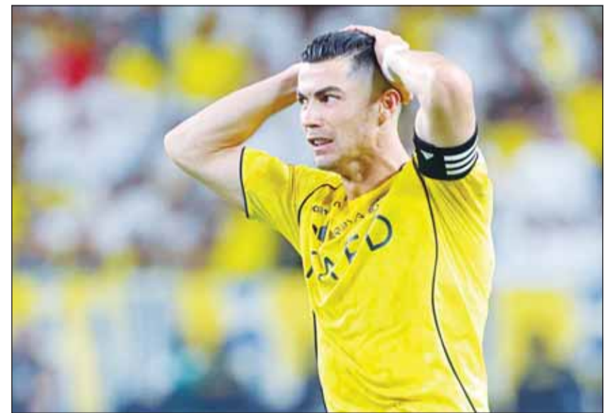
الدون خسر بطولتين في أسبوع واحد

على تصديت أراكي الثابتة وقدرة غامبا أوساكا على إيقاف جميع فرص التسجيل قبل هدف دينيس هوميت الحاسم. رونالدو عاش "تحطم قلبه للمرة الثانية خلال أسبوع واحد"، بحسب النسخة اليابانية من وكالة الأنباء الفرنسية، بعد تعثر النصر قبل أيام أمام الهلال في ديربي الرياض، فيما أشار التقرير إلى أن غامبا صمد أمام الضغط بعدما قلب هوميت مجريات المباراة بهدفه.