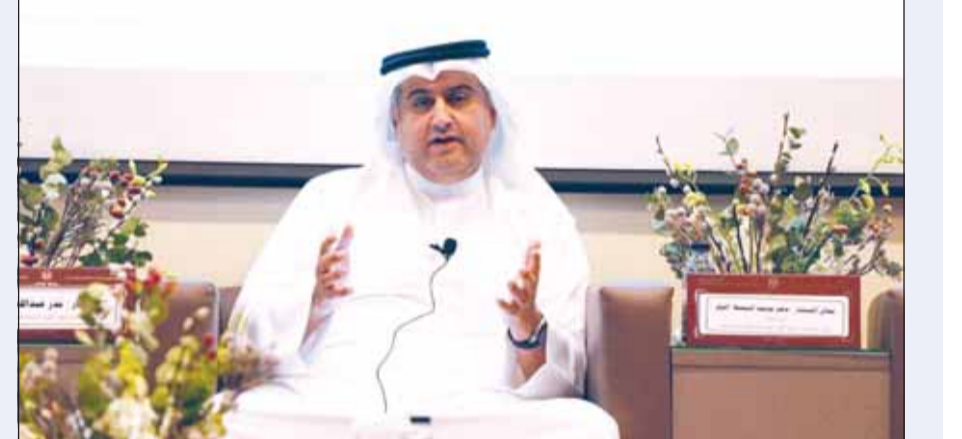
وزير العدل المستشار ناصر السميطة يتحدث خلال اللقاء

أدعو المرشحين لشغل وظيفة "وكيل نيابة" إلى التحلي بالنزاهة والحياد قبول الدفعة الجديدة يأتي ضمن خطة تكويت القضاء ودعمه بكفاءات وطنية مؤهلة