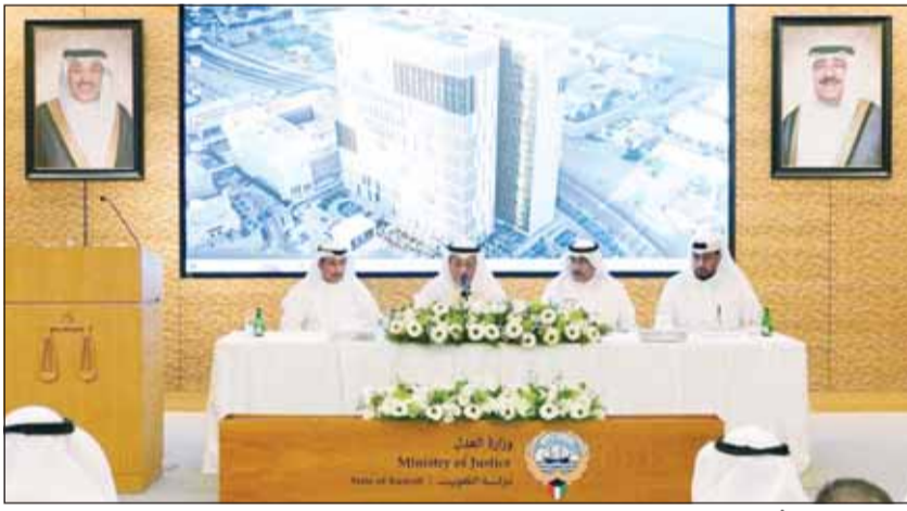
رئيس المجلس الأعلى للقضاء المستشار د.عادل بورسلي يتحدث في الجمعية العمومية لمحكمة التمييز

السلطة القضائية تجدد الولاء التام والعهد الدائم لسمو الأمير وسمو ولي العهد دوائر المحكمة مكتملة خلال يوليو ولا شك في استمرار جهدكم لمواصلة المسيرة