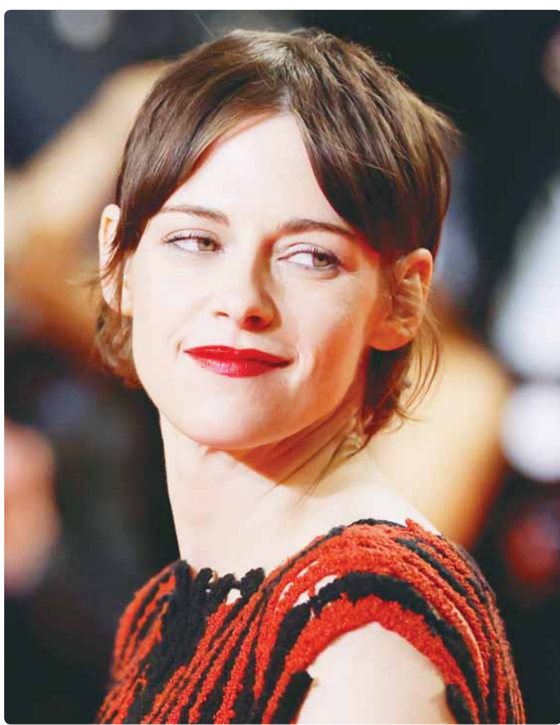
الممثلة الأميركية كريستين ستيوارت خلال حضورها مهرجان كان

تبقى الكويت، نظاماً وشعباً، صاحبة شرعية صمدت في وجه الغزو العراقي، ويبقى التوثيق واجباً... لا انتقاماً، وحفظ الذاكرة... حقاً لا يسقط بالتقادم.