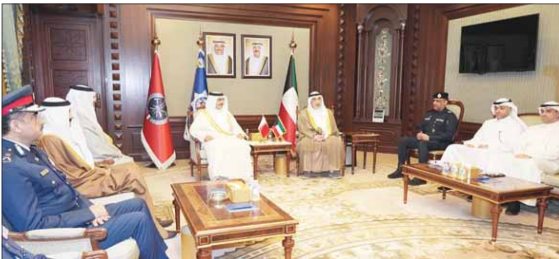
النائب الأول الشيخ فهد اليوسف خلال لقائه وزير الداخلية البحرينية الفريق أول ركن الشيخ راشد آل خليفة والوفد المرافق له

□ النائب الأول: دعم كامل لما تتخذه البحرين من إجراءات لحفظ أمنها