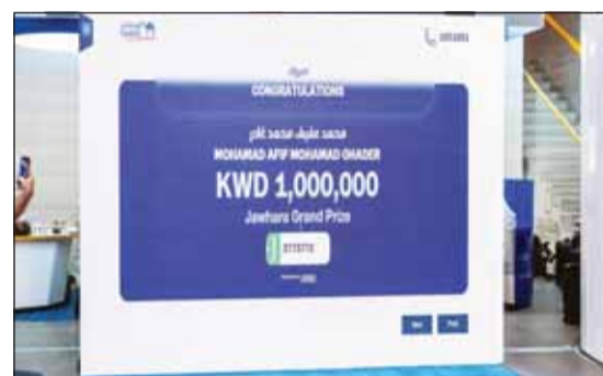
الإعلان عن المليونير الجديد

مصرفي موثوق يضع طموحات عملائه ومستقبلهم المالي في صميم أولوياته". وأضاف: "يسعدنا اليوم الإعلان عن 14 فائزاً جديداً في سحبوات