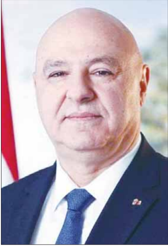
الرئيس اللبناني جوزاف عون