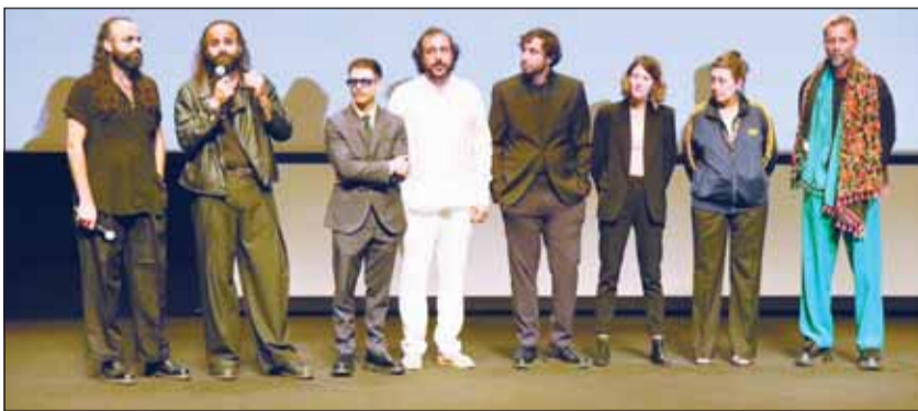
صناع فيلم كان يا ما كان في غزة

أعلن مركز السينما العربية عن جوائز النسخة العاشرة من جوائز النقاد للأفلام العربية في مدينة كان الفرنسية، على هامش فعاليات مهرجان كان السينمائي 2026 في دورته الـ 79، التي شهدت تكريم العديد من إنتاجات الأفلام المستقلة في العالم العربي على مدار العام الماضي. وأعلن علاء كركوتي وماهر دياب، الشريكان المؤسسان لمركز السينما العربية، حرصهما على تسليط الضوء على الأفلام والمواهب العربية، حيث ضمت لجنة التحكيم هذا العام 307 نقاد من مختلف أنحاء العالم لاختيار الفائزين. وشهد الحفل تكريم عدد من الشخصيات البارزة التي لها أثر استثنائي في دعم السينما العربية، حيث مُنحت جائزة Game Changer لـ Vincenzo Bugno تقديراً لدوره المؤثر في دعم السينما العربية، بينما ذهبت جائزة Personality of the Year إلى الفنان حسين فهمي احتفاءً بمسيرته الفنية الطويلة وإسهاماته. وشملت القائمة ما يلي: