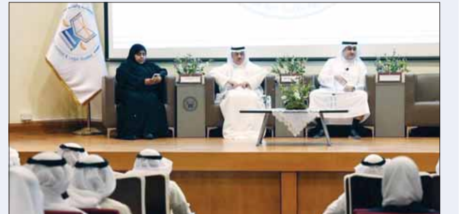
وزير العدل خلال لقائه بالمرشحين في المعهد

أعربت وزارة الخارجية عن إدانة دولة الكويت واستنكارها الشديد للاعتداء الذي استهدف مولداً كهربائياً خارج المحيط الداخلي لمحطة بركة للطاقة النووية في منطقة الظفرة بإمارة أبوظبي بطائرة مسيرة، معتبرة ذلك انتهاكاً صارخاً لسيادة دولة الإمارات العربية المتحدة الشقيقة