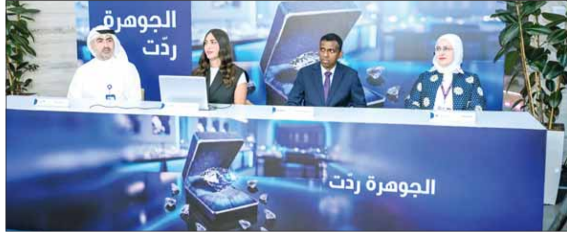
جهاز تدقيق عالمية مستقلة تشرف على السحب