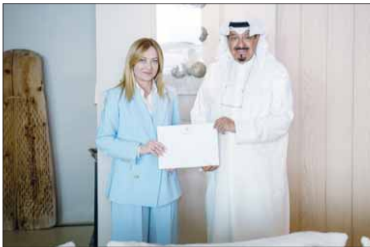
سمو رئيس مجلس الوزراء يتسلم رسالة الى سمو الأمير من رئيسة وزراء إيطاليا جورجيا ميلونيه

رئيس مجلس الوزراء وزير الدولة لشؤون مجلس الوزراء شريدة المعشري، ورئيس الدفاع الشيخ عبدالله العلي الصباح، ورئيس ديوان رئيس مجلس الوزراء الإناثية الشيخ خالد محمد خالد الصباح، وعدد من كبار المسؤولين بالدولة. وكان ممثل سمو أمير البلاد الشيخ مشعل الأحمد سمو رئيس مجلس الوزراء الشيخ أحمد العبدالله قد غادر والوفد المرافق له جمهورية اليونان الصديقة أمس بعد تروسة وفد الكويت المشارك في القمة الأوروبية الخليجية الجيوسياسية والاستثمارية الأولى. وكان في وداع سموه على أرض المطار سفير الكويت لدى جمهورية اليونان محمد علي الرومي وأعضاء السفارة. من جهة أخرى بعث سمو رئيس الوزراء الشيخ أحمد العبدالله ببرقية تهنئة إلى الملك هارالد الخامس ملك مملكة النرويج الصديقة بمناسبة ذكرى يوم الدستور بلاده.