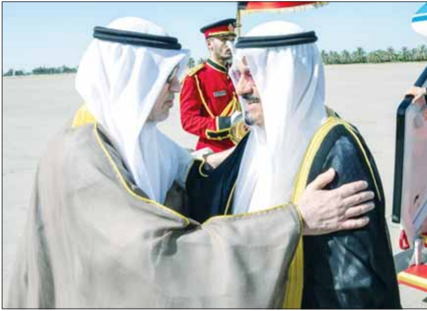
سموه لدم وصوله الى البلاد وفق استقباله النائب الاول لرئيس مجلس الوزراء ووزير الداخلية الشيخ فهد اليوسف