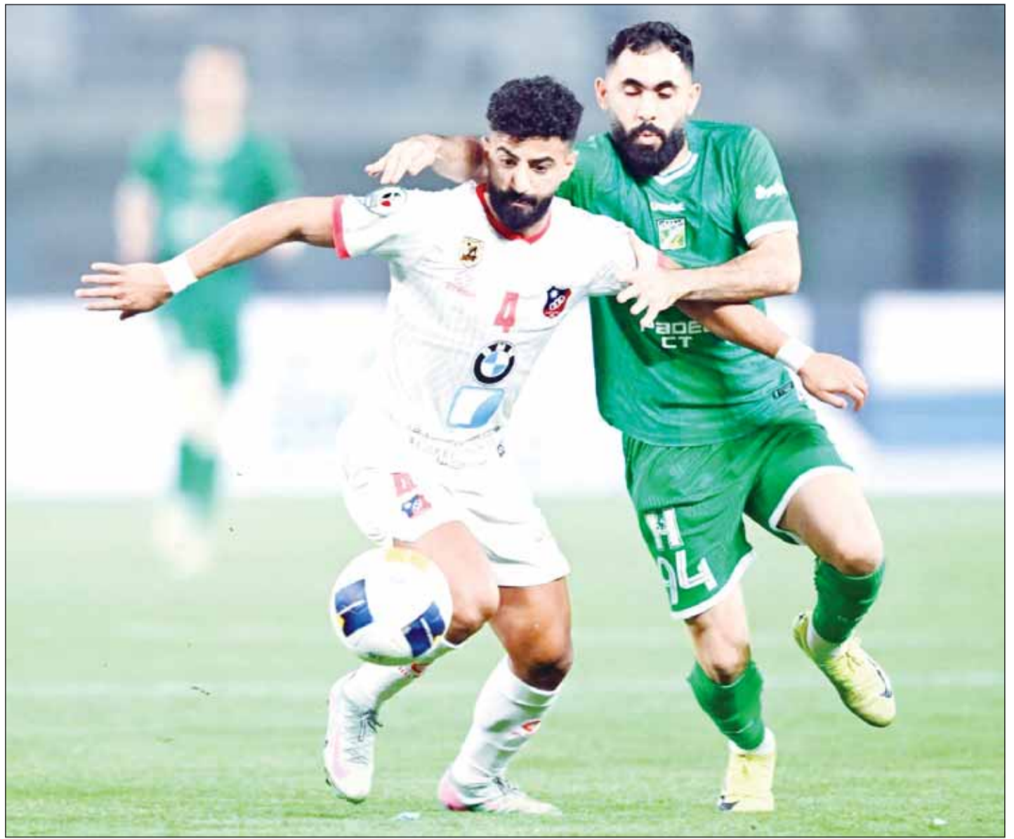
منافسة جديدة تجمع العربي والكويت في المباراة النهائية