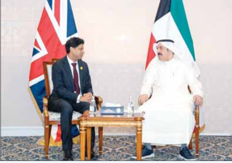
الوزير الرفاعي مستقبلاً السفير قديسي رشيد

تحسين جودة الأصول ورفع كفاءة العمليات التشغيلية بالشركة