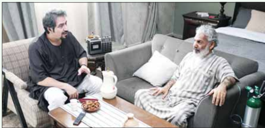
من مسلسل حبه الجرادية

ويجعل الإنتاج الدرامي جزءاً من الدورة الاقتصادية في المناطق التي تستضيف التصوير. وقد عانت الدراما السعودية لسنوات طويلة من محدودية الإنتاج وضعف الاهتمام الموسمي بالفنون قبل أن تأتي رؤية المملكة 2030 لتضع الفنون والصناعات الإبداعية ضمن القطاعات القادرة على الإسهام في المجتمع والاقتصاد، ومن هذا المنطلق أصبح الإنتاج التلفزيوني مجالاً يمكن أن يشارك في خفض البطالة وتنشيط الدورة الاقتصادية وفتح مسارات مهنية جديدة أمام الشباب. وبناءً على ذلك فإن تجربة حسن عسيري في الإنتاج الدرامي يمكن قراءتها من زاويتين، الأولى فنية واجتماعية من خلال أعماله وتقريب من قضايا المجتمع وفتح باب النقاش حولها، والثانية اقتصادية وتشغيلية عبر تحويل مواقع التصوير إلى بيئات للشباب وتحرك قطاعات مساندة، وبهذا المعنى لا تجدو الدراما مجرد محتوى يعرض على الشاشة بل صناعة متكاملة لها أثر فني واجتماعي واقتصادي في الوقت نفسه.