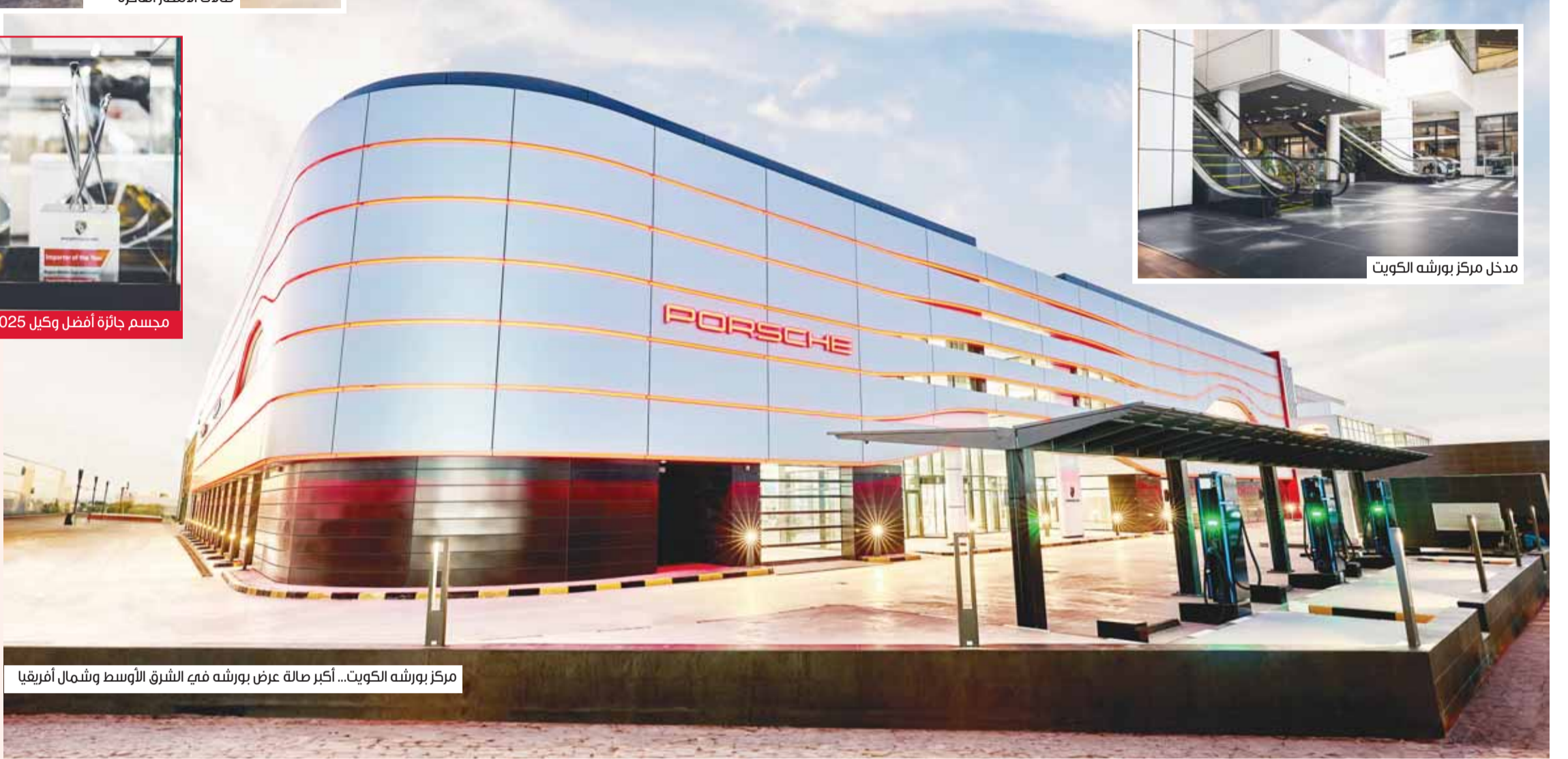
مركز بورشه الكويت... أكبر صالة عرض بورشه في الشرق الأوسط وشمال أفريقيا