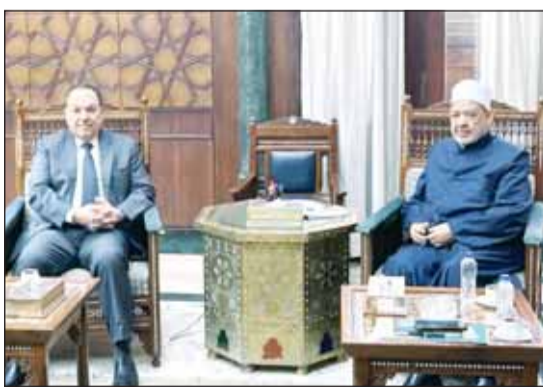
شيخ الأزهر د.أحمد الطيب وسفير الكويت في القاهرة غانم الغانم

الأكثر احتياجا بما يسهم في تحسين جودة الحياة وتلبية احتياجات المجتمع. من جانبه أكد السفير الغانم أن العلاقات المصرية الكويتية تمثل نموذجا راسخا للتعاون الأخوي القائم على الاحترام المتبادل والمصير المشترك، مشيرا إلى أن هذا التعاون يتجلى بوضوح في دعم المشروعات الخيرية والتعميرية داخل مصر. وأوضح أن الكويت قيادة وحكومة وشعبا تولي اهتماما كبيرا بالعمل الإنساني والخيري في مصر انطلاقا من الروابط التاريخية التي تجمع البلدين وحرصا على دعم الجهود الهادفة إلى تحسين مستوى معيشة الفئات الأكثر احتياجا.