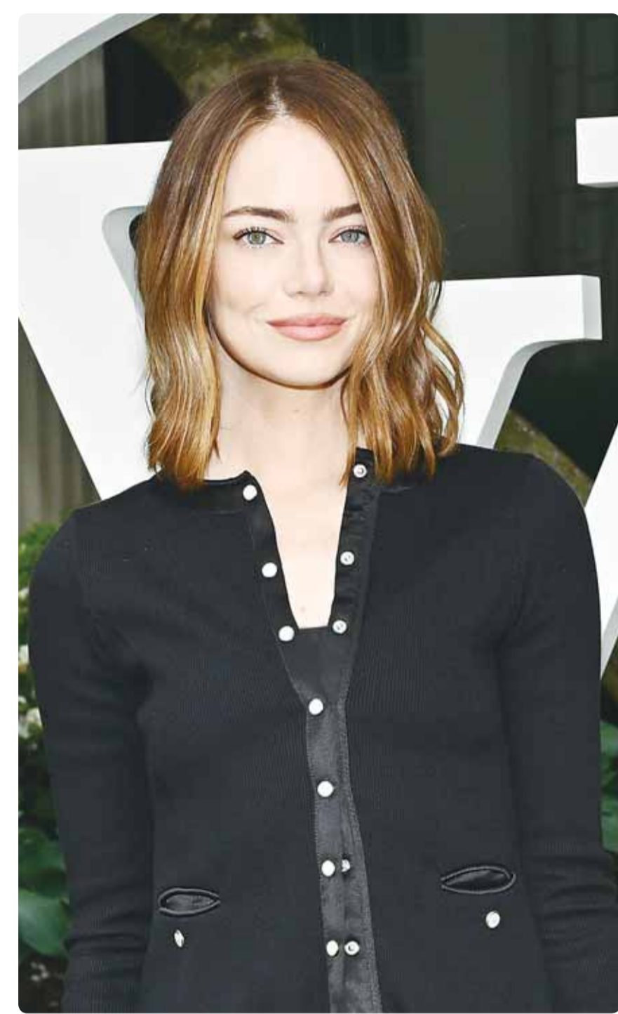
الممثلة الأميركية إيما ستون خلال حضورها عرض أزياء مجموعة "لوبي فويتون" في نيويورك