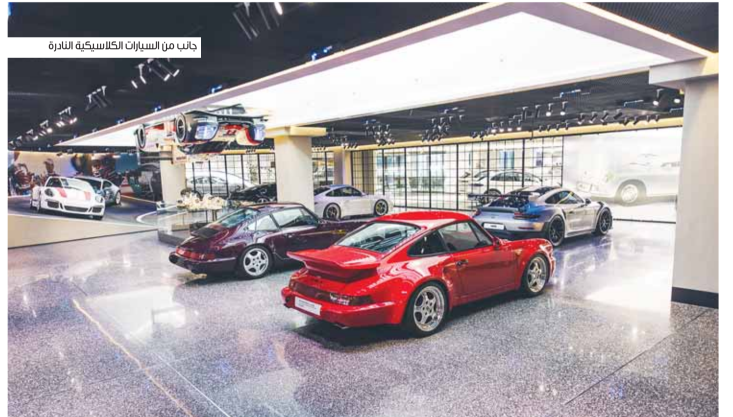
جانب من السيارات الكلاسيكية النادرة

حصل مركز بورشه الكويت على جائزة "أفضل وكيل في منطقة الشرق الأوسط" لعام 2025. وتمنح هذه الجائزة تقديرًا لجهود الوكيل المحلي وأدائه المتميز في جميع مجالات الأعمال. وتعد هذه المرة الثالثة التي تفوز فيها شركة بهباني للسيارات بالمركز الأول بهذه الجائزة خلال خمس سنوات، وذلك بعد فوزها في عامي 2021 و2022. وتشمل معايير التقييم رضا العملاء وجودة الخدمة والابتكارات في مجال المبيعات، إضافة إلى كفاءة فريق العمل والقدرة على تعزيز ولاء العملاء للوكيل وعلامة بورشه التجارية على المدى الطويل.