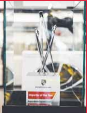
مجسم جائزة أفضل وكيل 2025