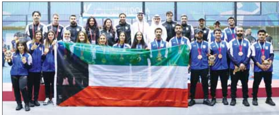
تألق كويتيه لافت بالألعاب الخليجية

ناصر صباح الأمد الصباح، ممثناً للتسهيلات الكبيرة والتوجيهات السديدة التي قدمت للعبة، والتي كان لها بالغ الأثر في تحليل العقبات والظهور بأفضل صورة ممكنة تعكس مكانة الرياضة الكويتية. كما أشاد بالجهود الكبيرة والعطاء اللامحدود لكافة الأجهزة الإدارية والفنية للاتحادات الرياضية، والأندية، واللجان المنبثقة من اللجنة الأولمبية.