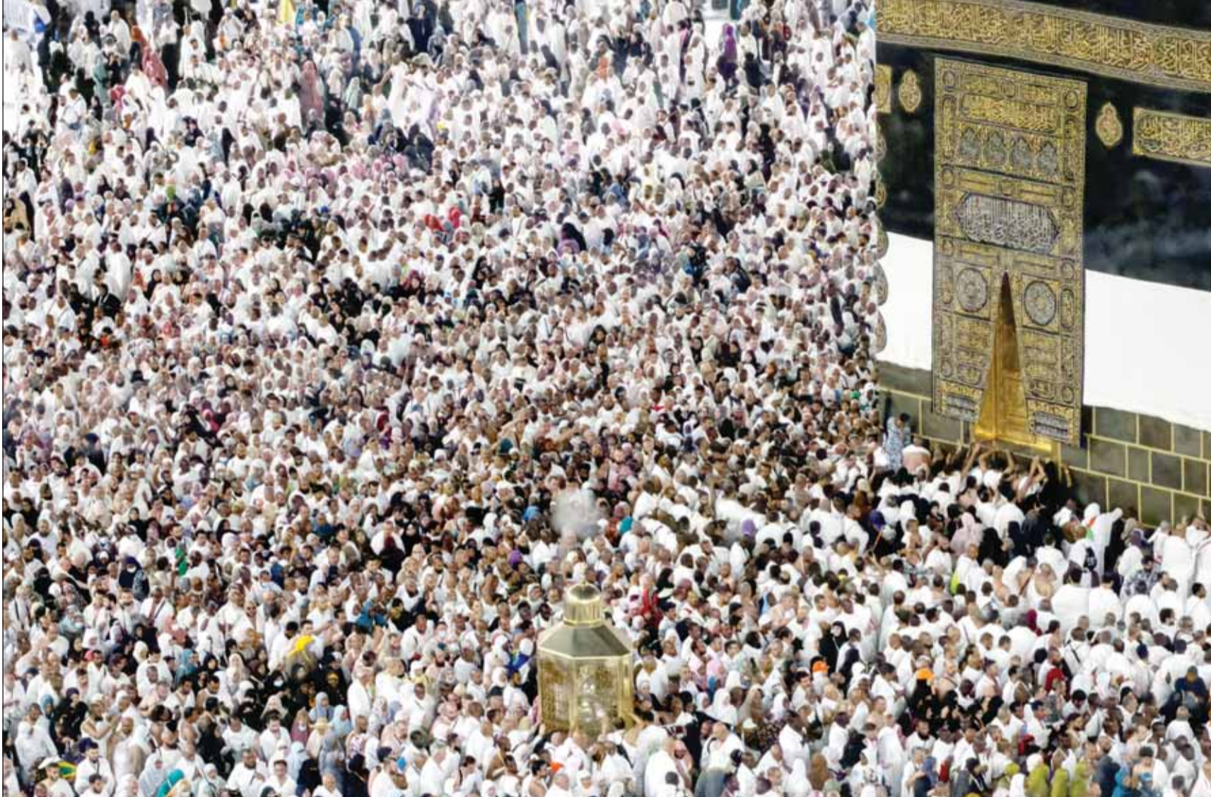
مئات آلاف الحجاج يؤدون طواف القدوم حول الكعبة المشرفة في مستهل موسم الحج حيث أعلنت السلطات السعودية وصول نحو 1.5 مليون من حجاج الخارج

السرعة نقل نحو 800 ألف راكب منذ انطلاق الخطة التشغيلية لموسم الحج عبر تنفيذ 3649 رحلة حتى الآن، وقال المتحدث الرسمي لـ "سار" خالد الفرغان إن قطار الحرمين السريع يواصل أداء دور محوري في تسهيل تنقل ضيوف الرحمن، ورفع كفاءة الحركة بين مكة المكرمة والمدينة المنورة وجدة، ضمن منظومة النقل المتكاملة خلال موسم الحج، مضيفاً أن القطر يُعد أسرع وسيلة نقل بين مكة المكرمة والمدينة المنورة، إذ يقطع المسافة البالغة 453 كيلومتراً خلال نحو ساعتين و15 دقيقة، كما يربط مطار الملك عبد العزيز الدولي بمحطة مكة المكرمة خلال نحو 50 دقيقة، ويصل قطار الحرمين السريع إلى سرعة تشغيلية تبلغ 300 كيلومتر في الساعة، ويمتد عبر خمس محطات تشمل مكة المكرمة والمدينة المنورة وجدة السليمانية ومدينة الملك عبد الله الاقتصادية ومطار الملك عبد العزيز الدولي.