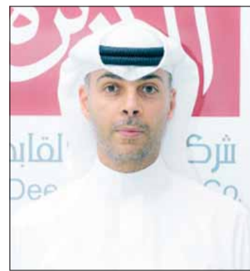
طلال بدر البحر

ذاته إلى استمرار الشركة في الحفاظ على مستويات منخفضة من الرافعة المالية، والتي تراجعت إلى 16% مقارنة بـ 21% في عام 2024، بما يعزز من مرونة الشركة المالية وقدرتها على التعامل مع المتغيرات الاقتصادية بكفاءة عالية.