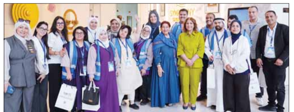
الشيخة شيخة العبدالله خلال رعاية الفعالية منسوبة أبناءها من ذوي العزيمة والهمم

استضاف فندق سيمفوني ستايل التابع للشركة التجارية العقارية ورشة تعليم الطهي لذوي الإعاقات الخاصة بالتعاون مع مؤسسة الرعاية المتكاملة لذوي الإعاقة (ICAN)، أقيمت تحت رعاية الشيخة شيخة العبدالله الخليفة الصباح - الرئيس الفخري للنادي الرياضي الكويتي للمعاقين، في فعالية إنسانية هدفت إلى دعم وتمكين ذوي الإعاقات الخاصة وتعزيز مشاركتهم الفاعلة في المجتمع. وتضمنت الورشة مجموعة من الأنشطة العملية في مجال الطهي، حيث شارك الحضور في إعداد الوجبات بإشراف مختصين، وسط أجواء مليئة بالحماس والتفاعل اليجابي. كما حرص فريق عمل فندق سيمفوني ستايل على تقديم الدعم والمساندة للمشاركين، بما ساهم في خلق تجربة مميزة وممتعة شجعتهم على اكتساب مهارات جديدة. وتأتي هذه المبادرة في إطار اهتمام الفندق المتواصل بدعم الأنشطة المجتمعية والإنسانية التي تساهم في