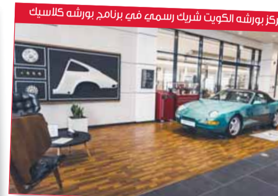
مركز بورشه الكويت شريك رسمي في برنامج بورشه كلاسيك