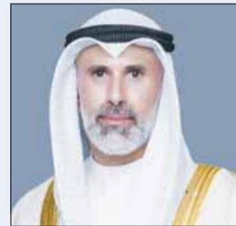
وزير الخارجية الشيخ جراح الجابر

في جنيف على هامش أعمال جمعية الصحة العالمية الـ79 حيث قام بتسليم جائزة سمو الشيخ صباح الأحمد، لتعزيز صحة كبار السن للفتن لهذا العام وهما البروفيسور الفرنسي برونو فيلاس ومجموعه (سينغ هيلد) السنغافورية تقديراً لإسهاماتهما الرائدة ومبادراتهما المتميزة في مجال تعزيز صحة كبار السن والرعاية المتكاملة لهم. وأوضح الشيخ الدكتور سلمان خليفة الصباح إن الجائزة تجسد التزام دولة الكويت الراسخ بدعم الجهود الدولية الرامية إلى تحسين جودة حياة كبار السن وتعزيز الرعاية الصحية والاجتماعية المتكاملة لهم انطلاقاً من الإرث الإنساني للكويت ودورها الداعم للعمل الصحي العالمي. وأشار إلى أن الجائزة التي أطلقت عام 2004 بالتعاون مع منظمة الصحة العالمية أصبحت منصة دولية مرموقة لتكريم المبادرات والإنجازات النوعية في مجال الشيخوخة الصحية بما ينسجم مع