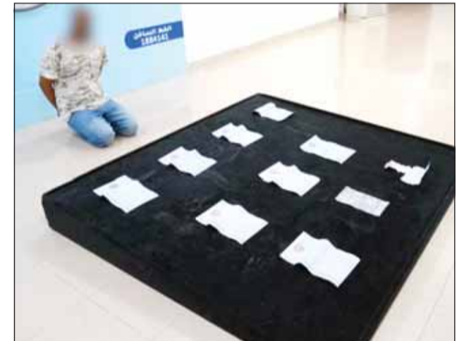
المتهم وأمامه الأوراق المشبعة بالمخدرات