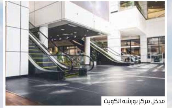
مدخل مركز بورشه الكويت