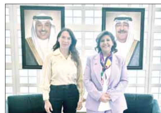
السفيرة الشقيقة جواهر الصباح خلال لقائها مع فانيسا فريرز

القواعد الأساسية للقانون الدولي الإنساني، مشيرة إلى استمرار استهداف البنية التحتية المدنية الحيوية في النزاعات المسلحة. وشددت السيدة جواهر الصباح على أهمية تعزيز احترام القانون الدولي والقانون الدولي الإنساني وترسيخ التدابير الرامية إلى حماية المدنيين والأعيان المدنية من المخاطر المتزايدة في النزاعات المعاصرة.