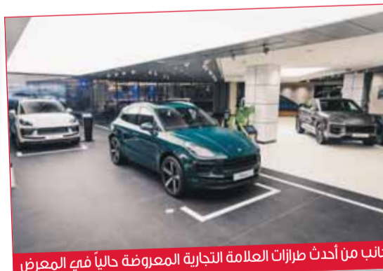
جانب من أحدث طرازات العلامة التجارية المعروضة حالياً في المعرض