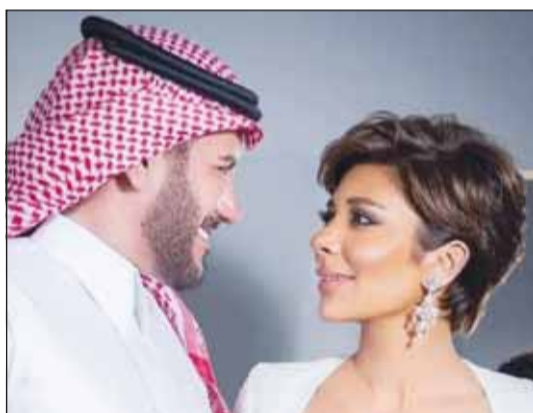
أصالة وزوجها فائق حسن

شهدت الساعات الماضية حالة واسعة من الجدل عبر مواقع التواصل الاجتماعي، بعد تداول أنباء تفيد بانفصال الفنانة أصالة نصري عن زوجها الشاعر العراقي فائق حسن، عقب زواج استمر نحو خمسة أعوام، ما أثار تساؤلات الجمهور ومتابعيهما، خاصة مع التزام الطرفين الصمت في بداية انتشار الشائعة، وتصدر اسم أصالة محركات البحث خلال الساعات الأخيرة، بينما تداول رواد مواقع التواصل أخباراً غير مؤكدة حول وجود خلافات بين الثنائي، وسط تكهنات بانتهاء علاقتهما بشكل رسمي خصوصاً بعد تداول أخبار القاء القبض على فائق حسن في مطار دبي على خلاف اتهامه بقضية نصب واحتيال على مذنية عربية وهو ما نفاها لاحقاً.