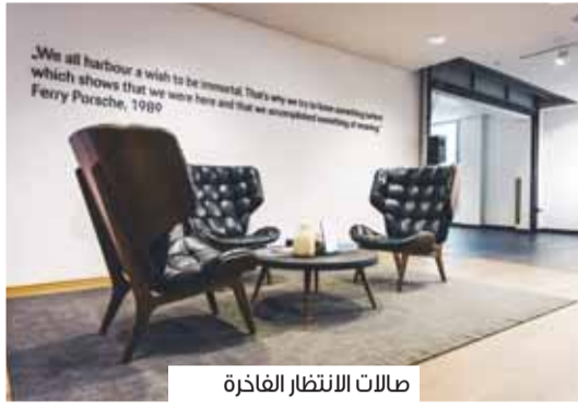
صالات الانتظار الفاخرة