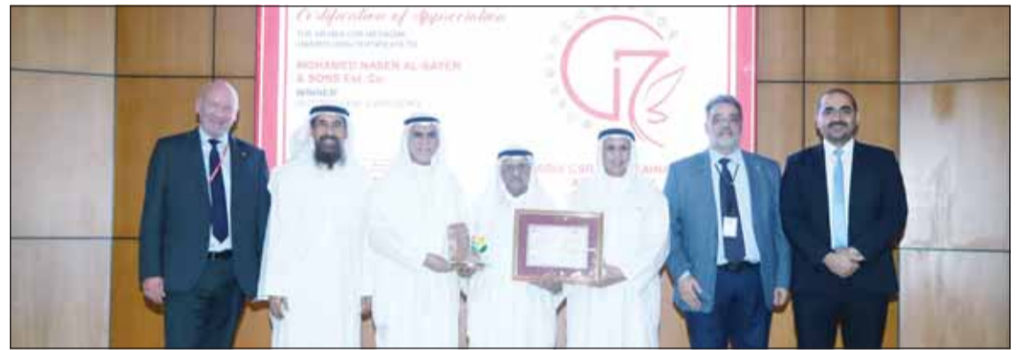
آل الساير خلال تسلم إحدى الجوائز

والحفاظ على البيئة. ومن خلال تعزيز المصادر المسؤولة والعمل بشفافية تضمن مجموعة الساير أن تكون مبادئ الاستدامة مدججة في كل مرحلة من مراحل عملياتنا". إن التزامنا بالحفاظ على البيئة يتجلى بوضوح في مبادراتنا للطاقة الشمسية، والتي أنتجت منذ عام 2015 ما مجموعه 13,517 ميغاواط/ساعة من الكهرباء النظيفة.