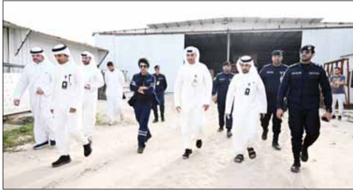
وزير الدولة لشؤون الشباب والرياضة د. طارق الجلاهمة خلال الجولة

أكد وزير الدولة لشؤون الشباب والرياضة الدكتور طارق الجلاهمة، الخميس الفائت، إن الحفاظ على أملاك الدولة "مسؤولية وطنية مشتركة" مشدداً على ضرورة "التصدي لأي تجاوزات أو استغلال غير مشروع يؤثر على دور المنشآت الرياضية أو يعطل الاستفادة منها بالشكل الأمثل". جاء ذلك في تصريح أدلى به الوزير الجلاهمة لـ (كونا) عقب جولة ميدانية لمتابعة إزالة التعديات على أملاك الدولة في عدد من المواقع والمنشآت الرياضية وذلك بتعاون وتنسيق مع الجهات الحكومية ذات الصلة.