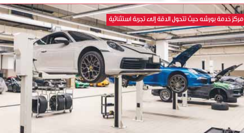
مركز خدمة بورشه حيث تتحول الدقة إلى تجربة استثنائية