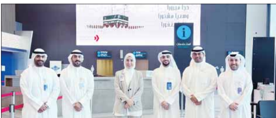
فريق البنك في وداع الحجاج

مزايا بطاقات الائتمان والبطاقات مسبقة الدفع، والتي تمنح العملاء استرداداً نقدياً ومجموعة واسعة من الامتيازات المرتبطة بالسفر، بما في ذلك دخول صالات المطارات العالمية، والتأمين على السفر، والعروض الخاصة على الحجوزات والخدمات السياحية المختلفة. كما يواصل البنك تعزيز ثقافته الأمان المصرفي بالالتزام مع موسم السفر، عبر دعوة العملاء إلى تحديث بيانات وجهاتهم عبر تطبيق البنك، في إطار دعمه لعمليات التوعية المصرفية وتعزيز حماية البطاقات أثناء التنقل خارج البلاد.