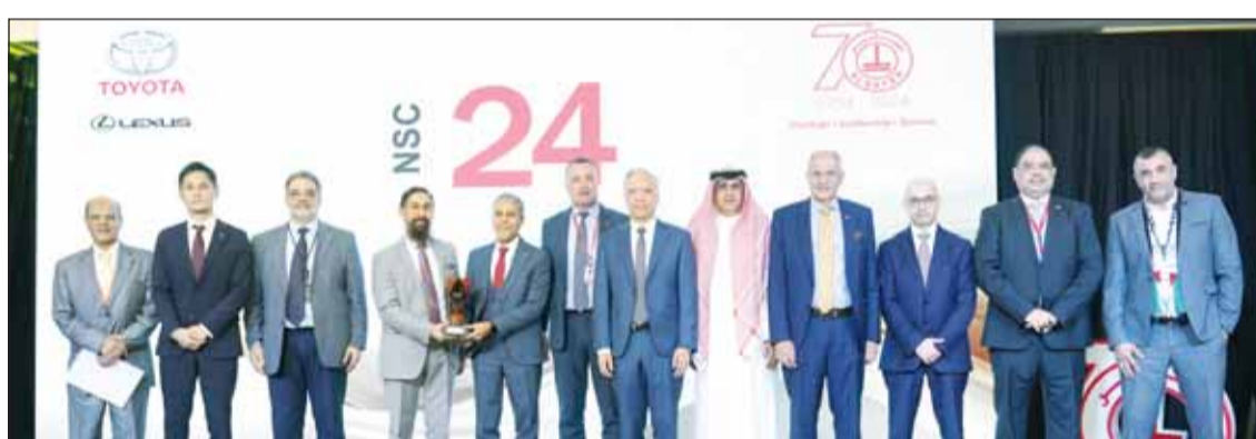
فريق الساير في إحدى المناسبات

وبحلول عام 2025، شكت الطاقة الشمسية 25٪ في أكبر مواقعنا استهلاكاً للطاقة الكهربائية وينسب تصل إلى 10٪ في المواقع الأخرى حسب المساحة المتاحة لتزويد أنظمة الطاقة الشمسية، مما ساهم في تقليل الانبعاثات الكربونية بنسبة 5,83٪، أي ما يعادل تجنب 8,351 طنًا مترياً من ثاني أكسيد الكربون. وعلى مر السنوات، قمنا بتوسيع أنظمة الطاقة الشمسية الكهروضوئية عبر خمسة مرافق رئيسية، ليصل إجمالي القدرة المركبة إلى 1,350 كيلوواط بالذروة. كما يتجلى إسهامنا في المجتمع من خلال دعم أكثر من 52 مبادرة خلال عامي 2024-2025، إلى جانب تسجيل 23,525 ساعة تطوع. وتعكس هذه الجهود التزامنا العميق بالمسؤولية الاجتماعية ودورنا في تمكين المجتمع. بالإضافة لذلك، تضع مجموعة الساير رؤية واضحة في قلب التزاماتها بالاستدامة، بما يتوافق تماماً مع مبادئ الاتفاق العالمي للأمم المتحدة. وتحافظ المجموعة على حقوق الإنسان وتعزز بيئة عمل آمنة وداعمة من خلال مجموعة واسعة من المبادرات الشاملة التي تركز على رضا الموظف.