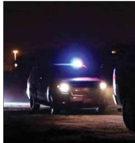
رجال المباحث خلال القبض على المتهم

□ المتهم عثر بحوزته على 5 غرامات من مادة "الشبو" بقصد الإتجار والتعاطي