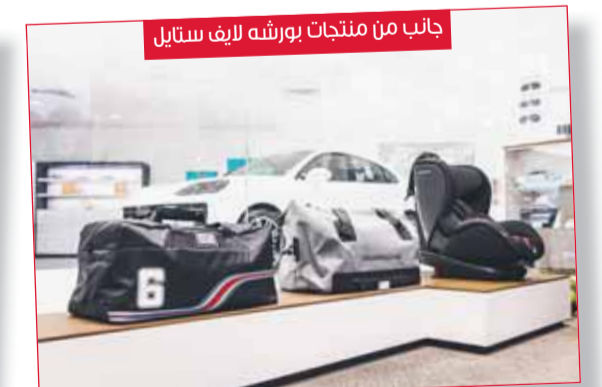
جانب من منتجات بورشه لارف ستايل