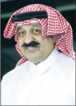
الشيخ أحمد اليوسف

بعث رئيس الاتحاد الدولي لكرة القدم جياني إنفانتينو ببرقية تهنئة إلى رئيس الاتحاد الكويتي لكرة القدم الشيخ أحمد اليوسف الصباح وأعضاء مجلس الإدارة، بمناسبة انتدابهم لقيادة الاتحاد للدورة الجديدة 2026-2030، متمنياً لهم التوفيق والنجاح في مهمتهم المقبلة.