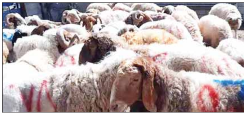
استعدادات وجهوزية في المسالخ لاستقبال ذبائح العيد

وشدد السالم على ضرورة توجيه المستهلكين إلى المسالخ المعمدة فقط، وتجنب الذبح العشوائي أو خارج النطاق الرقابي، لما قد يسببه ذلك من مخاطر صحية وبيئية، مؤكدا استمرار الحملات التوعوية والرقابية التي تنفذها الهيئة للمحافظ على جودة وسلامة اللحوم المتداولة في دولة الكويت.