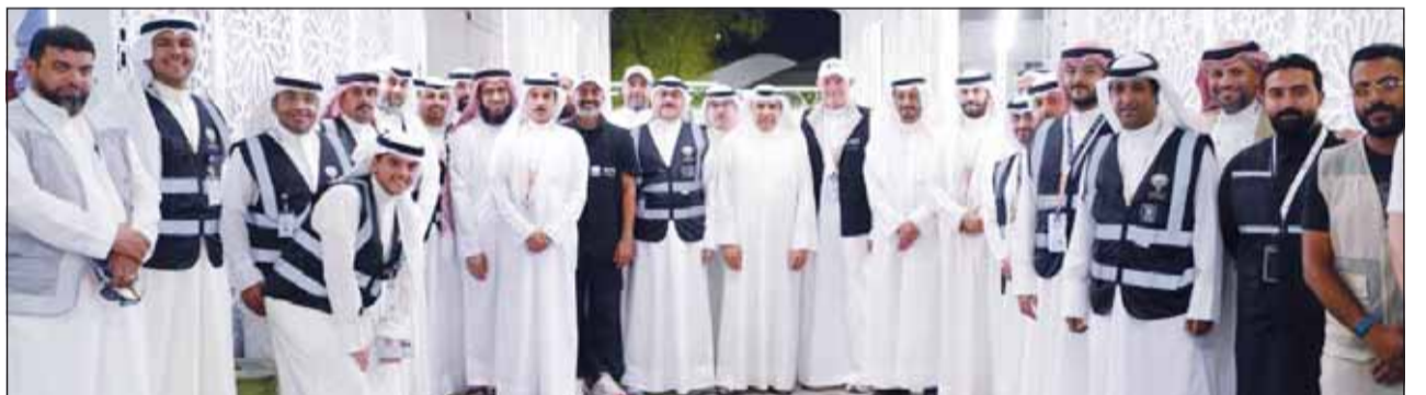
وكيل وزارة الشؤون الإسلامية بالتكليف د.سليمان السويم وأعضاء بعثة الحج خلال افتتاح مقر البعثة والحملات بالمشاعر المقدسة

بما يضمن توفير أفضل سبل الخدمات والرعاية للحجاج. كما أشار إلى تكثيف الجهود الميدانية ومتابعة المستجدات على مدار الساعة، مشددا على أن أهمية التزام الحجاج بالإرشادات والتعليمات التنظيمية والصحية بما يسهم في تسهيل أدائهم للمناسك والحفاظ على سلامتهم وانسيابية تنقلهم بين المشاعر المقدسة. وأعرب عن بالغ الشكر والتقدير للمملكة العربية السعودية بقيادة وحكومة وشعبا - على ما تقدمه من جهود كبيرة وخدمات متكاملة وإمكانات متطورة لخدمة ضيوف الرحمن وتيسير أداء مناسك الحج بكل أمن وطمانينة.