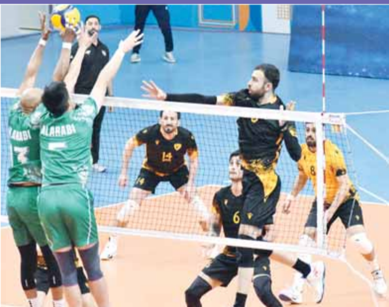
عودة نشاط الطائرة في سبتمبر

وفي إطار الاستعداد للموسم المقبل 2026-2027، حدد الاتحاد نهاية أكتوبر أو مطلع نوفمبر موعداً مبدئياً لانطلاق المنافسات الجديدة، سعياً للعودة إلى الرزنامة الطبيعية للمسابقات المحلية. وعلى صعيد ملف المحترفين، تلقى الاتحاد موافقة من الاتحاد الدولي لكرة الطائرة على فتح باب تسجيل اللاعبين المحترفين اعتباراً من مطلع أغسطس المقبل، وهو ما يمنح الأندية فرصة مبكرة لترتيب تعاقباتها استعداداً للموسم الجديد. كما يدرس الاتحاد مقترحاً جديداً يقضي بالسماح بتسجيل المحترفين طوال الموسم الرياضي، أسوة بعدد من الاتحادات الخليجية، مع وضع ضوابط مالية لتنظيم العملية، تتضمن فرض رسوم على تسجيل المحترفين، على أن ترتفع قيمة الرسوم في حال تسجيل أكثر من محترف، بهدف تحقيق التوازن بين دعم الأندية والمحافظة على الاستقرار الفني للمسابقة.