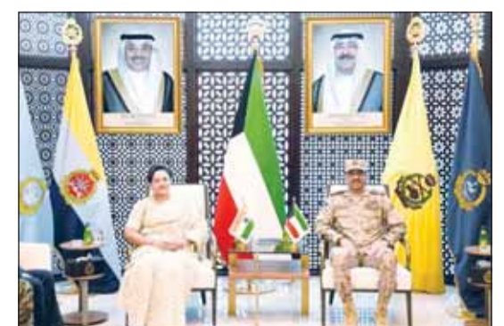
الفريق الركن خالد الشريهان خلال استقباله سفيرة الهند

العامه للجيش اللواء الركن طيار صباح جابر الأحمد الصباح. في الإطار نفسه، بحث رئيس الأركان العامة للجيش الفريق الركن خالد الشريهان مع سفيرة جمهورية الهند الصديقة لدى دولة الكويت براميتا تريباتي عدداً من المواضيع ذات الاهتمام المشترك. وقالت رئاسة الأركان العامة للجيش، إن ذلك جاء خلال استقبال الفريق الشريهان للسفيرة تريباتي حيث تم خلال اللقاء أيضاً تبادل الأحاديث الودية.