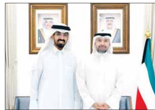
سفير الكويت لدى تونس منصور العمر مستقبلا خالد الشامي

تونس - كونا، أكد سفير دولة الكويت لدى تونس منصور العمر، أمس، أن العمل الخيري الكويتي إرث أصيل ومسؤولية وطنية تستوجب المحافظة عليه، معتبرا أن ما تقوم به المؤسسات الخيرية الكويتية يعكس الصورة المشرفة لدولة الكويت ورسالتها الإنسانية الراقية.