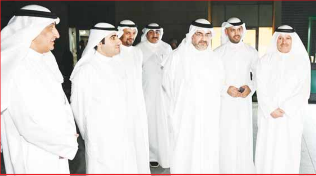
محافظ العاصمة الشيخ عبدالله سالم العلي ووكيل الديوان الأميري الشيخ عبدالعزيز المشعل خلال افتتاح النافورة