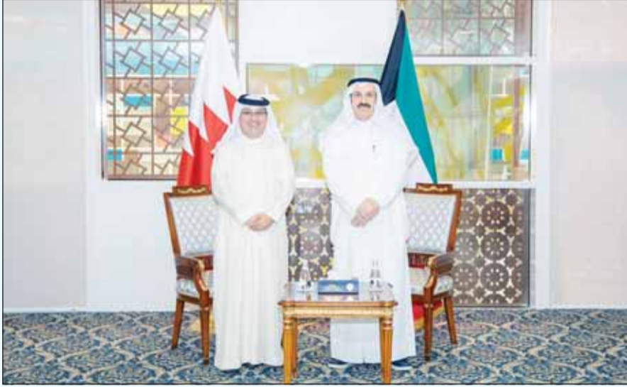
وزير المالية د. يعقوب الرفاعي وسفير مملكة البحرين الشقيقة صلاح المالكي

بحث وزير المالية د. يعقوب الرفاعي مع سفير مملكة البحرين الشقيقة لدى دولة الكويت صلاح المالكي أمس، أفاق التعاون المشترك واستعرضا العلاقات الأخوية والتاريخية التي تجمع قيادتي وشعبي البلدين الشقيقين. وقالت وزارة المالية في بيان صحافي إنه تم خلال اللقاء تبادل وجهات النظر حول أفاق التعاون المالي والاستثماري بين الجانبين وفرص الشراكة أمام القطاع الخاص في ضوء الإمكانيات المتاحة في مختلف القطاعات التنموية والتجارية في كلا البلدين.