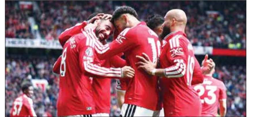
قيمة سوقية كبيرة للشبابين الحمر

ذكرت تقارير إعلامية أن نادي مانشستر يونايتد وصل تعزيزه مكانته كأحد أكبر الكيانات الاقتصادية في كرة القدم العالمية، بعدما امتل المركز الثاني في قائمة الأندية الأعلى قيمة سوقية في العالم بنحو 6,5 مليار دولار، وفق أحدث التقييمات المالية المرتبطة بسوق كرة القدم.