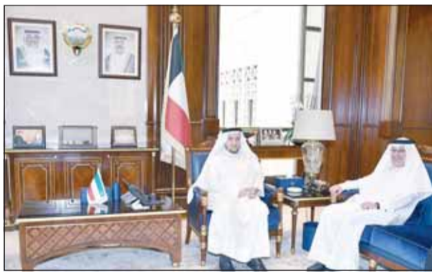
وزير مجلس الوزراء "شريدة المعوشي بحث مع سفير البحرين صلاح المالكي

بحث نائب رئيس مجلس الوزراء ووزير الدولة لشؤون مجلس الوزراء شريدة المعوشي مع سفير مملكة البحرين لدى دولة الكويت صلاح المالكي سبل تعزيز العلاقات الثنائية المتميزة بين البلدين الشقيقين في مختلف المجالات. وذكر مكتب الوزير المعوشي في بيان صحفي، أمس، أنه تم خلال اللقاء الذي عقد في مكتبه في قصر السيف بحضور المستشار بالسفارة البحرينية إيمان البورشيد استعراض عدد من الموضوعات ذات الاهتمام المشترك وتبادل وجهات النظر حول مستجدات الأوضاع التي تمر بها المنطقة وانعكاساتها على الأمن والاستقرار الإقليمي. وأضاف أنه تم خلال اللقاء أيضا بحث سبل تعزيز العلاقات التي تجمع بين دول مجلس التعاون الخليجي على كافة الأصعدة بما يعكس عمق الروابط الأخوية والتاريخية التي تربط دول المجلس إضافة إلى مناقشة آفاق توسيع مجالات التعاون بما يخدم المصالح المشتركة ويدعم مسيرة العمل الخليجي المشترك.