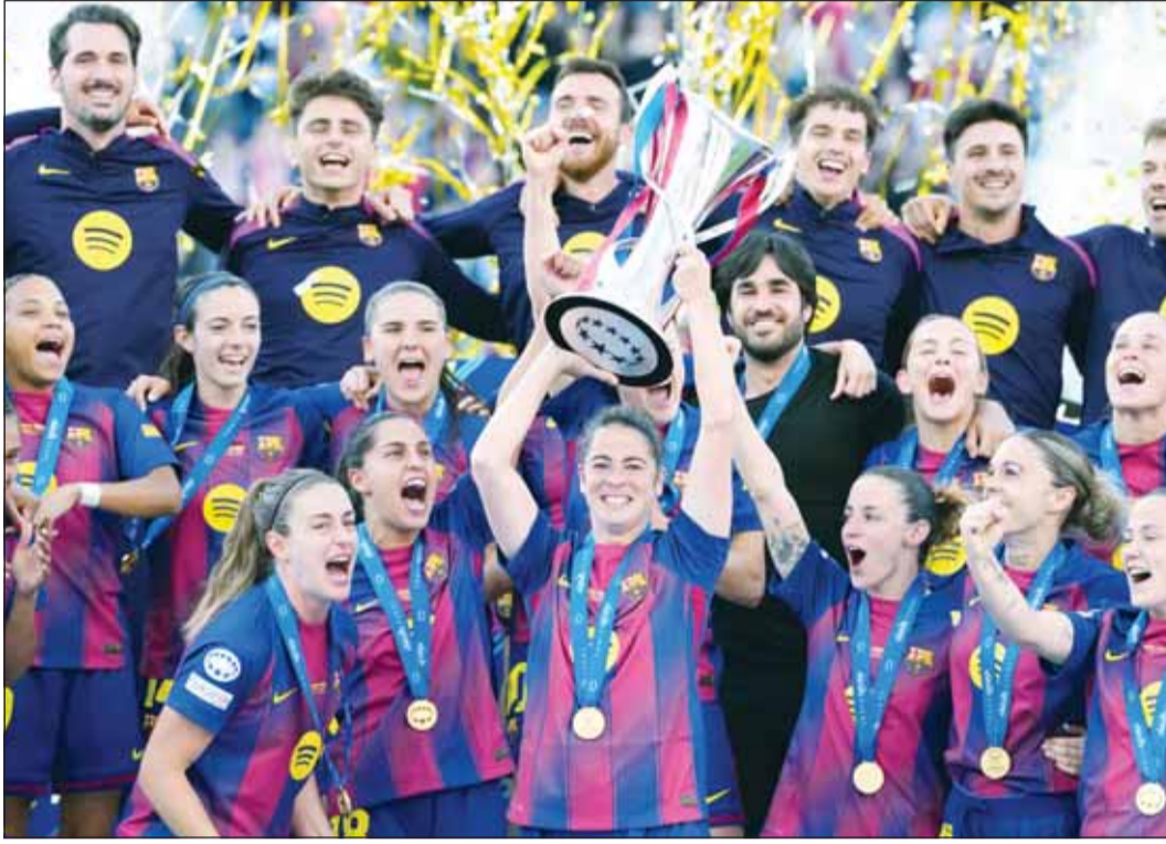
تتويج سيدات برشلونة بكأس دوري أبطال أوروبا

للمرة 29 في تاريخه، عند 94 نقطة في المركز الأول في الترتيب، بعدما حقق اللقب للموسم الثاني على التوالي تحت قيادة مديره الفني الألماني هانزي فليك، بينما رفع فالنسيا رصيده إلى 49 نقطة في المركز الثامن. فيما، اختتم ريال مدريد مسيرته في بطولة الدوري الإسباني، بفوز كبير 4-2 على ضيفه أتلتيك بلباو.