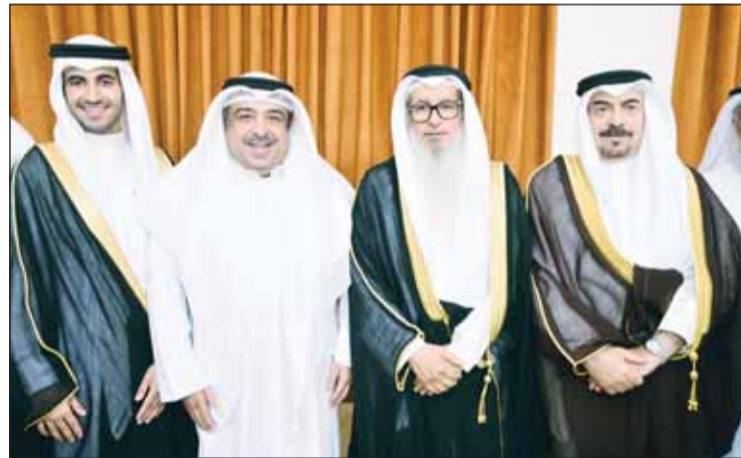
الشيخ علي عبدالعزيز المالك يبارك