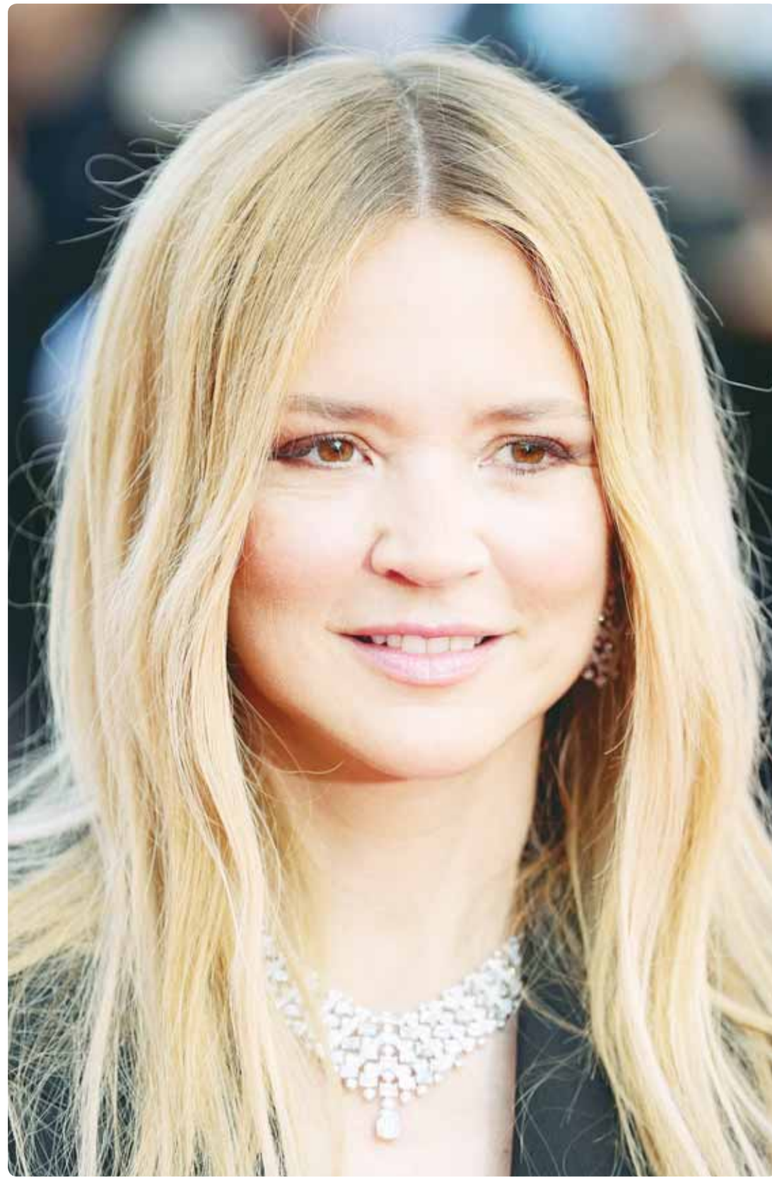
الممثلة البلجيكية فيرجيني إيفيرا خلال حفل توزيع جوائز مهرجان كان السينمائي (راجع ص 13)

ومع تدشين مرحلة العتب الأخوي بين الجناحين الكويتي والفلسطيني، يمكن ترقيّب بزوغ فجر ترميم جديد، يعيد إطلاق العلاقة في سياقات وظروف موثقة، تستهدف مخاطبة الوعي العام، وربما إعادة تشكيله وتشغيت بنيتة.