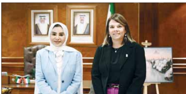
الوزيرة د. أمال الحويلة وإيما مورلي

من جانبها، أشادت مورلي وفق البيان بالمستجدات الخاصة بتنظيم العمل الخيري الكويتي لجهة تعزيز الشفافية والرقابة وتوجيه المساعدات لمختلف البرامج ذات الاستحقاق. وأعربت عن تقديرها لجهود الوزارة في تطوير منظومة العمل الاجتماعي والخيري.