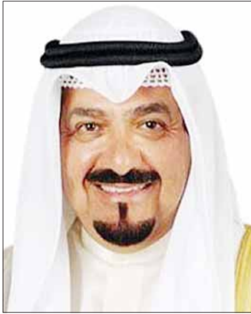
سمو رئيس الوزراء الشيخ أحمد العبدالله