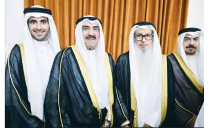
الشيخ مبارك الفيصل قدم التهاني