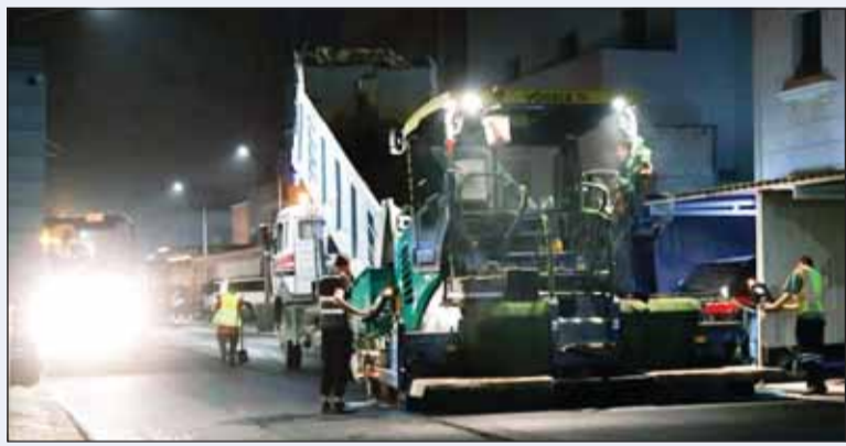
صيانة الطرق في المواقع الجديدة

ولفتت إلى أن مواقع الطرق السريعة تشمل طريق الصبية، وتقاطع الدائري الرابع مع طريق المغرب، وطريق الفحيحيل مقابل مشرف وسلوى، والجسر العلوي لتقاطع الدائري الرابع باتجاه السالمية، إضافة إلى طريق الدائري الرابع من تقاطع طريق المغرب إلى تقاطع شارع دمشق، وطريق السالمي باتجاه الكويت، والدائري السابع من كيلو 24 إلى كيلو 27 في الاتجاهين.