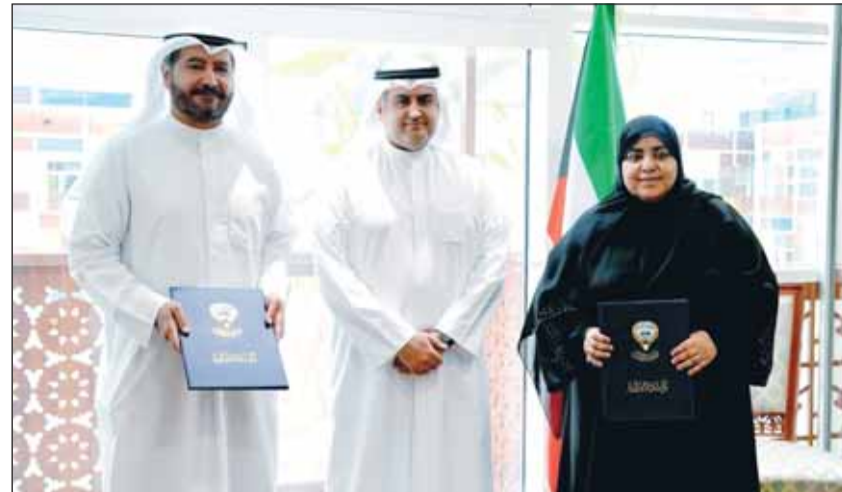
وكيل وزارة العدل بالتكليف عواطف السند ورئيس اتحاد المصارف حمد المرزوق يتبادلان وثائق الاتفاق بحضور وزير العدل المستشار ناصر السميذ

□ "العدل": تسهيل التعاملات بين الوزارة والجهات المصرفية □ المرزوق: تسريع الإجراءات وتعزيز ثقة المتعاملين