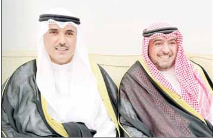
الشيخ تامر العلي والشيخ حمود الجابر