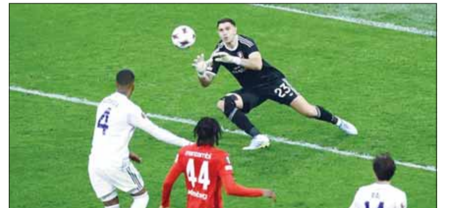
مارتينيز يتعرض لإصابة قبل المونديال

خرج الحارس الأرجنتيني إيميليانو مارتينيز بإصابات طفيفة، من نهائي الدوري الأوروبي ضد فرايبورغ الذي فاز فيه فريقه أستون فيلا 3-صفر، وذلك بعدما تعرض لكسر في إصبعه خلال الإجماع قبل المباراة. ورغم الكسر، شارك الأرجنتيني في المباراة وحافظ على نظافة شبكته، وبعد رفع الكأس، شرح مارتينيز الموقف الصادم بروح الدعابة.