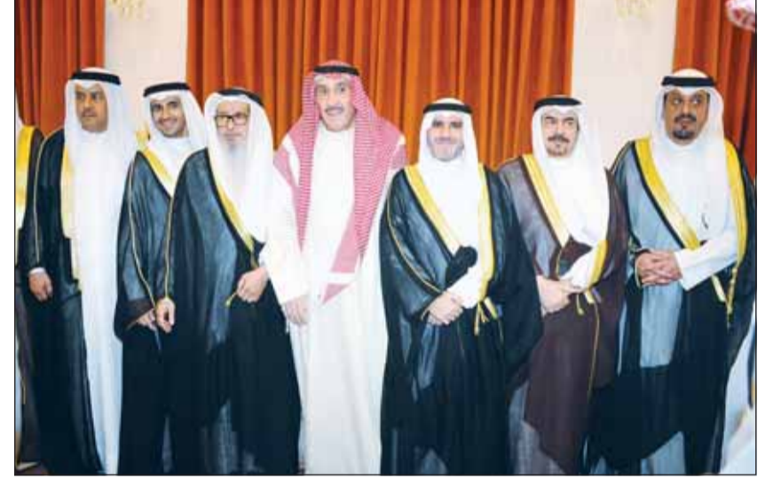
الشيخ عبدالله ناصر الصباح والشيخ فيصل الحمود يهنتان