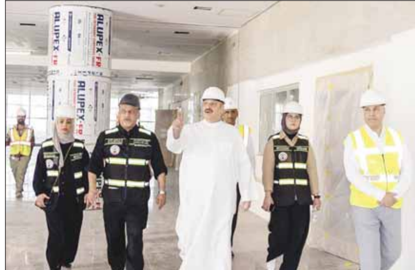
وزير الصحة د. أحمد العوضي خلال تفقده المشروع

□ النهم: توقعات بالانتهاء الكامل من المشروع وتسليمه 31 ديسمبر المقبل