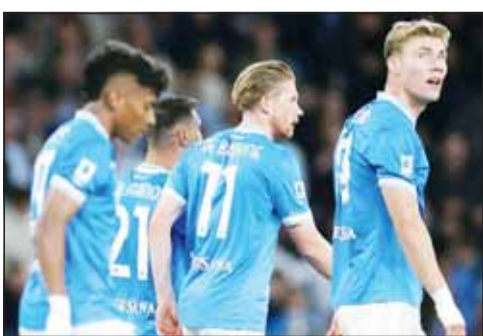
الاستحواذ على نابولي بملعب يور

ذكرت تقارير إعلامية أن نادي نابولي الإيطالي دخل مرحلة مفصلية قد تعيد رسم مستقبله بالكامل، بعد أن تقدم تحالف استثماري أمريكي بعرض ضخم تبلغ قيمته نحو مليار يورو للاستحواذ على النادي من عائلة دي لورينتينس، في واحدة من أكبر الصفقات المحتملة بتاريخ كرة القدم الإيطالية. بحسب ما نشرته صحيفة ذا أثلتيك، فإن مجموعة "أندر دوغ غلوبال بارتنرز" تقود المفاوضات نيابة عن تحالف من المستثمرين الأمريكيين، ضمن مشروع واسع يهدف إلى تحويل نابولي إلى مؤسسة رياضية متعددة الأنشطة، تركز على كرة القدم وكرة السلة والاستثمارات التجارية والبنية التحتية. وأوضحت الصحيفة "رغم أن إدارة نابولي تؤكد حتى الآن أن النادي ليس معروضاً للبيع، فإن المفاوضات لم تتوقف خلال الأشهر الستة الماضية، وسط إصرار من الجانب الأمريكي على محاولة إقناع رئيس النادي أوريليو دي لورينتينس بالتخلي عن ملكيته التاريخية". وأضافت "يمثل العرض الأمريكي قيمة استثنائية مقارنة بالمبلغ الذي دفعه دي لورينتينس عند شراء نابولي عام 2004، حين أنقذ النادي من الإفلاس مقابل نحو 31 مليون يورو فقط، بعدما كان الفريق يلعب حينها في الدرجة الثالثة الإيطالية". وتابعت "منذ استحوذته على النادي، نجح المنتج السينمائي الإيطالي في إعادة نابولي إلى قمة الكرة الإيطالية، محققاً إنجازات تاريخية تضمنت الفوز بلقب الدوري الإيطالي، وإنهاء انتظار دام 33 عاماً للتتويج بالاسكوديتو عندما حقق اللقب في عام 2023، إضافة إلى التتويج بثلاثة ألقاب في كأس إيطاليا ولقب السوبر الإيطالي".