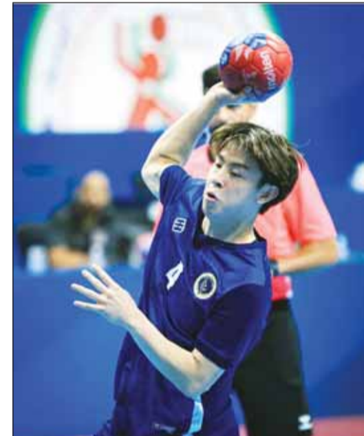
ياسوهيرا نجم يد برقان بالآسيوية

يلتقي فريق كرة اليد الأول بنادي برقان اليوم، منتخب مصر للشباب، في أولى مباريات برقان الودية بمعسكره الحالي بالعاصمة المصرية القاهرة، والذي يستعد من خلاله لخوض منافسات النسخة الثامنة والعشرين من بطولة كأس اسيا للاندية ابطال الدوري لكرة اليد للرجال المؤهلة لمونديال كأس العالم سويفر جلوب - مصر 2027 التي يستضيفها النادي خلال الفترة من 6 وحتى 15 يونيو المقبل.