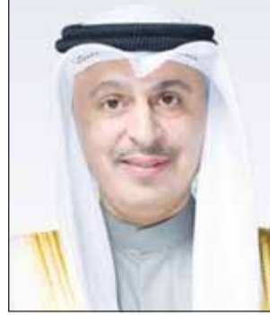
وزير التجارة والصناعة أسامة بودي

التنظيمية المقترحة لمعالجة اختلالات السوق والحد من آثار التضخم. كما أجاز اللجنة تشكيل فرق عمل فرعية متخصصة لإعداد الدراسات والتحليلات الفنية اللازمة ضمن نطاق اختصاصاتها.