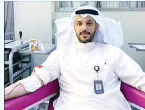
الموظفون يتبرعون بالدم

نظمت شركة "بيتك كابيتال" الذراع الاستثماري لمجموعة بيت التمويل الكويتي، حملة للتبرع بالدم بالتعاون مع بنك الدم المركزي، وبمشاركة واسعة من موظفيها، بهدف الإسهام في دعم المنظومة الصحية وتعزيز جاهزيتها. وقالت الشركة في بيان صحفي أمس، إن الحملة شهدت إقبالاً لافتاً من موظفي الشركة من مختلف الإدارات، في مشهد يعكس عمق ثقافة العطاء والعمل الإنساني المتجددة في بيئة العمل داخل "بيتك كابيتال" وحرص الشركة على تعزيز قيم التكافل المجتمعي. وحرصت "بيتك كابيتال" على تنظيم الحملة وفق أعلى معايير السلامة والإجراءات الصحية المعتمدة، بالتنسيق الكامل مع الفرق الطبية المتخصصة من بنك الدم المركزي، لضمان راحة وسلامة المتبرعين.