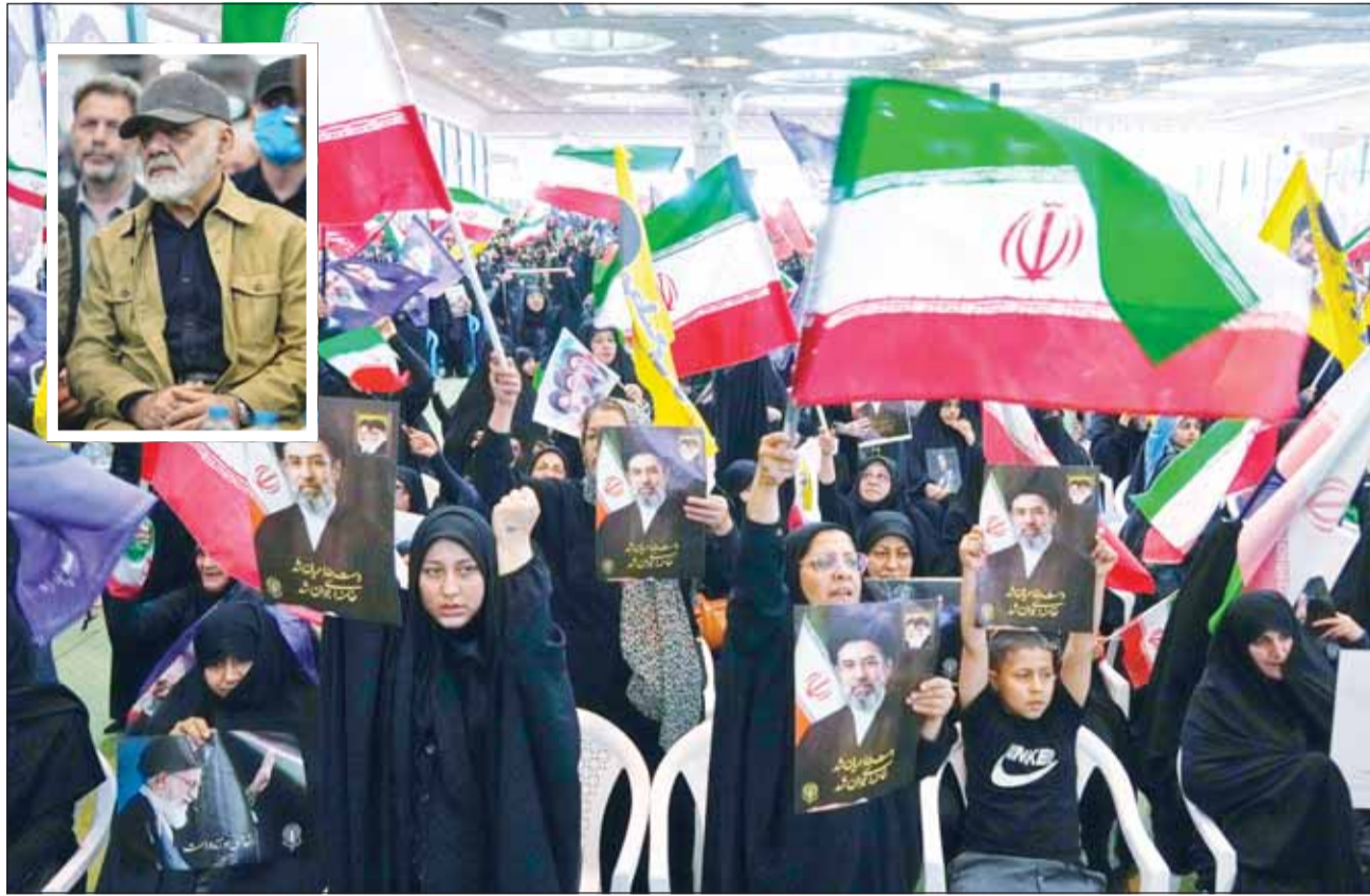
إيرانيون يرفعون الأعلام خلال مراسم بالجامع الكبير في طهران لتأبين قتلهم الحرب وفيه الإطراء قائد مقر خاتم الأنبياء علي بن عبد الله حضره الأعراسم

وغير أمس، أعلن ترامب اقتراب التوصل إلى اتفاق نهائي وشامل مع إيران، مشيراً إلى أن المحادثات قطعت شوطاً حاسماً وأن الإعلان الرسمي عن الاتفاق بات وشيكاً، قائلًا على منصبه "تروث سوشال" إن الأطراف المعنية تعكف على الملمات المعنية، مبيّناً أن الاتفاق يتضمن بنداً رئيسياً ينص على إعادة فتح مضيق هرمز إلى جانب حزمة من البنود الأخرى التي تمت تسويتها خلال جولات التفاوض، بينما توقع وزير الخارجية الأميركي ماركو روبيو صدور إعلان في وقت لاحق من أمس، قائلًا في مؤتمر صحفي مشترك مع نظيره الهندي سورامانيام جايشانكار في نيودلهي، "أعتقد أن المزيد من الأخبار حول الوضع ربما تصدر اليوم (أمس).. هناك احتمال لسماع أخبار سارة خلال الساعات القليلة القادمة بشأن مضيق هرمز"، مشيراً إلى أن الولايات المتحدة أقرت تقدماً بشأن إيران بعد العمل مع دول الخليج، بينما قالت مصادر رفيعة إن الاتفاق المبدئي المحتمل سيحمل اسم "إعلان إسلام آباد"، مضيفة أن باكستان ستعطي إعلاناً مذكراً للتفاهم دون حاجة لحضور أطراف التفاوض، فيما قد تعقد جولة المحادثات المقبلة في الخامس من يونيو، مشيرة إلى أن الاتفاق المبدئي مذكراً تفاهم يليها تفاوض على القضايا النهائية، وبينما أكد وزير الخارجية الباكستاني إسحق دار أن تقدماً كبيراً أمرز ما بيعت على التفاوض بإمكانية التوصل إلى نتيجة