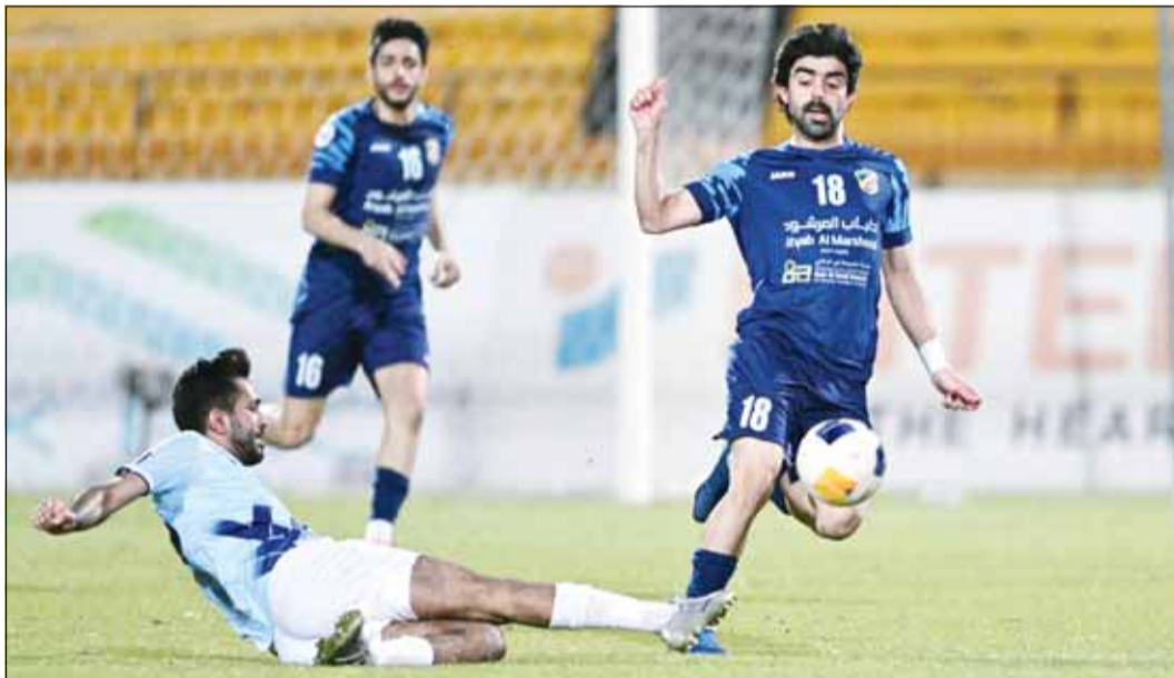
السالمية حقق فوزاً سهلاً على الشباب

المدرّب التونسي نبيل معلول، وأثبتت قدرتها في التواجد ضمن التشكيلة الأساسية. على الجانب الآخر، يطمح التضامن التاسع (12 نقطة)، إلى الاستفادة من ارتفاع معنويات لاعبيه، بعد أن فرض التعادل الذي حققه على السالمية في الجولة الماضية (1-2)، والذي شهد مشاركة عدد من العناصر الشابة التي دفع بها