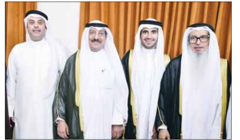
براك النون يبارك