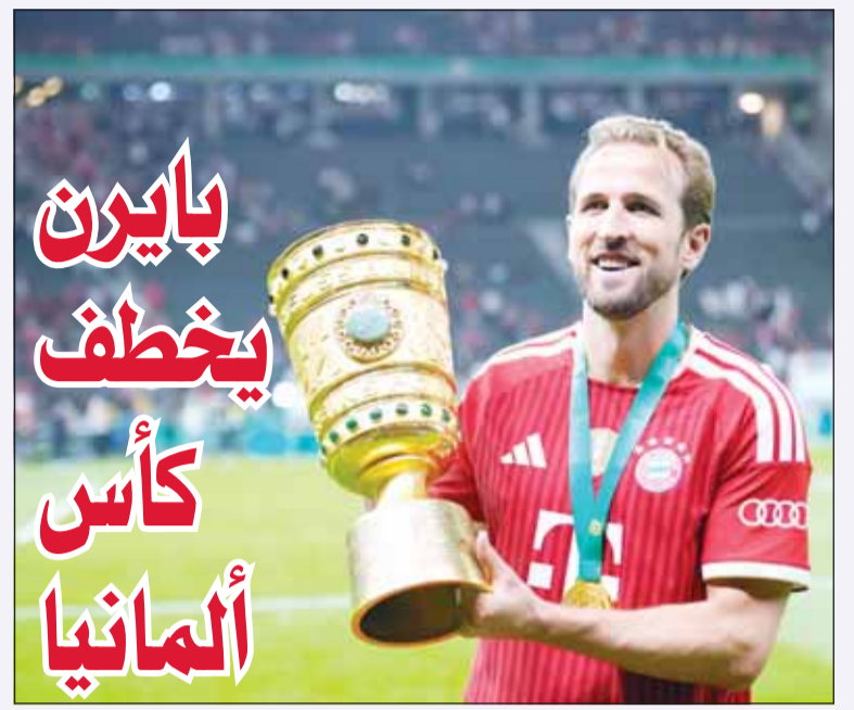
كين حطم رقماً صامداً من 98 عاماً

ومازال فريق برشلونة للرجال عاجزاً عن تحقيق دوري أبطال أوروبا منذ 11 عاماً، إذ غادر البطولة المالية من ربع النهائي إثر الخسارة أمام أتلتيكو مدريد 3-2 في مجموع المباراتين. من جانبه، ودع فريق برشلونة للرجال نجمه البولندي روبرت ليفاندوفسكي