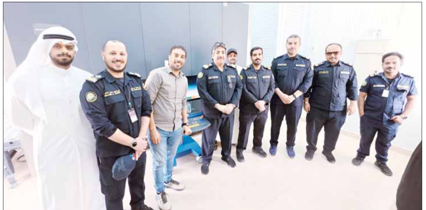
فريق "الجمارك" في منفذ السالمي خلال تدشين استخدام الجهاز