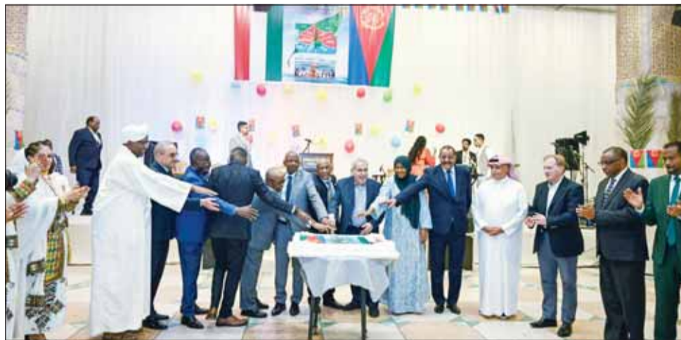
قطع قالب الحلوى خلال الاحتفال