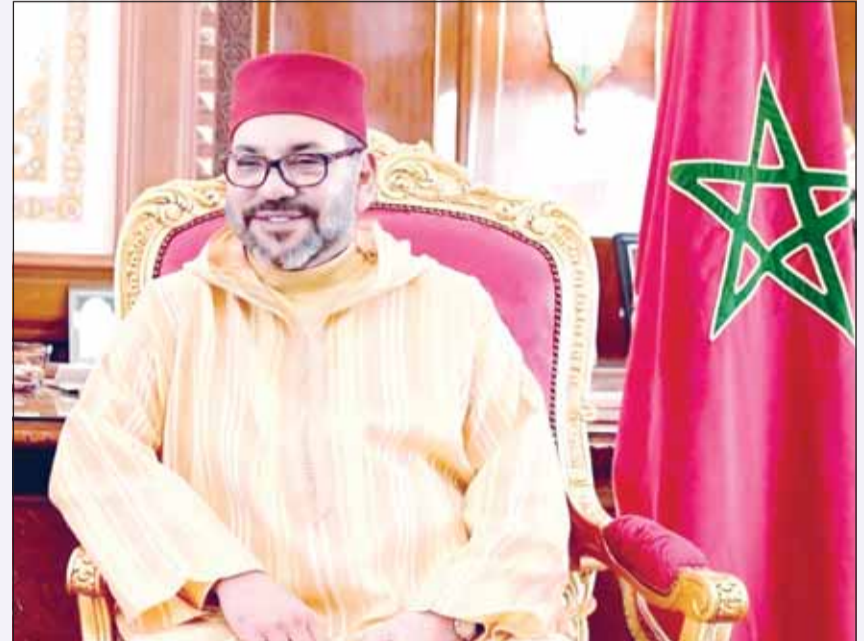
الملك محمد السادس

عاد المشجعون السنغاليون الذين سجنوا بعد أعمال الشغب التي وقعت خلال نهائي كأس أمم أفريقيا 2025 في كرة القدم في الرباط في يناير، إلى السنغال صباح أمس، بعد أن شملهم عفو ملكي أصدره العاهل المغربي الملك محمد السادس يوم السبت "لاعتبارات إنسانية". وفي 18 يناير، خلال نهائي البطولة في الرباط، فاز السنغال 1-0 في نهاية مباراة فوضوية. وعقب احتساب ركلة جزاء للمغرب في الوقت بدل الضائع من الشوط الثاني، مباشرة بعد إلقاء هدف للسنغال، غادر عدد من اللاعبين السنغاليين أرض الملعب، فيما حاول مشجعون اقتحام الميدان ورشقوا مقدوفات. وفي فبراير، أصدرت العدالة المغربية أحكاماً بالسجن النافذ تراوحت بين ثلاثة أشهر وسنة بحق 18 سنغالياً بتهمة "شغب الملاعب"، ولا سيما ارتكاب أعمال عنف ضد قوات الأمن، بعد توقيفهم خلال النهائي واحتجازهم في المغرب منذ تلك الأحداث، وقد وضعت هذه القضية أواخر الصداقة بين الرباط وداكار على المحك.