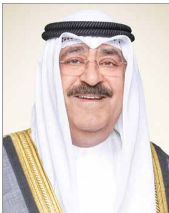
سموه أمير البلاد الشيخ مشعل الأحمد

وبعث سمو ولي العهد برسائل شكر جوابية ضمنها سموه شكره على ما عبروا عنه من طيب المشاعر ومن صادق الدعاء بمناسبة عيد الأضحى المبارك سائلاً سموه الباري جل وعلا أن يحفظ الوطن العزيز ويديم عليه نعمة الأمن