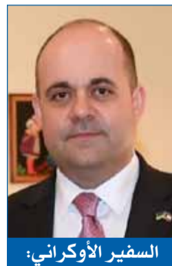
السفير الأوكراني: في العيد تتجلى بأبهى صورة قيم الألفة والتعايش بين الشعوب