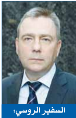
السفير الروسي: جهود الكويت الإنسانية والخيرية مستمرة في دعم كل المحتاجين