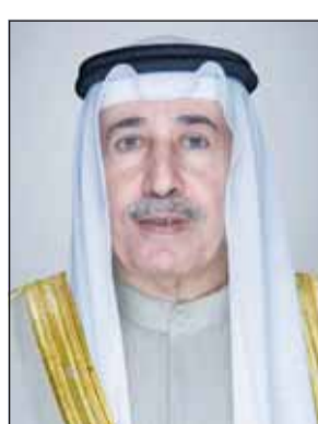
الشيخ مبارك الحمود

تقدم رئيس الحرس الوطني الشيخ مبارك الحمود بأسمى آيات التهاني والتبريكات إلى مقام صاحب السمو أمير البلاد الشيخ مشعل الأحمد القائد الأعلى للقوات المسلحة وإلى سمو ولي العهد الشيخ صباح الخالد بمناسبة عيد الأضحى المبارك. وقال الحرس الوطني في بيان لوكالة الأنباء الكويتية (كونا) أمس، إن الشيخ مبارك الحمود تقدم بالأصالة عن نفسه ونجابهة عن منتسبي الحرس الوطني قادة وقوات إلى المقام السامي بأسمى آيات التهاني والتبريكات بمناسبة قرب حلول عيد الأضحى المبارك.