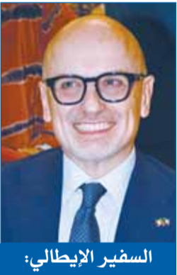
السفير الإيطالي: علاقاتنا مع الكويت في تطور مستمر ومثمر في المجالات كافة