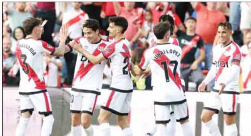
النهائي الأول بتاريخه لفرق فايكانو

ويبلغ رايو فايكانو نهائي دوري المؤتمر الأوروبي لأول مرة في تاريخه، إذ يبحث عن بطولته الأولى عبر كل العصور في المستوى الأعلى بعدما اكتفى بتحقيق بطولات الدرجة الثانية والثالثة في السنوات الماضية. ولتعلقت صحيفة "ماركا" الإسبانية صورا من وصول الفريق المرديدي إلى لايبزيغ متوجعا بعشرة مشجعين فقط التقطوا صورا مع المدرب إينغفو بيريز واللاعبين، قبل 48 ساعة من المباراة المرتقبة.