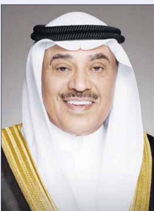
سموه ولي العهد الشيخ صباح الخالد

سموه بادل كبار الشيوخ الدعوات بأن يديم الله الأمن والرخاء ولي العهد يتبادل التهاني بالعيد مع ملوك ورؤساء الدول العربية والإسلامية