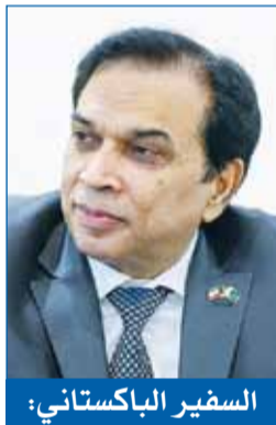
السفير الباكستاني: نبارك للكويت بعيد الأضحى ونؤكد التزامنا الثابت بأمنها