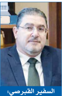
السفير القبرصي: حريصون على تطوير تعاوننا البناء مع الكويت في كل الميادين