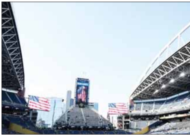
الظروف الطبيعية تهدد كأس العالم

تعتبر الحرارة والرطوبة والعواصف الرعدية مرادفات للصيف في العديد من مناطق أميركا الشمالية، لكنها قد تشكل بعد أسابيع قليلة تهديدا لكأس العالم 2026 في كرة القدم. تقام النسخة الـ 23 من النهائيات العالمية في كل من الولايات المتحدة وكندا والمكسيك عبر 16 مدينة مضيفة، من بينها مناطق معتادة على درجات حرارة صيفية مرتفعة تتفاقم بفعل رطوبة خانقة. وفي الوقت نفسه، تشكل حرائق الغابات المتكررة في أماكن مثل كندا وكاليفورنيا مخاطر على جودة الهواء. ثم هناك الرعد والبرق، تسودي العواصف الصيفية في الولايات المتحدة في أغلب الأحيان إلى إيقاف الأحداث الرياضية في الهواء الطلق. وعلى المنظمين فرض تأخير الزماني لمدة 30 دقيقة عند حدوث صاعقة ضمن نطاق بين 8 و10 أميال (13 إلى 16 كيلومترا). وكل ضربة لاحقة تعني بدء فترة توقف جديدة مدتها نصف ساعة.