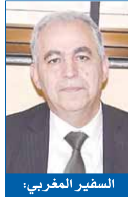
السفير المغربي: نهني سمو الأمير والملك محمد السادس وشعبي البلدين بالعيد

تقدم سفير فرنسا لدى البلاد أوليفييه غوفان بأصدق التهاني