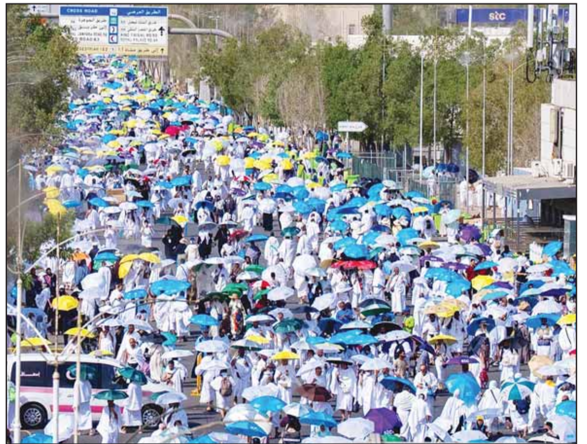
الحجاج يؤدون مناسك الحج

وشهد الموقع انسيابية عالية في حركة الحشود بفضل الخطط التشغيلية والتنظيمية المتكاملة التي نفذتها الجهات المعنية لإدارة مسارات المشاة، وتنظيم الوصول إلى المواقع المحيطة بالجبل، إلى جانب تكثيف الخدمات الإرشادية والصحية والإنسانية على مدار الساعة.