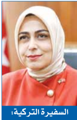
السفيرة التركية: عيد الأضحى مناسبة لتجسيد قيم التضحية والرحمة والتضامن