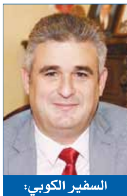
السفير الكويبي: علاقاتنا مع الكويت قائمة على التفاهم الاحترام