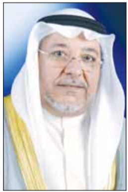
الشيخ علي الجراح

رفع وزير الديوان الأميري الأسبق الشيخ علي الجراح أسمى آيات التهاني والتبريكات إلى مقام سمو أمير البلاد الشيخ مشعل الأحمد وسمو ولي العهد الشيخ صباح الخالد والشعب الكويتي الكريم، بمناسبة عيد الأضحى المبارك. وأكد الشيخ علي الجراح أن هذه المناسبة المباركة تعزز معاني التلاحم والتسامح والانتماء الوطني، مشيراً إلى أن الكويت استطاعت الحفاظ على أمنها واستقرارها بفضل وحدة شعبها وحكمة قيادتها الرشيدة. وأضاف أن الأعياد تمثل فرصة لتعزيز قيم الوسطية والمحبة والعمل المشترك، داعياً الجميع إلى الحفاظ على مسيرة التنمية والاستقرار.