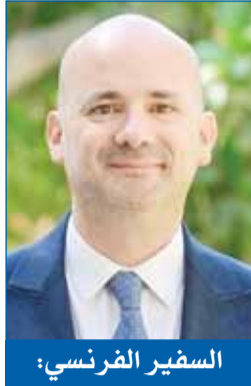
السفير الفرنسي: نتطلع لأن تحمل هذه المناسبة المباركة السلام والطمأنينة