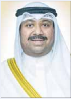
الشيخ عبد الله الفالكي

رفع وزير الدفاع الشيخ عبدالله العلي أسمى آيات التهاني والتبريكات إلى مقام صاحب السمو أمير البلاد الشيخ مشعل الأحمد القائد الأعلى للقوات المسلحة وإلى سمو ولي العهد الشيخ صباح خالد وإلى سمو رئيس مجلس الوزراء الشيخ أحمد عبدالله بمناسبة عيد الأضحى المبارك.