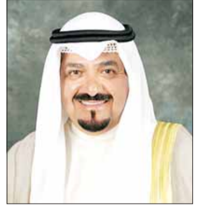
الشيخ أحمد عبدالله

كما أعرب سموه عن بالغ التقدير بالدور الكبير الذي تقوم به المملكة العربية السعودية الشقيقة قيادة وحكومة وشعباً في تنظيم موسم الحج وتسيير امکانات والخدمات المتطورة لخدمة ضيوف الرحمن، مشيداً بما تبذله الجهات المختصة من جهود مميزة أسهمت في توفير الأجواء الآمنة والميسرة للحجاج من مختلف دول العالم بما يعكس دورها الكبير والريادي متمنياً للمملكة العربية السعودية الشقيقة دوام الرفعة والازدهار.