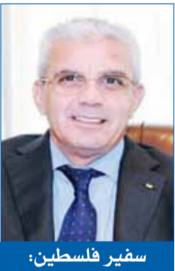
سفير فلسطين: نثمن مواقف دولة الكويت الداعمة للقضية الفلسطينية