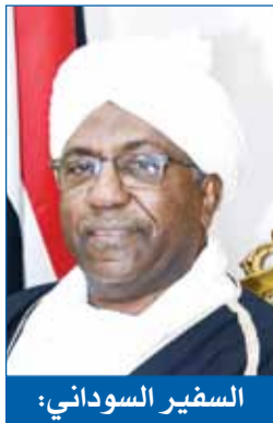
السفير السوداني: نرجو للكويت مزيداً من التماسك والوحدة والأمن والاستقرار