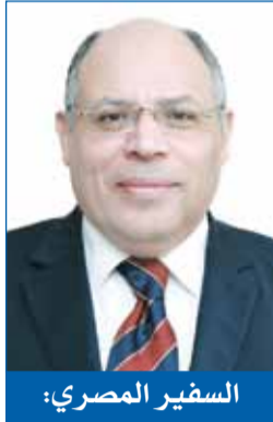
السفير المصري: نعز بعلاقاتنا الأخوية والتاريخية الراسخة مع الكويت