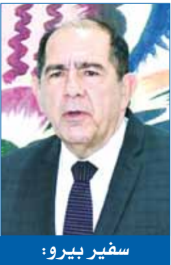
سفير بيرو: حكمة القيادة الكويتية مكنت البلاد من التعامل مع الأزمة الأخيرة