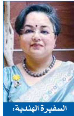
السفيرة الهندية: عيد مبارك للكويت... وشكر كبير لتقديرها كل الدعم لجاليتنا