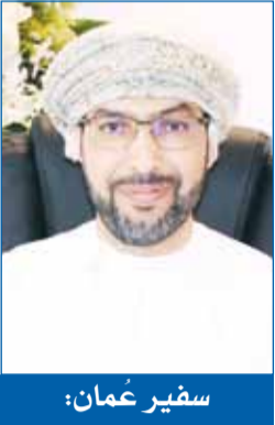
سفير عُمان: أدام الله على الكويت نعمة الأمن والأمان في ظل قيادتها الحكيمة