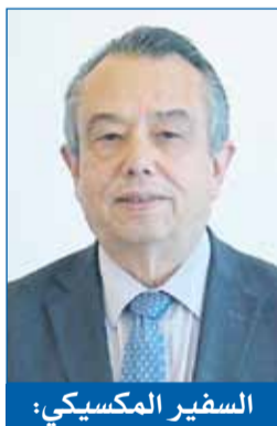
السفير المكسيكي: علاقاتنا مع الكويت راسخة وتقوم على الاحترام المتبادل