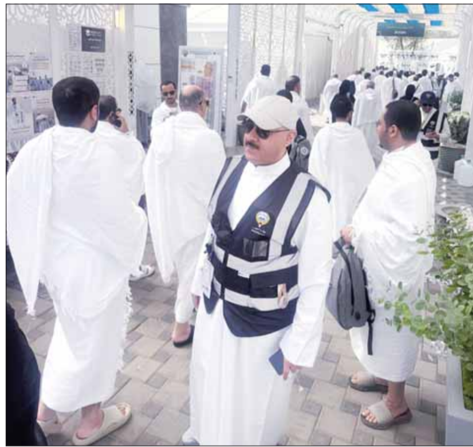
رئيس بعثة الحج بالتكليف د.سليمان السويلم مستقبلاً الحجاج الكويتيين في عرفات

عرفات - "كونا"، أعلن رئيس بعثة الحج الكويتية وكيل وزارة الشؤون الإسلامية بالتكليف الدكتور المهندس سليمان السويلم، أمس، اكتمال وصول جميع حملات الحج الكويتية إلى صعيد عرفات لأداء الركن الأعظم من مناسك الحج.