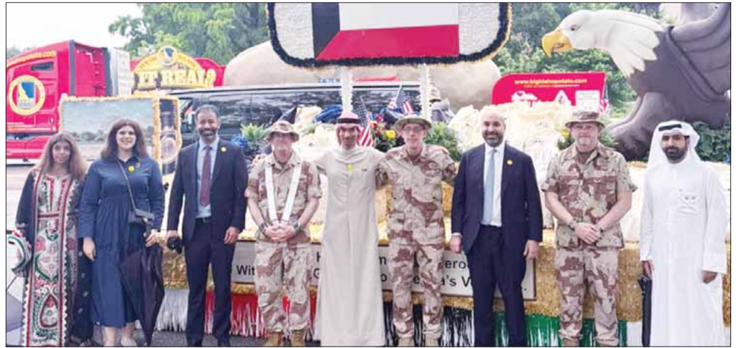
جانب من احتفالات السفارة الكويتية في واشنطن بيوم الذكرى