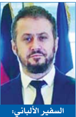
السفير الألباني: نستذكر في العيد دور الكويت التنموي والإنساني الداعم لنا