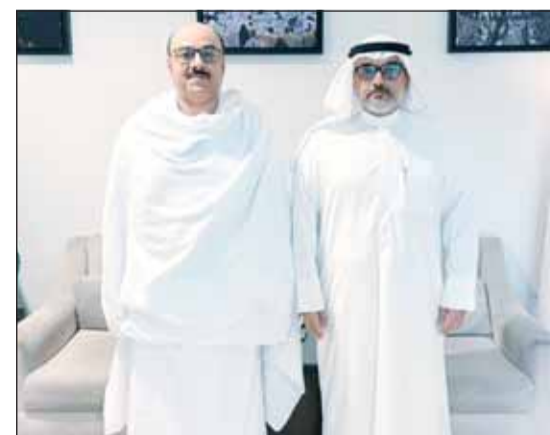
القنصل يوسف التنيب مستقبلاً رئيس بعثة الحج د.سليمان السويلم

مثنياً جهودهم المتواصلة التي أسهمت في توفير أعلى مستوى من الخدمات والراحة لحجاج دولة الكويت وضمان انسيابية تنقلهم وأدائهم للمناسك بكل سهولة. وأشار إلى التجهيز المبكر لمقر بعثة الحج الكويتية في مشعر عرفات بكافة الإمكانيات وبشكل متميز لتوفير أفضل سبل الرعاية وتمكين الحجاج من أداء المناسك بكل يسر. وأشاد بالرعاية الكريمة والاهتمام المتواصل من القيادة السعودية الرشيدة وبالجهود الكبيرة التي تبذلها