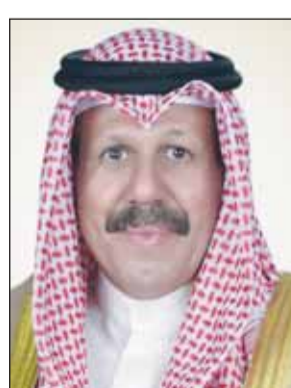
الشيخ فيصل النواف

وأكد أن منتسبي الحرس الوطني سيواصلون أداء واجبهم الوطني بأعلى درجات الجاهزية والاستعداد للقيام بمهامهم بكل كفاءة واقتدار خاصة في ظل الظروف الاستثنائية داعياً المولى عز وجل أن يديم على دولة الكويت نعمة الأمن والأمان وأن يحفظها وشعبها من كل مكروه في ظل القيادة الحكيمة.