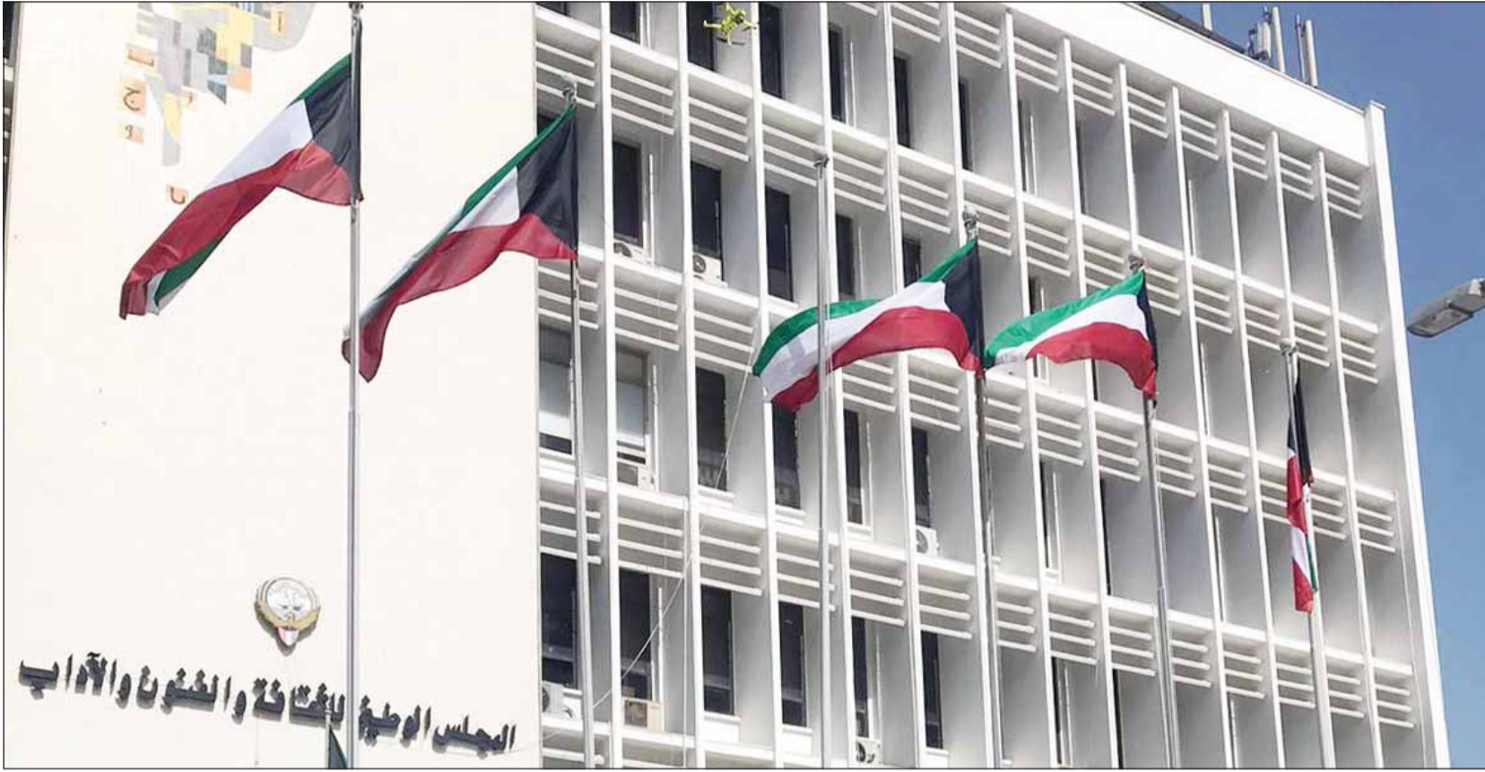
مبنى المجلس الوطني للثقافة والفنون والآداب

علمت "السياسة" أن الجهاز المركزي للمناقصات العامة قرر خلال اجتماعه الذي عقد الاثنين الماضي فتح العطاءات الفنية المقدمة لممارسة "خدمات الاستشارات لمشروع إعداد وتطوير البنية التعليمية للاقتصاد الإبداعي".