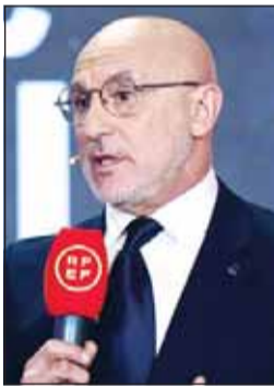
لويس دي لا فوينتي

وأضاف "إذا كان علينا المخاطرة، فسنخاطر في كأس العالم. لكن نظرنا تتجاوز المباراة الأولى والثانية أيضا. لذا، إذا كان علينا الانتظار لفترة أطول قليلا، فسنتظر".