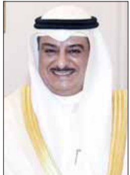
المستشار سعد الصفران

تقدم النائب العام المستشار سعد الصفران باطبيب التهاني والتبريكات إلى مقام صاحب السمو أمير البلاد الشيخ مشعل الأحمد وإلى سمو ولي العهد الأمين الشيخ صباح الخالد وإلى سمو رئيس مجلس الوزراء الشيخ أحمد عبدالله وإلى الشعب الكويتي الكريم بمناسبة حلول عيد الأضحى المبارك. وهذا المستشار الصفران في بيان صحفي أمس باسمه وبالأصالة عن المصانين العموم وأعضاء النيابة العامة كافة القيادة السياسية بهذه المناسبة السعيدة.