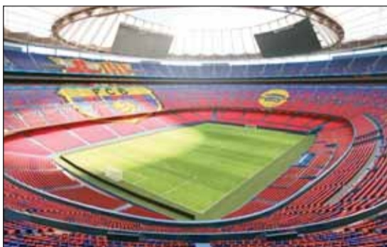
تطوير ملعب سبوتيفاي كامب نو

أكدت تقارير إعلامية أن نادي برشلونة يواصل المضي في مشروعه الضخم لتطوير ملعب سبوتيفاي كامب نو، ضمن خطة شاملة لا تقتصر على الجانب الرياضي فقط، بل تمتد إلى تعزيز العوائد الاقتصادية عبر نموذج استثماري مبتكر يهدف إلى تحويل الملعب إلى وجهة ترفيهية وسياحية متكاملة.