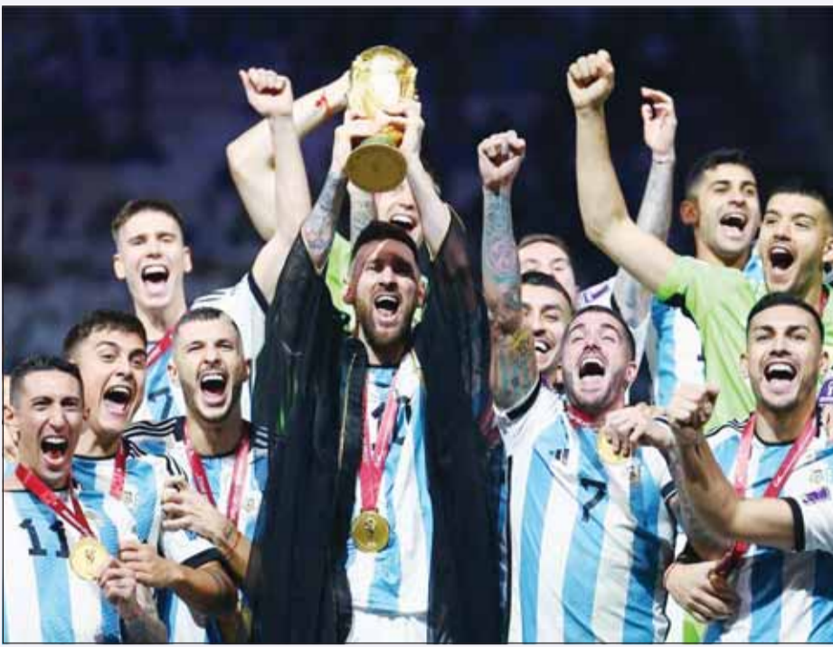
التانغو يخشع لعنة خروج البطل من الدور الأول

الدور الأول رغم امتلاكه كوكبة من النجوم بقيادة بيليه، وذلك بعد خسارتين أمام المجر والبرتغال. وتعرض منتخب فرنسا لكرة القدم لواحدة من أكبر مفاجآت كأس العالم، حين خرج من دور المجموعات في مونديال 2002 بكوريا الجنوبية واليابان، بعد أربعة أعوام فقط من تتويجه باللقب على أرضه. وفشل المنتخب الفرنسي، بقيادة زين الدين زيدان، في تحقيق أي فوز، بعدما خسر أمام السنغال والدنمارك وتعادل مع أوروغواي. وعادت إيطاليا لتعيش السيناريو ذاته في مونديال 2010 بجنوب إفريقيا، بعدما تخليت مجموعتها برصيد نقطتين فقط، إثر تعادلين أمام باراجواي ونيوزيلندا، ثم خسارة مفاجئة أمام سلوفاكيا. وفي مونديال 2014 بالبرازيل، خرج منتخب إسبانيا لكرة القدم مبكرا بعد خسارتين قاسيتين أمام هولندا وتشيلي، رغم احتفاله بمعظم نجوم جيله الذهبي المتوج بلقب 2010. أما منتخب ألمانيا لكرة القدم، بطل مونديال 2014، فقد أصبح الضحية السادسة في نسخة روسيا 2018، بعدما خسر أمام المكسيك وكوريا الجنوبية، ليودع البطولة من الدور الأول للمرة الأولى منذ عقود. ومع اقتراب انطلاق كأس العالم 2026، تبقى الأ نظار موجهة نحو المنتخب الأرجنتيني لمعرفة ما إذا كان سيتمكن من كسر هذه القاعدة التاريخية، أم أن "لعنة البطل" ستضيف ضحية جديدة إلى قائمتها الطويلة.