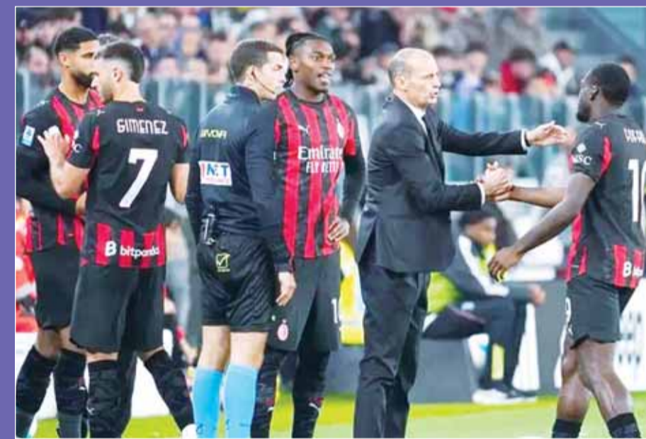
أليغري خلال مباراة سابقة لميلان

"شكراً على كل شيء، يا مدرينا". وأنهى نابولي موسمه بالمركز الثاني خلف إنتر ميلان المتوج بلقب الدوري الإيطالي. وأعلن كونتي تنحيه في مؤتمر صحفي قبل أن يدخل في مشادة مع رئيس النادي.