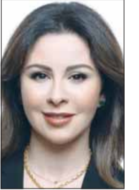
السفيرة الزين الصباح

في لحظات مفصلية من التاريخ ورسختها المواقف والتضحيات المشتركة". مشيرة إلى قيادة الولايات المتحدة الأميركية لتحالف عالمي في حرب تحرير الكويت في عام 1991. وأوضحت أنه "مع قرب افتتاح النصب التذكاري الوطني لحرب عاصفة الصحراء هذا الخريف نواصل تكريم أولئك الذين وقفوا إلى جانب الكويت وأسهموا في صناعة مسار التاريخ". ويعد (يوم الذكرى) مناسبة سنوية تطل في الإثنين الأخير من شهر مايو وتقام أبرز مراسمه في مقبرة (أرلينغتون) الوطنية قرب العاصمة واشنطن حيث يضع الرئيس الأميركي إكليلاً من الزهور على قبر الجندي المجهول تكريماً للقتلى العسكريين الأميركيين. وبدأت دولة الكويت على المشاركة في مراسم إحياء هذا اليوم الذي يقام في شارع الدستور الرابط بين البيت الأبيض والكونغرس بحضور وفد من السفارة الكويتية في واشنطن.