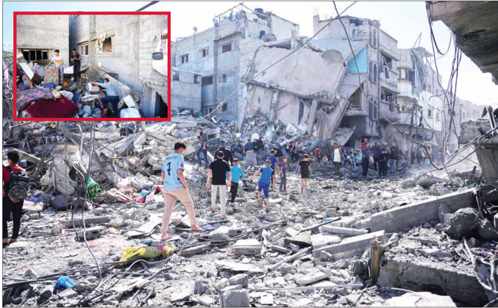
فلسطينيون يتفقدون أنقاض ميناء دمرة غارة جوية إسرائيلية في النصيرات وسط قطاع غزة

وقال، "شغلت لسنوات عديدة أرفع المناصب، سواءً في السلك الدبلوماسي، أو في الحكومة والكنيست، وأعتقد أنني أعرف ما تحتلّه دولة إسرائيل"، وفق تعبيره. ووفقاً لموقع "واللا"، تحدث أردان عن محادثاته الجارية لتأسيس حزب جديد، قائلاً، "الهدف هو إنشاء قوة سياسية تقول كفى، لسنا مستعدين لقبول هذا الوضع. لن ننضم إلى حكومة ضيقة، تعتمد على هذا القطاع أو ذلك، أو هذه الهيئة المتطرفة أو تلك". وأضاف عضو حزب الليكود، "لن أُنحَق قطاً لليكود وما يحدث داخله. المستعمون أنكبء بما يكفي ليبركوا أنني لو شعرت بالارتياح لما يحدث الآن داخل الليكود، لعدت إلى العمل السياسي".