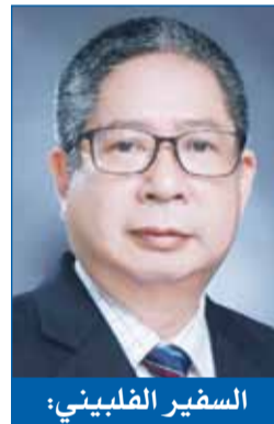
السفير الصيني: في الأعياد تتجسد بجلاء قيم السلام والأخوة بين الشعوب