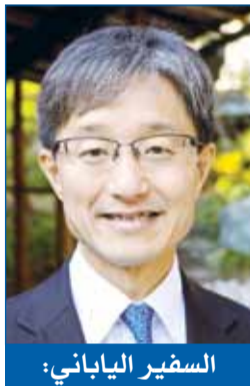
السفير الياباني: الكويت أثبتت أنها صديق حقيقي لبلادنا وشعبنا في وقت الأزمات