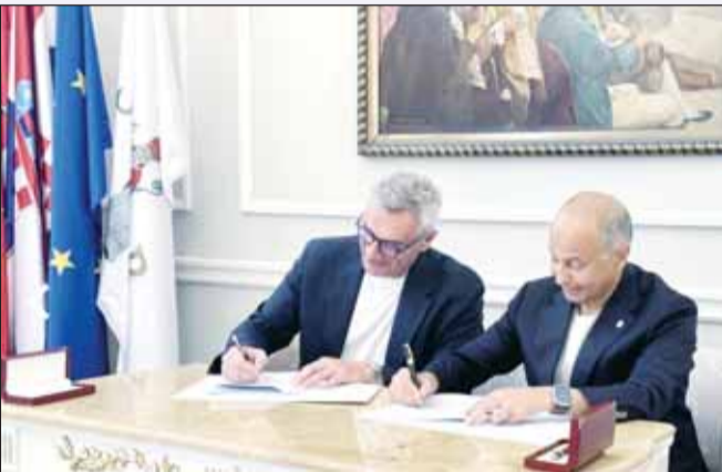
المسلم خلال توقيع عقد البطولة

وقع الاتحاد الدولي للألعاب المائية عقد استضافة أول بطولة عالم لكرة الماء بنظامها الجديد (4x4)، والتي ستقام خلال الفترة من 31 أغسطس إلى 6 سبتمبر المقبلين بمدينة دوبروفنيك السياحية في كرواتيا.