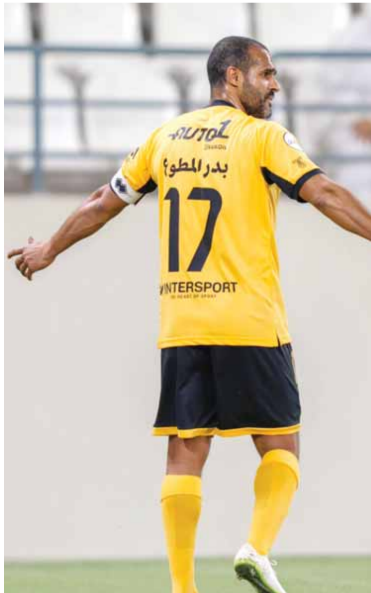
المطوع قاد القادسية لتحقيق فوز ثمين على التضامن (القادسية)