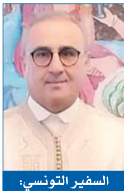
السفير التونسي: روابط الأخوة بين بلدينا راسخة... ونتطلع للمزيد من التعاون