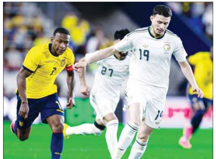
جانب من لقاء السعودية والإكوادور

عندما أفرقت دفاع الإكوادور من الناضية اليسرى قبل أن يطلق تسديدة أرضية من داخل منطقة الجزاء ارتطمت بقدم الحارس وسكنت شبكها. وهذه المباراة الأولى لليوناني دونيس المدرب الجديد للسعودية الذي تولى المسؤولية الشهر الماضي وحتى يوليو 2027 خلفاً للفرنسي هيرفي رينارد، وذلك قبل أقل من شهرين على انطلاق كأس العالم في أمريكا الشمالية. وتخوض السعودية غمار كأس العالم، التي تستضيفها الولايات المتحدة وكندا والمكسيك، ضمن المجموعة الثامنة إلى جوار منتخبات إسبانيا بطة أوروبا وأوروغواي بطة العالم مرتين والرأس الأخضر.