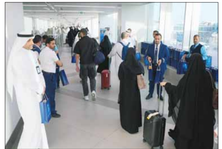
خلال توزيع الهدايا

استقبلت شركة الخطوط الجوية الكويتية أول من أمس أولى رحلات وصول الحجاج من مطار الكويت الدولي (تي 4) حيث تضمنت رحلات العودة من جدة والطائف بالإضافة إلى المدينة المنورة. وقال الرئيس التنفيذي للشركة بالتكليف عبد الوهاب الشطي "إن استقبال حجاج بيت الله الحرام يأتي في إطار حرص الخطوط الكويتية على الاهتمام بتوفير كافة وسائل وسبل الراحة أثناء وصولهم، مبيناً أن الشركة تولي اهتماماً بالغاً بأن تكون الإجراءات سلسة ومرحبة وميسرة وبمبسطة وذلك بالتعاون والتنسيق مع كافة القطاعات المعنية في البلاد. وأضاف أن الناقل الوطني لخدمة الحجاج قامت بتقديم خدمات المناولة الأرضية في مبنى (تي 4) للحجاج المسافرين على الخطوط الجوية العربية السعودية وشركة طيران ناس في المغادرة والوصول وتسهيل إجراءات السفر لهم. وأكد الشطي أن الشركة تقوم بتشكيل لجنة دائمة خاصة بالحج والعمرة سنوياً مكونة من أهم قطاعات الشركة، مشيراً إلى أن اللجنة تعمل على متابعة التنظيم لرحلات الحج والعمرة بشكل دائم طوال العام وذلك للعمل على تقديم أفضل تجربة لخدمة الحجاج المسافرين على متن طائرات الخطوط الجوية الكويتية. وذكر أن نجاح موسم الحج هذا العام أتى بعد تخطيط ودراسة متأنية ومتكاملة العناصر لتقديم أفضل الخدمات المتميزة لعملاء الشركة وذلك بالتعاون والتنسيق مع كافة الشركات والممات المتخصصة بالحج والعمرة المشاركة في موسم الحج. وأكد على مواصلة الشركة جهودها في تقديم أفضل الخدمات للحجاج سواء في إنهاء إجراءات السفر أو على متن الطائرة معرباً عن خالص شكره لكافة حملات الحج التي وضعت ثقها في الناقل الوطني لدولة الكويت".