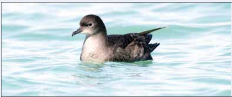
جلم الماء قصير الذيل