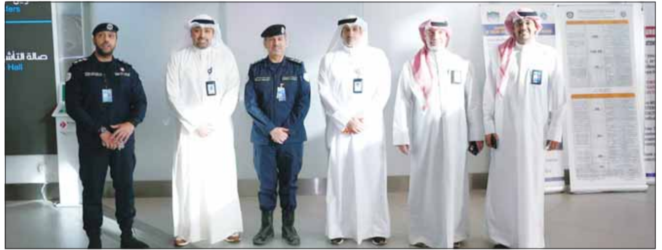
مسؤولو "الكويتية" وأمن المطار في استقبال حجاج بيت الله الحرام