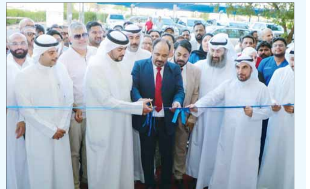
مسؤولو الشركة خلال قص شريط الافتتاح