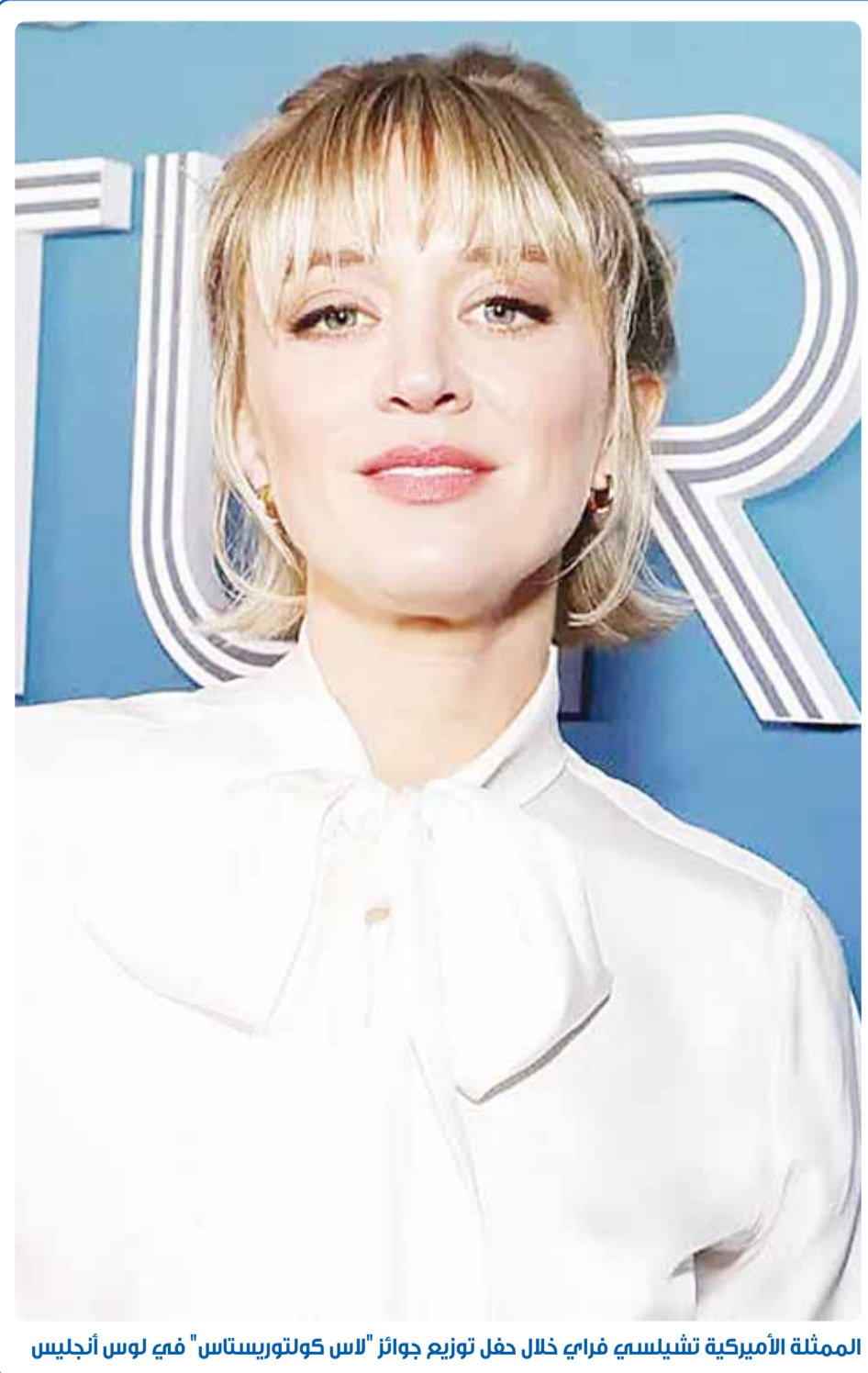
الممثلة الأميركية تشيلسي فراي خلال حفل توزيع جوائز "لاس كولتوريستاس" في لوس أنجلوس

يبدو أن النيزك قد فتحت على ارتفاع 40 ميلاً فوق شمال شرق ماساتشوستس وجنوب شرق نيو هامبشاير، وتقدّر الطاقة المنبعثة عند التفتت بما يعادل نحو 300 طن من مادة "تي إن تي"، وهو ما يفسر الصوت العالي.