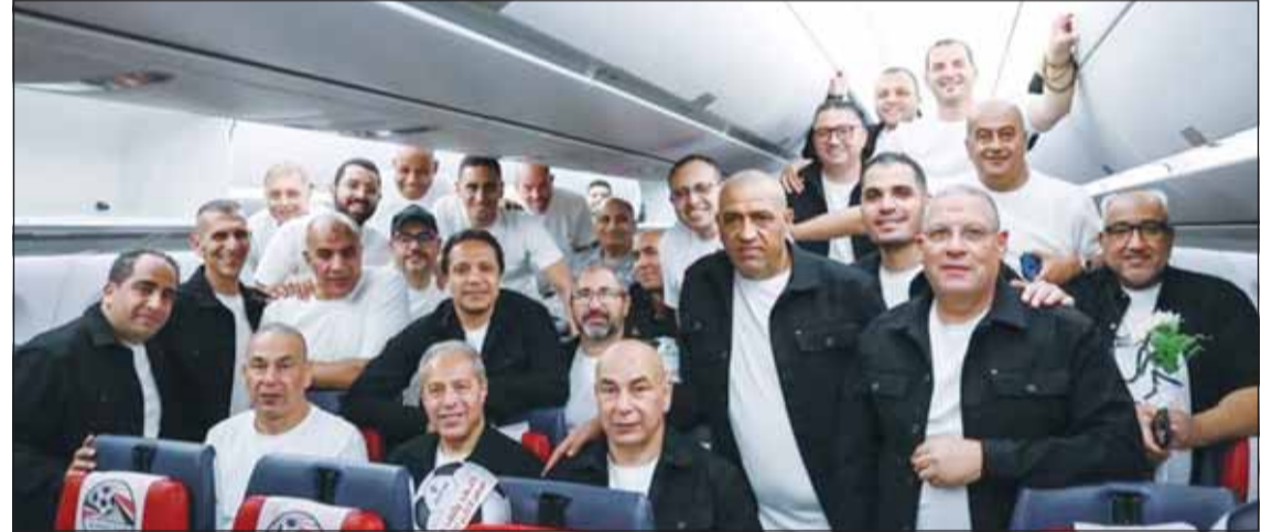
بعثة مصر إلى كأس العالم

عايزين المنتخب ياخذ كل دعم ورعاية، لكن من حق الناس تسأل، مين اللي هيسافر؟ وليه هيسافر؟ واغتاروه على أي أساس؟ وكل دولار هيتصرف من المال العام رايح فين؟". وأوضح أن قرارات وزارة الشباب والرياضة كشفت عن توسع كبير في تشكيل البعثة ومسئولياتها، رغم أن بعثة منتخب كرة قدم يفترض أن تكون محددة وواضحة، وتشمل اللاعبين والجهاز الفني والجهاز الطبي والإداريين المرتبطين مباشرة بامتيازات الفريق. وأشار إلى أن القرارات تضمنت مساعيات متعددة تشمل التنسيق الأمني، ومسؤولين للتدبير، وأمن الملاعب، والمراسم، والشؤون المالية والضيافية، والانتقالات، والاتصالات، وغيرها من المساميات الإدارية، متسائلاً "هل نحن ذاهبون إلى بطولة كأس العالم لكرة القدم؟ أم نتسابق لإهدار المال العام ولمجانلة الأصدقاء والأحباب على حساب الشعب؟!".