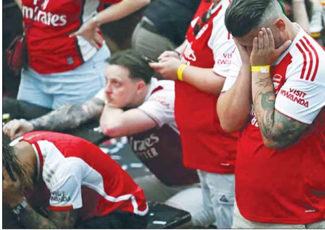
الحزن يخيم على جماهير الأرسنال بعد خسارة نهائي أبطال أوروبا

ووصفة عامة، يمتلك أرسنال لقبين قاريين فقط طوال تاريخه هما كأس المعارض بين المدن موسم 1969-1970 قبل إلغاءها، بالإضافة لكأس الكؤوس الأوروبية قبل 32 عاماً.