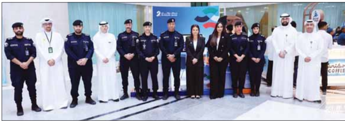
ممثلو بنك برقان ووزارة الداخلية في صورة جماعية خلال المبادرة