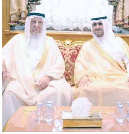
... وتهنئة من الشيخ أحمد علي يوسف