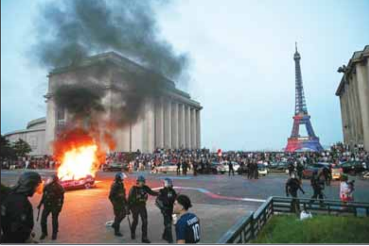
حرائق باريس بعد تحقيق اللقب القاري

تحولت احتفالات جماهير نادي باريس سان جيرمان بالفوز الثاني في تاريخ النادي بلقب دوري أبطال أوروبا إلى مشاهد من الفوضى وأعمال الشغب في عدد من شوارع العاصمة الفرنسية، بعدما شهدت باريس ليلة مضطربة تخللتها حرائق واشتباكات وأضرار طالت ممتلكات عامة وخاصة.