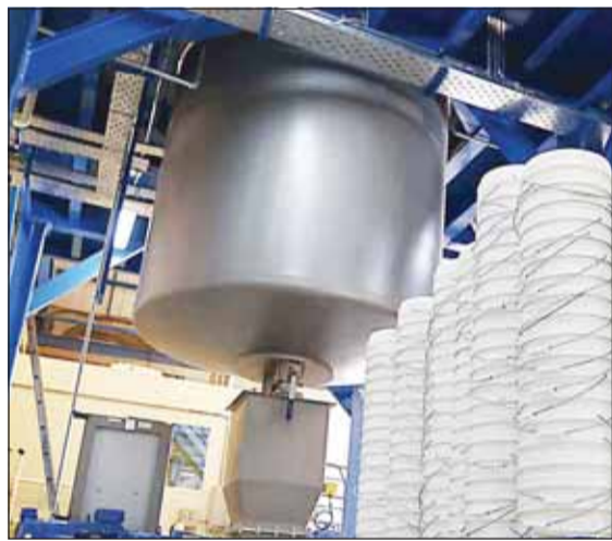
الصناعة أساس نهضة أي اقتصاد