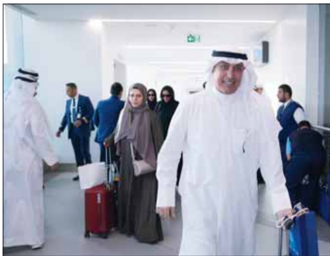
حمداً لله على السلامة

استقبلت شركة الخطوط الجوية الكويتية أول من أمس أولى رحلات وصول الحجاج من مطار الكويت الدولي (تي 4) حيث تضمنت رحلات العودة من جدة والطائف بالإضافة إلى المدينة المنورة. وقال الرئيس التنفيذي للشركة بالتكليف عبد الوهاب الشطي "إن استقبال حجاج بيت الله الحرام يأتي في إطار حرص الخطوط الكويتية على الاهتمام بتوفير كافة وسائل وسبل الراحة أثناء وصولهم، مبيناً أن الشركة تولي اهتماماً بالغاً بأن تكون الإجراءات سلسة ومرحبة وميسرة وبمبسطة وذلك بالتعاون والتنسيق مع كافة القطاعات المعنية في البلاد. وأضاف أن الناقل الوطني لخدمة الحجاج قامت بتقديم خدمات المناولة الأرضية في مبنى (تي 4) للحجاج المسافرين على الخطوط الجوية العربية السعودية وشركة طيران ناس في المغادرة والوصول وتسهيل إجراءات السفر لهم. وأكد الشطي أن الشركة تقوم بتشكيل لجنة دائمة خاصة بالحج والعمرة سنوياً مكونة من أهم قطاعات الشركة، مشيراً إلى أن اللجنة تعمل على متابعة التنظيم لرحلات الحج والعمرة بشكل دائم طوال العام وذلك للعمل على تقديم أفضل تجربة لخدمة الحجاج المسافرين على متن طائرات الخطوط الجوية الكويتية. وذكر أن نجاح موسم الحج هذا العام أتى بعد تخطيط ودراسة متأنية ومتكاملة العناصر لتقديم أفضل الخدمات المتميزة لعملاء الشركة وذلك بالتعاون والتنسيق مع كافة الشركات والممات المتخصصة بالحج والعمرة المشاركة في موسم الحج. وأكد على مواصلة الشركة جهودها في تقديم أفضل الخدمات للحجاج سواء في إنهاء إجراءات السفر أو على متن الطائرة معرباً عن خالص شكره لكافة حملات الحج التي وضعت ثقها في الناقل الوطني لدولة الكويت".