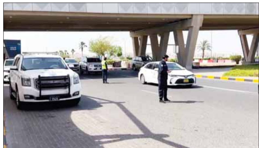
انتشار أمني منظم