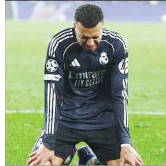
سان جيرمان تفوق أوروبا بعد رحيل مباني

لم يكن أكثر مشجعي باريس سان جيرمان تفاؤلاً بتوقع أن يهيمن فريقه على بطولة دوري أبطال أوروبا موسمين متتاليين بعدما رحل نجمه السابق كيليان مباني إلى ريال مدريد صيف 2024، واليوم ييمت الأخير عن أول بطولة مع فريقه الإسباني بينما يحتفل زملاؤه السابقون بالكؤوس وإحدى تلو الأخرى. وتوترت الأجواء بين مباني وإدارة باريس سان جيرمان في موسمه الأخير بعدما رفض تمديد عقده رغبة بالرحيل إلى ريال مدريد لاعب حر وهو ما حدث في يونيو 2024.