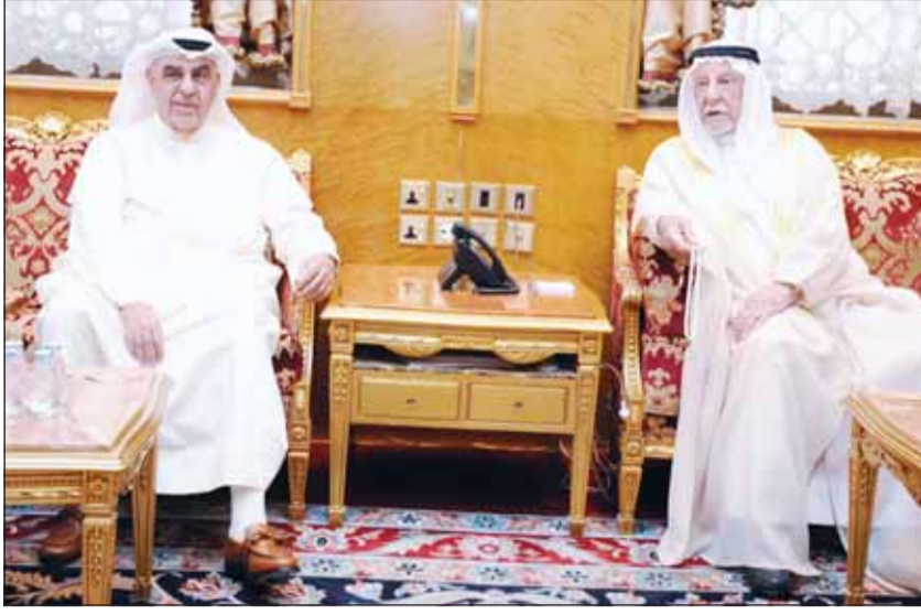
الشيخ جابر الفيصل والغانم