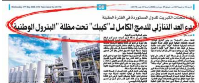
خبر "السياسة" المنشور في 27 مايو 2026

تأكيداً لما نشرته "السياسة" تحت عنوان، "بدء العد التنازلي للدمج الكامل لـ"كيبك" تحت مظلة "البتترول الوطنية" بتاريخ 27 مايو 2026، أعلنت "البتترول الوطنية" أمس في الجريدة الرسمية "الكويت اليوم" عن حل الشركة الكويتية للصناعات البترولية المتكاملة واندماجها مع شركة البترول الوطنية الكويتية بطريق الضم تنفيذاً لقرار المجلس الأعلى للبتترول الصادر في اجتماعه في 29 ابريل الماضي المتعلق باندماج الشركتين اندماجاً بطريق الضم "إلحاق/حل" الشركة الدامجة محلها قانوناً في كافة حقوقها والتزاماتها وما يتربط على هذا الاندماج من آثار. ثانياً، تفويض وزير النفط - رئيس مجلس إدارة مؤسسة البترول الكويتية بتحديد