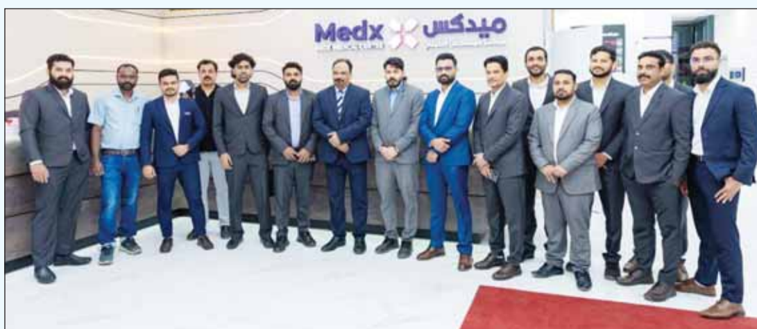
صورة جماعية لفريق الشركة