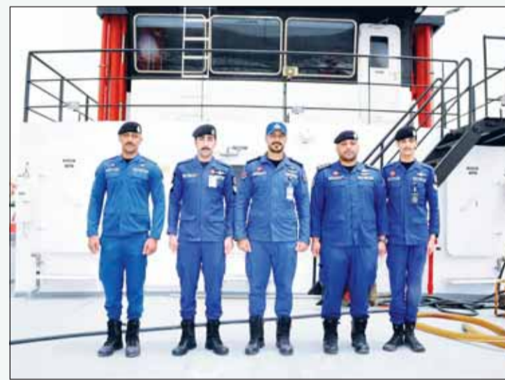
رجال الإطفاء والإنقاذ البحري... جاهزة تأمناً على مدار الساعة

وأوضح أن فرق الإنقاذ البحري تمتلك وسائل ومعدات حديثة تشمل الزوارق السريعة وأجهزة الإنقاذ المتطورة، ما يساهم في تنفيذ المهام بكفاءة عالية وسرعة استجابة كبيرة، مؤكداً أن عمليات الإنقاذ البحري تلعب دوراً مهماً في الحد من حالات الغرق والحوادث البحرية من خلال سرعة التدخل ونشر التوعية وتعزيز إجراءات السلامة البحرية، إلى جانب أعمال المراقبة والمتابعة المستمرة في مختلف المواقع البحرية.