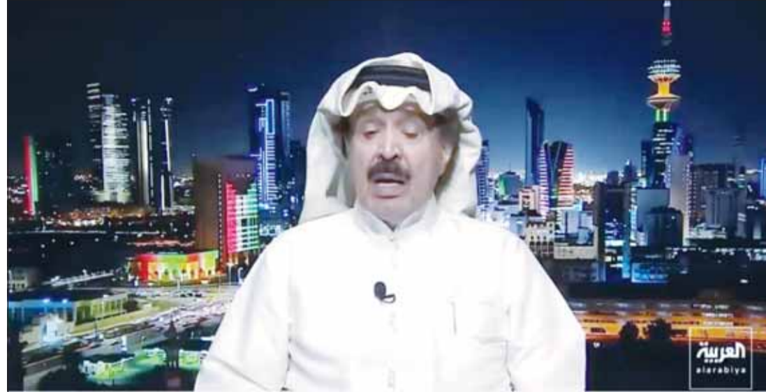
العميد أحمد الجارالله خلال حديثه لبرنامج "العربية"

وإذ أكد العميد أنه كان يرفض الدعوات التي تطالبه بعدم انتقاد النظام الإيراني، وقال، "فلأنني كنت أدرك جيداً مخططات النظام"