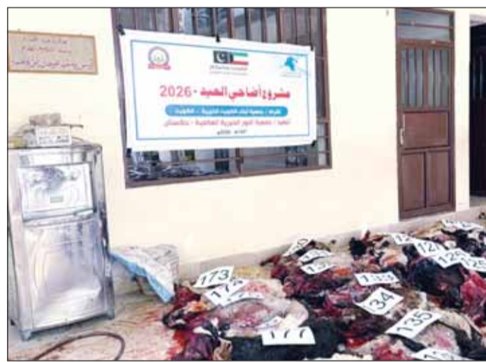
جانب من الحصص جاهزة للتوزيع