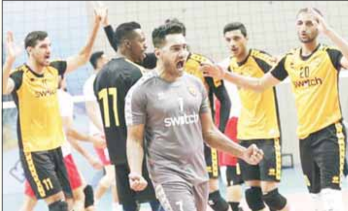
دشتي مع القادسية بقاء سابق