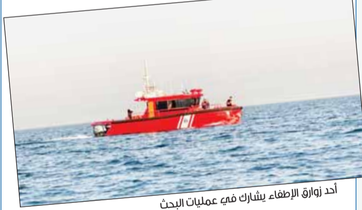
أحد زوارق الإطفاء يشارك في عمليات البحث

كشف رئيس القسم (ج) بمركز السالمية للإطفاء والإنقاذ البحري أن المخالفات البحرية تقع ضمن اختصاص خفر السواحل، الذي يعمل بشكل ميداني مع فرق الإنقاذ البحري، مشيراً إلى أن بعض المخالفات تتعلق بعدم الالتزام بإجراءات السلامة أو عدم تشغيل الأنوار الملاحية في القطع البحرية.