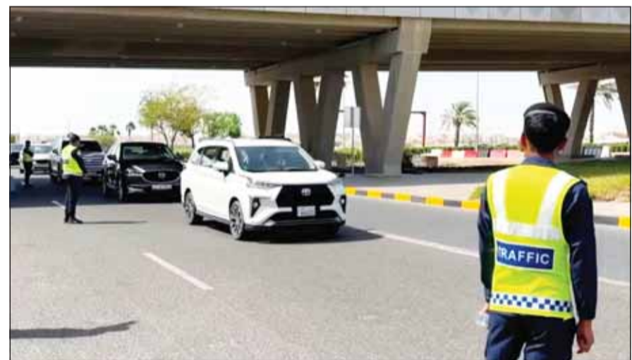
تواجد رجال الأمن والسيابية في حركة السير