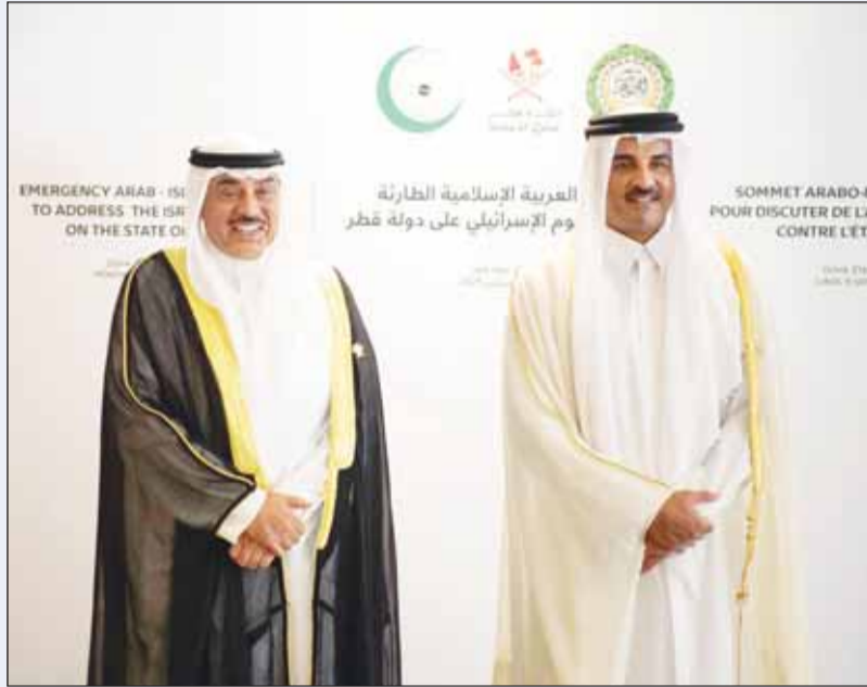
أمير قطر الشيخ تميم بن حمد آل ثاني وسمو ولي العهد في قمة الدوحة