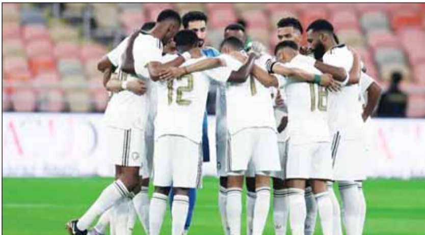
الأخضر السعودي جاهز لكأس العالم

أعلن اليوناني جورجوس دونيس، المدير الفني لمنتخب السعودية، القائمة النهائية للفريق التي ستشارك في كأس العالم 2026 لكرة القدم.