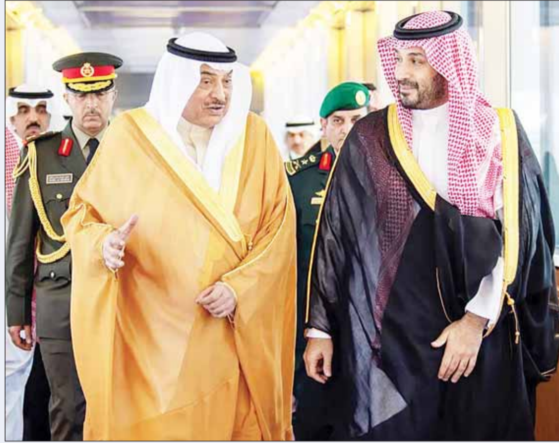
ولي العهد وفي استقباله ولي العهد السعودي الأمير محمد بن سلمان في جدة

في 28 مايو 2026، أول أيام عيد الأضحى المبارك، أدى سمو ولي العهد الشيخ صباح الخالد صلاة العيد في مسجد الدولة الكبير، بحضور كبار الشيوخ والمسؤولين وعدد من السفراء والديبلوماسيين. وفي وقت لاحق زار سموه قياديي ومنتسبي السلك العسكري والأمني، ناقلاً إليهم تهاني سمو أمير البلاد بالعيد، ومشيداً بجهودهم وتضحياتهم في حماية الوطن وصون أمنه واستقراره، وبمستوى الجاهزية والكفاءة والانضباط الذي أبداه منتسبو السلك العسكري والأمني.