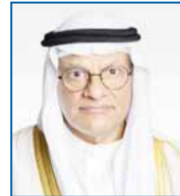
د. نادر الجلال

نجدد لسموه العهد في الدفاع والمحافظة على أمن واستقرار البلاد