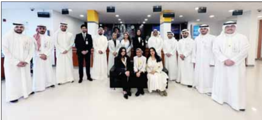
معرفة متوسطة فريق عمل فرع الشويخ بحضور بعض المسؤولين في البنك

جهير معرفي: نواصل تزويد موظفي الفروع بالأدوات اللازمة للإبداع في خدمة العملاء