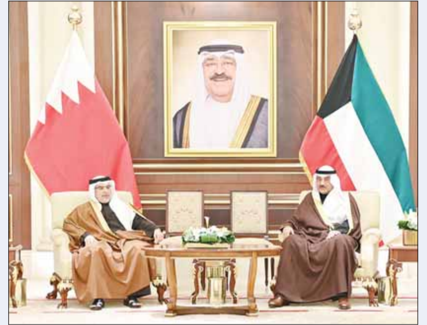
سمو ولي العهد الشيخ صباح الخالد وولي عهد البحرين رئيس مجلس الوزراء الأمير سلمان آل خليفة