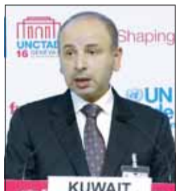
السفير ناصر الهين

جاء ذلك في تصريح ادلى به السفير الهين بمناسبة انطلاق أعمال الدورة الـ114 لهوتمر العمل الدولي في مدينة (جنيف) السويسرية ومشاركة الكويت بوفد رفيع المستوى برئاسته. ودعا في هذا الصدد مجلس