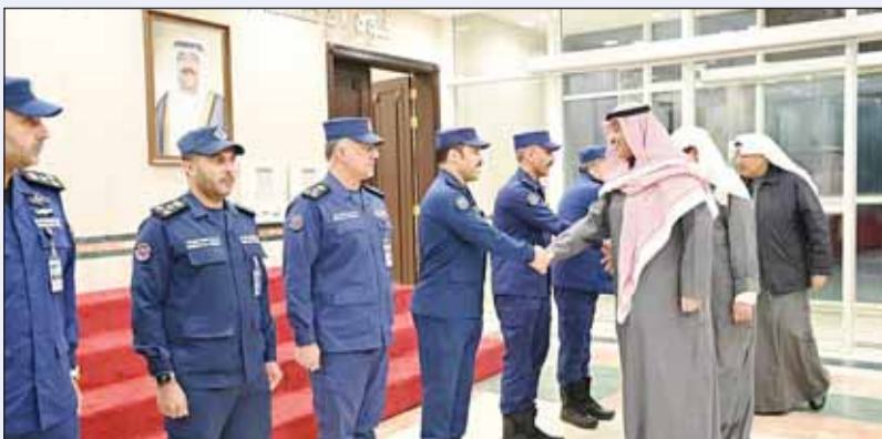
سموه خلال زيارته قوة الإطفاء العام