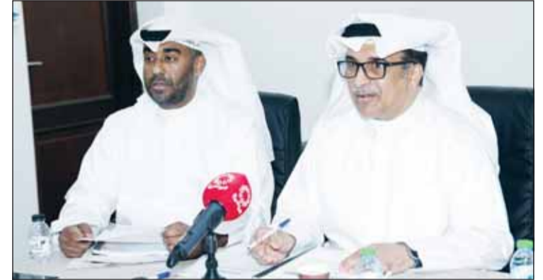
المرعي والنمش خلال عمومية الطائرة