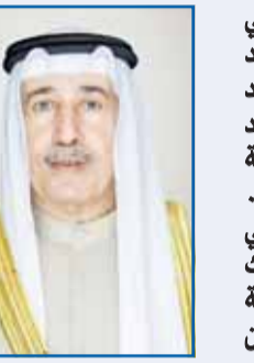
الشيخ مبارك الحمد

هنا رئيس الحرس الوطني الشيخ مبارك الحمد الصباح سمو ولي العهد الشيخ صباح الخالد بمناسبة الذكرى الثانية لتولي سموه ولاية العهد. وقال الحرس الوطني - في بيان - إن الشيخ مبارك الحمد هنا بالأصالة عن نفسه ونيابة عن منتسبي الحرس الوطني قادة وقوات سمو ولي العهد بمناسبة الذكرى الثانية على تولي سموه ولاية العهد.