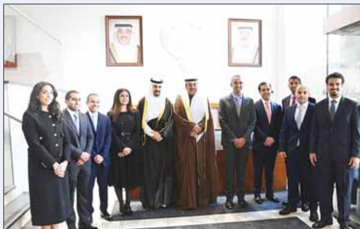
سموه متوسلاً مسؤولي وموظفي مكتب الاستئثار

وفي 13 يناير 2026، استقبل سموه وزير الداخلية البحريني الفريق أول الركن الشيخ راشد