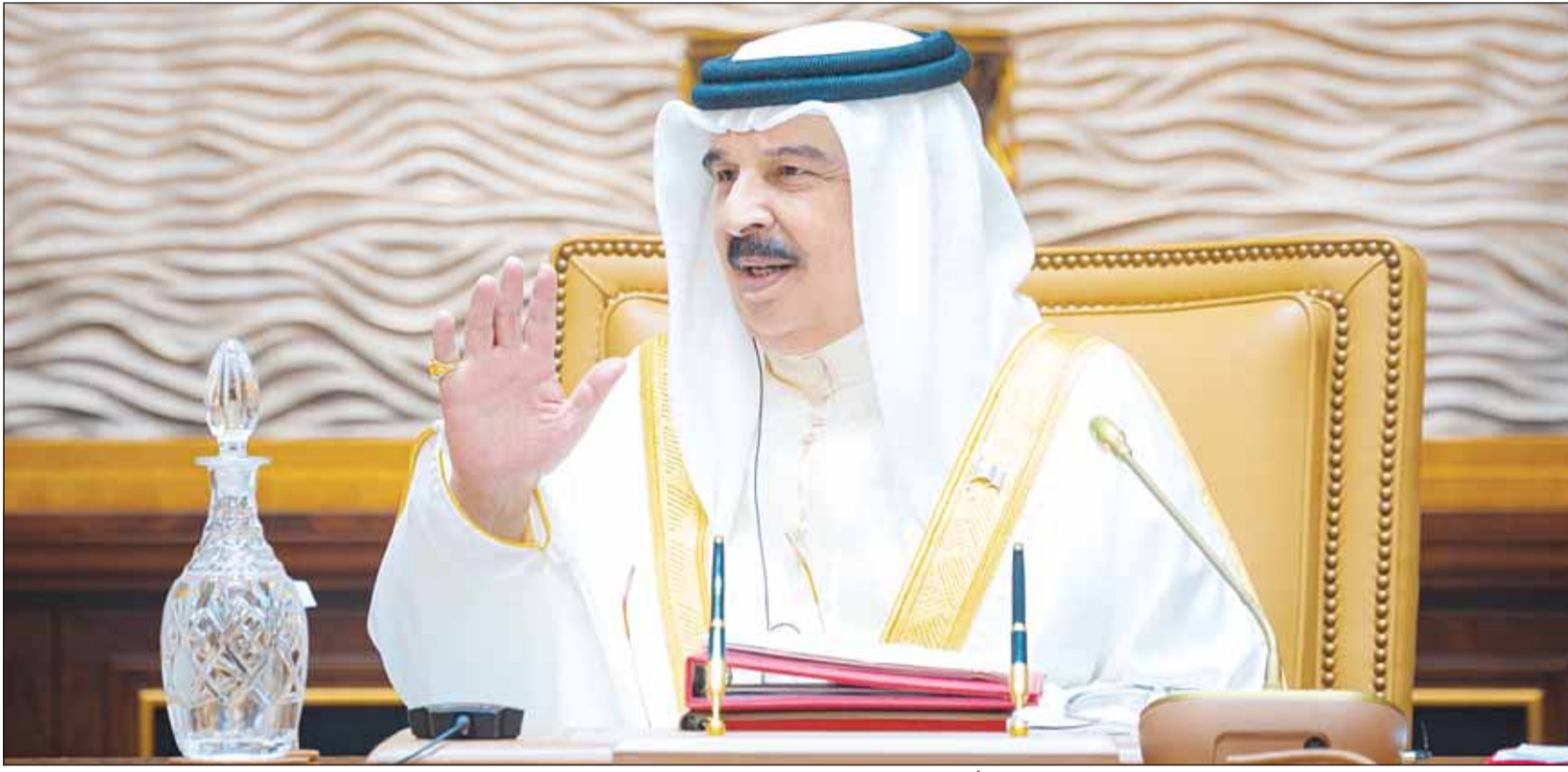
العاهل البحريني الملك حمد بن عيسى مترسلاً اجتماع مجلس الوزراء البحريني، أمس

النيابة العامة تأمر بحبس المتهمين بخلية "الحرس الثوري" الإرهابية وكشف سرية حساباتهم المصرفية وتضبط مصنفات تروج لفكر "ولاية الفقيه"