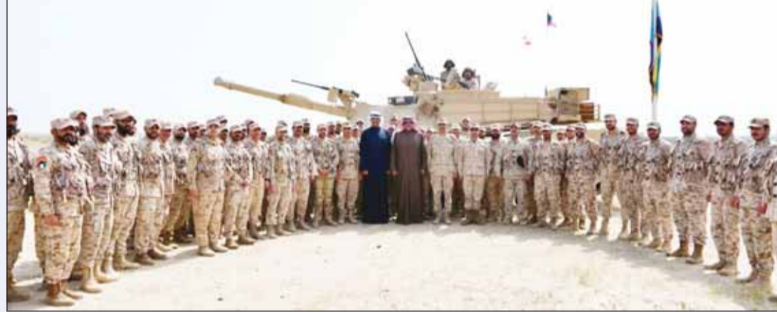
سمو ولي العهد يتوسط ضباط وأفراد أحد المواقع العسكرية