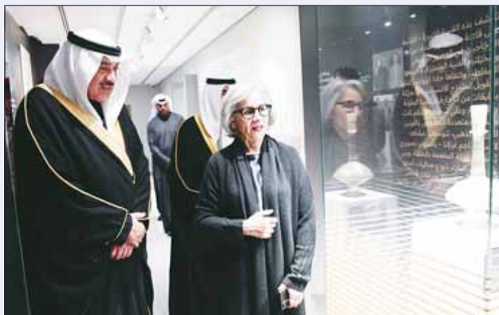
سموه يطلع على بعض المقترحات الأثرية بحضور الشبيخة حصة الصباح

في 25 فبراير 2026، اصطحب سمو أمير البلاد الشيخ مشعل أحمد سمو ولي العهد الشيخ صباح الخالد وسمو رئيس مجلس الوزراء الشيخ أحمد عبدالله في زيارة إلى وزارة الدفاع، حيث أشاد سمو الأمير بجاهزية القوات المسلحة وجهود تطوير المنظومة الدفاعية، مؤكداً دعم تمكين المرأة في المؤسسة العسكرية، وتوسيع الشراكات الدفاعية الخليجية والعربية، بما يعزز أمن الوطن واستقراره. وعرضت خلال الزيارة خطط تطوير الجيش الكويتي ورفع جاهزيته القتالية، إضافة إلى افتتاح "مصنع نايف للدخائر الخفيفة"، وإنشاء "مديرية تجميع وتصنيع المسيرات الميدانية"، واستحداث "فرع الذكاء الاصطناعي" ضمن تشكيلات الجيش الكويتي، ثم الإعلان عن تخريج دفعة أولى من العنصر النسائي برتبة ملازم، خلال أبريل 2026.