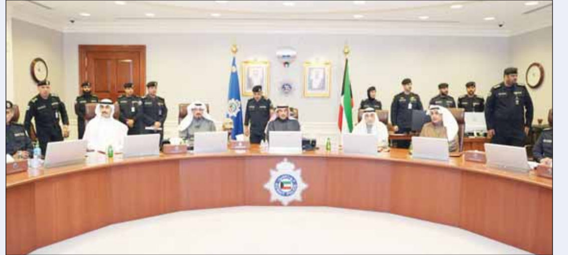
سموه خلال زيارته وزارة الدفاع