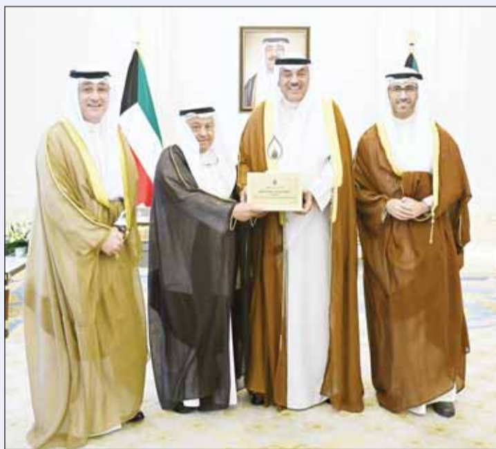
ومستقبلاً وزير النفط ونائب الرئيس التنفيذي لمؤسسة البترول والرئيس التنفيذي لنفط الكويت

بن عبدالله آل خليفة، الذي نقل إلى سموه تحيات ملك البحرين وولي عهده، ومقله سموه تحياته وتمنياته بالسلام والازدهار لمملكة البحرين قيادة وشعباً. ثم استقبل سموه نائب رئيس مجلس الوزراء وزير خارجية دولة الإمارات الشيخ عبدالله بن زايد آل نهيان، حيث تم التأكيد على عمق العلاقات الأخوية بين البلدين الشقيقين.