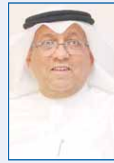
المستشار د. عادل بورسلي

هنا رئيس المجلس الأعلى للقضاء ورئيس محكمة التمييز المستشار الدكتور عادل بورسلي، أمس، سمو ولي العهد الشيخ صباح الخالد بمناسبة حلول الذكرى الثانية لتولي سموه ولاية العهد في البلاد. وقال المستشار د. بورسلي في بيان له "بالأصالة عن نفسي ونيابة عن أعضاء المجلس الأعلى للقضاء