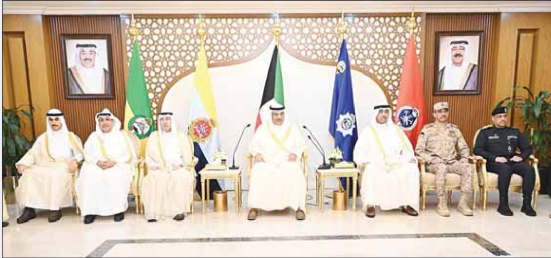
سمو ولي العهد الشيخ صباح الخالد زار أول أيام عيد الأضحى إخوانه وأبناءه من قياديي ومنتسبي السلك العسكري والأمني

وفي اليوم نفسه، أجرى سموه اتصالات مع ولي العهد السعودي الأمير محمد بن سلمان، ونائب رئيس دولة الإمارات الشيخ منصور بن زايد، ونائب أمير قطر الشيخ عبدالله بن حمد، وولي عهد البحرين الأمير سلمان بن حمد، جرى خلالها تأكيد أهمية الحفاظ على الأمن الخليجي المشترك وتعزيز التنسيق بين دول مجلس التعاون لمواجهة التحديات الإقليمية المستجدة. كما تلقى سموه اتصالاً من ملك بلجيكا فيليب، أكد خلاله دعم بلاده للكويت وإدانتها الاعتداءات التي استهدفت أراضيها.