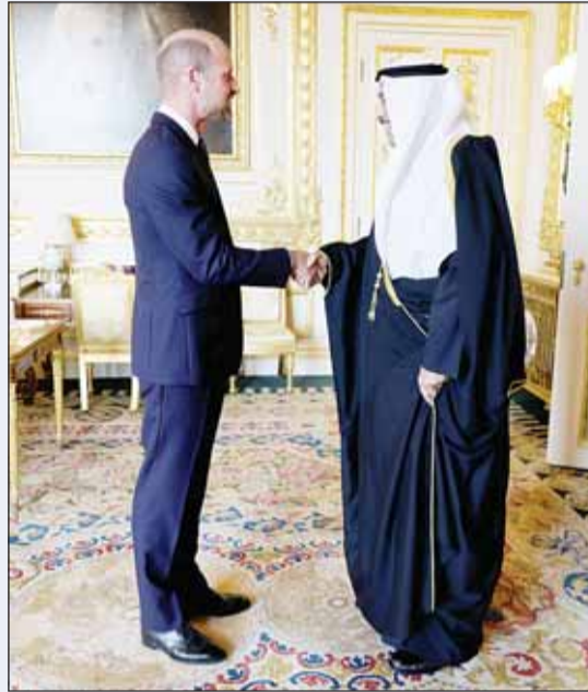
ولي العهد يلتقي ولي عهد المملكة المتحدة الأمير ويليام