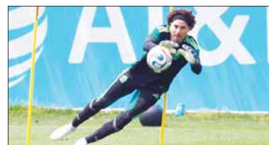
الحارس المكسيكي غيرمو أوتشوا

المولود في إسبانيا ألفارو فيدالغو والمهاجم المولود في كولومبيا جوليان كينونيس، وهما لاعبان منجسان أصبحا من اللاعبين الأساسيين في تشكيلة المنتخب الوطني.