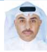
الشيخ م. فهد داود الصباح