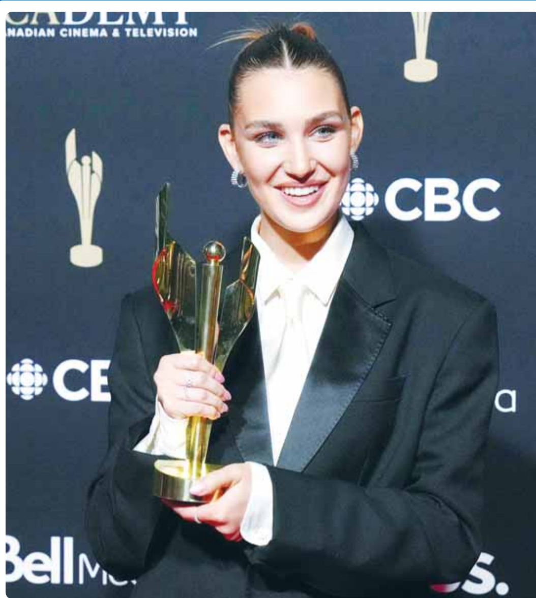
الممثلة الكندية صوفيه نيليس تعرض جازتها بعد فوزها بجائزة "راديو س" في تورنتو

إن هذا الانعاش الاقتصادي، له مفاعيل اجتماعية، وكذلك يعمل على تخفيف الضغط السياسي بين الدول، ولهذا فإن الواجب حالياً على العالم أن يتجه إلى تفعيل القوة الناعمة هذه، على غيرها من القوى الأخرى التي سببت الكثير من الضحايا منذ بداية القرن العشرين إلى يومنا هذا.