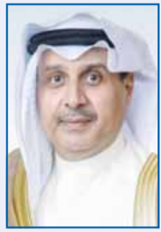
الشيخ حمد جابر العلي

بمناسبة الذكرى الثانية لتولي سمو ولي العهد الشيخ صباح الخالد ولاية العهد، أعرب وزير شؤون الديوان الأميري الشيخ حمد جابر العلي عن أسمى آيات التهاني وأصدق التبريكات إلى مقام سموه بهذه المناسبة العزيزة.