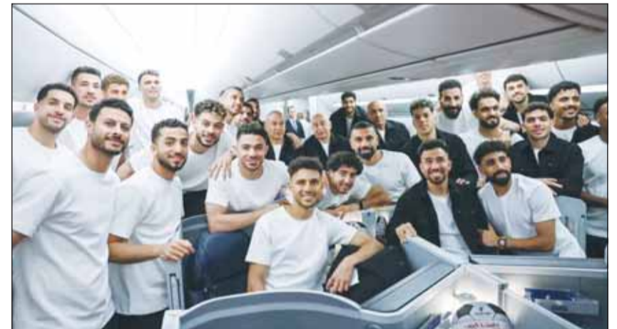
اتهامات بإهدار المال العام لبعثة الفراعنة

رد الاتحاد المصري لكرة القدم بشكل رسمي، على الجدل الذي ثار بشأن بعثة منتخب "الفراعنة" التي وصلت إلى الولايات المتحدة للمشاركة في كأس العالم. وكانت تقارير إعلامية أفادت بوجود أزمة، بسبب قرار سفر أفراد إضافيين في بعثة منتخب مصر إلى الولايات المتحدة.