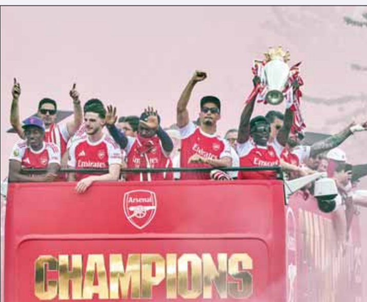
احتفالات المدفعية بلقب الدوري الإنكليزي

حاول أرسنال تجاوز خيبة خسارة نهائي دوري أبطال أوروبا بالاحتفال مع جماهيره بلقب الدوري الإنكليزي الممتاز، الذي أحرزه للمرة الأولى منذ عام 2004.