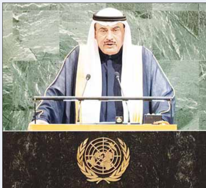
سموه يلقي كلمة الكويت في الدورة الـ80 للجمعية العامة للأمم المتحدة

فيليبو غراندي والوفد المرافق. وفي اليوم التالي 27 أكتوبر 2025، استقبل سموه عمدة مدينة ميامي الأميركية فرانسيس أكس سوزايز والوفد المرافق. وفي 02 نوفمبر 2025، استقبل سمو ولي العهد نائب رئيس جمهورية الصين الشعبية هان تشنغ، بمناسبة زيارته الرسمية للبلاد. وفي 10 نوفمبر 2025، استقبل سموه الأمين العام لمنظمة البلدان المصدرة للبترول (أوبك) هيثم الغيص. وفي 17 نوفمبر 2025، استقبل سموه بحضور سمو رئيس مجلس الوزراء الشيخ أحمد عبدالله، رئيس وزراء جمهورية فيتنام الاشتراكية قام مينه تشينه والوفد المرافق، بمناسبة زيارته الرسمية للبلاد.