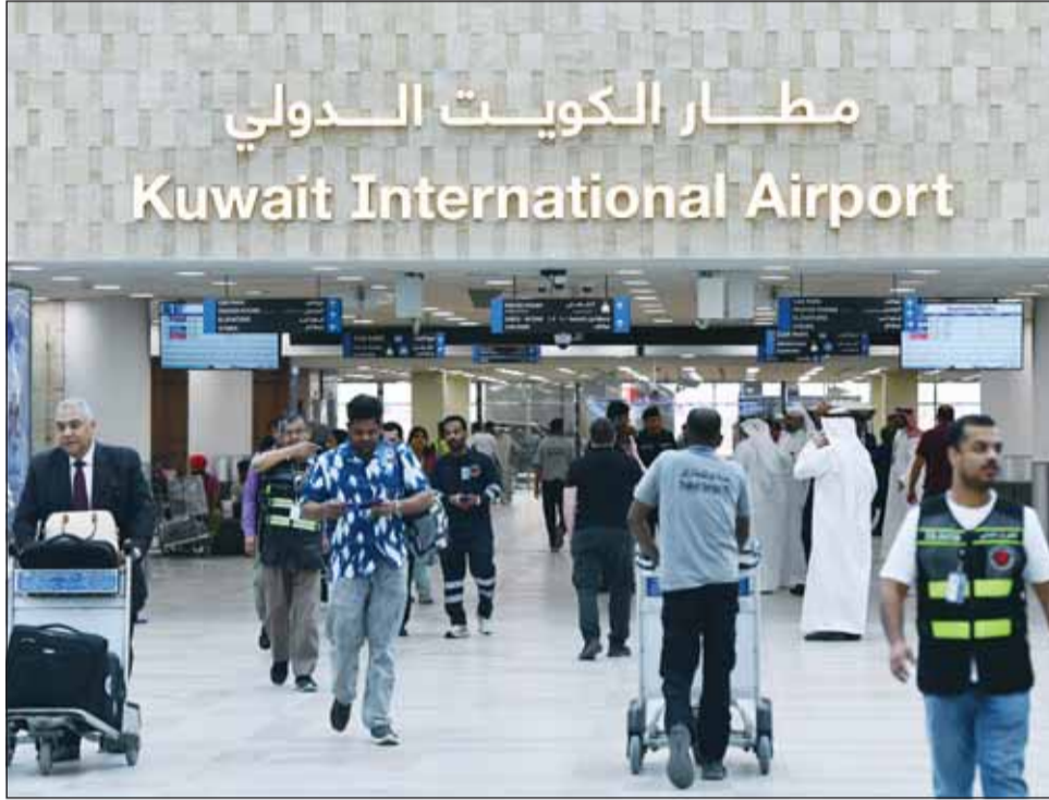
عودة حركة المسافرين

العتيبي: رحلة واحدة لكل شركة طيران ضمن خطة تشغيل تدريجية الحضور لمطار الكويت الدولي قبل موعد الرحلة بثلاث ساعات على الأقل إغلاق كاؤنترات تسجيل الدخول قبل الإقلاع بساعة للمسافرين إلى دول "الخليجي" والعربية