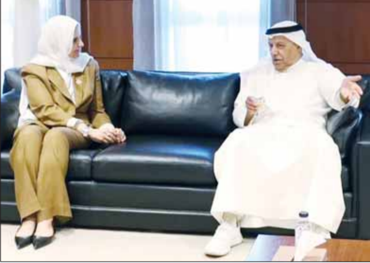
وزيرة الدولة لشؤون التنمية والاستدامة دريم الفليج مستقبلة رئيس مجلس إدارة اتحاد الصناعات الكويتية حسين الخرافي