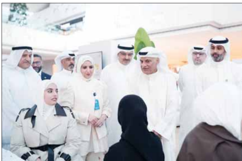
جولة في جناح حملة "وجهني"