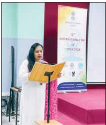
سفيرة الهند باراميتا تريباتي

إذ شاركت 177 دولة في رعاية القرار الذي اعتمد يوم 21 يونيو يوماً دولياً لليوغا، باعتباره رمزاً للتعاظم بين الإنسان والطبيعة.