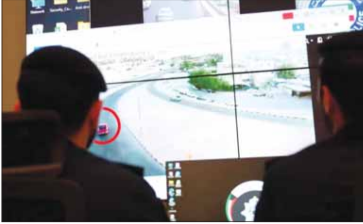
... وكاميرا أخرى ترصد خروجهم من إحدى المناطق السكنية