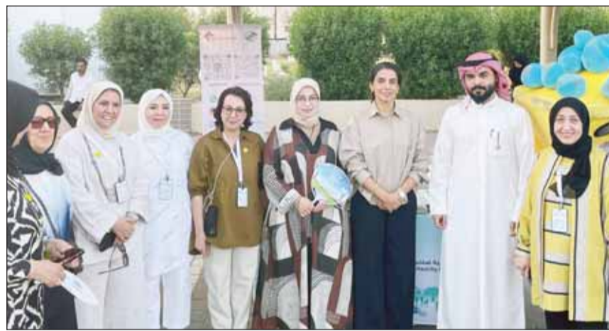
السفيرة التركية طوبى نور سونمز خلال مشاركتها في فعالية إعادة التدوير

ويعكس هذا التكريم التزام السفارة بالاستدامة ودورها الفعّال في تعزيز الوعي البيئي داخل السفارة وفي المجتمع.