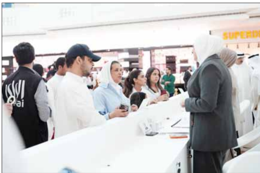
إقبال الطلبة على جناح حملة "وجهني"

ومن جانبه، أكد الرئيس التنفيذي لمجموعة بيت التمويل الكويتي، خالد يوسف الشميلان، أن المشاركة في حملة "وجهني" تنطلق من الدور الوطني للبنك والريادة في المسؤولية المجتمعية، معرباً عن فخره بالشراكة الاستراتيجية مع وزارة التعليم العالي ومؤكداً حرصه على ترسيخها وتطويرها باستمرار. وأضاف: "يهدف تعاوننا المشترك إلى دعم أبنائنا الطلبة وتزويدهم بالمعرفة والإرشاد اللازمين قبل رحلة الابتعاث، بما يعزز جاهزيتهم الأكاديمية ويساعدهم على رسم مساراتهم التعليمية بثقة ووعي". وأكد أن بيت التمويل الكويتي يولي أهمية كبيرة لدعم وتطوير العملية التعليمية في الكويت، انطلاقاً من التزامه بمساندة جهود الدولة ومؤسساتها عبر منظومة متكاملة من المبادرات والبرامج الاستراتيجية، مبيّناً أن هذا التوجه يستند إلى إيمان عميق أن التعليم يمثل استثماراً حقيقياً ومستداماً في مستقبل الكويت. وأشار الشميلان إلى أن الشراكة المثمرة مع الوزارة في حملة "وجهني" تمثل نموذجاً رائداً للتعاون البناء والتكامل الاستراتيجي بين القطاعين الحكومي والخاص، بما يسهم في تحقيق الأثر الإيجابي المنشود على صعيد تنمية رأس المال البشري. وشدد على حرص بيت التمويل الكويتي على تقديم الدعم الفاعل لكافة المبادرات والأنشطة التي تطلقها مؤسسات التعليم العالي في الكويت، بما في ذلك جامعة الكويت، والجامعات الخاصة، والهيئة العامة للتعليم التطبيقي والتدريب، إلى جانب المكاتب الثقافية الكويتية في الخارج، دعماً لمسيرة التعليم وتعزيزاً لفرص الطلبة في تحقيق طموحاتهم.