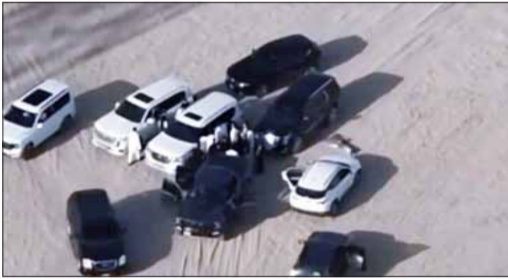
انتشار أمني كثيف لرجال المباحث في البر