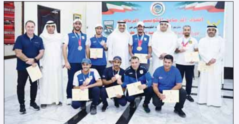
العتيبي مكرماً لرماة الكويت

أشاد رئيس اتحاد الرماية الكويتي المهندس دعيح العتيبي أول من أمس، بجهود الرامة الكويتيين الذين شاركوا وتألّفوا في دورة الألعاب الخليجية الأخيرة التي استضافتها العاصمة القطرية الدوحة محققين 10 ميداليات (أربع ذهبيتا ومثلثا فضيات وميداليتان برونزيتان). وقال العتيبي في تصريح صحفي عقب حفل أقامه اتحاد الرماية لتكريم أبطاله بعد النتائج المميزة إن رامة وراميات الكويت حققوا أفضل النتائج رغم قلة عدد الرامة وعدم أخذ الفرصة الكافية للتدريب والاستعداد الكافي للبطولة الخليجية.