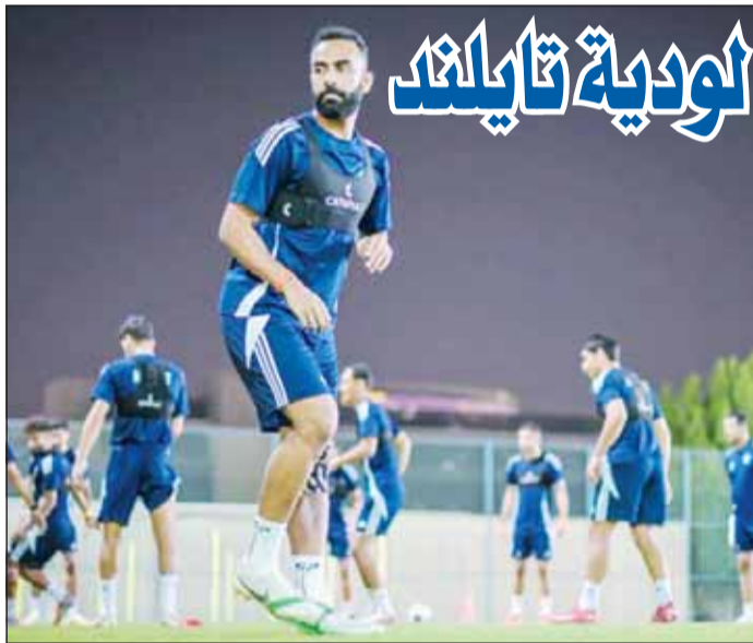
تدريب سابق لمنتخبنا الوطني الأول لكرة القدم

وأشار المصدر إلى أن إدارة النادي تبذل جهودا مكثفة لمعالجة الملفين في أسرع وقت ممكن، لما لهما من تأثير مباشر على جاهزية الفريق الفنية والإدارية، خاصة أن برقان يستعد لتمثيل الكويت في بطولة تضم نخبة الأندية الآسيوية الطامحة إلى المنافسة على اللقب والتأهل للاستحقاقات العالمية المقبلة، خاصة أن برقان