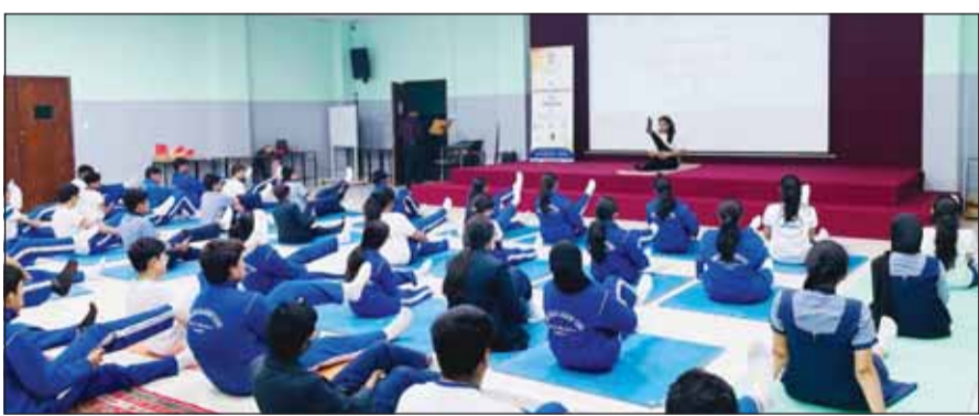
من استعدادات السفارة الهندية للاحتفال بيوم اليوغا

وأشارت السفارة إلى أن اليوم الدولي لليوغا انطلق بمبادرة قدمها رئيس الوزراء الهندي ناريندرا مودي أمام الجمعية العامة للأمم المتحدة في سبتمبر 2014، حيث لاقت تأييداً واسعاً من المجتمع الدولي،