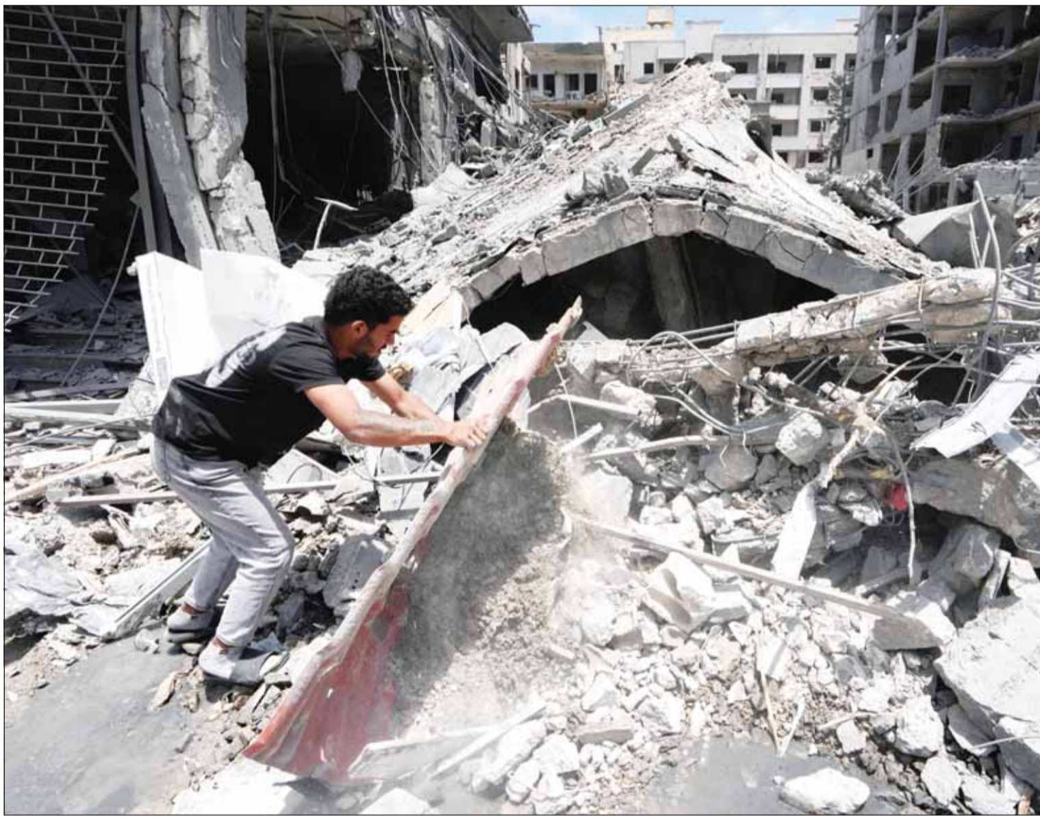
لبناني يبحث عن متعلقات أسرته بين أنقاض منزله الذي دمرته غارة إسرائيلية في مدينة صور الساحلية الجنوبية

ومواجهة التحديات المشتركة، مستعرضاً الجهود المصرية الرامية لخفض التصعيد ودعم مسار المحادثات بين الولايات المتحدة وإيران لإنهاء الأزمة الحالية وتجنب تداعياتها الاقتصادية والسياسية على المنطقة والعالم. وفي غضون ذلك، وفي خطوة تقرب دولة الاحتلال من انتخابات مبكرة وترخي ظلالاً من الغموض على مستقبل رئيس وزراء الاحتلال بنيامين نتنياهو، أقر الكنيست الإسرائيلي مشروع قانون حله بالقرارة الأولى، بتأييد 106 أعضاء من أصل 120 من دون أي معارضة، على أن يعود إلى لجنة الكنيست قبل طرحه للتصويت في القراءتين الثانية والثالثة.