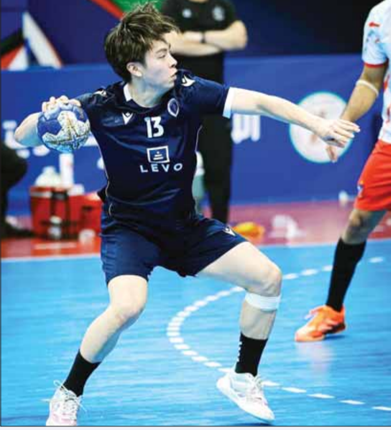
ياسوهيرا أود نجوم برقان في آسياوية