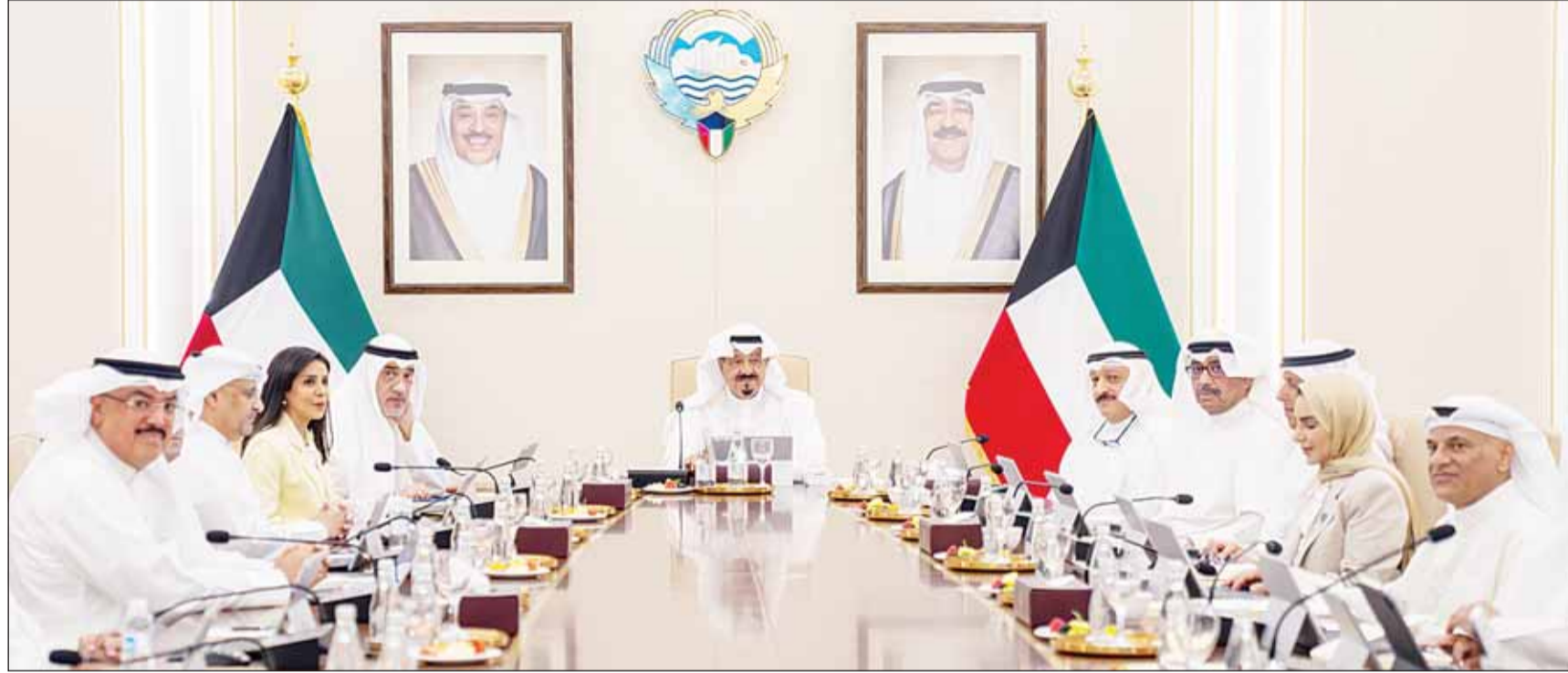
سمو رئيس مجلس الوزراء الشيخ أحمد العبدالله مترئسا الاجتماع

عقد مجلس الوزراء اجتماعاً، أمس، برئاسة سمو رئيس مجلس الوزراء الشيخ أحمد العبدالله، وبعد الاجتماع، قال وزير الدولة لشؤون الاتصالات وتكنولوجيا المعلومات وزير الإعلام والثقافة بالوكالة عمر العمر، "أحيط مجلس الوزراء علماً في مستهل اجتماعه بخفوى الرسالة الخطية التي تلقاها سمو أمير البلاد الشيخ مشعل الأحمد من طارق رحمن رئيس وزراء جمهورية بنغلاديش الشعبية الصديقة تتصل بالعلاقات الثنائية الوثيقة التي تربط البلدين الصديقين وأطر تعزيزها وتنميتها إضافة إلى آخر التطورات على الساحتين الإقليمية والدولية إلى جانب تبادل وجهات النظر حول القضايا ذات الاهتمام المشترك.