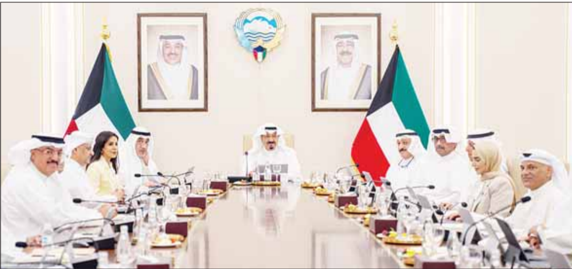
سمو رئيس مجلس الوزراء الشيخ أحمد العبدالله مترئساً الاجتماع

اعتماد مشروع مرسوم بتعديل قانون إنشاء مؤسسة البترول ورفع سمو الأمير المسيرة المباركة لسمو ولي العهد تبرز وفاء وعطاء وتفاني سموه