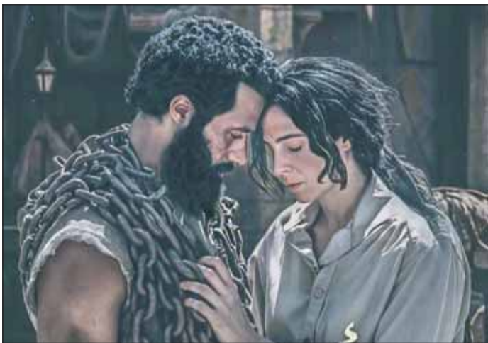
محمد رمضان في "أسد"

وأكد رمضان أن إشادة تركي آل الشيخ تمثل شهادة مهمة يعجز بها هو وجميع صناع الفيلم، مشيراً إلى تطلعه للتعاونات المقبلة بينهما خلال الفترة القادمة. كما حرص الفنان المصري على توجيه التهنئة لفريق عمل فيلم 7DOGS، في رسالة حملت دلالات واضحة على طبيعة العلاقة بين الطرفين، خاصة بعد الشائعات التي انتشرت خلال الفترة الماضية حول وجود منافسة أو خلافات مرتبطة بمشروعات الإنتاج الكبرى.