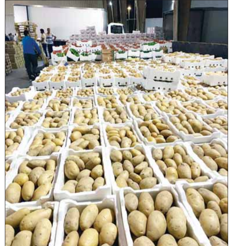
البطاطا من إنتاج مزارع الوفرة

المحافظة على الخبرات الوطنية المتراكمة وتشجيع استمرار المزارع المنتجة التي أتجعت نجاحها على مدى سنوات طويلة، بما يعزز قدرة الكويت على تحقيق أهدافها في مجال الأمن الغذائي والاستدامة. ومن هذا المنطلق، يأمل المزارعون من الوزارة ريم الفليح زيارة المزارع الكويتية والاطلاع ميدانياً على ما تحقق فيها من إنجازات وتجارب ناجحة، والاستماع مباشرة إلى أصحابها والعاملين فيها، بما يسهم في بناء رؤية متكاملة تدعم هذا القطاع الحيوي وتواكب توجهات الدولة نحو تعزيز الاستدامة وتنمية الموارد الوطنية. فالزراعة لم تعد مجرد نشاط اقتصادي، بل أصبحت جزءاً أساسياً من منظومة الأمن الغذائي، الأمر الذي يجعل دعم المزارعين والمحافظة على استمرار إنتاج المزارع استثماراً وطنياً في مستقبل الكويت وأمنها الغذائي.