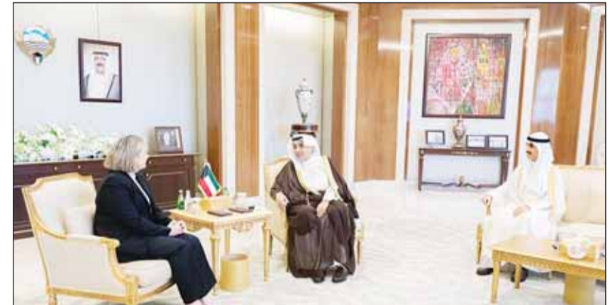
الشيخ حمد جابر العلي والشيخ ثامر الجابر يستقبلان سفيرة أستراليا ميليسا كيليه

كما جرى بحث آخر المستجدات على السامتين الإقليمية والدولية وتطورات الأوضاع التي تشهدها المنطقة والتأكيد على مواصلة التنسيق ودعم الجهود الهادفة إلى تعزيز الأمن والاستقرار في المنطقة. وأشاد بالجهود الطيبة التي بذلتها السفارة طوال فترة عملها لدى البلاد وبإسهاماتها في دعم العلاقات بين البلدين الصديقين متمنيين لها دوام التوفيق والنجاح في مهامها المستقبلية.