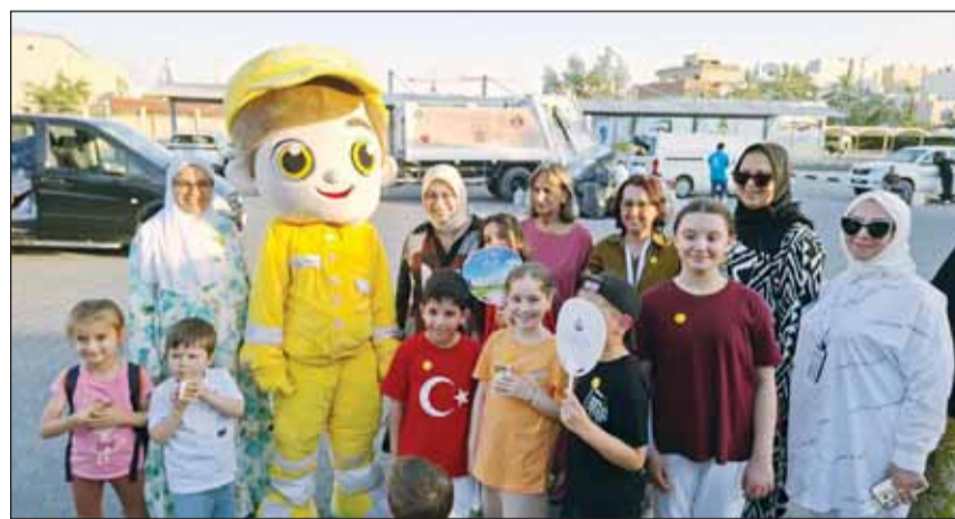
السفيرة سونمز مع المشاركين في مشروع صفر نفايات