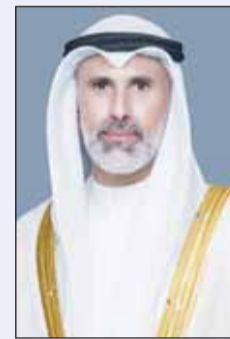
الشيخ جابر الصباح

وقالت "الخارجية" - في بيان صحافي - إن الاجتماع الذي عقد عبر تقنية الاتصال المرئي والمسموع برئاسة الأمين العام للمجلس الأعلى للتخطيط والتنمية بالتكليف أحمد الجناحيه ومشاركة أعضاء لجنة المرأة والأعمال - استهدف بحث ومناقشة آخر مستجدات ملف مؤشر المرأة وأنشطة الأعمال الصادر عن البنك الدولي واستعراض الخطوات التي تتخذها الكويت لتعزيز بيئة الأعمال والتمكين الاقتصادي للمرأة بما يتوافق مع المعايير الدولية والخطط التنموية الوطنية. وأضافت، إن اللقاء شهد تبادل الروى والأفكار بين ممثلي الجهات الأعضاء في اللجنة الوطنية وخبراء البنك الدولي حول سبل تطوير التشريعات والسياسات الداعمة للمرأة في قطاع الأعمال والوقوف على أبرز المؤشرات التي تعكس تقدم دولة الكويت في هذا المجال فضلا عن تعزيز آليات التنسيق المشترك لمتابعة متطلبات المؤشر العالمي في المرحلة المقبلة. وذكرت أنه في ختام الاجتماع أكد المشاركون أهمية استمرار التنسيق والتعاون المشترك بين الجهات الحكومية ومجموعة البنك الدولي ومواصلة عقد هذه اللقاءات الدورية لمتابعة وتطوير السياسات والتشريعات بما يضمن تعزيز مكانة الكويت في المؤشرات والتقارير الدولية ذات الصلة بحقوق الإنسان والتمكين الاقتصادي للمرأة.