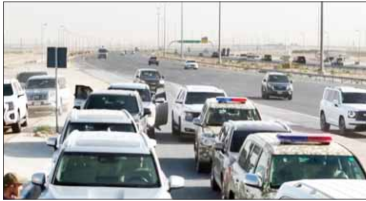
حركة الطرق تحت مجهر الأجهزة الأمنية