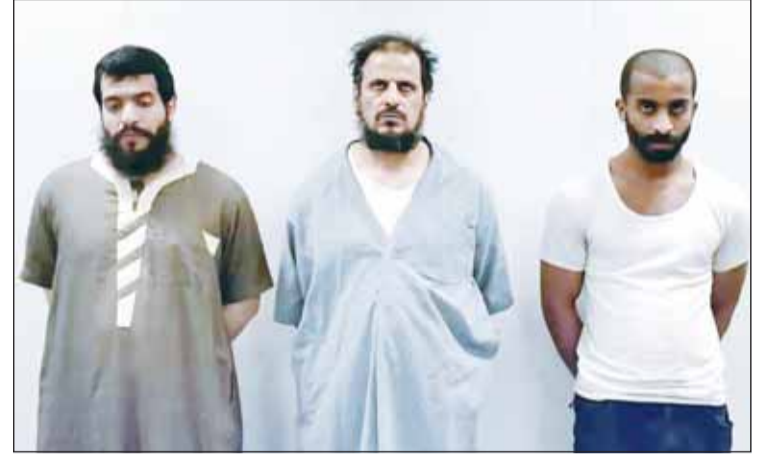
السجناء الهاربون عقب ضبطهم