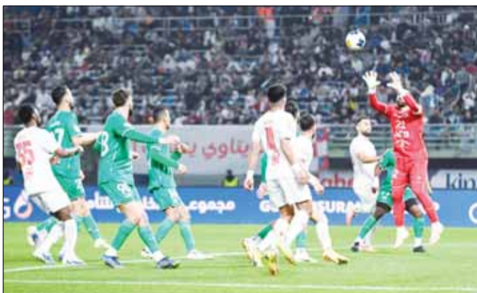
شهران بين ختام الموسم الماضي وبداية الموسم الجديد

ومن المقرر أن تُعقد منافسات القسم الثاني من الدوري يوم 13 يونيو الجاري بالجولة الثامنة عشرة، لتبدأ بعدها مباشرة مرحلة مجموعة البطولة في 16 يونيو، والتي تقام جولاتها في 19 و22 و25 يونيو، على أن تُعقد في 29 من الشهر ذاته.