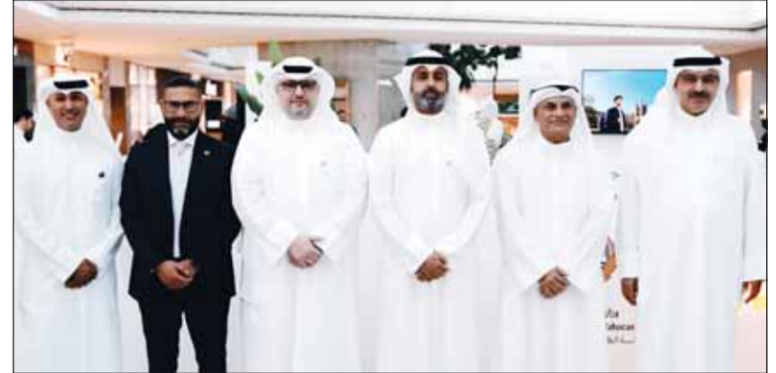
قيادات وزارة التعليم العالمي وبيت التمويل الكويتي