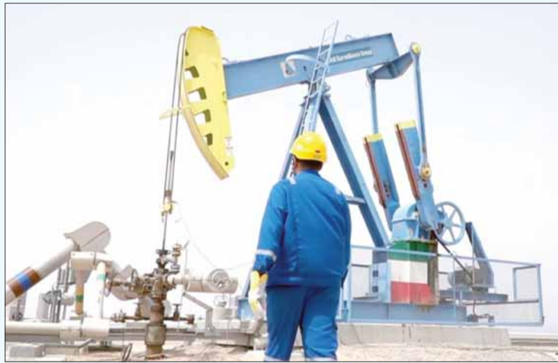
نفط الخليج "قريباً تحت غطاء" نفط الكويت"

بعد إتمام عملية دمج أصول الشركة الكويتية للصناعات البترولية المتكاملة "كيبك" ونقل مصنعي غاز "الشعبية وأم العيش" تحت كيان "البتترول الوطنية"، كشفت مصادر لـ "السياسة" أن عملية الدمج الثالثة التي سيعمل عليها خلال الأشهر القادمة ستكون دمج ونقل أصول الشركة الكويتية لقطاع الخليج تحت كيان ومظلة عملاق النفط العالمي الكويتي "نفط الكويت"، موضحة في الوقت ذاته أن ملف الدمج بينهما تتم دراسته بدقة تفصيلية هادئة مشيرة إلى أن اكتمال أعمال دمج "كيبك" لـ "البتترول الوطنية" فتح الباب لتحريك ملف نقل أسهم نقل أسهم الشركة الكويتية لقطاع الخليج لشركة نفط الكويت بصورة أسرع عن ذي قبل، لاسيما أن عمليات دمج الشركات النفطية ضمن استراتيجية المجموعة المؤسسة 2040. وذكرت المصادر أن من فوائد دمج الشركات النفطية التابعة لـ "مؤسسة البترول" تعظيم أرباحها من خلال الترشيد عن طريق دمج الوظائف والقيادات التنفيذية الوسطى، فضلاً عن أن هذا الدمج يسهم في رفع كفاءة العمليات التشغيلية ويقضي على الروتين ويسهم بزيادة التقدم التكنولوجي. وذكرت أن وجود شركة واحدة ممثلة في "نفط الكويت" تقوم بأعمال التنقيب والاستكشافات النفطية والغاز داخل الكويت أو في المنطقة المقسومة بين الكويت والسعودية أصبح أمراً ضرورياً لاسيما وأن "نفط الكويت" ذات سمعة عالمية في