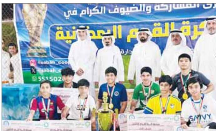
الجمعية متوجاً بـ بنك وربة بلقب البطولة

حقق فريق بنك وربة، لقب بطولة جمعية صباح الأحمد الراضانية في نسختها الخامسة، والتي أسدل الستار عنها أول من أمس، بعد توقف النشاط الرياضي في البلاد إثر الاعتداءات الآتمة على الكويت، وتمكن فريق بنك وربة من الفوز بلقب البطولة للكبار، بعد تغلبه في المباراة النهائية على فريق "الميرنجي"، كما حصد فريق "شباب صباح الأحمد" لقب بطولة الناشئين بعد فوزه على فريق "الكويت".