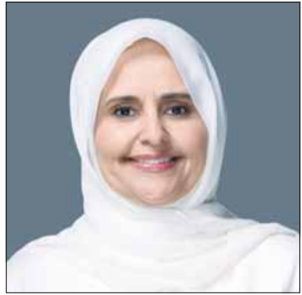
الوزيرة د.ريم الفليح