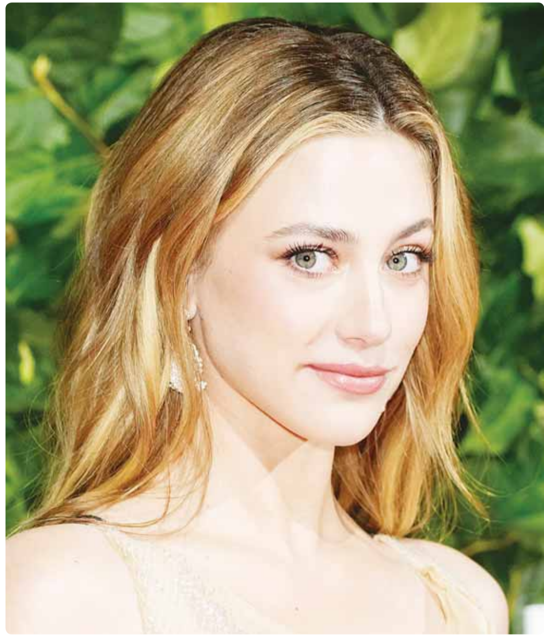
الممثلة الأميركية ليليه راينهارت خلال حفل توزيع جوائز "غوتم" التلفزيونية في نيويورك