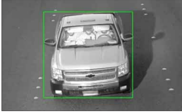
إحدى الكاميرات رصدت ثلاثي الهروب داخل مركبتهم على الطريق