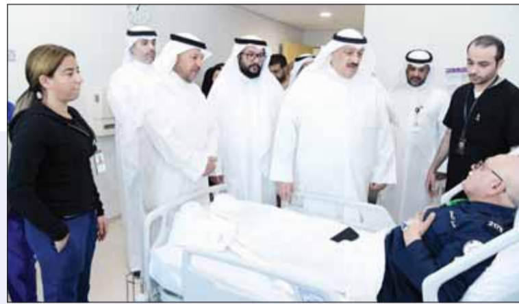
الوزير د.أحمد الموضعي خلال الزيارة يرافقه محافظ الفروانية والوكيل الشيخ د.سلمان الصباح