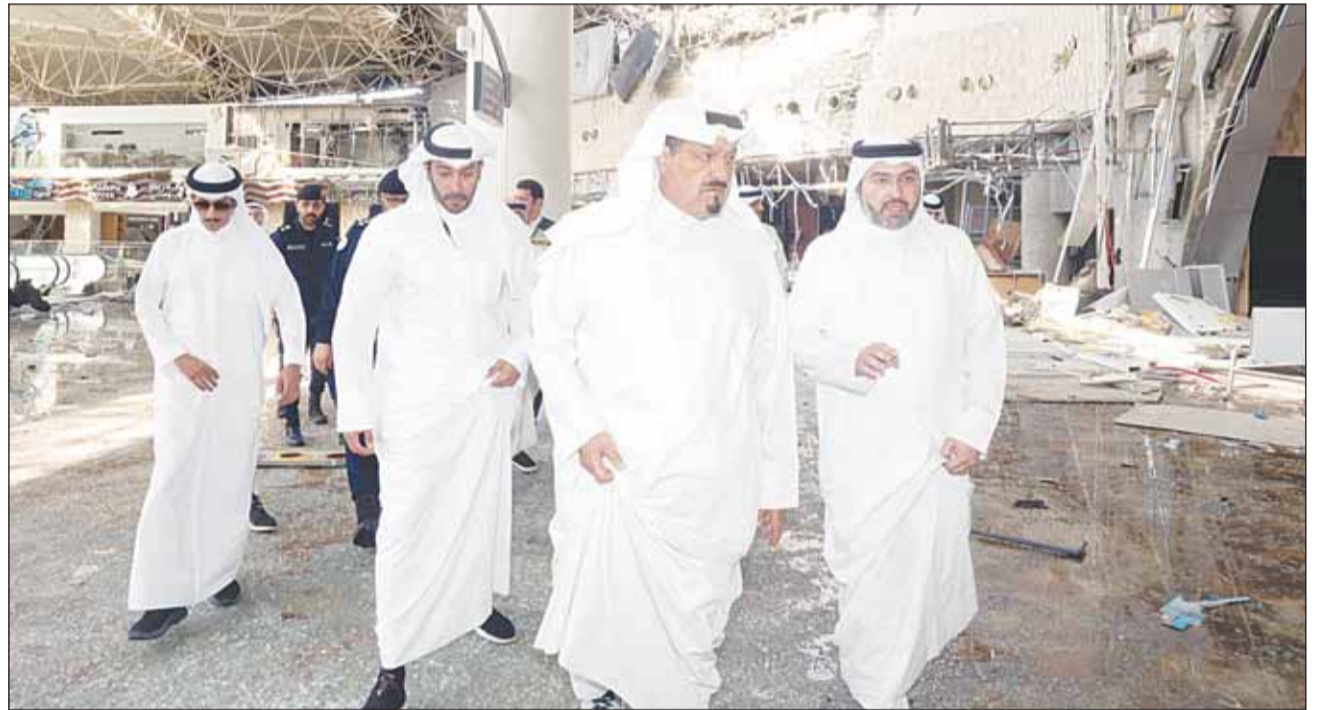
سمو رئيس الوزراء الشيخ أحمد العبدالله لدم تقفده المطار

اسم QRcode زيارة الموقع الإلكتروني: aljarallah.com