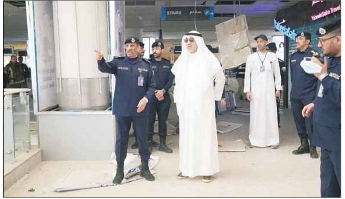
النائب الأول الشيخ فهد اليوسف لدمه تفقده المطار

ومباشرتها للمهام الموكلة إليها وما اتخذته من إجراءات لتأمين المواقع المتضررة والحفاظ على سلامة العاملين في الموقع.