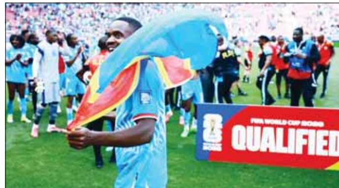
بكامبو لاعب منتخب الكونغو

أصدر رئيس بلدية لا لينايا دي لا كونتسيبيون، جنوب إسبانيا، قراراً بمنع مباراة ودية كانت مقررة في التاسع من يونيو بين منتخب تشيلي وجمهورية الكونغو الديمقراطية، كإجراء احترازي بسبب تفشي فيروس إيبولا في الكونغو.