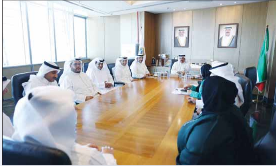
وزير التربية سيد جلال الطبطبائي، مترئساً الاجتماع الموسع لقياديين الوزارة