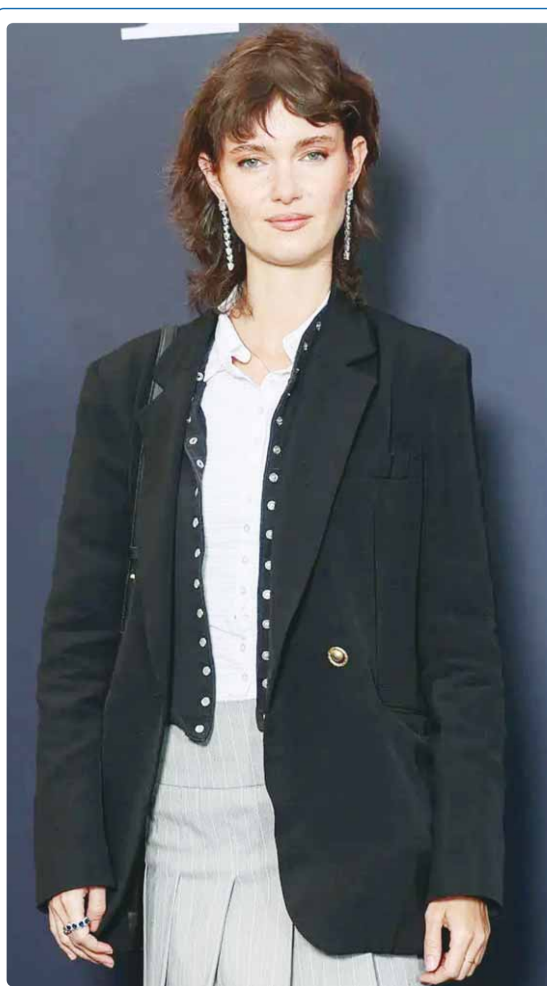
الممثلة الفرنسية ليا بونو خلال حضورها الذكرى السنوية لـ "Mediawan" في باريس