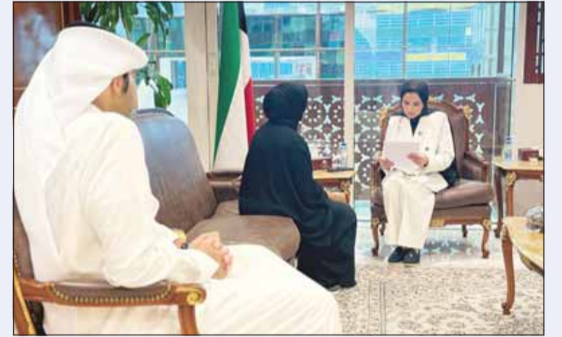
الوزيرة د. أمثال الحويلة لدى استقبالها إحداهم المواطنين

استقبلت وزيرة الشؤون الاجتماعية وشؤون الأسرة والطفولة الدكتورة أمثال هادي الحويلة أمس عدداً من المواطنين خلال اللقاء الأسبوعي المخصص للاستماع إلى مطالبهم وملاحظاتهم، وذلك في إطار نهج الوزارة القائم على تعزيز التواصل المباشر مع الجمهور. وأكدت خلال اللقاء حرص الوزارة على متابعة القضايا المطروحة من المواطنين والعمل على تذييل العقوبات التي قد تواجههم، بما يساهم في تسهيل الإجراءات والارتقاء بمستوى الخدمات المقدمة للمستفيدين.