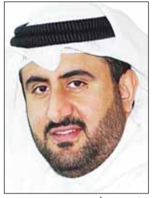
الشيخ خالد أحمد الصباح

أكد العضو المنتدب للتسويق العالمي في مؤسسة البترول الكويتية، الشيخ خالد أحمد الصباح، إن القطاع النفطي الكويتي سيعاود الإنتاج بنسبة تصل إلى 70% خلال فترة تتراوح بين 6 و8 أسابيع، وذلك بعد إعادة فتح مضيق هرمز. وأضاف خلال مؤتمر النفط والغاز في الشرق الأوسط الذي تنظمه "ستاندر أند بورز غلوبال إنرجي"، الذي نظم خلال يومي 3 و2 يونيو الجاري في لندن أن النسبة المتبقية البالغة 30% قد تستغرق نحو شهر إضافي للوصول إلى المستويات الطبيعية، متوقفاً عودة مصافي التكرير في الكويت إلى طاقتها التشغيلية خلال فترة تتراوح بين أسبوعين و3 أسابيع. على الصعيد ذاته أكدت مصادر لـ "السياسة" أن شركة نفط