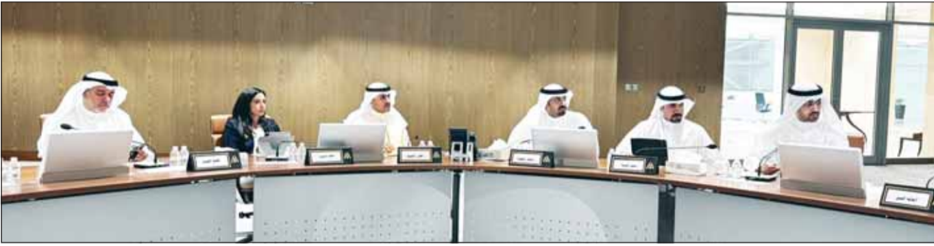
جانب من اجتماع اللجنة الفنية

ونص المشروع على منح ترخيص بناء لمدة سنتين لإنجاز الأعمال، فيما تكون مدة ترخيص الإشغال ثلاث سنوات قابلة للتجديد لمدد مماثلة، مقابل رسم مقداره 150 ديناراً عن المساحة المستغلة، مع تقديم كفاية مصرفية تعادل 10% من قيمة الأعمال لضمان الصيانة والإزالة عند انتهاء الترخيص. وألقى المشروع مسؤولية الصيانة الدورية للنصب أو المجسم والمنطقة المحيطة به على الجهة المبادرة طوال فترة الترخيص، مع إلزامها بإزالة المنشأة عند انتهاء الترخيص أو في حال صدور قرار بإلغائه، وتحمل جميع التكاليف المترتبة على ذلك. كما منح المشروع الجهة المختصة صلاحية إلغاء الترخيص إذا لم يتم تنفيذ الأعمال خلال مدة الترخيص، أو إذا اقتضت المصلحة العامة ذلك، أو عند مخالفة الاشتراطات والضوابط المعمدة. ويأتي المشروع في إطار توجه البلدية نمو تنظيم إقامته المعالم التذكارية والمجسمات في المواقع العامة وفق معايير موحدة تضمن الحفاظ على المظهر الحضاري والجمالي للدولة وتمنع العشوائية في استغلال الفضاءات العامة.