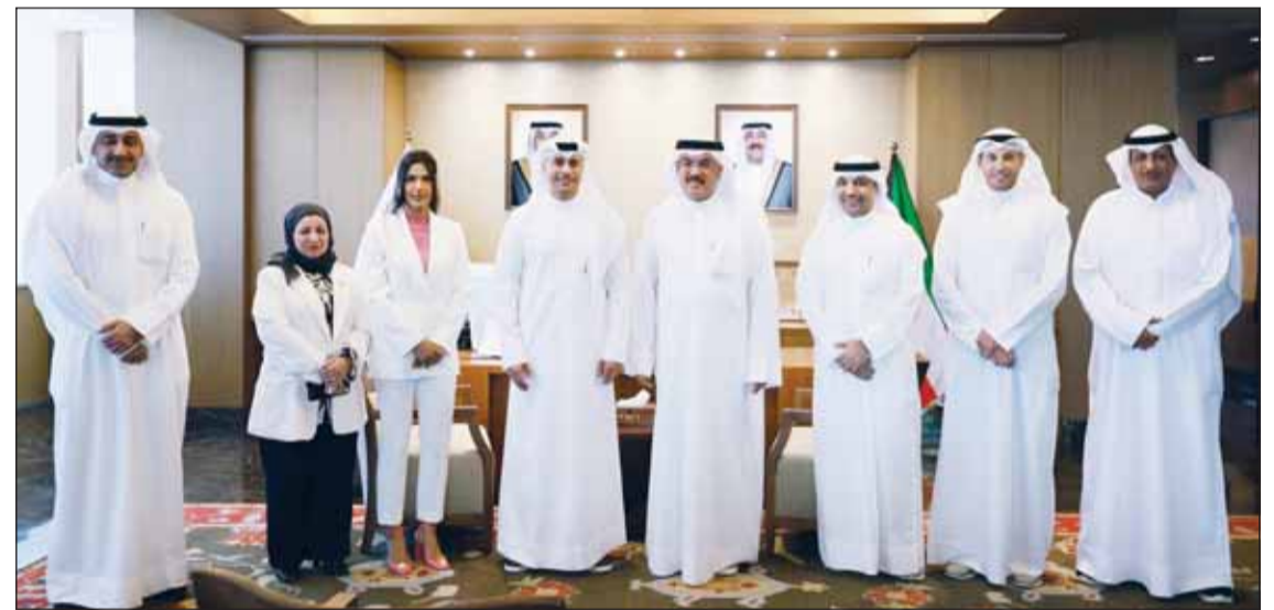
وزير التربية سيد جلال الطبطبائي والشباب والرياضة د. طارق الجلاهمة خلال اللقاء

البدنية والنفسية وقادر على الإسهام بفاعلية في مسيرة التنمية. وأضافت أنه جرى مناقشة آليات استثمار الطاقات الشبابية واكتشاف المواهب الرياضية ورعايتها عبر تكامل الجهود بين القطاعين التربوي والرياضي وتوفير بيئة تعليمية ورياضية محفزة تدعم الإبداع والتميز وتسهم في ترسيخ قيم الانضباط والعمل الجماعي وروح المنافسة الإيجابية.