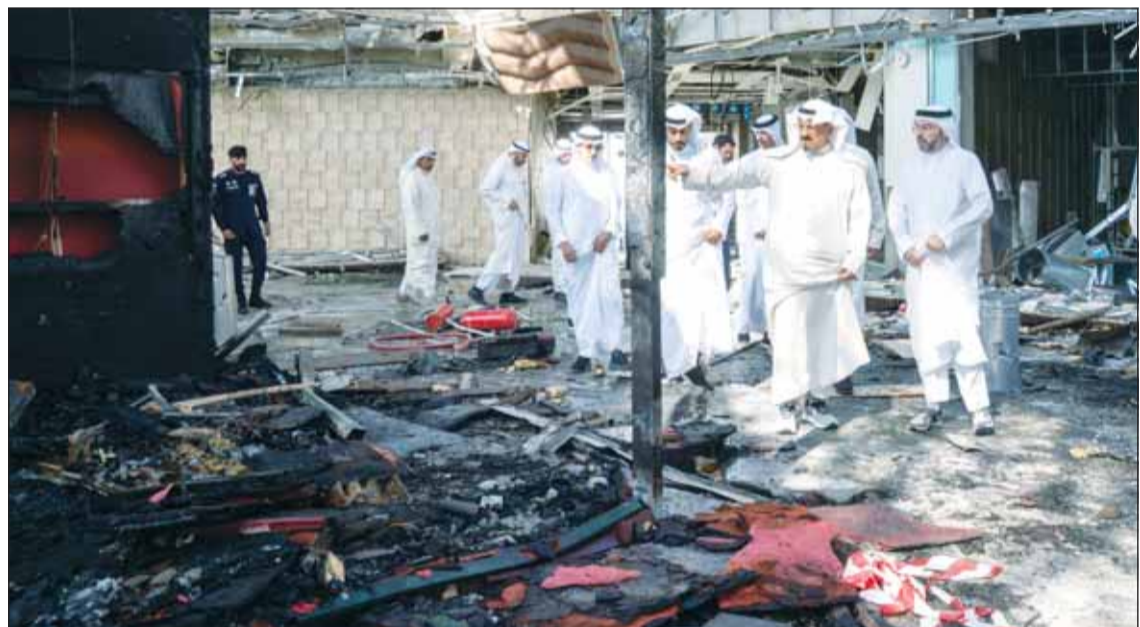
سمو رئيس الوزراء الشيخ أحمد العبدالله لدى تفقده الأضرار الناجمة عن الاعتداءات الإيرانية الأثمة فمب منبم "T1"

وعادة تأهيل المبنى بما يضمن عودته إلى جاهزيته التشغيلية في أقرب وقت ممكن. وأعرب سموه عن شكره وتقديره لكافة الطواقم العاملة في المطار وفرق الطوارئ على استجابتهم السريعة في التعامل مع تداعيات الحادث مشيدا بسرعة تنفيذهم للخطوات اللازمة والسيطرة على الموقف بكفاءة عالية.