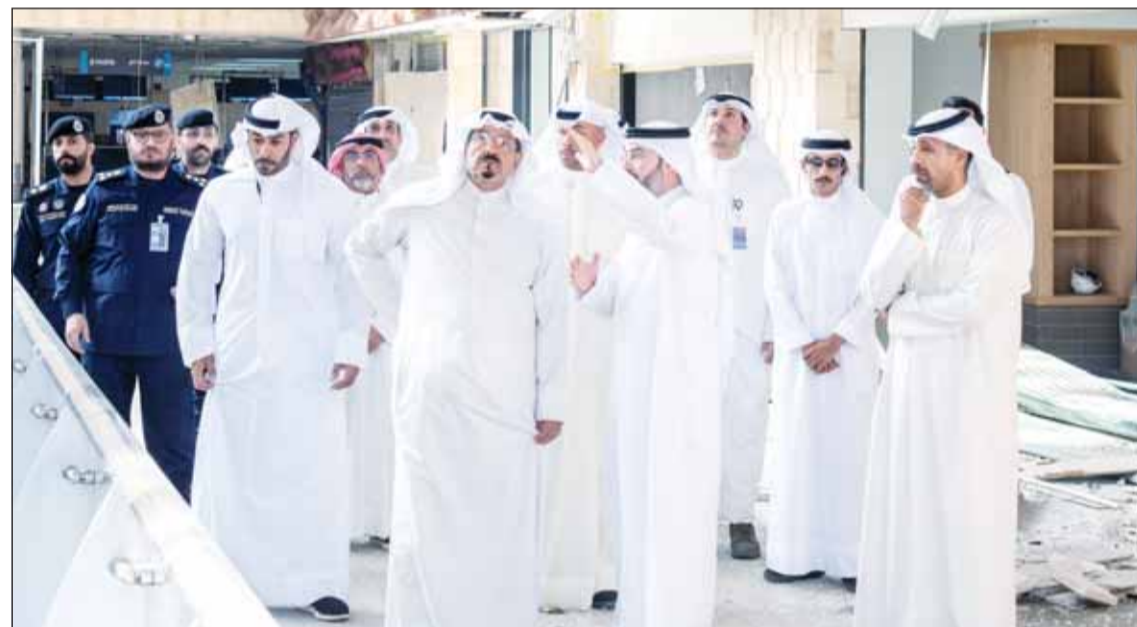
.. يستمع إلى شرح عن تقييم الأضرار

اتخاذ التدابير اللازمة للحفاظ على سلامة العاملين والمتواجدين في الموقع | مباشرة الإجراءات المطلوبة لتنفيذ الإصلاحات بما يضمن جاهزيته التشغيلية | الشكر والتقدير لفرق الطوارئ لاستجابتهم السريعة في التعامل مع تداعيات الحادث بكفاءة