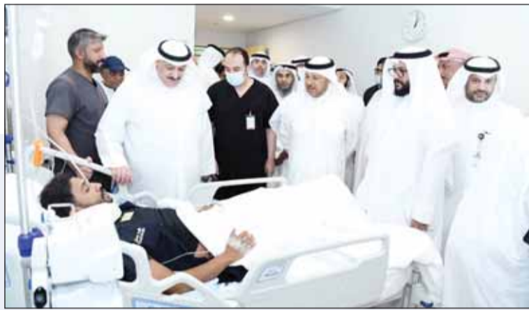
... ويطمئنون علم حالة مصابي الاعتداء على المطار

"الداخلية": الابتعاد عن المواقع المتضررة وعدم الاقتراب منها أو التجمهر في محيطها