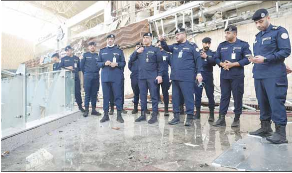
وكيل وزارة الداخلية اللواء عبدالوهاب الوهيب لدمه تفقده مبنى المطار