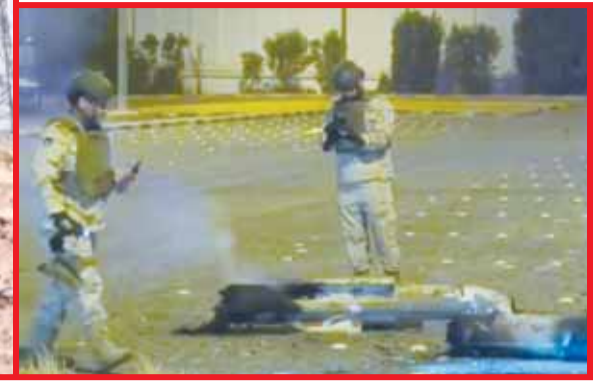
بقايا الصواريخ الآتمة

القوات المسلحة رصدت وتعاملت مع 13 صاروخاً باليستياً و 17 طائرة مسيرة