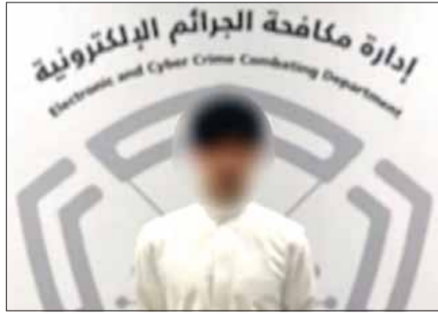
المتهم بعد ضبطه

بعد ساعات قليلة من نشر شاب فيديو تعامل الدفاعات الجوية مع عدد من الصواريخ، استطاع رجال وزارة الداخلية القبض عليه وإملائته إلى الجهة المختصة. وقالت وزارة الداخلية - في بيان صحافي - ان الجهات المختصة تمكنت من ضبط مستخدم أحد الحسابات على إحدى مواقع التواصل الاجتماعي، بعد قيامه بتصوير ونشر مقاطع فيديو تضمنت تعامل الدفاعات الجوية مع عدد من الصواريخ، في مخالفة من شأنها الإضرار بالمصلحة العامة ومتطلبات الأمن والسلامة. وقالت الوزارة، ان الشاب استخدم هاتفه النقال للتصوير أثناء قيادة المركبة، الأمر الذي تسبب بوقوع حادث مروري، ما يشكل مخالفة للقوانين والأنظمة المعمول بها.