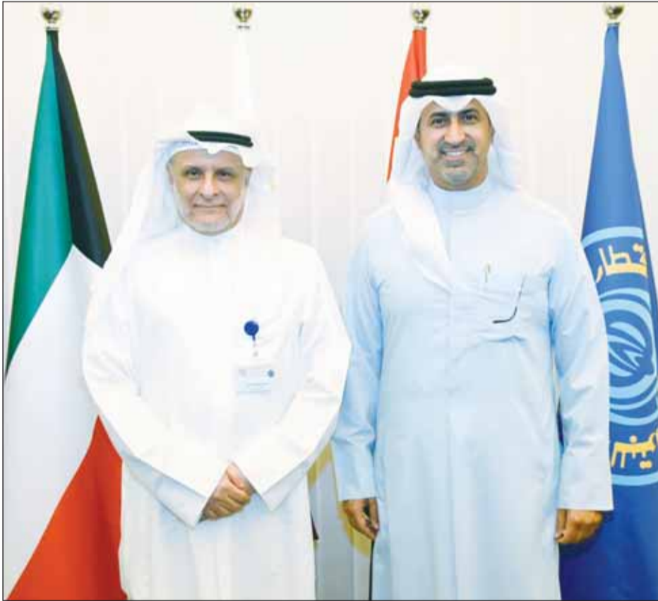
وكيل وزارة النفط الشيخ د. نمر الصباح يزور مقر المنظمة العربية للطاقة ويطلع على الخطط التطويرية

الدول الأعضاء إلى جانب بحث سبل تعزيز التعاون والتنسيق المشترك بين وزارة النفط والأمانة العامة للمنظمة في مختلف المجالات ذات الاهتمام المشترك. وفي بيان منفصل للمنظمة أعربت عن استنكارها وإدانتها الشديدين للهجمات الأخيرة التي استهدفت دولة الكويت. وأكدت المنظمة أن مثل هذه الأعمال من شأنها أن تؤثر سلباً على استقرار أسواق الطاقة مجددة التأكيد على دعمها الكامل لكل ما تتخذه الكويت من إجراءات لحماية أمنها واستقرارها.