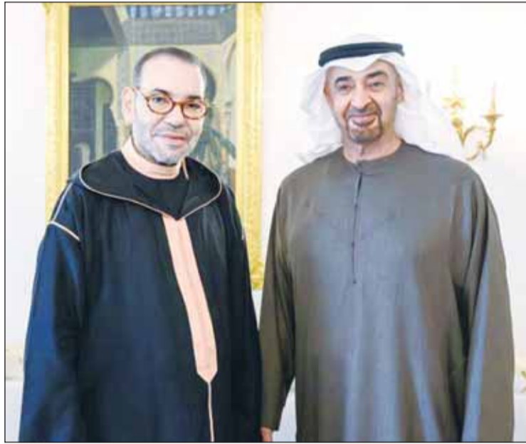
رئيس الإمارات الشيخ محمد بن زايد والحايل المغربي الملك محمد السادس بالرباط (رأس)

أوراق اعتماده إلى وزير الخارجية المغربي ضمن الأطر الدبلوماسية المعمول بها، ما يكرس التحالف رسمياً بمهامه الجديدة ممثلاً لفرنسا لدى المملكة خلفاً للسفير كريستوف لوكورتبي الذي تولى تمثيل باريس بالرباط منذ العام 2022، قبل أن يتم تعيينه مديراً عاماً للوكالة الفرنسية للتنمية بالمغرب، وهو المنصب الذي يشرفه مهامه رسمياً بتاريخ 11 مايو الماضي، عقب استكمال المصادقة داخل المؤسسات الفرنسية، ويأتي تعيين لاليو في سياق يشهد تقارباً مهماً بين المغرب وفرنسا، خاصة بعد إعادة ترتيب أولويات الشراكة الثنائية وتكثيف التنسيق السياسي والاقتصادي بين البلدين، ما يجسد رغبة باريس في تعزيز حضورها الاستراتيجي بالمملكة وتوسيع مجالات التعاون مع الرباط خلال المرحلة المقبلة. على صعيد آخر، كشفت بيانات رسمية أودعتها كوريا الجنوبية لدى سجل الأمم المتحدة للأسلحة التقليدية أن المغرب عزز ترسانته الدفاعية خلال العام 2025 باقتناء منظومات دفاع جوي محمولة من طراز "شايرون"، في خطوة تعكس استمرار القوات المسلحة الملكية في تنفيذ استراتيجيتها شاملة لتحديث قدراتها