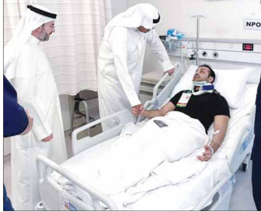
... ويضمّن على مصاب آخر