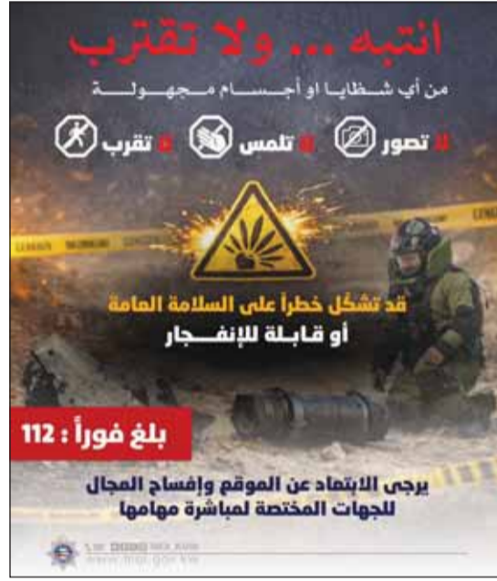
لا تقرب... ولا تصور... ولا تلمس

حذرت وزارة الداخلية من الاقتراب من أي شظايا أو أجسام مجهولة قد يعثر عليها لما قد تشكله من خطر على السلامة العامة أو لكونها قابلة للانفجار. ودعت إلى عدم التصوير ولمس الأجسام أو العبث بها والابتعاد عن موقعها فوراً مع إفساح المجال للجهات المختصة لمباشرة مهامها واتخاذ الإجراءات اللازمة. كما شددت على أهمية الإبلاغ الفوري عن أي جسم مجهول عبر هاتف الطوارئ (112). بدورها، أهابت رئاسة الأركان العامة للجيش بالمواطنين والمقيمين عدم الاقتراب أو لمس أي حطام أو شظايا أو أجسام مجهولة قد تكون ناتجة عن عمليات اعتراض الأهداف الجوية المعادية نظراً لما قد تشكله من خطر على السلامة العامة. وأكد المتحدث الرسمي لوزارة الدفاع العقيد الركن سعود العطوان - في بيان صحفي - ضرورة الإبلاغ الفوري عن أي من هذه المخلفات عبر رقم الطوارئ (112) أو الجهات المختصة واتباع تعليمات الأمن والسلامة واستقاء المعلومات من المصادر الرسمية المعتمدة. ودعا البيان الجميع إلى التعاون والالتزام بالارشادات الصادرة حفاظاً على أمنهم وسلامتهم.