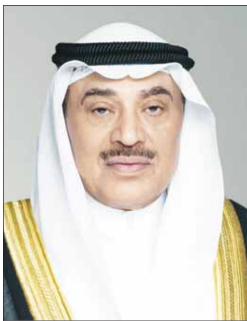
سمو وليه العهد الشيخ صباح الخالد

العمل الخليجي المشترك، متمنيا لسموه موفور الصحة ولمملكة البحرين وشعبها الشقيق دوام الأمن والاستقرار. كما تلقى سمو ولي العهد اتصالا هاتفيا امس من أخيه الرئيس محمود عباس رئيس دولة فلسطين الشقيقة، نقل خلاله تحياته إلى سمو أمير البلاد الشيخ مشعل الأحمد، معربا عن إدانته الشديدة للهجمات الإيرانية الأثمة على المنشآت المدنية، مؤكدا تضامن دولة فلسطين الكامل وتأييدها في كل ما تتخذه دولة الكويت من إجراءات لمفظ سيادتها وأمنها. من جانبه، عبر سمو ولي العهد عن بالغ شكره وتقديره لفخامة الرئيس محمود عباس رئيس دولة فلسطين الشقيقة على هذه المشاعر الأخوية الصادقة والموقف الداعم لدولة الكويت، متمنيا لدولة فلسطين وشعبها الشقيق الأمن والسلام والاستقرار.