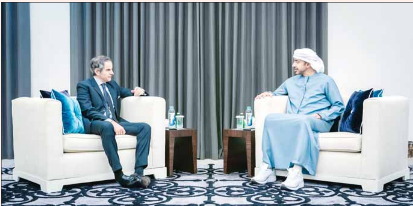
وزير الخارجية الإماراتي الشيخ عبدالله بن زايد مستقبلاً المدير العام للوكالة الدولية للطاقة الذرية رافائيل غروسي في أبوظبي

والشفافية، إلى جانب حرصها على التعاون الدولي الوثيق في هذا المجال، مشيراً إلى الدور الأساسي الذي تقوم به الطاقة النووية في ضمان أمن الطاقة وتلبية الطلب المتزايد عليها بفعل زيادة الاعتماد على الكهرباء، وخصوصاً في الصناعات الثقيلة ومراكز البيانات والذكاء الاصطناعي، قائلاً إن منشآت الطاقة النووية تم ركيزة أساسية لنظام الطاقة المستدام بما يضمن تقدم وازدهار المجتمعات، وأي تهديد أو استهداف لهذه المنشآت يمثل مصدر قلق بالغ للمجتمع الدولي، نظراً لما قد يترتب عليه من تداعيات محتملة على السلامة والأمن النوويين وعلى الاقتصاد العالمي ككل، وبالتالي يجب على الجميع الحرص على أن تظل هذه المنشآت محمية وبمعية عن التوترات في جميع الأوقات وفقاً للمبادئ والمعايير الدولية ذات الصلة.