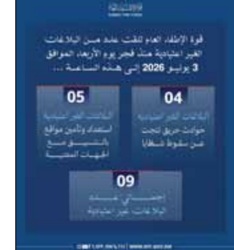
إحصائية قوة الإطفاء العام

أعلن المتحدث الرسمي باسم قوة الإطفاء العام العميد محمد الغريب أن قوة الإطفاء العام تعاملت فجر أمس مع 9 بلاغات غير اعتيادية نتيجة سقوط شظايا ناجمة عن اعتراض الدفاعات الجوية لصواريخ وطائرات مسيرة إيرانية معادية، وأوضح أن البلاغات غير الاعتيادية شملت 4 حوادث حريق نتجت عن سقوط شظايا بالإضافة إلى 5 حالات استعداد وتأمين مواقع بالتنسيق مع الجهات المعنية.