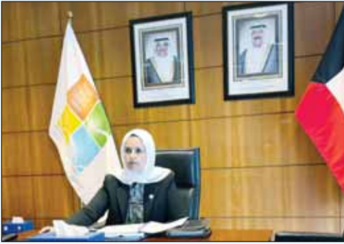
وزير الدولة لشؤون التنمية والاستدامة الدكتورة ريم الفليج خلال مشاركتها في الجلسة العامة لمؤتمر التفاعل (CICA)

أكدت وزير الدولة لشؤون التنمية والاستدامة الدكتورة ريم الفليج أمس الخميس أهمية تعزيز الحوار السياسي وبناء الثقة بين الدول باعتبارهما ركيزتين أساسيتين لدعم التعاون الاقتصادي وتحقيق التنمية المستدامة. وجاء ذلك في كلمة للوزيرة خلال مشاركتها في الجلسة العامة لمؤتمر التفاعل وإجراءات بناء الثقة في آسيا (CICA) ضمن الاجتماع الثاني لـ (حوار ترمذ) حول الترابط بين آسيا الوسطى وجنوب آسيا عبر الاتصال المرئي. وشددت الفليج لـ (كونا) على ضرورة التكامل الإقليمي وتطوير الشراكات في مجالات التجارة والنقل والخدمات اللوجستية والطاقة بما يسهم في تحقيق الاستقرار والازدهار المشترك. وقالت إن الكويت تولي اهتماماً خاصاً بالاستثمار في البنية التحتية الذكية وتعزيز الأمن الغذائي والمائي وتطوير سلاسل الإمداد ودعم التحول نحو الاقتصاد الأخضر.