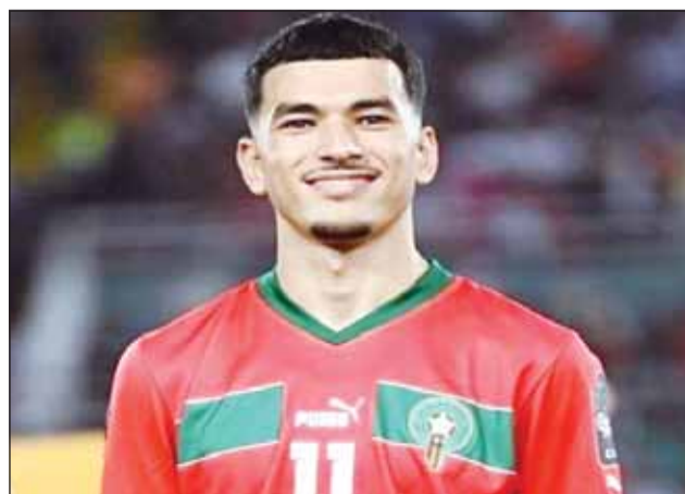
الواحد، ممنوع من دخول أميركا

جهوداً رفيعة المستوى جارية حالياً لحل المشكلة. كما لقت تقارير مغربية أخرى على أن الواودي لم يحصل على تأشيرة بسبب مشكلة مرتبطة بالحصول على تأشيرة دخول أميركا، وأن