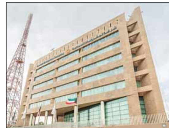
مقر المشروعات السياحية

وبينت أن هذه المبادرة تعكس حرصها على استقطاب الشركات الخوسية مع المبادرين في القطاع الترفيهي وتمكينهم من تقديم تجارب متميزة تسهم في تنشيط الحركة السياحية والترفيهية في البلاد معربة عن تطلعها لمواصلة دعم المبادرات الموسمية التي تعزز خيارات الترفيه العائلي وتواكب تطلعات المجتمع الكويتي على مدار العام.