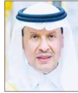
الأمير عبد العزيز بن سلمان

ودعا وزير الطاقة السعودي إلى ضرورة تكثيف الجهود الدولية لحماية قطاع الطاقة من أي تهديدات متعملة، مشيراً إلى أن هذا القطاع الحيوي يتطلب أطر تعاون أوسع وأكثر مرونة لمواجهة التحديات المستقبلية.