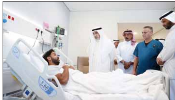
... ويطمئن علم مصاب آخر