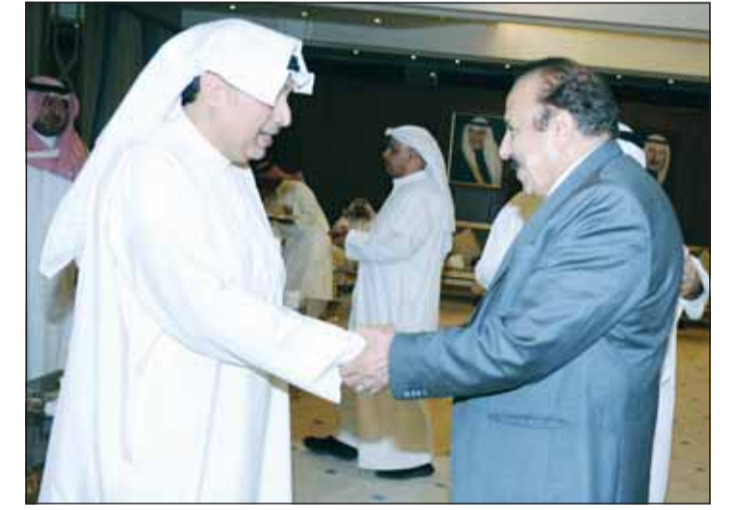
الشيخ حمد جابر العلي وبسام القصاص