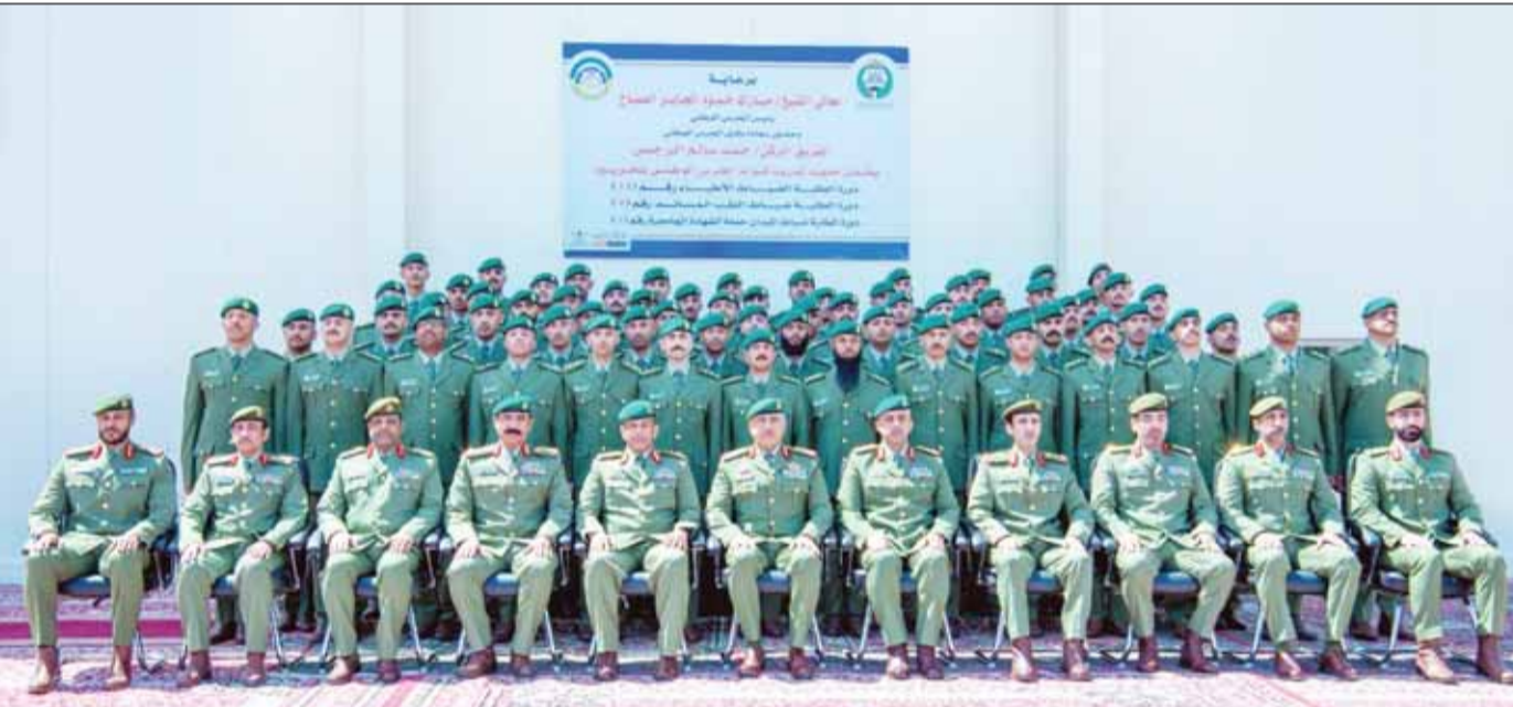
الفريق البرجس وقادة الحرس الوطنيين يتوسطون الضباط الخريجين

□ تصدوا بحزم لكل معتد تسول له نفسه العبث بأمن الكويت واستقرارها