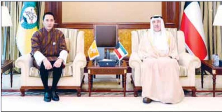
رئيس الحرس الوطني خلال لقائه مع سفير بوتان

بحث رئيس الحرس الوطني الشيخ مبارك المحمود الصباح مع سفير مملكة بوتان الصديقة لدى دولة الكويت بوب دورجي موضوعات مشتركة. وذكر الحرس الوطني - في بيان صحافي أمس - أن المحمود استقبل السفير دورجي وبحث معه خلال اللقاء عددا من الموضوعات ذات الاهتمام المشترك بين الجانبين.