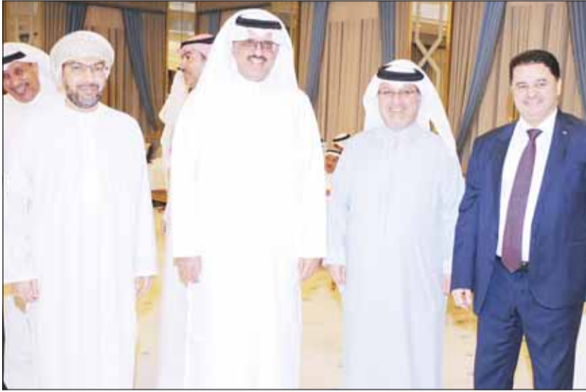
سفراء الأردن سنان المجالي والبحرين صلاح المالكي والسعودية الأمير سلطان بن سعد وسلطنة عمان د. صالح الخروصي