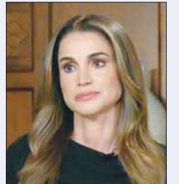
الملكة رانيا العبدالله

أعربت الملكة رانيا العبدالله، عن تضامنها مع الكويت، إثر الاعتداء الإيراني الآثم على المطار. ونشرت الملكة رانيا عبر حسابها الرسمي على منصة "إنستغرام" تعليقاً على خبر لوكالة الأنباء الكويتية (كونا)، تضمن تفاصيل حالة الاستنفار الصحي بعد العدوان وتوزيع المصابين الـ 63 على المستشفيات. وقالت في تعليقها: "لكويت مكان في الوجدان والذاكرة لدى كل من عرف أهلها وطيب معدنهم، دعواتنا بالشفاء والسلامة للجميع، وحفظ الله جميع أوطاننا العربية من كل سوء".