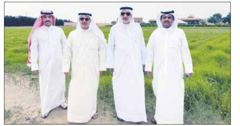
أل الرطام في المزرعة