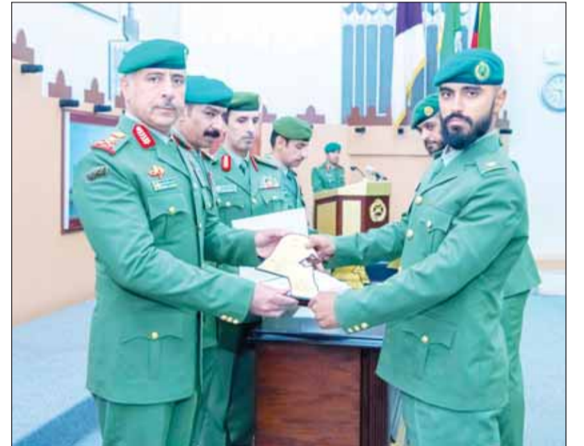
الفريق البرجس يكرم خريجاً

وأشار إلى حرص المعهد على إعداد وتأهيل الضباط الجدد بما يواكب متطلبات العمل العسكري ويعزز جاهزيتهم للقيام بواجباتهم الوطنية على أكمل وجه. وفي ختام الحفل أدى الضباط الخريجون القسم العسكري، متعهدين بالدور عن الوطن وحماية أمنه واستقراره وصون مكتسباته، ثم كرم أوائل الخريجين تقديراً لتفوقهم وتميزهم خلال فترة التدريب.