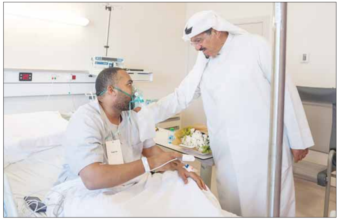
سمو رئيس الوزراء الشيخ أحمد العبدالله يطمئن على أحد المصابين

من الكوادر الطبية حول الحالة الصحية للمصابين والخدمات العلاجية المقدمة لهم، موجها بتوفير جميع أوجه الدعم والرعاية اللازمة واستمرار متابعة أوضاعهم الصحية أولا بأول حتى تماثلهم للشفاء. وأشاد بجهود الكوادر الطبية وفرق الطوارئ وما أظهره من كفاءة وسرعة استجابة في التعامل مع المصابين، مثنياً الجهود الكبيرة التي بذلها رجال الأمن وما تحلوا به من جاهزية وبقية ميدانية وسرعة في التعامل مع تداعيات الاعتداء. وأعرب عن خالص العزاء وصادق المواساة بوقاة شخص في حادث الاعتداء الآثم، سائلاً المولى عز وجل أن يلهم ذويه الصبر والسلوان وأن يمن بالشفاء العاجل على المصابين.