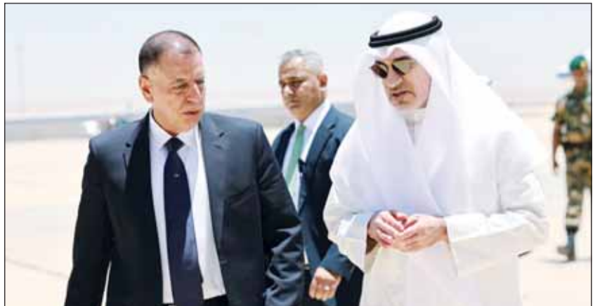
النائب الأول الشيخ فهد اليوسف لدم وصوله الى مستشفى جابر يرافقه وزير الداخلية الأردني مازن الفريية

عمان - "كونا"، عاد النائب الأول لرئيس مجلس الوزراء وزير الداخلية الشيخ فهد اليوسف إلى البلاد أول من أمس قادماً من العاصمة الأردنية عمان بعد زيارة رسمية إلى المملكة تظلمها عقد مباحثات أمنية. وقالت (الداخلية) - في بيان صحافي - أن الشيخ فهد اليوسف أشاد بعمق الروابط التاريخية والأخوية بين البلدين الشقيقين، مؤكداً على أهمية التنسيق الأمني المشترك لتعزيز الاستقرار. وكان النائب الأول بحث في العاصمة الأردنية عمان مع وزير الداخلية الأردني مازن الفريية أوجه العلاقات الثنائية بين البلدين الشقيقين. وقالت وزارة الداخلية - في بيان صحافي - إن اليوسف استعرض مع وزير الداخلية الأردني التطورات الأمنية الإقليمية والجهود المبذولة بشأنها. وأشاد الشيخ اليوسف بعمق العلاقات الأخوية والتاريخية التي تجمع الكويت والأردن وما يشهده التعاون المشترك بين وزارتي الداخلية في البلدين الشقيقين من تنسيق متواصل يسهم في تعزيز الأمن والاستقرار.