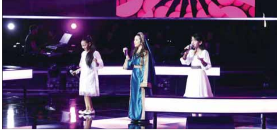
من ذا فويس كيدز