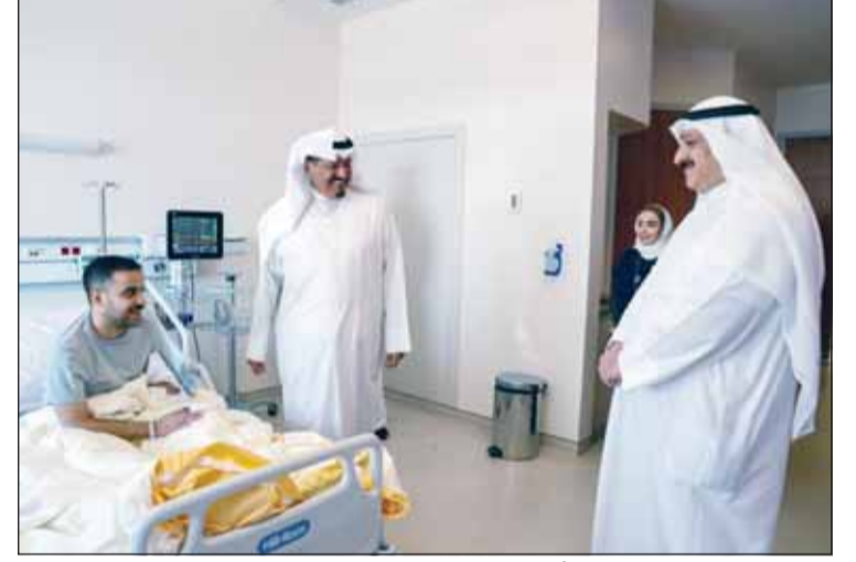
رئيس الوزراء وحديث ودم مع أحد مصابي العدوان