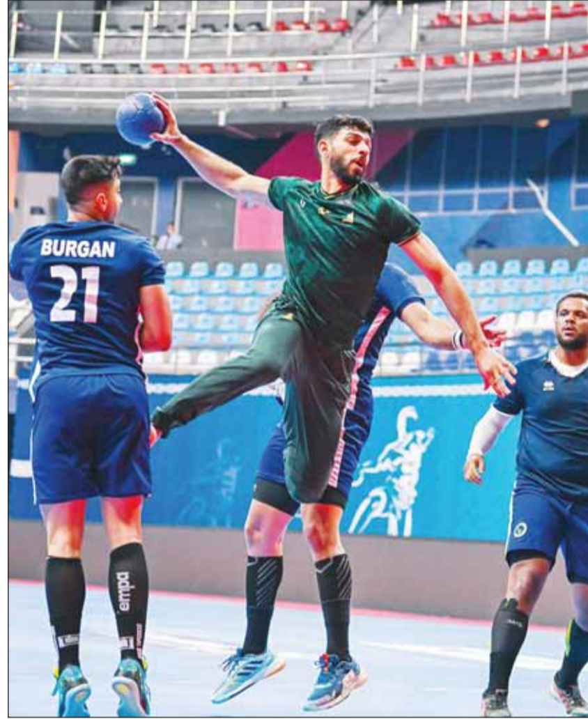
جانب من ودية يد برقان والخليج السعودي أول من أمس

ومسب نظام البطولة الجديد بعد انسحاب الفريق الصيني، تلعب الفرق فيما بينها دوري