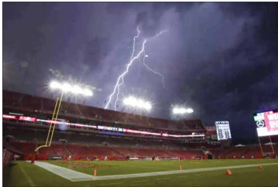
الصواعق تهدد مباريات كأس العالم

كما قام بيريز بتعديل شعار حملته الانتخابية خصيصاً لهذه المناسبة، من "تاريخ طويل نصنعه" إلى "الكثير من التاريخ لصنعه".