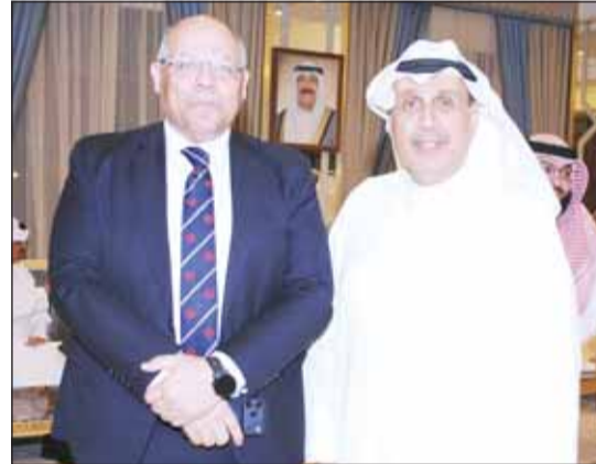
الشيخ حمد مرحباً بالسفير المصري محمد أبو الوفا