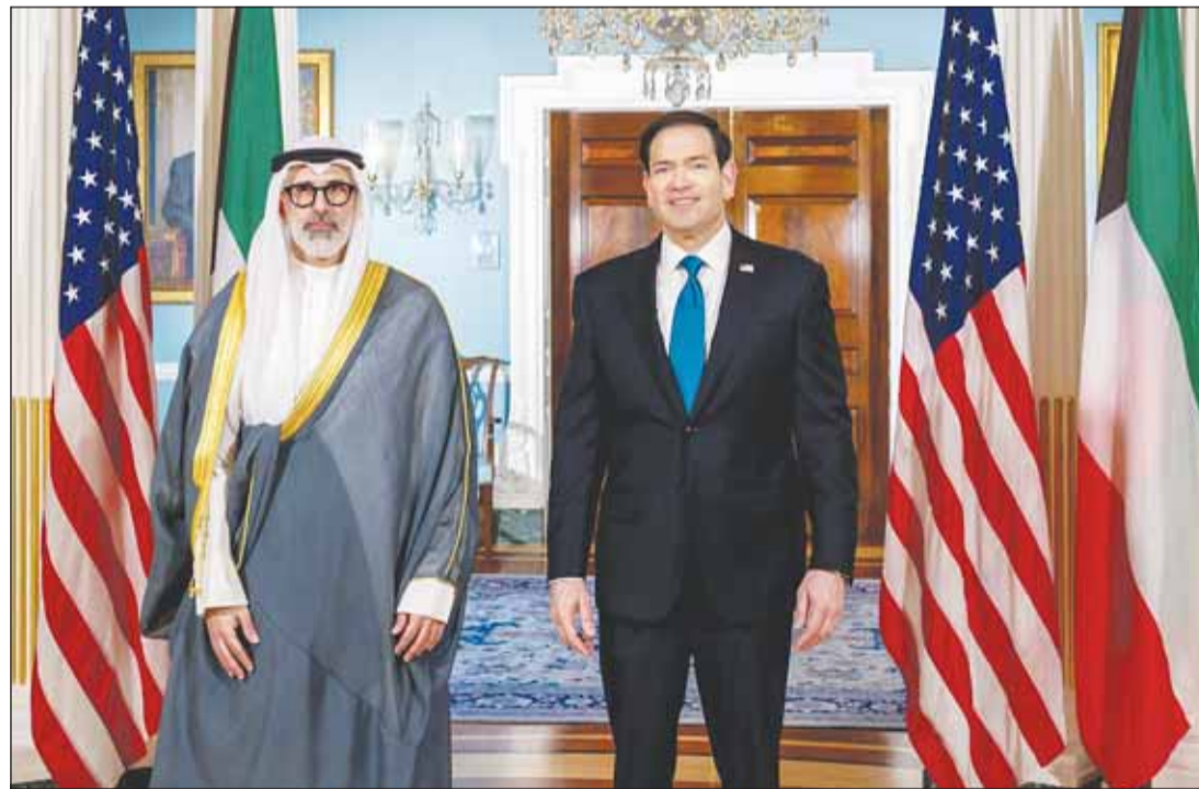
وزير الخارجية الشيخ جراح الجابر ونظيره الأميركي ماركو روبيو

زار سمو رئيس مجلس الوزراء الشيخ أحمد العبدالله، أمس، المصابين الذين يتلقون العلاج في مستشفى جابر الأحمد إثر العدوان الإيراني الآثم الذي استهدف مطار الكويت الدولي، للاطمئنان على حالتهم الصحية والوقوف على مستوى الرعاية الطبية المقدمة لهم، وذلك برفقة وزير الصحة د.أحمد الموضي. (راجع ص3) وأكد سمو رئيس مجلس الوزراء حرص الحكومة على متابعة أوضاع المصابين وتوفير جميع أوجه الدعم والرعاية اللازمة لهم حتى تماثلهم للشفاء، موجها الجهات المعنية بتسخير كل الإمكانيات الطبية والفنية وتقديم أفضل مستويات الرعاية الصحية والعلاجية للمصابين.