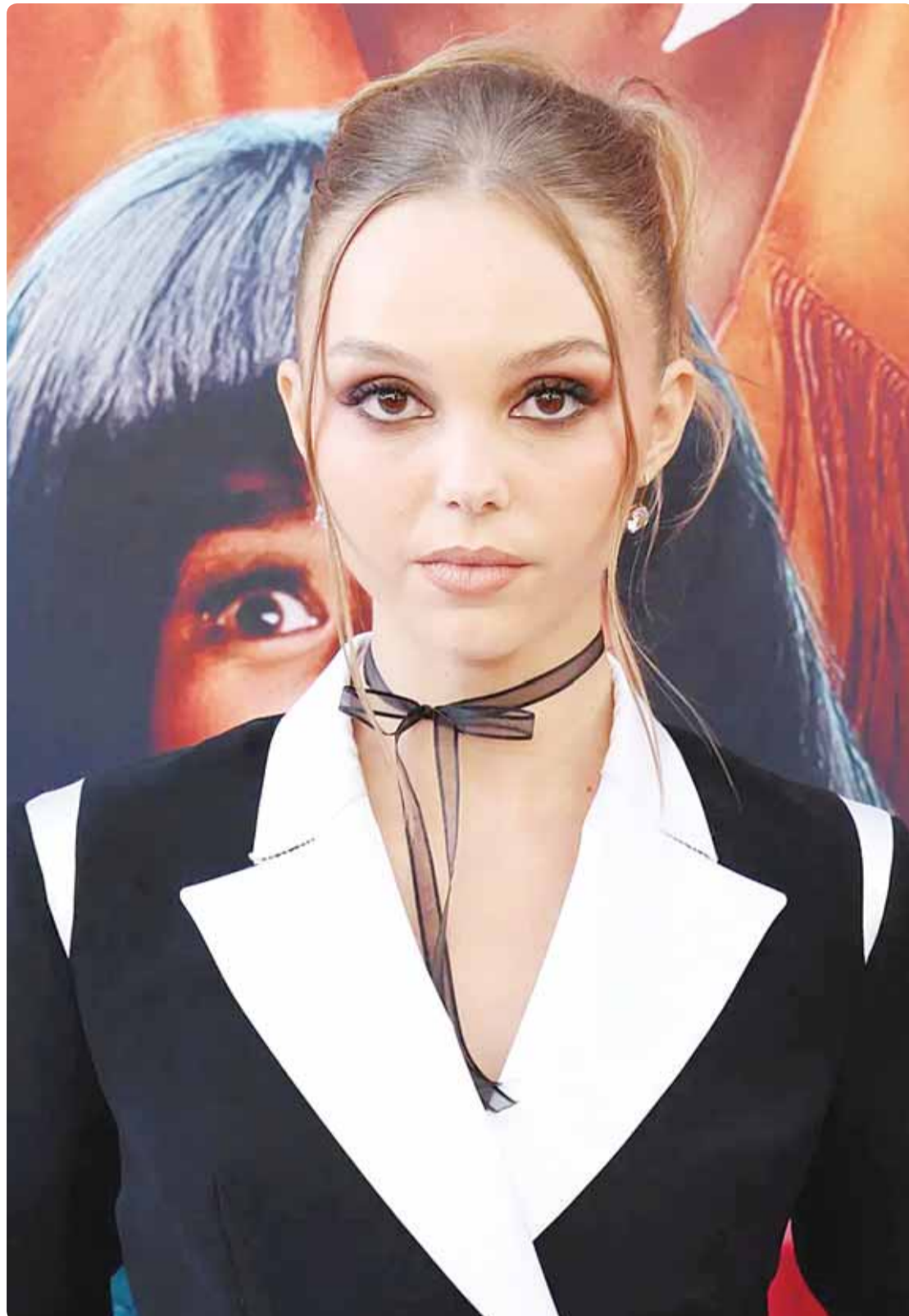
الممثلة الأميركية سافانا لي ناصيف خلال حضورها فيلم "سكيري موفيه" في لوس أنجلوس