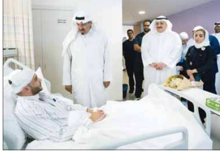
... ويحدث الله آخر