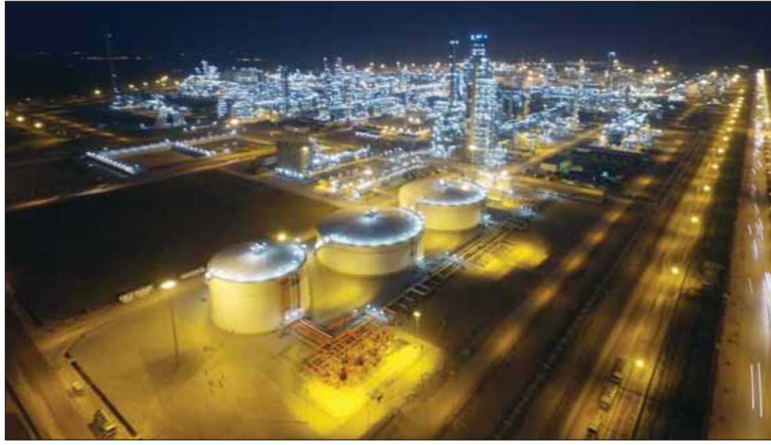
صورة ليلية لمصفاة نغي سون

وتبلغ حصة "مؤسسة البترول" في مصفاة "نغي سون" NSRP الكويتية الفيتنامية 35,1٪، وحققت إيرادات خلال العام 2025 وصلت إلى 188 تريليون دونغ فيتنامي بما يوازي 7,13 مليار دولار حيث عالجت ما يقارب 12 مليون طن من النفط الخام. وقالت إن المصفاة طرحت فرصة استثمارية في المواقع المشتركة منها "مصنع إنتاج حمض الكبريتيك" بسعة 350