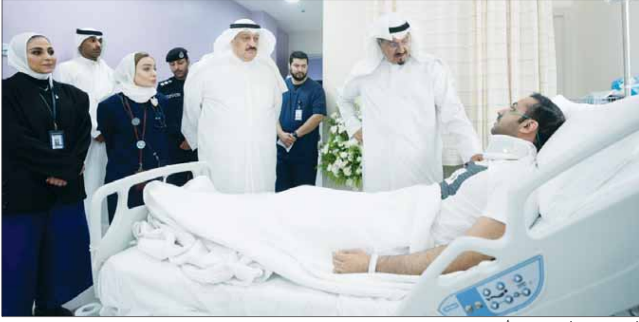
رئيس الوزراء يطمئن علم سلامة أحد الجرحى