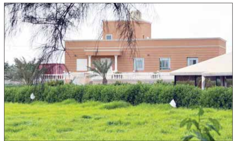
جانب من مزرعة رطام