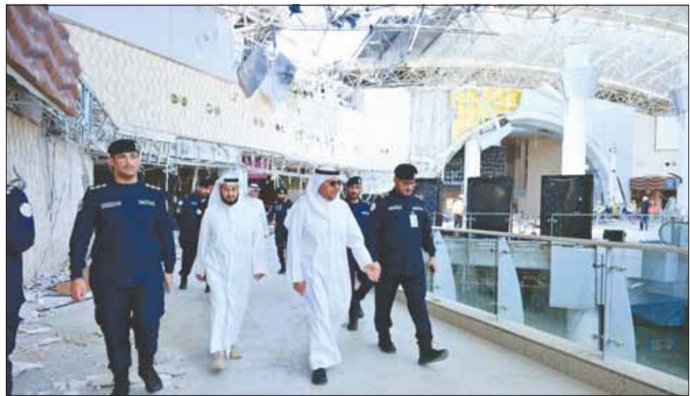
محافظ الفروانية الشيخ عذبة الناصر خلال الجولة التفقدية بالمطار

باليهود الكبيرة التي تبذلها مختلف الجهات الأمنية والفنية والعاملين في المطار في مواجهة هذه الظروف الاستثنائية. وأكد الناصر أن ما تعرضت له الكويت من اعتداء آثم لن يزيد أبناء الوطن إلا تماسكاً ووحدة خلف القيادة السياسية الحكيمة، مشدداً على أهمية مواصلة الجهود والتنسيق بين جميع الجهات المعنية للمحافظة على أمن البلاد وسلامة منشآتها الحيوية.