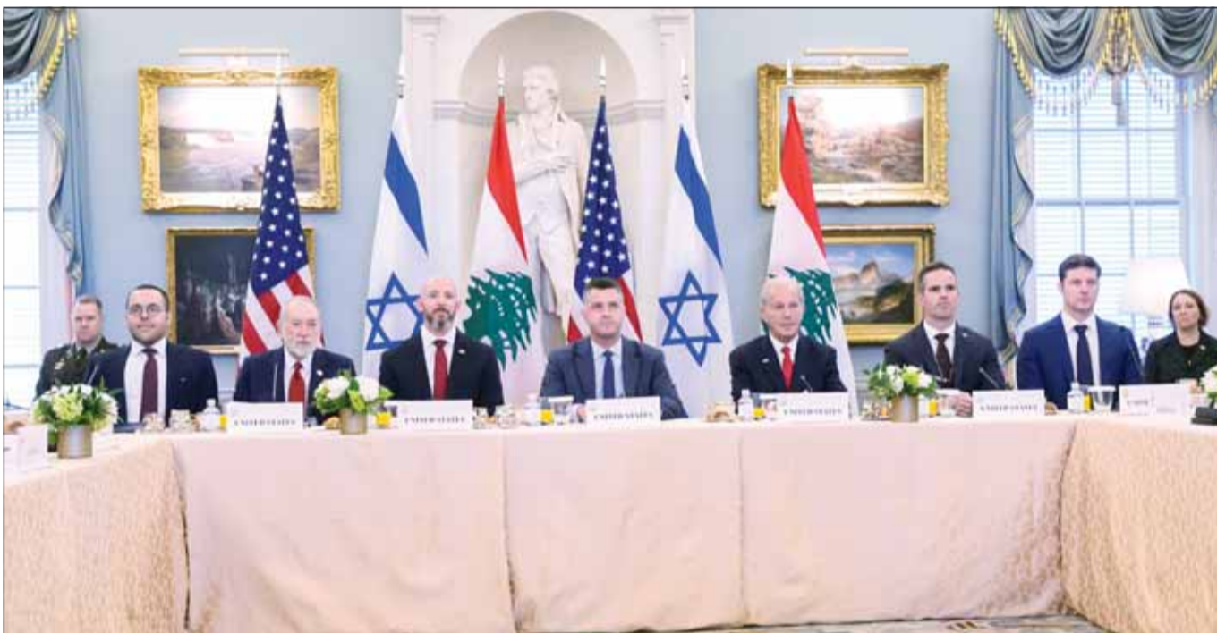
جانب من جولة المادثات الخامسة بين سفير إسرائيل لاس واشنطن جيتيل لير وسفيرة لبنان ندى حمادة برعاية أميركية في وزارة الخارجية بواشنطن

حكومية". وجاء في البيان، "ستتبع هذه الخطوات إرزاز تقدم نحو اتفاق شامل للسلام والأمن". وأضاف، "أكدت جميع الدول أن مستقبل العلاقة بين إسرائيل ولبنان يجب أن تقررته حكومتان سياديتان، ورفضت أي محاولة، من أي دولة أو فاعل من غير الدول، لامتياز مستقبل لبنان كرهينة". وأشار البيان إلى أن لبنان وإسرائيل اتفقا على مواصلة المفاوضات المباشرة، بهدف بناء الثقة وحل القضايا العالقة الأخرى. كما اتفق الجانبان على استئناف المادثات بشأن "المسارات السياسية والأمنية" خلال الأسبوع الذي يبدأ في 22 حزيران، بهدف التوصل إلى اتفاق