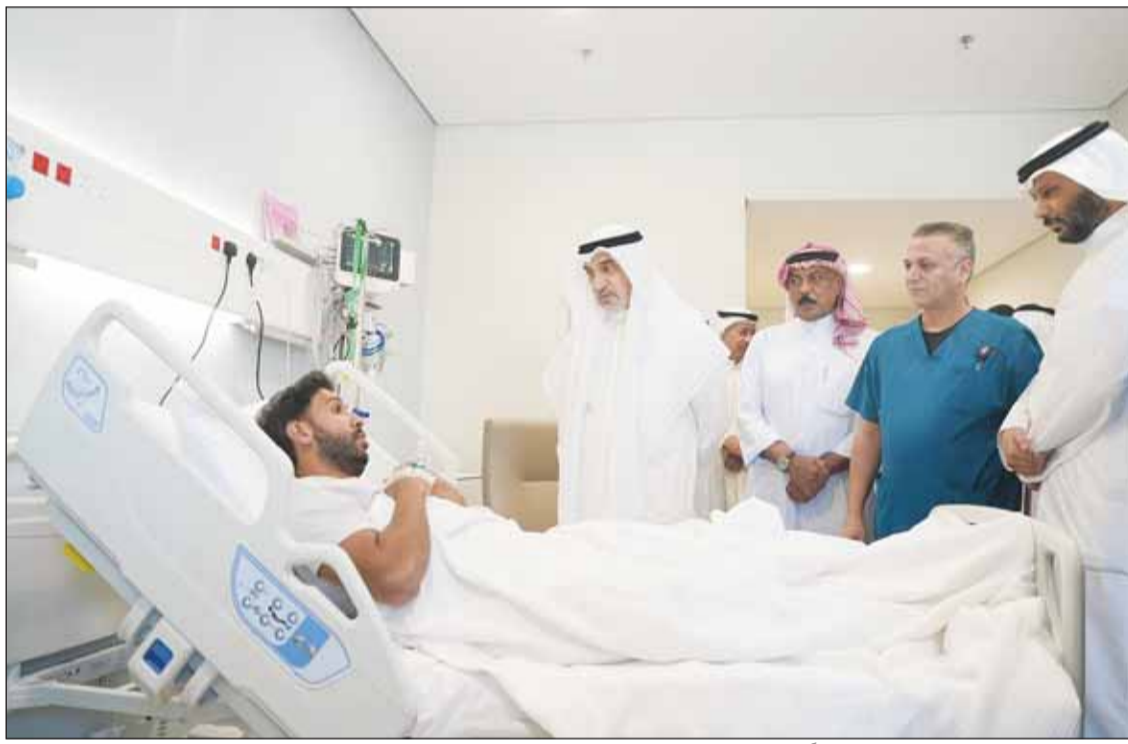
النائب الأول الشيخ فهد اليوسف مطمئناً على أحد المصابين

العبدالله: تسخير كل الإمكانيات الطبية وتقديم أفضل مستويات الرعاية للمصابين