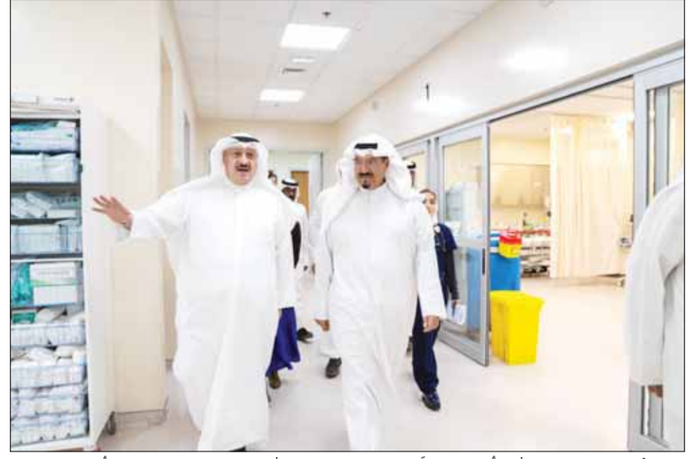
سمو رئيس مجلس الوزراء الشيخ أحمد العبدالله لدم وصوله الى مستشفى جابر يرافقه وزير الصحة د. أحمد العوضي