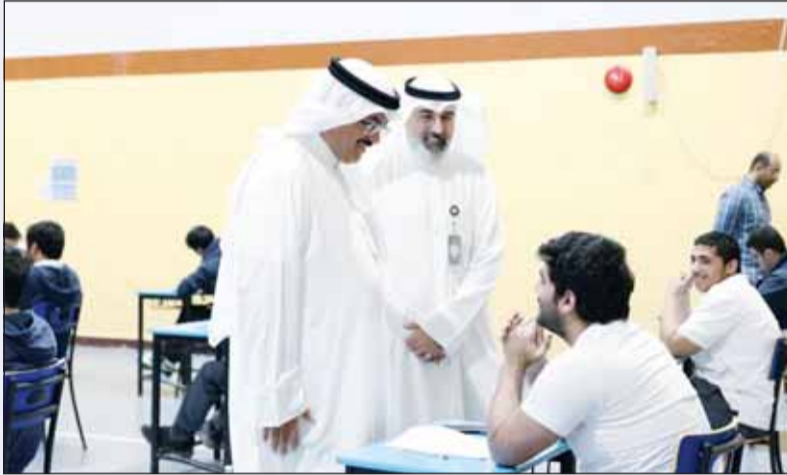
وزير التربية سيد جلال الطبباطي في حديث "إبومي" مع أحد الطلاب خلال أداء الامتحان

قام وزير التربية سيد جلال الطبباطي أمس بجولة تفقدية، شملت عددا من المدارس ولجان امتحانات نهاية العام الدراسي لطلبة الصفين العاشر والحادي عشر للاطلاع ميدانياً والتأكد من انتظام عملية الامتحان وتوفير الأجواء المناسبة للطلبة.