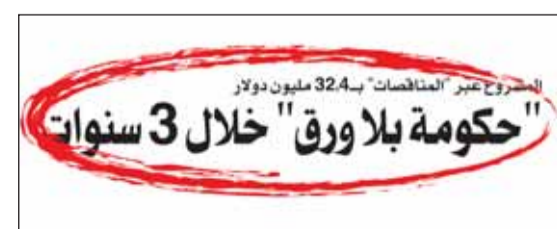
خبر "السياسة" عن المشروع كما نشر في عدد الاثنين 18 مايو

إجراءات الرقابة المسبقة والتدقيق والمراجعة وإبداء الرأي بالتعاقد حال عدم وجود أي ملاحظات تستدعي الرد عليها من قبل الجهاز، بوصفه الجهة ذات الشأن. في سياق متصل، حصل الجهاز أسيراً على التتمة 12