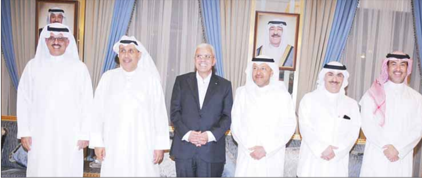
الشيخ: مبارك سالم العلي وخالد عبداللّه وعذبة الناصر وحمد جابر العلي وسفير فلسطين رامي طهوب وعميد السلك الدبلوماسي السفير السعودي الأمير سلطان بن سعد