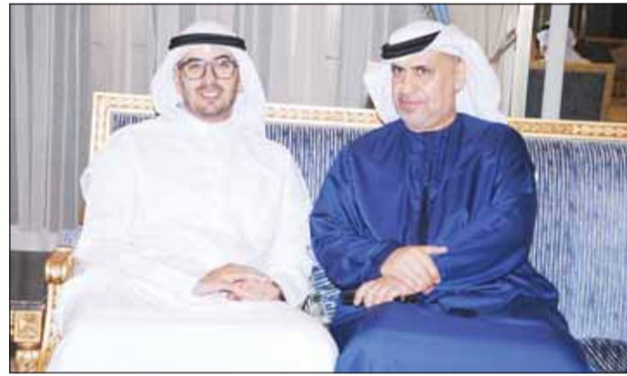
سفير الإمارات د.مطر النيايدي والشيخ أحمد الدعيج

استأنف وزير شؤون الديوان الأميري الشيخ حمد جابر العلي استقبال رواد ديوانيته الأسبوعية في منطقة سلوى، وذلك بعد إجازة عيد الأضحى المبارك، حيث ركب بالحضور الذين توافدوا كمادتهم مساء الثلاثاء لتبادل التهاني والأطاديث الودية في أجواء سادتها المحبة والألفة. وشهدت الديوانية حضور عدد من الشيوخ والشخصيات الاجتماعية والأصدقاء، الذين