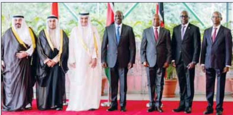
السفير أنس معرفي والرئيس الكيني وليم روتو يتوسطان مسؤولي الجانبين

قدم سفير الكويت في نيروبي أنس معرفي أوراق اعتماده إلى رئيس كينيا وليم روتو خلال مراسم رسمية أقيمت في القصر الرئاسي. وذكرت سفارة الكويت لدى كينيا - في بيان صحافي أمس الخميس - أن السفير معرفي نقل إلى الرئيس الكيني تحيات وتهاني سمو أمير البلاد الشيخ مشعل الأحمد وسمو ولي العهد الشيخ صباح خالد وسمو رئيس مجلس الوزراء الشيخ أحمد العبدالله وتمنياتهم لجمهورية كينيا الصديقة بدوام التقدم والازدهار والاستقرار. وأكد السفير معرفي خلال اللقاء متانة العلاقات الثنائية التي تربط الكويت وكينيا، إذ يصادف هذا العام ذكرى مرور 61 عاماً على إقامة العلاقات الدبلوماسية بين البلدين. وشدد على أهمية مواصلة العمل على تطوير العلاقات الثنائية وتعزيزها في مختلف المجالات بما يخدم المصالح المشتركة بين البلدين والشعبين. وأعرب السفير معرفي عن تطلعه إلى توسيع آفاق التعاون المشترك لا سيما في القطاعات الاقتصادية والتجارية والاستثمارية بما يعكس الروابط الثنائية ومرص قيادتي البلدين على تعزيز الشراكة وتوسيع المجالات.