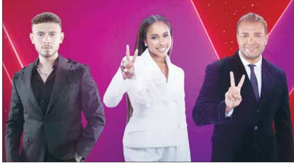
ثلاثي التحكيم في ذا فويس كيدز