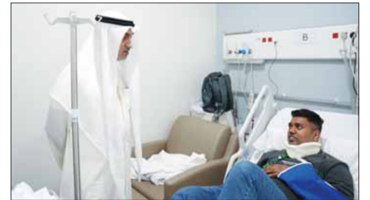
النائب الأول الشيخ فهد اليوسف لدم اطمئنانه علم أحد المصابين

الصحية أولاً بأول حتى تماثلهم للشفاء. وأشاد بجهود الكوادر الطبية وفرق الطوارئ وما أظهره من كفاءة وسرعة استجابة في التعامل مع المصابين، مثنياً الجهود الكبيرة التي بذلها رجال الأمن وما تحلوا به من جاهزية وبقظة ميدانية وسرعة في التعامل مع تداعيات الاعتداء. وأعرب عن خالص العزاء وصادق المواساة بوفاة شخص في حادث الاعتداء الأثم، سائلا المولى عز وجل أن يلهم ذويه الصبر والسلوان وأن يمن بالشفاء العاجل على المصابين.