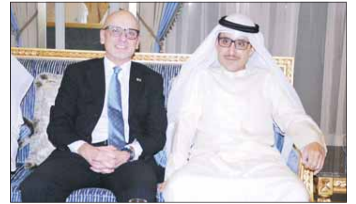
الشيخ د.أحمد ناصر المحمد وسفير إيطاليا لورنزو موريني