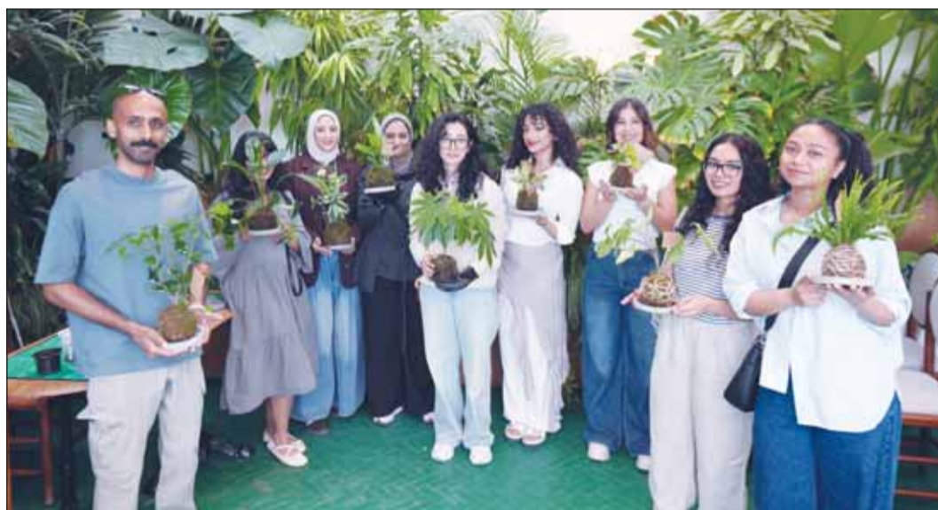
صورة جماعية للمشاركين في ورشة العمل

بمناسبة اليوم العالمي للبيئة، نظم بنك الخليج ورشة عمل لعملائه، حول إعادة تدوير بقايا القهوة وتحويلها إلى تربة صالحة للزراعة، وتمويلها إلى البيئية دانة معرفي، وذلك في إطار جهوده المستمرة لترسيخ مفاهيم الاستدامة البيئية وتعزيز الوعي المجتمعي بأهمية إعادة التدوير والحفاظ على الموارد الطبيعية.