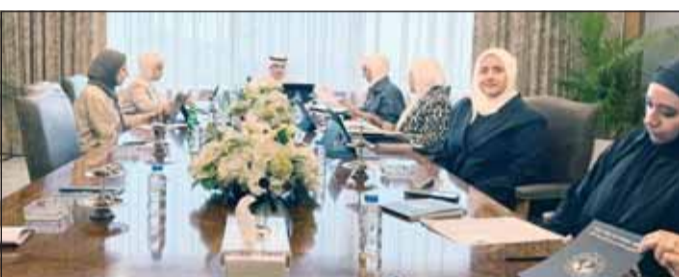
وزير العدل المستشار ناصر السميطة مترشحاً للاجتماع الخامس لهيئة القصر

ترأس وزير العدل المستشار ناصر السميطة، أمس، الاجتماع الخامس لمتابعة مجريات سير العمل في الهيئة العامة لشؤون القصر وبحث القرارات الادارية الهادفة إلى تطوير الأداء وتعزيز كفاءة الخدمات في مقر الهيئة. وذكرت "شؤون القصر" في بيان لـ "كونا" أن الوزير السميطة أكد خلال الاجتماع على أهمية الاستمرار في تطوير خدمات الهيئة وآليات إدارة استثماراتها بما يؤدي إلى الاستثمار في تحقيق عوائد مناسبة للممولين برعايتها وذلك في إطار تنفيذ استراتيجيتها الجديدة.