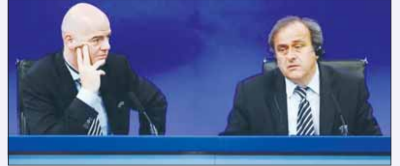
بلاتيني يشكو إنفانتينو لدم القضاء

تقدم الفرنسي ميشيل بلاتيني الاثنين بشكوى أمام القضاء في بلاده ضد رئيس الاتحاد الدولي لكرة القدم (فيفا) جياني إنفانتينو بتهمة "الافتراء" و"استغلال النفوذ"، في إطار القضية التي أنهت عام 2015 طموحه في الوصول إلى رأس الهيئة الكروية العليا، وفق بيان أرسل إلى وكالة فرانس برس. وتستهدف هذه الشكوى أيضاً مسؤولين سابقين في فيفا، وهي مرفقة بدعوى مدنية، ما سيؤدي إلى "تعيين قاضي تحقيق"، بحسب ما أوضح نجم منتخب فرنسا السابق. وتقدم بلاتيني بشكويين عاديّين في 2018 ثم في 2021 في الملف نفسه، الأولى بتهمة الافتراء ضد مجهول والثانية بتهمة استغلال النفوذ ضد إنفانتينو، وأميلنا إلى القضاء السويسري، اعتبرت الأولى ساقطة بحكم مرور الزمن، فيما حُفظت الثانية من دون ملاحقة في أكتوبر الماضي. وبالطواري، سيهاجر الفائز بالكرة الذهبية ثلاث مرات إجراء مديناً ضد الهيئة المالكة لكرة القدم العالمية "للحصول على تعويض عن مجمل الأضرار" المرتبطة بـ"المناورات التي استخدمت لمنعه من الترشح لرئاسة فيفا عام 2015"، بحسب ما جاء في البيان. وقال بلاتيني في مارس الماضي عبر إذاعة "أر أم سي"، "لن أترك الدين الحقوا بي الأذى"، في إشارة إلى القضية التي أدت إلى سقوطه كرئيس للاتحاد القاري، قبل أن تختتم في أغسطس ببراءة نهائية في سويسرا. ويرى بلاتيني أن إنفانتينو الذي كان نائبه حين تولى الفرنسي رئاسة الاتحاد الأوروبي للعبة (يويفا)، إلى جانب المدير القانوني السابق ليفيا السويسري ماركو فيليغر والرئيس السابق للجنة التحقيق السويسري الإيطالي دومينيكو سكالو "عملوا على إقصائه من سباق رئاسة" الاتحاد الدولي عبر "اتهامات لا أساس لها على الإطلاق".