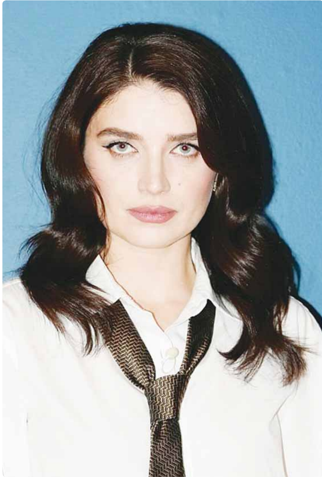
الممثلة الإيرلندية إيغ هيوسون خلال مقابلتها في برنامج تلفزيوني بنيويورك