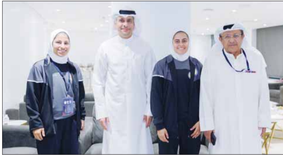
الجلاهمة والذياب مع الحكمتين العنزي والنسيم

وأشار إلى أن البطولة تضم متفرجين بارزين ما يضيء عليها طابعاً فنياً عالياً وهو ما أظهرته الفرق منذ اليوم الأول "بل وصل الأمر لأن تكون بطولة الأندية أقوى