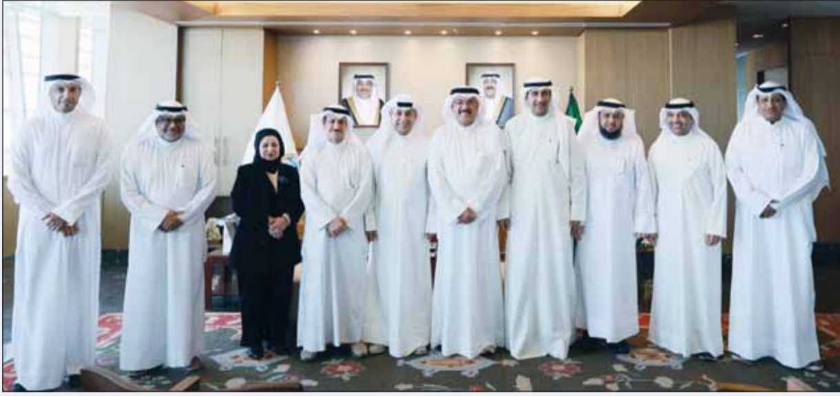
وزير التربية سيد جلال الضباطي متوسلاً مع وفد جمعية الضباط المتقاعدين

التنسيق وتشكيل فرق عمل بين الجهتين لتبادل الروى بشأن المبادرات والمشروعات التي من شأنها دعم العملية التعليمية، وتعزيز الشراكة المجتمعية، بما يواكب توجيهات وزارة التربية نحو توفير بيئة مدرسية أكثر أمناً واستقراراً تسهم في تحقيق الأهداف التربوية والتعليمية المنشودة.