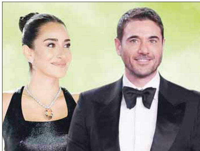
أحمد عز وأمينة خليل