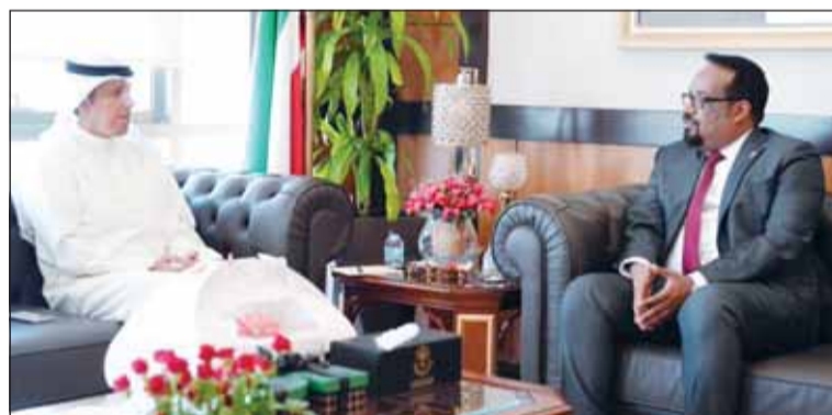
وزير الأوقاف د.محمد الوسمي خلال لقائه سفير إثيوبيا د.سعيد جبيل