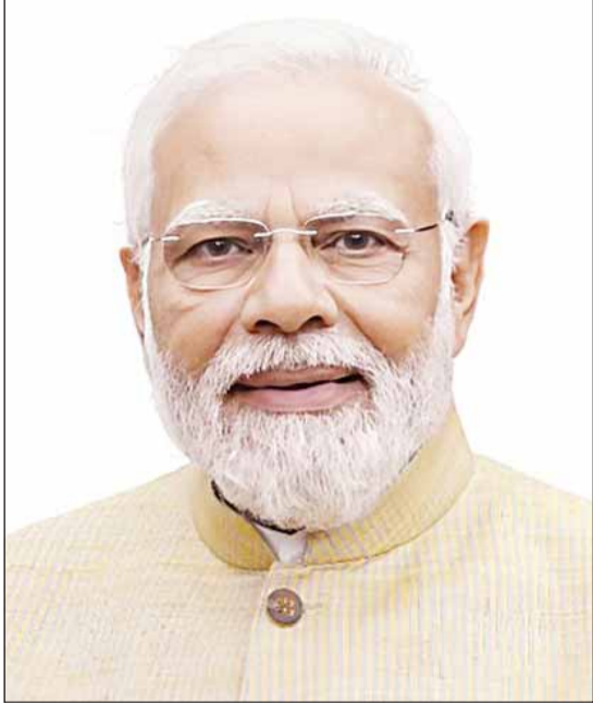
رئيس الوزراء الهندي ناريندرا مودي