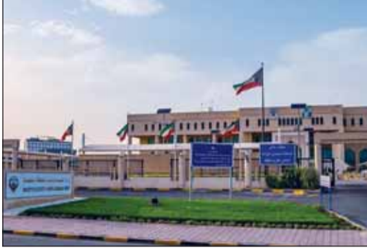
مبنى وزارة الكهرباء والماء والطاقة المتجددة

قرر مجلس إدارة الجهاز المركزي للمناقصات تمديد فترة التأمين الأولي للشركات الثلاث المشاركة بمناقصة توريد وتركيب وتشغيل وصيانة وحدات توربينية غازية تعمل بنظام الدورة المركبة لزيادة الطاقة الكهربائية بموقع محطة الصبية للقوى الكهربائية و تقطير المياه) 900 ميغاواط (-) المرحلة الرابعة) التي ستنفذها وزارة الكهرباء والماء والطاقة المتجددة.