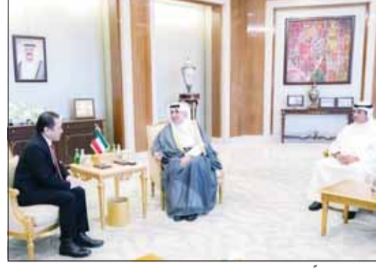
... ومستقبلاً سفير بروناي دار السلام الصديقة سوليني سعيد