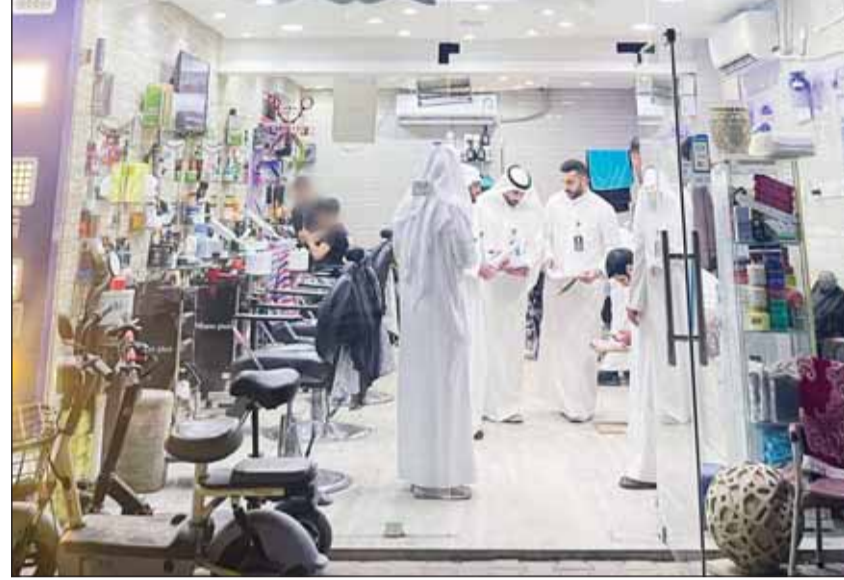
جانب من الحملات التفتيشية على الصالونات والمعاهد الصحية

الخدمة تشمل المستحضرات والمكملات الغذائية الواردة من الخارج