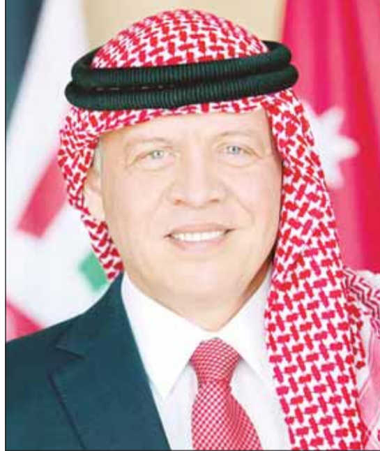
العاقل الأردني الملك عبدالله بن الحسين