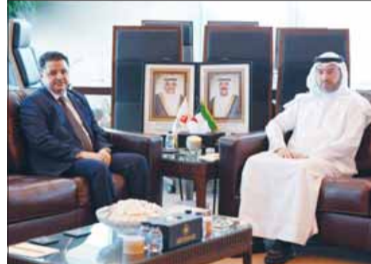
الشيخ حمد جابر العلي سفير بروناي دار السلام مع السفير الأردني سنان المجالي

بحث رئيس الهيئة العامة للطيران المدني الشيخ المهندس حمود المبارك الصباح مع سفير المملكة الأردنية الهاشمية لدى البلاد سنان المجالي سبل تعزيز التعاون المشترك بين البلدين الشقيقين في مجال الطيران المدني. وقالت الهيئة - في بيان - إنه تم خلال اللقاء استعراض أوجه التعاون والتنسيق بين البلدين وبمقتضى سبل تطويرها بما يدعم قطاع النقل الجوي ويعزز تبادل الخبرات في المجالات الفنية والتشغيلية. وأضافت: إن الجانبين ناقشا عدداً من الموضوعات ذات الاهتمام المشترك في مجال الطيران المدني بما يسهم في تطوير منظومة النقل الجوي وفق أفضل الممارسات والمعايير الدولية. وأفادت بأن الجانبين أكداً أهمية مواصلة التعاون والتنسيق المشترك بما يعزز العلاقات الثنائية بين البلدين ويدعم آفاق التعاون في المجالات المرتبطة بقطاع الطيران المدني.