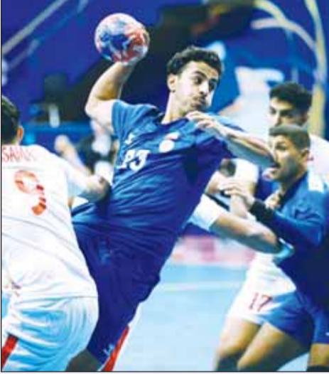
أزرق اليد بالمستوى الرابع بالقرعة

تقام في العاشرة من صباح اليوم، قرعة بطولة العالم للمنتخبات لكرة اليد بنسختها الـ 30 والمقرر إقامتها في ألمانيا يناير 2027. وستنقل القرعة عبر موقع الاتحاد الدولي لليد في "يوتيوب".