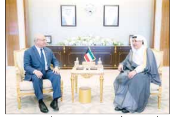
وزير شؤون الديوان الأميري مستقبلاً سفير بنغلاديش سيد طارق حسين

استقبل وزير شؤون الديوان الأميري الشيخ حمد جابر العلي سفير جمهورية بنغلاديش الشعبية الصديقة لدى دولة الكويت سيد طارق حسين. وتم خلال اللقاء بحث العلاقات المتميزة التي تربط البلدين الصديقين وسبل دعمها وتطويرها في مختلف المجالات بما يخدم المصالح المشتركة ويعزز أطر التعاون القائم بينهما. وناقش الجانبان عدداً من القضايا ذات الاهتمام المشترك وأقر المستجدات على السامتين الإقليمية والدولية وتطورات الأوضاع التي تشهدها المنطقة والتأكيد على دعم الجهود الرامية إلى تعزيز الأمن والاستقرار. واستقبل وزير شؤون الديوان الأميري الشيخ حمد جابر العلي سفير بروناي دار السلام الصديقة لدى دولة الكويت سوليني سعيد. وتم خلال اللقاء استعراض العلاقات الطيبة التي تجمع البلدين الصديقين وسبل تعزيزها وتنميتها بما يسهم في فتح آفاق أرحب للتعاون الثنائي في مختلف المجالات. كما تم تبادل وجهات النظر حول عدد من الموضوعات ذات الاهتمام المشترك وبمقتضى التطورات على السامتين الإقليمية والدولية.