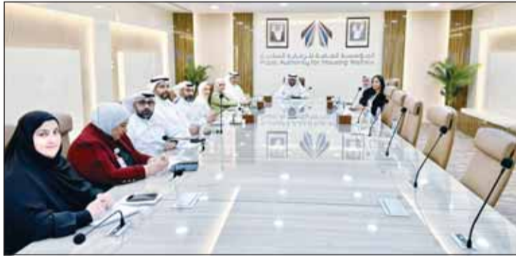
جانب من اجتماع مسؤولي "السكنية" وتكنولوجيا المعلومات

تسريع الاستجابة ورفع مستوى جودة الخدمات.