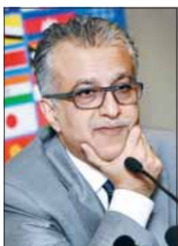
الشيخ سلمان بن إبراهيم

من المنتخبات الآسيوية يبلغ تسعة منتخبات إلى نهائيات كأس العالم يعكس حجم التقدم الذي تشهده كرة القدم في القارة. وأشار إلى أن المنتخبات الآسيوية لا تمثل دولاً فقط بل تحمل معها آمال وتطلعات مليارات الجماهير في القارة داعياً اللاعبين والأجهزة الفنية إلى خوض المنافسات بروح الشجاعة والإصرار والالتزام بقيم اللعب النظيف والعمل على كتابة فصل جديد من النجاحات الآسيوية في أكبر حدث كروي عالمي.