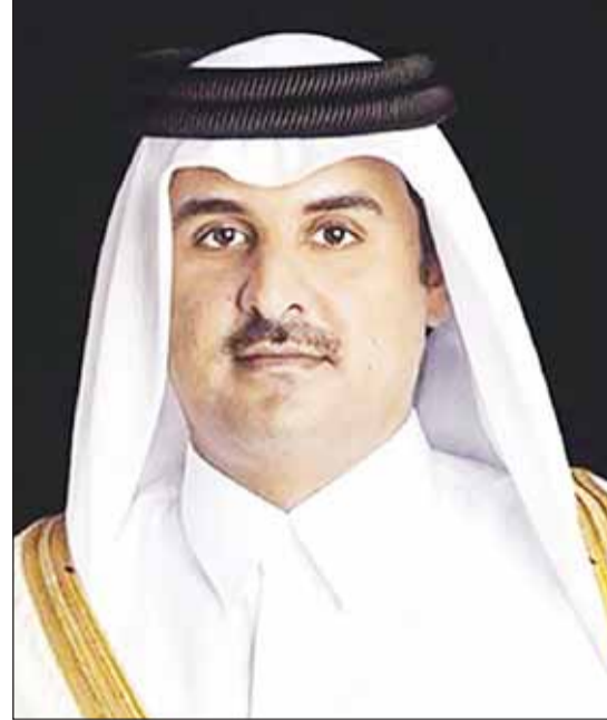
أمير قطر الشيخ تميم بن حمد