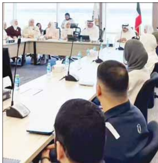
فريق حوكمة "الأشغال" خلال لقاءه موظفيه بمبنى T2

يذكر أن وزارة الكهرباء والماء والطاقة المتجددة الجهة ذات الشأن بتنفيذ مشروع المحطة الذي تعمل عليه بشكل كبير في إضافة 900 ميغاواط إلى إجمالي إنتاجية الطاقة في البلاد. وكان الجهاز المركزي للمناقصات العامة قد قرر تأهيل 3 شركات للتنافس على المناقصة والمطابقين للمواصفات والشروطات ومن المتوقع خلال المدة المحددة الانتهاء من إجراءات طرح المشروع واستكمال الخطوات الخاصة بموافقات