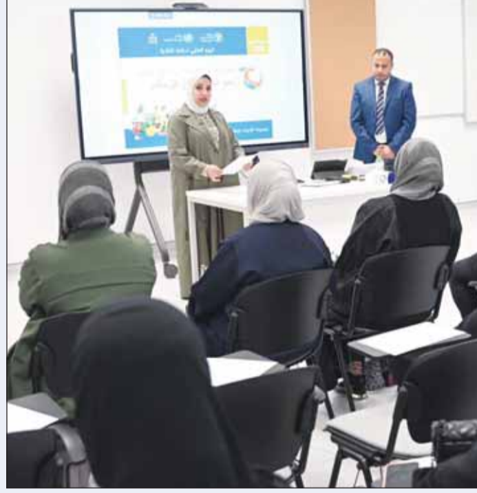
جانب من البرنامج

أطلقت وزارة الصحة - ممثلة بإدارة التغذية والإطعام - برنامجاً تدريبياً متخصصاً لتطبيق نظام إدارة سلامة الغذاء (ISO 22000:2018) والتدقيق الداخلي وإعداد كبار المدققين المعتمدين دولياً، بالتزامن مع اليوم العالمي لسلامة الأغذية، وفي إطار التزام الوزارة بتعزيز منظومة سلامة الغذاء والارتقاء بجودة الخدمات الغذائية المقدمة في المؤسسات الصحية.