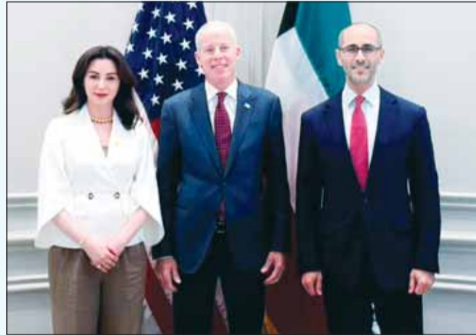
الشيخ نواف السعود، وزير الطاقة الأميركي، والشيخة الزين الصباح

عقد نائب رئيس مجلس الإدارة والرئيس التنفيذي لمؤسسة البترول الكويتية الشيخ نواف سعود الناصر الصباح اجتماعاً مع وزير الطاقة الأميركي كريست رايت في واشنطن، بحضور سفيرة دولة الكويت لدى الولايات المتحدة الأميركية الشبيخة الزين صباح الناصر الصباح.