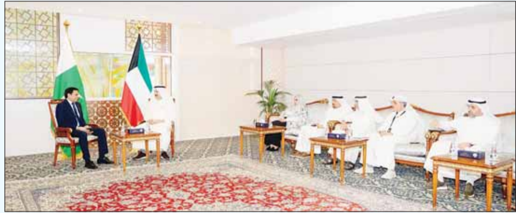
وزير المالية د. يعقوب الرفاعي، أثناء استقباله سفير باكستان لدمع البلاد د. ظفر إقبال

بحث وزير المالية د. يعقوب الرفاعي أمس، مع سفير جمهورية باكستان الإسلامية لدى دولة الكويت د. ظفر إقبال سبل تعزيز العلاقات والتعاون المتميزة بين البلدين في شتى المجالات وتعزيز التعاون المشترك وتوسيع آفاق الشراكة بين الجانبين. وقالت وزارة المالية في بيان صحفي إنه تم خلال اللقاء مناقشة أفر التطورات المتعلقة بالتوقيع النهائي على اتفاقية التجارة