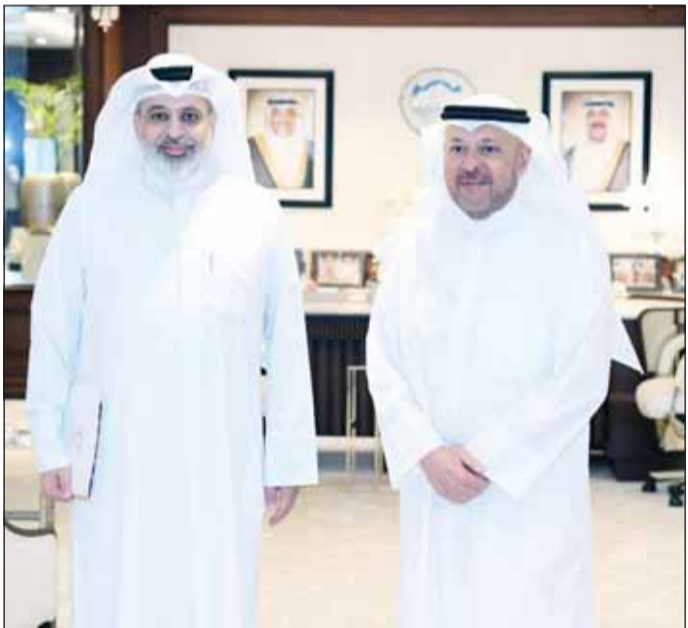
الشيخ عذيب الناصر ومضام الخميس

استقبل محافظ الفروانية الشيخ عذيب الناصر، في مكتبه بديوان عام المحافظة، الأمين العام للملتقى الإعلامي العربي الماضي الخميس. وتناول اللقاء عدداً من الموضوعات ذات الاهتمام المشترك، لا سيما دور الإعلام في إبراز الجهود التنموية والخدمية، وأهمية تعزيز الشراكة بين المؤسسات الرسمية والجهات الإعلامية بما يسهم في دعم الرسالة الوطنية وترسيخ الوعي المجتمعي. أكد المحافظ الناصر حرص محافظة الفروانية على الانفتاح والتواصل مع مختلف المؤسسات الإعلامية والشخصيات المهنية المؤثرة، مشيداً بالدور الذي يقوم به الملتقى الإعلامي العربي في دعم الحوار الإعلامي وتبادل الخبرات بين الإعلاميين العرب من جانبه، أعرب الخميس عن شكره وتقديره للمحافظ على حسن الاستقبال، مثنياً للجهود التي تبذلها محافظة الفروانية في خدمة المواطنين والمقيمين، ومؤكداً أهمية استمرار التعاون والتعسيق فيما يخدم العمل الإعلامي ويعزز القضايا التنموية والمجتمعية.