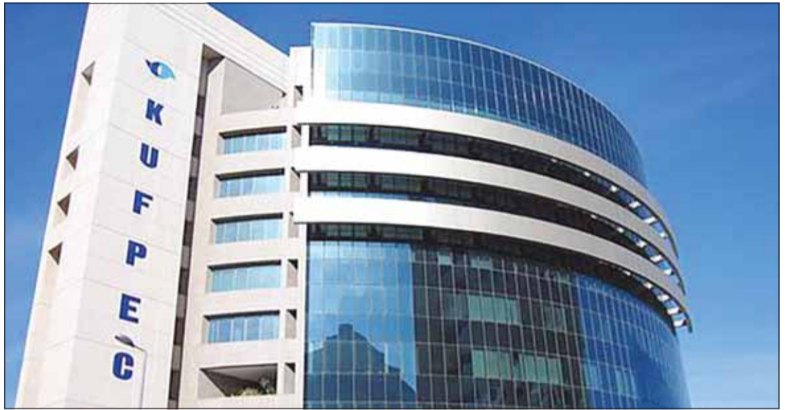
مقر الشركة الكويتية للاستكشافات البترولية الخارجية "كوفيك"

هبطت من 226 مليون دينار في 2024 إلى 107 ملايين العام الماضي