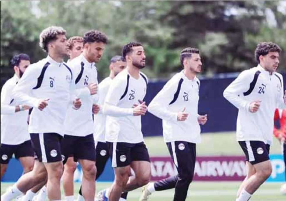
وفد طبيه تواجد فيه تدريبات منتخب مصر

أجرى لاعبو منتخب مصر المتواجدين في مدينة سبوكن الأمريكية تحليلاً لكشف المنشطات، ضمن سلسلة من الإجراءات قبل المشاركة في بطولة كأس العالم لكرة القدم بالولايات المتحدة الأمريكية وكندا والمكسيك. وذكر المركز الإعلامي للاتحاد المصري لكرة القدم أمس، أن هناك وفداً طبيياً من الاتحاد الدولي للعبة (فيفا) تواجد في مقر البعثة وقام بعمل تحليل لعدد من اللاعبين وجاء الاختيار بشكل عشوائي. كما أضاف المركز أنه "من المتعارف عليه أن زيارة لجنة المنشطات للمنتخبات تكون بغير ترتيب مسبق لأخذ عينات من اللاعبين في أي وقت قبل وخلال البطولات". ويشترك المنتخب المصري في كأس العالم للمرة الرابعة بعد نسخ 1934 و1990 و2018، حيث أوقعته القرعة في المجموعة السابعة بمرحلة المجموعات برفقة منتخب نيوزيلاندا وإيران بالإضافة للمنتخب البلجيكي. كما يبحث المنتخب بقيادة مديره الفني المحلي حسام حسن، عن تحقيق انتصاره الأول في المونديال، والتأهل للدور الإقصائي للمرة الأولى في تاريخ الفريق.