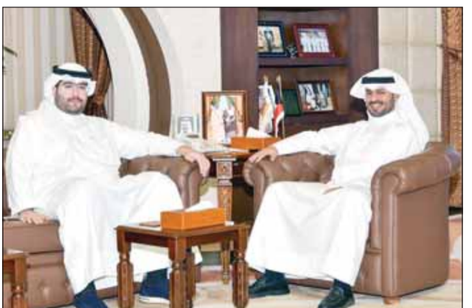
الشيخ صباح البدر خلال استقباله عبدالله الخبز

استقبل محافظ مبارك الكبير ومحافظ حولي بالتكليف الشيخ صباح بدر السالم، في مكتبه بديوان المحافظة أمس، المدير العام لمصنع الأغذية عبدالله الخبز. وتناول اللقاء عدداً من الموضوعات المتعلقة بالأمن الغذائي وتطوير قطاع الصناعات الغذائية، وبحث السبل الكفيلة بتحسين جودة الإنتاج الوطني ورفع كفاءته بما يلبي احتياجات السوق المحلي. كذلك ناقش الجانبان أهمية تعزيز الرقابة وتطوير خطوط الإنتاج لحماية صحة المستهلك وضمان سلامة المنتجات الغذائية، حيث أكد المحافظ أهمية دعم المنشآت الصناعية الوطنية وتدليل العقبات التي تواجهها، بما يسهم في تعزيز منظومة الأمن الغذائي والارتقاء بمستويات الجودة والسلامة.