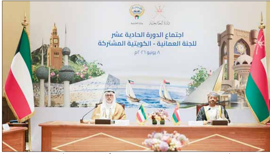
وزير خارجية الكويت الشيخ جراح الجابر ونظيره في سلطنة عمان بدر البوسعيد يجلسان في اجتماع اللجنة المشتركة