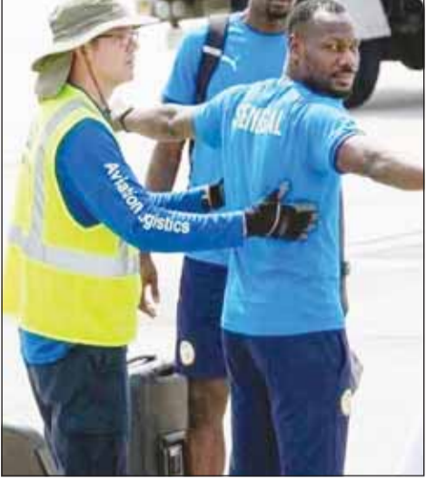
تفتيش منتخب السنغال