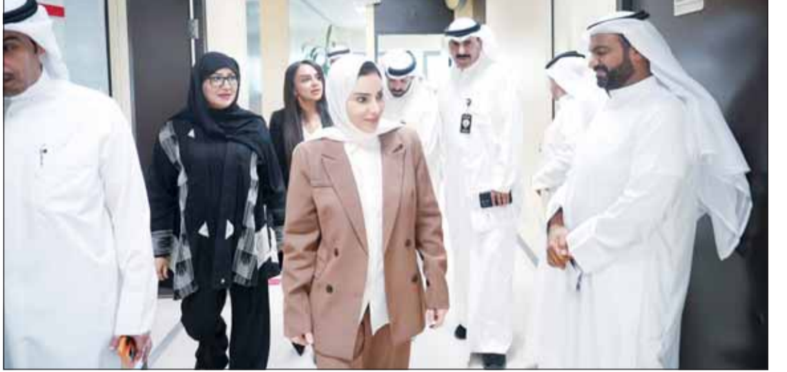
وزيرة "الشؤون" د. أمثال الحويلة خلال جولتها في قطاعات وإدارات الوزارة

تقليص الدورة المستندية وتسريع المعاملات وخطط التحول الرقمي