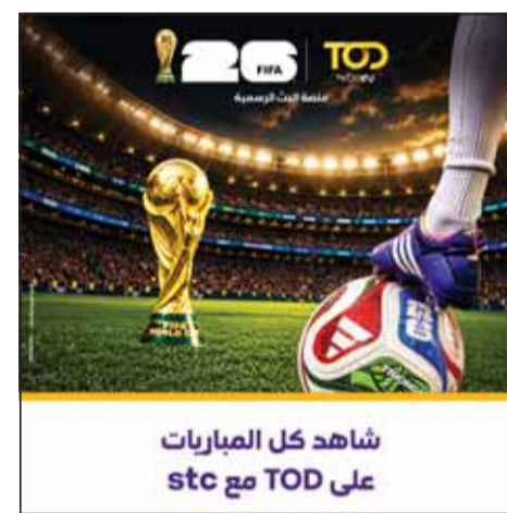
شاهد كل المباريات على TOD مع stc

أعلنت شركة الاتصالات الكويتية stc، الرائدة في تمكين التحول الرقمي وتقديم خدمات ومنصات مبتكرة للعملاء في الكويت، عن شراكة استراتيجية مع منصة TOD، الرائدة في مجال بث المحتوى الرياضي والترفيهي في منطقة الشرق الأوسط وشمال إفريقيا، وذلك قبيل انطلاق بطولة كأس العالم FIFA 2026. وبموجب هذه الشراكة، سيتمكن عملاء stc من الاستمتاع بمشاهدة البث المباشر لجميع مباريات هذا الحدث الرياضي العالمي المرتقب، من خلال مجموعة من خيارات الاشتراك المرنة المصممة خصيصاً لتلبية احتياجاتهم ومتطلباتهم المختلفة. وتعكس هذه الشراكة التزام stc المستمر بتعزيز باقة خدماتها الرقمية المتكاملة، ومنح قيمة مضافة لعملائها من خلال التعاون الاستراتيجي مع كبرى شركات المحتوى.