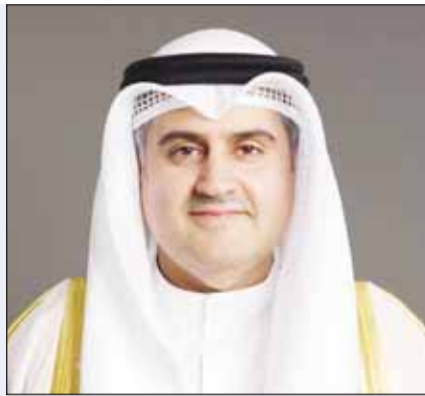
وزير العدل المستشار ناصر السميطة

□ تمديد فترة بقاء الإشعارات في "سهل" من 3 أشهر إلى سنتين ومعالجة إشكالات إلغاء "هويتي"