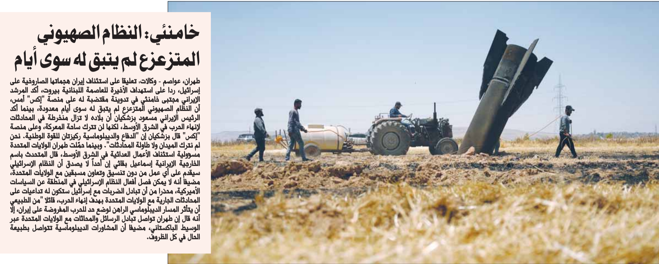
مزارعون سوربون في حقل زراعي محترق فيما يبدو حطام صاروخ إيراني سقط خلال المواجهة بين إيران وإسرائيل أمس

طهران زعمت تعليق العمليات العسكرية بعد "توجيه رد مؤلم"... وتل أبيب: وقف النار في إيران ولكن ليس في جنوب لبنان وسنرد على أي صواريخ