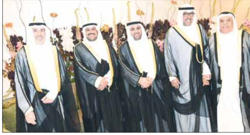
الشيخ ضاري الفهد مهنتاً