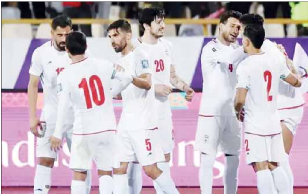
معسكر منتخب إيران في تيخوانا

ووصل اللاعبون والطاقم المرافق إلى مطار شديد الحراسة، فضع لدوريات جنود الحرس الوطني المكسيكي، حيث كان في انتظارهم عدد قليل من المشجعين لوموا بالأعلام الإيرانية. وتفاقم الخلاف بين إيران والولايات المتحدة بعدما رفضت الأخيرة منح تأشيرات دخول لبعض أفراد الطاقم المرافق للفريق، قبل أيام فقط من انطلاق كأس العالم 2026 غداً، وهي النسخة التي تستضيفها الولايات المتحدة والمكسيك وكندا. وغادر المنتخب الإيراني تركيا، حيث كان يقيم معسكراً لمدة 15 يوماً، السبت إلى المكسيك.