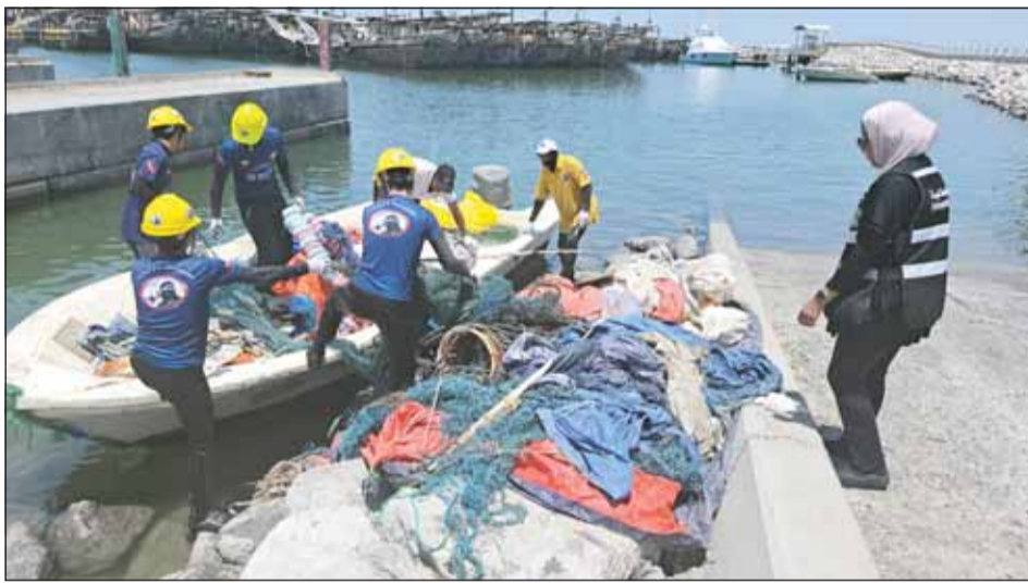
فريق الغوص التطوعي يرفع أسماكاً نافقة من ساحل البدع

كبرى مهملات كانت تشكل عائقاً أمام حركة القوارب وتهديدا مباشرا للكائنات البحرية. وبين أن العمليات امتدت لتشمل جون الكويت، داعياً مرتادي البحر والصيديين وهواة الأنشطة البحرية إلى ضرورة تحمل المسؤولية المشتركة والمحافظة على سلامة الجبل والمحيطات.