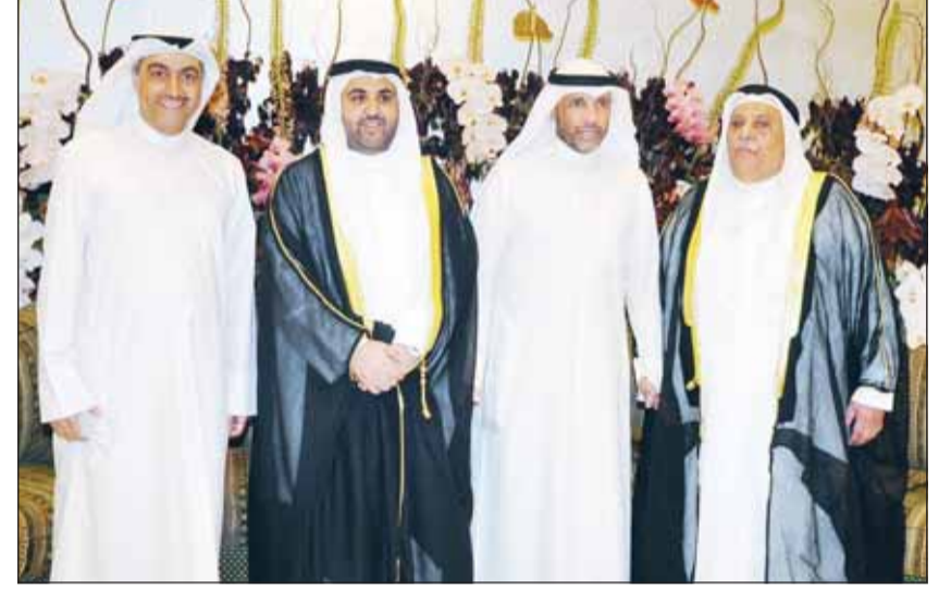
تهنئة من مرزوق الغانم