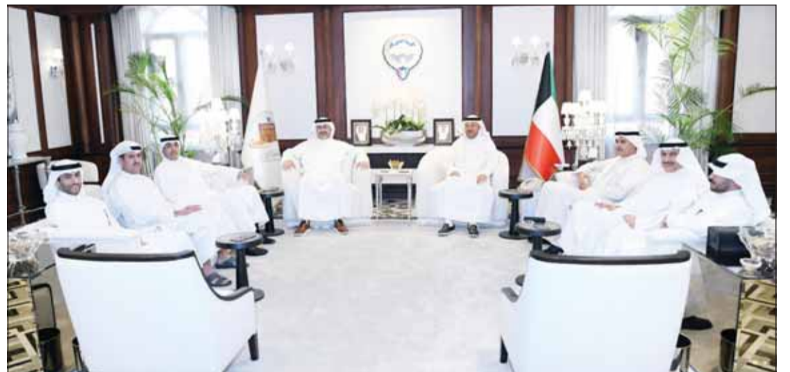
جانب من اللقاء الذي جمع المحافظين مع الأمين العام لمنظمة المدن العربية

العمل العربي المشترك ويخدم أهداف التنمية والتطوير. وأشار إلى إشادة المحافظين بالدور الذي تقوم به منظمة المدن العربية في دعم العمل التنموي العربي المشترك، مؤكدا أهمية تعزيز التعاون مع المنظمة والاستفادة من برامجها ومبادراتها النوعية في دعم التنمية المحلية وتبادل الخبرات والمعارف بين المدن والمحافظات العربية.