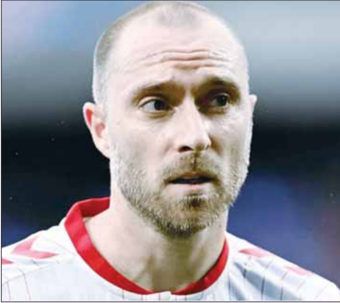
الدنماركي كريستيان إريكسن

والمخاوف المستمرة بشأن حالته الصحية. وقال طبيب المنتخب الدنماركي لكرة القدم أمسن، إن اللاعب كريستيان إريكسن "في حالة معنوية جيدة" ومن المتوقع أن يغادر المستشفى قريباً، بعد تعرضه لانهايار جديد أثناء اللعب مع منتخب الدنمارك.