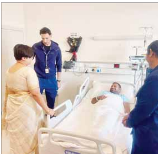
السفيرة باراميتا تريباتي لدى زيارتها المواطنين الهنود المصابين

زارت السفيرة الهندية لدى البلاد باراميتا تريباتي المواطنين الهنود الذين أصيبوا خلال العدوان الإيراني على مطار الكويت الدولي في 3 يونيو الجاري، وذلك في مستشفى جابر. وقد استفسرت السفيرة عن أحوالهم، وأكدت لهم دعم السفارة الكامل ومساعدتها لهم. كما تحافظ السفارة على اتصال وتنسيق وثيق مع المستشفى وعائلات المصابين. ومن بين المواطنين الهنود الـ 13 الذين تم إدخالهم إلى مستشفيات مختلفة، فرج الجميع باستثناء 4 لا يزالون يتلقون العلاج.