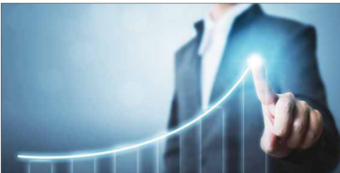
الاستثمار في تكنولوجيا المعلومات يستقطب رؤوس الاموال