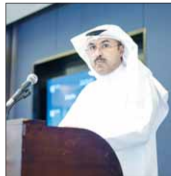
جانب من كلمة المحيلان

البنية الرقمية للمشاريع العمرانية الكبرى، بما يضمن جاهزيتها للتعامل مع متطلبات الاقتصاد الرقمي في المستقبل، ويعزز من تنافسية الكويت كمركز حضري متقدم في المنطقة.