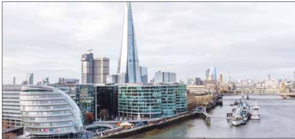
لندن تستضيف مؤتمر البورصات الخليجية الخامس