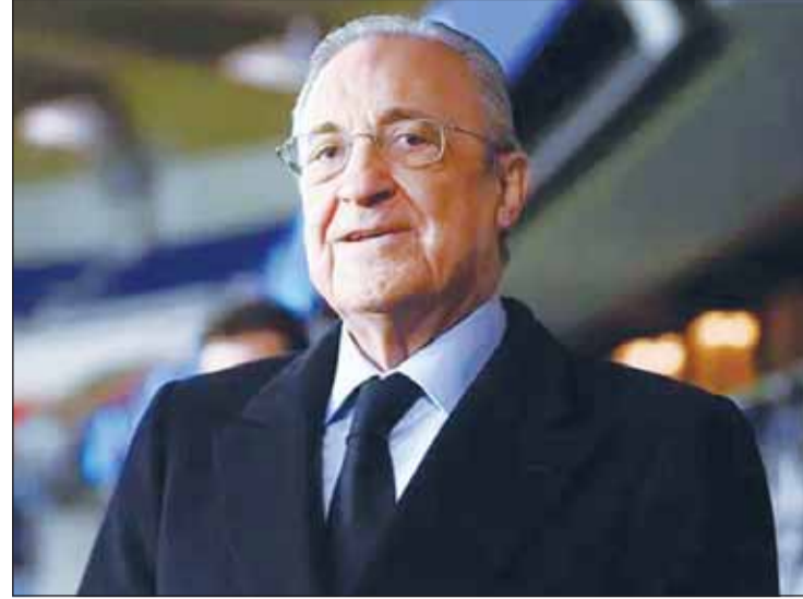
فلورنتينو بيريز مستمراً برئاسة ريال مدريد

أمس، وعد بيريز بتعيين مدرب بنفخيا جوزيه مورينيو على رأس الإدارة الفنية للفريق.