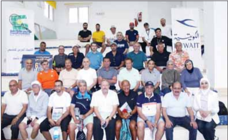
جانب من المشاركين في عربية رواد التنس

مكائنها ضمن أجندة الاتحاد العربي للتنس. وذكر المطيري أن الاتحاد العربي أصر على استمرار النشاط وتنظيم البطولة رغم التحديات والظروف التي تحيط بالمنطقة، منوهاً بأن المشاركة المميزة من اللاعبين واللاعبات دليل على المصداقية والتعاون المتبادل بين المجمع والحرص على ثبات الجدول الزمني لأجندة الاتحاد.