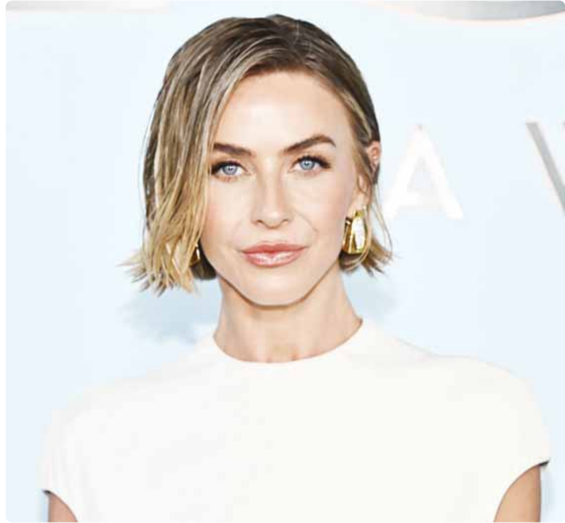
الممثلة الأميركية جوليان هوف خلال توزيع جوائز توني في نيويورك