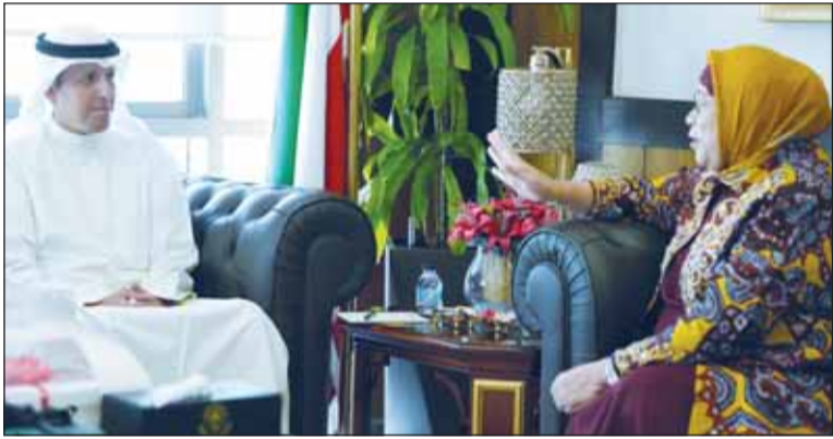
الوزير د. محمد الومسيه خلال استقباله السفيرة لينا ماريتا

بحث وزير الأوقاف والشؤون الإسلامية الدكتور محمد الومسيه مع سفيرة جمهورية إندونيسيا لدى دولة الكويت لينا ماريتا، أمس، سبل تعزيز التعاون في المجالات ذات الاهتمام المشترك بما يخدم مصالح البلدين الصديقين. وذكرت وزارة الشؤون الإسلامية في بيان (كونا) أن الجانبين أكدا أهمية مواصلة التنسيق في المجالات المرتبطة بالشؤون الإسلامية والتعاون وتبادل الخبرات بما يسهم في تعزيز العلاقات المتميزة وتحقيق الأهداف المشتركة.