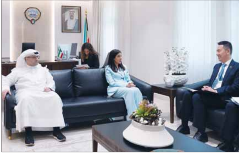
وزيرة الأشغال د. نورة المشعان خلال لقائها السفير الصيني ياغ شين

□ السفير الصيني: مواصلة دعم مشروعات التعاون التنموي مع الكويت