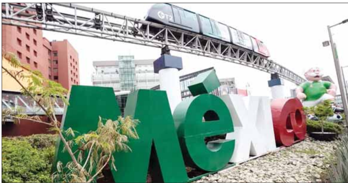
العواصف عائق أمام افتتاح كأس العالم

على مجريات البطولة بأكملها. وتبستب الأمطار الغزيرة التي هطلت على مكسيكو سيتي في إغراق الشوارع بالمياه، كما تأثرت وسائل النقل العام، حيث توقفت بعض خطوط المترو عن العمل واضطرت السلطات إلى إغلاق مداخل عدد من المحطات. وقد تسبب العواصف في اضطرابات واسعة خلال مناقسات كأس العالم التي تستضيفها المكسيك بالاشتراك مع الولايات المتحدة وكندا. وخلال بطولة كأس العالم للأندية التي أقيمت في الولايات المتحدة العام الماضي، تأجلت عدة مباريات بسبب مخاطر الصواعق.