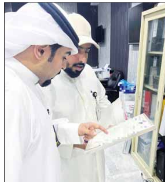
التدقيق على الرخص التجارية