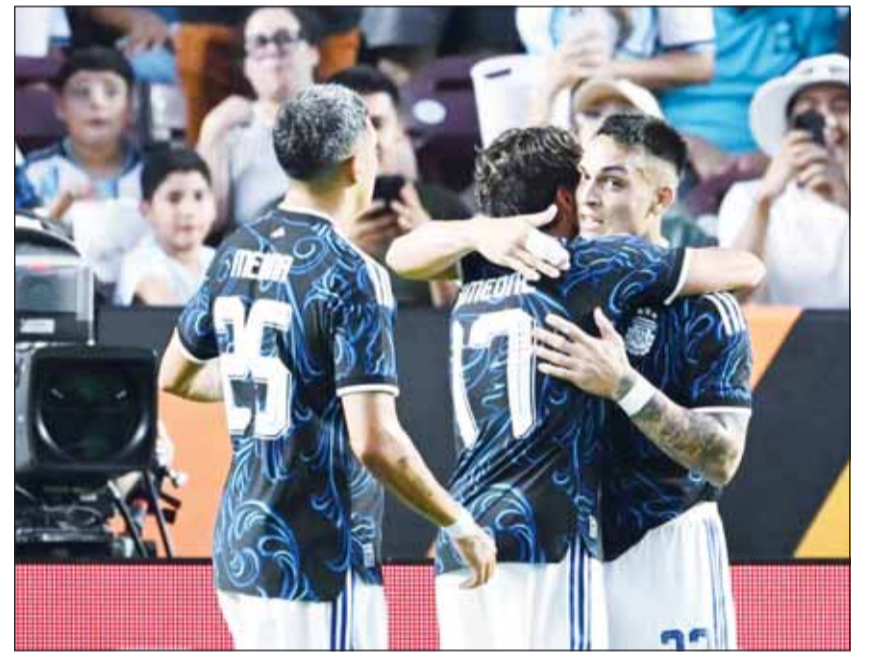
الأرجنتيين عبرت هندوراس ودياً

ومدحت ذلك خلال البروتوكول الأولي للمباراة الودية، عندما كان اللاعبون يتوقعون سماع النشيد الوطني الأرجنتيني ضمن مراسم ما قبل المباراة، وبدلاً من ذلك، بدأت أغنية "بومبون أسيسينو"، التي اشتهرت بها فرقة لوس بالميراس.