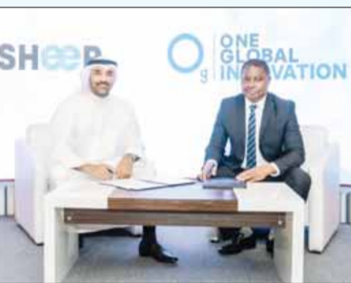
جانب من توقيع اتفاقية الشراكة

وقعت شركة "كاشير" اتفاقية تعاون استراتيجية مع OG Innovation، الذراع التقنية لمجموعة One Global، في خطوة تهدف إلى تعزيز مكانة الشركتين في سوق الحلول الرقمية وخدمات الدفع الآلي، ودعم التحول الرقمي في قطاع الأعمال والمطاعم والتجزئة.