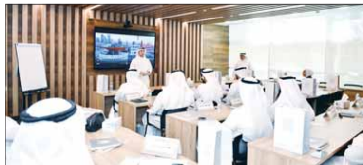
جانب من البرنامج التدريبي

انطلق امس ، البرنامج التدريبي المتخصص لـ "شهادة محكم وموفق تجاري معتمد والتحكيم في منازعات المؤسسات المالية الإسلامية"، والذي يأتي بتمرة تعاون ستراتيبي بين مركز الكويت للتحكيم التجاري التابع لفرقة تجارة وصناعة الكويت، ومعهد الدراسات المصرفية. ويهدف هذا البرنامج، الذي يمتد على مدار شهر كامل، إلى إعداد وتأهيل كوادر وطنية وخبرات متخصصة قادرة على فض النزاعات التجارية والمالية وفق أعلى المعايير الدولية والشرعية، مما يعزز من مكانة البيئة الاستثمارية والقانونية في دولة الكويت.