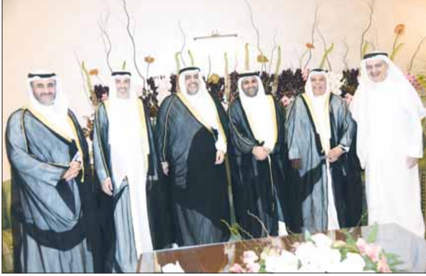
الشيخ خليفة والشيخ عبدالله علي الخليفة يهنتان