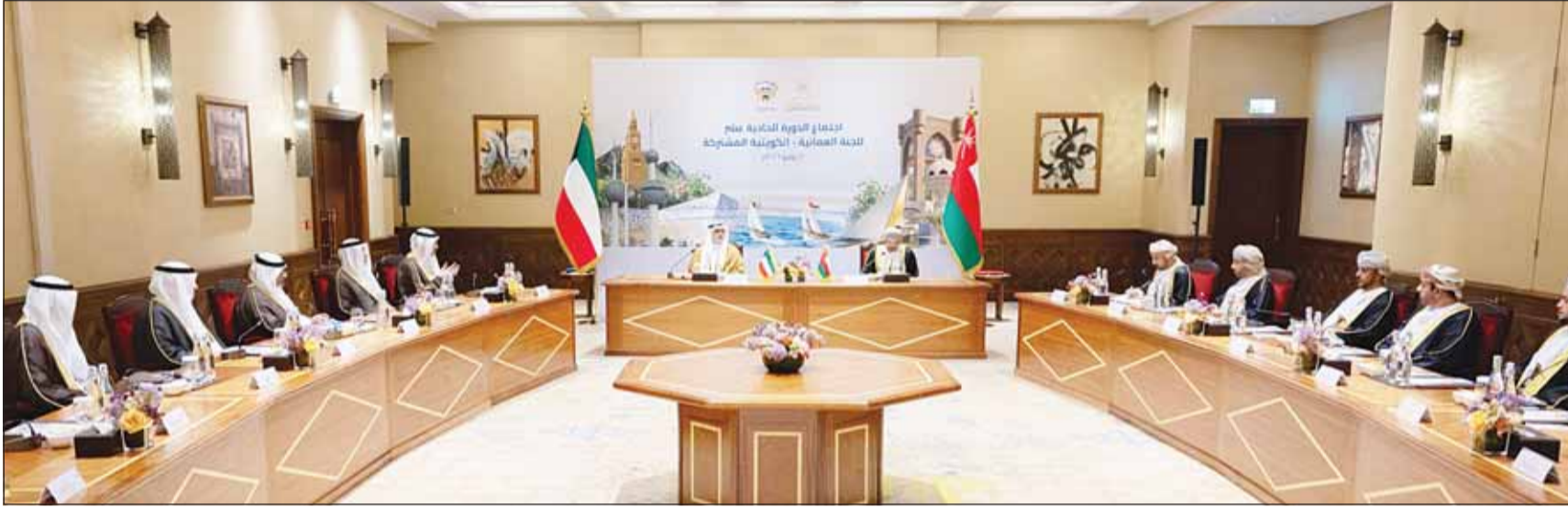
وزير الخارجية الشيخ جراح الجابر ونظيره بدر البوسعيد في اجتماع اللجنة

السيبراني، وبرنامج تنفيذي لمذكرة التفاهم في مجال التقييس للفترة من 2026 إلى 2030. كما حضر وزير الخارجية مآدبة عشاء أقامها نظيره العماني على شرفه وأعضاء الوفد الكويتي المشارك في أعمال اللجنة المشتركة.