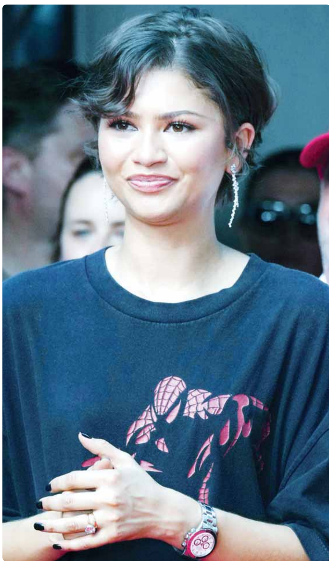
الممثلة الأميركية زيندايا خلال حضورها فيلم "سبايدر مان: يوم جديد" في باريس

فإن اقتنع البعض منا بهذا المفهوم، ولم يندب الفرد منا حظه، فسوف تنخفض مشاعر التوتر والكآبة، والحرز والمسد التي يعاني منها الكثيرون، أي تحمسن حالتهم الصحية.