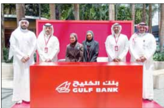
فريق المبيعات فرع بنك الخليج يستقبل رواد مول 360

الشهري. من جهة أخرى، ومع بداية موسم الإجازات الصيفية يتواجد فريق مبيعات بنك الخليج في مول 360 اعتباراً من اليوم ولمدة ثلاثة أيام للرد على استفسارات الرواد حول منتجات البنك المتنوعة.