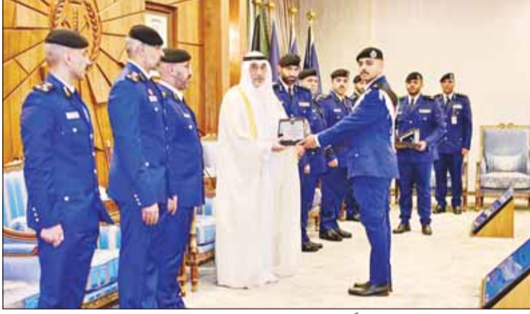
الشيخ فهد اليوسف يكرم خريجاً

نعتر بتضحيات رجال الإطفاء... ونحني استمراهم في أداء واجبهم بتميز واقتدار