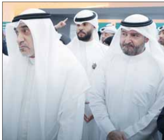
الشيخ فهد اليوسف ورئيس مجلس إدارة بيت التمويل حمد المرزوق