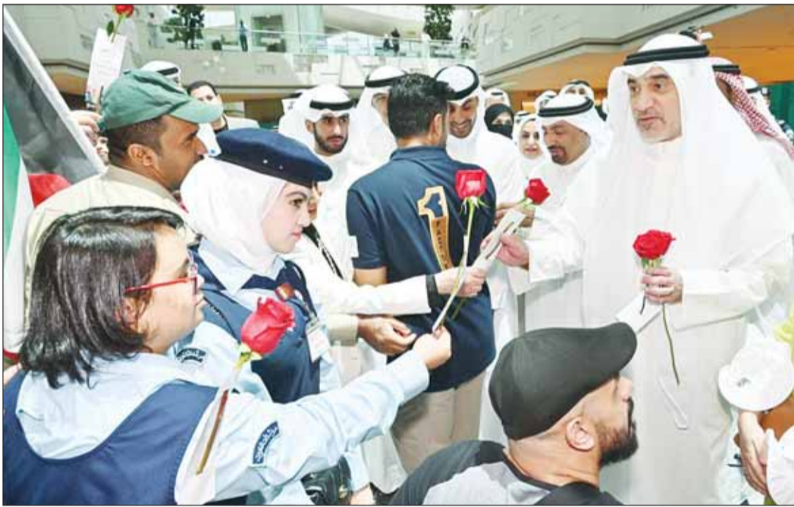
النائب الأول الشيخ فهد اليوسف لدم افتتاح حملة "وطن يحميك" يتلقم ورداً من مرشدات الكويت

أكد النائب الأول لرئيس مجلس الوزراء وزير الداخلية الشيخ فهد اليوسف أن الأجهزة الأمنية تمكنت من ضبط نحو 95% من شحنات المخدرات التي تحاول دخول البلاد، وذلك بفضل التعاون والتنسيق بين مختلف الجهات المعنية، كاشفاً - خلال رعايته وحضوره انطلاق الحملة التوعوية "وطن يحميك" - عن أن الكويت لم تشهد دخول أي شحنة مخدرات عبر المنافذ البرية منذ أكثر من 6 أشهر، كما لم تدخل أي شحنة عبر البحر منذ أكثر من عام. (راجع ص5) وأضاف النائب الأول أن قانون المخدرات الجديد كان له أثر مباشر في الحد من دخول المخدرات إلى البلاد، مؤكداً أن نسبة التهريب انخفضت بما لا يقل عن 80 في المئة، فيما ارتفعت أسعار المخدرات داخل السوق بنسبة تراوحت بين 200 و300 في المئة، الأمر الذي يعكس نجاح القانون في تضيق الخناق على تجار السموم. وفيما أشار إلى أن الكويت كانت في السابق تستقبل المخدرات عبر البر والبحر والجو، أكد أن الوضع تغير بشكل كبير بعد تطبيق المنظومة الأمنية الجديدة، لافتاً إلى أن تجار المخدرات يبتكرون باستمرار وسائل جديدة للتهريب، إلا أن الأجهزة الأمنية تسبقهم