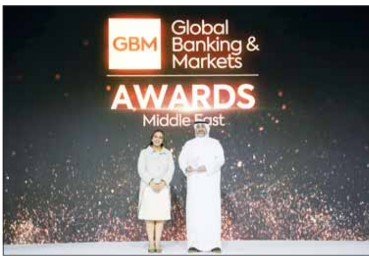
ممثل "المالية" أثناء استلام جائزة صفقة العام في أسواق الدين

حققت وزارة المالية إنجازاً دولياً بحصولها على جائزة صفقة العام "Deal of the Year" في فئة Global Banking & Markets Middle East Awards 2026 تقديراً لنجاحها في إدارة الإصدار السيادي الذي استقطب اهتماماً واسعاً من المستثمرين، وأبرز قوة الأسس المالية لدولة الكويت وقدرتها على الوصول إلى الأسواق العالمية بشروط تنافسية.