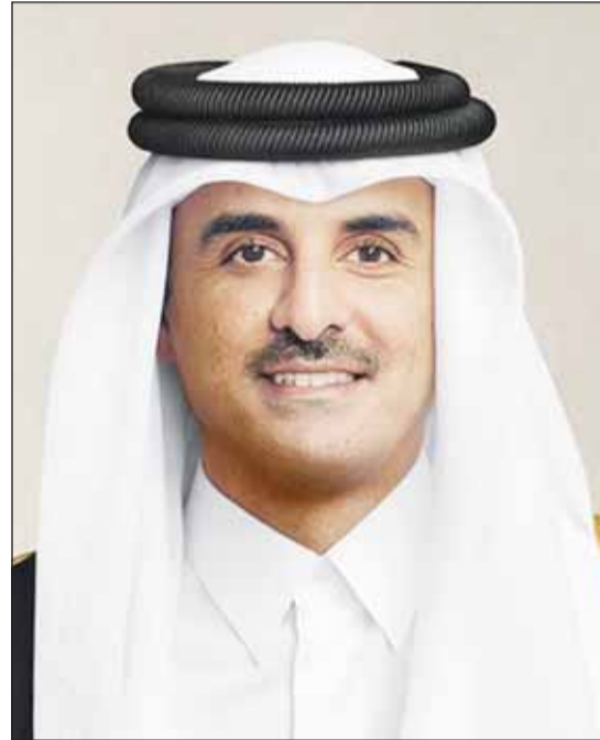
سمو الشيخ تميم بن حمد

من جهته، بعث سمو ولي العهد الشيخ صباح خالد ببرقية تهنئة إلى الشيخ تميم بن حمد أمير دولة قطر الشقيقة ضمنها سموه خالص تهنائيه بمناسبة الذكرى الثالثة عشرة لتولي سموه مقاليد الحكم. متمنيا لسموه دوام الصحة وموفور العافية ودولة قطر الشقيقة وشعبها الكريم المزيد من التقدم والازدهار في ظل القيادة الرشيدة