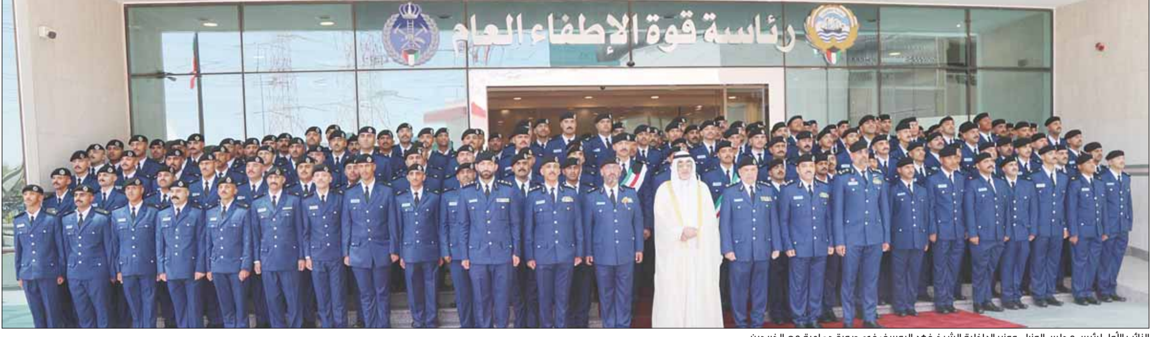
النائب الأول لرئيس مجلس الوزراء ووزير الداخلية الشيخ فهد اليوسف، في صورة جماعية مع الخريجين

شهد حفل تخرج 134 ضابط اختصاص في قوة الإطفاء