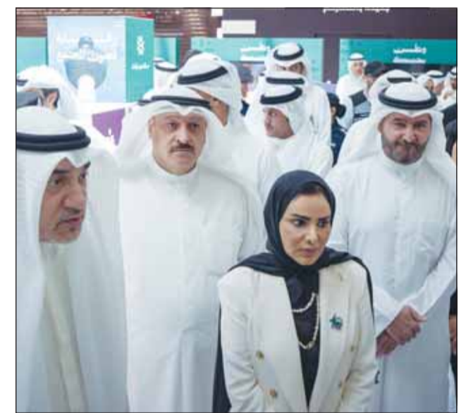
الشيخ فهد اليوسف و د. أمثال الحويلة، و. أحمد العوضي وحمد المرزوق

شارك بيت التمويل الكويتي في الحملة الوطنية الكبرى "وطن يحميك"، التي تهدف الى حماية الشباب وتعزيز وعي المجتمع بمخاطر المخدرات وأثارها السلبية على الفرد والأسرة والوطن، تأكيداً لدوره المجتمعي الرائد ودعمه للمبادرات الحكومية. وقال بيت التمويل الكويتي في بيان صحفي ان الحملة انطلقت بمجمع الأفتيز بحضور النائب الأول لرئيس مجلس الوزراء وزير الداخلية الشيخ فهد اليوسف، ووزيرة الشؤون الاجتماعية وشؤون الأسرة والطفولة د. أمثال الحويلة، ووزير العدل المستشار ناصر السميح، ووزير الصحة د. أحمد العوضي، وكذلك بحضور رئيس مجلس إدارة بيت التمويل الكويتي، حمد المرزوق. وقد أشاد الوزراء بدور بيت التمويل الكويتي في دعم هذه الحملة، مثنين مساهماته المجتمعية المتنوعة ومرصه على المشاركة في مختلف المبادرات التي تخدم المجتمع. من جانبه، أكد رئيس مجلس إدارة بيت التمويل الكويتي، حمد المرزوق، أن البنك سيواصل دعمه للمبادرات الوطنية الهادفة إلى حماية المجتمع وترك بصمة