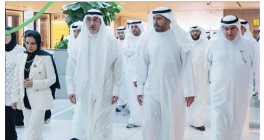
الشيخ فهد اليوسف ود. أمثال الحويلة والمستشار ناصر السميح، ورئيس مجلس إدارة بيت التمويل الكويتي