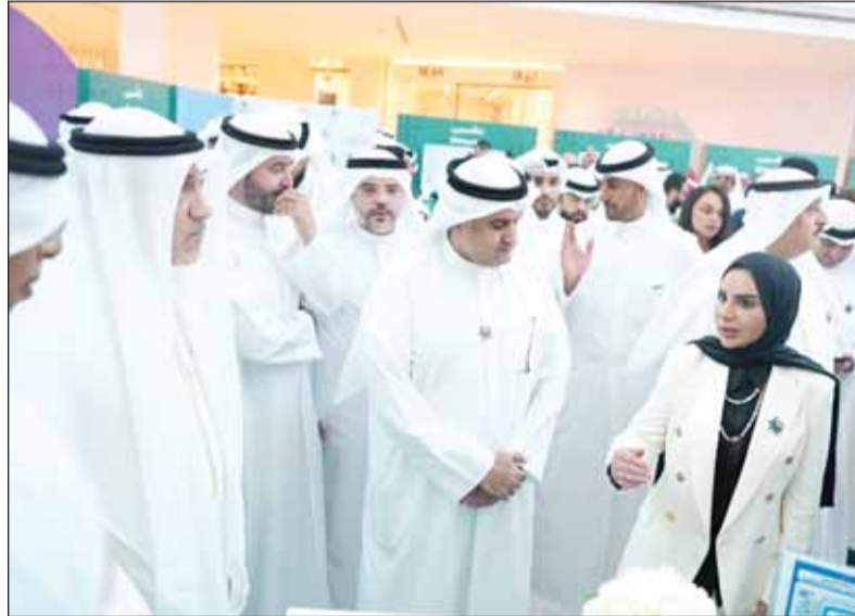
الشيخ فهد اليوسف والمستشار ناصر السميح يستمعان لشرح الحويلة

وأضافت: "نحن إلى جانبكم لنمنح كل مريض فرصة حقيقية للعودة إلى أسرته ومجتمعه فرداً متعافياً وفعالاً" وشددت على أهمية دور الأسرة في الوقاية والاعتناء وتشجيع أبنائها على طلب العلاج. وحضر انطلاق الحملة وزير العدل المستشار ناصر السميح ووزير الصحة الدكتور أحمد العوضي وممثلون عن الوزارات والجهات المشاركة بما يعكس تكامل الجهود الوطنية في مواجهة آفة المخدرات وتعزيز الوعي المجتمعي بمخاطرها.