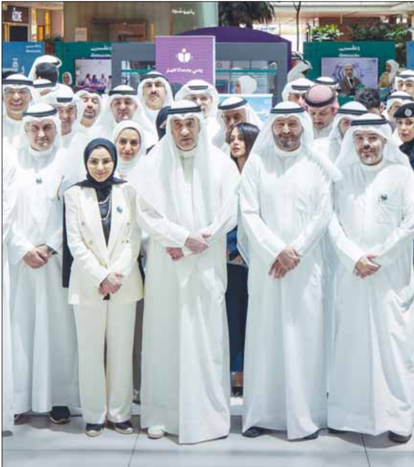
وزير الداخلية الشيخ فهد اليوسف ووزيرة الشؤون د. أمثال الحويلة ووزير العدل ناصر السميح وحمد المرزوق

تعزيز الوعي المجتمعي يمثل خط الدفاع الأول في مواجهة التحديات