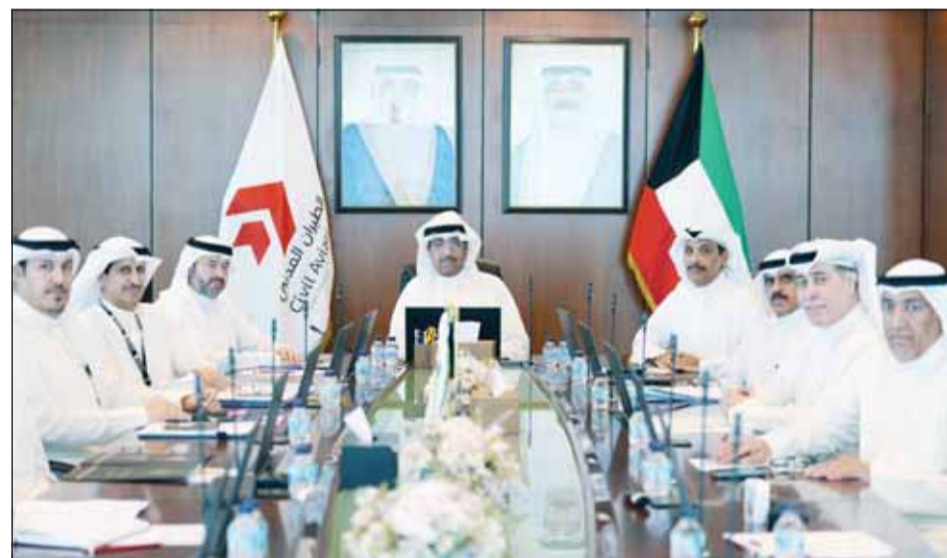
وزير الدفاع الشيخ عبدالله العليمي مترئسا اجتماعا مع قياديين هيئة الطيران المدني

أكد وزير الدفاع الشيخ عبدالله العليمي، أمس، أهمية مواصلة تطوير منظومة الطيران المدني وتعزيز جاهزيتها وفق أعلى معايير الأمن والسلامة والكفاءة التشغيلية. جاء ذلك في بيان الهيئة العامة للطيران المدني عقب زيارة قام بها الوزير إلى الهيئة اطلع خلالها على أبرز المشاريع والخطط التطويرية الجاري تنفيذها في مطار الكويت الدولي. وأضاف البيان أن زيارة وزير الدفاع تناولت الجهود المبذولة للارتقاء بقطاع الطيران المدني بما يواكب تطورات الدولة ويعزز مكانة هذا القطاع الحيوي ودوره في دعم منظومة النقل الجوي في البلاد. وكان رئيس الهيئة العامة للطيران المدني الشيخ المهندس حمود المبارك في استقبال وزير الدفاع لدى وصوله إلى مقر الهيئة إلى جانب عدد من مسؤولي الهيئة.