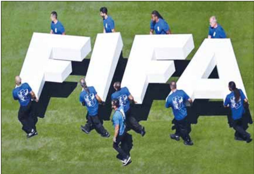
الروس يعودون للمشاركة الدولية

تقرر السماح لروسيا بالمشاركة في بطولة دولية لكرة القدم للمرة الأولى في أكتوبر، وذلك بعد أكثر من 4 سنوات على بدء الحرب على أوكرانيا.