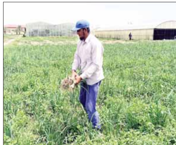
أحد العمال يعمل في حقل أخضر من المزرعة

وفتح بأهمية أن "تسارع الجهات المعنية بأمر المناطق الزراعية بإجراء ما يلزم لمعالجة مشكلة الانقطاعات المفاجئة، والطويلة للكهرباء، عن مزارع العبدي، وكذلك ضعف ضخ المياه المعالجة إليها، خصوصاً أننا مقبلون على أشهر صيف طويلة وقاظة جداً.