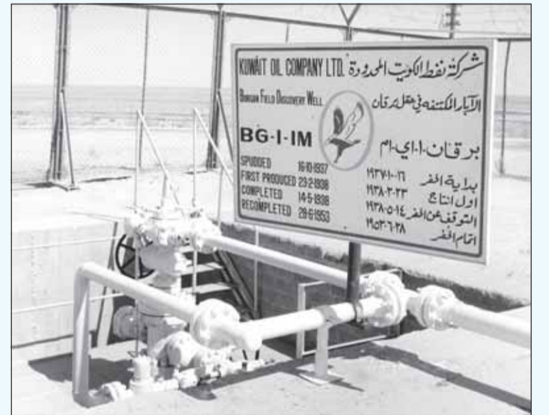
الكويت تحتفل نهاية الشهر بتصدير أول شحنة نفط قبل 80 عاماً