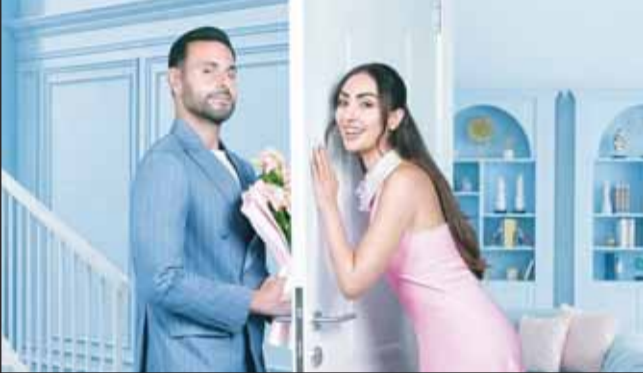
أحبك من زمان

تجتمع النجمة نور الغندور مع الفنان علي كاكولي في فيلم سينمائي جديد يحمل عنوان "أحبك من زمان"، من المقرر عرضه 23 يوليو المقبل عبر إحدى المنصات الإلكترونية. وكشفت البرومو الرسمي للفيلم عن ملامح قصته التي يغلب عليها الطابع الرومانسي، حيث ظهر علي كاكولي في المشاهد الأولى وهو يقابل نور الغندور خلال احتفالها بعيد ميلادها، إذ قام بإطفاء الشموع الموضوعة على قالب الحلوى، قبل أن يقدم لها هدية ويخبرها بأنه يحمل لها خيراً سعيداً، مؤكداً أنه سيكشف لها عن هوية الفتاة التي ينوي الارتباط بها. وتقدم السعادة نور الغندور، معتقدة أنه سيستغل المناسبة للإعلان عن خطبتها أمام الحضور، إلا أنها تتعرض لصدمة غير متوقعة، بعدما يجانبها بظهور فتاة أخرى، ليكشف أنها حبيبته التي ينوي الزواج منها، ويطلب منها التعرف إليها، في مفاجأة تقلب أجواء الاحتفال رأساً على عقب، عندما يشير إلى صديقتها والتي تجسد دورها للمرة الأولى المديعة والمؤثرة نهى نبيل.