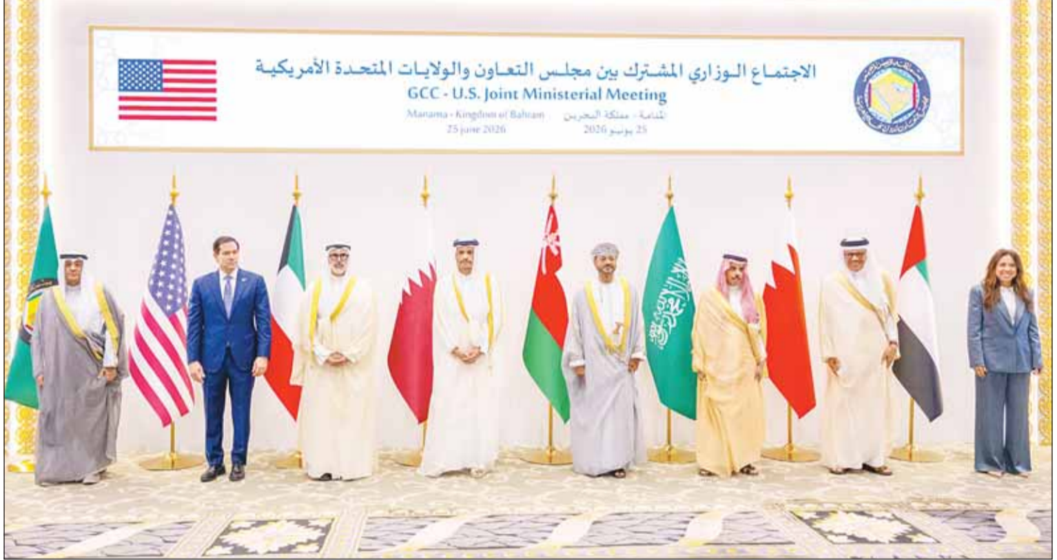
وزراء خارجية دول مجلس التعاون لدول الخليج العربية ووزير الخارجية الأميركي ماركو روبيو في لقطة تذكارية بمناسبة اجتماعهم المشترك في العاصمة البحرينية المنامة أمس (بنا)