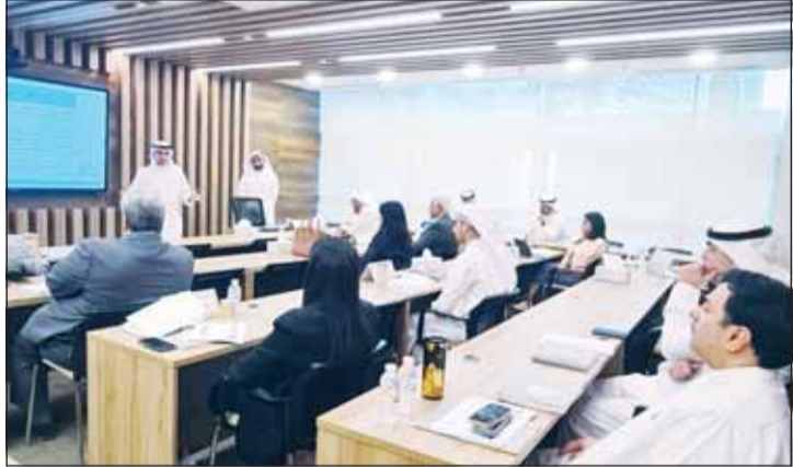
جانب من البرنامج