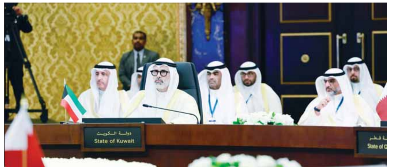
وزير الخارجية الشيخ جراح الجابر مترئسا وفد الكويت في الاجتماع

المتحدة الأميركية وروابط الصداقة التاريخية بين الجانبين كما تمت مناقشة سبل تعزيز العلاقات الخليجية - الأميركية والأخذ بمجالات الشراكة إلى آفاق أرحب وأكثر شمولاً.