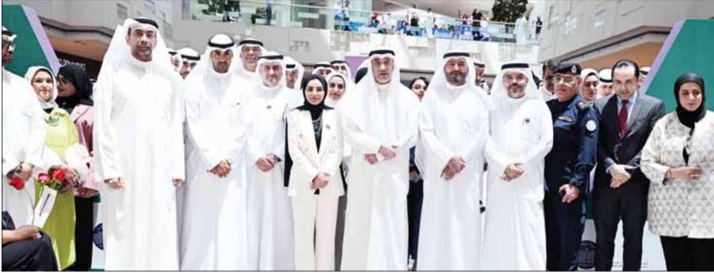
النائب الأول لرئيس مجلس الوزراء وزير الداخلية الشيخ فهد اليوسف وزير العدل المستشار ناصر السميح ووزيرة الشؤون د. أمثال الحويلة ورئيس مجلس إدارة بيت التمويل الكويتي حمد المرزوق و د. خالد العجمي

□ أي محكوم بالإعدام لا يبقى في السجن أكثر من 3 أشهر □ نسب تهريب المخدرات انخفضت أكثر من 80% والأسعار تضاعفت □ عاجزون عن شكر القطاع الخاص على دوره الوطني الكبير □ الخناق ضاق على تجار السموم بتطبيق المنظومة الأمنية الجديدة