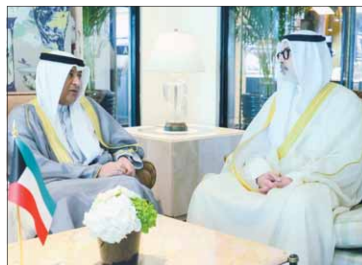
وزير الخارجية الشيخ جراح الجابر لدمه لقاؤه الأمين العام لمجلس التعاون جاسم البديوي

المنامة - كونا، التقى وزير الخارجية الشيخ جراح الجابر، أمس، الأمين العام لمجلس التعاون لدول الخليج العربية جاسم البديوي على هامش أعمال الاجتماع الوزاري المشترك بين المجلس والولايات المتحدة الأميركية الذي عقد في مملكة البحرين الشقيقة. ونذكرت "الخليجية" في بيان لها أنه جرى خلال اللقاء مناقشة أطر تعزيز الجهود الداعمة لمسيرة العمل الخليجي المشترك نمو مزيد من التضامن والترابط وبحث آخر المستجدات على الساحة الإقليمية.