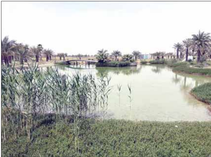
البحيرة في المزرعة