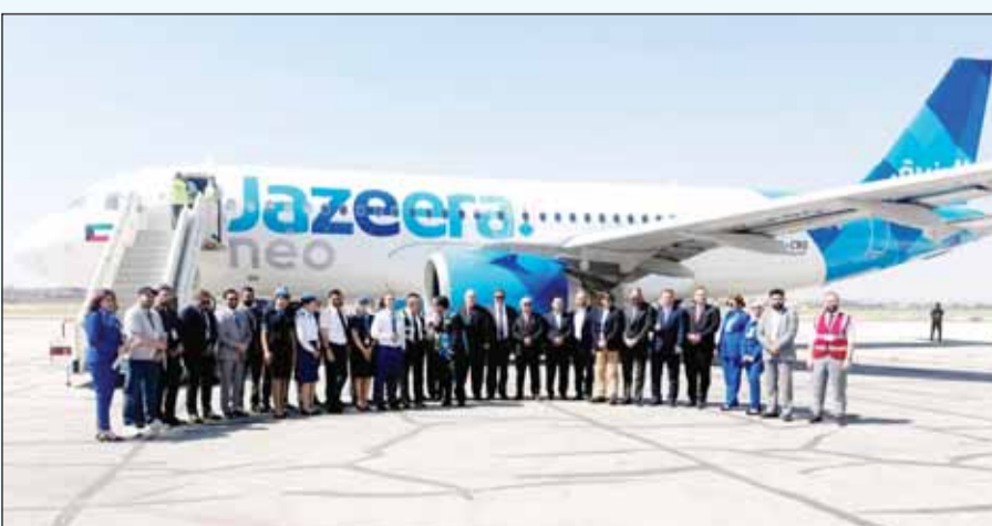
طيران الجزيرة تعيد تشغيل خطها إلى حلب السورية

الجوي خطوة مهمة نحو تعزيز التواصل بين العائلات، وتنشيط حركة الاستثمار والتجارة، ودعم مسيرة التعافي والتنمية التي تشهدها المدينة، بما يعزز مكانة حلب كمركز اقتصادي وثقافي وسيامي". وقال رئيس الهيئة العامة للطيران المدني والنقل الجوي السوري، عمر المصري، "يعكس استئناف الرحلات المباشرة بين الكويت وحلب الجهود المستمرة لتعزيز قطاع الطيران في سوريا وتوسيع شبكة الربط الجوي الدولي". وأوضح "الجزيرة" أنها تقوم بتسيير رحلتين أسبوعياً على هذا الخط يومي الخميس والسبت، استجابة للطلب المتزايد من المسافرين الراغبين في زيارة الأهل والأصدقاء، إضافة إلى الراغبين في الاستفادة من الربط المباشر والمريح بين الكويت وشمال سوريا، مشيرة إلى أنه اعتباراً من 21 يوليو، سيرتفع عدد الرحلات إلى ثلاثة أسبوعية بإضافة رحلة كل يوم الثلاثاء. ونقل البيان عن الرئيس التنفيذي لشركة طيران الجزيرة بارثان باسوياتي قوله "سعيدون بتدشين رحلتنا المباشرة إلى حلب، المدينة ذات الأهمية التاريخية والثقافية والاقتصادية الكبيرة. ويعكس هذا الخط الجديد التزامنا بإعادة ربط المجتمعات وتوفير المزيد من خيارات السفر لعملائنا في مختلف أنحاء المنطقة".