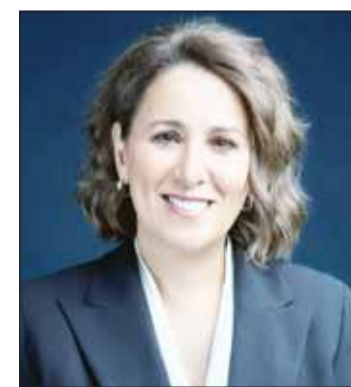
الشيخة أدانا ناصر الصباح