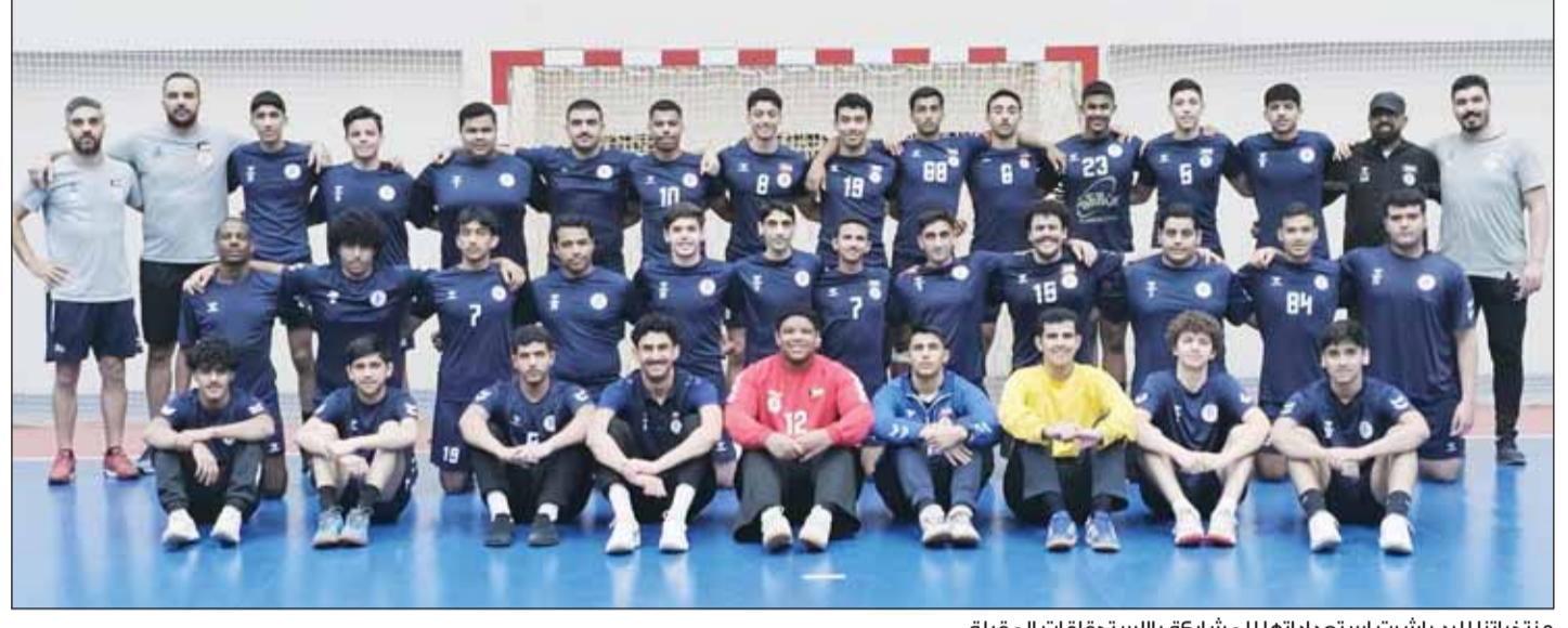
منتخباتنا لليد باشرت استعداداتها للمشاركة بالاستحقاقات المقبلة