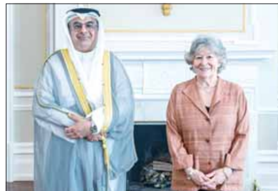
السفير طلال الهاجري والحاكمة العامة لكندا لويز أربور

واشنطن - كونا، قدم سفير دولة الكويت لدى كندا طلال الهاجري، أمس، أوراق اعتماده سفيراً فوق العادة مفوضاً لدولة الكويت لدى كندا إلى الحاكمة العامة لكندا لويز أربور خلال المراسم التي اقيمت في قصر الحاكم العام بحضور عدد من كبار المسؤولين في وزارة الخارجية الكندية ومكتب الحاكم العام.