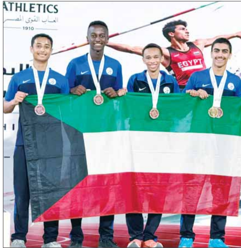
أبطال أزرق القوى علم منصة التتويج

واستضافت مصر البطولة العربية الثالثة لألعاب القوى تحت 16 سنة وتحت 23 سنة على مضمار استاد هيئة قناة السويس بمدينة الإسمايلية بمشاركة 14 منتخباً عربياً.