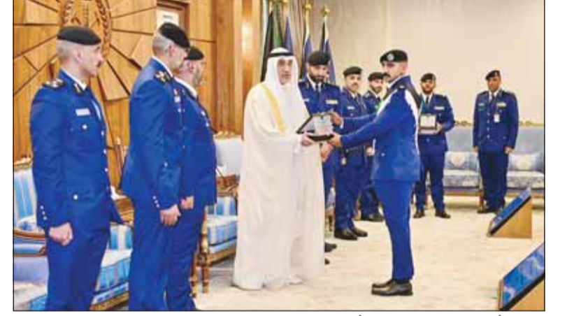
النائب الأول ووزير الداخلية مكرماً أحد الخريجين

الإنسانية والوطنية. وحث النائب الأول للخريجين على مواصلة بذل الجهد والإخلاص في خدمة الوطن، والعمل على تطوير قدراتهم المهنية والارتقاء بمستوى أدائهم، بما يعزز كفاءة قوة الإطفاء العام في إنقاذ الأرواح وحماية الممتلكات.