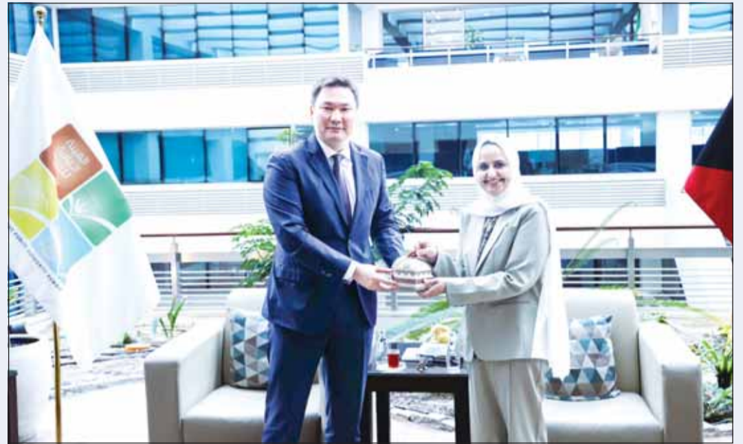
وزير الدولة لشؤون التنمية والاستدامة الدكتورة ريم الفليج خلال لقاءها سفير جمهورية كازاخستان لدى دولة الكويت يرزان إيليكييف

أفضل الممارسات والمعايير الدولية. وذكرت أن المرحلة التجريبية تمثل اللجنة الأولى في بناء منظومة وطنية شاملة لتقارير الاستدامة الحكومية وتسهم في متابعة التقدم المحرز في الملفات البيئية وتدعم رفع مؤشرات الاستدامة البيئية للدولة وتعزيز جاهزية الكويت لمواجهة التحديات المناخية وتحقيق التوازن بين التنمية الاقتصادية والمحافظة على البيئة للأجيال القادمة.