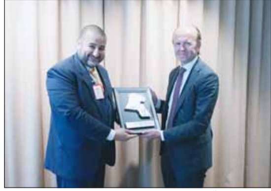
الشيخ د.عبدالله المشعل مع كبار المسؤولين في السويد

قام وكيل وزارة الدفاع الشيخ الدكتور عبدالله المشعل بزيارة رسمية إلى مملكة السويد الصديقة في إطار تنفيذ الخطة الاستراتيجية لوزارة الدفاع (2020-2030) الهادفة إلى تعزيز الشركات الدولية وتبادل الخبرات والاستفادة من أفضل الممارسات العالمية في المجالات الدفاعية والعسكرية.