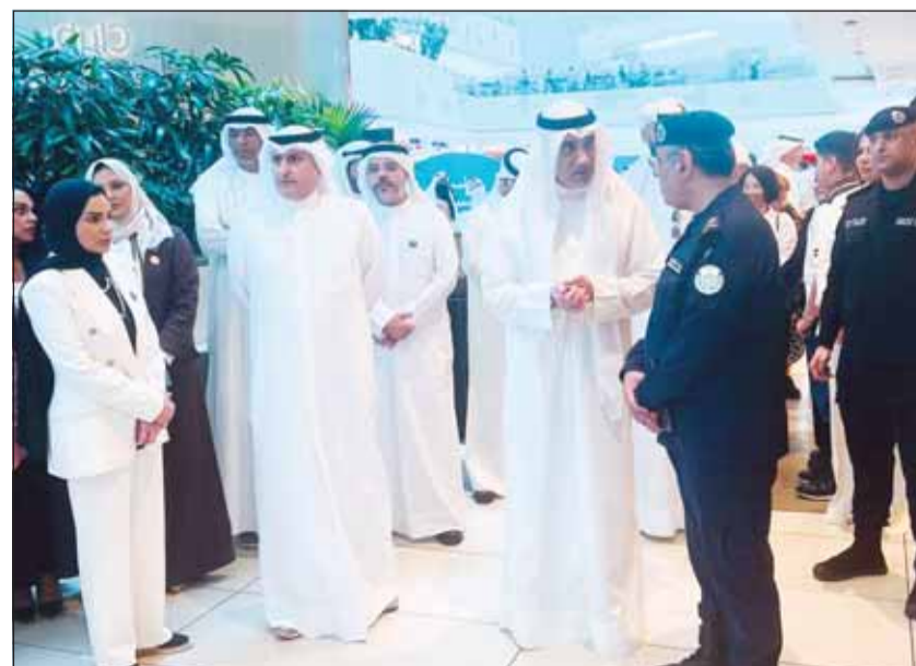
النائب الأول وزير الداخلية الشيخ فهد اليوسف في حوار مع العميد محمد قبازرد خلال الفعالية

وأوضح أن الإدارة تنسق بصورة مستمرة مع الجهات الحكومية والجمعيات الأهلية ومؤسسات المجتمع المدني لتنفيذ برامج توعوية مشتركة تعزز الثقافة الوقائية وترسخ مفهوم المسؤولية المجتمعية في مكافحة المخدرات. وأشار إلى أن قانون مكافحة المخدرات الجديد حقق نتائج إيجابية ملموسة منذ بدء تطبيقه، إذ أسهم في الحد من قضايا جلب المواد المخدرة