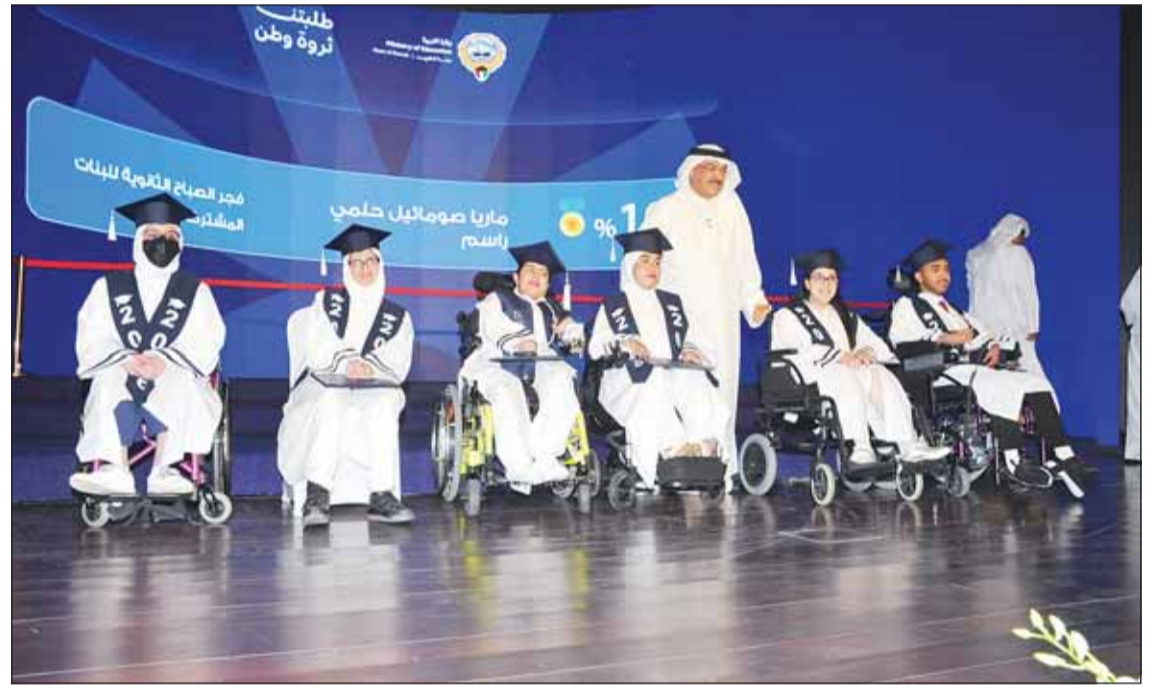
الوزير الطيباتية مع متفوقين "التربية الخاصة"