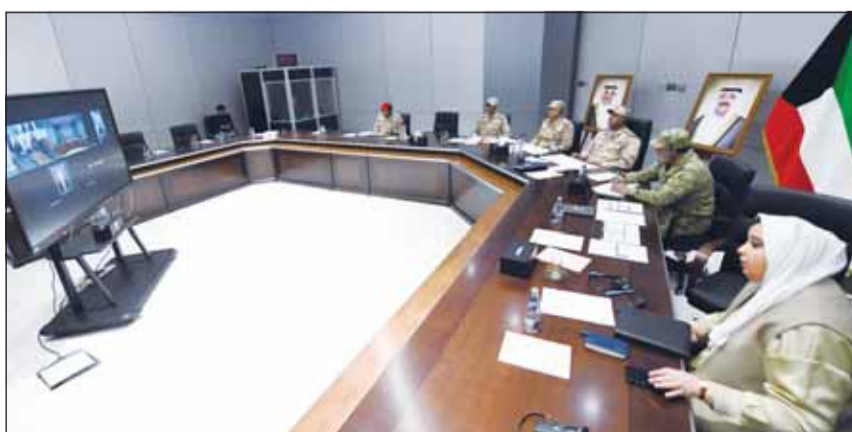
جانب من اجتماع فريق "أمان" مع إدارة الحماية المدنية الايطالية

عقد فريق العمل المعني بإنشاء المركز الوطني لإدارة الطوارئ والأزمات والكوارث على المستوى الوطني (أمان) اجتماعاً، أمس، عبر تقنية الاتصال المرئي مع إدارة الحماية المدنية الإيطالية، وذلك في إطار تبادل الخبرات والاطلاع على التجارب الدولية المتقدمة في مجالات إدارة الطوارئ والأزمات والكوارث.