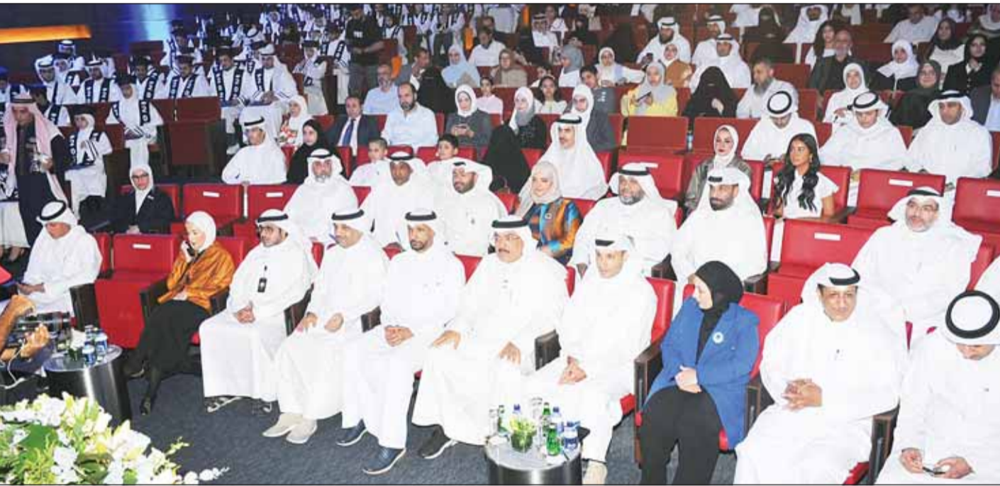
... ويتوسط قياديين "التربية" خلال حفل التكريم

كرم وزير التربية سيد جلال الطببائي أمس نحو 120 طالباً وطالبة من فائقي الصف 12 من التعليم العام والديني والتربية الخاصة للعام الدراسي 2025 - 2026 الذي أقيم على مسرح وزارة التربية. وأعرب الوزير الطببائي في كلمة له خلال المحفل عن خالص تهنئته للطلبة الفائزين بمناسبة إعلان نتائج الصف 12، مؤكداً أنهم رفعا اسم الكويت وأسرهم ووزارة التربية عالياً بما حققوه من نتائج مشرفة. وقال: "لا يفوتني في هذه المناسبة أن أتقدم بخالص الشكر وعظيم التقدير إلى مقام سمو أمير البلاد الشيخ مشعل الأحمد وسمو ولي العهد الشيخ صباح الخالد وسمو رئيس مجلس الوزراء الشيخ أحمد عبدالله على ما يولونه من اهتمام بالغ ودعم متواصل لمسيرة التعليم وإيمانهم الراسخ بأن الاستثمار في الإنسان هو أساس التنمية وبناء مستقبل الكويت". وأكد أن هذا الدعم الكريم يشكل حافزاً للجميع لمواصلة تطوير المنظومة التعليمية وتمكين أبنائنا وبناتنا من تحقيق المزيد