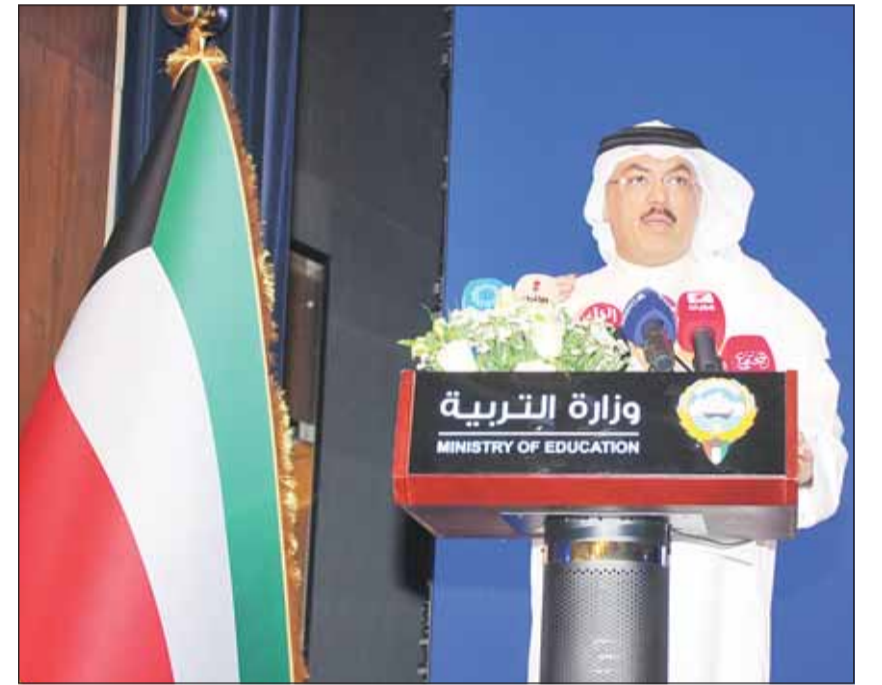
الوزير الطببائي متحدثاً