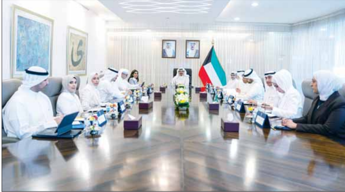
سمو رئيس مجلس الوزراء الشيخ أحمد عبدالله مترأساً اجتماع اللجنة الوزارية لمتابعة المشاريع التنموية الكبرى

أعلنت الهيئة العامة للاتصالات وتقنية المعلومات عن 70 بلاغ نصب وامتيال تعاملت الهيئة معها خلال شهر يونيو الماضي. وأوضحت الهيئة في إحصائية "أن البلاغات شملت 39 موقع الكتروني و رسالة نصية واحدة، و4 مكالمات هاتفية و20 وسائل التواصل الاجتماعي و6 تطبيق واتس اب"، مؤكدة أهمية البلاغ وعدم مشاركة البيانات الشخصية او البنكية