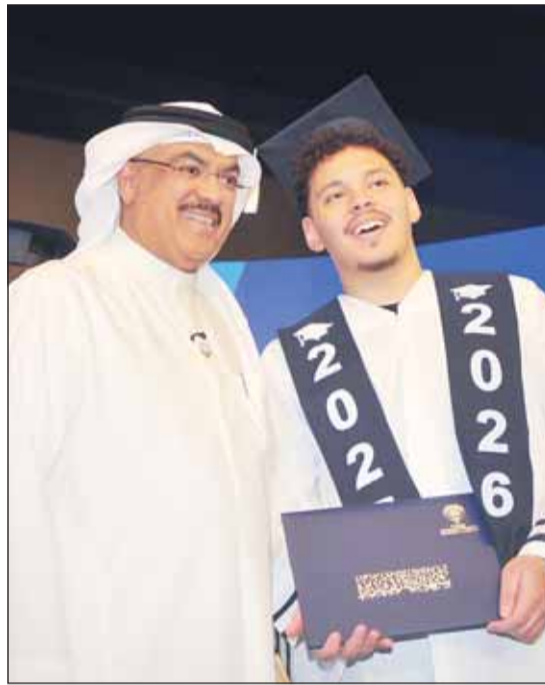
الطيباتية مع أحد المتفوقين