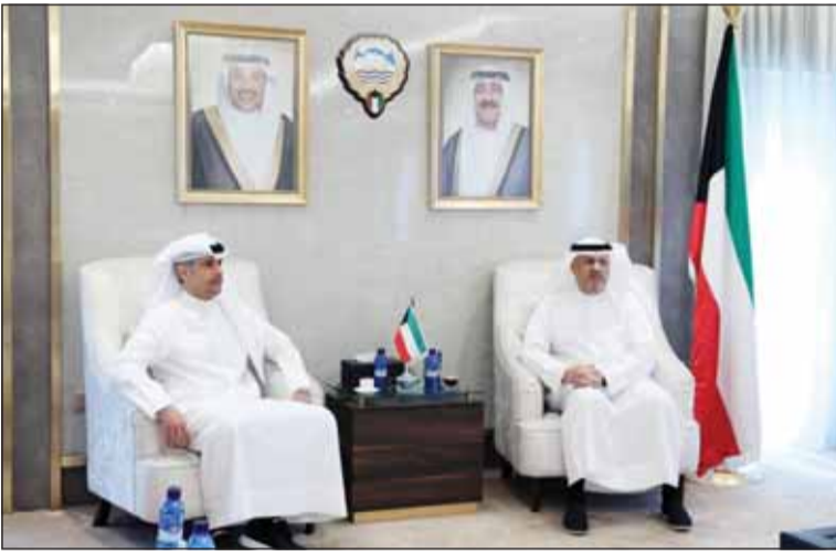
العمر والجلاهمة بحثاً سبل تعزيز التعاون والتنسيق بين الوزارتين

بحث وزير الدولة لشؤون الاتصالات وتكنولوجيا المعلومات ووزير الإعلام والثقافة بالوكالة عمر العمر مع وزير الدولة لشؤون الشباب والرياضة الدكتور طارق الجلاهمة سبل تعزيز التعاون والتنسيق بين الجانبين في عدد من الملفات ذات الاهتمام المشترك. وقالت وزارة الإعلام في بيان صحفي أمس، إن اللقاء يأتي في إطار تعزيز التكامل والتنسيق بين الجهات الحكومية بما يخدم تطوير العمل الموسمي والإعلامي. وذكر البيان أن الجانبين أكداً خلال اللقاء على أهمية مواصلة التعاون بما يسهم في دعم جهود التطوير ورفع كفاءة العمل خاصة في المجالات الإعلامية والشبابية والرياضية. وحضر اللقاء وكيل وزارة الإعلام الدكتور ناصر محيسن وعدد من القياديين بالوزارتين.