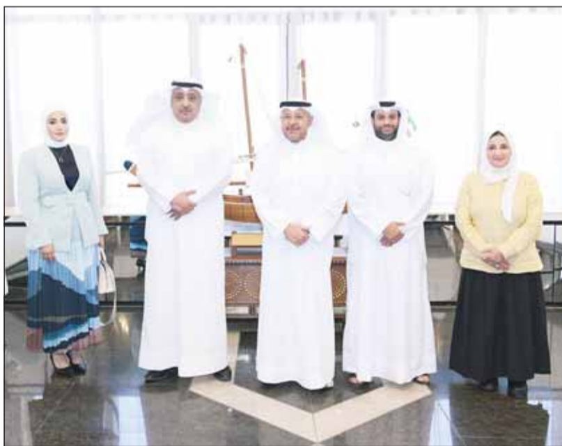
محافظ الفروانية خلال استقبال وفد جمعية الوقاية من التفكك الأسري