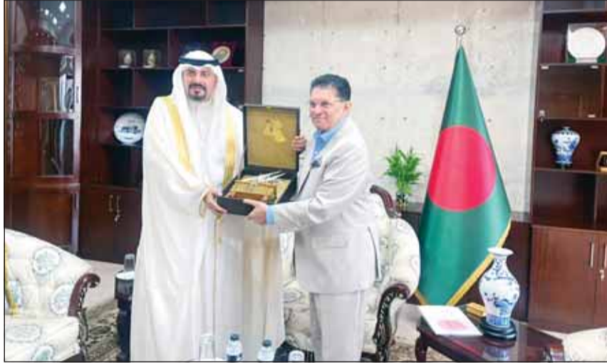
السفير علي حمادة ووزير خارجية بنغلاديش د.خليل الرحمن

كوالالمبور- "كونا". بحث سفير الكويت لدى بنغلاديش علي حمادة، أمس الخميس، مع وزير خارجية بنغلاديش الدكتور خليل الرحمن، علاقات التعاون بين البلدين وسبل دعمها وتعزيزها. وقال السفير حمادة، في تصريح لـ"كونا" عقب اللقاء، إن الاجتماع جاء في إطار الحرص على توطيد العلاقات الكويتية-البنغلاديشية بما يخدم المصالح المشتركة في مختلف المجالات، مشيراً إلى أنه جرى استعراض أوجه التعاون بين البلدين، إلى جانب بحث عدد من الموضوعات ذات الاهتمام المشترك. وأضاف أنه نقل إلى وزير خارجية بنغلاديش تهنئة دولة الكويت ووزير الخارجية الشيخ جراح جابر الأحمد بمناسبة فوز بنغلاديش برئاسة الدورة المقبلة للجمعية العامة للأمم المتحدة، لافتاً إلى أن الوزير البنغلاديشي أعرب عن بالغ تقدير بلاده للكويت على ما قدمته من دعم لترشحها لهذا المنصب. وأكد السفير حمادة تطوع الكويت إلى أن تواصل بنغلاديش، خلال رئاسة الدورة المقبلة للجمعية العامة، دعم القضايا والاهتمامات المشتركة، من خلال تعزيز التنسيق والتشاور والعمل المشترك