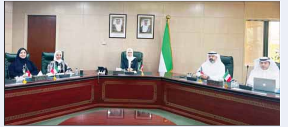
وزيرة الدولة لشؤون التنمية والاستدامة د.ريم الفليج مترأساً وفد الكويت في الاجتماع

ترأست وزيرة الدولة لشؤون التنمية والاستدامة الدكتورة ريم الفليج، أمس، وفد دولة الكويت المشارك في الاجتماع الاستثنائي للوزراء المعنيين بالزراعة والأمن الغذائي بدول مجلس التعاون لدول الخليج العربية الذي عقد عبر تقنية الاتصال المرئي برئاسة مملكة البحرين دولة الرئاسة. وذكرت الهيئة العامة للغذاء والتغذية في بيان أن الاجتماع ناقش تنفيذ توجيهات قادة دول مجلس التعاون بشأن دراسة إنشاء مناطق للخرن الاستراتيجي الخليجي للغذاء والاحتياجات الأساسية بما يعزز الأمن الغذائي الخليجي ويرفع جاهزية دول المجلس لمواجهة التحديات والأزمات المرتبطة بسلاسل الإمداد. وأشار البيان إلى أنه تم خلال الاجتماع اعتماد التوصيات الخاصة به بما يعزز التكامل الخليجي في القطاعات الاستراتيجية ويعزز منظومة الأمن الغذائي في دول المجلس. وضم وفد الكويت المشارك بالاجتماع المدير العام للهيئة العامة للغذاء والتغذية بالنائب والمدير العام للهيئة العامة لشؤون الزراعة والثروة السمكية بالنائب ومدير إدارة سلامة الغذاء ومدير إدارة الأمن الغذائي.