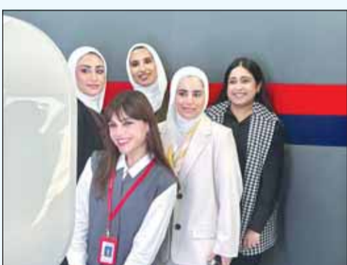
خلال المشاركة في المبادرة