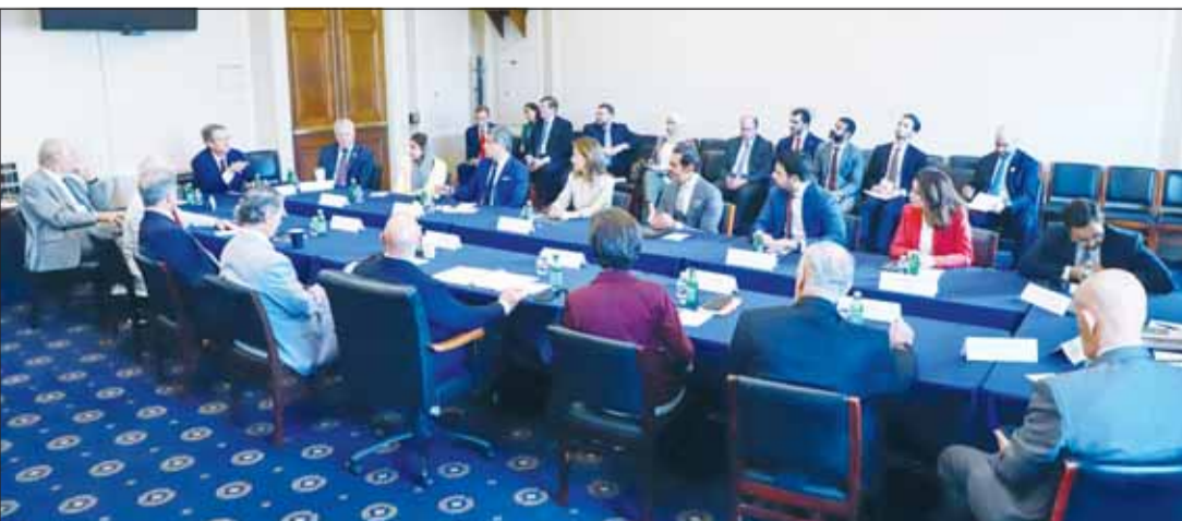
الشيخة الزين الصباح شاركت في اجتماع سفراء دول مجلس التعاون لدول الخليج والأردن

شاركت سفيرة دولة الكويت لدى الولايات المتحدة الشيخة الزين الصباح، أول من أمس الأربعاء، في اجتماع مشترك ضم سفراء دول مجلس التعاون لدول الخليج العربية والملكة الأردنية الهاشمية مع رئيس لجنة الشؤون الخارجية في مجلس النواب الأميركي النائب براين ماست، وعدد من كبار أعضاء اللجنة.