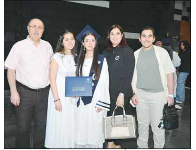
متفوقة في صورة تذكارية مع أسرتها