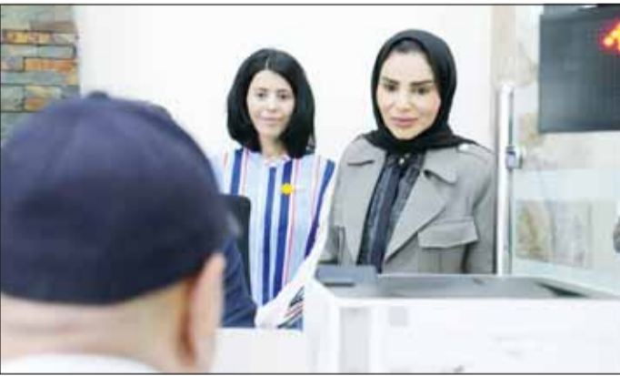
... وتتابع آلية استقبال المراجعين وإنجاز المعاملات