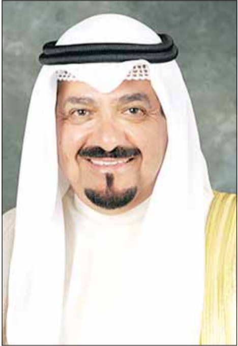
سمو الشيخ أحمد العبدالله

ولي العهد: مثابرتكم وحرصكم وما هيأته أسركم من بيئة دراسية أسهمت في تحقيق هذا التفوق