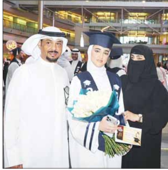
متفوقة تتوسط والديها