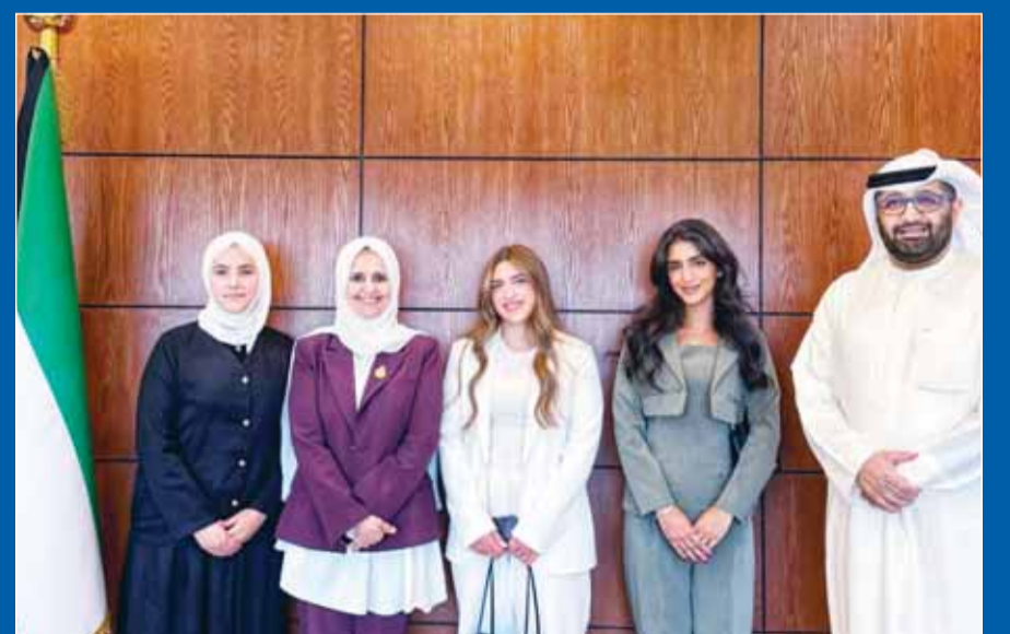
الوزيرة د.ريم الفليج متوسطة أعضاء رابطة طلبة الطب البيطري

نظمت رابطة طلبة الطب البيطري لقاءً مع وزير الدولة لشؤون التنمية والاستدامة د. ريم الفليج وجرى خلال اللقاء بحث واقع القطاع البيطري وأفاق تطويره في ضوء التوجهات الوطنية للاستدامة. وتناول اللقاء الدور المحوري للطب البيطري في تعزيز الأمن الغذائي، وحماية الصحة العامة، ودعم منظومة الأمن الحيوي، إلى جانب أهمية ترسيخ مفهوم الصحة الواحدة (One Health) بوصفه إطاراً تكاملياً يربط بين صحة الإنسان والحيوان والبيئة، ويميز الجاهزية الوطنية لمواجهة الأزمات الصحية والطوارئ الوبائية.