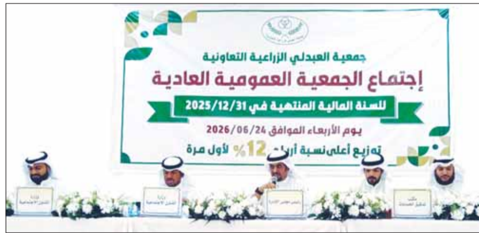
مجلس الإدارة خلال الاجتماع

التأمت الجمعية العمومية لجمعية العبدلي الزراعية التعاونية، مساء الأربعاء قبل الماضي في صالة "تنمية المجتمع" في منطقة سعد العبد لله، بحضور مندوب وزارة الشؤون الاجتماعية، وعدد من أعضاء الجمعية المساهمين فيها، حيث جرى التصديق على التقريرين الإداري والمالي للسنة المالية للجمعية المنتهية في 2025/12/31.