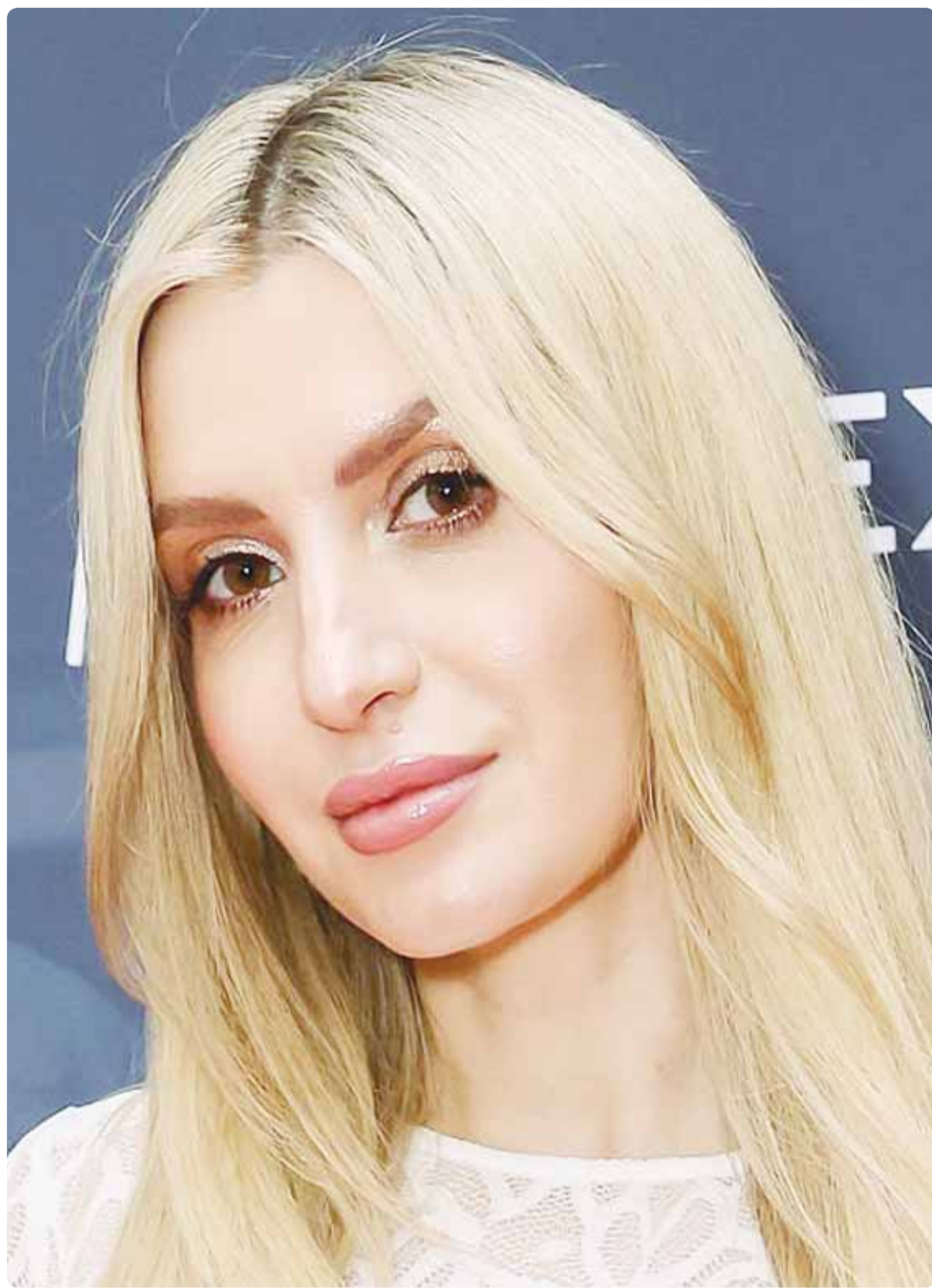
عارضة الأزياء البريطانية فيكتوريا براون خلال حضورها حفل "ليكسو غراند بريكس" في لندن