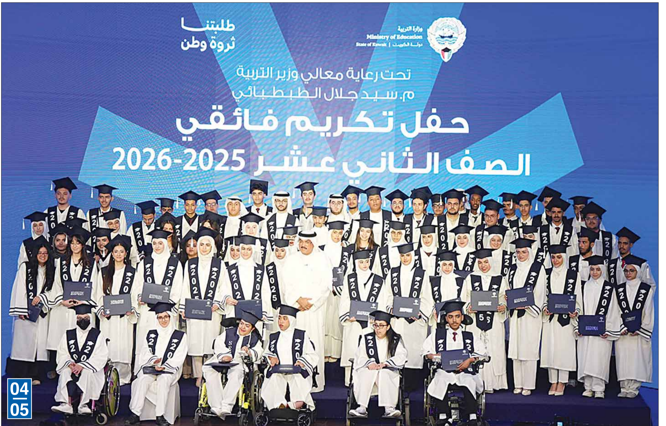
وزير التربية سيد جلال الطبيبائي متوسماً الطلبة الفائقين المكرمين