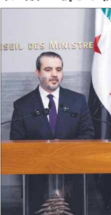
رئيس الوزراء اللبناني نواف سلام ووزير الخارجية والمغتربين السوري أسعد الشبياني خلال مؤتمر صحافي مشترك في بيروت أمس

الوقت نفسه لضرورة تسليم السجناء السوريين الموجودين في لبنان، وفي تصريح لافت، فتح الشبياني الباب أمام احتمال لقاء "حزب الله" مستقبلاً "إذا اقتضت المصلحة"، لكنه أكد أنه لا