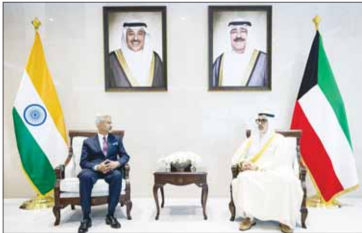
وزير الخارجية الشيخ جراح الجابر مستقبلاً نظيره الهندي د. سوبراهمانيام جايشانكار

التقى وزير الخارجية الشيخ جراح الجابر، امس، وزير خارجية جمهورية الهند الصديقة د. سوبراهمانيام جايشانكار وذلك بمناسبة زيارته الرسمية والوفد المرافق إلى دولة الكويت. وذكرت "الخارجية" في بيان لها أنه جرى خلال اللقاء استعراض العلاقات التاريخية الراسخة التي تربط البلدين الصديقين وسبل تعزيزها وتطويرها في مختلف المجالات بما يسهم في الارتقاء بأطر التعاون والتنسيق إلى مستويات أكثر شمولاً كما بحث الجانبان آخر التطورات على السامتين الإقليمية والدولية. وأقام الشيخ جراح الجابر مأدبة غداء على شرف د. جايشانكار والوفد المرافق له.