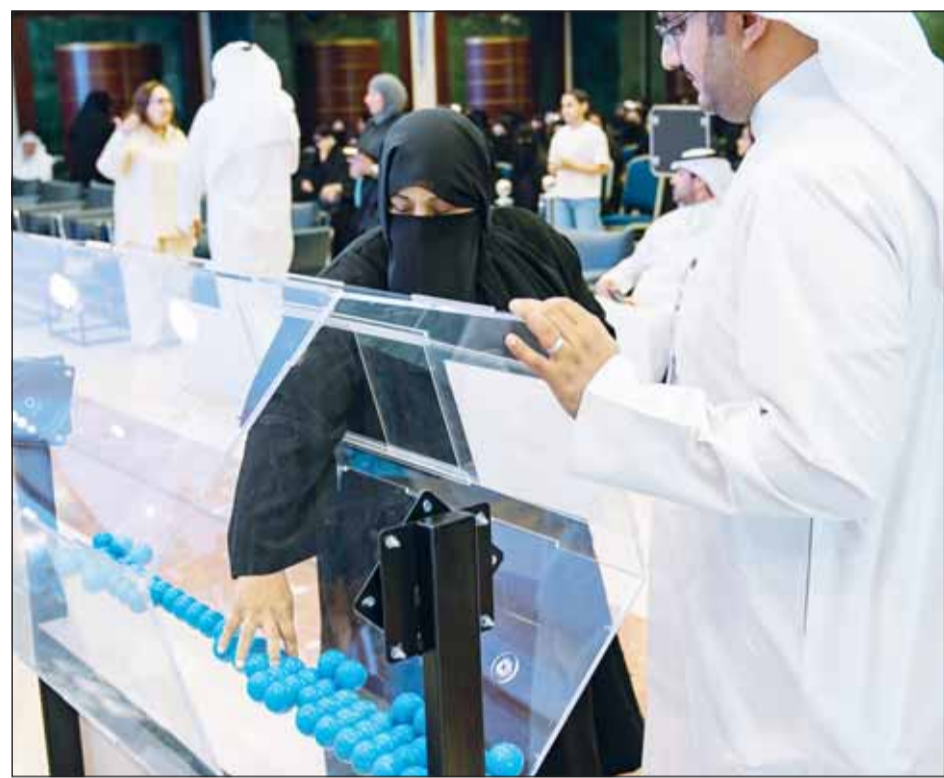
جانب من إجراء القرعة