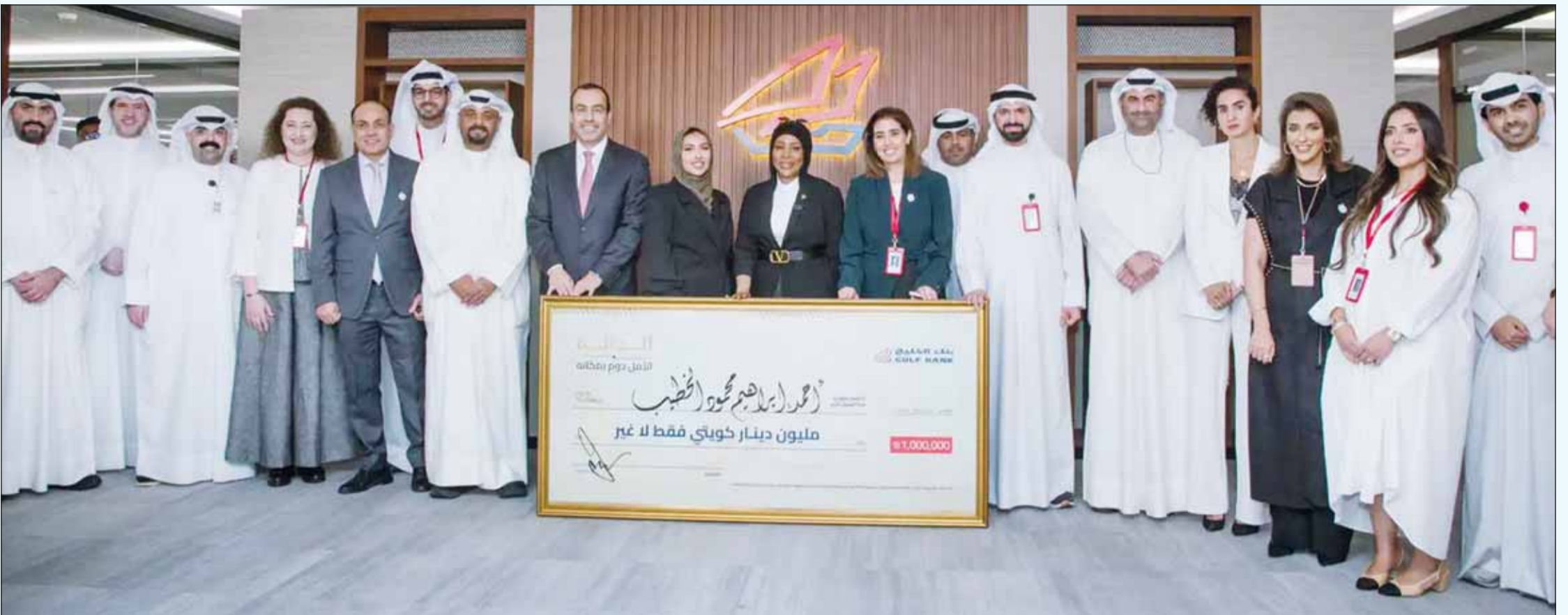
صورة جماعية لمسؤولي وموظفي بنك الخليج مع الشيك