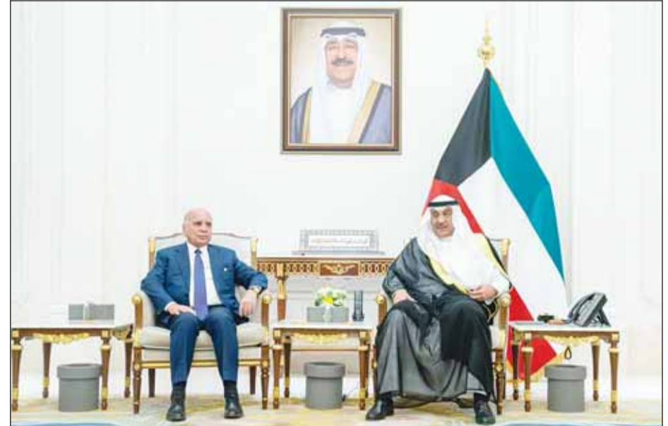
سمو ولي العهد الشيخ صباح الخالد مستقبلاً وزير الخارجية العراقي الدكتور فؤاد حسين

بالإضافة إلى مناقشة عدد من القضايا والموضوعات ذات الاهتمام المشترك. حضر اللقاءين رئيس ديوان سمو ولي العهد الشيخ ثامر الجابر ووزير الخارجية الشيخ جراح الجابر وكبار المسؤولين.