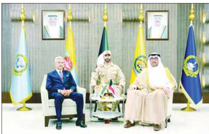
وزير الدفاع الشيخ عبدالله العلي الصباح مستقبلاً وزير الخارجية الهندي

وحضر اللقاء سفيرة جمهورية الهند لدى دولة الكويت براميتا تريباتي. في الإطار نفسه، استقبل وزير الدفاع الشيخ عبدالله العلي الصباح وزير الشؤون الخارجية في جمهورية الهند الصديقة د. سوبراهمانيام جايشانكار، بمناسبة زيارته الرسمية للبلاد. وجرى خلال اللقاء تبادل الآراء