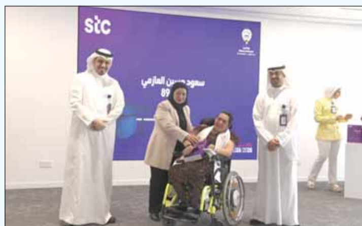
تكريم الطلاب المتميزين من مدارس التربية الخاصة

نحو التميز. ومن خلال مبادراتنا التعليمية "upgrade"، نؤكد التزامنا بتوفير فرص تُقَدّر إنجازات الطلاب، وتُعلي من شأن تقائهم، وتُلهمهم لمواصلة السعي نحو النجاح. وأضاف النوبيت، "يُعد تكريم الطلاب المتميزين أحد السبل العديدة التي نؤكد بها التزامنا بدعم التعليم وتمكين الشباب في الكويت. ونحن فخورون بالاحتفاء بإنجازات الطلاب من مختلف الخلفيات التعليمية، وسنواصل بناء شراكات استراتيجية مع الجهات الحكومية والخاصة لإطلاق مبادرات تساهم في تطوير قطاع التعليم وتمكين الشباب في الكويت سواء على الصعيد الأكاديمي أو الشخصي، لتحقيق كامل إمكاناتهم". كما أكدت stc أن دعم الطلاب وتكريم الإنجازات الأكاديمية يظلان جزءاً لا يتجزأ من التزام الشركة بتمكين الشباب ودعم قطاع التعليم. وانطلاقاً من شراكاتها الاستراتيجية مع الجهات الحكومية والخاصة، تواصل شركة الاتصالات الكويتية إطلاق مبادرات مؤثرة تساهم في النهوض بالتعليم، وتنمية المواهب الوطنية، وتشجيع الابتكار.