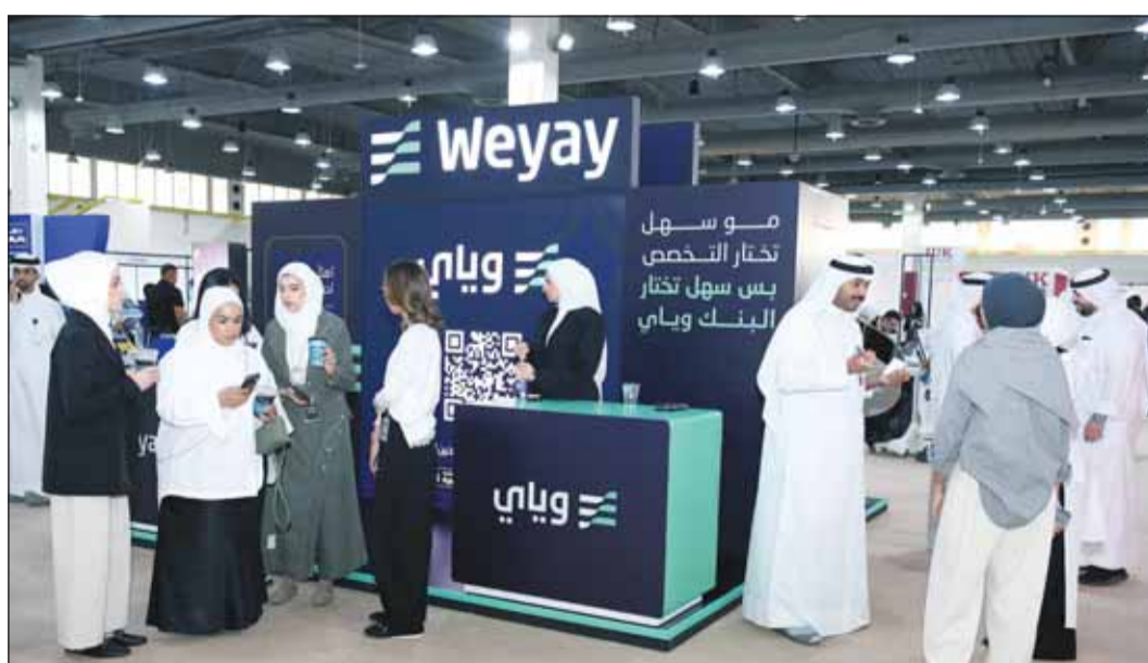
فريق البنك يشارك في حملة "اختار تخصصك صح"