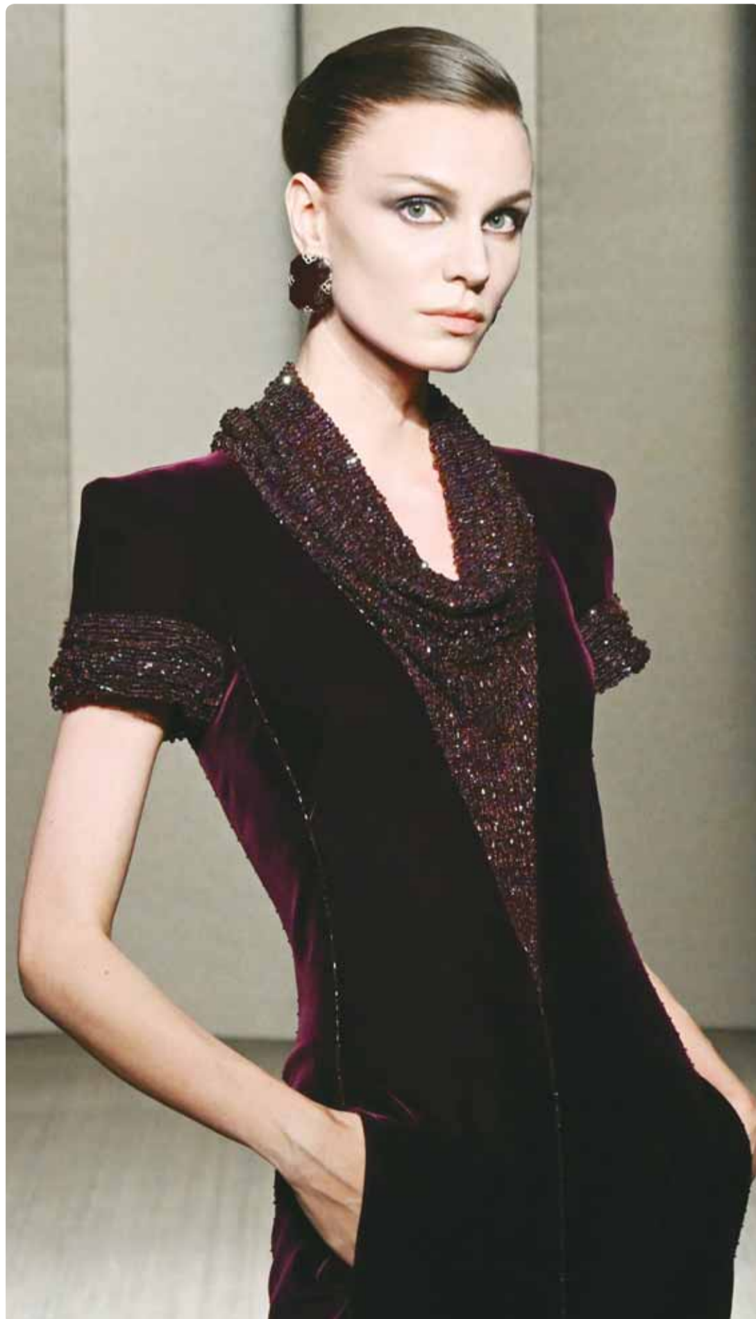
عارضة في زي من مجموعة "جورجيو أرماني بريفيه" خلال أسبوع باريس للموضة

واشنطن - وكالات، تشهد مانهاتن الأميركية حالة استنفار عامة بعد كارثة إنشائية تعرضت لها ناطحة سحاب، مكونة من 37 طابقاً، تقع على مقربة من مبنى الأمم المتحدة، ومحطة قطارات "غراند سنترال" ومبنى "كرايسلر" الشهير. المبنى كان المقر الرئيسي لسابق لشركة الأدوية الشهيرة "فايزر"، وفضع أخيراً لأكثر عملية تحويل في تاريخ نيويورك من مبنى مكاتب إدارية إلى شقق سكنية فاخرة تضم أكثر من 1600 وحدة. ونشرت وكالات أنباء وناشطون صوراً ومقاطع وصفت بأنها "مثيرة للذعر"، يظهر فيها المبنى وهو يترنح ويميل، وذلك بعد إيلائه إثر انحناء عارضتين إنشائيتين وانهار طوابق عدة. وعقد مفاوض إدارة المباني في مدينة نيويورك مؤتمراً صحافياً، استعرض فيه جهود تثقيب واستقرار المبنى في منطقة "ميدتاون مانهاتن"، وقدم تحديثات بشأن إغلاق الشوارع وعمليات الإخلاء المرتبطة بذلك.