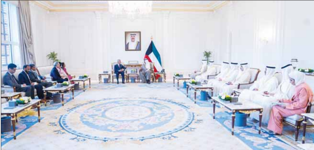
سمو ولي العهد الشيخ صباح الخالد مستقبلاً وزير الشؤون الخارجية في الهند الدكتور أس جايشانكار والوفد المرافق