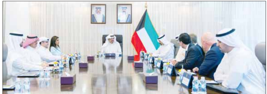
سمو الشيخ أحمد عبدالله مستقبلاً بروس فلات

توطيد التعاون والروابط الاقتصادية والتجارية مع الشركات العالمية