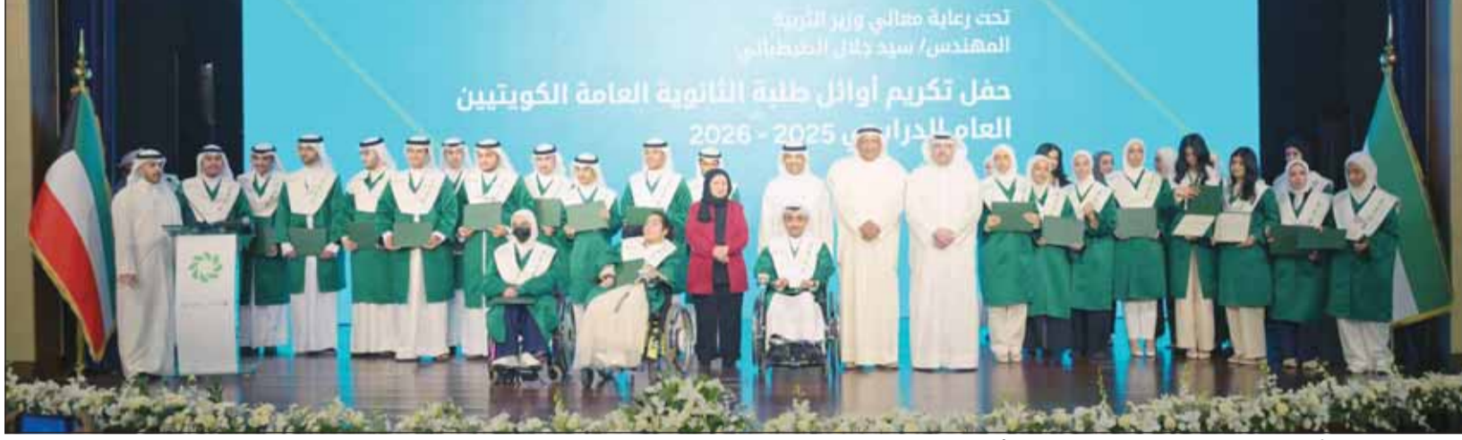
صورة جماعية لمسؤولي بيت التمويل الكويتي والتربية مع الفائزين خلال حفل التكريم