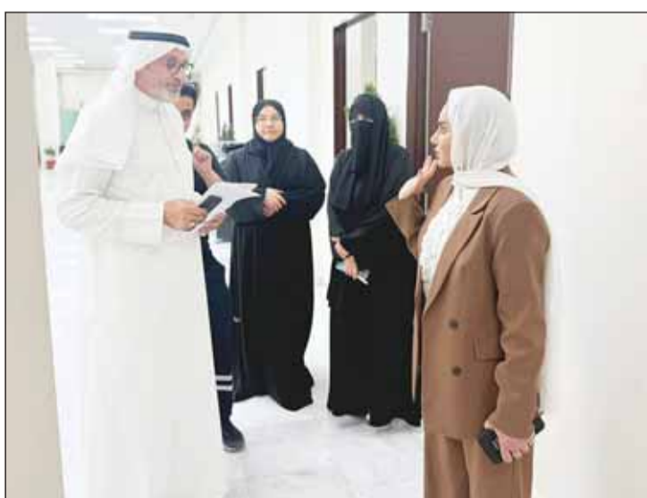
وزيرة الشؤون د. أمثال الحويلة خلال الجولة

قامت وزيرة الشؤون الاجتماعية وشؤون الأسرة والطفولة الدكتورة أمثال الحويلة بزيارة تفقدية إلى المجلس الأعلى لشؤون الأسرة، وذلك في إطار متابعتها المستمرة لسير العمل والإطلاع على آلية العمل داخل المجلس.