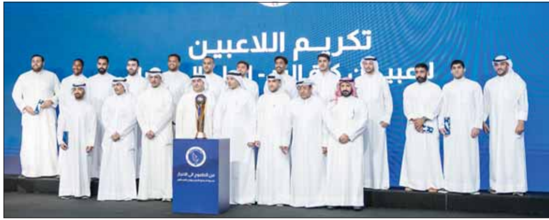
لقطة جماعية لفرق يد برقان بطل آسيا خلال الحفل