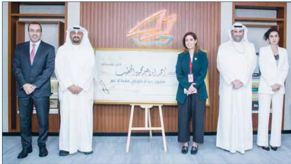
مسؤولو بنك الخليج في ختام سحب مليونير الدانة