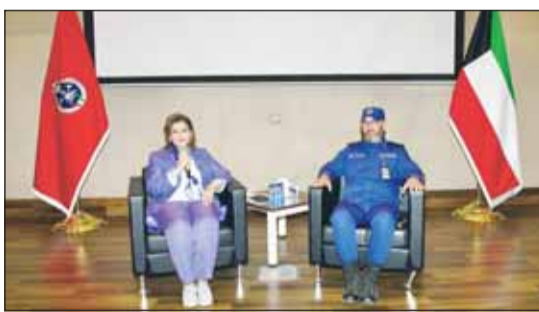
اللواء طلال الرومي والسفيرة الشبيخة جواهر إبراهيم الدعيج

نظمت قوة الإطفاء العام، بحضور رئيس القوة اللواء طلال محمد الرومي ومساعد وزير الخارجية لشؤون حقوق الإنسان السفيرة جواهر إبراهيم الدعيج، لقاء مع الدفعة الأولى من ضابطات المنصر النسائي، وذلك في إطار دعم الكفاءات الوطنية وتعزيز دور المرأة في المنظومة العسكرية. وشهد اللقاء استعراض تجربة الدفعة الأولى من الضابطات وما حقته من حضور متميز في مختلف مجالات العمل، إلى جانب مناقشة سبل دعم مشاركتهن وتطوير قدراتهن من خلال توفير بيئة عمل محفزة، وإثارة الفرص التدريبية والوظيفية التي تسهم في الارتقاء بكفاءتهن المهنية.