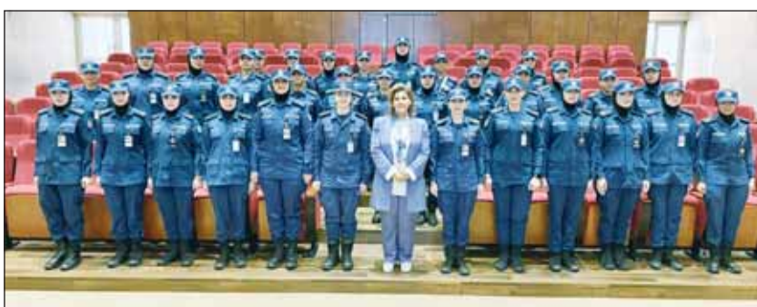
السفيرة الشبيخة جواهر إبراهيم الدعيج متوسطة ضابطات الإطفاء

كما تضمن اللقاء تبادل الأحاديث الودية، ومناقشة عدد من الموضوعات ذات الاهتمام المشترك، بما يعكس اهتمام الدولة بتعزيز دور المرأة في المؤسسات العسكرية، وترسيخ مبدأ تكافؤ الفرص، بما يواكب توجهات التنمية ويميز جاهزية وكفاءة قوة الإطفاء العام في أداء رسالتها الوطنية.