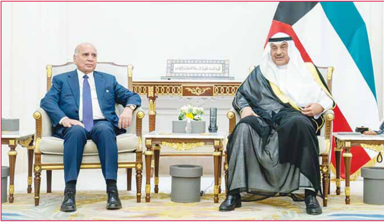
ولي العهد استقبل وزير... الخارجية العراقي والشؤون الخارجية الهندي 03