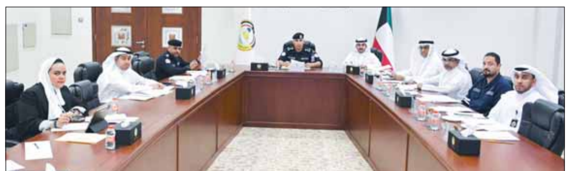
اجتماع اللجنة الأمنية في محافظة الجهراء

الحركة والمخاطر غير النظامية، ودراسة مواقع تتطلب حلولاً مرورية مناسبة، بما يسهم في تحقيق انسجامية