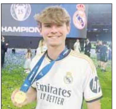
بار أختد مهاجم الميرينغزي

يوصل نادي ريال مدريد الإسباني، تحصيل مواهبه الكروية الشاب بعمود رجيحة، تعود على النادي بفوائد مالية سواء في حال الإعارة والبيع أو إعادة البيع.