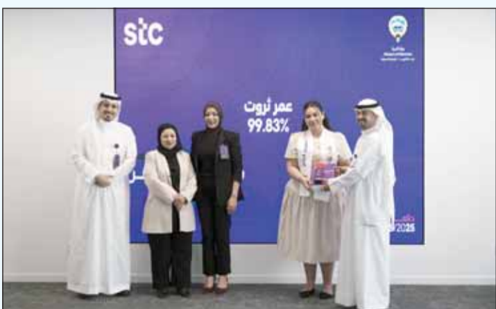
تكريم أبناء الموظفين المتفوقين

نحو التميز. ومن خلال مبادراتنا التعليمية "upgrade"، نؤكد التزامنا بتوفير فرص تُقَدّر إنجازات الطلاب، وتُعلي من شأن تقائهم، وتُلهمهم لمواصلة السعي نحو النجاح. وأضاف النوبيت، "يُعد تكريم الطلاب المتميزين أحد السبل العديدة التي نؤكد بها التزامنا بدعم التعليم وتمكين الشباب في الكويت. ونحن فخورون بالاحتفاء بإنجازات الطلاب من مختلف الخلفيات التعليمية، وسنواصل بناء شراكات استراتيجية مع الجهات الحكومية والخاصة لإطلاق مبادرات تساهم في تطوير قطاع التعليم وتمكين الشباب في الكويت سواء على الصعيد الأكاديمي أو الشخصي، لتحقيق كامل إمكاناتهم". كما أكدت stc أن دعم الطلاب وتكريم الإنجازات الأكاديمية يظلان جزءاً لا يتجزأ من التزام الشركة بتمكين الشباب ودعم قطاع التعليم. وانطلاقاً من شراكاتها الاستراتيجية مع الجهات الحكومية والخاصة، تواصل شركة الاتصالات الكويتية إطلاق مبادرات مؤثرة تساهم في النهوض بالتعليم، وتنمية المواهب الوطنية، وتشجيع الابتكار.