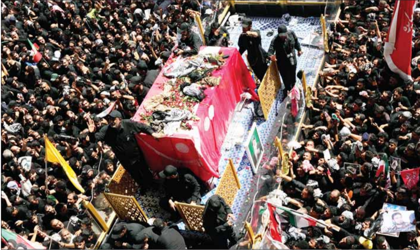
موكب تشييع المرشد الإيراني السابق علي خامنئي يسبق طريقه بصعوبة وسط عشرات آلاف المشيعين داخل مرقد الإمام علي في النجف بالعراق أمس

قشم ومدينة سيريك، قاتلاً إنه جرى سماع دوي 10 انفجارات في ميناء بندر عباس وثمانية انفجارات في منطقة طاهورية بمدينة سيريك وسعة انفجارات أخرى في قرية ميسين بجزيرة قشم، مضيفا أن إصابات عدة وقعت جراء استهداف ميناء تجاري بمدينة سيريك عند الساعة الثانية بعد منتصف الليل وتم نقل الجرحى لمستشفيات مدينة ميناب بمحافظة هرمزگان، ونقل التلفزيون عن السلطات المحلية بمحافظة هرمزگان القول إن أعمدة الدخان المتصاعدة في غرب مدينة بندر عباس تعود لاستهداف رصيف الصيد في المدينة أدى لإشتعال النيران في عدد من زوارق الصيد.