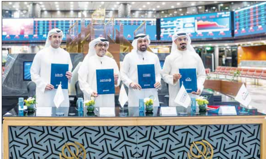
صورة جماعية بعد توقيع اتفاقية الشراكة