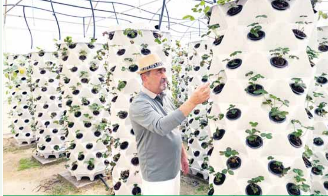
معرفي يشرح عملية الزراعة في الأبراج

□ عودة خدمات "هيئة الزراعة" إلى الوفرة والعدلي ضرورية □ تدوير بقايا المزارع وفضلاتها أفضل من رميها في العراء