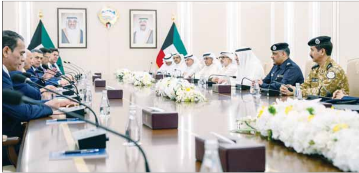
جانب من جلسة المباحثات بين الجانبين الكويتي والعراقي

بدوره، استقبل وزير الخارجية الشيخ جراح الجابر، أول من أمس، وزير خارجية جمهورية العراق الشقيق الدكتور فؤاد حسين بمناسبة زيارته الرسمية إلى دولة الكويت. وقالت وزارة الخارجية الكويتية في بيان صحافي إن الوزير الشيخ جراح الجابر أقام مأدبة عشاء عمل على شرف وزير الخارجية العراقي والوفد المرافق. وأوضحت أنه جرى خلال مأدبة عشاء العمل بحث عدد من القضايا ذات الاهتمام المشترك فضلا عن تطورات الأحداث الراهنة في المنطقة. من جهة أخرى، تلقى وزير الخارجية الشيخ جراح الجابر اتصالا هاتفيا من أمس، من وزير خارجية المملكة العربية السعودية الشقيقة الأمير فيصل بن فرحان. وذكرت وزارة الخارجية في بيان أنه جرى خلال الاتصال مناقشة أفر التطورات التي تشهدها المنطقة لا سيما التصعيد الراهن وتداعياته والجهود المبذولة لخفض التصعيد وامتواء التوتر وتعزيز الطول الدبلوماسية بما يسهم في الحفاظ على الأمن والاستقرار الإقليمي.