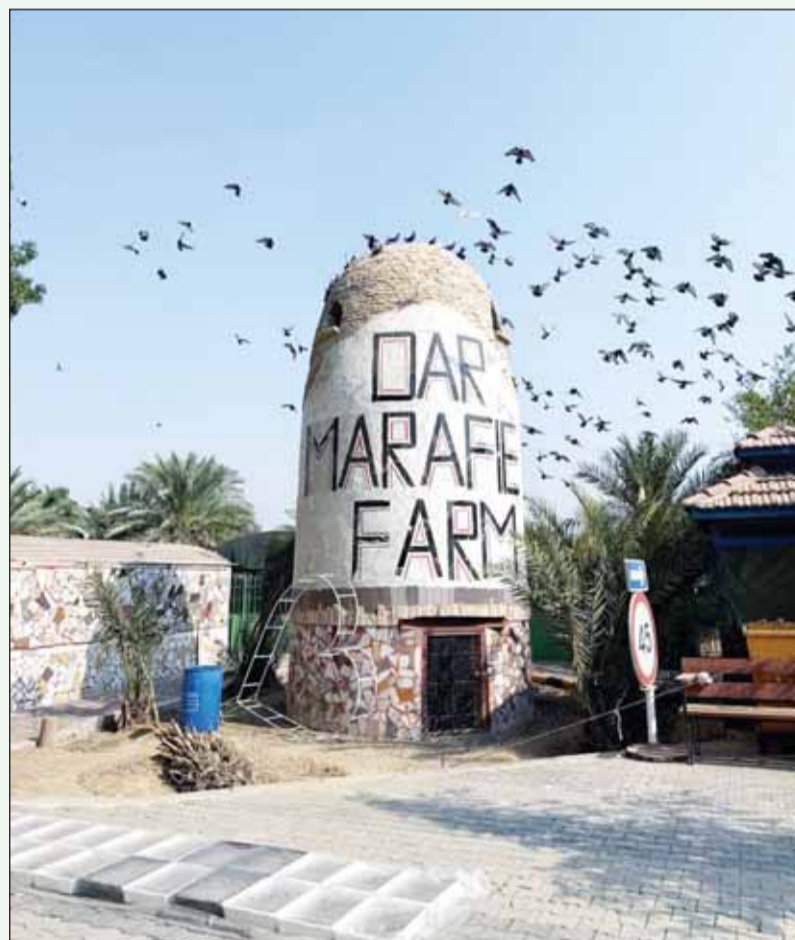
برج طيور في المزرعة

وفتم أبو عمار حديثه بأهمية "استغلال أو استثمار جميع الحيارات الزراعية في الوفرة وعدم السماح لبعض المزارعين فيها بتأجير مزارعهم للغير، واعتماد الجديد والحديث في عالم المواد، والمستلزمات الزراعية، خصوصاً البذور والتقاوي القوية المناسبة لأجواء الكويت.