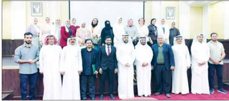
جانب من حضور الجلسة الختامية

بعد سلسلة من الجلسات واللقاءات الأدبية، اختتم منتدى المبدعين في رابطة الأدباء الكويتيين موسمه الثقافي، وشهدت الجلسة الختامية للمنتدى قراءات أدبية للنصوص التي أنتجها الأعضاء خلال الموسم، تنوعت بين الشعر والقصة القصيرة والنصوص.