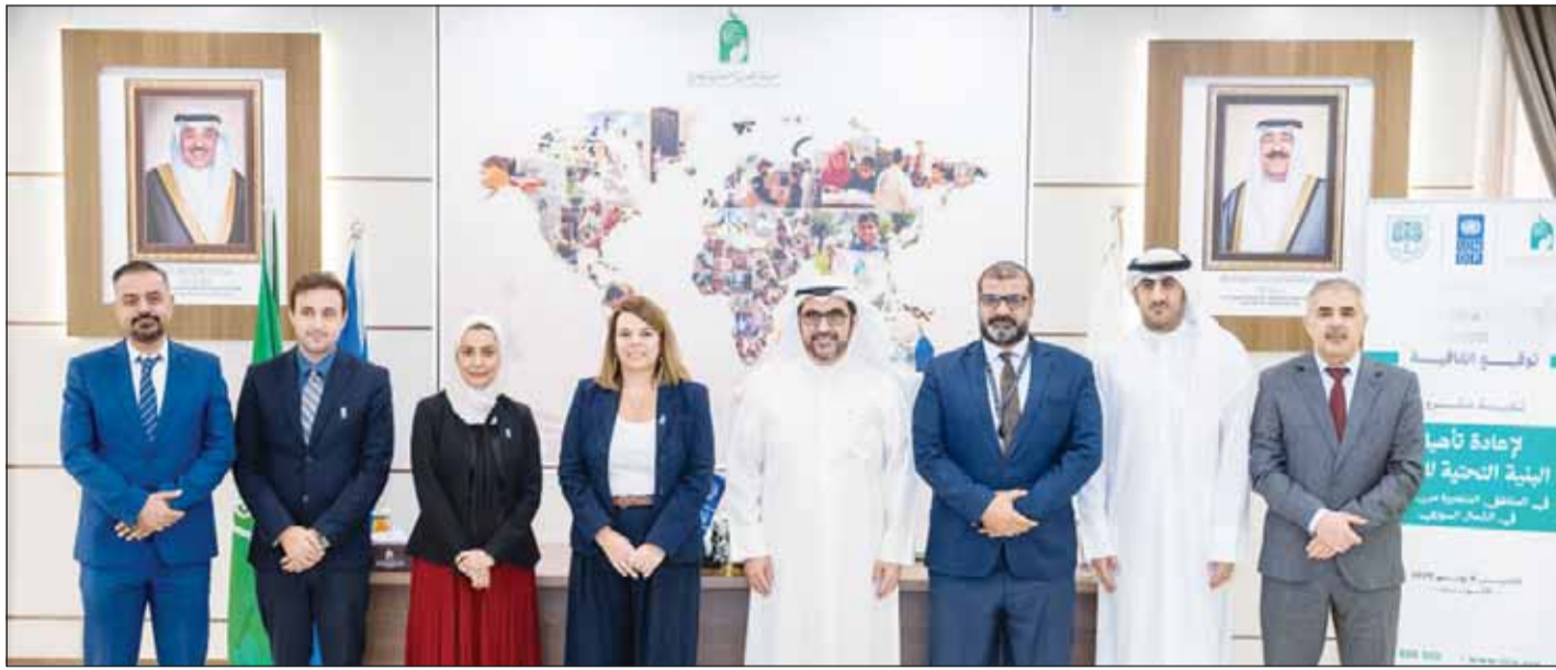
ممثلو الهيئة الخيرية وبرنامج الأمم المتحدة الإنمائي عقب توقيع الاتفاقية