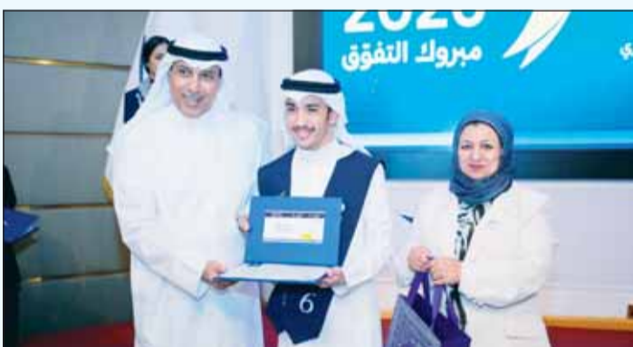
جانب من تكريم المتفوقين

واختتم "تنتظح إلى أن تواصلوا مسيرتكم العلمية والمهنية بنفس العزيمة والإصرار، وأن تكونوا نماذج مشرفة لوطنكم ومجتمعكم في المستقبل، سائلين المولى عز وجل أن يوفقكم جميعاً ويسدد خطاكم، وأن يديم على وطننا العزيز نعمة الأمن والاستقرار والازدهار".