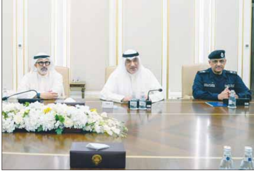
النائب الأول الشيخ فهد اليوسف مترئسا الجانب الكويتي خلال الجلسة