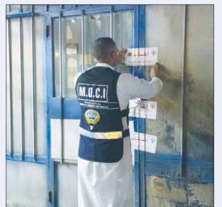
إغلاق المحل بعد ضبط الكمبريسورات

أعلنت وزارة التجارة والصناعة تمكن فريق طوارئ محافظتي الأممي ومبارك الكبير التابع لإدارة الرقابة التجارية وحماية المستهلك من ضبط 1399 (كمبريسور) لتكليف الهواء مستعملة ومجددة بمختلف الماركات والأحجام خلال جولة تفتيشية على عدد من المحال التجارية في المحافظات.