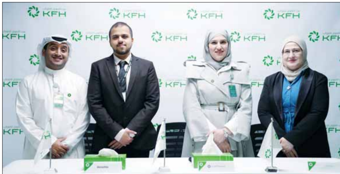
خلال عملية إجراء السحب

ويمكن للعملاء فتح حساب "الحصاد" و"الربح" من خلال الفروع المصرفية، وخدمة KFHonline، وأجهزة الصرف الآلي والاستفادة من الفرص المميزة التي توفرها، والتي تمنحهم المزايا الفورية بجوائز قيمة في السحوبات القادمة، إلى جانب المصرفية والتي تلبي تطلعاتهم وتعزز تجربتهم المصرفية.