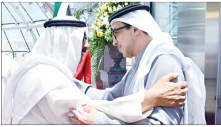
سمو الأمير مرحباً بالشيخ منصور بن زايد