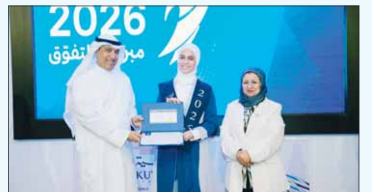
تكريم إحدى المتفوقات