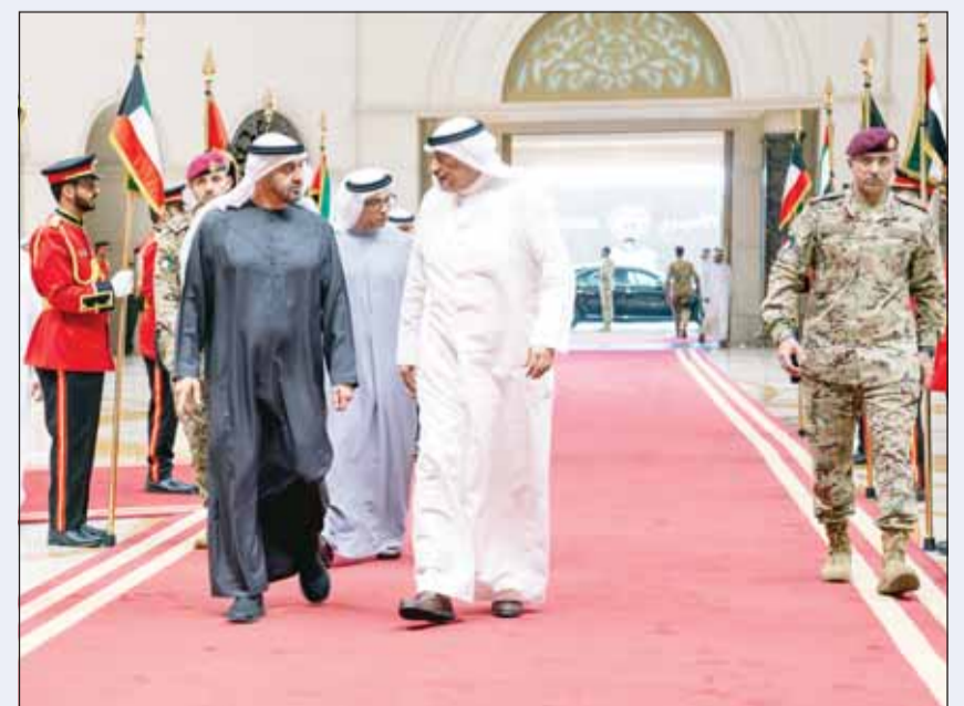
سمو ولي العهد الشيخ صباح الخالد في وداع رئيس الإمارات الشيخ محمد بن زايد