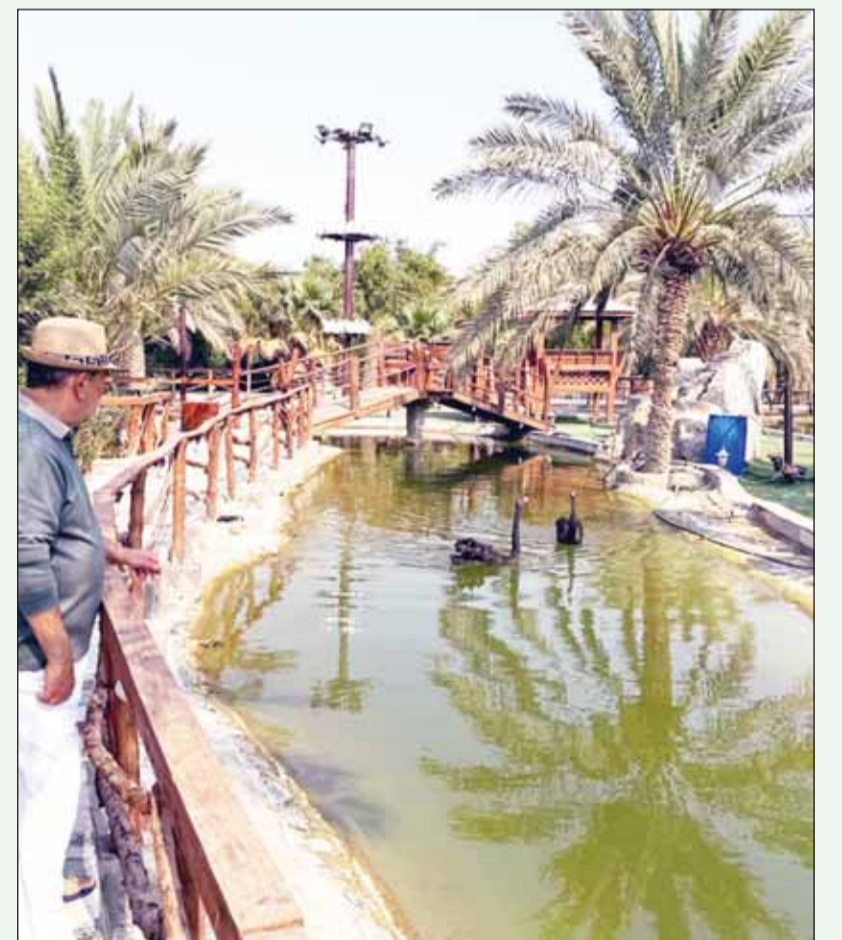
جانب من بحيرة الاسمال في المزرعة