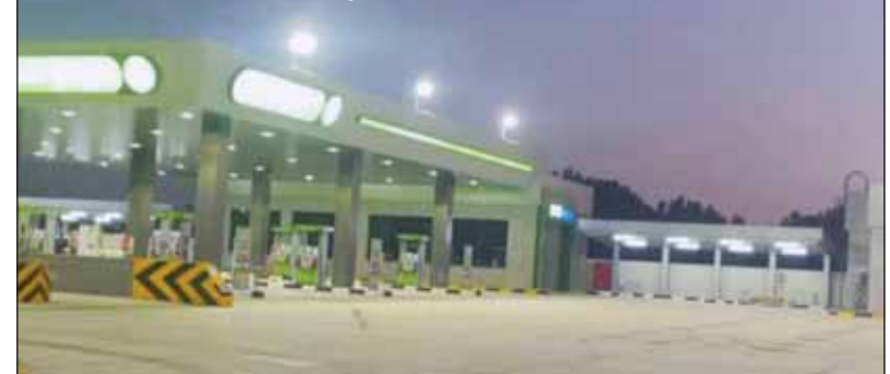
المحطة بعد الصيانة

أعيد مطلع شهر يوليو الجاري افتتاح محطة بنزين الوفرة الزراعية، في شارع محمد الجلال السهلي، بعد الانتهاء من صيانتها. وقد رحب بهذه العودة الدكتور فالح العبد الناشط الزراعي والمزارع المعروف في منطقة الوفرة الزراعية، وكذلك العديد من المزارعين.