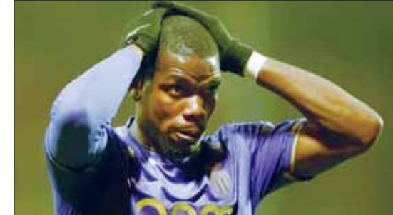
موناكو لا يرغب باستمرار بوغبا معه

يواجه النجم الفرنسي بول بوغبا مستقبلاً غامضاً في فريق موناكو، حيث أقرت إدارة النادي بملكانية بيع اللاعب الفائز بكأس العالم عام 2018 هذا الصيف.