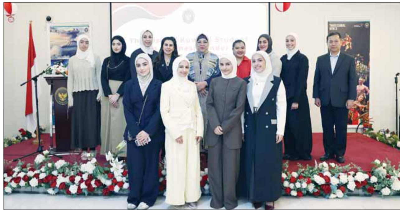
سفيرة إندونيسيا لينا ماريانا متوسطة الطالبات

استضافت سفارة جمهورية إندونيسيا لدى البلاد وفد طالبات المرحلة الثانوية المشاركات في النسخة الـ15 من برنامج "كن من المتفوقين"، الذي نظمه الصندوق الكويتي للتنمية هذا العام من خلال رحلة إلى إندونيسيا خلال الفترة من 15 إلى 25 يناير الماضي، بحضور عدد من المسؤولين المشرفين على البرنامج من الصندوق الكويتي.