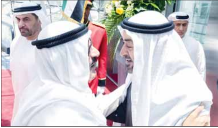
سمو الأمير مستقبلاً رئيس الإمارات

□ الأمير ورئيس الإمارات أكد تعزيز وحدة الصف ومسيرة مجلس التعاون لدول الخليج العربية □ بحث آخر المستجدات إقليمياً ودولياً وفي مقدمتها تطورات الأوضاع في منطقة الشرق الأوسط