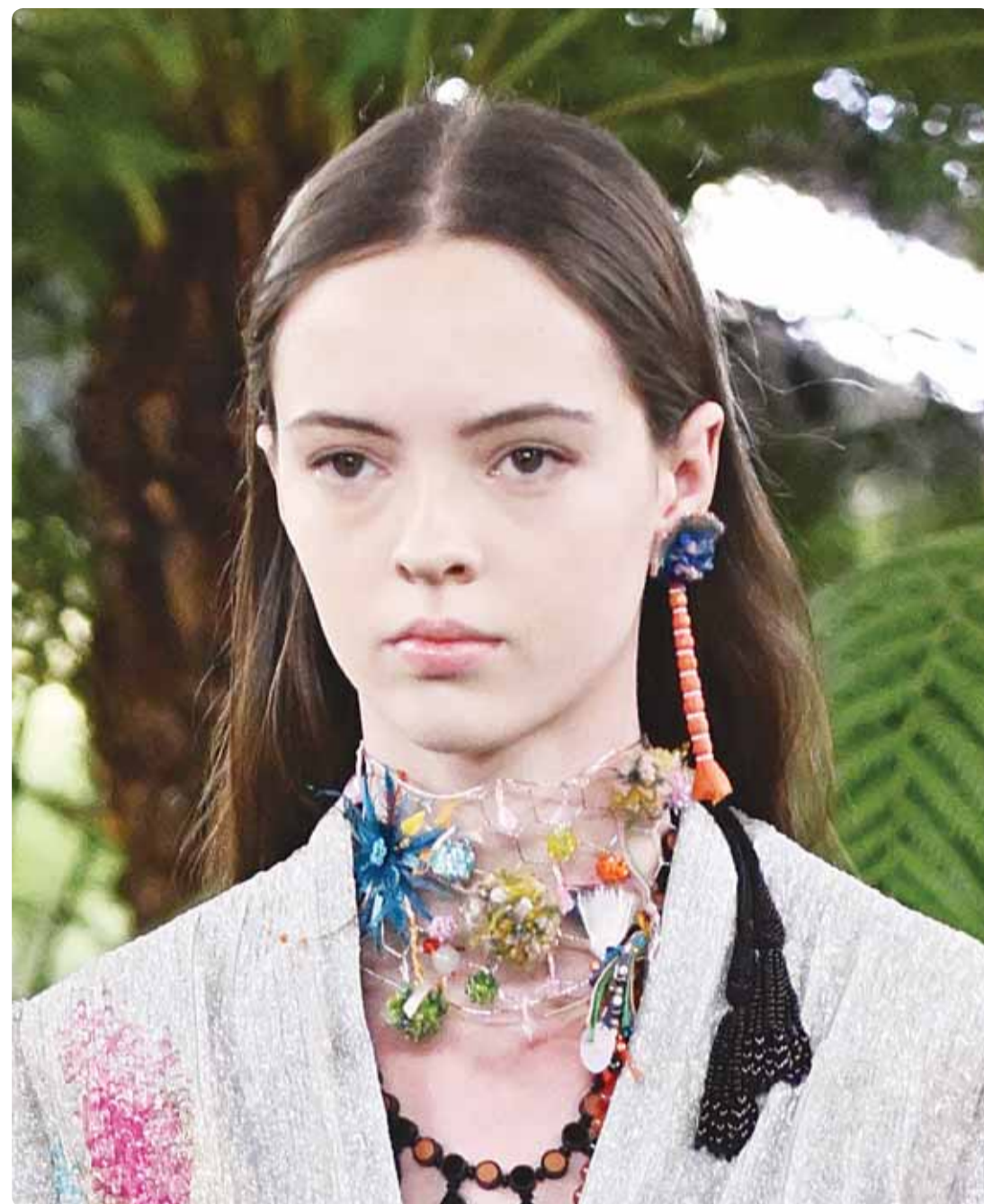
عارضة فيع زيم من مجموعة "كريستيان ديور" خلال عروض أسبوع باريس للموضة

أرجو المعذرة لكتي مضطر لذكر أمر ما، فقد عملت بسفراتنا في البرازيل، وفي أحد الأيام شعرت بشيء من البرق يمر بالشقة، عندئذ تحرك كتاب في مكتبي من صف الكتب، وسقط بشكل جميل للفاية، فشعرت بالفرح فخرجت ثم عدت بعد ساعتين، وفتحت الباب وأنا أذكر الله، فلا بد لي من الذهاب إلى عملي بعد ساعات، والسؤال، ماهذا، لا شك أن هناك عالماً آخر لا نراه أمام أعيننا.