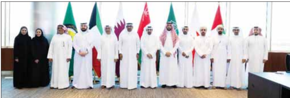
المشاركون في الاجتماع

شبكة الربط الخليجي، وأخر التطورات المتعلقة بمشاريع الربط الثنائية بين الدول الأعضاء. وفي ختام أعمالها، أوصت اللجنة بضرورة مواصلة تطوير المنظومة وتعزيز جاهزيتها، بما يدعم استدامة إمدادات الكهرباء، ويواكب خطط التوسع في تجارة الطاقة الإقليمية.