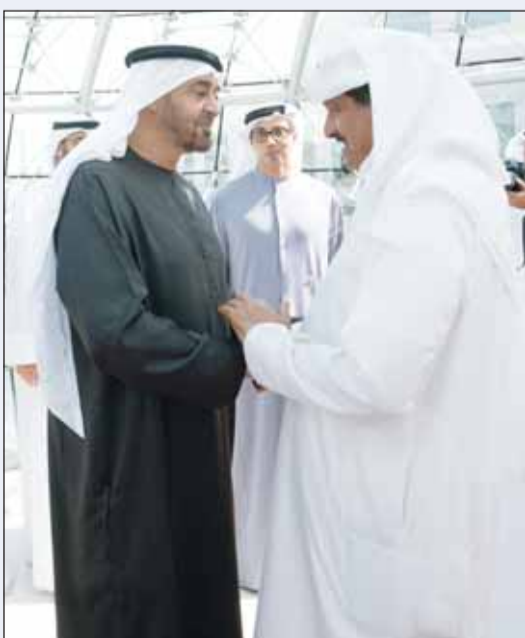
سمو الشيخ أحمد عبدالله مودعاً الشيخ محمد بن زايد

غادر البلاد امس، صاحب السمو الشيخ محمد بن زايد آل نهيان رئيس دولة الإمارات العربية المتحدة الشقيقة والوفد المرافق لسموه وذلك بعد الزيارة الأخوية. وكان في مقدمة مودعي سموه على أرض المطار أخوه سمو ولي العهد الشيخ صباح الخالد. كما كان في وداع سموه سمو رئيس مجلس الوزراء الشيخ أحمد عبدالله والنائب الأول لرئيس مجلس الوزراء وزير الداخلية الشيخ فهد اليوسف ووزير شؤون الديوان الأميري الشيخ حمد جابر العلي ورئيس ديوان سمو ولي العهد الشيخ ثامر الجابر. وكان سمو الشيخ محمد بن زايد آل نهيان رئيس دولة الإمارات العربية المتحدة الشقيقة وصل إلى البلاد والوفد المرافق لسموه وذلك في زيارة أخوية. وكان على رأس مستقبلي سموه على أرض المطار أخوه سمو أمير البلاد الشيخ مشعل الأحمد وسمو ولي العهد الشيخ صباح الخالد. كما كان في استقبال سموه سمو رئيس مجلس الوزراء الشيخ أحمد عبدالله والنائب الأول لرئيس مجلس الوزراء وزير الداخلية الشيخ فهد اليوسف ووزير شؤون الديوان الأميري الشيخ حمد جابر العلي. هذا ويرافق سموه وفد يضم سمو الشيخ منصور بن زايد آل نهيان نائب رئيس الدولة نائب رئيس مجلس الوزراء رئيس ديوان الرئاسة والفريق سمو الشيخ سيف بن زايد آل نهيان نائب رئيس مجلس الوزراء وزير الداخلية وسمو الشيخ حمدان بن محمد بن زايد آل نهيان نائب رئيس ديوان الرئاسة للشؤون الخاصة ومعالي الشيخ محمد بن حمد بن طحون آل نهيان مستشار صاحب السمو رئيس الدولة وعدداً من كبار المسؤولين في دولة الإمارات العربية المتحدة الشقيقة.