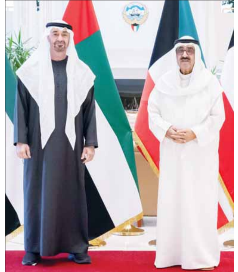
سمو الأمير الشيخ مشعل الأحمد ورئيس الإمارات الشيخ محمد بن زايد