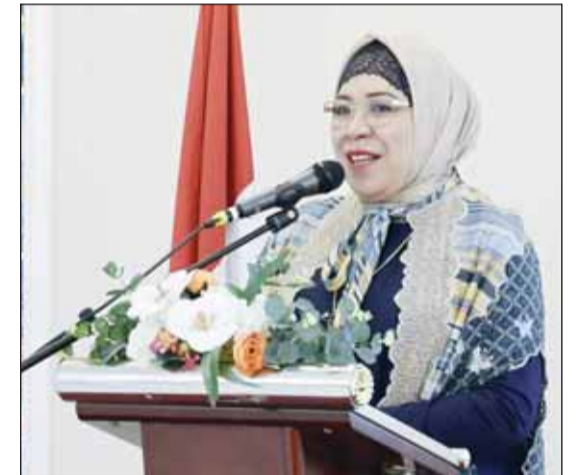
سفيرة إندونيسيا لينا ماريانا متحدث

وأضافت، "نعرب عن تقديرنا العميق لمساهمة الصندوق الكويتي القيمة في تنمية إندونيسيا، وفي تعزيز العلاقات بين بلدينا". وقالت، "أكثر ما أثار إعجابي هو حماسكن واستعدادكن التام للاطلاع والتعلم، وأمل أن تكون هذه التجربة قد عرفتكن بإندونيسيا، وألهمتكن لتصبحن سفيرات شابات للصداقة، وأن