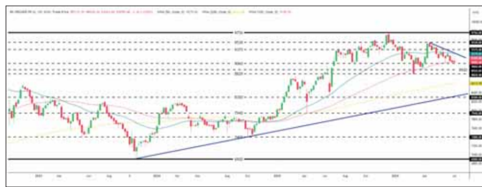
المؤشر الأول فوق مستوى الدعم القوي عند 8,828 نقطة

5,09٪ نمواً بالسيولة الأسبوع الماضي وعدد الصفقات يرتفع 2,82٪