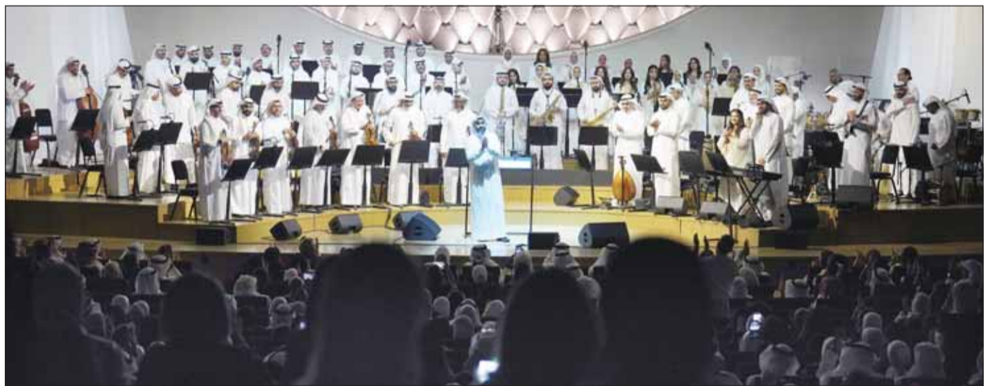
جانب من الامسية برعاية زين

أعلنت زين الكويت عن رعايتها للعرض الفني "وطني" الذي أقيم على خشبة مسرح جابر العلي في مركز الشيخ جابر الأحمد الثقافي من تقديم "سين" للإنتاج الفني، وهو العمل الأوركستراي الذي أعاد تقديم باقة من أجمل الروائع الوطنية الكويتية التي ارتبطت بذاكرة الوطن ووجدان أبنائه على مدى عقود.