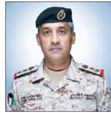
العقيد سعود العطوان

أمن الكويت خط أحمر ونحتفظ بحقوقنا في اتخاذ ما يلزم لصون سيادتنا