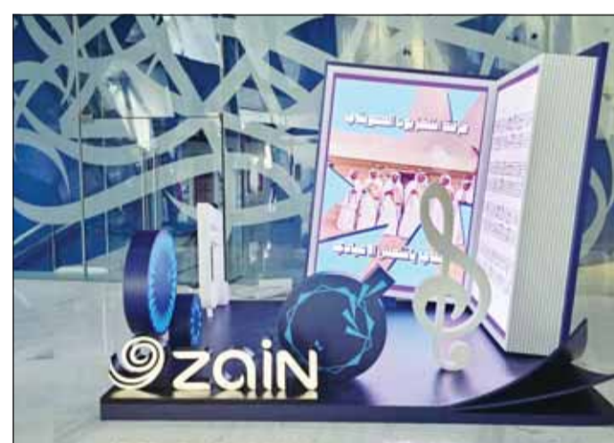
زين ترعى العرض الفني "وطني"

وحرصت زين على أن تكون مشاركتها في هذا العمل امتداداً لدورها في دعم الفعاليات الوطنية والثقافية التي تجمع المجتمع حول قيم الفقر والانتماء، وتقدم محتوى