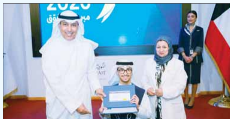
وتكريم متفوقاً آخر