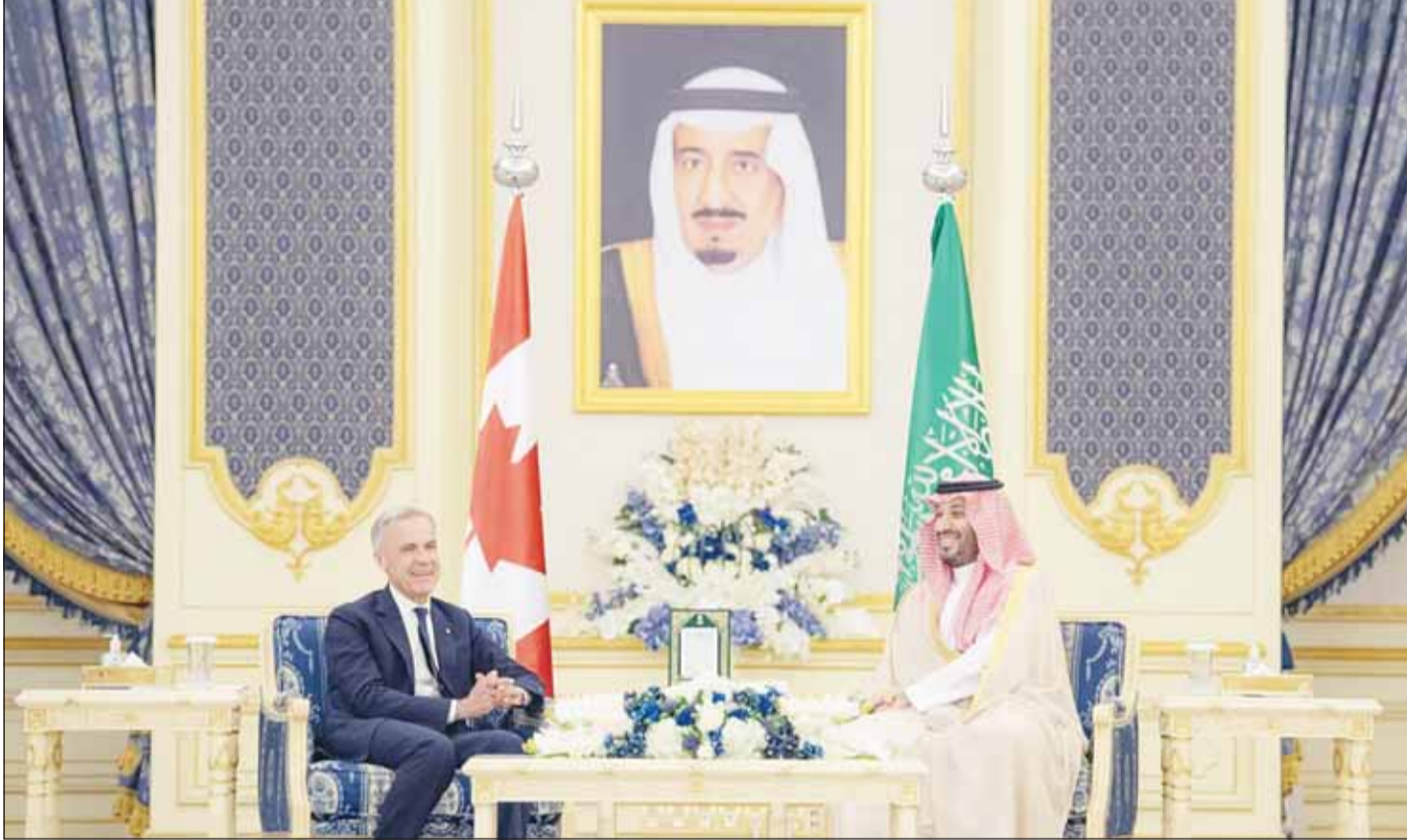
ولي العهد السعودي الأمير محمد بن سلمان مستقبلا رئيس الوزراء الكندي مارك كارني في قصر السلام في جدة أمس