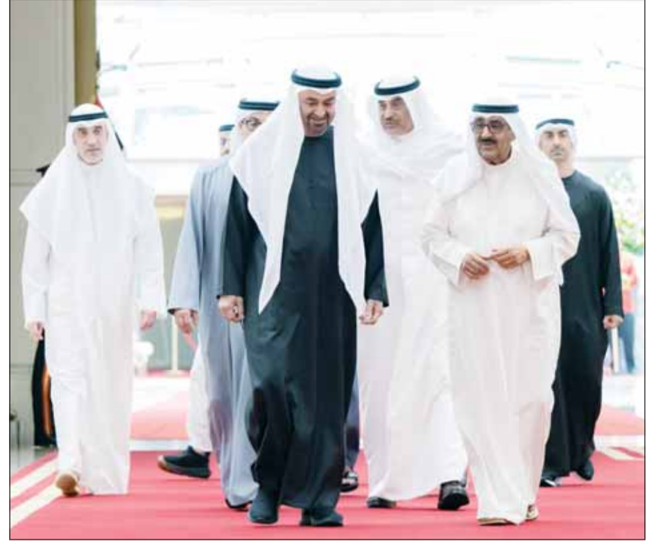
سمو الأمير الشيخ مشعل الأحمد مستقبلاً رئيس الإمارات الشيخ محمد بن زايد لدهم وصوله