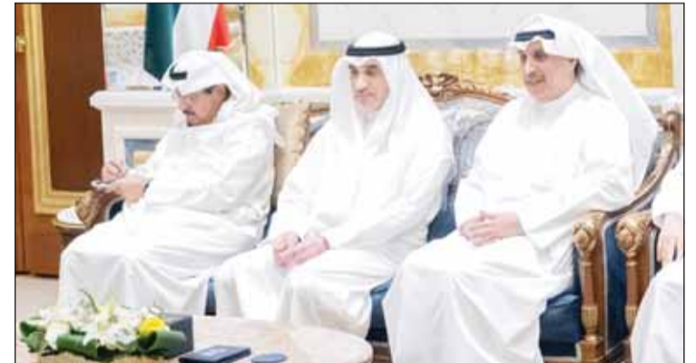
سمو الشيخ أحمد عبدالله والشيخ فهد اليوسف والشيخ حمد جابر العلي