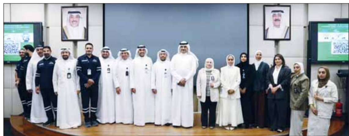
كوادر "الكهرباء" والناقلات" المشاركون في الفعالية

في الاطار نفسه، وافق الجهاز المركزي للمناقصات العامة على توصية الوزارة بشأن مناقصة تحديث معدات وتجميع وتحليل البيانات القائمة لمحطات توليد القوى الكهربائية ومحطات التحويل الرئيسية القائمة. من جهة أخرى، شاركت الوزارة ممثلة بالهيئة الوطنية لتوفير الطاقة والمياه "وفا" وإدارة الطاقة المتجددة، في فعالية معرض "العيش المستدام وكفاءة الطاقة في المباني"، التي نظمتها شركة ناقلات النفط الكويتية لموظفيها من 8-9 يوليو الجاري، ضمن جهود تعزيز مفاهيم الاستدامة والمحافظة على الموارد الطبيعية.