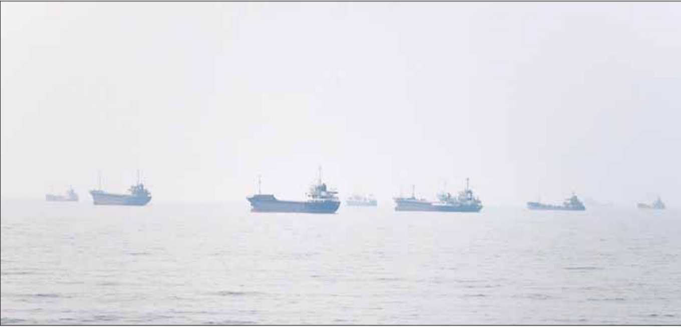
سفن تجارية في مضيق هرمز قبالة بندر عباس مع انتهاء المهلة التي منحتها أميركا لإيران لإصدار بيان رسمي تتعهد فيه وقف استهداف حرية الملاحة

إيرانية وعراقية، ولا سيما في طهران وقم والنجف وكربلاء ومشهد، عكست ما وصفه بـ"الحضور التاريخي والكاثر للأعداء"، معرباً عن شكره لعشرات الملايين الذين شاركوا في المراسم، في حين توعد أمين المجلس الأعلى للأمن القومي محمد باقر ذو القدر بالرد على أي هجوم يستهدف البنية التحتية الإيرانية، مؤكداً أن إسرائيل لن تكون بمنأى من أي رد إيراني محتمل.