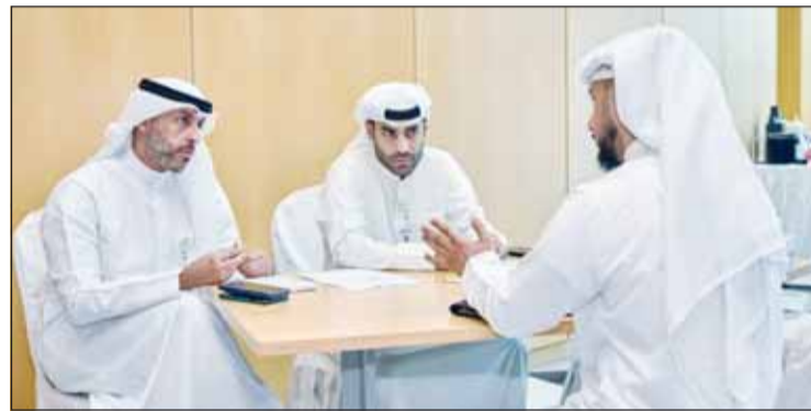
مقابلة خلال اليوم الوظيفي