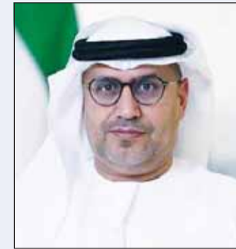
السفير الإماراتي مطر النيايدي