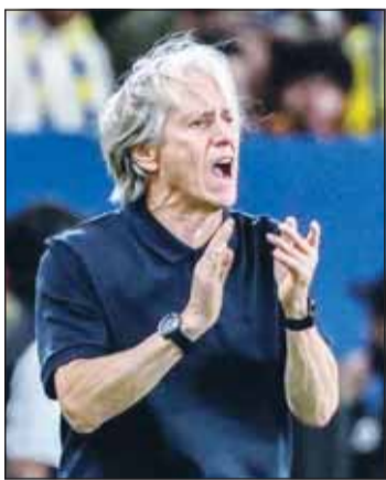
جورجيه جيسوس مدرباً للبرتغال

أعلنت صحيفة "البلوا" البرتغالية وموقع "ورلد سوكور توك"، أن عقد مدرب منتخب البرتغال الجديد جورجيه جيسوس، والذي خلف الإسباني روبرتو مارتنيز، يمتد حتى يونيو 2030 ليشراف بموجبه جيسوس على قيادة البرتغال في بطولتي "يورو 2028" وكأس العالم 2030. وسيكون أول اختيار رسمي للمدرب جيسوس في 24 سبتمبر المقبل عندما يواجه منتخب ويلز ضمن منافسات دوري الأمم الأوروبية. وجاء تعيين جيسوس مدرباً للبرتغال، بعد استقالة روبرتو مارتنيز عقب الفرج المخيب لمنتخب البرتغال من ثمن نهائي كأس العالم الحالي 2026 أمام إسبانيا.