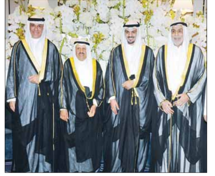
الشيخ دعيخ الخليفة يهنئ