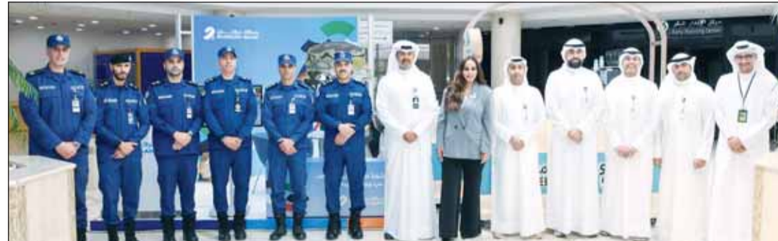
صورة جماعية لفرق البنك ومنتسبي الإطفاء

وفي إطار هذه المبادرة، حرص بنك برقان على تقديم مواد توعوية ضمن الحملة المصرفية الوطنية "لنكن على دراية"، التي أطلقها بنك الكويت المركزي بالتعاون مع اتحاد مصارف الكويت ودعم البنوك المحلية، بهدف تعزيز الثقافة المالية وترسيخ مفاهيم الاستخدام الآمن للخدمات المصرفية والرقمية. كما ركزت هذه المواد على رفع مستوى الوعي بمخاطر الاحتيال الإلكتروني وأساليب الوقاية منه، بما يساهم في تعزيز الممارسات المصرفية الآمنة وترسيخ الوعي المالي لدى مختلف شرائح المجتمع.