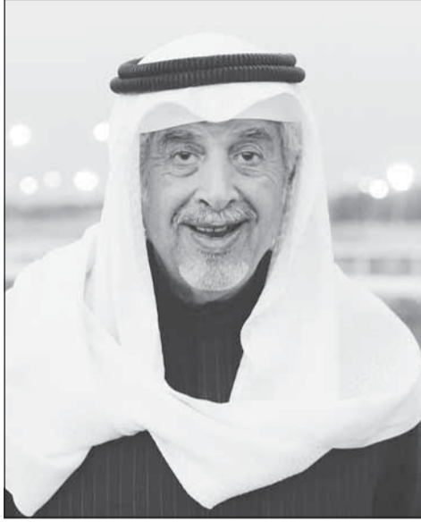
الشيخ علي الحمد الصباح

فقدت الفروسية الكويتية نائب رئيس نادي الصيد والفروسية الأسبق الشيخ علي الحمد السلمان الصباح عميد اسبطل "النشاما". ويعد الشيخ علي الحمد من موسسي الفروسية الكويتية وحقق العديد من الإنجازات في سباقات الخيل. وتقدم رئيس وأعضاء نادي الصيد والفروسية بخالص العزاء إلى أسرة الفروسية في وفاة أحد أعمدتها الرئيسية.