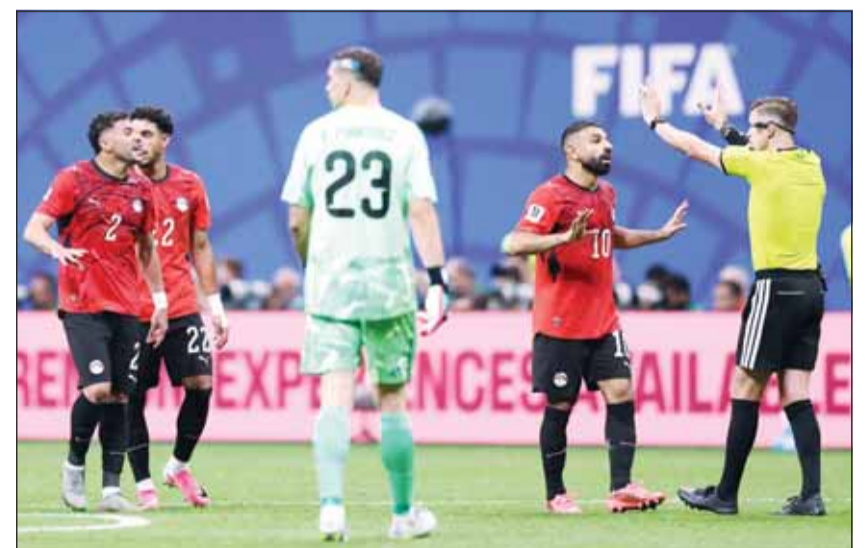
جانب من لقاء مصر والأرجنتين المثير للجدل

تشير تقديرات المؤسسات المالية إلى أن بطولة كأس العالم 2026 باتت مرشحة لتصبح أكبر منصة للمراهنة الرياضية في التاريخ متجاوزة جميع البطولات السابقة. وسجلت منصة التوقعات المالية الأمريكية الشهيرة "كالشي" نشاطاً قياسياً غير مسبق بالتزامن مع الزخم الموندالي، حيث بلغت أحجام التداول عليها أكثر من 31 مليار دولار في يونيو وحده. ويمثل هذا الرقم قفزة هائلة بارتفاع تجاوز 70٪ مقارنة بالشهر السابق، مما يعكس الشغف الاستثماري المتزايد وتحول البطولة الكروية إلى المحرك الأساسي لتدفقات المنصة النقدية. وفي سوق المنصات الأمريكية والمشفرة، واصلت منصة "بوليماركت" هيمنتها محققة رقماً قياسياً جديداً يبلغ حجم تداولاتها 10,8 مليار دولار.