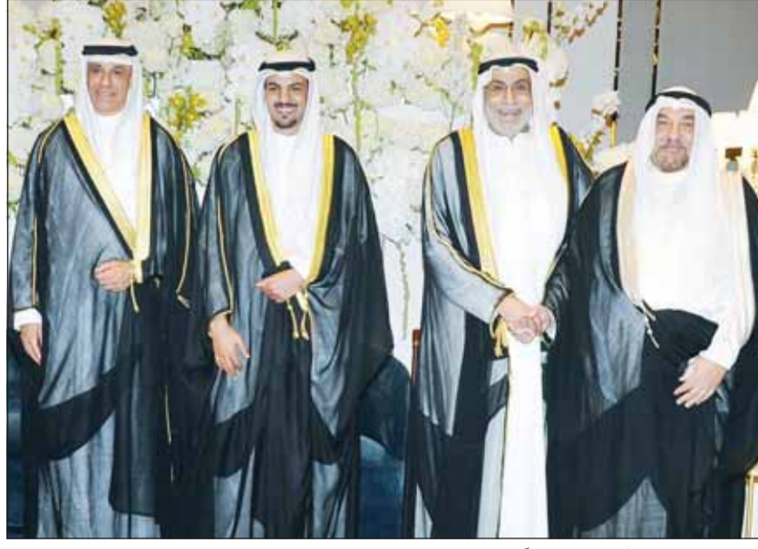
الشيخ خليفة عبدالله الجابر مهنتاً