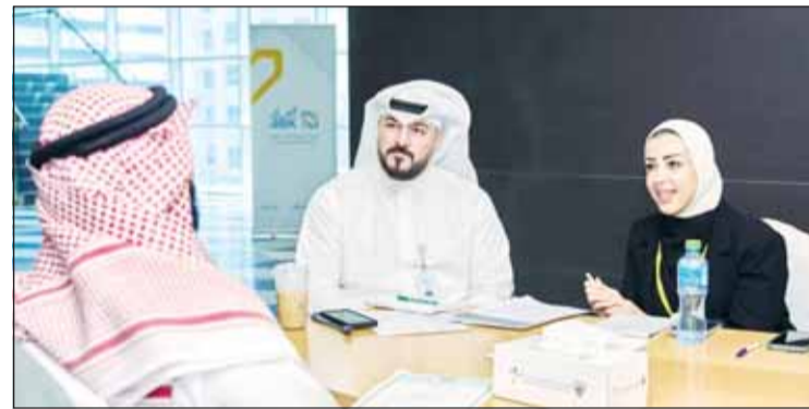
استقبال طلبات التوظيف

وأفادت الأربش "نحن لا نبحث فقط عن مواهب أكاديمية، بل نستقطب الشغف والطموح لتقديم بيئة عمل جاذبة