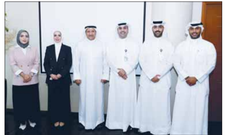
فريق البنك مع ممثلي الأمانة العامة لمجلس الجامعات الخاصة

الجامعات الخاصة يعكس التزام وياء بالمساهمة في دعم الطلبة خلال المراحل المفصلة من رحلتهم التعليمية. ومن جانبه، سلط الأمين العام لمجلس الجامعات الخاصة الدكتور جاسم العلي الضوء على أهمية دعم المبادرات التي تمنح الشباب المعرفة والإرشاد اللازمين لاتخاذ قرارات تصنع فرقا في مستقبلهم، مؤكداً أن التعاون مع بنك وياء يهدف إلى تقديم تجارب ومبادرات تثري معرفة الطلبة بالفرص الأكاديمية والمهنية المتاحة، وتساعدهم على رسم مساراتهم المستقبلية بثقة ووضوح أكبر. كما تناول الاجتماع إمكانية تنظيم فعاليات وورش عمل وأنشطة مشتركة في مواقع مختلفة ضمن حملة "اصنع مستقبلك"، بهدف توفير محتوى إرشادي وتفاعلي يساعد الطلبة على استكشاف ميولهم وإهتماماتهم، والتعرف على التخصصات والمسارات التعليمية التي تتناسب مع قدراتهم وأهدافهم المستقبلية. وتتنسج هذه الخطوة مع التزام وياء المستمر ببناء شركات استراتيجية ذات أثر إيجابي على المجتمع، وتطوير مبادرات مبتكرة تواكب احتياجات الشباب وتساهم في تعزيز جاهزيتهم لمتطلبات المستقبل. وفي ختام الاجتماع، أكد الجانبان أهمية استمرار التعاون والعمل على تطوير مبادرات مشتركة ضمن حملة "اصنع مستقبلك" بما يدعم الطلبة في مختلف مراحل رحلتهم الأكاديمية، ويساهم في تمكينهم من بناء مستقبلهم بثقة ووعي.