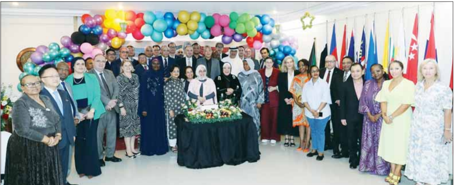
السفيرة الإندونيسية لينا ماريانا والسفيرة التركية طوبى سونمز مع الأسرة الدبلوماسية خلال الحفل

السفيرة ماريانا لزميلتها المغادرة: مثلت بلادك برقي وإخلاص ومهنية عالية