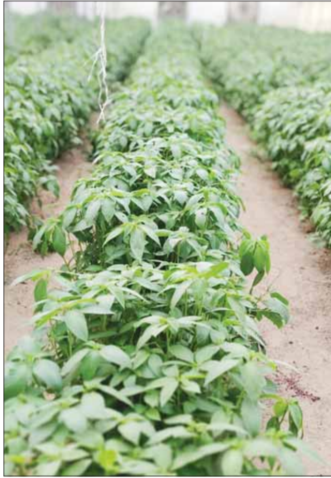
الملوخية... سيّدة المزارع