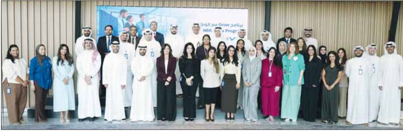
صورة جماعية لفرق البنك الوطني مع المنظمين للبرنامج

وأكدت النصرالله أن هذه المبادرات تساهم في ترسيخ بيئة عمل تعاونية قائمة على تبادل الخبرات بين مختلف الأجيال الوظيفية، بما يعزز نقل المعرفة ويدعم بناء قدرات مستقبلية قادرة على مواكبة التطورات المتسارعة في القطاع المصرفي والتكنولوجي.