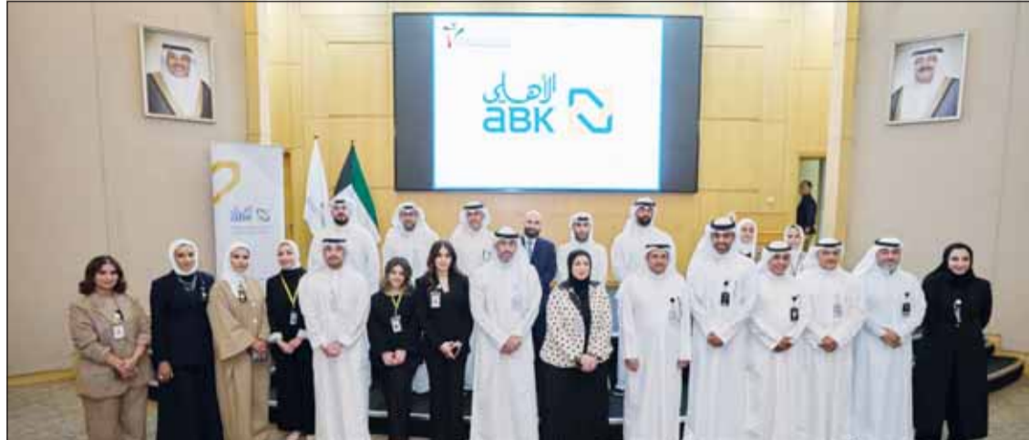
لقطة جماعية خلال الفعالية بحضور ممثلين البنك

وأشادت الأربش في نهاية تصريحها بجهود الهيئة العامة للقوى العاملة، مؤكدة حرص البنك على التعاون مع مختلف الجهات المعنية في دولة الكويت والمساهمة في توفير المزيد من فرص العمل للكويتيين في القطاع الخاص ضمن إطار رؤية كويت جديدة 2035 التحويلية.