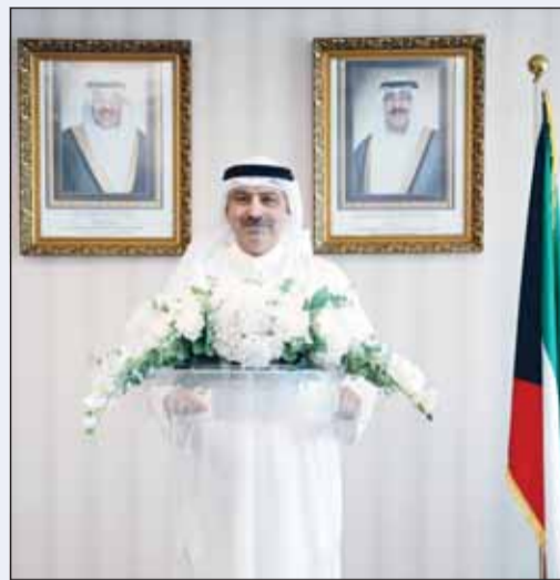
الدكتور بدر البصيري

أعلن وكيل وزارة التعليم العالي الدكتور بدر البصيري نتائج المقبولين في خطة البعثات الخارجية للعام الجامعي 2026/2027، مبيناً أن عدد المقبولين بلغ 2704 من الطلاب والطالبات فريجي الثانوية العامة للعلمين الدراسيين 2024/2025 و2025/2026، بمختلف أنظمة التعليم في المدارس الحكومية والخاصة والأجنبية.