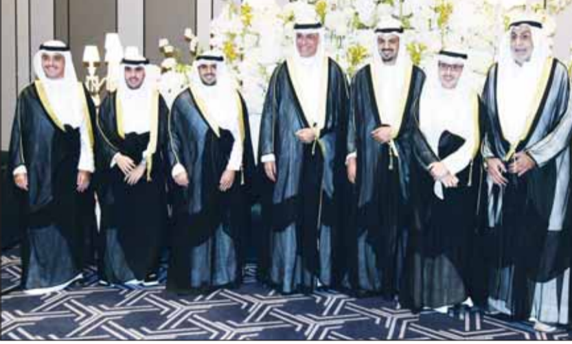
الشيخ د.أحمد ناصر المحمد وأبنائه الشيخ محمد وناصر وعبدالله يقدمون التهاني