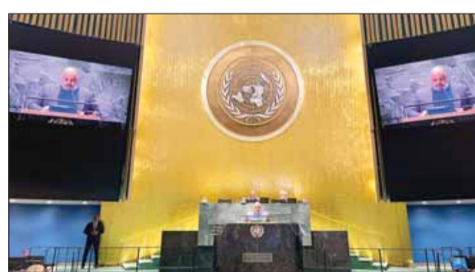
السفير طارق البنائي يلقي كلمة الكويت في الاجتماع

■ نويبورك - كونا، قال مندوب دولة الكويت الدائم لدى الأمم المتحدة السفير طارق البنائي إن قرار الكويت الذي اقترحه باعتباره السابع من سبتمبر يوماً عالمياً للتوعية بمرض (الحثل العضلي الدوشيني) علامة "فارقة" في خدمة المصابين بالأمراض النادرة.