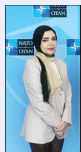
رابطة مكبة جمعة

كما تناقش لجنة محافظة مبارك الكبير في المجلس خلال اجتماعها الاثنين المقبل برئاسة نصار العازمي طلب الهيئة العامة للطرق والنقل البري تعديل شكل وإبعاد موقع خزان لتجميع مياه الأمطار بمساحة 7898,5 متر مربع، مع تخصيص مسار ربط الخزان في منطقة صباح السالم قطعة ( 3 ) بمحافظة مبارك الكبير، وطلب الهيئة العامة للصناعة تخصيص موقع لاقامة محطة لمعالجة المخلفات الصناعية السائلة في منطقة صباحان الصناعية (قطعة 1)، بالإضافة الى مناقشة طلب امدى