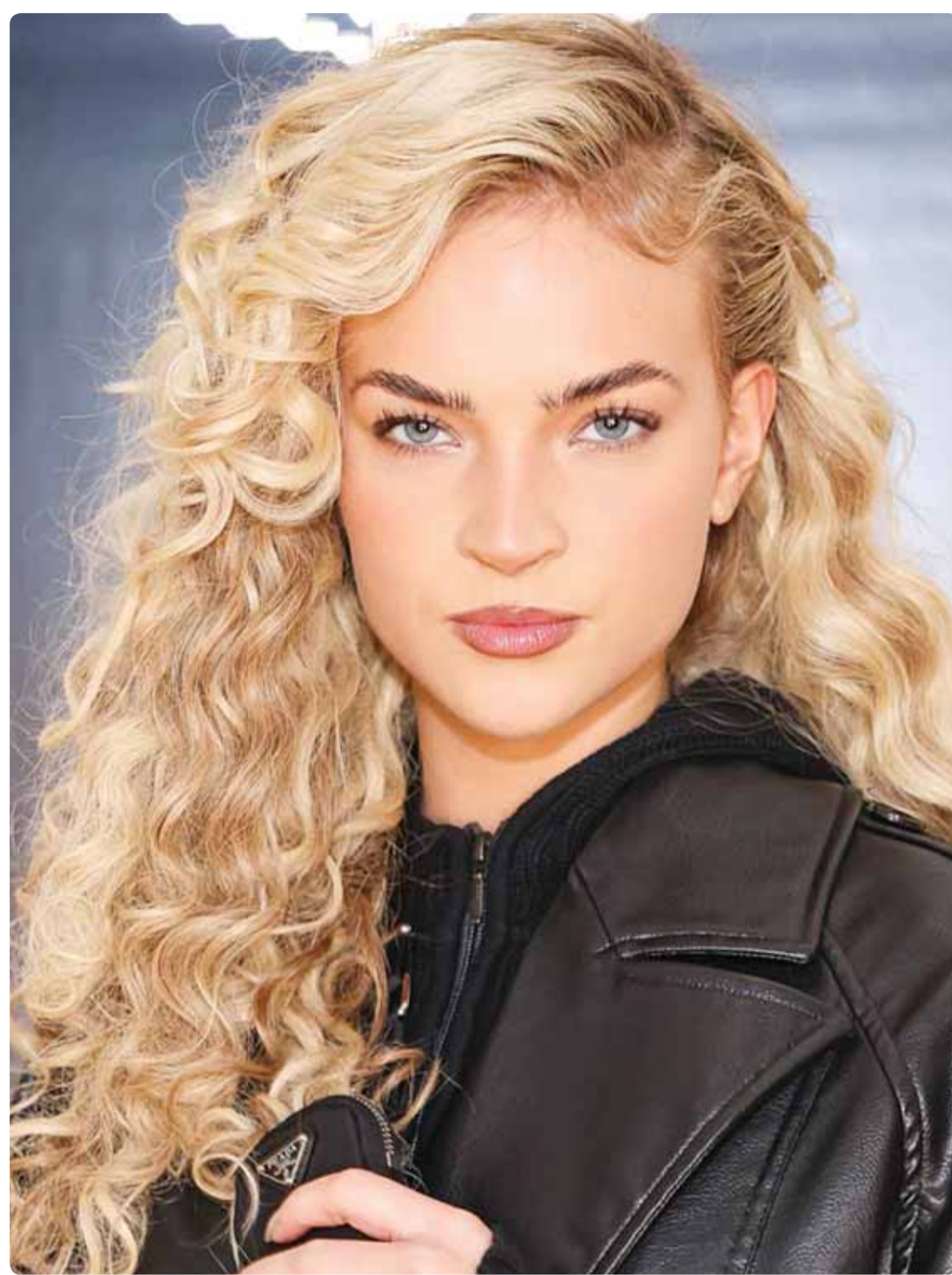
الممثلة البريطانية إميليلا سيلبيرغ خلال حضورها معرض "Longines Dolce Vita" في لندن

لما كنا في فاقة وعوز قبل اكتشاف النفط، وكنا صفارا ندفع ضريبة للفلسطينيين ونحن ندخل السجناء، لم يرسل أهالي الضفة تقاضة واحدة لنا إلى الكويت، ولما اجتاحنا صدام هرعوا لنصرتهم، وتمنوا زوال الكويت.