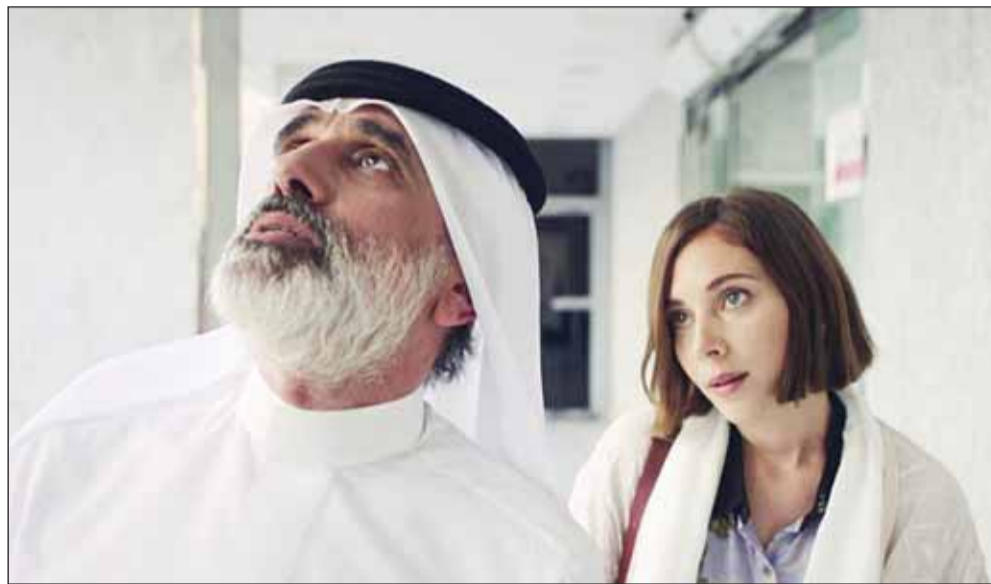
البنوي في مشهد من فيلم "بسمة"

يضحك المتلقي". على صعيد الدراما التلفزيونية تحظى الفنانة البنوي، بحكم واسع من المشاركات العربية، أبرزها مسلسل "60 دقيقة"، الذي يعد أول بطولة لها في الدراما المصرية أيضاً، حيث أدت خلاله شخصية "سارة" ذات الأبعاد النفسية المركبة، كزوجة شابة تتعرض لأزمات عدة. كما شاركت أيضاً في المسلسل المصري "ما وراء الطبيعة" بشخصية "نرجس" والدة الطفلة شيراز الخضراوي، والتي كانت أمد المماور الرئيسية في المسلسل. وشاركت البنوي، كذلك في المسلسل اللبناني "الشك" بصورة مختلفة تماماً، حيث كانت واحدة من بطلات العمل وواحدة من كتاب حلقاته ومخرجه، ولعبت فيه دوراً صعباً للغاية، حيث جسدت شخصية "سمر"، التي تقرر المكوث في منزلها بعيداً عن أي اختلاط بالأقارب أو الأصدقاء، لكنها تتلقى قفأة رابطاً يكشف عن جريمة قتل، وتصبح قفأة رهينة قاتل عنيف.