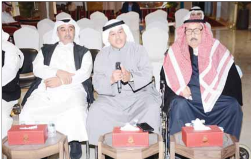
عبدالعزیز المفرح "شادي الخليج" تقدم حضور الندوة