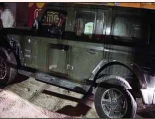
السيارة المتسببة في الحادث

بالمتهمين حتى لاحظا مطاردته لهما، وهنا توقف السارق جانبا وترك المركبة المسروقة وتلفظ عليهما ولوح لهما يسكين قبل أن يصعد مع صاحبه سائق "الرانجلر"، وبعدها أخذ المتوفى مركبته ومضى في طريقه، إلا أن المتهمين عانا وتوجهوا نحوه وعلقوا به.