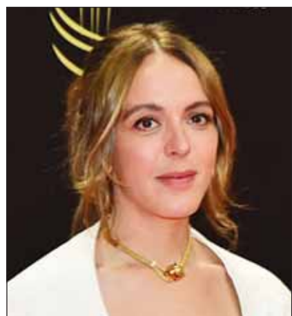
الكندية مونيبة شكري

عاشته مع زوجها، وحتى مع انتمائها الاجتماعي كأستاذة للفلسفة. قالت المخرجة الكندية خلال مناقشة الفيلم، إنها اهتمت بتقديم الشخصية ومنحها بُعداً جمالياً وفكرياً، وظهرت شخصية المخرجة وهويتها من خلال توظيف بعض مقاطع من الموسيقى العربية، وأغنيات فايزة أحمد، وقالت، أحب هذه الموسيقى، وفيها انتمائي... كما ثمة إشارة لجزائري يدعى جوجو، كان صديقاً لوالدها، واعتبرت أن الحب هو سياسي، لأنه يتأثر بالانتماءات إلى فئات معينة في المجتمع، ويكسر الفوارق الاجتماعية. ورداً على انتهاء علاقة الحب في الفيلم بالفراق رغم الشغف، قالت المخرجة بأنها على العكس، فقد تكون نهاية جيدة ليعيش الحب أكثر، وإشارة لأن المرأة لا تحتاج شريك حياة لتجد سعادتها.