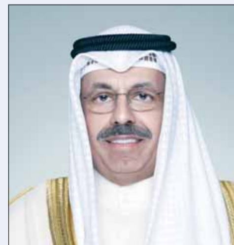
سمو الشيخ أحمد النواف

وقع المجلس الأعلى للقضاء في الكويت والمحكمة العليا في جمهورية إندونيسيا الصديقة مذكرة تفاهم صباح أمس في مبنى قصر المجلس الأعلى للقضاء في مشرف. وقع الاتفاقية عن الجانب الكويتي رئيس المجلس الأعلى للقضاء المستشار الدكتور عادل بورسلي ومن الجانب الإندونيسي رئيس المحكمة العليا البروفيسور الدكتور محمد شريف الدين. وتضمنت المذكرة بنوداً تركز على تبادل المعلومات والخبرات