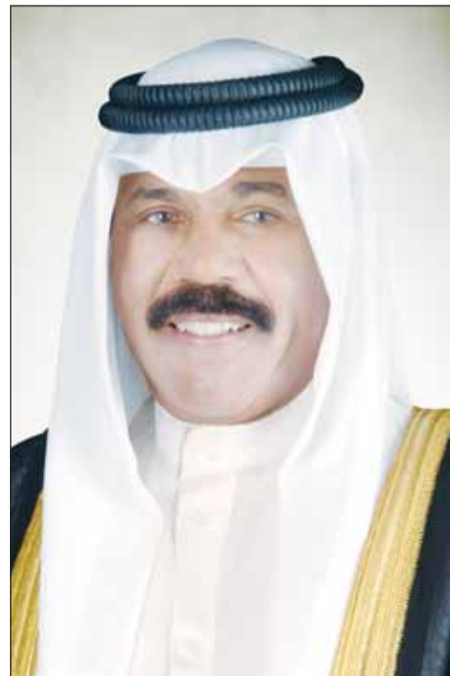
سمو أمير البلاد الشيخ نواف الأحمد

بعث سمو ولي العهد الشيخ مشعل الأحمد ببرقية تهنئة إلى الرئيس دانييل نوبو أسين رئيس جمهورية الإكوادور الصديقة، ضمنها سموه خالص تهانيه بمناسبة انتخابه رئيساً لجمهورية الإكوادور وأدائه اليمين الدستورية. كما بعث سمو ولي العهد ببرقية تهنئة إلى الرئيسة سانديرا ماسون رئيسة جمهورية باربادوس ضمنها سموه خالص تهانيه بمناسبة العيد الوطني لبلادها وراجيا لها دوام الصحة والعافية.