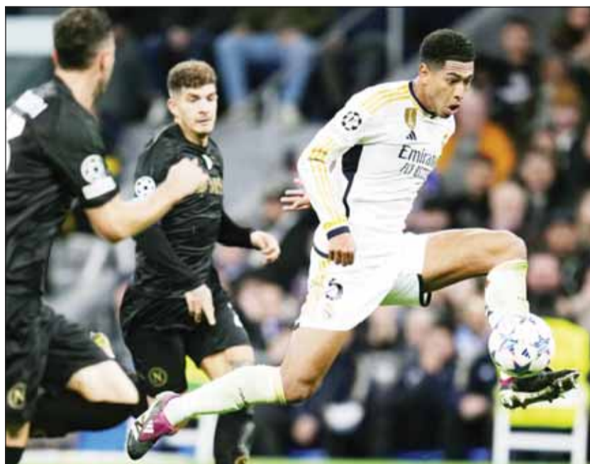
أنشيلوتي يشتم على نجم الريال بيلينغهام

مباراة، لا يفاجئنا نحن فقط، بل يفاجئ الجميع، إنه هدية لكرة القدم، زملاؤه والمشجعون سعداء كثيراً به، سعداء بمشاهدة لاعب كرة القدم يلعب بهذه الطاقة والحيوية والأيجابية، أمل أن يتمكن من الاستمرار هكذا، لا أخوض في مسألة قيمة الصفقة المالية، لكنها كان صفقة مذهلة، يجب علينا الأخذ في الاعتبار انه يبلغ من العمر 20 عاماً، إنه اللاعب المثالي لكرة القدم اليوم، قوي