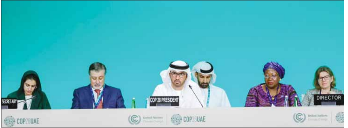
سلطان الجابر خلال افتتاح المؤتمر

رحب سمو الشيخ محمد بن راشد آل مكتوم نائب رئيس الدولة رئيس مجلس الوزراء حاكم دبي، بصيوف دولة الإمارات المشاركين في مؤتمر الأطراف في اتفاقية الأمم المتحدة الإطارية بشأن تغير المناخ COP28 الذي انطلق في دبي. وقال بن راشد في تغريدة على حسابه في منصة "إكس": نرحب في دولة الإمارات بأكثر من 70 ألف ضيف من 198 دولة.. رؤساء دول وقادة حكومات ووزراء ومسؤولو شركات ومنظمات دولية وأكاديميون وإعلاميون مطوا رحالهم في دولتنا لمناقشة قضية واحدة.. هي الحفاظ على كوكبنا للأجيال القادمة.. المهمة عظيمة.. والتحديات كبيرة.. ولكن يعلمنا التاريخ أن اجتماع البشر وتعاونهم وتوحيد جهودهم كان وما يزال أعظم سر في ازدهار حضاراتهم واستمرار تقدمهم.. كل التوفيق للجميع في هذه المهمة الإنسانية ونجدد ثقتنا في فريقنا الوطني في استضافة وتنظيم هذا الحدث الدولي الاستثنائي في دولة الإمارات.