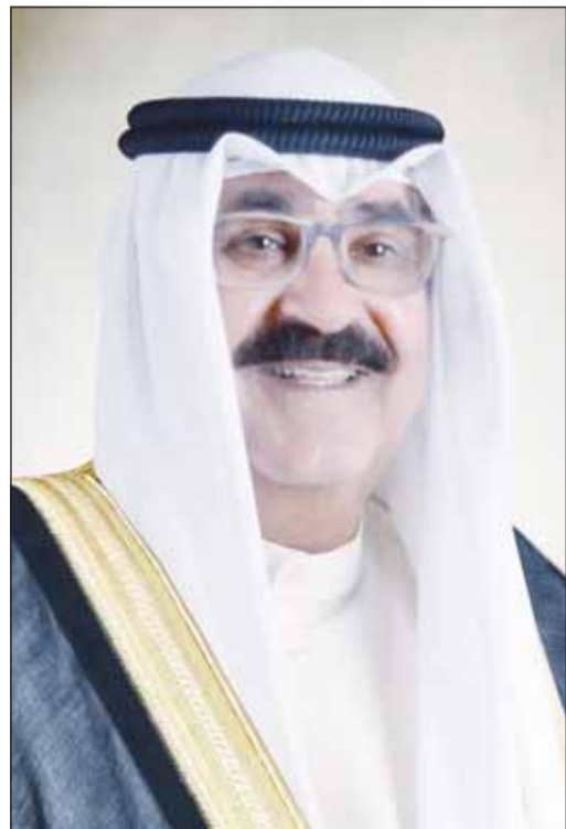
سمو ولي العهد الشيخ مشعل الأحمد

أقلعت صباح أمس الطائرة الإغاثية الـ 31 من الجسر الجوي الكويتي متجهة إلى مطار العريش المصري، محملة بـ 10 أطنان من المساعدات والمستلزمات الطبية لإغاثة الأشقاء في قطاع غزة. وقال مدير إدارة الكوارث والطوارئ في جمعية الهلال الأحمر الكويتي يوسف المعراج: إن الكويت تبذل كل جهودها لإيصال المساعدات الإنسانية لقطاع غزة بشكل عاجل لتخفيف معاناة الأشقاء الفلسطينيين جراء الاعتداءات المدمرة من الكيان الصهيوني. وأضاف المعراج أن الجسر الجوي يأتي في إطار الدعم الذي تقدمه القيادة الكويتية بتوجيهات سامية من سمو أمير البلاد الشيخ نواف الأحمد، ومتابعة حثيثة من الوزارات والمؤسسات المعنية.