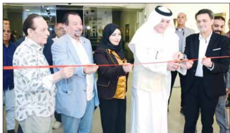
جانب من افتتاح المعرض