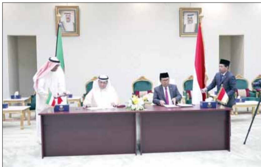
المستشار د. عادل بورسلي والبروفيسور محمد شريف الدين خلال توقيع مذكرة التفاهم

القضائي والمستشار عويد التويمير رئيس المكتب الفني في محكمة التمييز. من جهة أخرى زار رئيس المجلس الأعلى للقضاء ورئيس محكمة التمييز المستشار د. عادل بورسلي جناح معهد الكويت للدراسات القضائية والقانونية في معرض الكويت الدولي للكتاب 46، حيث أطلع على أحدث إصدارات المعهد وأثنى على الجهود المبذولة.