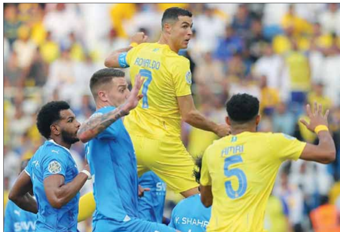
الدور بقود العالمي بمواجهة الزعيم

غير أن قائد العالمي رونالدو متصدر ترتيب الهادفين برصيد 15 هدفاً، ويليه المصري ميتروفيتش مهاجم الهلال برصيد 11 هدفاً، ثم مالكوم بـ 9 أهداف. وتلقى فريق النصر دفعة معنوية أمس بعودة نجمه وقائده رونالدو إلى المشاركة في التدريبات استعداداً لمباراة الدوري بعد تعافيه من إصابة في الرقبة.