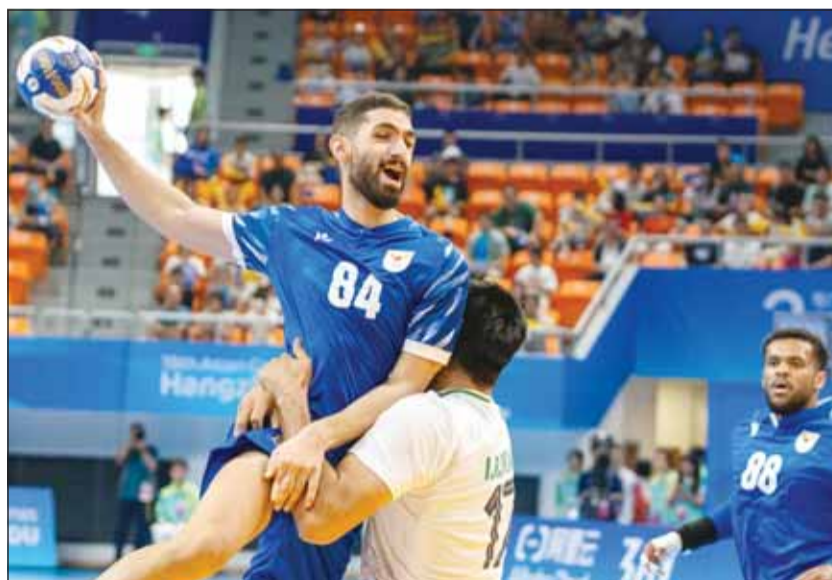
أزرق اليد يواصل الاستعدادات لبطولة آسيا