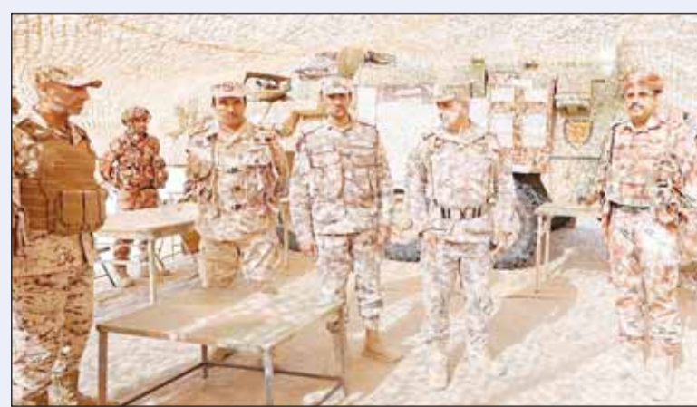
عدد من الجنود والضباط المشاركين في التمرين يستمعون للتوجيهات

تواصلت أمس، تدريبات تمرين "تكامل-1" ضمن المرحلة الثانية في شمال غرب البلاد (الديرع - الأبرق)، بمشاركة قوات درع الجزيرة. وتتضمن المرحلة الثانية تدريبات تحاكي التحديات الممكنة في منطقة العمليات بهدف زيادة التفاهم بين القوات المشاركة ورفع مستوى جاهزيتها تمهيداً للمرحلة الثالثة والأخيرة. يذكر أن تمرين تكامل-1 الذي ينفذ على ثلاث مراحل أساسية، يأتي بعد أن نفذت قوات درع الجزيرة تمرين (مراكز قيادات بري تكامل-1) في المملكة العربية السعودية الشقيقة في أكتوبر 2022.