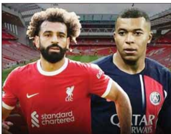
مباي مرشد لخلافة صلاح بليفربول

بدأ نادي ليفربول يستعد للرحيل لنجمه الأول الدولي المصري محمد صلاح، من خلال جس نبض أفضل لاعب فرنسي في المواسم الأخيرة كيليان مباي.