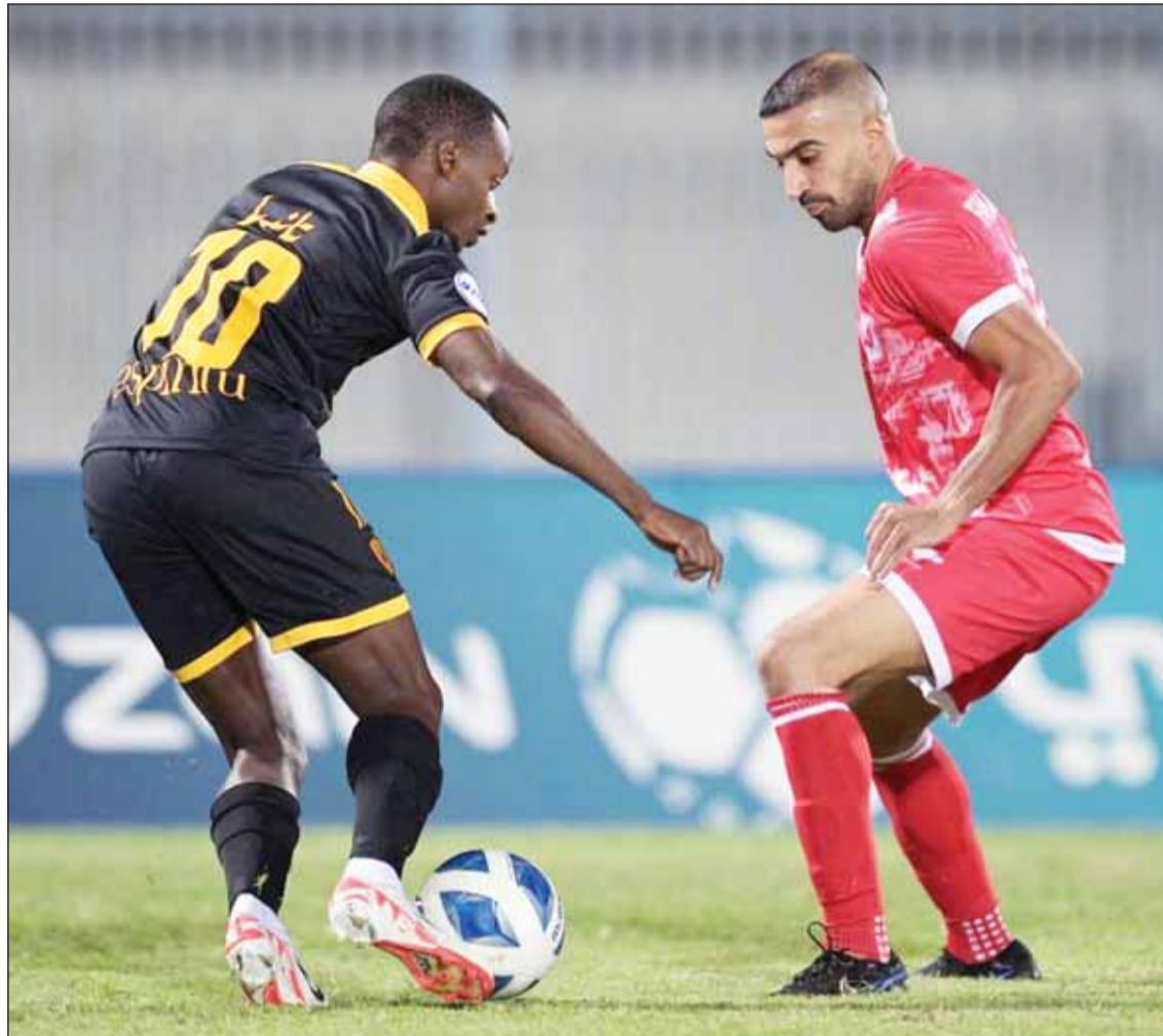
الأصفر يطمح لقيادة قوية بكأس ولي العهد

وتأجلت مواجهة الكويت والنصر إلى 18 ديسمبر الجاري، في حين نجبت القرعة العربي حامل اللقب خوض هذا الدور، حيث ينتظر الفائز من مواجهة الشباب واليرموك. في أولى مواجهات اليوم، يبحث القادسية عن انطلاق قوية، من أجل المنافسة على لقب غائب عن خزائنه منذ موسم 2017-2018، وهو لقب سيصبح له "فك الشراكة" مع الكويت والعربي اللذين يتقاسمان معه أكثر الأندية حصولاً على اللقب (9 مرات لكل ناد)، كما