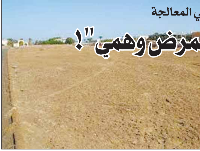
الاراضي الفضاء... هل يوقف القانون احتكارها؟!