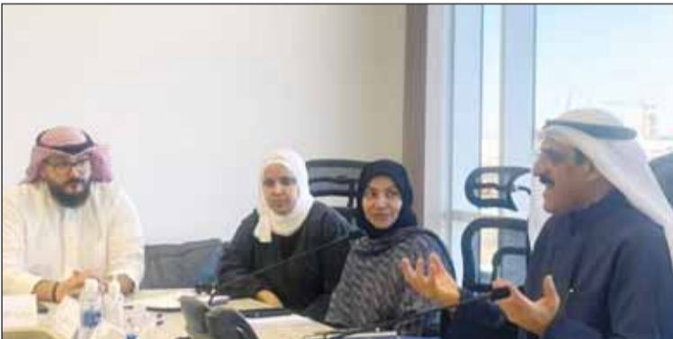
الوزير د.جاسم الأستاذ متحدثاً خلال اللقاء

التقى وزير الكهرباء والماء والطاقة المتجددة ووزير الأشغال العامة بالتكليف د.جاسم الأستاذ أمس، بالكوادر الوطنية العاملة في إدارة تنفيذ مشروع المطار. ونشرت وزارة الأشغال في بيان لها، أن اللقاء جاء لتعظيم الجهود المبذولة من قبل جهاز إشراف الوزارة في مشروع مبنى الركاب T2 بمطار الكويت الدولي. ولفتت إلى أن الوزير الأستاذ شدد على ضرورة الدفع برفع مستوى إنتاجية عمل الطاقات الشابة في هذا المشروع الحيوي.