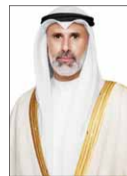
الشيخ جابر الجابر

تلقى نائب وزير الخارجية السفير الشيخ جراح الجابر اتصالاً هاتفياً من نائب وزير خارجية روسيا الاتحادية والممثل الخاص للرئيس الروسي للشرق الأوسط ودول أفريقيا ميخائيل بوغدانوف. وقالت "الخارجية" في بيان لها أمس إنه تم خلال الاتصال بحث سبل توطيد العلاقات الثنائية بين البلدين، والقضايا الراهنة محل الاهتمام المشترك.