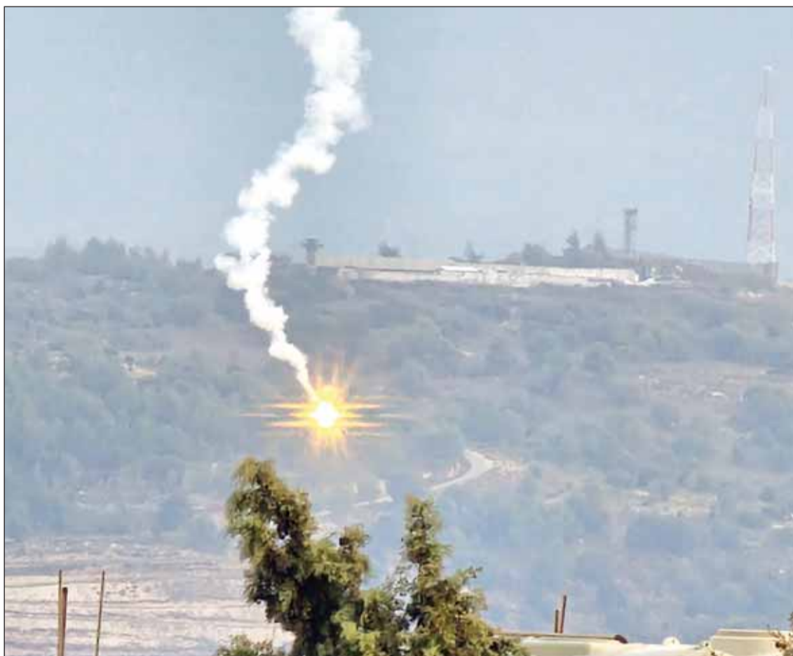
انفجار أحد صواريخ القبة الحديدية الإسرائيلية فوق بلدة رميش جنوب لبنان

من جانبه، أكد رئيس مجلس النواب اللبناني نبيه بري أن الخطر على لبنان وكل المنطقة مصدره إسرائيل، مشدداً على ضرورة التنبيه مما تبيته إسرائيل من نوايا عدوانية، سواء في غزة أو ضد لبنان، مؤكداً تمسك لبنان والتزامه بتنفيذ القرار 1701، بالرغم من خرقه من جانب إسرائيل آلاف المرات. ورفض بري أي تعديل للقرار، قائلاً "لا أحد يستطيع أن يضع على لبنان شروطاً أو يفرض تعديلات أو ترتيبات جديدة عليه، وأي خطوة في هذا الاتجاه غير مقبولة من قبلنا وستواجهها"، مضيقاً: "المطلوب فقط هو أن يطبقوا القرار ولا شيء آخر". إلى ذلك، وفي يومه الثاني، زار المبعوث الفرنسي لودريان رئيس كتلة "حزب الله" النيابية النائب محمد رعد في الضاحية الجنوبية لبيروت، ثم التقى رئيس حزب "الكتائب" النائب سامي الجميل الذي قال، إن اللقاء كان إيجابياً وهدفاً مصلحاً للبنان وقول الحقيقة للناس والمشكلة ليست عند المعارضة بل عند حزب الله المُتمسك برشرحه والرافض لأي كلام حول اسم آخر وبات مصدر التعطيل واضحاً. ودعا الجميل، حزب الله وحلفاءه إلى التعالي عن منطق الفرض، مشدداً في الوقت ذاته على ضرورة عدم زعزعة قيادة الجيش في هذه الفترة، معتبراً أن القرارات المصرية والتسويات الكبيرة في المنطقة لا تكون على حساب الدولة اللبنانية التي دفعت ثمن القتال في