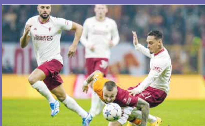
تعادل عادل بين غلطة سراي ومانشستر يونايتد

ضمن تأمله لدور السعة عشر من المسابقة في وقت سابق من دور المجموعات. ويتبقى مان يونايتد مباراة واحدة أمام بايرن في المسابقة القارية، وسيكون مطالباً بتحقيق الفوز في "أول ترافورد" لإبقاء أي آمال بالتأهل. وسجل أهداف الشياطين الممر كل من الأرجنتيني ألخاندرو غارناتشو (11) والبرتغالي برونو فيرنانديش (18) والإسكتلندي سكوت مكمكيني (55)، فيما سجل زياش هدفين للفريق التركي (29 و62)، وأضاف التركي كيريم أكوركوغلو الثالث (71).