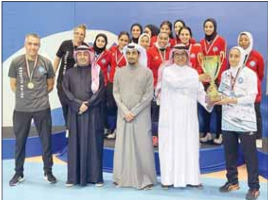
المربي يتوج نادي سلوى الصباح بكأس السوبر

■ حقق فريق الكرة الطائرة بنادي سلوى الصباح، لقب بطولة كأس السوبر للسيدات، بعد تغلبه في المباراة النهائية التي أقيمت أول من أمس بصالة الاتحاد بمجمع الشيخ سعد العبدالله، على فريق نادي الفتاة بنتيجة ثلاثة أشواط للإشياء "25-16، 25-22، 25-25". لتحقق فتيات سلوى الصباح أول لقب في مسابقات السيدات بالكرة الطائرة للموسم الجديد 2023-2024.