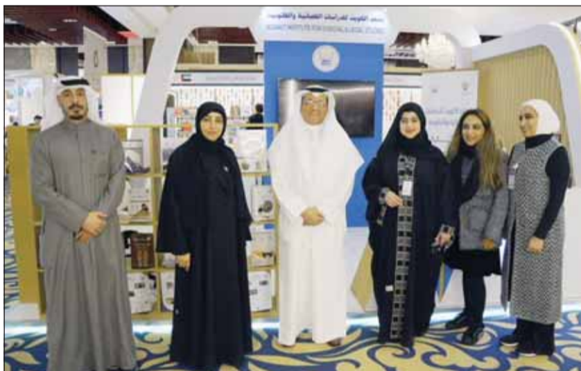
رئيس المجلس الاعلم للقضاء المستشار د. عادل بورسلي خلال زيارته جناح معهد الدراسات القضائية