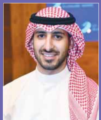
الشيخ يوسف الصباح

وتقام منافسات اليوم على ارتفاعات 90 سم و 105 و 115 و 125 و 135 سم، على أن تتواصل الجولة غدا السبت في الساعة 10.30 صباحاً بإقامة 4 أشواط على ارتفاعات 110 و 120 و 130 والجائزة الكبرى على ارتفاع 140 سم، وتبلغ جوائز الجولة الأولى 10 آلاف دينار للحاصلين على المركز الأول. وقال عضو مجلس إدارة الاتحاد الكويتي للفروسية الشيخ يوسف مشعل الصباح، "نجحت إدارة الاتحاد الكويتي للفروسية في تنظيم نسختين من