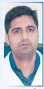
د/ شجاهان BDS, MDS الأسنان