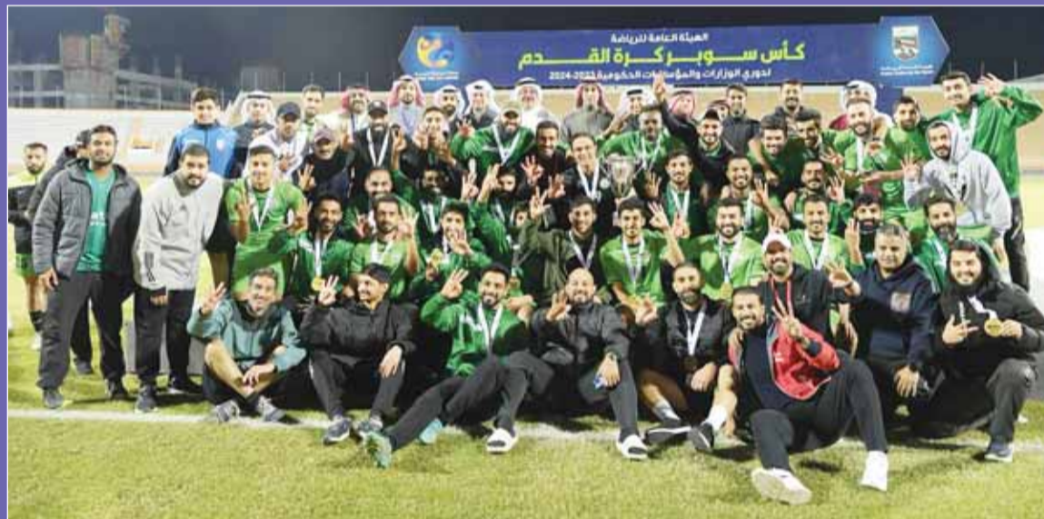
تتويج الحرس الوطني بكأس سوبر الوزارات

توج فريق الحرس الوطني لكرة القدم بلقب كأس السوبر للوزارات والهيئات والمؤسسات الحكومية بعدما نجح في الفوز على فريق الهيئة العامة للصناعة بركلات الترجيح 6-5، بعد انتهاء الوقت الاصلي بالتعادل الايجابي 2-2 في المباراة التي جمعتهم على استاد الصداقة والسلام ببادي كاظمة.