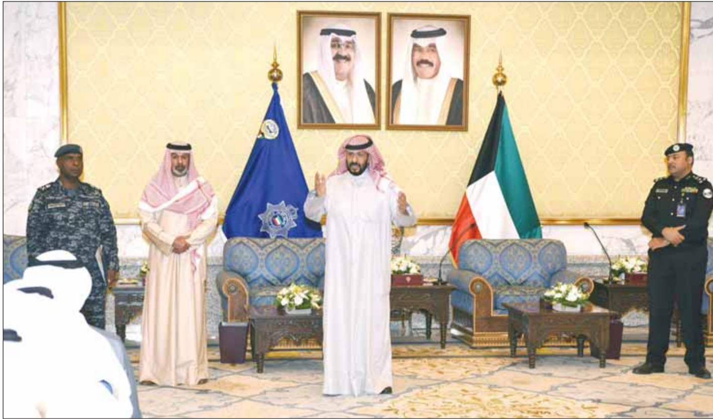
الشيخ طلال الخالد والشيخ سالم النواف خلال تكريم كوكبة من أبطال "الداخلية"

قضايا اللاجئين في مختلف دول العالم والتخفيف من معاناتهم دون أي أجندة سياسية". وقال إن أهمية عقد هذا المؤتمر الآن تأتي في ظل الظروف الكارثية والاستثنائية التي يشهدها العالم والتي تتطلب منا جميعاً دعم جهود المفوضية لضمان حماية وسلامة الأشخاص الأكثر ضعفاً. كما طالبت دولة الكويت المؤتمر بالتطرق إلى الاحتياجات الإنسانية العاجلة والملحة في قطاع غزة انطلاقاً من مسؤولية التضامن والمسؤولية الجماعية حيث لا تزال المنطقة تواجه تحديات إنسانية في غاية التعقيد بسبب ما تقوم به القوة القائمة بالاحتلال من قصف غاشم لمخيمات اللاجئين ومنشآت الأمم المتحدة.