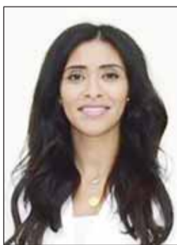
الشيخة نبيلة الصباح

ذكرت الشيخ نبيلة أن الكويت التي تحتل حالياً المركز 72 على مؤشر الابتكار العالمي يمكنها أن تصعد من خلال إعطاء الأولوية للبحث والتطوير ودعم الشركات الناشئة ودعم الابتكار الأخضر، مشيدة بتعزيز الشراكات بين الأوساط الأكاديمية والصناعة وتمسكين القواعد التنظيمية ورعاية ثقافة تتمحور حول الإبداع يشكل أهمية بالغة. وشددت على أن اتفاقات التعاون سواء مع المنظمات الدولية أو الهيئات الحكومية أو قادة الصناعة جزءاً لا يتجزأ من رؤية الشيخة فادية سعد العبد الله رئيسة المبرة بهدف تحقيق الشمولية والتواصل بين جميع القطاعات مع التزام متجدد بنقاء الجسور وتشكيل التحالفات وفخلق عالم لا يعرف فيه الابتكار حدوداً ونوهت بأهمية المنتدى في تسليط الضوء على بعض الاتجاهات الرئيسية في مجال الابتكار ونقل التكنولوجيا وفرص الاستثمار ودور المؤسسات التعليمية وتضاريف السياسات الحكومية وأهمية الملكية الفكرية، مؤكدة أن القيادة الاستراتيجية هي حجر الزاوية لتمويل التحديات إلى فرص من خلال تعزيز التعاون مع الجهات ذات العلاقة.