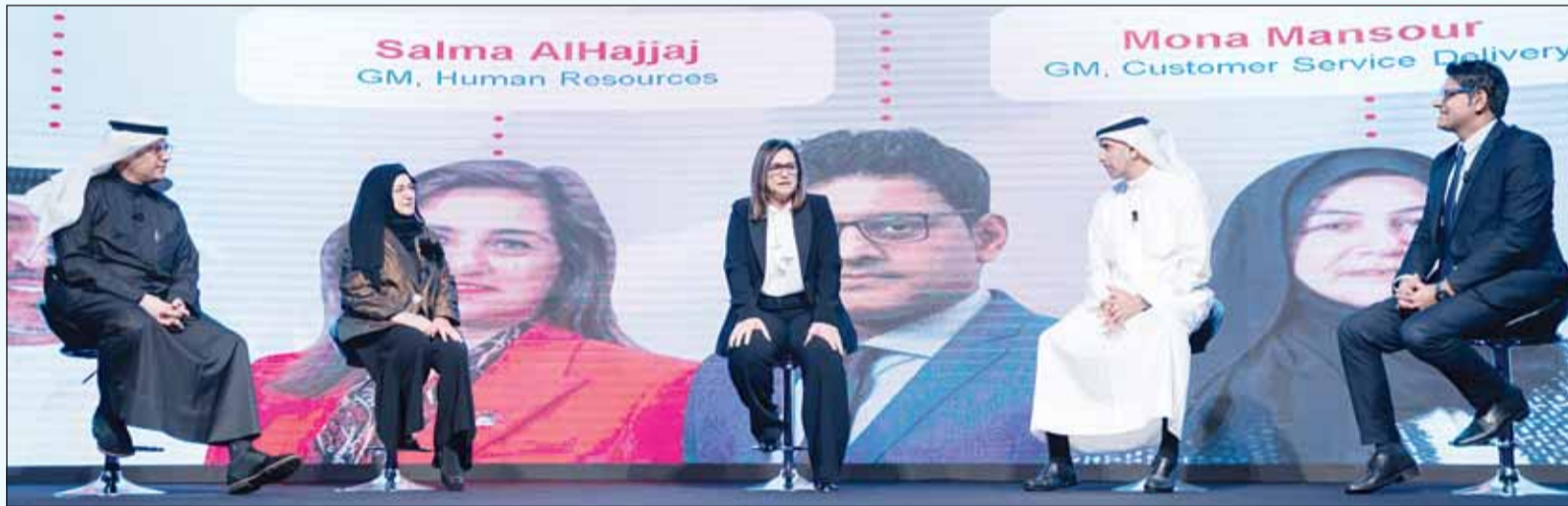
مديره الإدارات خلال الجلسة الحوارية