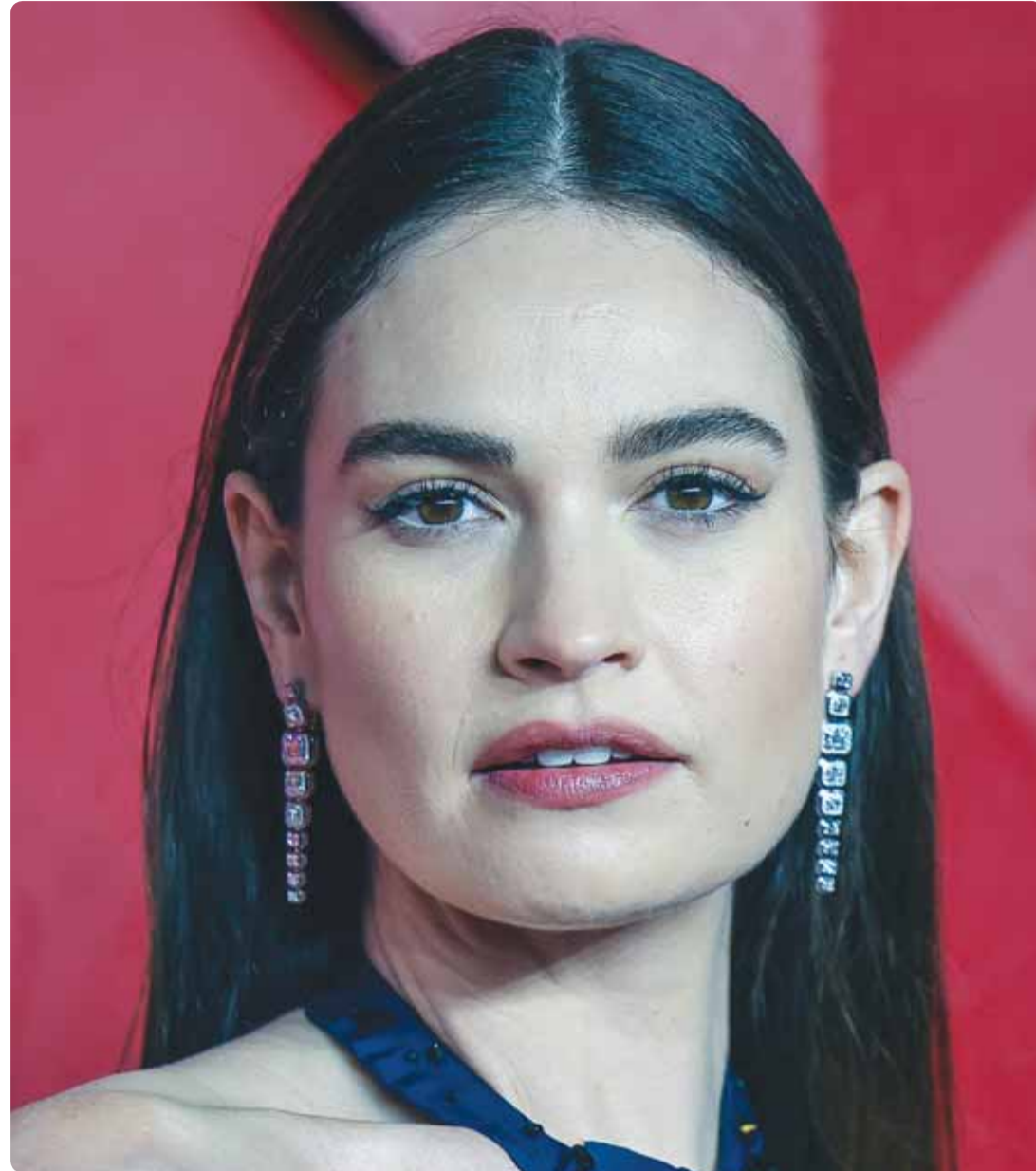
الممثلة البريطانية ليلبي جيمس خلال حضورها حفل توزيع جوائز الأزياء في لندن

يعتبر الأمن العقائدي والفكري، من ركائز الأمن القومي للدولة، التي يحاول الأعداء الإخلال به. نحن نعانى من زعزعة الأمن العقائدي والفكري، مما نشاهده ونسمعه ونقرأه، في قنوات التواصل الاجتماعي، ووسائل الإعلام المختلفة، من أفراد، وجماعات، تنتمي لجماعات حزبية، عقائدية، وفكرية، منها من يتخذ الدين عبادة يستتر بها، ومنها، من يلقي الدين نهائياً، ويحصره في المسجد فقط، ومحاوله هذه الجماعات بث أفكارها في صفوف الشعب الكويتي، حتى تستطيع السيطرة عليه، وقيادته بكل سهولة. خطورة فكر، ومنهج هذه الجماعات، أن بعضها تأسس على روايات كاذبة، مثل قول أدمم إنه قدم إلى الكويت من بلده الأصلي في ستينيات القرن الماضي، فلم يشاهد كويتياً واحداً ملتصقاً، أو واحداً يصلي في المسجد، بل كان المصلون من الوافدين كما يزعم، ولهذا قرر أن ينشر الصورة في البلاد، وكان الكويت وشعبها لم يكونوا محافظين على دينهم، وليس فيهم علماء، ومشايخ، وهذا والله كذب وبهتان. بعض تلك الجماعات، مثل جماعة "الإخوان المسلمين" تأسست على يد حسن البنا، أنشأ حزبا سياسيا في دولته مصر، التي درس فيها بعض أبناء الكويت، فتأثروا بفكره ومنهجه، فلبوا هذا الفكر إلى البلاد، كما استغل هذا الحزب حاجة الكويت للمعلمين ولليد العاملة في بداية نشأتها كدولة