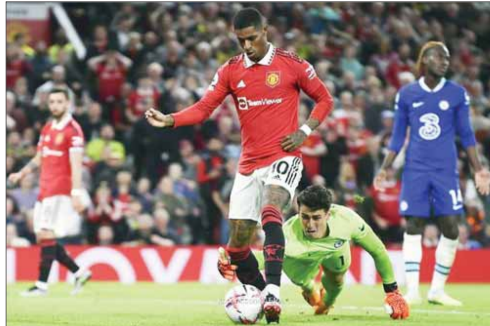
مواجهة نارية بين مانشستر يونايتد وتشيلسيه الليلة

وتفوق صلاح على إيرلينغ هالاند، ورودري، وبيوكايو ساكا وكيران تريبيير، وأولي واتكينز، ليحصل على الجائزة المرموقة. وعقب حصوله على الجائزة، قال صلاح: "أريد أن أشكر الجميع على جائزة اتحاد مشجعي كرة القدم، خاصة أنها جرت وفق استطلاع رأي جماهيري".