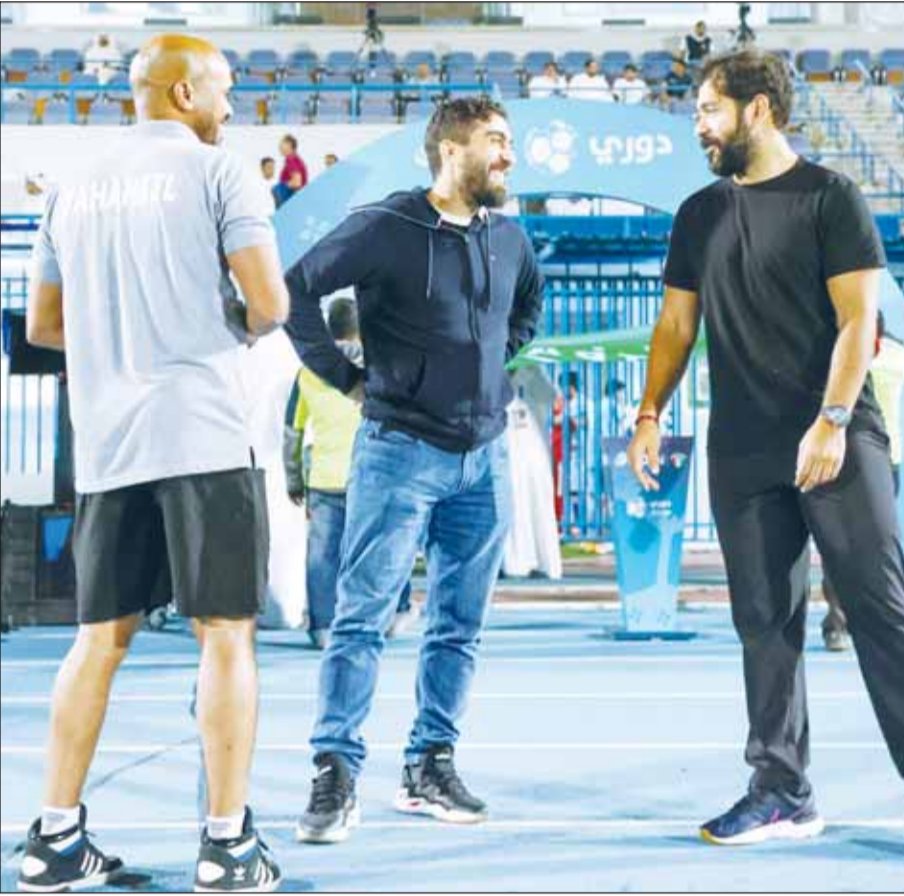
رما تكون الليلة الفرصة الاخيرة لمدربي الفحيحيل والسالمية