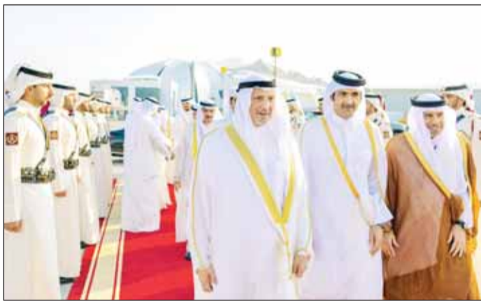
ممثل سمو الامير وزير الخارجية الشيخ سالم العبدالله لدى مغادرته الدوحة