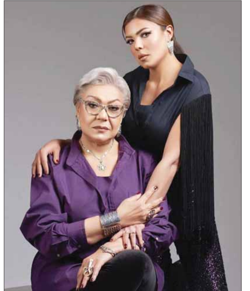
ناهد فريد شوقي وابنتها ناهد السباعي

يذكر أن ناهد، هي ابنة الفنانين فريد شوقي وهدي سلطان، وشقيقة الفنانة رانيا فريد شوقي، والدة الفنانة ناهد السباعي، وزوجها هو الكاتب والمخرج الراحل محمد السباعي، اعترفت الإنتاج الفني ومن أبرز أعمالها، مسلسل "الطاووس"، وفيلم "ميسيريا" لاحد زكي، "من نظرة عين" لمنى زكي وغيرها، وعملت كذلك مشرفة على الإنتاج ومنتجة منفذة في الدراما التلفزيونية.