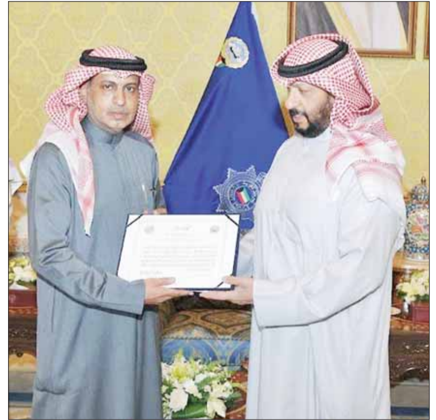
النايب الأول ووزير الداخلية الشيخ طلال الخالد مكرماً اللواء حامد الدواس