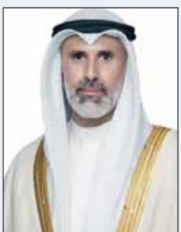
الشيخ جراح الجابر

■ تلقى نائب وزير الخارجية السفير الشيخ جراح الجابر أمس، اتصالاً هاتفياً من وزير الدولة لشؤون الشرق الأوسط وشمال أفريقيا وجنوب آسيا والأمم المتحدة في وزارة الخارجية والكونغول والتنمية في المملكة المتحدة اللورد طارق أحمد. وتم خلال الاتصال بحث العلاقات الثنائية بين البلدين الصديقين وسبل توطيدها في كافة المجالات والموضوعات ذات الاهتمام المشترك بالإضافة إلى التطورات المالية على السامتين الاقليمية والدولية.