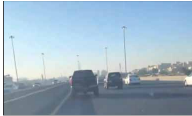
المركبة التي وثقها المواطن مظللة وبدون لوحات

عدم فحص المركبات التي يوجد تلف برقم لوحاتها المعدنية، أو لعدم وضوح اللوحة من أي نوع إذا ضبطت وهي تسير في الطريق بغير لوحات، أو بلوحة واحدة أو غير مقروءة، أو وجود ما يعيق رؤيتها، أو تحمل لوحات غير مصروفة من الإدارة العامة للمرور. وأشار المصدر إلى أن الإدارة العامة للمرور حجزت الاسبوع الماضي فقط حوالي 330 مركبة، بينها مركبات مظللة الزجاج ينسب تخالف القانون، ولفت إلى أن تعميمها صدر من مدير الفحص الفني قبل نحو شهرين يشدد على ضرورة