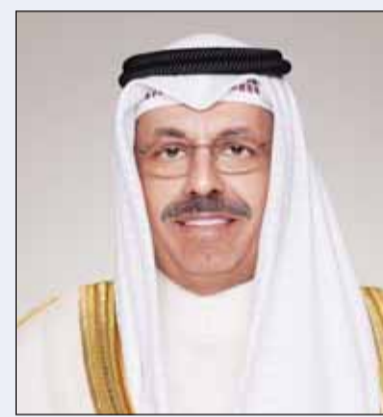
سمو الشيخ أحمد النواف

■ بعث سمو رئيس مجلس الوزراء الشيخ أحمد النواف ببرقية تهنئة إلى الملك ماها فاجيرالونفكورن ملك مملكة تايلاند الصديقة بمناسبة العيد الوطني لبلاده.