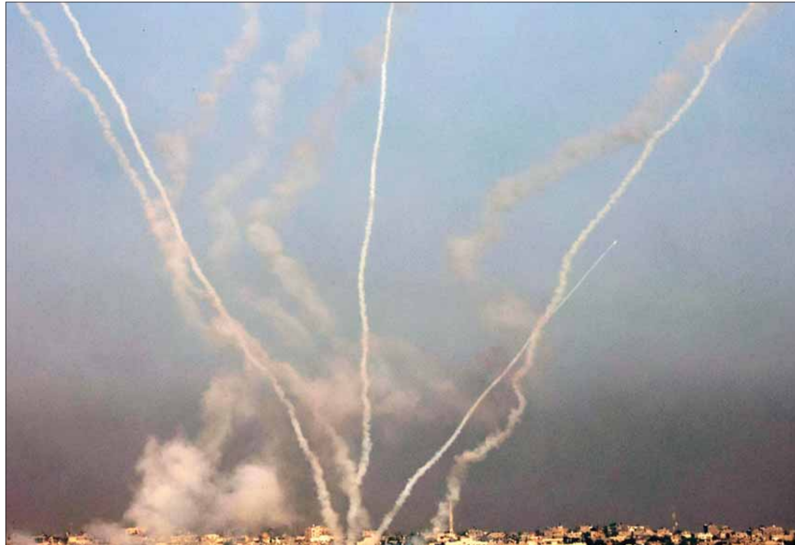
وايل من الصواريخ يُطلق من غزة باتجاه إسرائيل وسط استمرار القتال

■ غزة،وكالات، فيما واصل الكيان الصهيوني هجومه البري وقصفه لكامل مناطق قطاع غزة المحاصر، مخلفاً المزيد من الشهداء والجرحى الفلسطينيين، أعلنت القناة 12 الإسرائيلية أن 10 انفجارات قوية هزت تل أبيب، مشيرة إلى أن منظومة القبة الحديدية حاولت اعتراض صواريخ فلسطينية في سماء المدينة. أكدت وسائل إعلام أن فرق الإسعاف الإسرائيلي توجهت إلى المواقع التي تم الإبلاغ فيها عن سقوط صواريخ.