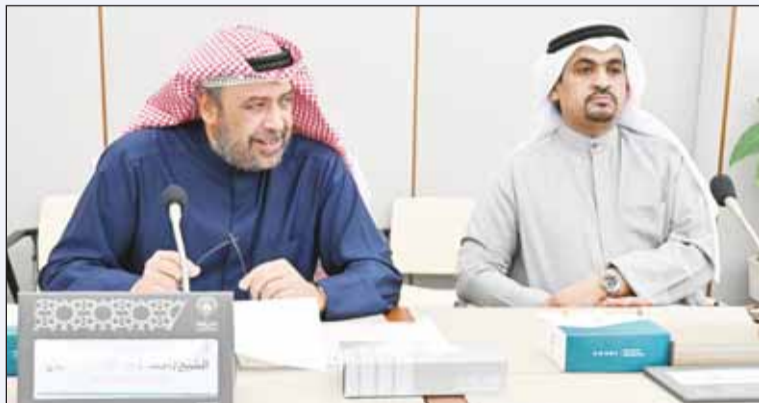
الشيخ أحمد الفهد لأم حضوره اجتماع لجنة حماية الاموال العامة