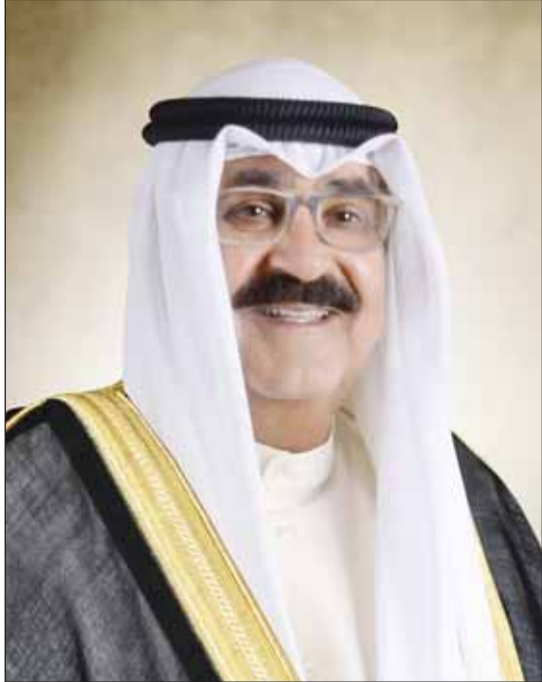
سمو ولي العهد الشيخ مشعل الأحمد

الأربعاء 22 جمادى الأولى 1445 هـ - الموافق 6 من ديسمبر (كانون الأول) 2023 م (السنة 54) العدد (19427)