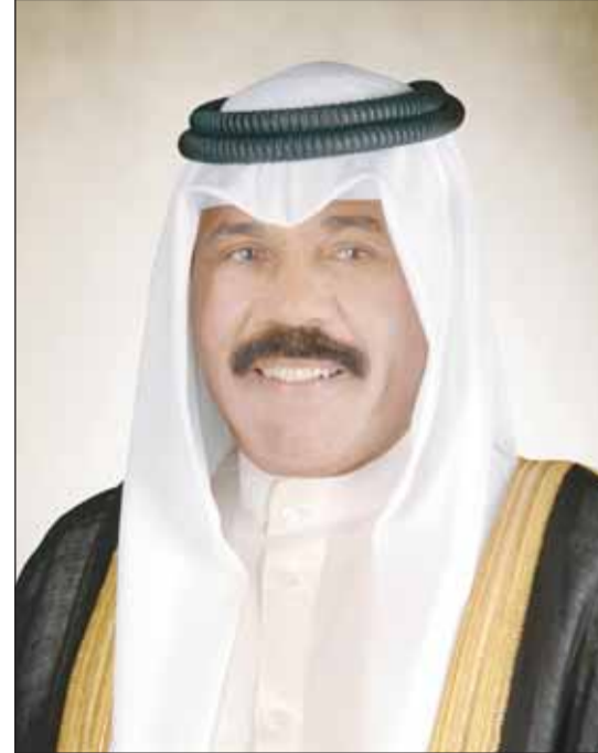
سمو أمير البلاد الشيخ نواف الأحمد

■ استقبل سمو ولي العهد الشيخ مشعل الأحمد بقصر بيان أمس، سمو الشيخ ناصر المحمد من جهة أخرى، بعث سمو ولي العهد ببرقية تهنئة إلى الملك ماها فاجيرالونفكورن ملك مملكة تايلاند الصديقة، ضمنها سموه خالص تهانيه بمناسبة العيد الوطني لبلاده وراجيا له دوام الصحة والعافية.