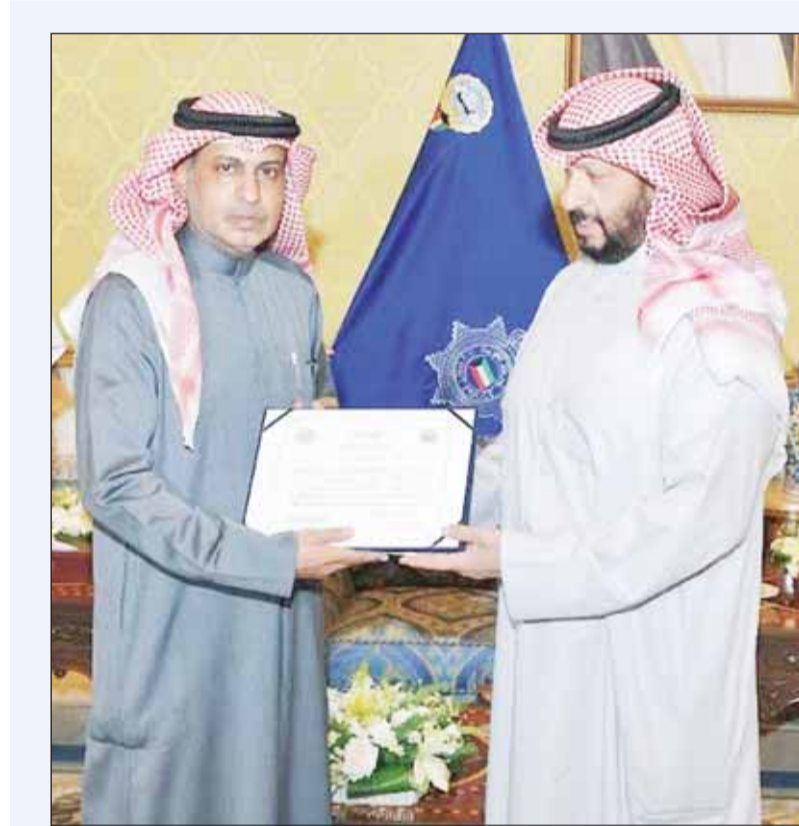
النائب الأول ووزير الداخلية الشيخ طلال الخالد مكرم اللوات حامد الدواس

تفويض وزراء الداخلية اتخاذ الإجراءات اللازمة لتنفيذ التأشيرة الخليجية الموحدة