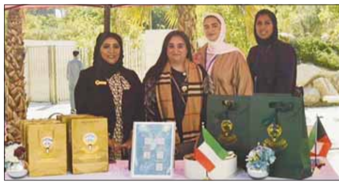
جناح "التعليم العالي"

وقال السميّط أن هذا الحدث يؤكد التزامها بإثراء الرحلة التعليمية لطلابها، من خلال التعاون مع "أمديست" لجلب فريق "HSBC" إلى الحرم الجامعي. وذكرت "AIU" أنها تهدف إلى تزويد طلابها برؤى مصيرية وثمينة حول العالم الديناميكي للخدمات المصرفية والمالية، إلى جانب فرص التواصل