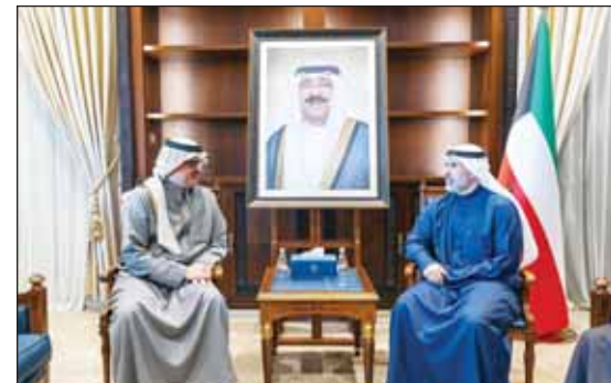
الجابر مستقبلاً سفير خادم الحرمين الشريفين الأمير سلطان بن سعد

■ استقبل نائب وزير الخارجية السفير الشيخ جراح الجابر أمس سفير الجمهورية اليونانية لدى الكويت يوانيس بلوتاس حيث بحث الجانبان سبل توطيد العلاقات الثنائية التي تربط البلدين الصديقين. ولفت إلى أنه أجرى استقبل نائب وزير الخارجية السفير الشيخ جراح الجابر أمس سفير خادم الحرمين الشريفين لدى الكويت الأمير سلطان بن سعد بن خالد آل سعود حيث تم بحث العلاقات الثنائية بين البلدين الشقيقين والقضايا محل الاهتمام المشترك. إلى ذلك، استقبل نائب وزير الخارجية السفير الشيخ جراح الجابر أمس سفير جمهورية الهند لدى الكويت أندرش سويكا حيث تم بحث العلاقات بين البلدين الصديقين وسبل توطيدها في كافة المجالات.