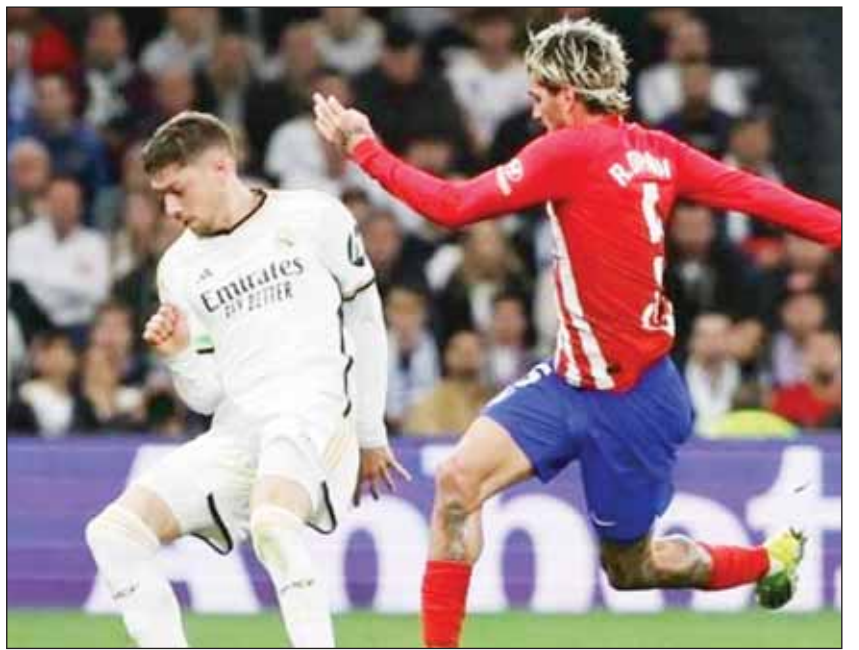
التعادل يحسم مواجهة "دريه العاصمة"

■ اقتنص أتلتيكو مدريد تعادلاً مثيراً بهدف لمتله من متصدر الدوري الإسباني ريال مدريد أول من أمس في مباراة (الدريه) في إطار منافسات الجولة 23 من المسابقة.