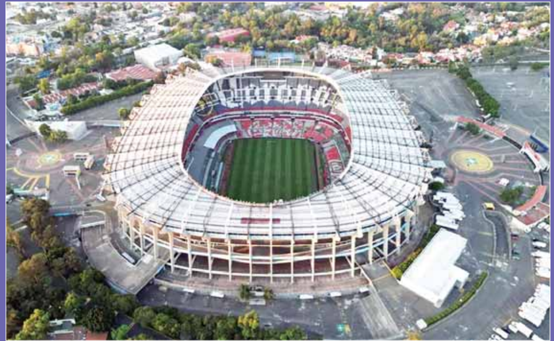
ملعب "أزتيكا" المكسيكي يحتضن افتتاح مونديال 2026

وستقام النسخة الثالثة والعشرين من كأس العالم في 16 ملعباً في الدول الثلاث، على أن يكون النهائي في أميركا وستبدأ الولايات المتحدة مشوارها في دور المجموعات على