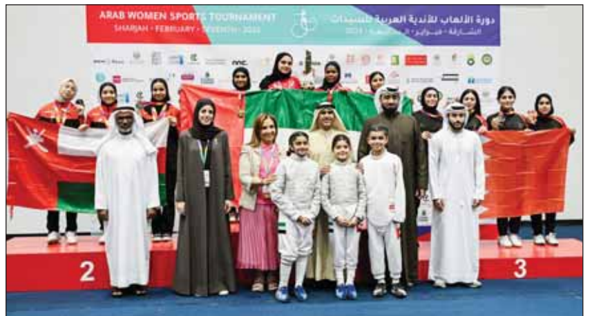
القاسمية وال خليفة والمحمودية مع بطلات المباراة