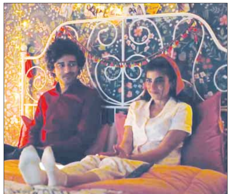
مشهد من فيلم "حوجن"

يُعد "حوجن" أحد أكبر المشاريع الفنية حتى الآن التي تنضوي تحت مظلة الشراكة الإنتاجية المبرمة العام 2019 بين شركة إيميج نيشن أبوظبي، وستديوهات MBC، الذراع الإنتاجية لـ "مجموعة MBC" و"فوكس ستديوز"، وهي ثلاث من أهم الشركات الإقليمية الناشطة في قطاع صناعة المحتوى الفني والترقيهي.