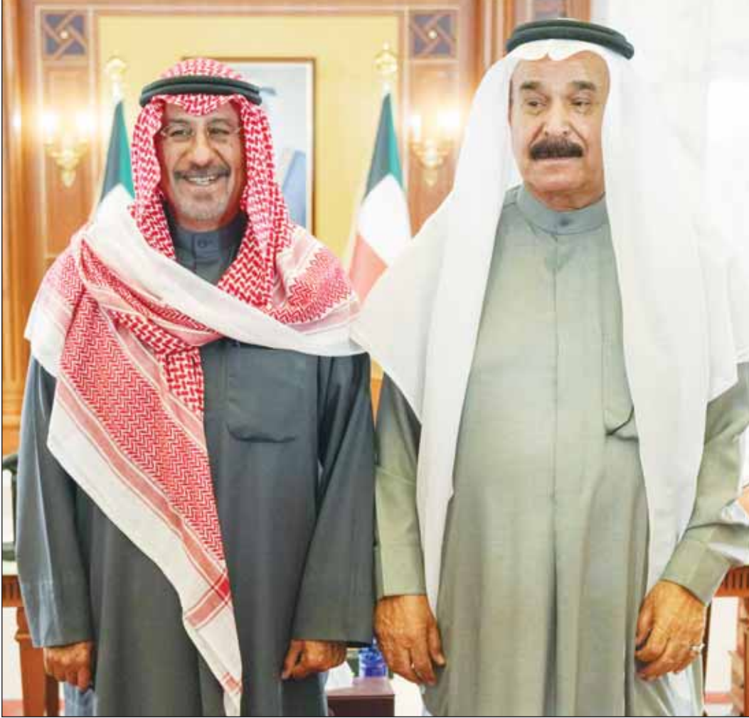
سمو رئيس الوزراء الشيخ د. محمد الصباح ونائب رئيس التحرير سليمان الجارالله