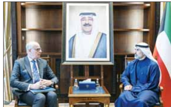
... وأثناء لقائه سفير اليونان

■ استقبل نائب وزير الخارجية السفير الشيخ جراح الجابر أمس سفير الجمهورية اليونانية لدى الكويت يوانيس بلوتاس حيث بحث الجانبان سبل توطيد العلاقات الثنائية التي تربط البلدين الصديقين. ولفت إلى أنه أجرى استقبل نائب وزير الخارجية السفير الشيخ جراح الجابر أمس سفير خادم الحرمين الشريفين لدى الكويت الأمير سلطان بن سعد بن خالد آل سعود حيث تم بحث العلاقات الثنائية بين البلدين الشقيقين والقضايا محل الاهتمام المشترك. إلى ذلك، استقبل نائب وزير الخارجية السفير الشيخ جراح الجابر أمس سفير جمهورية الهند لدى الكويت أندرش سويكا حيث تم بحث العلاقات بين البلدين الصديقين وسبل توطيدها في كافة المجالات.