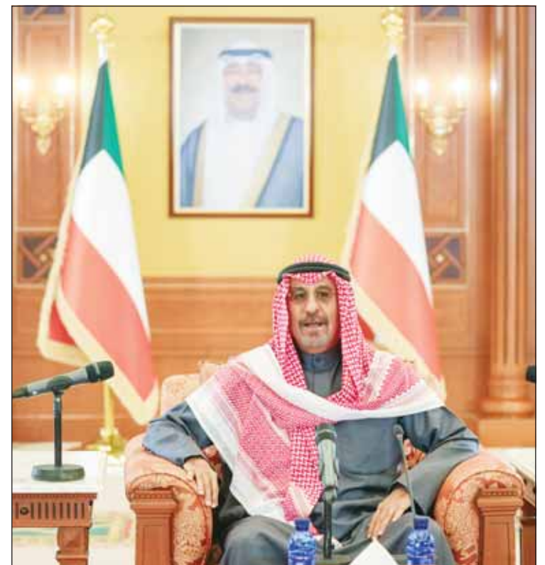
سمو رئيس الوزراء الشيخ د. محمد الصباح متحدثاً خلال اللقاء

وشدد على أن استدامة دولة الرفاه يجب أن تكون مبنية على أسس واضحة، تركز على الطبقة الوسطى المتماسكة الثابتة التي تدعم الاستقرار في المجتمع، مؤكداً أن هناك استحالة لتحقيق استدامة دولة الرفاه في ظل استمرار الاعتماد على ثروة طبيعية ناضبة.