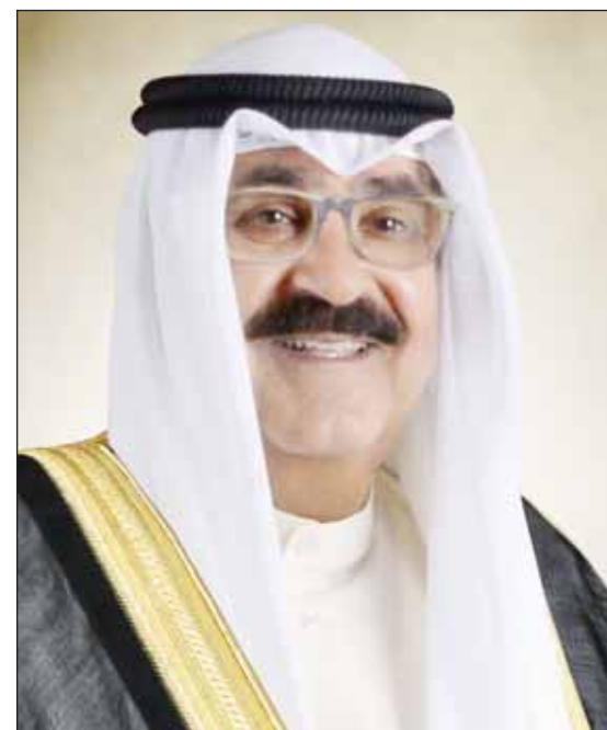
سمو أمير البلاد الشيخ مشعل الأحمد

وعقدت اللجنة تسعة اجتماعات كان آخرها في مارس الماضي بالعاصمة العمانية مسقط وأثمرت أعمال الدورة التاسعة للجنة المشتركة عن التوصل لاتفاق حول خمس مذكرات تفاهم وبرامج تنفيذية بمجالات عدة وهي مذكرة تفاهم في مجال الدراسات البيولوجية والتدريب ومذكرة تفاهم في مجال التعليم العالي ومذكرة تفاهم في مجال حماية المنافسة ومنع الاحتكار والبرنامج التنفيذي للتعاون في مجال حماية البيئة للفترة من 2021 إلى 2024 والبرنامج التنفيذي للتعاون في مجال تنمية الصادرات الصناعية للفترة من 2023 إلى 2025.