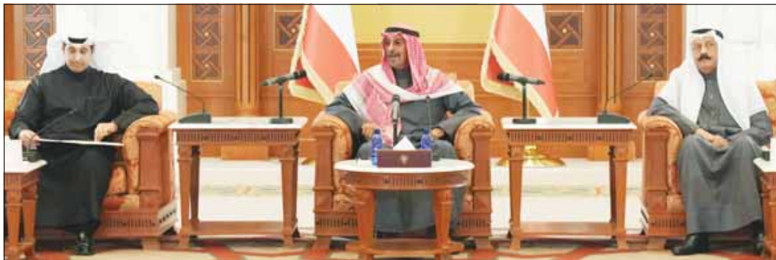
سمو رئيس الوزراء الشيخ د. محمد الصباح وزير الإعلام عبدالرحمن المطيري

الجوار ودول مجلس التعاون الخليجي إلى الأفق العربي والإسلامي"، مشيراً إلى أن حرارة أوضاعنا الإقليمية ترتفع بشكل كبير قد يعرض المنطقة إلى الخطر. وكشف رئيس الوزراء أن هناك جولات خارجية عديدة لدول مجلس التعاون الخليجي خلال المرحلة المقبلة، وتحركاً مكثفاً تجاه الحرب البشعة والإبادة التي يتعرض لها أشقاؤنا في فلسطين.