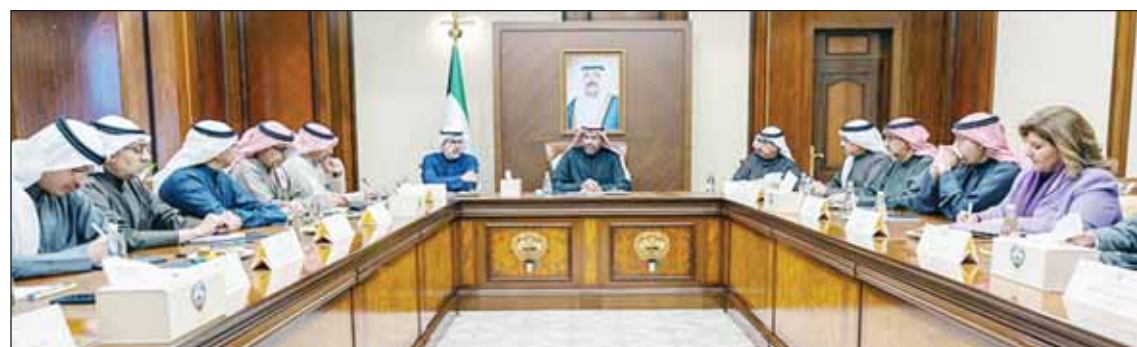
وزير الخارجية خلال الاجتماع مع مساعديه بحضور الشيخ جراح الجابر

■ بحث وزير الخارجية عبدالله اليحيا أمس في ديوان عام الوزارة وبحضور نائب وزير الخارجية الشيخ جراح الجابر ومساعدي الوزير شؤون الوزارة ومتابعة أبحاثها وسبل تطوير العمل فيها والإجراءات التي تقوم بها البعثات الدبلوماسية والفصلية في الخارج. وقد وجه الوزير المساعدين في وزارة الخارجية نحو تسخير جميع الإمكانيات لتطوير مستوى العمل في الوزارة والبعثات في الخارج والدفع بالطاقات الشبابية لتمثيل دولة الكويت في الخارج وتبوء مراكز قيادية في الوزارة واستكمال المسيرة العريقة لعمل وزارة الخارجية ورفع راية الكويت وخدمة شعبها ووطنها ومصالحها التزاماً وتنفيذاً للأوامر السامية لسمو أمير البلاد الشيخ مشعل الأحمد والتوجهات الحكيمة من سمو رئيس مجلس الوزراء الشيخ الدكتور محمد الصباح.