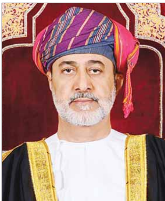
السلطان هيثم بن طارق

بـ 900 هكتار وهو مشروع مشترك بين مجموعة الطاقة العالمية المتكاملة (أو كيو) وشركة البترول الكويتية العالمية (كيو 8) ويتميز بموقعه الاستراتيجي المطل على خطوط النقل البحري الرئيسية في بحر العرب وسيكون له مردود إيجابي على المنطقة. ومع بدء عمليات تشغيل المصفاة ستبلغ الطاقة التكريرية 230 ألف برميل يومياً من النفط الكويتي الخام وستعمل على تغطية الاحتياجات اليومية الإقليمية والعالمية من منتجات الطاقة المختلفة وهي الديزل ووقود الطائرات بالإضافة إلى النافتا وغاز البترول المسال وتحقيق الاستغلال الأمثل للموقع الجغرافي للمنطقة الاقتصادية الخاصة بالدقم.