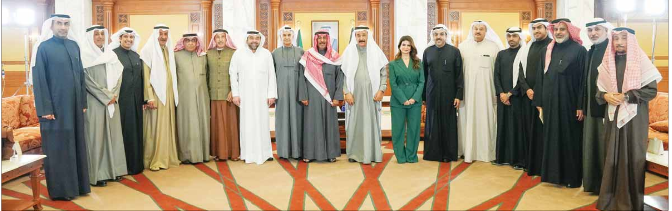
سمو رئيس الوزراء الشيخ د. محمد الصباح متوسماً رؤساء تحرير الصحف المحلية

الثلاثاء 25 من رجب 1445هـ - الموافق 6 فبراير (شباط) 2024م (السنة 54) العدد (19478)