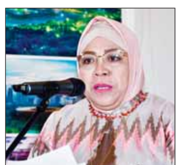
السفيرة الإندونيسية لينا مارينا متحدثه

سيستلمون بطاقتين للاقتراع اداها لاختيار الرئيس ونائبه والثانية لاختيار نواب مجلس النواب الوطني، حيث أن هناك 8 لجان انتخابية متوفرة بالسفارة لاستقبال المصوتين. ولفتت إلى أن التصويت سينطلق في السفارة في التاسع من فبراير الجاري في الساعة الثامنة صباحاً وحتى السادسة مساءً حسب توقيت الكويت مبينة أنه في حال لم يحصل أي من المرشحين للرئاسيين ونوابهم على الحد الأدنى من الأصوات 50% فإنه سيتم تنظيم جولة أخرى من الانتخابات في السادس والعشرين من يونيو المقبل.