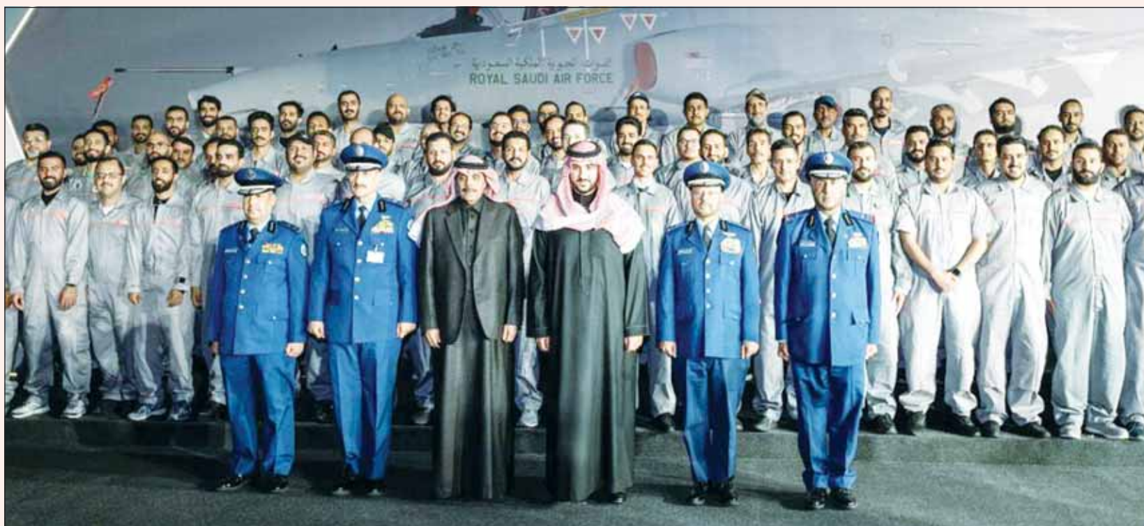
وزير الدفاع السعودي الأمير خالد بن سلمان متوسطاً فريق عمل آخر طائرة نفاثة متقدمة من طراز "هوك تي 165" التي جمعت في المملكة كليا بأيدٍ سعودية