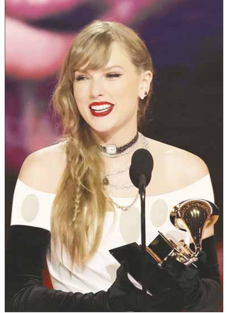
تايلور سويفت... إنجاز تاريخي

وذهبت جائزة أفضل ألبوم موسيقى الفولك إلى الكندية جوني ميتشل، التي غنّت للمرة الأولى، وقد بلغت الثمانين من عمرها، على مسرح "غرامي".