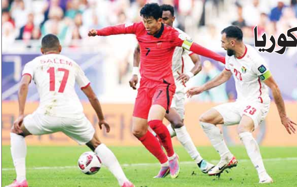
الأردن تتطلع لمواجهة تاريخية أمام كوريا

ولن تكون مهمة منتخب "النشأمة" سهلة في تمويل حلم الوصول إلى النهائي إلى حقيقة عندما يواجه كوريا الجنوبية في قبل النهائي حيث يقدم الكوريون مستوى فنياً متميزاً مكنهم من إقصاء منتخب أستراليا أحد مرشحي الفوز بالبطولة في الوقت الإضافي بهدفين لهدف.