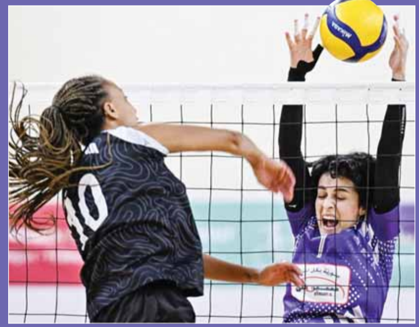
تفوق طائرة سلوى على تل درة

واستطاع فريقاً سلوى الصباح، و"سبورتينج" أمس، تحقيق انتصارين في ختام دوري المجموعات، جاء بالنتيجة ذاتها (0-3)، ومثل بروفة ختامية قبل دخولهم استمحاق الدور ربع النهائي للمسابقة، وحققت لاعبات الفريق الكويتي على حساب فريق تل درة السوري في مباراة لحساب المجموعة الثانية، قبل أن