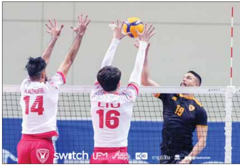
مواجهة كويتية في الأراضي العمانية

وقال محامي الدفاع الخاص باللاعب الذي ارتدى قميص برشلونة ويعتبر أحد أساطيره للقضاء في المحاكمة التي جرت مساء الأربعاء، موكلي كان تحت تأثير الكحول وكان لديه ضعف على المستوى المعرفي، ويمكن مشاهدته في فيديو من تلك الليلة وهو يعاني بالمركة، كونه شخصاً غير معتاد على تناول هذه الكمية من الكحول.