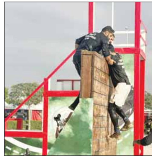
الهجوم وتحدي البرج العالي

حقق فريق لواء (المغاوير/ 25) المركز 29 في بطولة "تحدي الإمارات للفرق التكتيكية" في نسختها الخامسة وذكرت رئاسة الأركان - في بيان صحفي أمس - أن الفريق حقق المركز 29 من أصل 76 فريقا مشاركا من مختلف دول العالم في البطولة الدولية "تحدي الإمارات للفرق التكتيكية" التي استضافتها "شرطة دبي" خلال الفترة من 3 إلى 7 فبراير الجاري، الهادفة إلى تعزيز التعاون بين الوحدات الخاصة والفرق التكتيكية (SWAT) على مستوى العالم. وأوضحت أن مشاركة فريق لواء المغاوير بالبطولة الدولية إلى تبادل الأفكار والتجارب الميدانية والقيم الإيجابية، وتعزيز روح التضامن والاحترام بين أعضاء الفرق المتنافسة، وفيها يعين على كل فريق خوض العديد من التحديات، مثل المناورات التكتيكية والهجوم وإنقاذ ضابط وتحدي البرج العالي، ومنافسة الفرق الأخرى. وتعتمد هذه البطولة على اللياقة البدنية للفرق المشاركة والأسلوب التكتيكي والرميات المتعددة تحت جهد بدني يتطلب التركيز الذهني بأعلى المستويات.