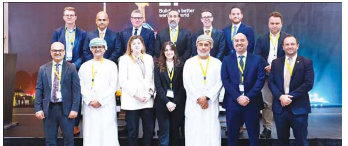
المشاركون في الندوة

كما تناولت الندوة التحديات التنظيمية والاتجاهات الضريبية الأخيرة في منطقة الشرق الأوسط وشمال إفريقيا، وخاصة في دول مجلس التعاون الخليجي، والتي تؤثر على الشركات الكويتية العاملة في ولايات قضائية أخرى. ومن ذلك تطبيق ضريبة القيمة المضافة في دول مجلس التعاون الخليجي الأخرى، وكذلك ضريبة دخل الشركات في الإمارات، ونظام الفوترة الإلكترونية في السعودية. كما تناولت الندوة أيضاً دور التكنولوجيا في رحلة التحول الضريبي، وقضية الموكمة البيئية والاجتماعية والموسمية.