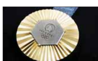
ميداليات أولمبياد 2024

وأوضحت اللجنة المنظمة للأولمبياد أنه تم تحديد المعدن من الطلاء مع صلته وتلميعه خلال عملية تصنيع 5084 ميدالية لدورة الألعاب التي تقام خلال الفترة بين 26 يوليو و11 أغسطس، على أن يعقبها الدورة البارالمبية. وقال يواخيم رونسين، رئيس لجنة التصميم باللجنة المنظمة "أردنا إضافة هذه اللمسة الفرنسية واعتقدنا أن برج إيفل سيكون بمثابة الكزة في الأعلى، وأضاف "الوصول على قطعة منه هو قطعة من التاريخ".