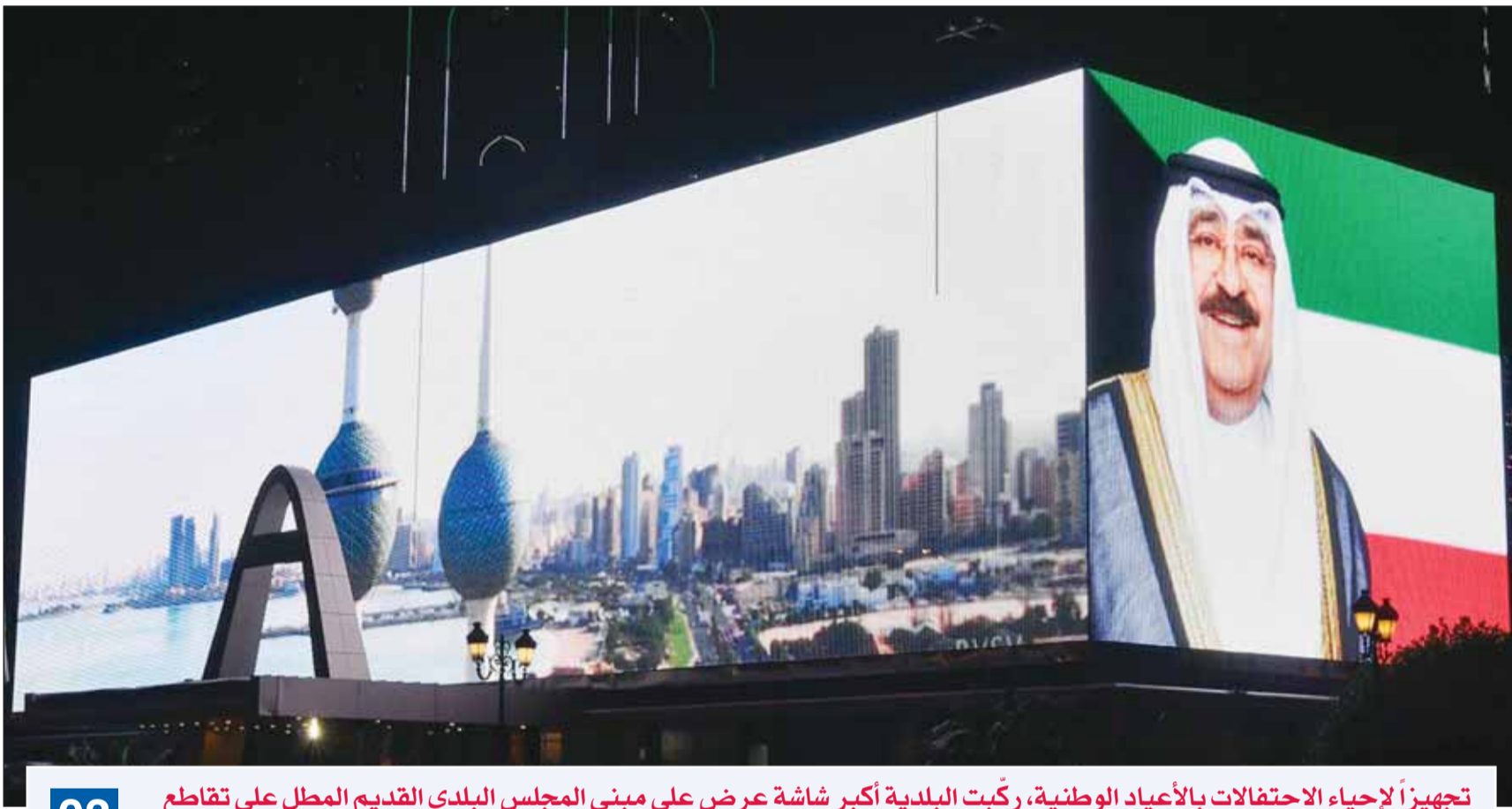
تجهيزاً لإحياء الاحتفالات بالأعياد الوطنية، رُكبت البلدية أكبر شاشة عرض على مبنى المجلس البلدي القديم الممثل على تقاطع قصر نايف مبنى محافظة العاصمة بساحة إجمالية للشاشة 1200 متر مربع

كشفت بيانات البنك المركزي عن إقفال البنوك المملوكة 684 حساباً مصرفياً لنحو 646 عميلاً نتيجة ارتفاع 2085 شيكاً من دون رصيد بقيمة 20 مليون دينار خلال العام الماضي، لافتة إلى أن 2778 عميلاً مصرفياً أصدروا نحو 4295 شيكاً من دون رصيد بقيمة 60 مليون دينار خلال عام 2023. وأوضحت البيانات أن إجمالي الشيكات التي أصدرها 104 آلاف عميل في البنوك خلال