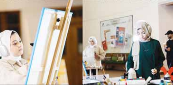
مجموعة من الفنانين المشاركين في مسابقة ألوان الموسيقى