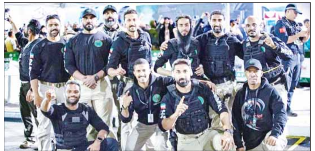
أعضاء الفريق المشاركون في البطولة

اختتمت القوة البحرية فعاليات تمرين المدافع المتأهب (24) بمشاركة وحدات من الإدارة العامة لخفر السواحل بوزارة الداخلية وقوات من دول مجلس التعاون لدول الخليج العربية والقوات البحرية الأميركية والقوات البحرية الملكية البريطانية الذي أقيم خلال الفترة من 28 يناير و لغاية 7 فبراير 2024. وذكرت رئاسة الأركان العامة للجيش - في بيان صحفي - أن التمرين شهد عدة أنشطة منها رماية بحرية وتنفيذ تدريبات على عمليات نوعية