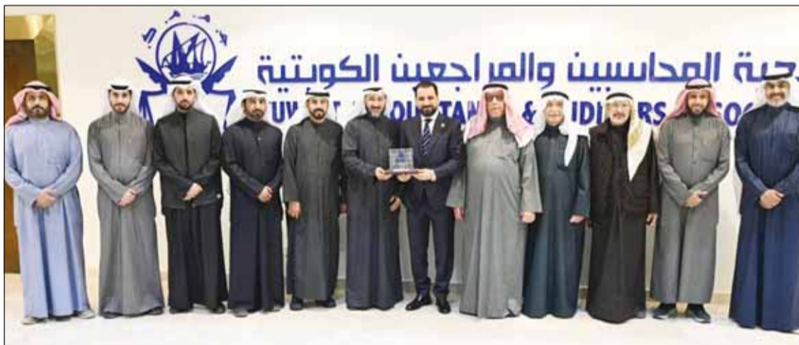
صورة جماعية خلال اللقاء

ولفت أن الاجتماع تطرق لعمل أكاديمية المحاسبين لخريجي المحاسبة والتي تقدم برنامج تأهيل مهني لحديثي التخرج الراغبين في العمل بالقطاع المالي بالكويت، ومدى إمكانية الاستفادة من قدرات اتحاد المحاسبين والمراجعين العرب في هذا الخصوص. وأشار إلى أن أكاديمية المحاسبين تستهدف الاستفادة من الذكاء الاصطناعي وتوظيفها في مجال التدريب والتأهيل، من أجل بناء كوادر محاسبية متميزة.