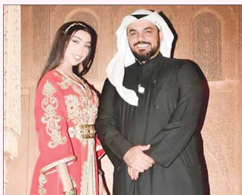
محمد الترك ودنيا بطمة

علق المنتج والمخرج محمد الترك، عبر حسابه بتطبيق "إنستغرام"، على توقيف طليقته الفنانة المغربية دنيا بطمة، لتنفيذ حكم السجن النافذ لمدة عام في قضية حساب "حمزة مون بيبي"، قائلاً: "لا أتمنى السجن لأحد سواء كان قريباً أو بعيداً أو عدواً... شيء يوجع القلب، الله يصبر أهلها ويصبر الناس اللي يحبونها".