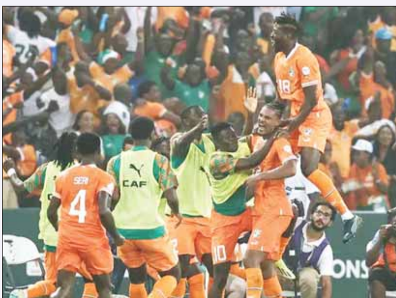
منتخب الأسيال إنه النهائي الأفريقي

في وقت سابق. في المقابل، يلتقي منتخب الكونغو الديمقراطية، الذي كان يحلم بالوصول على كأس البطولة، بعدما حصدها عامي 1968 و1974، مع منتخب جنوب إفريقيا غداً في مباراة تحديد المركزين الثالث والرابع. ووجد منتخب كوت ديفوار تفوقه على الكونغو الديمقراطية في مواجهة السادسة بالبطولة القارية، حيث تفوق عليه 3 مرات مقابل تعاديلين وانتصار وحيد للكونغو الديمقراطية. وتعد كوت ديفوار أول دولة تصل إلى نهائي كأس أمم إفريقيا على الرغم من تعرضها لهزيمة بأربعة أهداف في وقت سابق من البطولة (خسرت 0-4 أمام غينيا الاستوائية) منذ نيجيريا في عام 1990، التي خسرت 5 - 1 أمام الجزائر في دور المجموعات قبل أن تواجه مرة أخرى في النهائي في ذلك العام، حيث خسروا 0-1.