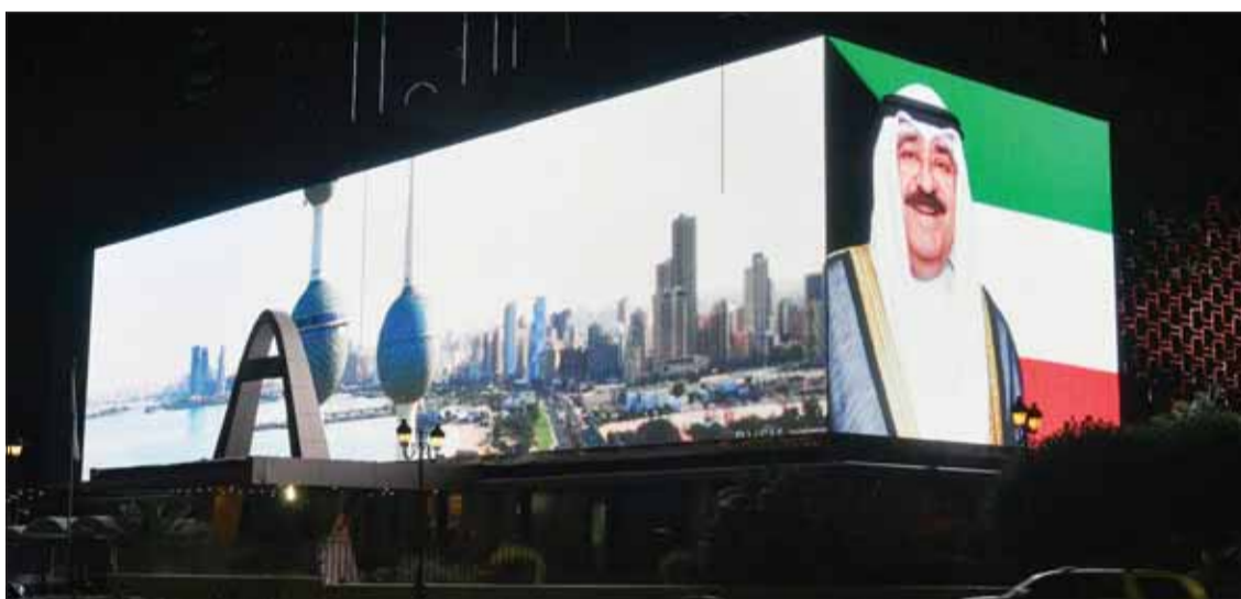
أكبر شاشة علم واجهة مبنى البلدية تزدان بصور سمو الأمير وعلم الكويت