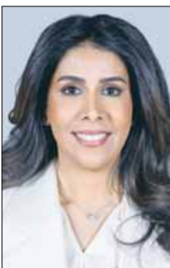
د. نورة المشعان

للهيئة، ووضع رؤية واضحة لمعالجة الاختلالات الادارية بها، والعمل على تطوير منظومة النقل البري لمحاكاة التناقص الدولي بشأنها، على أن يتبع ذلك تعديل قانون إنشاء الهيئة بما يواكب المتغيرات ويحقق الفائدة المرجوة من انشائها. وأفادت أن عدداً من النواب خلال اجتماع لجنة الميزانيات النيابية الاخير حثوا وزيرة الأشغال العامة ووزير الدولة لشؤون البلدية د.نورة المشعان على تفعيل دور الهيئة واستكمال طلب سحب المشروع، لاسيما ان خطة عمل الحكومة تتضمن العديد من المشاريع ذات العلاقة بالهيئة، منها السكة الحديد، وكذلك مشاريع البنية التحتية لاصلاح الطرق، وتطوير منظومة النقل ومشاريع المنطقة الشمالية وتشغيلها وغيرها من المشاريع، لاسيما ان إلغاء الهيئة سوف يستلزم إصدار قانون جديد لتحديد الجهات المشرفة على النقل البري.