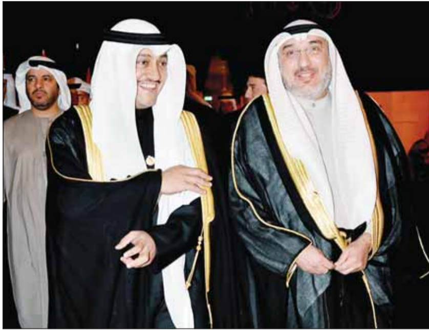
ممثل الأمير راعي الحفل الوزير د. عادل العدواني وطلال الخرافي

رئيس النادي العلمي: رعاية الأمير المعرض تأكيد على دعم سموه للإبداع والبحث والابتكار