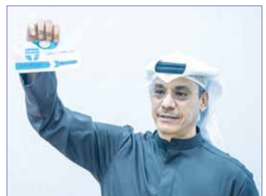
العنواني خلال قاعة الدوري

تنطلق غداً، منافسات الجولة الأولى من دوري كرة اليد بنسخته الـ57 للموسم الرياضي 2023-2024 بمشاركة 14 نادياً وانسحاب الجبراء والشباب من النسفة الحالية. ويقتتح مباريات الدوري العام "الدمج" بنظامه الجديد فريقاً التضامن والفحيحيل في الرابعة والنصف مساءً، يعقبها في السادسة مساءً لقاء النصر مع الصليبخات، على أن تختتم مباريات السبت بمواجهة السالمية مع اليرموك، على أن تقام مباريات دوري اليد على صالة مجمع الشيخ سعد العبدالله.