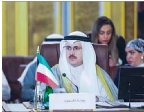
الشيخ فراس الصباح مترئساً وفد الكويت في المنتدى

أبني امتداداً لجهود قطر في ترسيخ مبادئ وهوية الأسرة العربية وحمايتها من المخاطر التي تهدد ودمتها وتماسكها. والتقى الشيخ فراس الصباح على هامش المنتدى العربي بالأمين العام لجامعة الدول العربية أحمد ابوالغيط.