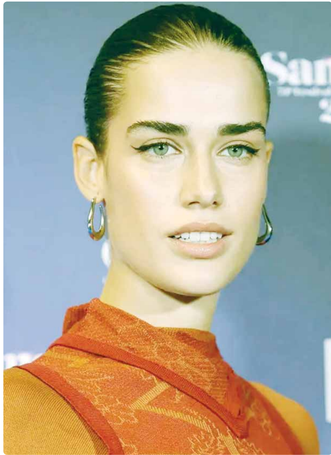
المغنية الإيطالية كلارا سوسيني خلال حضورها مهرجان سان ريمو الموسيقي