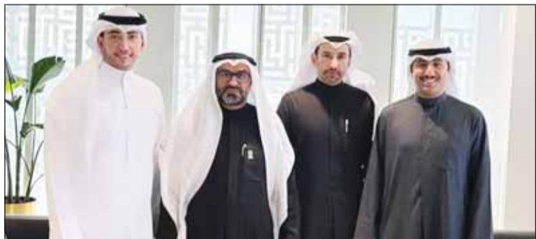
مدير الجامعة بالإبابة د. شارب الحريه خلال لقائه اتحاد الطلبة والهيئة الإدارية

الطلبة لهذا العام واستمرار سريان القرار الخاص بوقف التعيين والانتداب في جامعة الكويت. وطمان الحريه الطلبة ممثلاً بالاتحاد الوطني لطلبة الجامعة أن الإدارة الجامعية تعمل على قدم وساق على استكمال جداول جميع الطلبة في ظل الامكانيات المتوفرة. وبيدوره شكر الاتحاد الإدارة الجامعية وعلى رأسها الأستاذ الدكتور مشاري لافي الحريه مدير جامعة الكويت بالإبابة على حرصه الواضح على مصلحة الطلبة ومحاولة إزالة أي عقبات أو مشكلات تواجه سير العملية التعليمية داخل الجامعة.