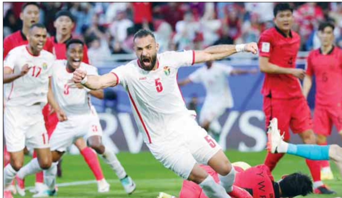
الشماس "لدخول التاريخ"