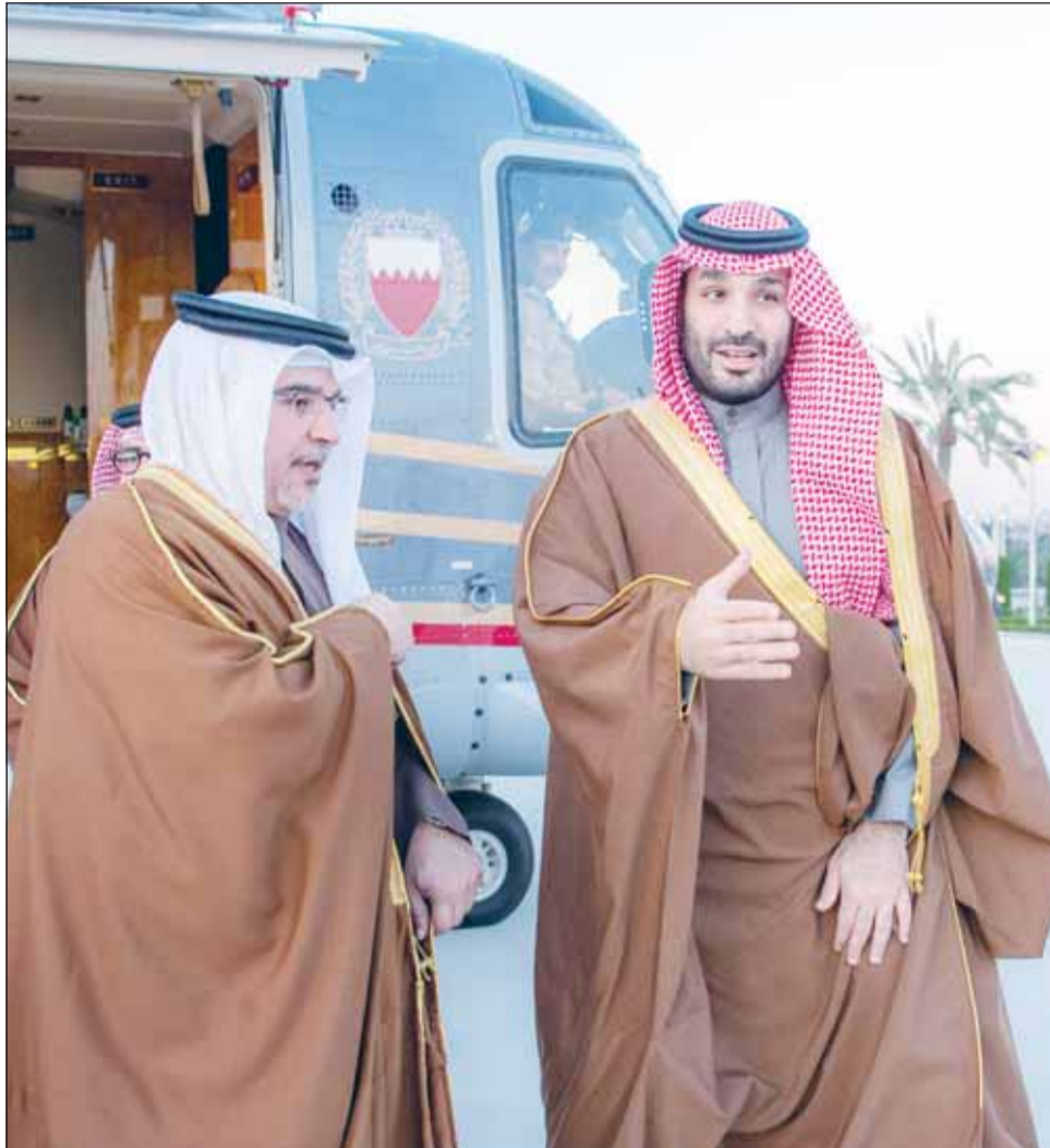
ولي العهد السعودي الأمير محمد بن سلمان مرحبا بولي العهد البحريني الأمير سلمان بن حمد في الرياض

وأشاد الأمير محمد بن سلمان خلال الاجتماع بالعلاقات التاريخية المتينة والعريقة التي تربط السعودية والبحرين وشعبهما الشقيقين، متطلعا لبذل المزيد من الجهود لتحقيق رؤية خادم الحرمين الشريفين الملك سلمان بن عبد العزيز تجاه وحدة دول مجلس التعاون الخليجي التي من شأنها تحقيق الاستقرار والنماء لشعوبها، مشيراً إلى أن ما يقوم به مجلس التنسيق السعودي - البحريني واللجان المنبثقة عنه من أعمال ومبادرات في جميع مجالات التعاون من شأنها أن تحقق المنفعة لمواطني البلدين وتبني تطلعات قيادتهما.