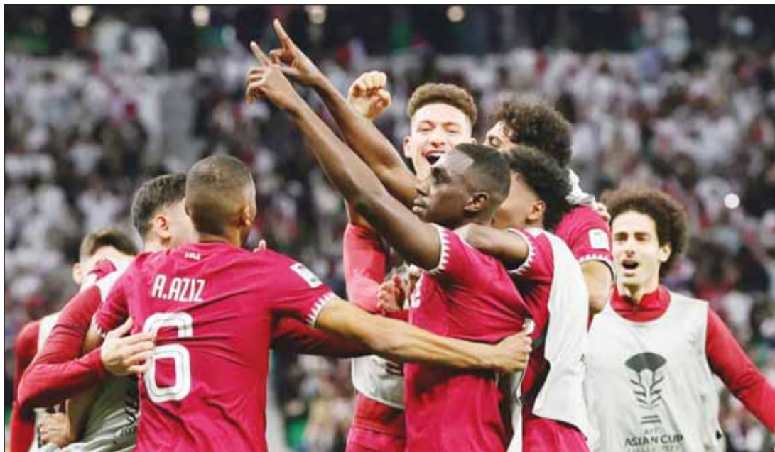
العنابي "للاحتفاظ باللقب الآسيوي"