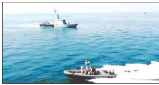
جانب من الزوارق المشاركة في التمرين

ضاربة كإجراء غارة برمائية متعددة الأطراف مكونة من قوات خاصة مختلطة وعمليات اقتحام وتفقيش السفن التجارية وأمالات النفط؛ وذلك للوصول إلى أعلى درجات التنسيق والتعاون من أجل زيادة القدرة المشتركة وقابلية العمل البيئي بين المشاركين. وأوضحت أن التمرين - الذي يقام بصورة دورية - يهدف إلى تعزيز القدرات القتالية والدفاعية و يساهم في تحقيق الاستقرار و حفظ السلام في منطقة الخليج العربي بشكل عام والأمن البحري بشكل خاص.