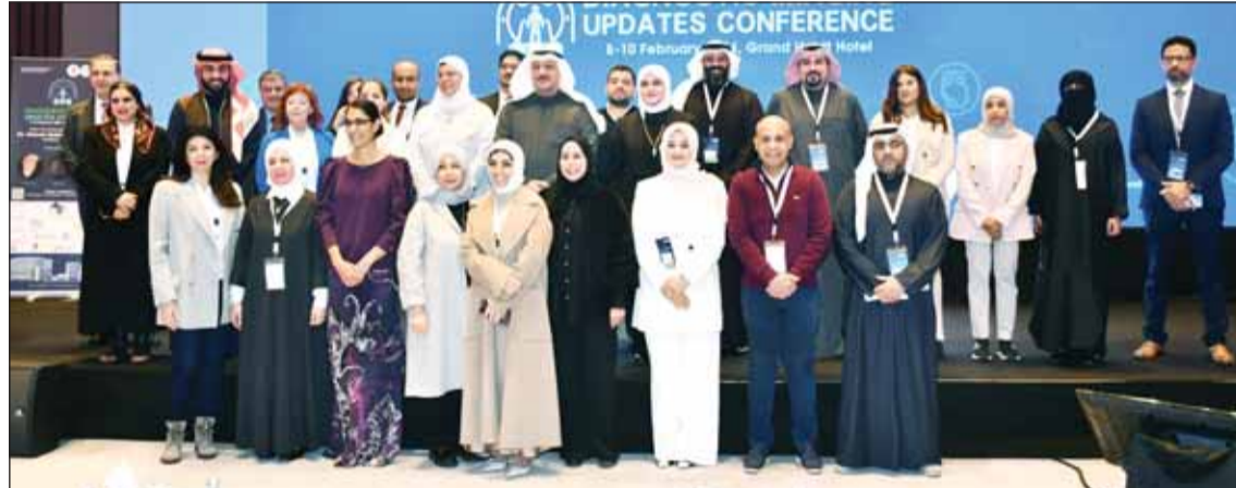
وزير الصحة د. أحمد العوضي يتوسط عددا من المشاركين في المؤتمر