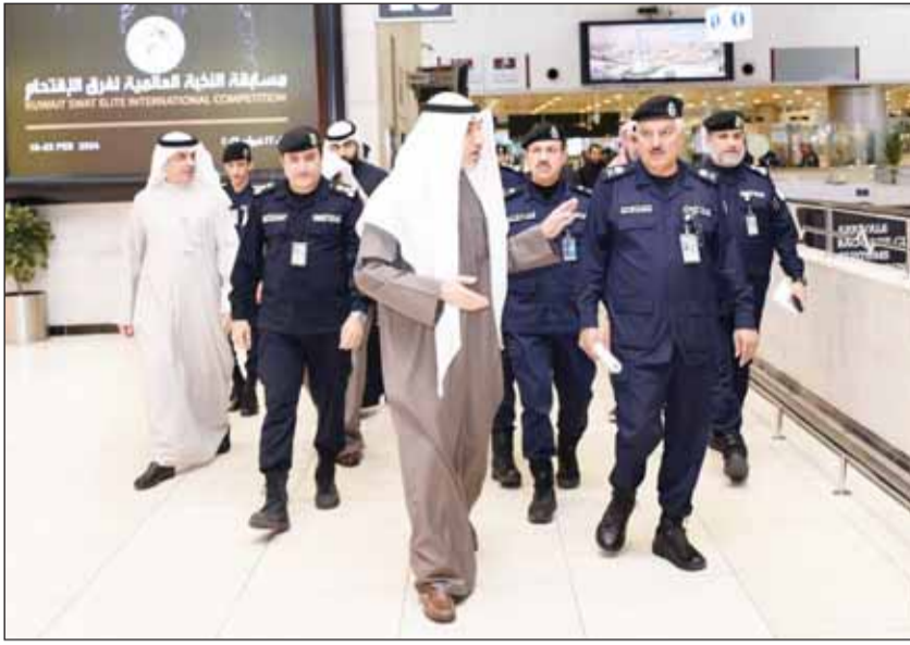
وزير الدفاع وزير الداخلية بالوكالة الشيخ فهد اليوسف خلال تفقده المطار