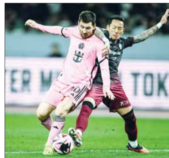
ميسي، أسعد اليابانيين وأغضب الصينيين

يبدو أن الجدل المتعلق بعدم خوض لاعب كرة القدم الأرجنتيني ليونيل ميسي لمباراة في هونغ كونغ لن يهدأ، حيث أبدى الكثيرون في الصين على وسائل التواصل الاجتماعي استياءهم الشديد من عدم مشاركته في اللعب. وذكرت وكالة أنباء "بلومبرغ" أن تصريحات كينيث فوك، عضو المجلس التشريعي للرياضة في هونغ كونغ، تصدرت قائمة أكثر الموضوعات تداولاً على موقع التواصل الاجتماعي "ويبو" أول من أمس، حيث اتهم فيها ميسي وتناديه إنتر ميامي الأميركي، بعدم احترام الجماهير المحلية.