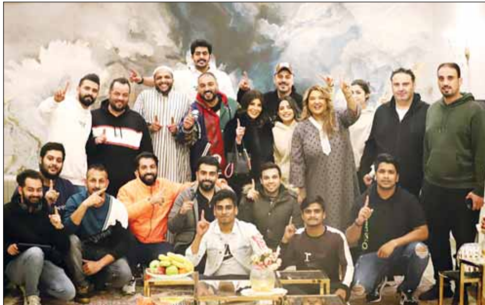
صورة جماعية لفريق مسلسل "بعد غيابك عني"

يجسدها لديها الكثير من الخيال في العلاقات الرومانسية، لكنه يحب من أعماق قلبه رغم المعاناة التي