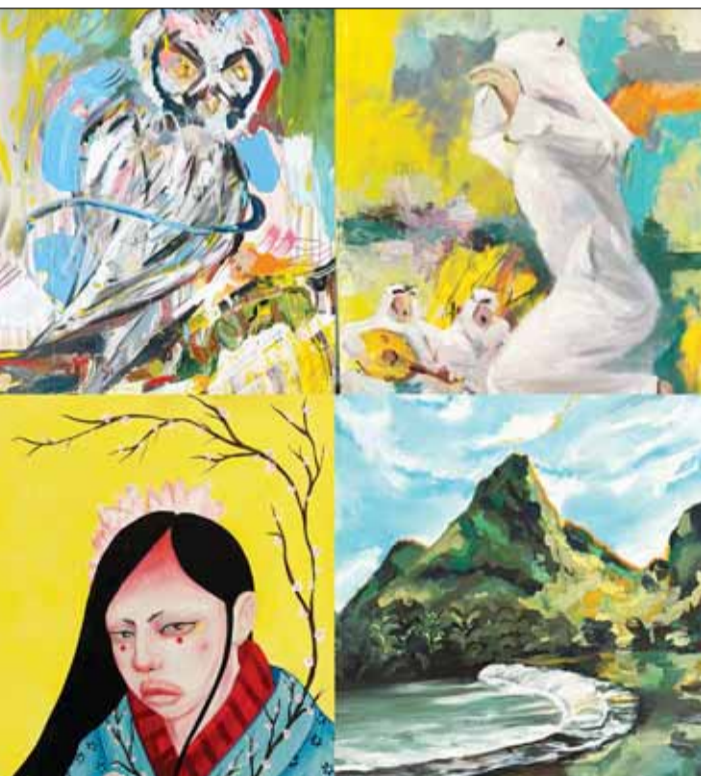
بعض الأعمال الفنية ضمن مسابقة ألوان الموسيقى

الشعري، عن سعادة الشركة برعاية هذه المسابقة قاطنة، "تمتلك شركة Ooredoo سجلاً حافلاً بدعم العديد من الأنشطة والفعاليات التي تهم مختلف شرائح المجتمع".