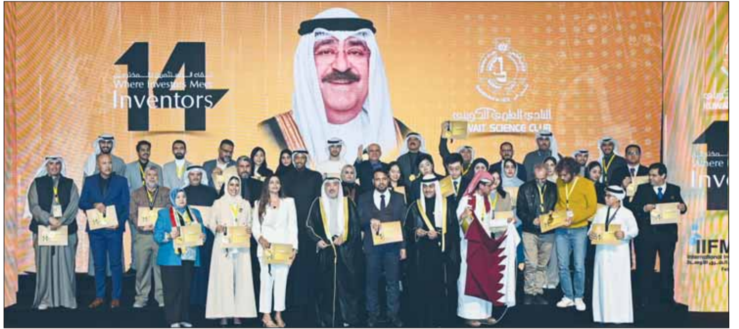
الفائزون الحاصلون على "الذهبية"