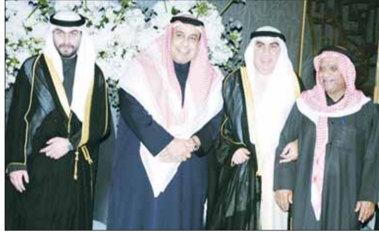
السفير فيصل الغيص يبارك