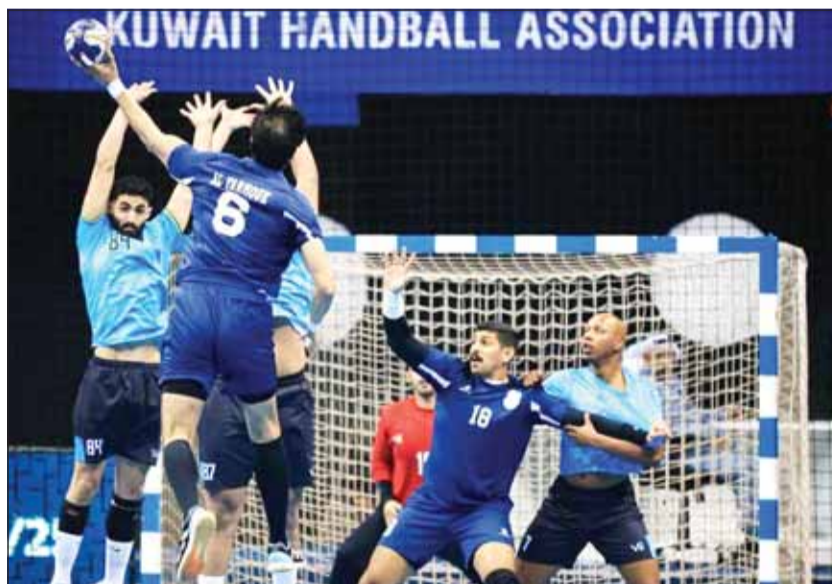
الساوي عبر اليرموك بصعوبة