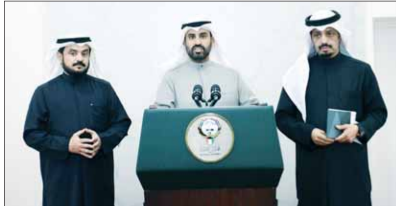
الجمعيّة متوسطة الحويّلة والمطيريّة خلال المؤتمّر الصحافيّ