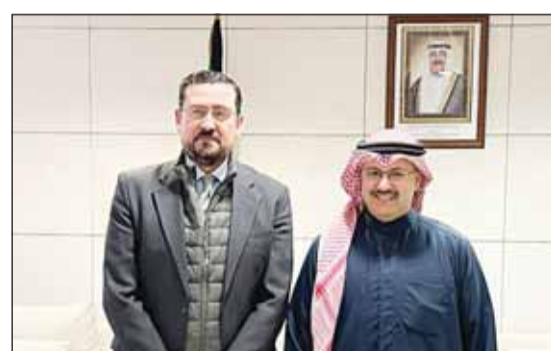
الوزير الشيخ فراس المالک والسفير الإسباني

أكد وزير الشؤون الاجتماعية وشؤون الأسرة والطفولة الشيخ فراس المالک أهمية الاطلاع والاستفادة من أهم التجارب والخدمات الاجتماعية في الدول المتقدمة، ومنها مملكة إسبانيا. وقالت "الشؤون" في بيان لها أمس إن المالک استقبل سفير إسبانيا ميغيل أغيلار للاطلاع على أهم التجارب والخدمات الاجتماعية التي تقدم في بلاده، مشيداً بعمق العلاقات الثنائية العريقة والمتميزة بين البلدين.