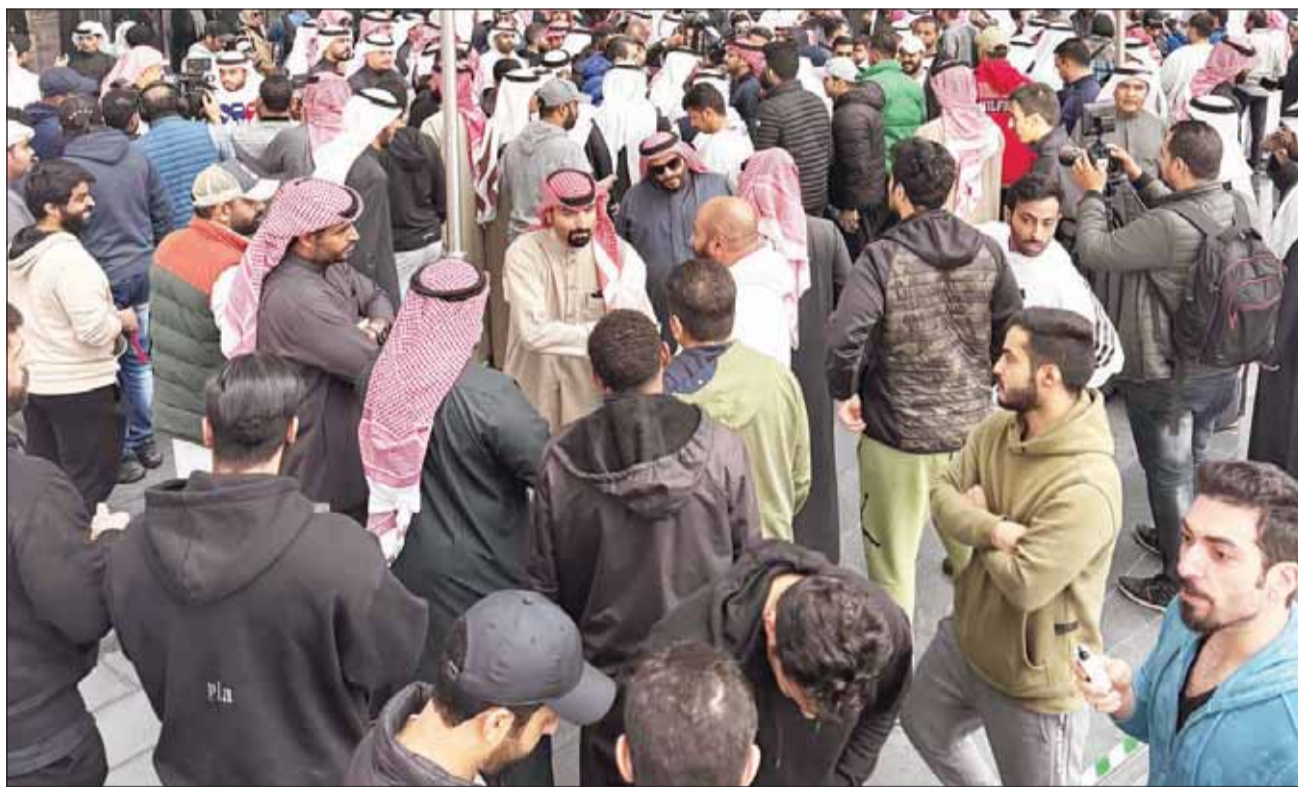
عدد من المعلمين اعتصموا اعتراضاً على البصمة أمام وزارة التربية أمس

"قضي الأمر"، فعلى وقع اعتصام "هش" نفذه العشرات أمام مبنى ديوان عام وزارة التربية، ركب قرار إلزام المعلمين في المدارس بالبصمة الالكترونية لإثبات الحضور والانصراف السكّة، ونجحت الوزارة في تحدي اليوم الأول، إذ بصم 89 ألفاً لتسجيل المدارس بمختلف مراحلها حضوراً غير مسبق والتزاماً من الجميع رؤساء ومرووسين. (راجع ص4-5) وفيما دخل أعضاء مجلس الأمة على الخط مهديين ومتوعدين وزير التربية وزير التعليم العالي د.عادل العدواني بالمسألة إن لم يتراجع عن القرار الذي بدأ يدهيها ومستحقاً وليس ثمة ما يعيبه، طرح الوسط التربوي تساؤلات تتعلق بالمرونة في تطبيق البصمة والفخرة المسموح بها للخروج نهاية الدوام، لاسيما من ليست لديه حصة أخيرة وألية الاستخذان، النتمة 06