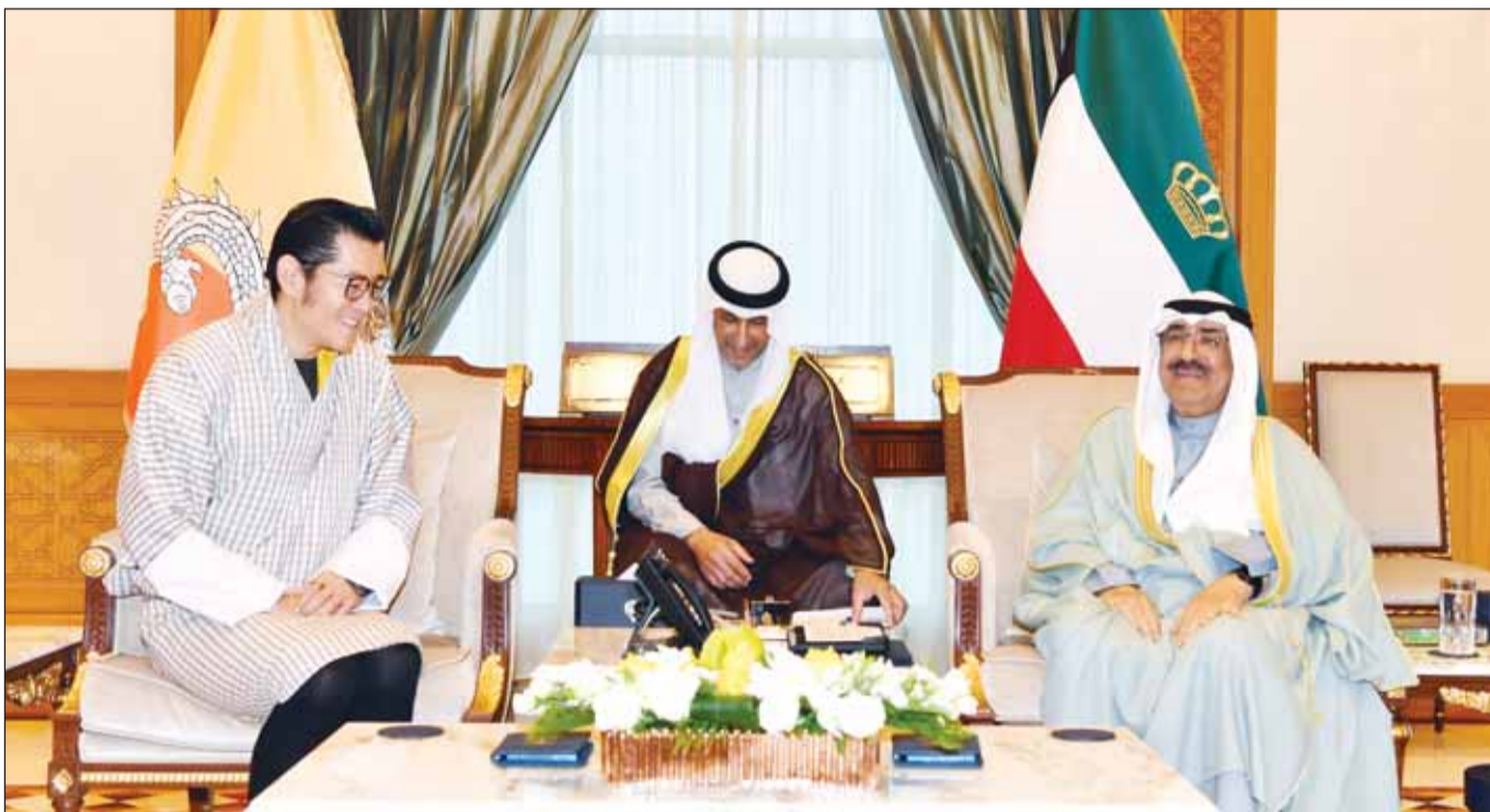
سمو أمير البلاد الشيخ مشعل الأحمد مستقبلاً ملك بوتان جيغمي كيسار نامجيل وانجشوك

متمنيا سموه له دوام الصحة والعافية وللمملكة الأردنية الهاشمية الشقيقة وشعبها الكريم كل التقدم والازدهار في ظل قيادته الحكيم.