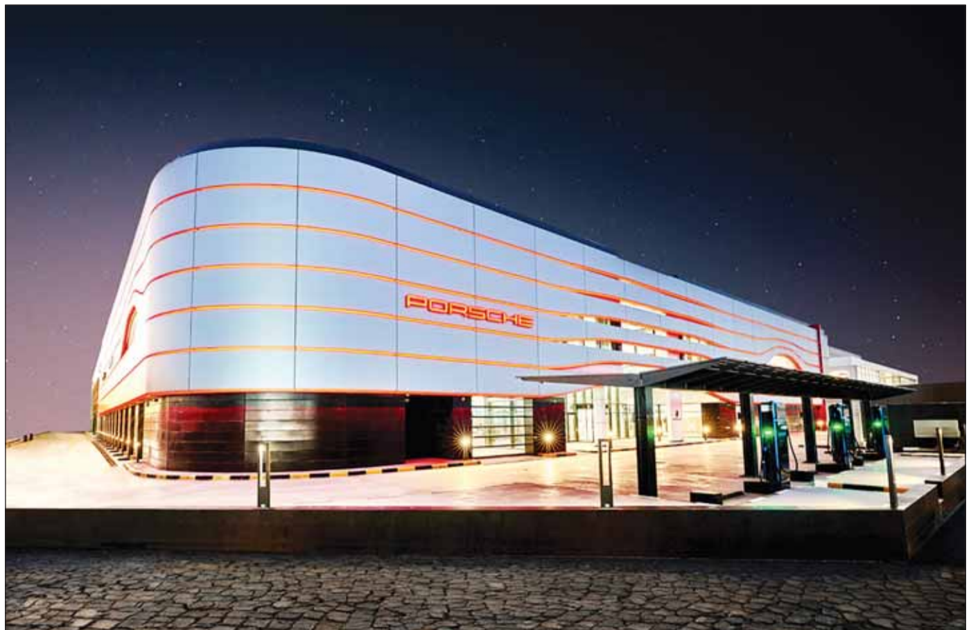
افتتاح مركز بورشه الجديد في الشويخ