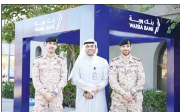
جانب من جناح بنك وربة في نادي ضباط الجيش

أعلن بنك وربة عن رعايته لأنشطة نادي ضباط الجيش بما في ذلك الأعياد الوطنية حتى تاريخ 1 مارس، تقديراً لما يقدمونه من جهود واضحة وخدمات جليلة للوطن.