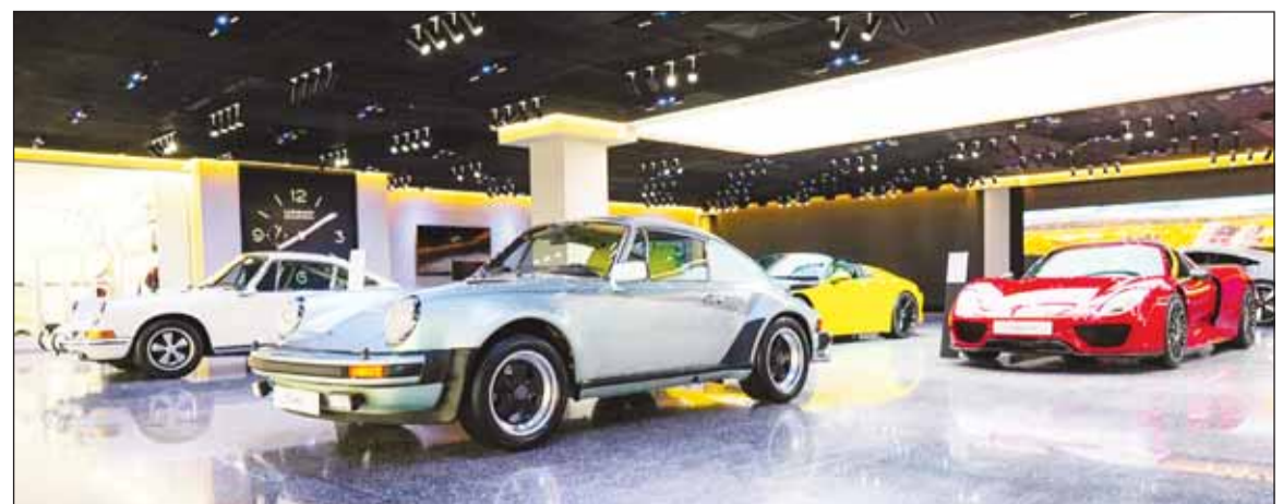
مركز بورشه للتجربة

مركز بورشه الشويخ ليس مجرد معرض للسيارات، بل هو وجهة تجمع بين الابتكار والأداء والشغف لإعادة تعريف تجارب السيارات الفاخرة، ندعو عملائنا الأعزاء والمتمسكين للانضمام إلينا في هذه الرحلة الاستثنائية، ليعيشوا روح بورشه بكامل حيويتها كما لم يحدث من قبل.