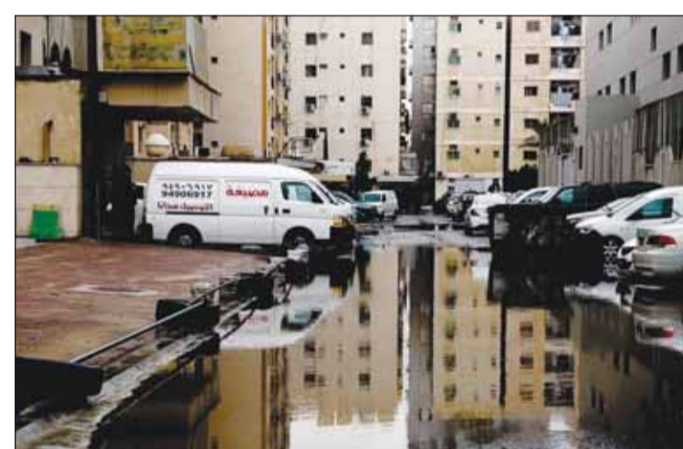
تجمعات بسيطة لمياه الأمطار في بعض المناطق

وكشفت إدارة الأرصاد الجوية في الإدارة العامة للطيران المدني أن منطقتي العبدلي والابرق سجلتا أعلى كمية للأمطار بواقع 9,5 ملم، تلتها أمطار الكويت بـ 6,5 ملم ثم رأس السالمية بـ 3,9 ملم حتى الساعة 12,30 مساءً.