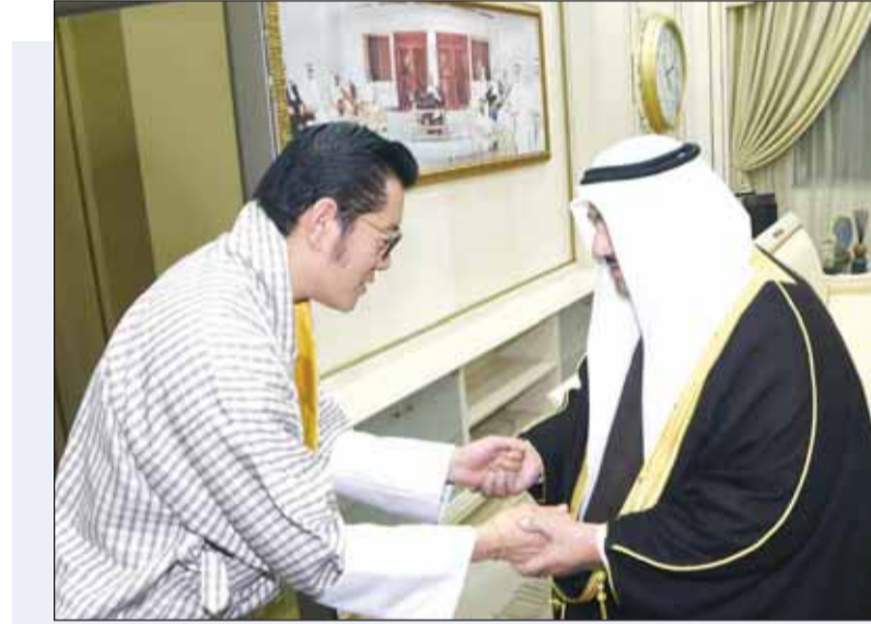
سمو الشيخ ناصر المحمد مستقبلاً ملك مملكة بوتان