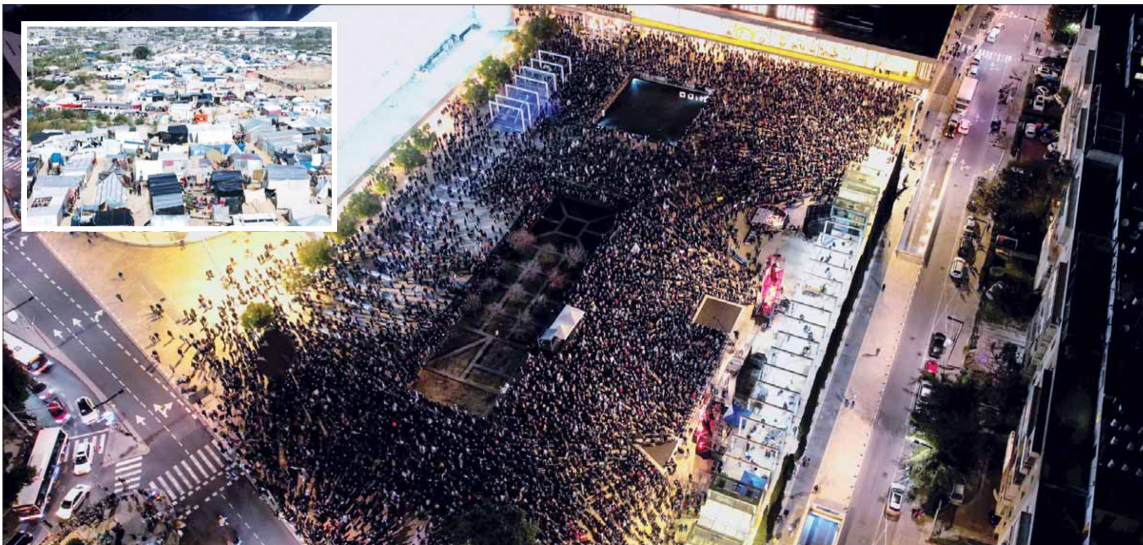
جانب من الاحتجاجات الحاشدة التي اجتاحت مدن الاحتلال الإسرائيلي للمطالبة بإقالة نتانياهو وهغه صفقة مع حركة "حماس" وفتح الإطارات النازحين الفلسطينيين في رفح حيث يتكدس مئات الآلاف وسط قلق من هجوم برية وشيك وتحذيرات من حمام دم (وكالات)

بإغلاء رفح قبل العملية البرية، لكنه لم يوضح أين سيسمح لهم بالمغادرة، مضيفة أن إدارة بايند تشعر بالقلق وتعتقد أن إسرائيل ليس لديها خطة منظمة للأنشطة في رفح من شأنها أن تسمح بحماية الكثافة السكانية المدنية في المدينة. وكان رئيس وزراء الاحتلال الإسرائيلي بنيامين نتانياهو جدد أمس، زعم الاحتلال إطلاق عملية عسكرية في رفح، رغم أن "النصر في متناول اليد بالسيطرة على رفح، المعقل الأخير لحماس". وكشفت بعض التفاصيل المتعلقة بالعملية العسكرية حيث أبلغ المجلس الوزاري المصغر للشؤون السياسية والأمنية (الكابينت)، بأن إسرائيل ليس أمامها سوى شهر واحد لإكمال عملياتها قبل بدء شهر رمضان، وزعم ضمان المرور الآمن للسكان المدنيين حتى يتمكنوا من المغادرة، قائلًا "تعمل على وضع خطة مفصلة لتحقيق ذلك ولا نتعامل مع الأمر بشكل عرسي"، لافتًا إلى أنه تم تطهير مناطق في شمال رفح يمكن استخدامها كمناطق آمنة للمدنيين، قائلًا للمنتقدين "أولئك الذين يقولون إننا يجب ألا ندخل رفح مطلقًا، يقولون لنا في الواقع إننا يجب أن نخسر الحرب، وتترك حماس هناك". في المقابل، هدد قيادي كبير في "حماس" من أن أي هجوم على رفح سوف يفسد ملف مفاوضات تصعيد الأزمة، وأعلنت كتائب القسام أن القصف الإسرائيلي المتواصل على غزة خلال الـ 96 ساعة الأخيرة، أدى إلى مقتل أسيرين وإصابة 8 آخرين بجروح خطيرة، وتظاهر الآلاف في عدد من مدن إسرائيل منها تل أبيب وحيفا، مطالبين بإقالة حكومة نتانياهو وإجراء انتخابات مبكرة والتوصل لصفقة تعيد الأسرى من قطاع غزة.