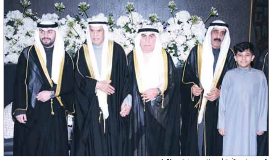
رئيس مجلس الأمة أحمد السعدون قدم التهاني