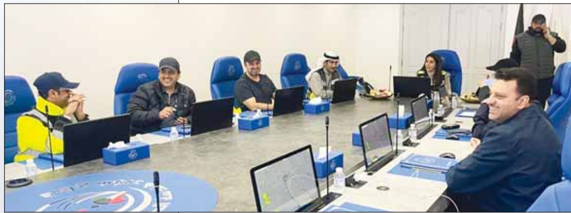
الوزير د. نورة المشعان تتابع استعدادات الوزارة من غرفة العمليات