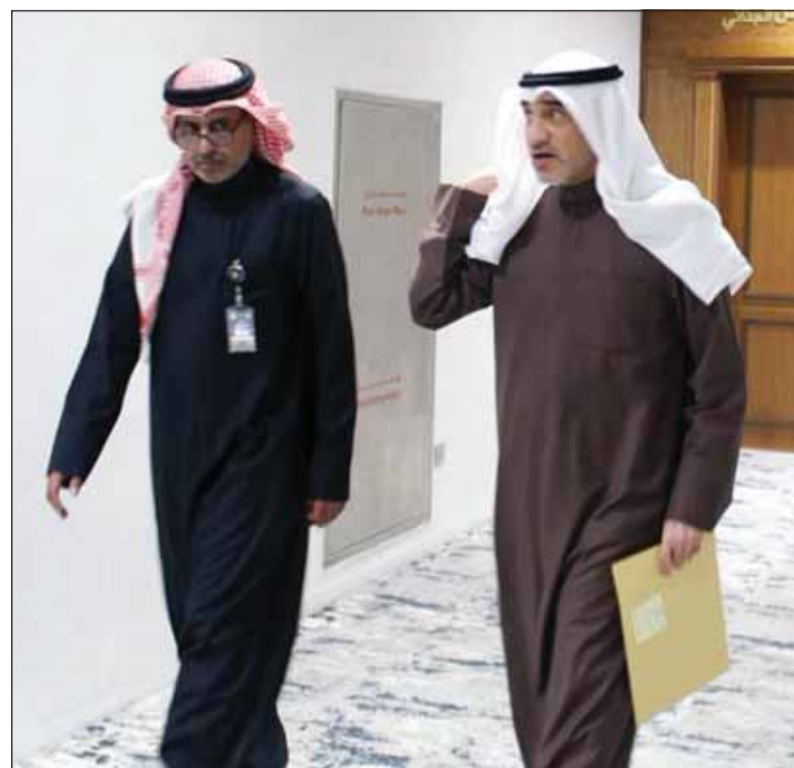
الوزير الشيخ فهد اليوسف خلال تفقده الادارة العامة للمباحث الجنائية

أكد نائب رئيس مجلس الوزراء ووزير الدفاع وزير الداخلية بالوكالة الشيخ فهد اليوسف ضرورة اتباع الأسس والإجراءات القانونية الصحيحة في مجال البحث والتحري وضبط القضايا ومراعاة المقوق والحرية.