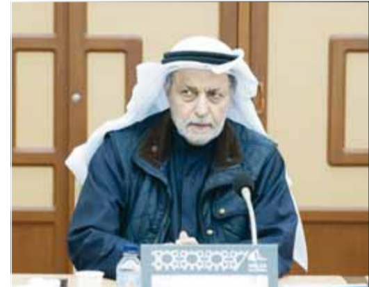
نائب رئيس الوزراء وزير النفط د. عماد العتيقي خلال الاجتماع

الموضوع ووصلنا إلى توافق نيابي حكومي حول تنفيذ هذا المطلب الشعبي والأساسي لهذه المناطق الجديدة. وأشار إلى أن اللجنة ستعقد اجتماعاً مكملًا بعد شهر، مبيّناً أنها تلقت وعوداً من وزير النفط والأشغال بأن يكون هناك رد مكتوب وإيجابي من أجل الوصول لتوافق نيابي حكومي والموافقة على هذا المقترح.