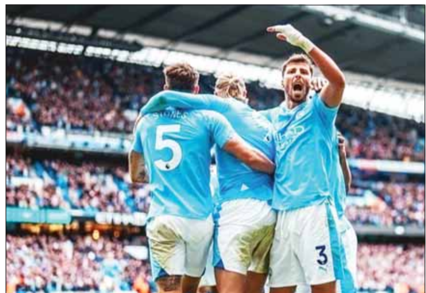
السيتي ضيفاً ثقيلًا علم كوينهاغن

نفس اليوم الذي يشهد موقعة بايرن ميونخ ولاتسيو في روما. وفي الأسبوع التالي، تقام مواجهات الذهاب الأربع المتبقية، إنتر ميلان وأتلتيكو مدريد، ليندهوفن وبروسيا دورتموند يوم الثلاثاء 20 فبراير الجاري، وفي الأربعاء 21 فبراير تقام مباراتاً بورتو مع أرسنال، ونايولي ضد برشلونه. ويطمح كوينهاغن إلى الذهاب لأبعد مدى ممكن في "التشامبيونز" بعد تأهله كوصيف مجموعة، رغم أنه ليس مرشحاً للتأهل على حساب "السييتيزنس" الذي يقدم مسيرة رائعة في "التشامبيونز" وفاز على جميع منافسيه في نسخة العام الماضي.