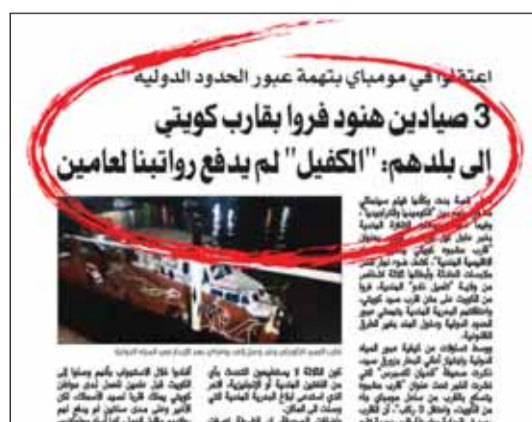
صورة ضوئية للخبر الذي نشرته "السياسة" الخميس الماضي

أنهما يريدان السفر إلى الهند وأنه يحتجز جوازيهما، وأوضحت للقوى العاملة بالمستندات أنها ممنوعان من السفر بقرار محكمة، مبدية استعداده لتسليم الجوازات فوراً إذا كانت هناك