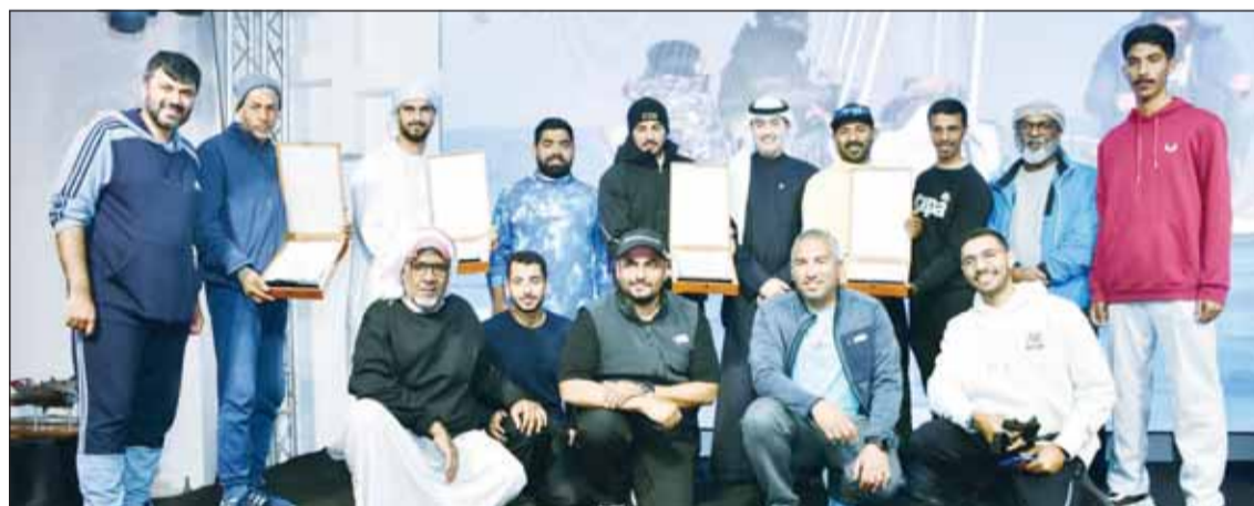
(تصوير - محمد مرسي)