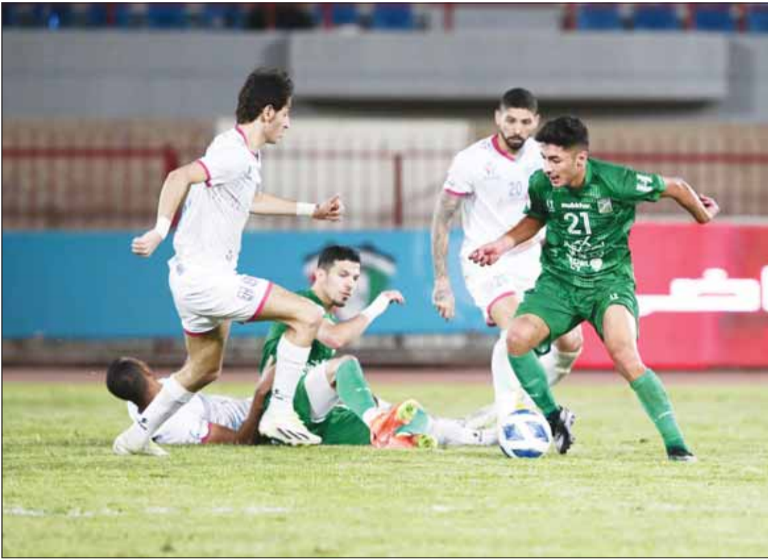
العربي والجهراء يبحثان عن أكثر من هدف اليوم

ويذكر مدرب العربي اليوسني داركو نستوروفيتش أن أي نتيجة غير الفوز اليوم،