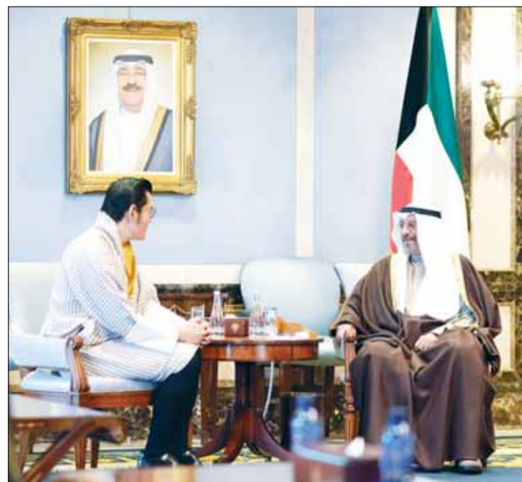
سمو رئيس الوزراء الشيخ د.محمد الصباح مستقبلاً ملك بوتان جيغمي كيسار

قطر لكرة القدم ببطولة كأس آسيا AFC قطر 2023م.