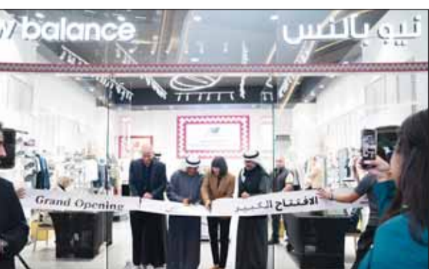
السفيرة الأميركية وستوارت وفصيل المطوع وحالد المطوع أثناء الافتتاح

أعلنت شركة علي عبدالوهاب المطوع التجارية عن افتتاح فرع جديد للعلامة التجارية New Balance في الكويت وتمهيداً في مول العاصمة، في قلب مدينة الكويت. وبهذه المناسبة، أقيم حفل افتتاح حضرته سفيرة الولايات المتحدة الأميركية لدى الكويت كارين ساسامارا، والمدير العام الإقليمي New Balance ستيفارت هينودن، ورئيس مجلس الإدارة والرئيس التنفيذي في شركة علي عبدالوهاب المطوع التجارية، فيصل علي المطوع، ونائب الرئيس التنفيذي خالد فيصل المطوع، بالإضافة إلى مجموعة كبيرة من محبي العلامة التجارية New Balance.