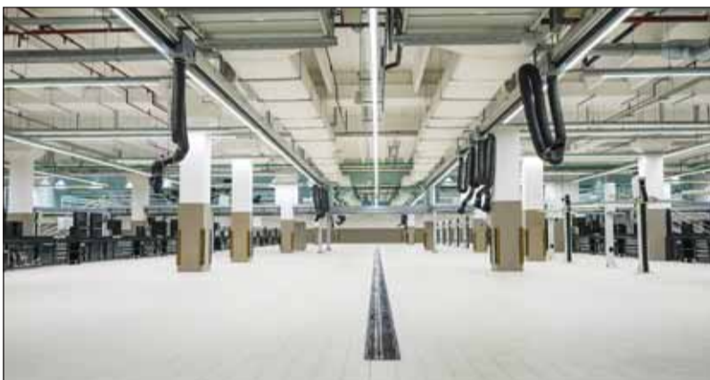
ورشة عمل في مركز بورشه الشويخ