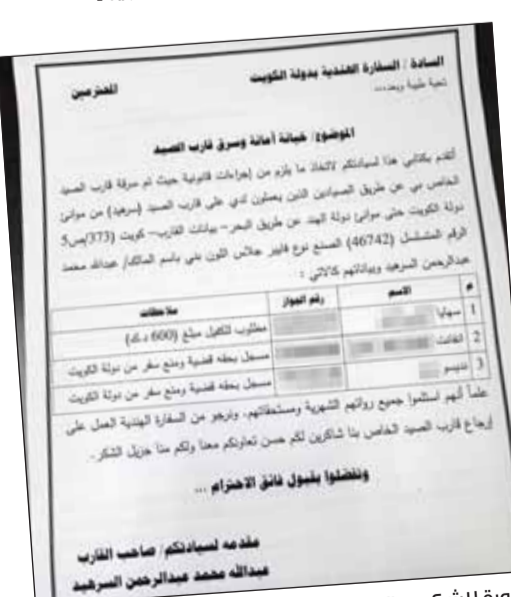
صورة للشكوى التي تقدم بها السرهيد إلى السفارة الهندية