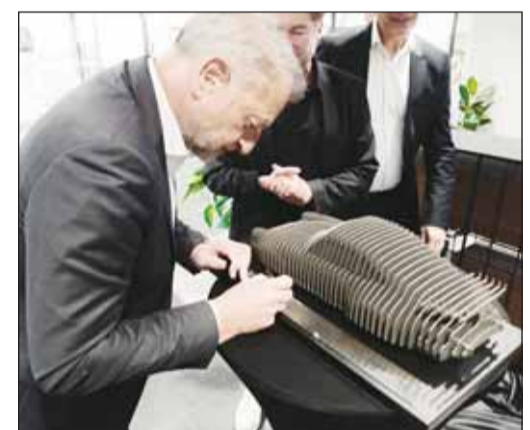
ديتليف فون بلاتن يحضر افتتاح مركز بورشه الشويخ بالكويت

وفي مساحة تبلغ 850 متراً مربعاً، يضم مركز بورشه الشويخ تمت جناحه أيضاً مجموعة حصرية من سيارات بورشه الخاصة، والتي قامت عائلة بهبهاني، المستورد الكويتي لسيارات بورشه، بجمعها على مدى الـ 60 عاماً الماضية.