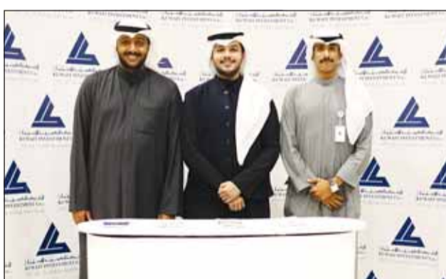
فريق الكويتية للاستثمار

المشاركين في المعرض من أصحاب المشاريع الصغيرة والمتوسطة للتعرف إلى تجارب عملية تدعم مشاريعهم الاستثمارية، وتساعدهم في النهوض بأعمالهم الناشئة. وذكر أيضاً أن "الكويتية للاستثمار" قامت بالإضاءة على جميع الخدمات التي يمكن أن تحسن مسار المبادرين، وطرق الحماية الواجبة من المخاطر المرتبطة والمتمثلة، مبيناً أن دعم الشركة بهذا الشأن لن يتوقف عند الشق التعريفي والإرشادي، بل يتضمن أدوات مختلفة من شأنها تعزيز هذا القطاع ورفع كفاءته، بما يودي في النهاية لبناء بيئة نشطة لتتمية المشروعات الصغيرة والمتوسطة باعتباره أمراً حيوياً لتعزيز التنوع الاقتصادي في الكويت على المدى البعيد.