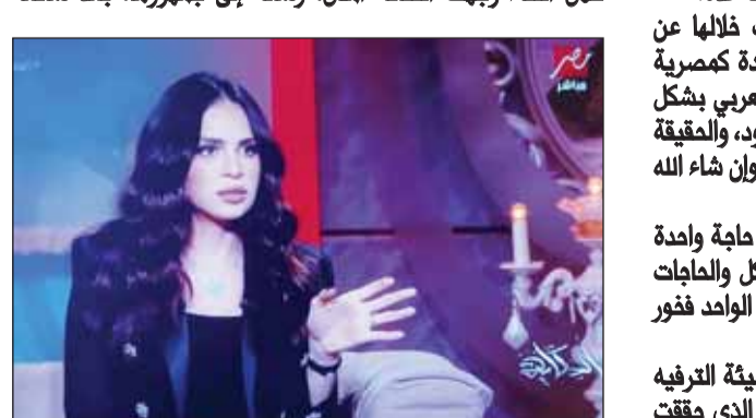
آمال ماهر صديقة "الحكاية"

تصدرت الفنانة آمال ماهر، البحث في "غوغل"، وحلت "ترند الميديا" بتعليق الجمهور على إطلاقتها المفاجئة في برنامج "الحكاية"، تقديم الإعلامي عمرو أديب، عبر شاشة mbc مصر، بعد غياب طويل عن الساحة الإعلامية والفنية لامتعتها خلالها شائعات عدة.