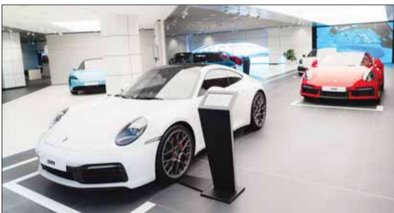
صالة عرض مركز بورشه الجديد