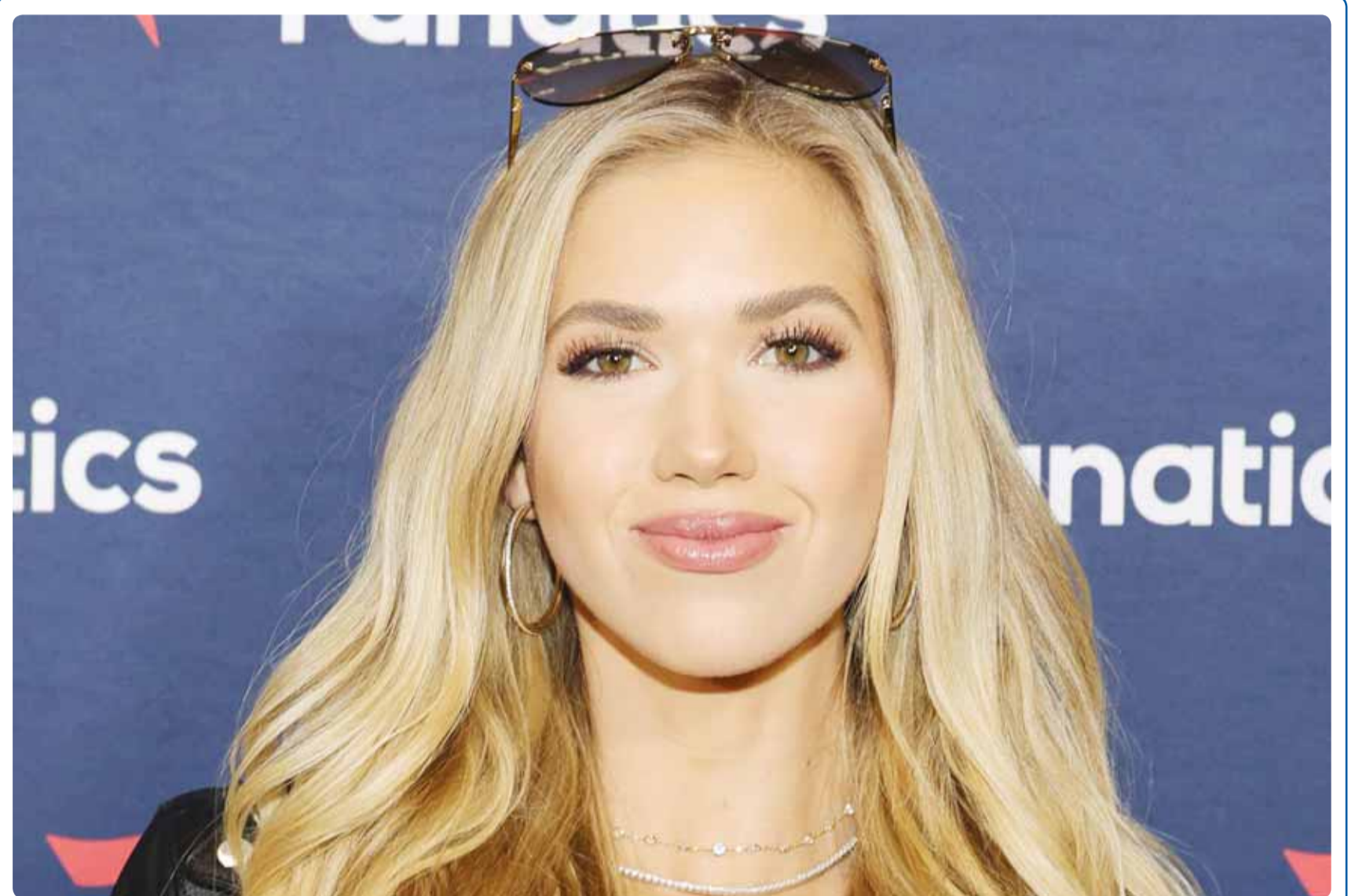
الممثلة الاميركية غابريلا هانت خلال حضورها حفل "Super Bowl" في لاس فيغاس

إننا في الكويت دولة مسالمة وشعب مسالم، غير أننا في موقع جغرافي حساس يتطلب منا دائما اليقظة والحذر، إذ رغم أننا نؤمن بقدر الله سبحانه، ونتوكل عليه، لكن علينا أن نعقلها.