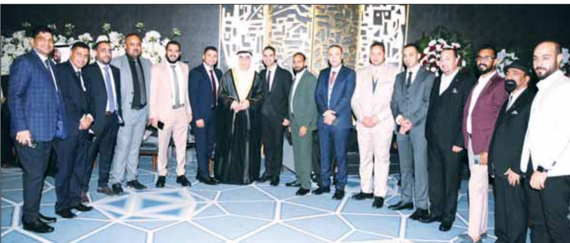
موظفو شركة الوسيط يقدمون التهاني لوالد المعرس