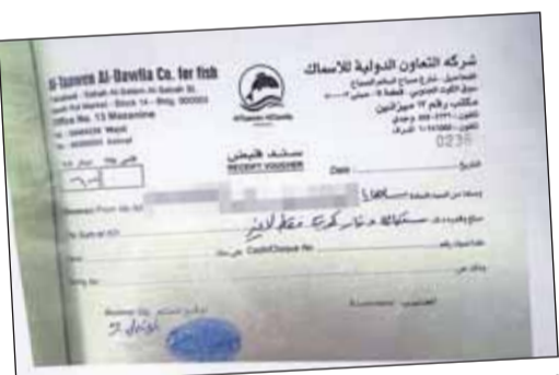
إيصال استلام 600 دينار