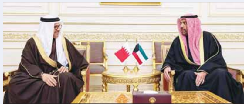
وزير الخارجية عبدالله الجبير مستقبلاً وزير خارجية مملكة البحرين د. عبداللطيف الزباني

استقبل وزير الخارجية عبدالله الجبير مساء أمس في مطار الكويت الدولي، وزير خارجية مملكة البحرين الشقيقة الدكتور عبداللطيف الزباني، بمناسبة زيارته الرسمية والوفد المرافق إلى دولة الكويت.