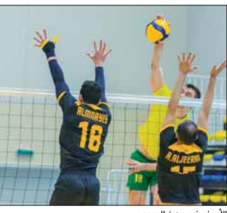
الأصفر خسر من السيب