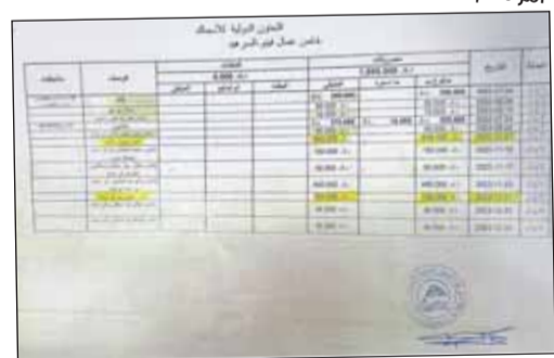
إيصال بمبلغ 600 دينار أعطاه لأحد الصيادين لتحويل إقامته