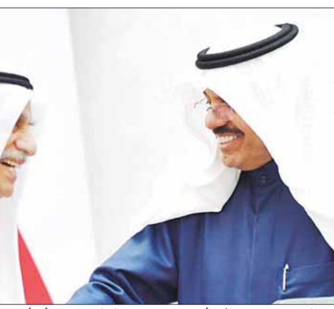
سمو رئيس مجلس الوزراء الشيخ أحمد النواف يلتقى تهنته رئيس مجلس الأمة أحمد السعدون

وافق المجلس في جلسة سرية، عقدت أمس، على ترشيح عصام الرومي لمنصب رئيس ديوان المحاسبة. وأشار إلى أن الرومي كان قد شغل منصب الوكيل المساعد لقطاع الرقابة على الوزارات والإدارات الحكومية في الديوان. وكان رئيس مجلس الأمة أحمد السعدون ألقى كلمة عبدالله السالم بعد انتقال المجلس إلى بند ترشيح رئيس ديوان المحاسبة لتعقد الجلسة سرية وفقاً لنص المادة (34) من قانون إنشاء ديوان المحاسبة رقم 30 لسنة 1964.