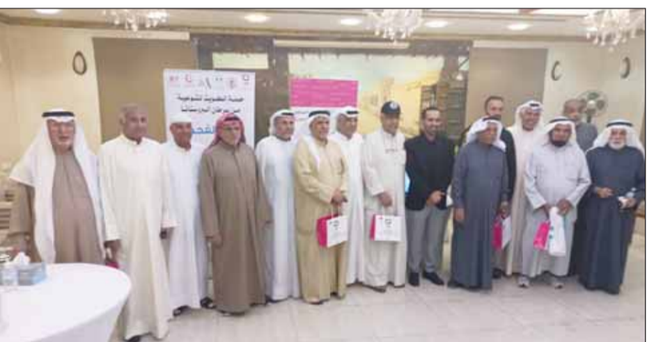
جانب من المشاركين في حملة "بادر بالفحص"

وأشار إلى انطلاق حملة الكويت للتوعية بسرطان البروستاتا التي أطلقتها (كان) في نوفمبر الجاري بالشراكة مع رابطة المسالك البولية الكويتية ورابطة الأورام الكويتية تحت شعار (بادر بالفحص)، وذلك بهدف تسليط الضوء على توعية فئة الرجال فوق الخمسين عاماً في دولة الكويت حول سرطان البروستاتا وأعلن تنظيم أكثر من 10 محاضرات ضمن أنشطة