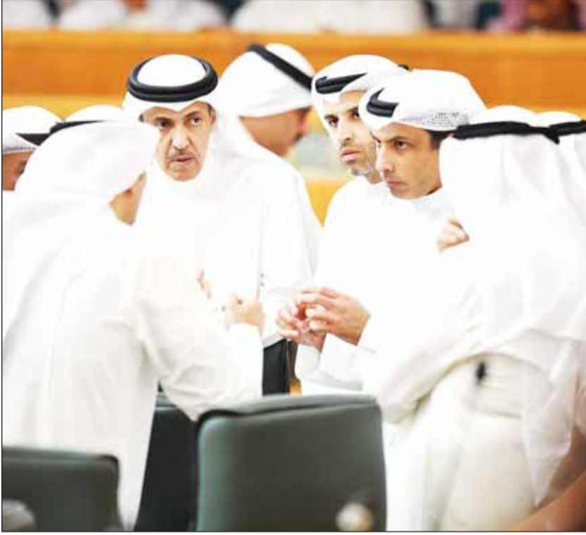
نقاش نيابي - حكومي