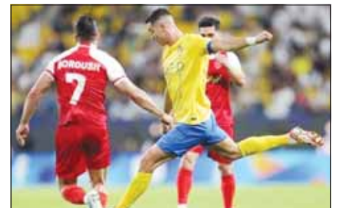
النصر تأهل لدور الـ16

وتأهل النصر لدور الستة عشر بدوري أبطال آسيا، معزراً صدرته للمجموعة الخامسة برصيد 13 نقطة، فيما رفع ببروزي رصيده للنقطة الثامنة في المركز الثاني بخارق أربع نقاط عن الدحيل القطري الذي فاز على الاستقلال متخذيل الترتيب. بدوره، حقق الاتحاد السعودي فوزاً مهماً بنتيجة 2-1 أمام مضيفه أجيك الأوزبكي، ليضمن التأهل لدور الـ16 من دوري أبطال آسيا.