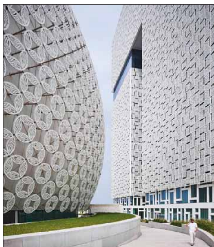
مشروع المباني الإدارية

حصل مشروع المباني الإدارية في مدينة صباح السالم في جامعة الكويت، على المركز الأول على المستوى المحلي والثاني على المستوى الإقليمي ضمن فئة "أفضل مشروع تعليمي واجتماعي" في جوائز MEED Projects Awards المرموقة لعام 2023. ويأتي هذا التكريم اعترافاً بالتصميم المعماري المتميز والمبتكر للمشروع.