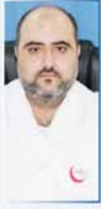
د/ ايهم BDS الأسنان