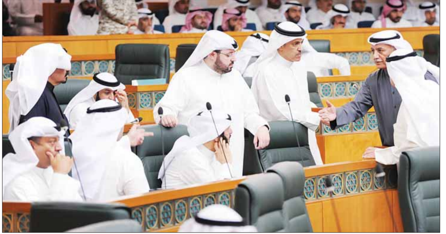
حوار نيابي ساخن

في بادرة حسن نية واستجابة للضغوط والمطالبات النيابية قبل مناقشة الاستجواب