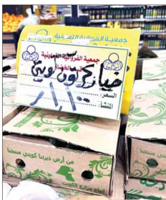
سعر كرتون الخيار قفز إلى 1.100 دينار