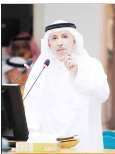
المضيف خلال مرافعته

مع وزرائه، وترك الوزراء النواب وكان لدى النواب أغلبية نيابية تساعده لكنه استقال وعطل الجلسات وتأخر التشكيل الحكومي كثيراً، ما الفرق عن سبقت من رؤساء الحكومات. وتساءل، أين أنت من قوانين تحسين معيشة المواطن، أنت لجأت إلى مجلس الأمة مع أنك كنت قادراً على حسمها بشخطة قلم دون الحاجة إلى قوانين من مجلس الأمة، نهجك لم يختلف عن سبقت، طائرات الديوان الاميري يتم استقلالها في رحلات شخصية خاصة وفي هذا هدر للمال العام، أين طوكت لتطوير التعليم والخدمات الصحية في المراكز الصحية الحكومية؟ وتابع قائلاً، نحن امام رئيس وزراء تراجع عن مضامين الخطاب السامي التاريخي، ولا يملك رؤية لمتطلبات العهد الجديد ولذلك اساسه على المنصة، لاسف نحن نعيش حقبة ضياع احد اهم مشرراته التشكيل الحكومي السعي، عندما تختار وزيراً متهماً بشراء أصوات ماذا يعني هذا؟ نعم تم استبعاده قبل يومين من القضية. واضح ان النواب لا يتقنون بك لذلك رفضوا التوزير. هل لدى الحكومة رؤية حقيقية، جواب وزير الدفاع على سؤال برلماني أكد فيه ان اجراء الكويت مفتوحة ولا دفاع جوياً ضد الميسرات، هذا الجواب كفيلاً بان يطير الحكومة ووزير الدفاع يفترض الا يستمر في منصبه، في بعض الدول يعتبر كلام وزير الدفاع هذا خيانة. وتختم بقوله، إن رئيس الحكومة يستهتر بالسؤال البرلماني، وإذا لم يجد النائب الجواب على أسئلته بذلك هل نبحث عنها في وكالة يقولون؟ أيضاً لدينا أكثر من 500 منصب قيادي شاغر لم يتم شغلها حتى الآن، وتعلمنا اليوم انك من تخبط في توزيع الهبات الحكومية.