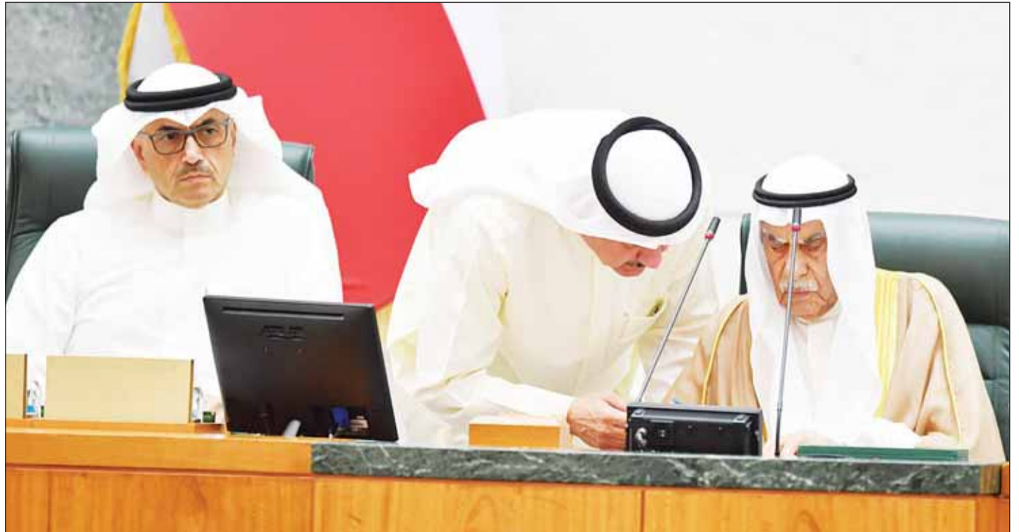
رئيس مجلس الأمة أحمد السعدون في حوار مع نائب رئيس مجلس الوزراء عيسه الكندري