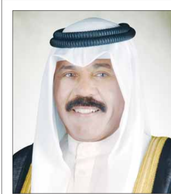
سمو أمير البلاد الشيخ نواف الأحمد

■ (روما) - كونا، اتفقت الكويت وجمهورية سان مارينو على بنود اتفاقية لتنظيم التشغيل الجوي بين البلدين وزيادة التعاون بينهما في مجال الطيران المدني. وذكرت سفارة دولة الكويت في روما في بيان لـ (كونا) أمس أن ممثلي سلطات الطيران المدني في الكويت وسان مارينو عقدا أول من أمس اجتماعاً بمقر السفارة "بهدف الوصول إلى اتفاق لتنظيم التشغيل الجوي بين البلدين الصديقين وزيادة التعاون بينهما في مجال الطيران المدني". وأوضح البيان أن هذه المباحثات أسفرت عن التوقيع على محضر اجتماع رسمي بالموافقة على بنود اتفاقية تنظيم النقل الجوي ومذكرة التفاهم التي تنظم قواعد التشغيل وحقوق النقل بين البلدين والتي سيتم توقيعها