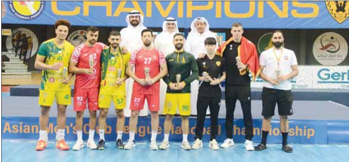
صفر و فلادان ويأسوهيرا ضمن التشكيلة المثالية بختام البطولة الآسيوية لليد