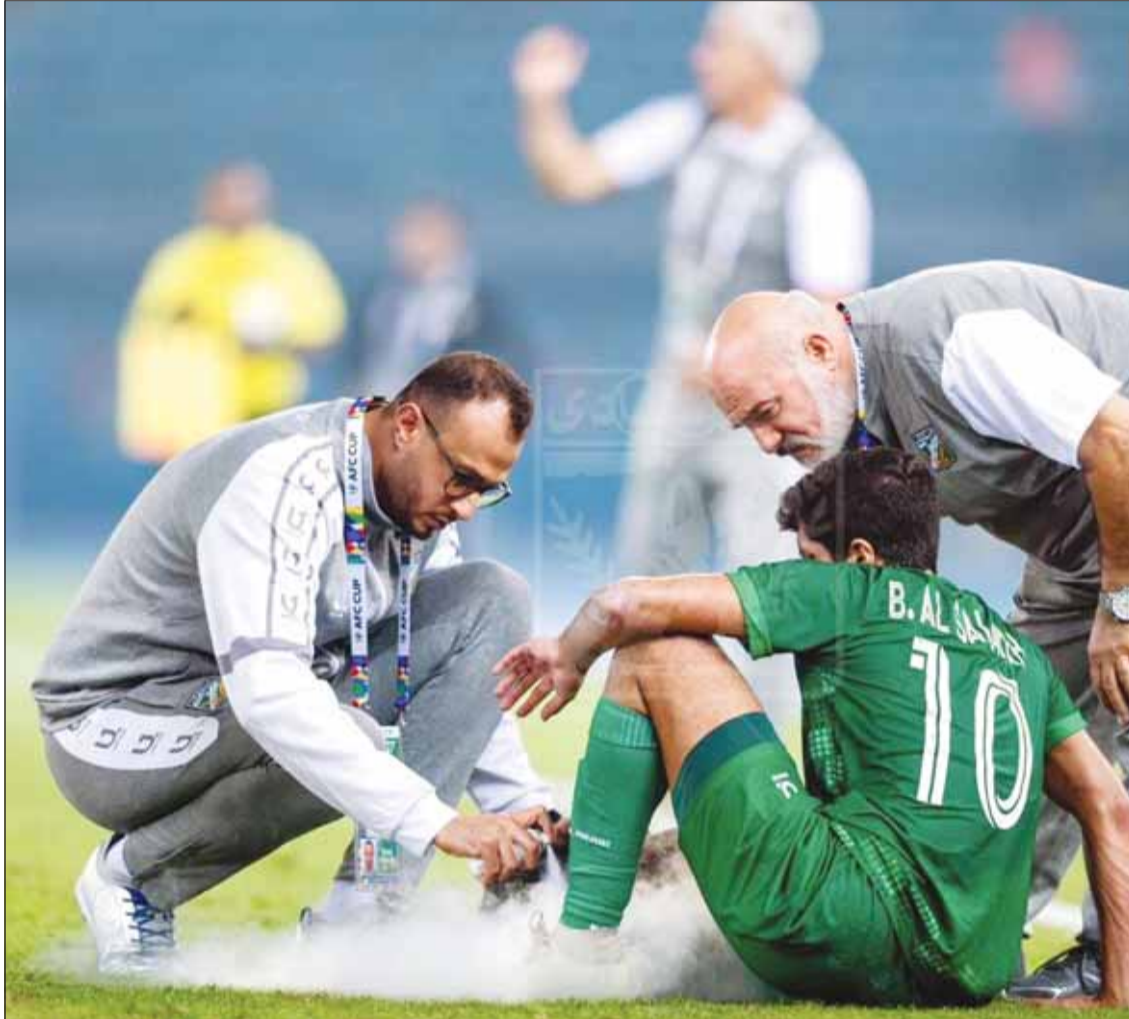
الإصابات أثرت على استقرار العربي