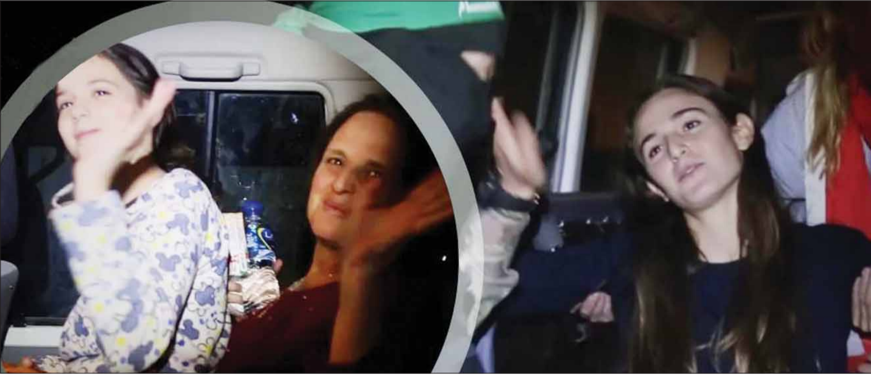
مشاهد تسليم مقاتلي "حماس" للأسرى إلى لجنة الصليب الأحمر آثار إعجاب العالم

عزة، عواصم - وكالات، حارب موازية نجحت فيها باقتدار المقاومة الفلسطينية، حيث لقن الفلسطينيون العالم درساً كبيراً في الأخلاق والحب والإنسانية، عبر مشاهد توديع الأسرى الإسرائيليين التي كانت ملأى برسائل تؤكد أنهم لا يقاتلون سوى الممثل، أما الأسرى فلم يعاملوا حسناً، مكتبيين الروايات الإسرائيلية التي تتحدث عن وحشيتهم ودمويتهم.