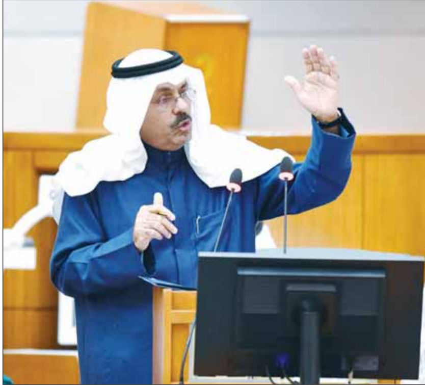
رئيس الوزراء الشيخ أحمد النواف يفتد محاور الاستجواب