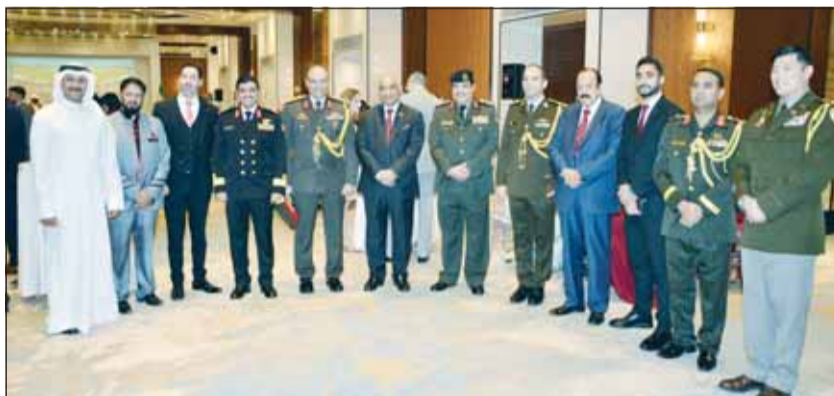
حضور عسكري وشعبي