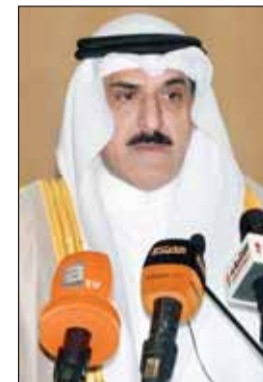
د.الأستاذ متحدثاً خلال المؤتمر

يعود بالفائدة على المجتمع العلمي لأهمية قضايا الطاقة لتحقيق أهداف النمو الاستراتيجي المستمر. في السياق، أشار رئيس جمعية المهندسين فيصل العتل لجهود "الجمعية" في مجال الطاقة مؤكداً تشكيل لجنة متخصصة بالطاقة وتنفيذ مبادرة لتقنين الكهرباء والماء في المساجد بتطبيق الأنظمة الذكية. الى ذلك، ذكر الرئيس التنفيذي لموسسة البترول الشيخ نواف السعود أن عدد سكان العالم اليوم البالغ 7,6 مليار نسمة وسيسل إلى 9,8 مليار في عام 2050 ولهذا فمع تزايد سكان العالم، سيطلب ذلك المزيد من الطاقة، ما يعني أن الطلب العالمي على الطاقة سيزداد بمعدل أسرع من النمو السكاني.