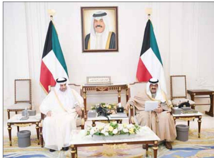
سمو ولي العهد الشيخ مشعل الأحمد لدى تسلمه دعوة الأمير للقمة الخليجية

الجيش بجمهورية باكستان الإسلامية الصديقة الفريق أول ركن سيد عاصم منير ووزير القانون والعدالة