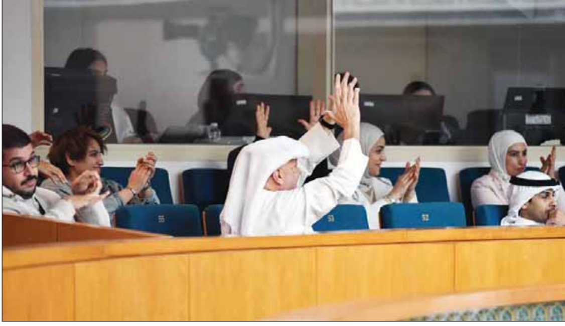
أهاليه ذوي الاحتياجات الخاصة لدم التصويت علم إقرار القانون