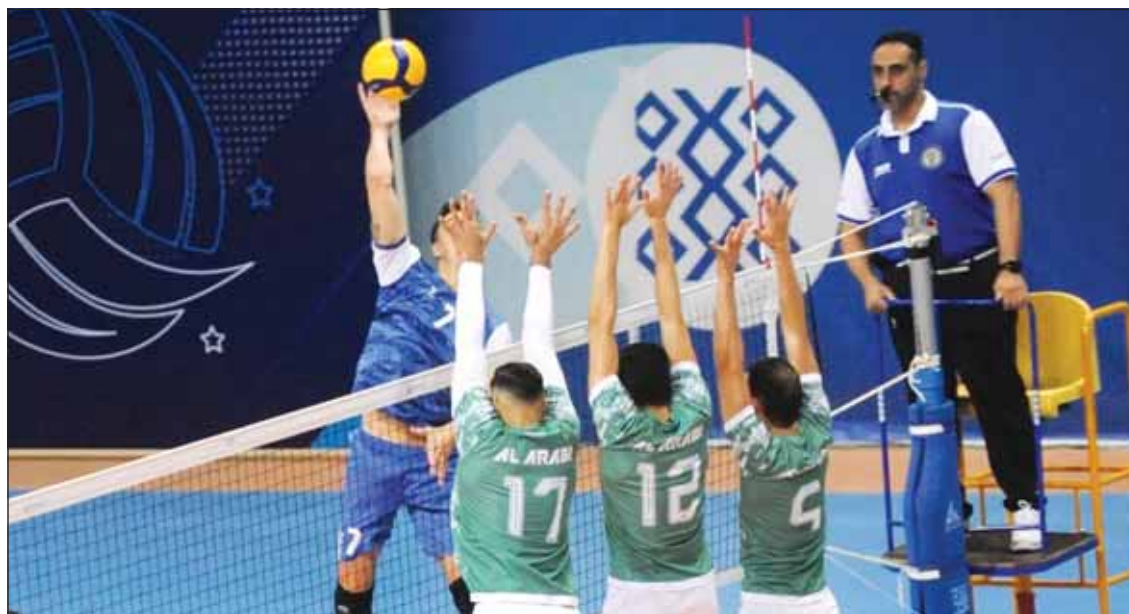
العربي هزم الشباب بسهولة

تمكن فريق الطائرة بالنادي العربي من تحقيق الفوز على خصمه الشباب بثلاثة اشواط للاشياء، جاءت نتائجها كالتالي: "25-22، 25-19، 25-22" في اللقاء الذي جمعهما أول من أمس بختام الجولة الثالثة من الدوري العام لفتحة العمومي، وفي ذات الجولة فاز اليرموك على الساحل بثلاثة اشواط لشوط "18-25".