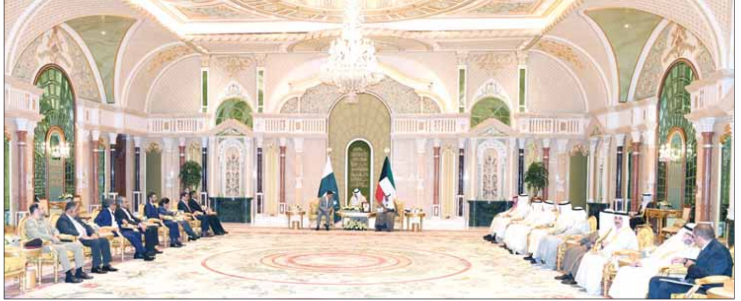
سمو ولي العهد الشيخ مشعل الأحمد ورئيس الوزراء الباكستاني أنور الحق كاكور خلال المباحثات

سموه هنا خادم الحرمين وولي عهده بفوز الرياض باستضافة "إكسبو 2030"