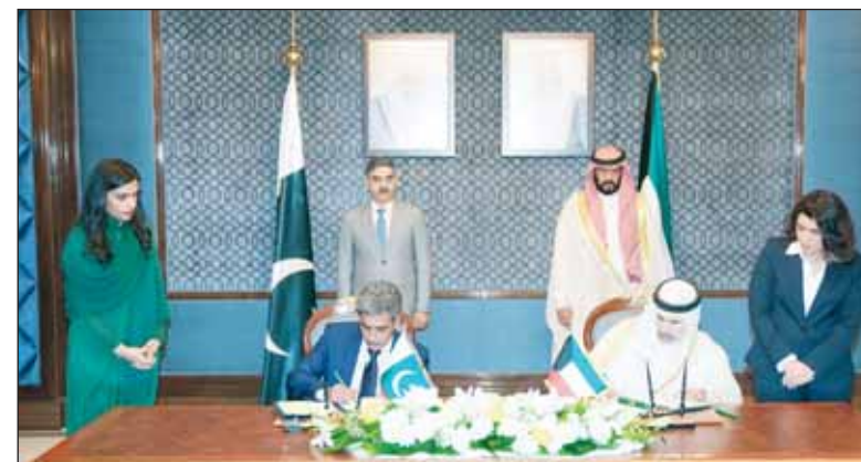
الشيخ طلال الخالد ورئيس وزراء باكستان أنور الحق كاكور يشهدان توقيع الاتفاقات

له. وبرت للضيف مراسم استقبال رسمية قام عقها بمصافحة كبار مستقبليهم وفي مقدمتهم وزير التجارة والصناعة ووزير الدولة لشؤون الشباب محمد العبيان ووزير الكهرياء والماء والطاقة المتجددة ووزير الأشغال العامة والوكالة رئيس بعثة الشرف المرافقة الدكتور جاسم الاستاد ووزير العدل ووزير الدولة لشؤون الإسكان قالح الرقية ووزير المالية فهد الجارالله ونائب وزير الخارجية السفير الشيخ جراح الجابر وسفير دولة الكويت لدى جمهورية باكستان نصار المطيري.