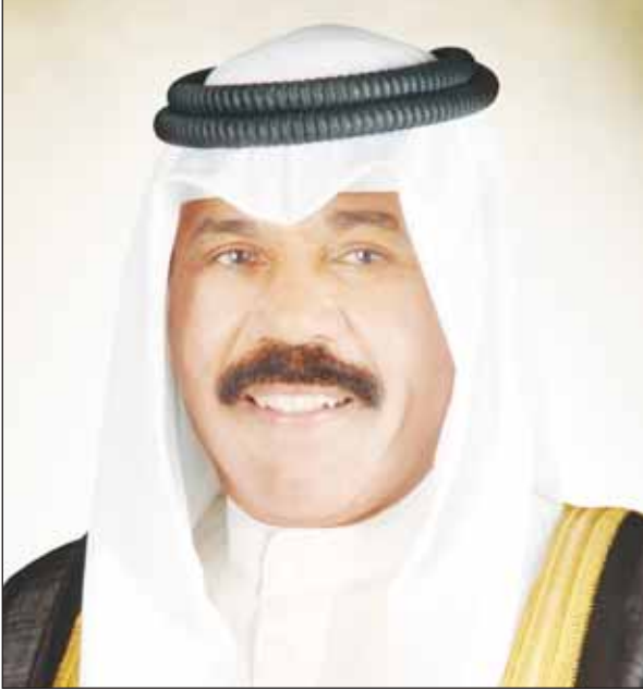
سمو أمير البلاد الشيخ نواف الأحمد

■ سموه دخل المستشفى لتلقي العلاج وإجراء فحوصات طبية إثر وعكة صحية طارئة