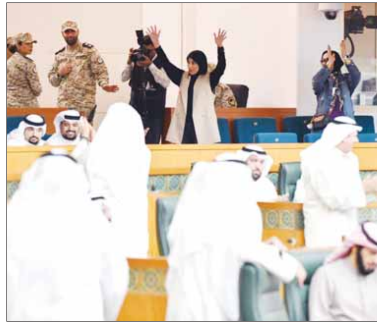
فرحة غامرة بإقرار القانون