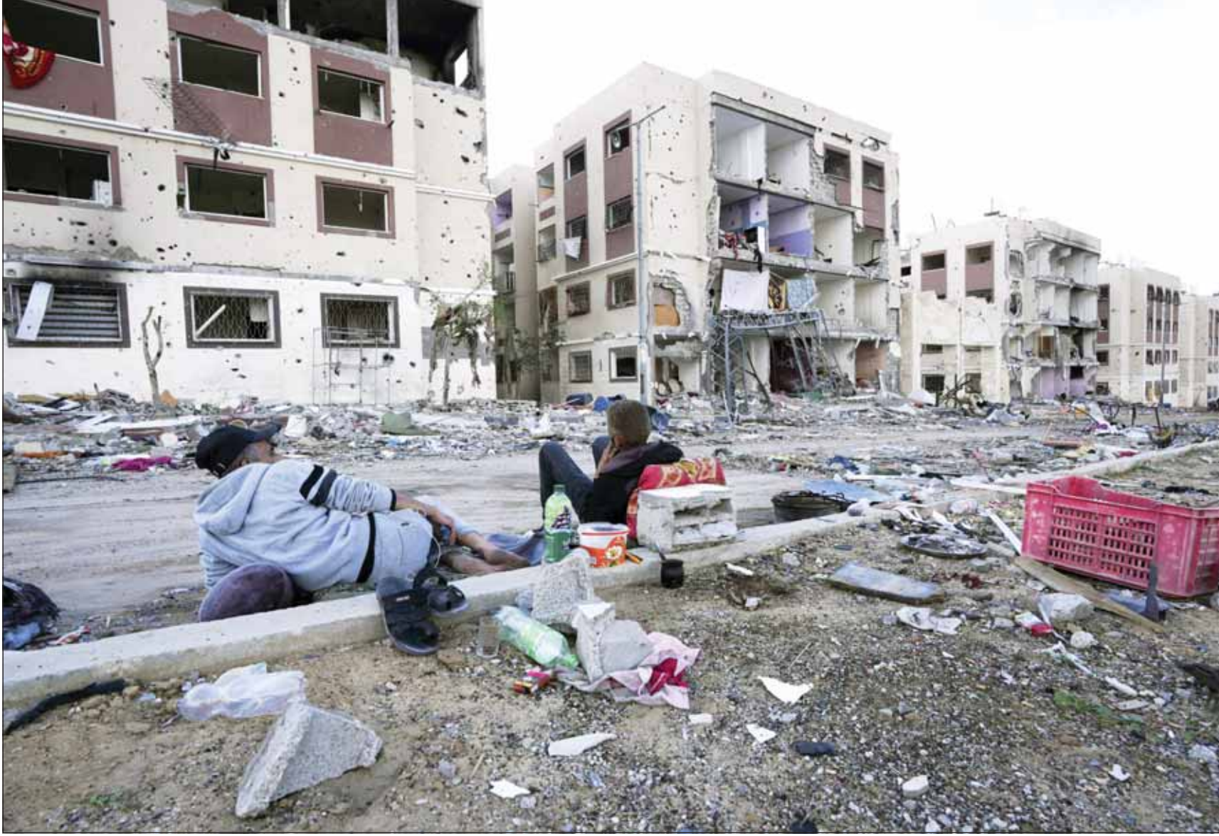
فلسطينيون يتمدون خلال فترة الهدنة علم أبيض منازلهم المدمرة التي سوتها آلة الحرب الإسرائيلية بالأرض

■ غزة، عواصم - وكالات، وسط مؤشرات قوية على النجاح ليل أمس في تمديد الهدنة واختلاف بشأن مدة التمديد يومين أو أربعة أيام، أكد مصدر مطلع أن حركة "حماس" أبلغت الوسطاء بموافقتها على تمديد الهدنة في قطاع غزة والتي من المفترض أن تنتهي في الساعة السابعة من صباح اليوم الخميس، أربعة أيام جديدة، قائلاً إن لدى الحركة ما يمكنها من إطلاق سراح إسرائيلييين محتجزين لديها ولدى الفصائل المسلحة الأخرى وجهات مختلفة خلال هذه الفترة، ضمن الآلية المتبعة وينفخ الشروط.