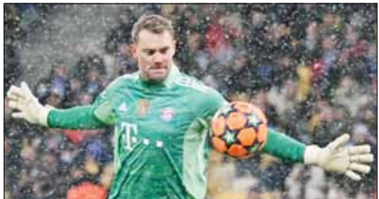
نوير يحدد عقده مع بايرن ميونخ

■ أعلن بايرن ميونخ بطل الدوري الألماني، أن حارس مرماه المخضرم مانويل نوير وقع على عقد جديد يبقيه في النادي حتى عام 2025. وانضم نوير البالغ من العمر "37 عاماً" إلى صفوف الفريق البافاري في عام 2011 قادماً من شالكه قبل أن يتم تعيينه قائداً للفريق بعد ست سنوات.