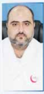
د/ ايهم BDS الأسنان