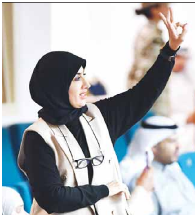
مختصة لفة الإشارة ترث للمعاقين بشراء إقرار القانون