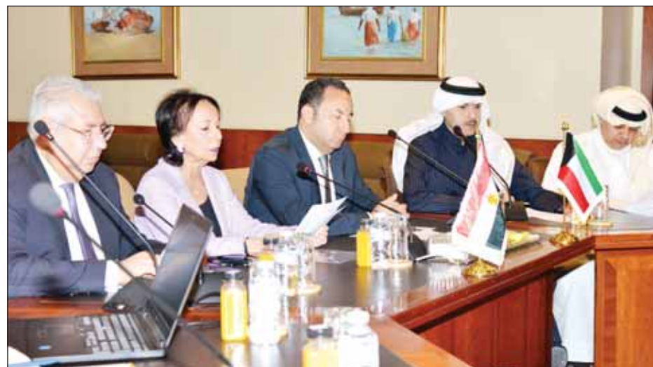
جانب من اللقاء المشترك في الغرفة

وأوضح أن تكنولوجيا المعلومات والاتصالات مرتبطة بتطور المجتمعات في العصر الحاضر وتعد الوسيلة الأكثر أهمية لنقل المجتمعات النامية إلى مجتمعات أكثر تطوراً لافتاً إلى أن التقدم في تكنولوجيا المعلومات بات من أهم المجالات التي شهدت تطوراً هائلاً والتي غيرت