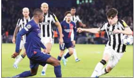
إيقاف حكم فيديو مباراة باريس ونيوكاسل