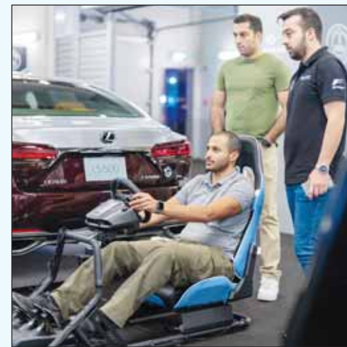
جانب من التجربة