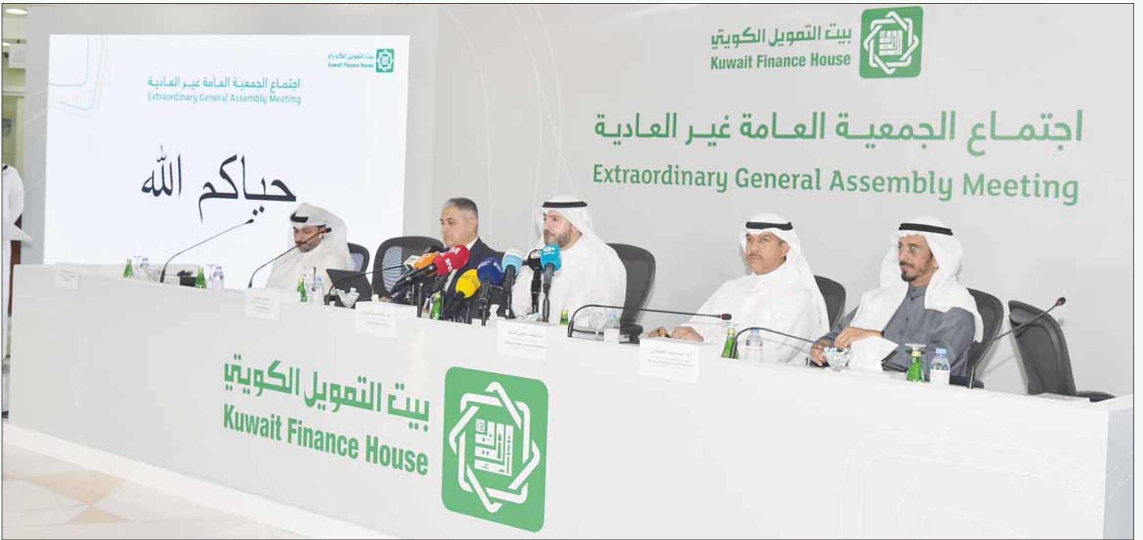
جانب من الجمعية العمومية