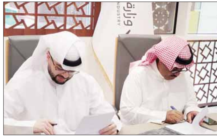
"التجارة" و"الاتصالات" خلال توقيع الاتفاقية

وبينت أن إجراءات الحجب أو رفع الحجب تتم وفق القوانين والقواعد العامة المعنية والمعمول بها في دولة الكويت ووفق القوانين واللوائح التنظيمية الخاصة بوزارة التجارة والصناعة.