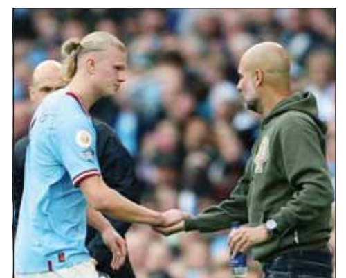
غوارديولا يكيّل المدير لهالاند

■ قال بيب غوارديولا مدرب مانشستر سيتي المدير للاعبه إيرلينغ هالاند بعد ما أضاف رقماً قياسياً آخر لسجلاته الليلة الماضية. وأصبح هالاند البالغ من العمر "23 عاماً" أسرع لاعب يسجل 40 هدفاً في دوري أبطال أوروبا بهدفه في الدقيقة 54 الذي قاد به انتفاضة سيتي للفوز 2-3 على رازن بال شجورت لايبزيغ ليضمن صدارة المجموعة السابعة قبل جولة على نهاية دور المجموعات. وقبل ثلاثة أيام، أصبح هالاند أسرع لاعب يسجل 50 هدفاً في الدوري الإنجليزي الممتاز في التعادل 1-1 مع ليفربول. وقال غوارديولا ما زما حين طلب منه صحفيون التعليق على إنجاز هالاند، مرة أخرى؟ هل يجب أن أفبرك مرة أخرى؟ للمرة المليون أنا منبهر حقاً. حقق هالاند رقماً قياسياً آخر، تهانينا، إنه لاعب رائع. قلته كثيراً السعادة لا تسعنا بما يفعله هالاند. نحن نحبه، ليس فقط للأهداف التي يسجلها، ولكن لأشياء أخرى كثيرة. واستغرق الأمر من هالاند 35 مباراة فقط ليصل إلى 40 هدفاً محطماً رقم رود فان نيستلروي البالغ 45 مباراة. لكن الشيء الأكثر أهمية بالنسبة لغوارديولا هو أن هالاند بدأ بصحة سيئة بعد شوط أول بطيء للغاية تركهم متأخرين بهدفين للمرة الأولى في مباراة بدوري أبطال أوروبا منذ 2018.