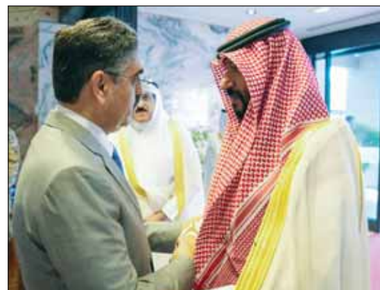
النائب الأول لرئيس الوزراء الشيخ طلال الخالد مستقبلاً رئيس وزراء باكستان