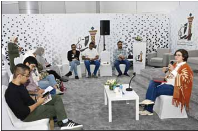
جانب من ورشة العمل

ووضحت أن الترجمة تحتاج إلى قراءة عربية واسعة، ومعرفة السجل اللغوي، والمفردات التي تناسب الأحداث، كما تطرقت إلى جدوى المقدمة للمادة المترجمة، كاشفة عن أن هناك ترجمات لا تحتاج إلى مقدمة، وترجمة أخرى تحتاج إلى مقدمة لتوضيح ما تتضمنه من أمور قد تكون صادمة للقارئ، وبالتالي تأتي المقدمة للتوضيح. وتحدثت أسعد عن تجربتها مع الترجمة، وما استفادته من خبرات خلال تلك الترجمة، وما قرأته في سبيل تقوية ملكة الترجمة لديها. ونصحت أن يتجه المترجم في البداية إلى القصة القصيرة مثل كعبها نجيب محفوظ لأن لديه حصيلة لغوية كبيرة، أو الشعر، والابتعاد عن الرواية، حيث إن الرواية تضم أحداثاً متشعبة، قد يتوه