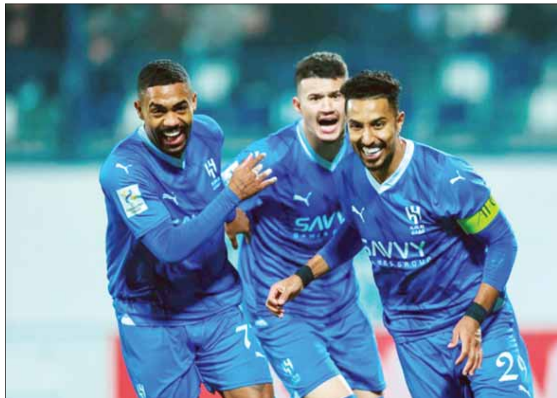
فرقة لاعبي الهلال بالفوز وتأهل إلى ثمن نهائي أبطال آسيا

خمس دقائق من النهاية. وفي مباراة أخرى، فاز الفيفا 1-3 على ضيفه أهال من تركمانستان، ليحقق انتصاره الثاني في دور المجموعات. ورفع فريق المدرب فوك رازوفيتش رصيده للنقطة السادسة في المركز الثالث بالمجموعة الأولى بفارق ست نقاط عن العين المتصدر والذي ضمن تأمله سابقاً للدور الثاني رغم الخسارة اليوم 1-3 أمام باختاكور صاحب المركز الثاني بسبع نقاط بينما يتذلل أهال الترتيب بثلاث نقاط. وسيضمن متصدرو المجموعات العشر فقط من جميع أنحاء آسيا العبور إلى دور الستة عشر وسيضم إليهم أفضل ثلاثة فرق من أصحاب المركز الثاني من التصنيف الغربي والشرقي من القارة على الترتيب. ويختتم الفيفا مباريات المجموعة خارج ملعبه أمام باختاكور، بينما يستقبل أهال نظيره العين.