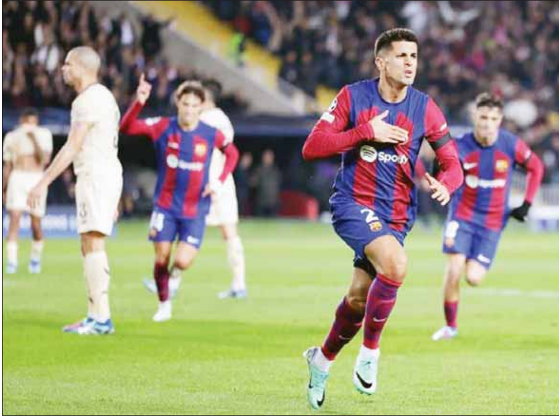
برشلونة هزم بورتو وتأهل للمرة الأولى منذ ثمن النهائي تحت قيادة تشافي

میلان. وستقام الجولة الاخيرة لهذه المجموعة يوم 13 ديسمبر المقبل، حيث يلقي نيوكاسل مع ميلان، وبروسيا دورتموند مع باريس سان جيرمان. وتاهل أيضاً اتلتيكو مدريد بعد فوزه 1-3 خارج أرضه على فينورد في روتردام. وظل أتلتيكو في صدارة المجموعة الخامسة برصيد 11 نقطة بعد فوزه خارج أرضه في المباراة للمرة الأولى منذ انتصاره على مانشستر يونايتد في أولد ترافورد في مارس 2022. كما ضمن هذا الفوز مكاناً في دور الستة عشر لنادي لاتسيو الذي رفع رصيده لعشر نقاط بعد فوزه على سيلتيك في روما بينما خرج فينورد من السباق. وفي مباراة أخرى، قلب مانشستر سيتي تأخره بهدفين أمام ضيفه لايبزيغ الألماني إلى فوز مثجير 3-2، من مباريات المجموعة السابعة. وفي المباراة الأخرى بالمجموعة ذاتها فاز يانغ بويز السويسري على ضيفه سرفينا زفييزا الصربي 2- صفر.