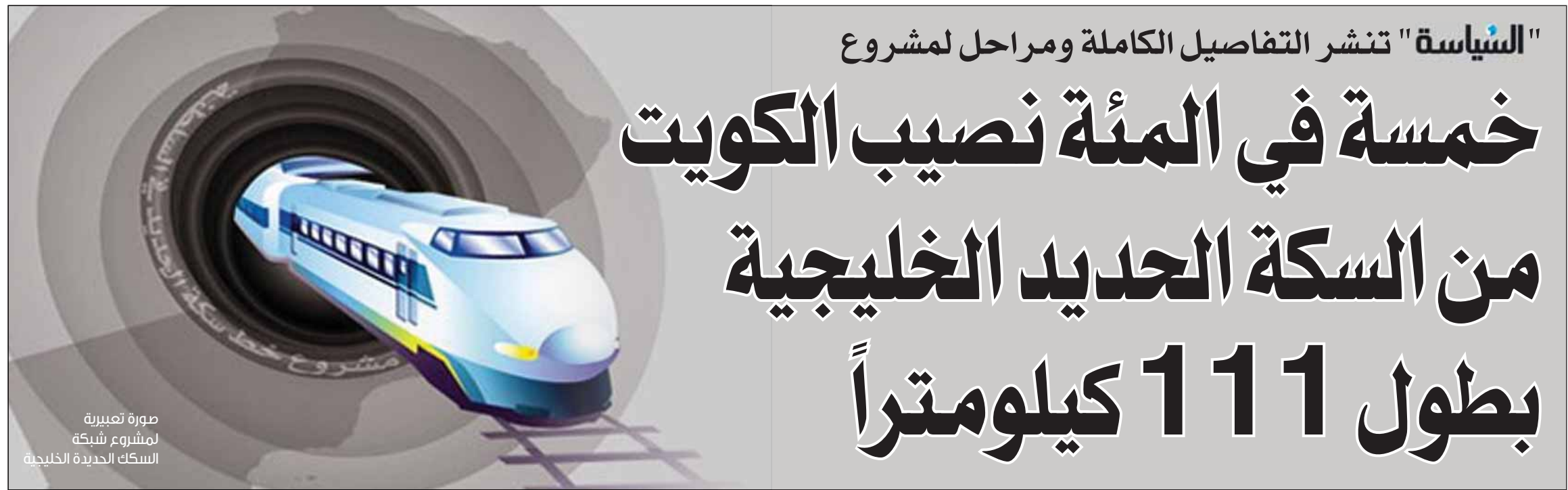
صورة تعبيرية لمشروع شبكة السكك الحديدية الخليجية

"السياسة" تنشر التفاصيل الكاملة ومراحل لمشروع