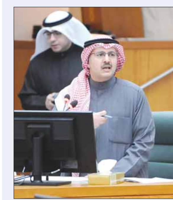
وزير الشؤون الشيخ فراس المالك