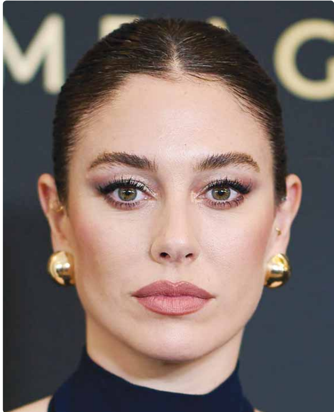
الممثلة الإسبانية بلانكا سواريز خلال مشاركتها بحفل كوكتيل عيد الميلاد في مدريد

نسأل الله أن يحفظ الكويت وشعبها بقيادة صاحب السمو الأمير وسمو ولي عهده حفظهما الله. اللهم ارحم شهداءنا الأبرار.