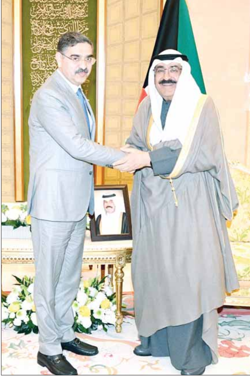
سمو ولي العهد الشيخ مشعل الأحمد مستقبلاً رئيس وزراء باكستان أنور الحق كاكور

Thursday 30th November 2023 (54th Year) issue No (19422)