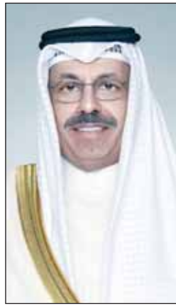
سمو الشيخ أحمد النواف

بعث سمو رئيس مجلس الوزراء الشيخ أحمد النواف ببرقية تهنئة إلى خادم الحرمين الشريفين الملك سلمان بن عبدالعزيز آل سعود ملك المملكة العربية السعودية الشقيقة ضمنها سموه خالص تهنائه بمناسبة إعلان المكتب الدولي للمعارض عن استضافة العاصمة السعودية المعرض الدولي إكسبو 2030.