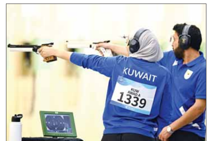
رماة منتخبنا الوطني للمسدس