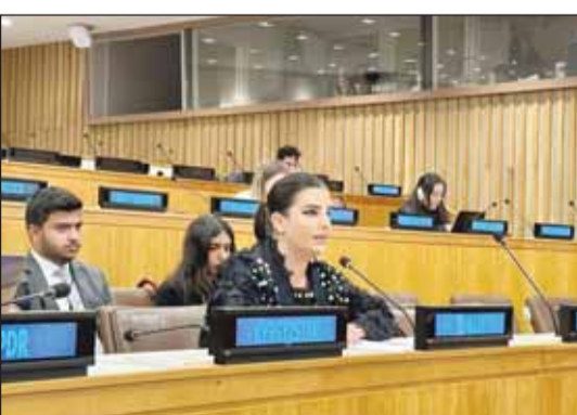
وفيقة الملا تلقي كلمة الكويت

وجددت الملا التزام دولة الكويت الكامل ببنود الاتفاقية الدولية لحقوق الأشخاص ذوي الإعاقة ومواصلة الجهود لدعمهم الشامل في المجتمع ضمن إطار رؤية الكويت المستقبلية للتنمية التي تنسجم مع أهداف التنمية المستدامة الأممية. وأشارت إلى أن الكويت وضعت "سياسة