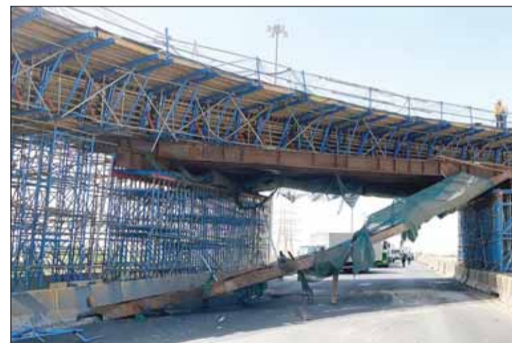
شدة الجسر المعدنية بعد سقوطها

وقالت إن الفرقة تبينت عند وصولها أن الحادث وقع نتيجة ارتطام الشاحنة بالجسر قيد الإنشاء، ما أدى لسقوط أحد الأعمدة الحديدية على مركبة، قوامت بالتعامل مع الحادث وتأمين المكان وتسليمه إلى الجهات المعنية. بدورها، أكدت الهيئة العامة للطرق والنقل الجوي في بيان أن مركبة "يوم تراك" تحمل طابوقاً بارتفاع أعلى من المصرح به، مما علق "يوم" رافعة السيارة بأحد عوارض الشدة المعدنية الموقفة للجسر