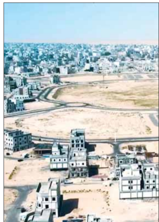
مدينة المطالع بلا محطات صرف

رئيس مجلس الوزراء والى وزير الأشغال باستعمال عمل محطة معالجة مياه موقفة وترسية المناقصة ومتابعة المقاول المنفذ حيث أن مدة تنفيذ المحطة لا يقل عن سنتين. وأشار إلى أن المواطنين تسلموا أراضيهم على المخطط "الورق" الرئيسي. واعتبر الدوسري أن المشكلة الكبرى في عدم وجود محطة معالجة مياه حتى ولو موقفة في مدينة المطالع محذراً من ظهور روائح كريهة بسبب ارتفاع منسوب مياه الصرف هناك. وتابع نوجه رسالتنا إلى سمو