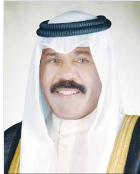
سمو أمير البلاد الشيخ نواف الأحمد

بعث سمو أمير البلاد الشيخ نواف الأحمد، ببرقية تعزية إلى رئيس جمهورية باكستان الدكتور عارف علوي، أعرب فيها سموه عن خالص تعازيه وصادق مواساته بضحايا الهجومين الإرهابيين، اللذين استهدفا موكبا دينيا قرب مسجد بإقليم بلوشستان جنوب غربي باكستان، ومسجدا في إقليم خيبر بختونخوا شمالي باكستان، وأسفرا عن سقوط الكثير من الضحايا والمصابين. وأكد سموه استنكار دولة الكويت وإدانته الشديدة لهذين العمليين الإرهابيين الشنيعين اللذين استهدفا أرواح الأبرياء الأمنيين ويتنافيان مع كافة الشرائع والقيم الإنسانية، سائلا سموه الباري، جل وعلا، أن يتقدم الضحايا بواسع رحمته ومغفرته ويمن على المصابين بسرعة الشفاء والعافية. من جهة أخرى، بعث سمو أمير البلاد الشيخ نواف الأحمد ببرقية تهنئة إلى الرئيس مكفوتيسي أريك ماسيسي رئيس جمهورية بوتسوانا، عبر فيها سموه عن خالص تهانيه بمناسبة العيد الوطني لبلاده، متمنيا سموه له موفقور الصحة والعافية ولجمهورية بوتسوانا وشعبها الصديق كل التقدم والازدهار.