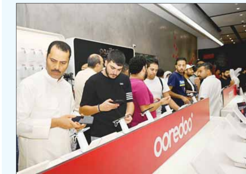
خلال حفل إطلاق هاتف iPhone 15 الجديد

هذا الحدث لم يكن مجرد إطلاق منتج تقليدي، بل قدم تجربة فريدة تجمع بين عشاق التكنولوجيا، والطعام والموسيقى. ويفضل مزيجه المثالي الذي يضم أحدث التقنيات، الألعاب الإلكترونية المثيرة، المأكولات الشهية والعروض الموسيقية المباشرة، استقطب الحدث حشداً ضخماً، مؤكداً مكانته كواحد من أهم الفعاليات في الكويت هذا العام.