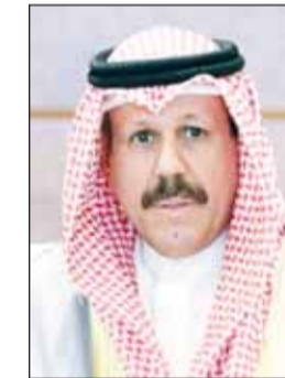
الشيخ فيصل النواف

للوطن العزيز. كما دعا المولى، عز وجل، أن يديم نعمتي الأمن والاستقرار والرفاء على وطننا الغالي والشعب الكويتي الوفي، في ظل القيادة الحكيمة لسموه، بموازرة أخيه سمو ولي العهد الأمين. وأكد أن منتسبي الحرس الوطني يُجندون لسموه العهد والولاء والوفاء على مواصلة العمل والبدل والعطاء، لخدمة الوطن المعطاء، والدفاع عنه، وحفظ أمنه واستقراره، وبذل الغالي والنفيس من أجل الدفاع عنه.