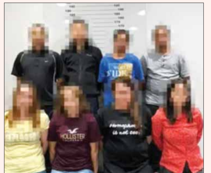
المتهمون بعد ضبطهم

ضمن جهود قطاع الأمن الجنائي في ضبط المذللين والخارجين عن القانون، تمكنت الإدارة العامة للمباحث الجنائية من ضبط ثمانية أشخاص بتهمة ادارة مسكن خاص كمطعم غير مرخص في منطقة المنقف، يقدم لرواده المشروبات الكحولية، المستوردة والمصنعة محلياً، ولحم الخنزير. فقد توصلت إدارة البحث الجنائي والرخص من خلال النشاط اليومي، وتكثيف عمليات البحث والتحرى عن إقدام أشخاص عدة بإدارة مسكن خاص، يعمل كمطعم غير