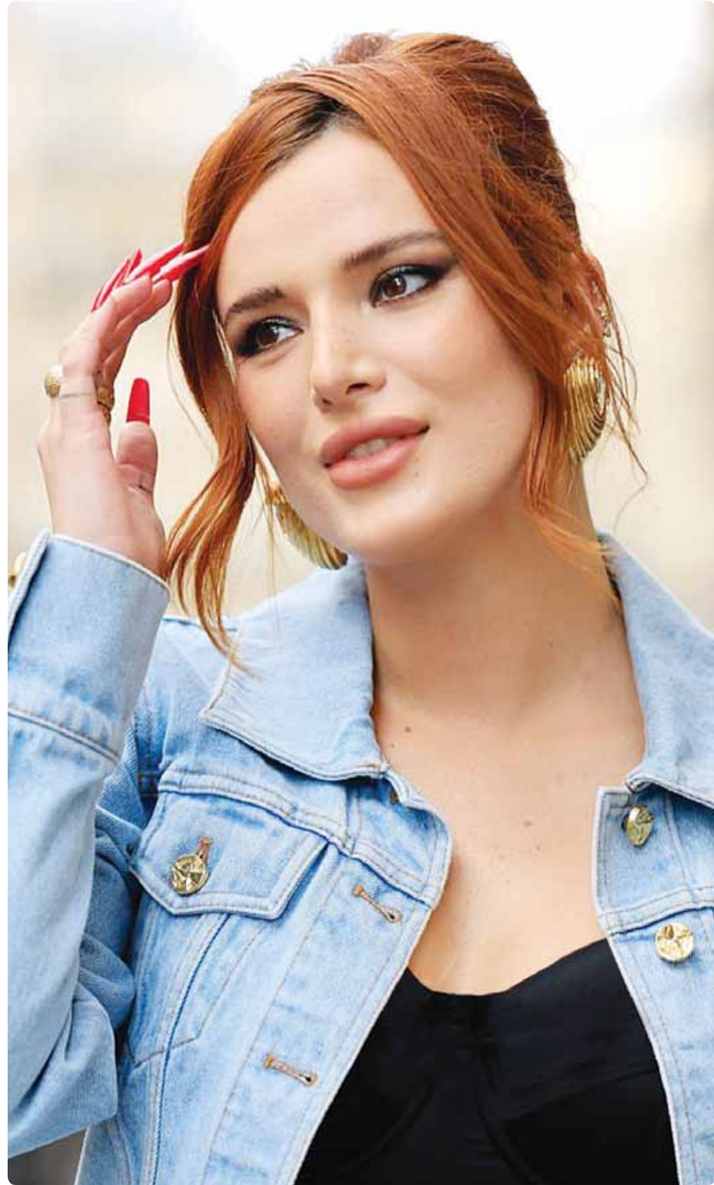
الممثلة الأميركية بيلا ثورن خلال حضورها أسبوع باريس للموضة