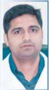
د/ شاجامان BDS, MDS الأسنان