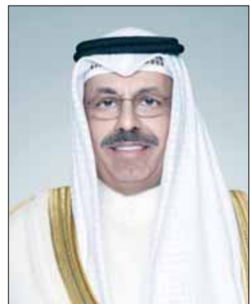
سمو الشيخ أحمد النواف