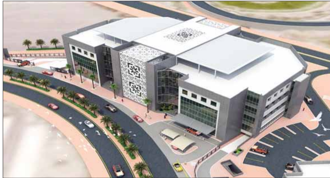
تصميم توسعة مبنى المعلومات المدنية

وقالت، بالنسبة لدراسة وتصميم والإشراف على مشروع مبنى الإدارة العامة للتحقيقات، فإنه جار تجديد الترخيص لإمكانية الطرح للتنفيذ، وطلبت وزارة الداخلية إعطاء المشروع الأولوية الثانية بعد المؤسسات الإصلاحية كذلك بشأن دراسة وتصميم والإشراف على مشروع مبنى الإدارة العامة لتنظيم المعلومات، فقد قامت وزارة الداخلية بتغيير موقع المشروع بعد الانتهاء من التصميم، وجر إصدار الأمر التغييري للمكتب المصمم بعد موافقة وزارة المالية مؤجراً عليه وسيتم الطرح في السنة المالية المقبلة.