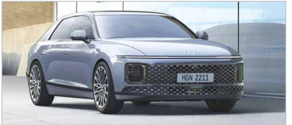
تصميم جذاب للسيارة أزيرا