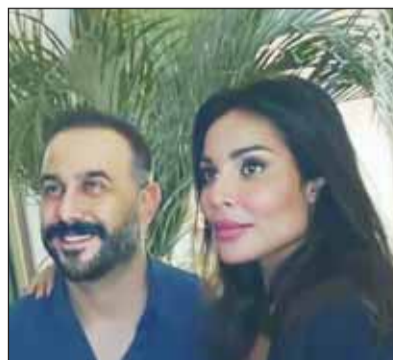
قصي خولي ونادين نجيم

للعديد من المشاهد، معترفاً بأنه كانت هناك أخطاء حدثت في اختصار وحذف المشاهد ينبغي أن يتحملها الجميع، وليس الشركة المنتجة بمفردها، على حد قوله، لكنه أكد أن المسلسل ظل متصمراً "الترند" طيلة فترة عرضه خلال رمضان، على الرغم من ذلك.