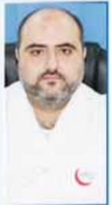
د/ إيهم BDS الأسنان