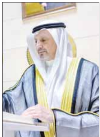
العبدالله يديون كلمة في سجل البعثة

أكد وزير الخارجية الشيخ سالم العبدالله التزام دولة الكويت بدعم المبادئ والأهداف المنصوص عليها في ميثاق الأمم المتحدة وتحديدًا تعزيز التعاون الدولي لضمان السلام والأمن والرفاه العالميين.