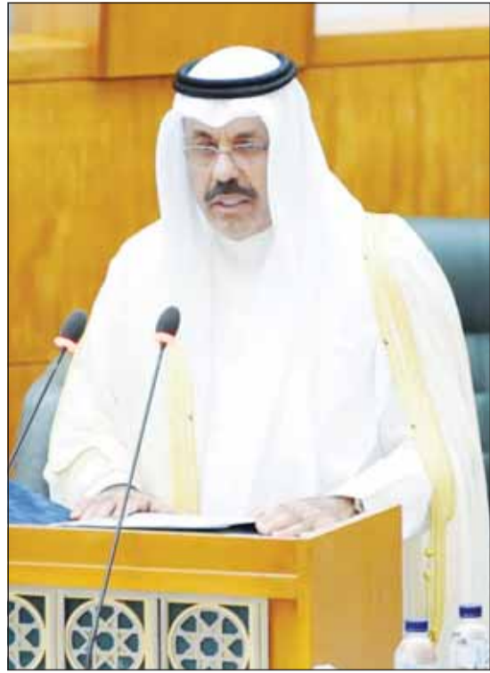
سمو الشيخ أحمد النواف يلقيه الخطاب الأميري

وفرننا 15,690 وظيفة للشباب الكويتي خلال الفترة من يناير إلى أكتوبر 2023 في الجهات الحكومية نقف أمام واقع جديد لم يشهده التاريخ المعاصر يتسم بالتغيرات ومحفوف بالمخاطر ومليء بالفرص المواطنون يتطلعون إلى مزيد من الإنجازات التنموية التي تلبى تطلعاتهم وتنسجم وطموحاتهم اجتماعات تنسيقية للتوافق على خارطة تشريعية تسهم بتحقيق محاور برنامج عمل الحكومة زيارة سمو ولي العهد إلى الصين استهدفت تعزيز العلاقات الثنائية وفتح آفاق جديدة للتعاون الوثيق