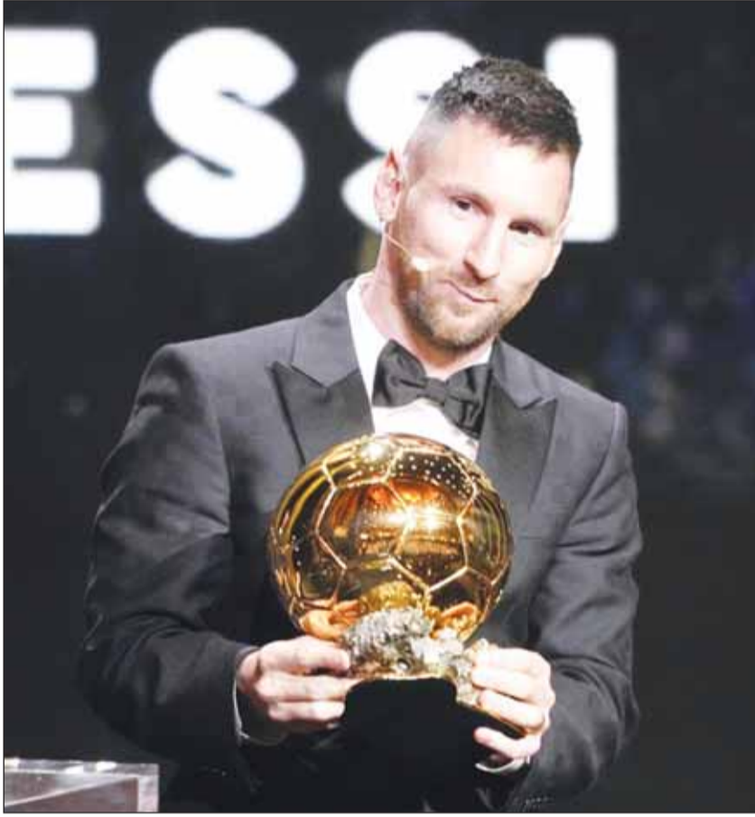
ميسي والكرة الثامنة لأفضل اللاعبين

حقق النجم الأرجنتيني ليونيل ميسي أول من أمس، إنجازاً جديداً بنيله جائزة الكرة الذهبية (بالون دور) لهذا العام ليعزز الرقم القياسي بالفوز فيها حيث حصل عليها للمرة الثامنة في مسيرته المأهولة.