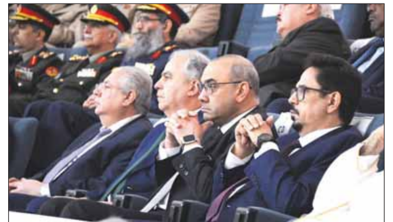
السكرتير العراقي بين الحضور الديبلوماسي