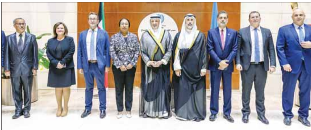
وزير الخارجية الشيخ سالم العبدالله والشيخ جراح الجابر مع مسؤولي بعثة الأمم المتحدة لدى البلاد

وأكد البحر ان جهود الصندوق الكويتي بالشراكة مع هيئات الأمم المتحدة تأتي ضمن إطار دعم العمل الإنساني الإقليمي والدولي في تعزيز قدرة البلدان على التنمية ما نتج عنه بالغ الأثر العميق في قطاعات التعليم والصحة والزراعة والري والنقل والاتصالات والطاقة والصناعة والمياه والصرف الصحي في الدول النامية، إضافة إلى دعم اللاجئين ومنحهم فرصة الحصول على حياة كريمة.