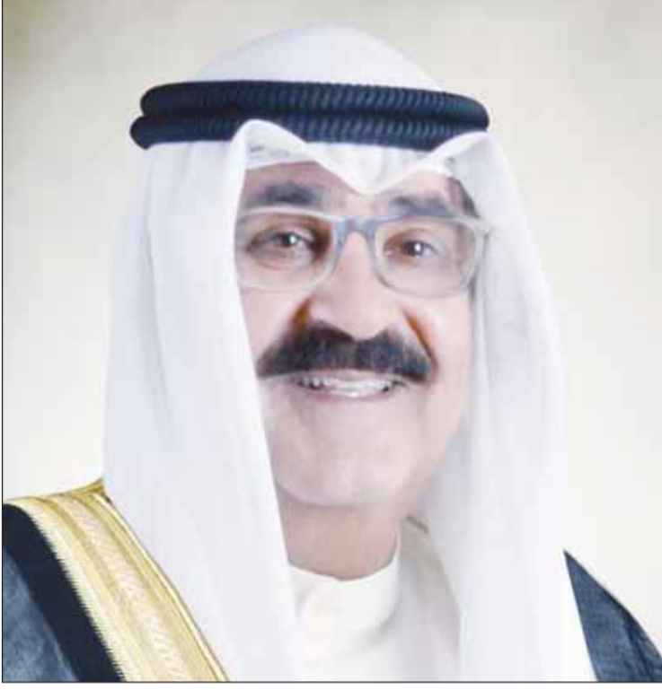
سمو ولي العهد الشيخ مشعل الأحمد

■ بعث سمو ولي العهد الشيخ مشعل الأحمد ببرقية تهنئة إلى أمين سر مجلس الأمة أسامة الشاهين، عبر فيها سموه عن خالص تهنائه بمناسبة تزكيته أمين سر مجلس الأمة، متمنياً سموه له كل التوفيق والسداد. كما بعث سموه ببرقية تهنئة إلى مراقب مجلس الأمة د.فلاح الهاجري، ضمنها سموه خالص تهنائه بمناسبة تزكيته مراقباً لمجلس الأمة، متمنياً سموه له كل التوفيق والسداد. وبعث سمو ولي العهد ببرقيات تهنئة إلى أعضاء مجلس الأمة الذين فازوا بعضوية لجان مجلس الأمة، متمنياً سموه للجميع كل التوفيق والسداد في خدمة الوطن العزيز.