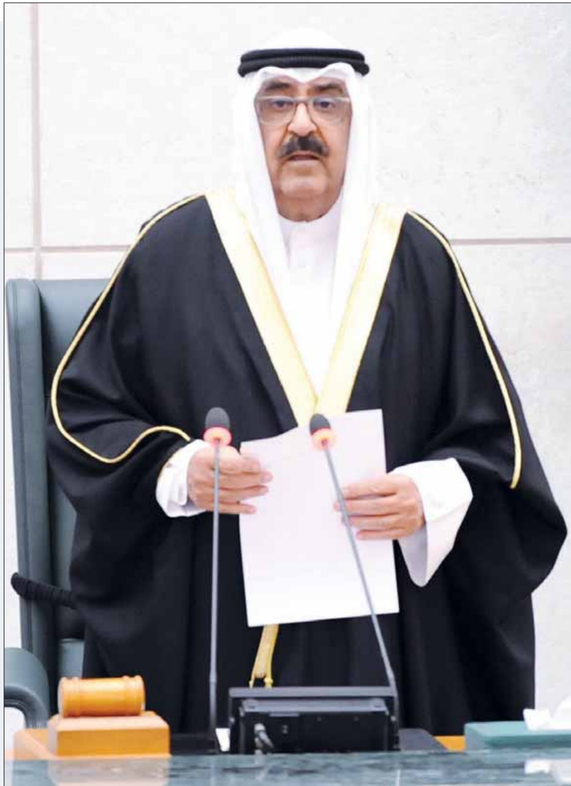
ممثل سمو الأمير سمو ولي العهد الشيخ مشعل الأحمد يتلو النطق السامي إيداً بافتتاح دور الانعقاد الثاني للمجلس

□ سيروا على بركة الله ونحن دائماً معكم وعلى الوعد والعهد الذي قطعنا على أنفسنا باقون