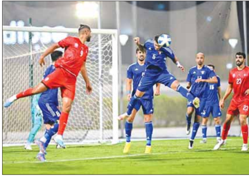
الأزرق يستعد لملاقاة الهند وأفغانستان

وأوضحت "رغم أن الانتهاكات المالية التي حصلت تحت المالكين السابقين، إلا أن تشيلسي يواجه عقوبات تتمثل في فرض غرامات ضخمة وفحص بعض النقاط، حيث انتقلت ملكية النادي إلى رجل الأعمال الأمريكي تود بويلي، مقابل 2,5 مليار جنيه إسترليني".