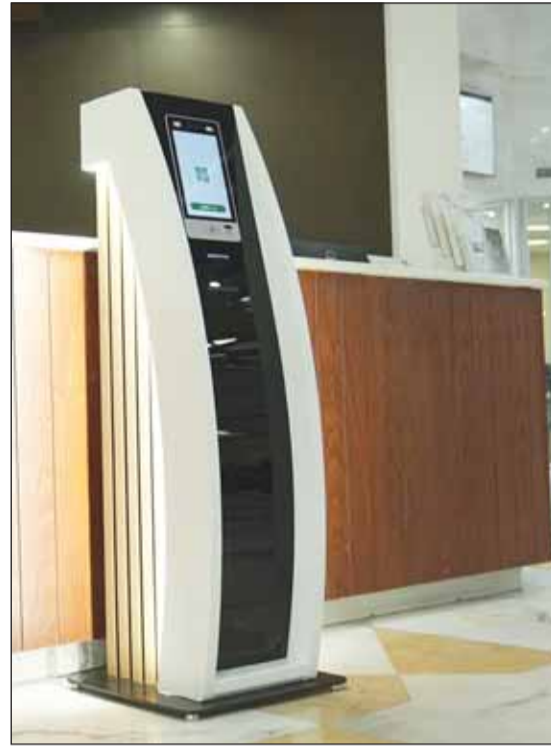
جهاز التعرف على السمات البيومترية للوجه

وفريدة تساهم في تحسين كفاءة العمليات والأداء. ولفت الرشود إلى أن العمل يمضي قدماً نحو توسيع نطاق المنتجات والخدمات المصرفية الرقمية وتعزيزها لتشمل كافة جوانب العمل لجعل "الرقمنة" أسلوب أداء والطابع المميز والرئيسي لكافة الأنشطة والأعمال في "بيتك"، بما يحافظ على مكانته الرائدة محلياً وعالمياً، منوهاً بأن أبرز محطات الريادة الرقمية لـ "بيتك" كان قبل أيام قليلة عندما أطلق بنك "تم" الرقمي، وهو أول بنك رقمي متوافق مع أحكام الشريعة الإسلامية في الكويت، حيث يمتلك هذا البنك الرقمي تصميم شبابي عصري، وخدمات وطول مصرفية مبتكرة، وقدرة تكنولوجية عالية، وبذات الوقت سرعة وسهولة استخدام مطلقاً، ونقاط ومكافآت استثنائية، ويدمج الخدمات المصرفية المبتكرة مع تجربة التواصل الاجتماعي والاهتمامات الشبابية.