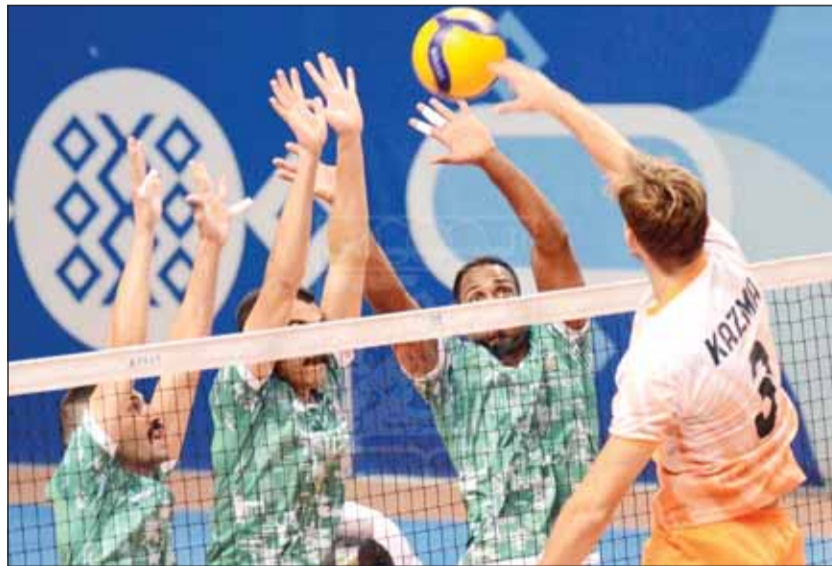
البرقالي عبر الأخضر