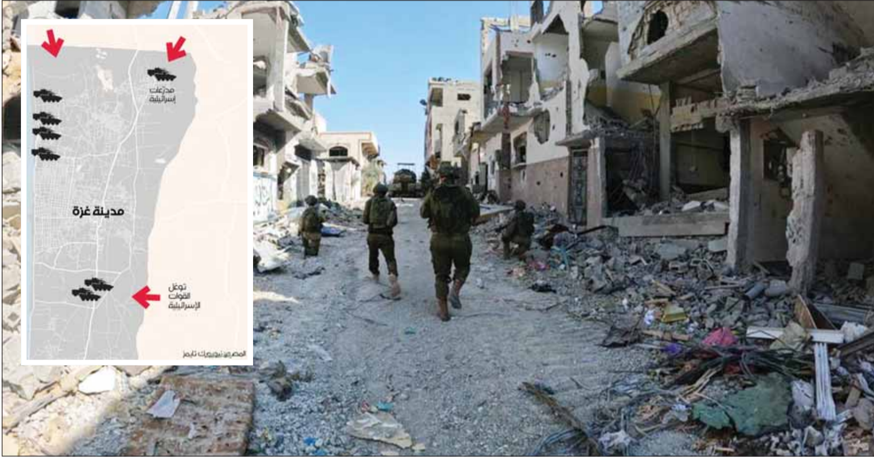
قوات عسكرية إسرائيلية تتوغل في مناطق مهجورة بقطاع غزة وفيه الأضرار خفيفة توضح مناطق توغل قوات جيش الاحتلال مع إعلان تل أبيب انطلاق الهجوم البري على القطاع رسمياً

غزة، عواصم - وكالات، وسط معارك ضارية شهدتها القطاع أمس، أعلنت إسرائيل صدور أمر الهجوم للقوات البرية، حيث أصدر قائد المنطقة الجنوبية للقوات البرية الإسرائيلية العاملة في القطاع أمراً بشن "هجوم على حماس والمنظمات الإرهابية"، وفق بيان للمتحدث باسم جيش الاحتلال أفيخاي أدري، الذي قال على منصة "أكس". "تحقيق الانتصار مهما طال القتال، وبغض النظر عن مدى صعوبته... سنحارب في الأزقة، وسنحارب في الأنفاق، وسنحارب أينما يلزم".