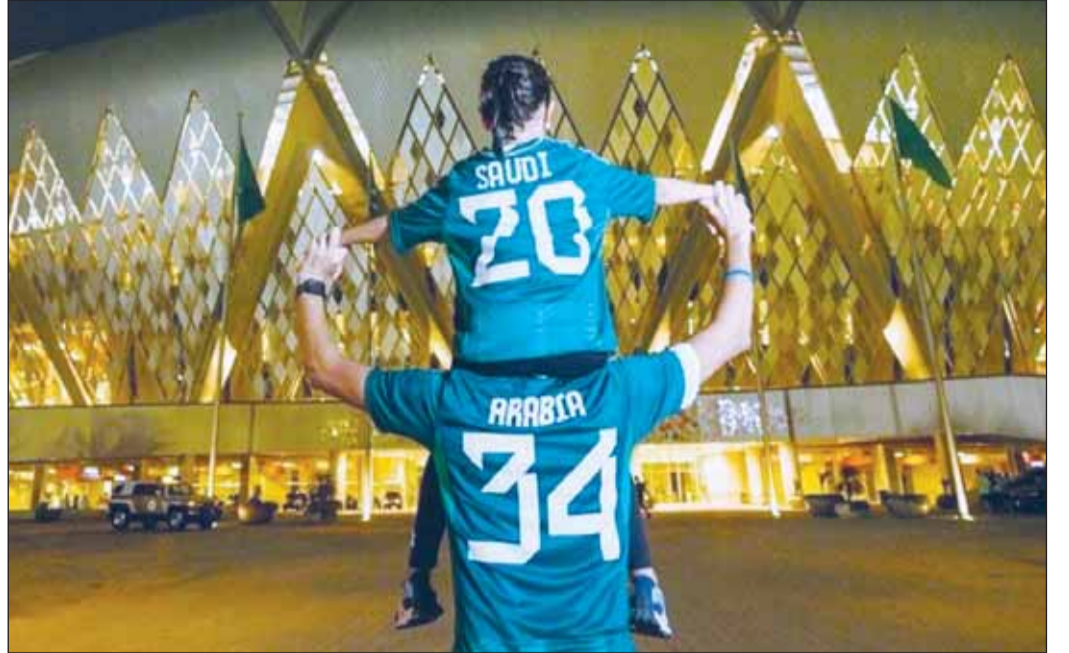
السعودية المرشح الوحيد لاستضافة مونديال 2034

مشارك محتمل مع الميزيا وسنغافورة قبل إعلانها بعد ذلك بأسبوع دعمها للعرض السعودي. واستضافت أستراليا بطولة ناجحة لكأس العالم للسيدات هذا العام لكنها لم يسبق لها استضافة كأس العالم للرجال. وقال الاتحاد الأسترالي في بيان "نتق في أننا في موقف قوي لاستضافة أقدم بطولة دولية للسيدات في العالم- كأس آسيا للسيدات عام 2026- وبعدها سنرحب بالأندية الأعظم في عالم كرة القدم في كأس العالم للأندية عام 2029. "تحقيق هذا.. سيمثل عقداً ذهبياً حقاً لكرة القدم في البلاد وللاتحاد الأسترالي للعبة".