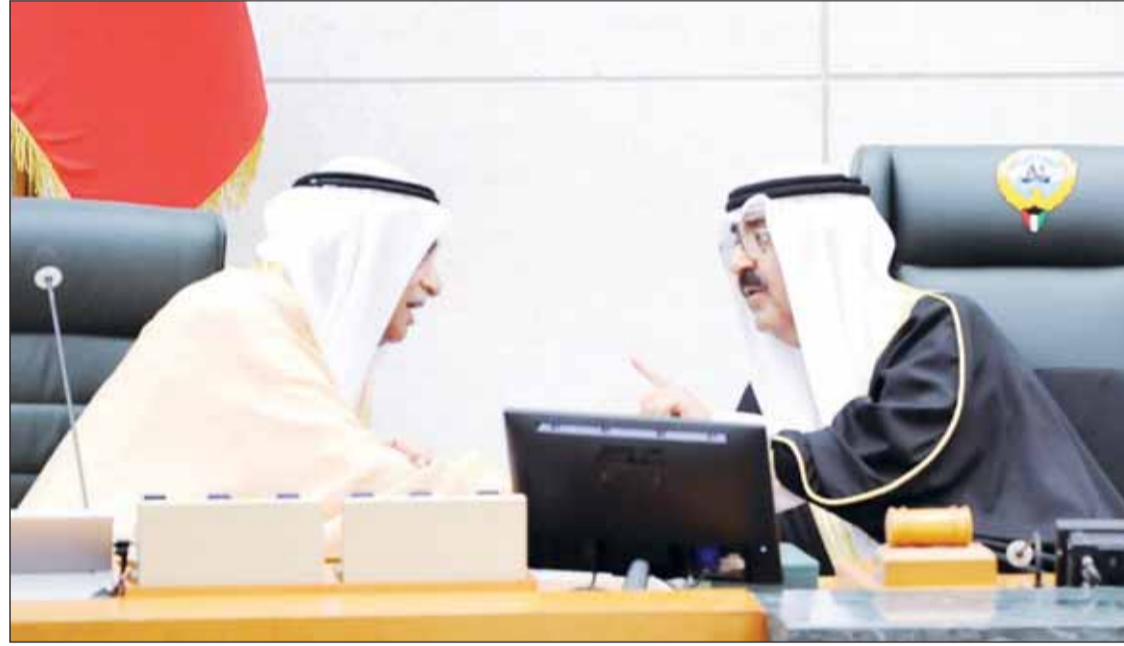
حوار بين ممثل سمو الأمير سمو ولي العهد ورئيس المجلس أحمد السعدون

العراقية، وكذلك الجهد المبذول من لجنة الشؤون الخارجية في مجلس الأمة والتعاون المتواصل مع إخوانهم في وزارة الخارجية، في العمل على تحقيق مصالح الوطن دون كلل.