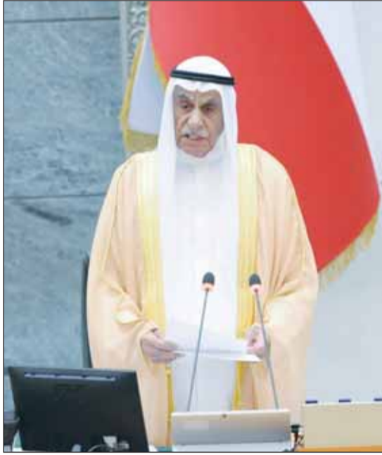
الرئيس السعدون يلقي كلمته