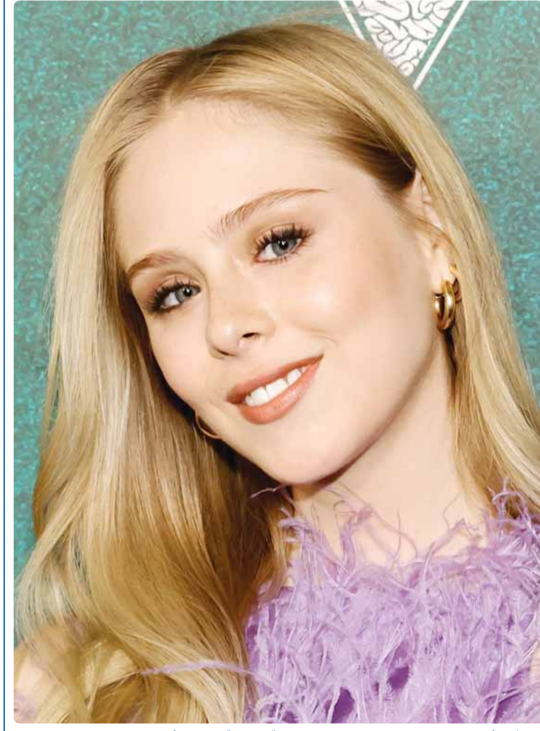
الممثلة الأميركية لوريتو بيرالتا خلال حضورها عرض فيلم "Radical" في لوس أنجلوس

نسأل الله أن يحفظ الكويت وشعبها بقيادة صاحب السمو الأمير وسمو ولي عهده، حفظهما الله ورعاهما. اللهم ارحم شهداءنا الأبرار.