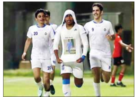
الشلال يفجر أزمة بين الجهراء والقادسية

وكان اتحاد الكرة، قد أعلن عن رزنامة المنتخب لشهر نوفمبر الجاري على حسابه الرسمي والتي تشمل مواجهتي الهند وأفغانستان.