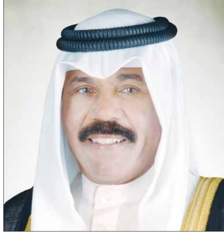
سمو أمير البلاد الشيخ نواف الأحمد

■ بعث سمو أمير البلاد الشيخ نواف الأحمد ببرقية تهنئة إلى أمين سر مجلس الأمة أسامة الشاهين، عبر فيها سموه عن خالص التهنائي بمناسبة تزكيته أمين سر مجلس الأمة، متمنياً سموه له كل التوفيق والسداد وللإسهام في خدمة الوطن العزيز ورفعته. كما بعث سموه ببرقية تهنئة إلى مراقب مجلس الأمة د.فلاح الهاجري، عبر فيها سموه عن خالص التهنائي بمناسبة تزكيته مراقباً لمجلس الأمة، متمنياً سموه له كل التوفيق والسداد للإسهام في خدمة الوطن العزيز ورفعته. وبعث سمو أمير ببرقيات تهنئة إلى أعضاء مجلس الأمة الذين فازوا بعضوية لجان مجلس الأمة، متمنياً سموه للجميع كل التوفيق والسداد للإسهام في خدمة الوطن العزيز ورفعته شأنه.