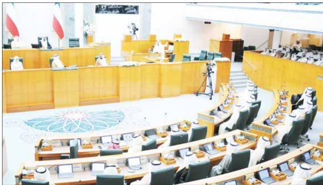
جانب من الجلسة وبيده النواف خلال إلقاء الخطاب الأميري

وبعث سمو الشيخ أحمد النواف ببرقيات تهنأته إلى أعضاء مجلس الأمة الذين فازوا بعضوية لجان مجلس الأمة، متمنيا سموه للجميع كل التوفيق والسداد.