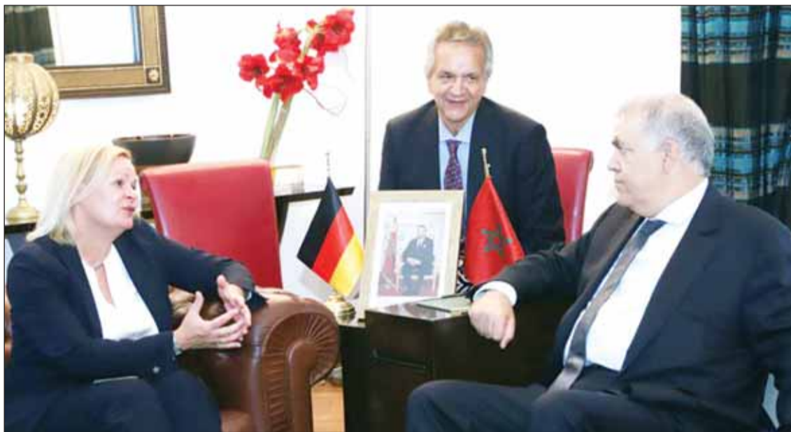
وزير الداخلية المغربي عبد الوافي لفتيت ووزيرة الداخلية الألمانية نانسجي فيزر خلال توقيع إعلان النوايا المشتركة في الرباط

المغرب إلى تعزيز التعاون بين برلين والرباط في القضايا الأمنية وكذلك في مجال الهجرة والترحيلات، ووقعت فيزر ونظيرها المغربي عبد الوافي لفتيت في العاصمة المغربية الرباط إعلان نوايا بهذا الخصوص.