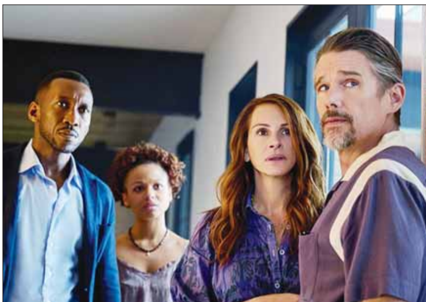
مشهد من فيلم "أترك العالم خلفك"

شركة Higher Ground Productions، التابعة لعائلة الرئيس الأمريكي الأسبق باراك أوباما، بعدما ركزت الشركة على برامج الأطفال، والأفلام الوثائقية. وكان أوباما، قد وضع رواية رمان علم، ضمن قائمة القراءة الصيفية لعام 2021، قبل أن يقرر تحويلها إلى فيلم سينمائي. وفي هذا الشأن، قال مخرج الفيلم سام إسماعيل، إن أوباما، قدم ملاحظات على السيناريو، مشيراً إلى أن تلك الملاحظات أضافته بشدة. وأضاف إسماعيل، في المسودات الأصلية للسيناريو، دفعت الأمور بالتأكيد إلى أبعد بكثير مما كانت عليه، وكان الرئيس أوباما، قادراً على إقناعي قليلاً بشأن كيفية تطور الأمور في الموقع. وأوضح إسماعيل، أنه كان لدى الرئيس الأسبق الكثير من الملاحظات على الشخصيات وطبيعة تعامل الجمهور معها، مبيناً أن أوباما عاشق للأفلام، ولم يكن يقدم ملاحظات حول أشياء كانت من خلفيته فحسب، بل كان يدون الملاحظات، باعتباره من محبي الكتاب وأراد أن يرى فيلماً جيداً حقاً. يُعرض فيلم "أترك العالم خلفك" في 22 نوفمبر المقبل، ثم يث عبر منصة "نتفليكس" في 8 ديسمبر المقبل.