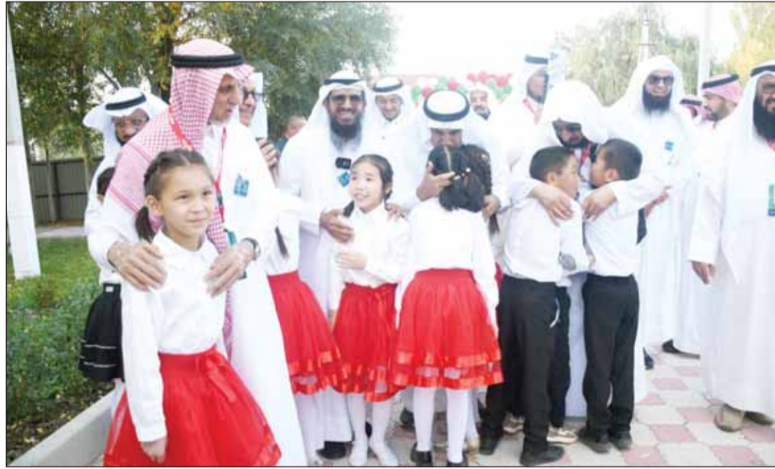
فرحة الأيتام بقدوم أبيهم الأيتام والمشاركين في الرحلة

مشاريع خيرية عملاقة وإنجازات جديدة لجمعية الصفا الإنسانية بقيادة "أبو الأيتام"