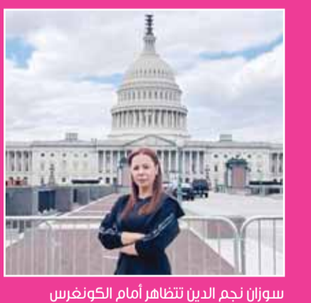
سوزان نجم الدين تتظاهر أمام الكونغرس

الأصوات لأنها ستكون الأقوى. وأرقت سوزان، مقطع الفيديو بتعليق جاء فيه: "من كل مكان بالعالم لازم يوصل صوتنا.. اليوم ومن أمام الكونغرس الأمريكي وبمشاركة يهود أميركا اللي شافو الحقيقة وطلعوا ينادو فيها.. تظاهرونا ورفعنا العلم وصرخنا بكلمة الحق.. الكلمة اللي لازم يسمعوها مهما كان الثمن كبير.. وين ما كتبتو اليوم.. بأي أرض وبأي ظرف ارفعوا أصواتكن ولا تخافوا.. مع بعض منعمل فرق ومتوقف العرب.. احكي الحقيقة.. ووصل صوتك". يأتي ذلك إيماناً من الفنانة السورية، بأن دورها كنجمة لها تأثير أن تكون دائماً صاحبة رأي وصوت في القضايا الإقليمية والعربية على وجه الخصوص، وخدمة القضايا الإنسانية في كل بقاع الأرض. وترى سوزان نجم الدين، إننا كعرب ورافضي الحرب في كل مكان بالعالم يجب أن يصل صوتنا للعالم أجمع، مسددة على أننا تظاهرونا ورفعنا العلم وصرخنا بكلمة الحق، حتى يسمعها الجميع مهما كان الثمن باهظاً.