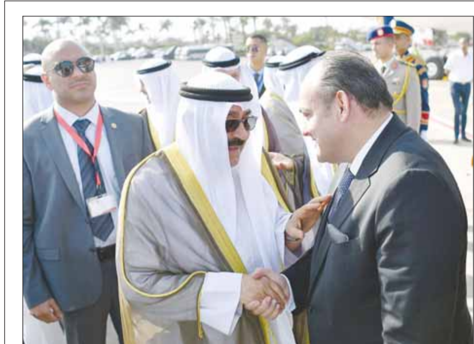
ممثّل سمو أمير البلاد، سمو ولي العهد، صباحاً فسبقه ليلته وصوله إلى مطار القاهرة

تطورات العدوان تحمل تداعيات خطيرة على أمن واستقرار المنطقة والعالم | قطاع غزة يتعرّض لعقاب جماعي وممارسات تتعارض مع القانون الإنساني | عدم سعي المجتمع الدولي لحل القضية وتعامله بازدواجية أسفرا عن هذه المأساة