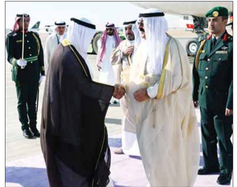
ممثل سمو أمير البلاد مضافاً مستقبليه لدى وصوله إلى مطار الرياض