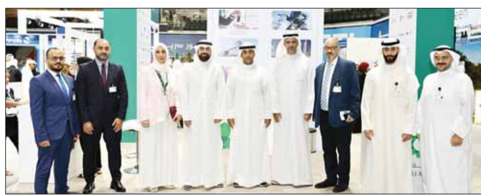
مشاركة الشركة في المعرض

من الشركات في كافة الصناعات التي تمارس فيها المجموعة أعمالها. وقد تضمن المعرض الوظيفي مشاركة عدد من قطاعات المجموعة التي شملت: قطاع السيارات وقطاع الخدمات المالية وقطاع الاستعانة والتأجير وقطاع التجارة والصناعة وقطاع الهندسة.