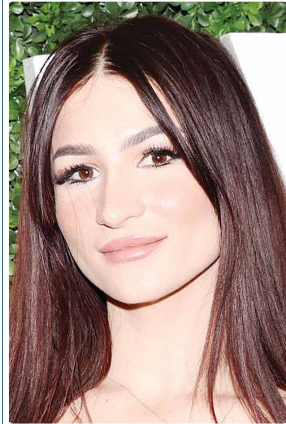
الممثلة الأمريكية فان دي خلال حضورها مهرجان "TwitchCon 2023 Las Vegas"