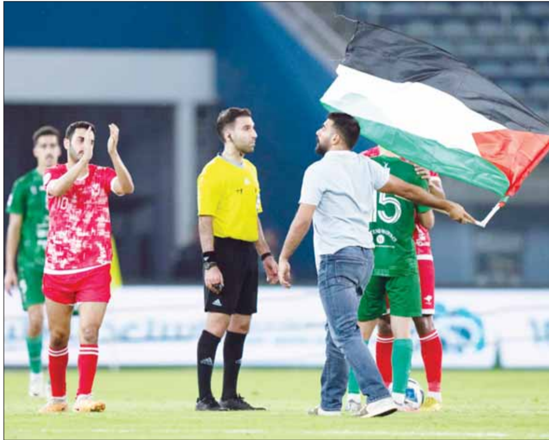
دخول أحد الجماهير الملعب حاملاً علم فلسطين

وتختتم الجولة الخامسة من الدوري بإقامة لقاء وحيد يجمع النصر والقادسية على استاد علي صباح السالم في الساعة السابعة والرابع مساءً. ويطمح القادسية (8 نقاط) إلى استغلال "تعتز" المتصدر، وتحقيق انتصار يقلص من خلاله الفارق على غرار الفريق التقليدي، فيما يبحث النصر (7 نقاط) عن انتصاره الثالث في المسابقة، والاقتراب أكثر من فرق المقدمة.