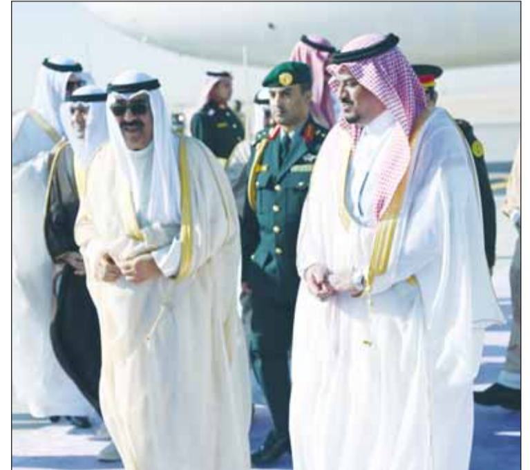
ممثل سمو الأمير سمو ولي العهد لدى وصوله إلى المملكة