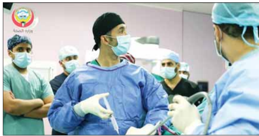
جانب من الجراحات

أعلنت وزارة الصحة تشييد أحدث أحدث الروبوت عالميا Da Vinci Xi في مركز الصباح الأحمد للكلية والمسالك وإجراء أولى عملياته باستئصال جذري للبروستاتا لمريض سرطان.