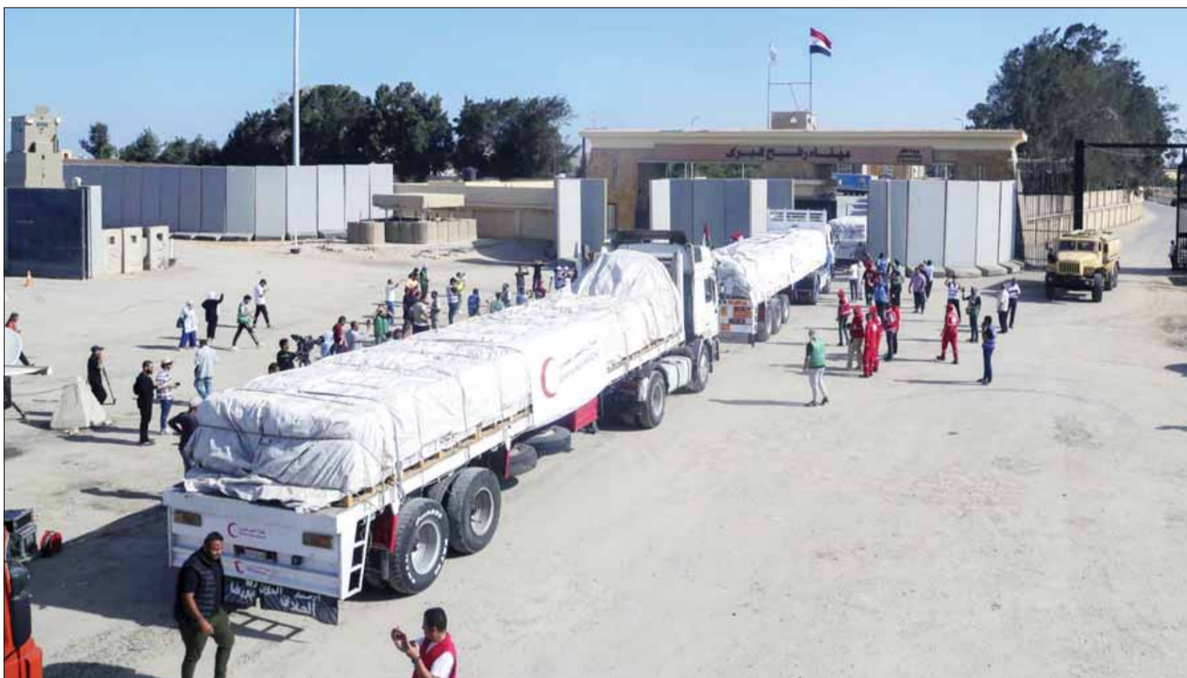
أول قافلة مساعدات إنسانية لدمع عبورها معبر رفح البري المصري إلى قطاع غزة المحاصر أمس حاملة أدوية ومستلزمات طبية ومواد غذائية

■ غزة، عواصم - وكالات، بعد مطاطة من الاعتلال، دخلت أول قافلة مساعدات إنسانية إلى قطاع غزة عبر مصر أمس وتتضمن 20 شاحنة محملة بأدوية ومستلزمات طبية وكمية محدودة من المواد الغذائية، على أن تتولى وكالة الأمم المتحدة لغوث وتشغيل اللاجئين الفلسطينيين "أونروا" توزيعها.