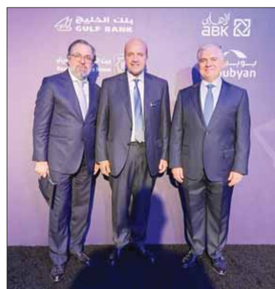
وقد البنك الأهلي المشارك في الاجتماعات

وتحت الرعاية الموقرة لصاحب السمو المهندس الشيخ سالم بن سلطان بن صقر القاسمي، رئيس هيئة الطيران المدني في رأس الخيمة وعضو