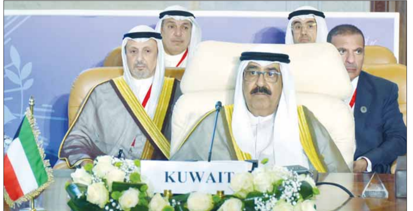
ممثّل سمو أمير البلاد، سمو ولي العهد، صباحاً فسبقه ليلته وصوله إلى مطار القاهرة للسلام