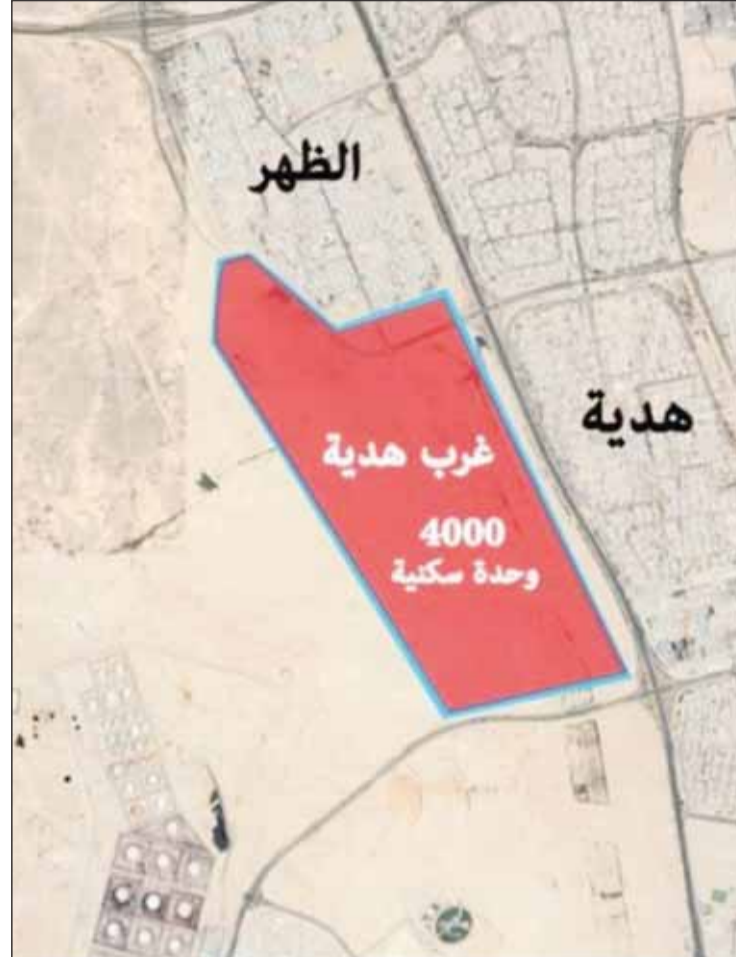
كروكبي لموقع غرب هدية