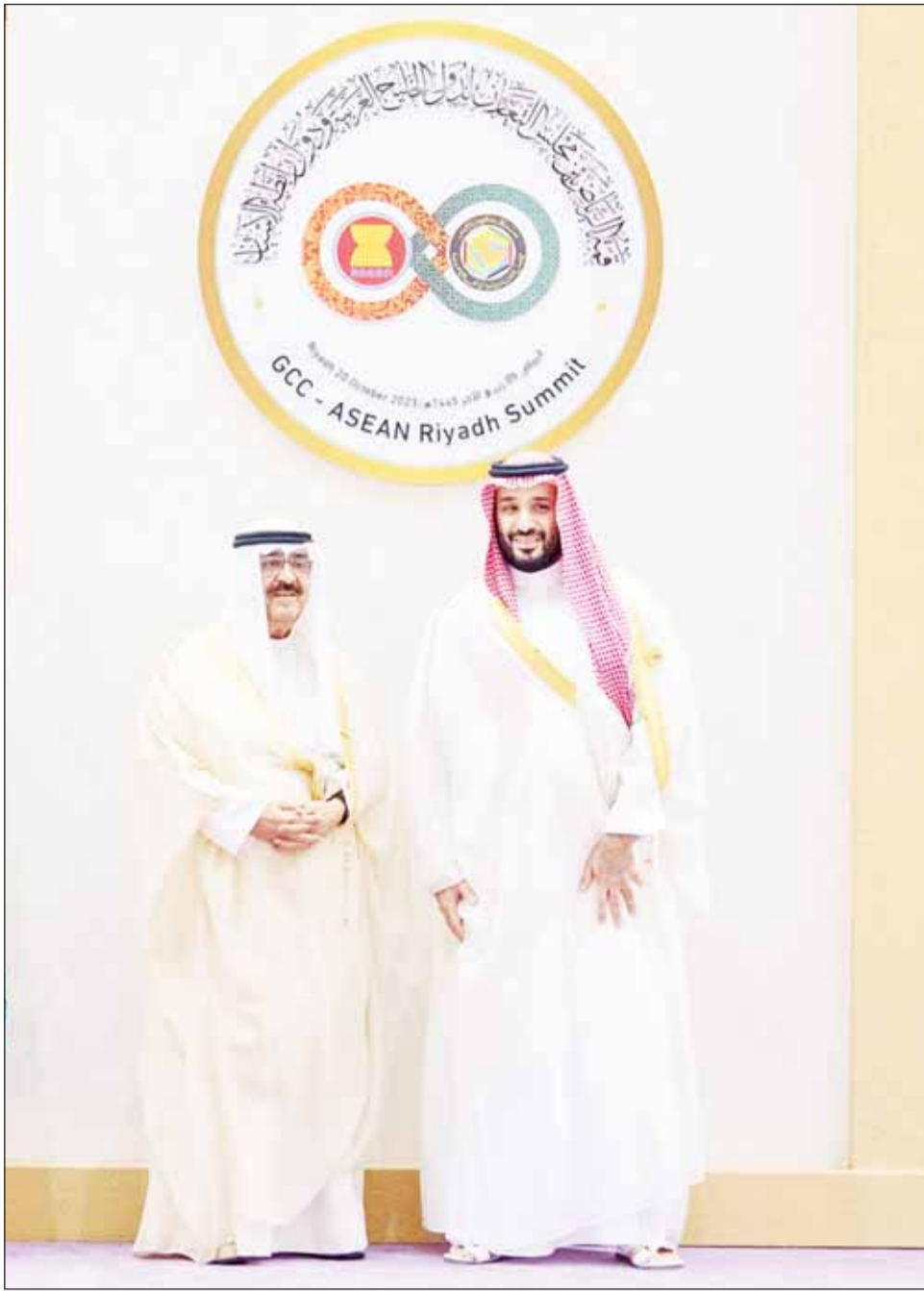
ممثل سمو أمير البلاد سمو ولي العهد الشيخ مشعل الأحمد وولي العهد السعودي الأمير محمد بن سلمان