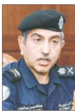
اللواء عبدالله الرقيب

وضبط 24 مركبة مطلوبة، و3 اشخاص بحالة غير طبيعية و60 شخصا دون أبحاث. وأشارت الاصنافية الى انه جرى تسجيل 4402 مخالفة مرورية متنوعة وتقديم المساعدات الى 441 حالة طلبت المساعدة خلال الاسبوع الماضي.