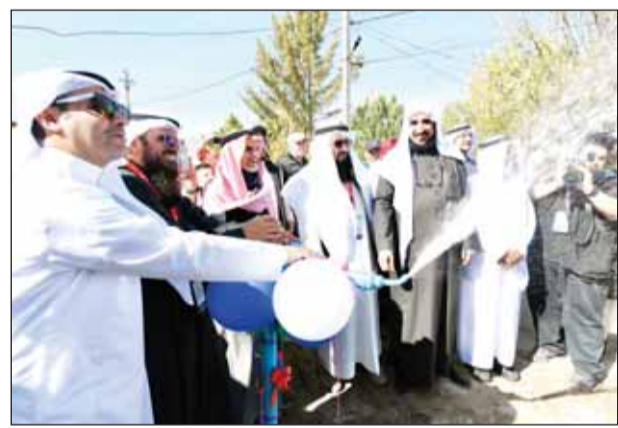
تدشين شبكة مياه

للطوارئ الذي يعد المستشفى الـ 11 الذي تنجزه جمعية الصفا الإنسانية إلى جانب عشرات المراكز الصحية. وفي اليوم التالي، الذي كان مطراً اقتصرت الفعاليات على رحلة إلى ربوع جبال قيرغيزيا للتعرف على طبيعتها الخلابة، فاستقبلتنا أمطار الخير التي ما لبثت أن تحولت إلى ثلج زاد من برودة الأجواء كرسالة تعريف بمعاناة المحتاجين الذين لا يمتلكون متطلبات العيش في فصل الشتاء.