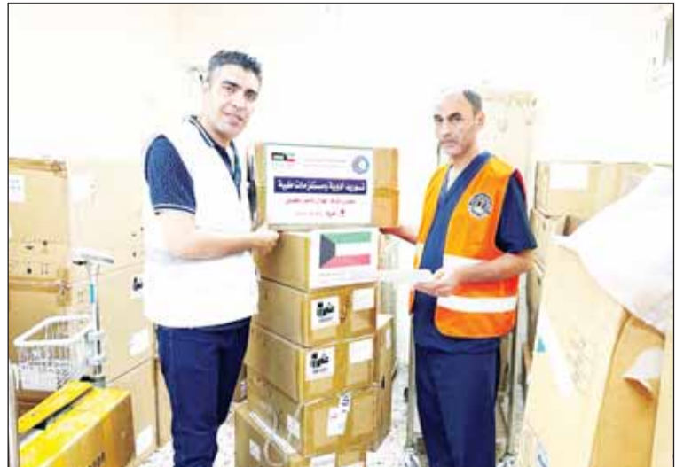
جمعية الهلال الأحمر الكويتية توفر مستلزمات طبية للمستشفيات في قطاع غزة

رام الله - (كونا)، وصلت جمعية الهلال الأحمر الكويتي، أمس، تقديم المساعدات العاجلة ضمن حملة "الكويت بجانبكم" للفلسطينيين في قطاع غزة الذين يتعرضون لعدوان الاحتلال الإسرائيلي عبر البر والجو والبحر اليوم الك15 على التوالي. وقدمت الجمعية للأسر النازحة اللجوءيات الساكنة والخبز وسلمت الدفعة الثانية من المعدات الطبية للمستشفيات التي تعاني من نقص حاد في الأدوية والمستلزمات الطبية. وتأتي الحملة لمساعدة ودعم الشعب الفلسطيني والتخفيف من آثار العدوان الذي تشنه قوات الاحتلال الإسرائيلي على قطاع غزة منذ السابع من أكتوبر الجاري ما أدى إلى سقوط 4385 شهيداً وإصابة نحو 13561 آخرين وفق أحدث حصيلة للسلطات الصحية في قطاع غزة.