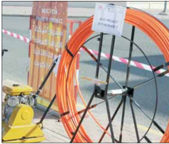
أعمال تركيب الألياف الضوئية - المرحلة الثانية

المرحلة الثالثة في محافظتي الأحمدي ومبارك الكبير 37 منطقة من بينها "صباح الصناعية وشاليهات الفيران والزور والنويصيب وغرب وشمال وسط الأحمدي وعلي صباح السالم."