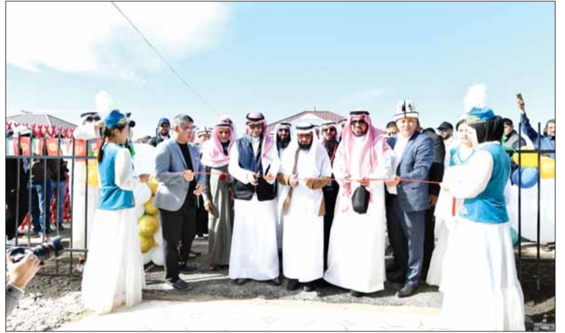
افتتاح أحد المشاريع في قرية الأمل للأرامل