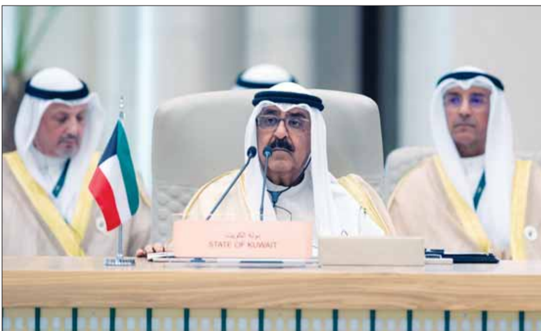
ممثل سمو الأمير سمو ولي العهد الشيخ مشعل الأحمد يلقي كلمة الكويت في القمة

➤ رغبة صادقة مشتركة لتطوير وتعزيز العلاقات لتشمل آفاق التعاون بمختلف المجالات