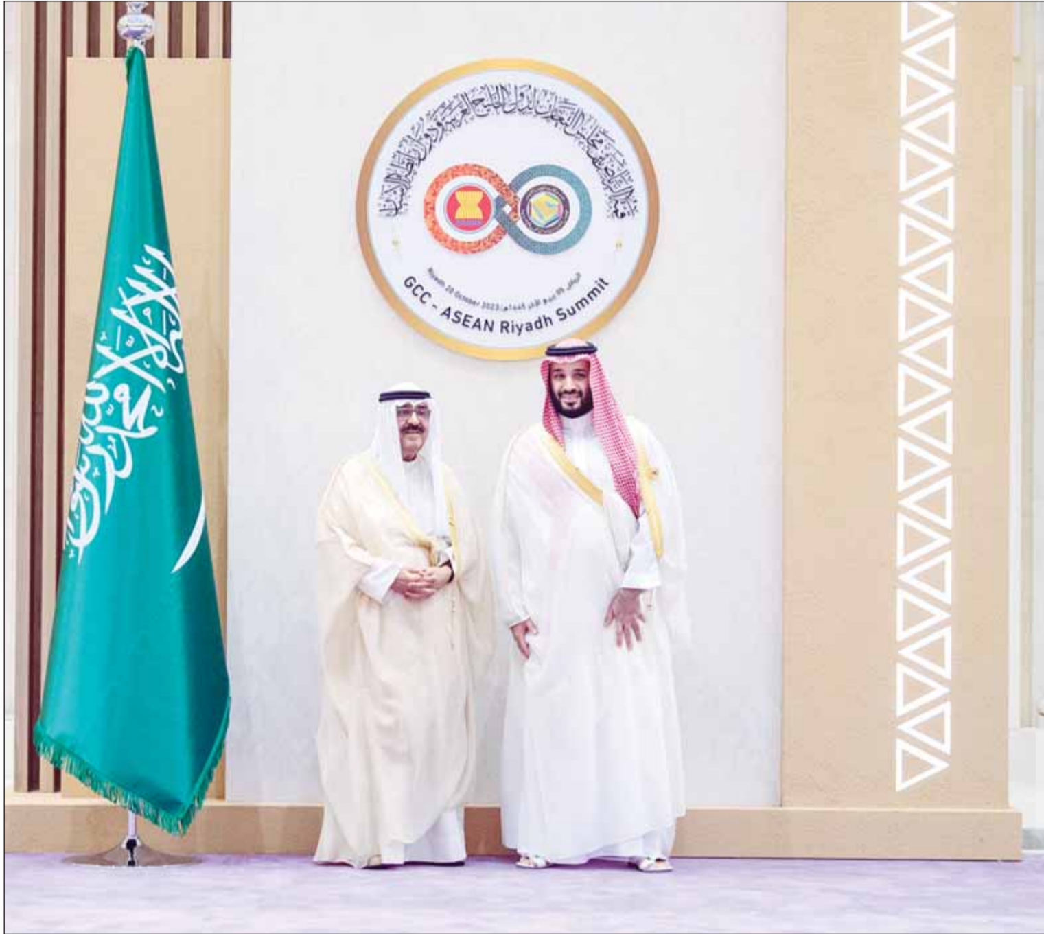
ممثل سمو الأمير سمو ولي العهد الشيخ مشعل الأحمد وولي العهد السعودي الأمير محمد بن سلمان

➤ احتضان المملكة للقمة الخليجية مع دول "الآسيان" يرسخ دورها المحوري العالمي