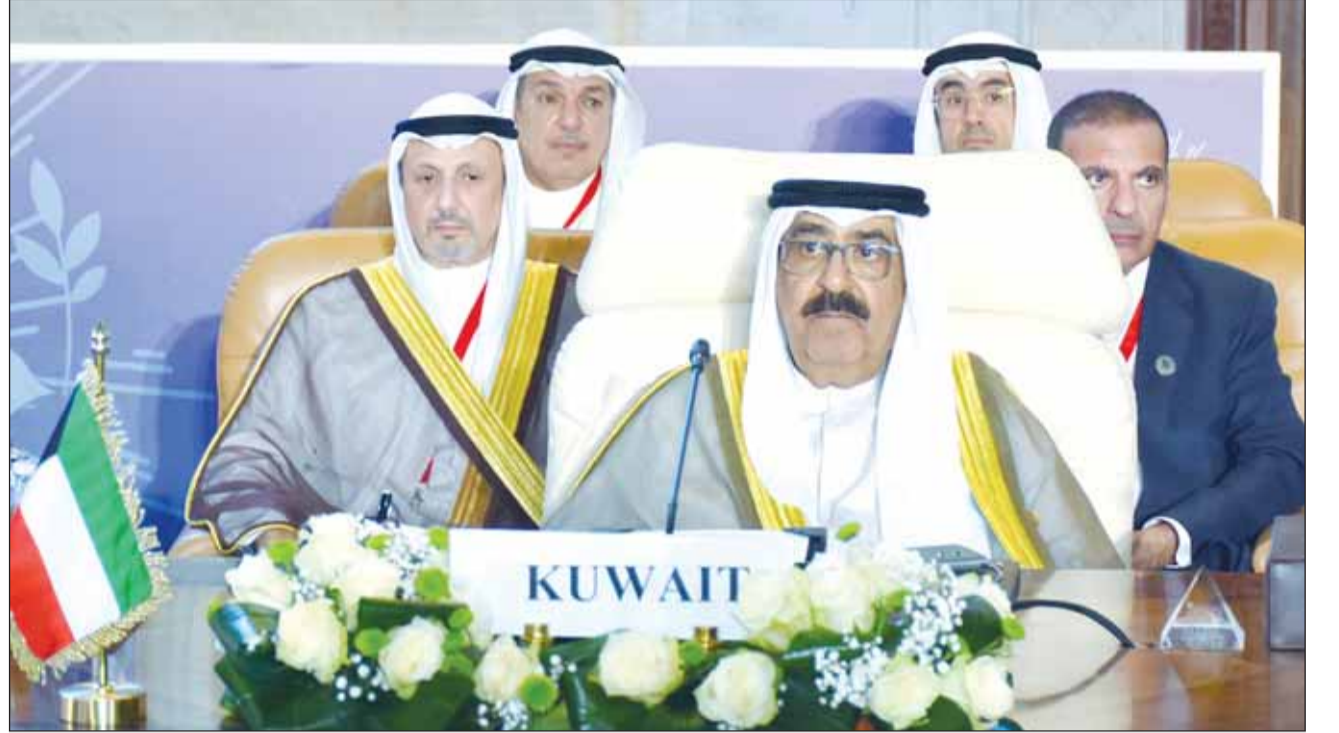
ممثل سمو أمير البلاد سمو ولي العهد الشيخ مشعل الأحمد يلقي كلمة الكويت في قمة القاهرة للسلام