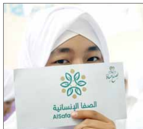
نظرة ثقة وأمل