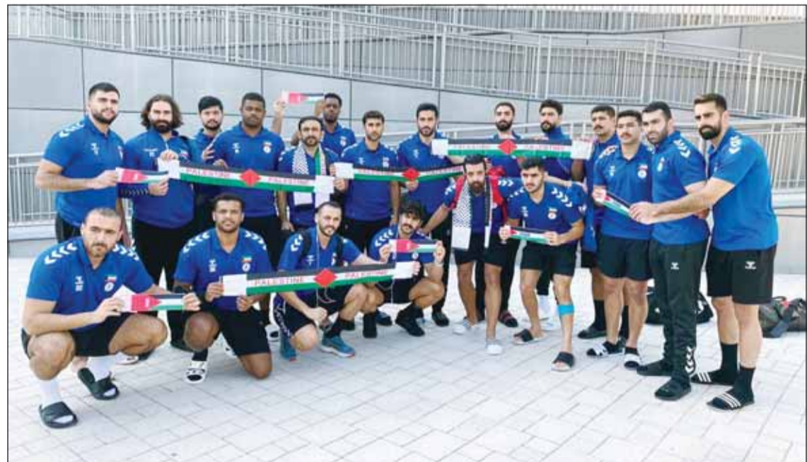
لاعب أزرق اليد يحملون علم فلسطين قبل لقاء اليابان