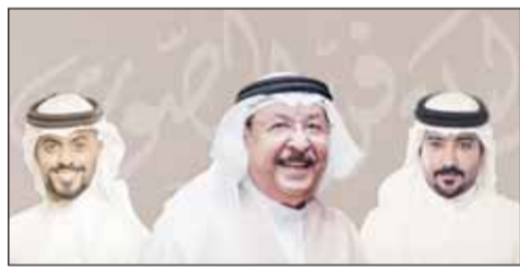
بوستر حفل أحمد الجميري

جيدة ويمتازون لتوجيه طاقتهم في الاتجاه السليم، وبإذن الله عندما تستقر الأمور سنكشف المزيد من التفاصيل المتعلقة بالبرنامج". وعن تواجدتها في الكويت، أوضحت الإعلامية الشهيرة رانيا برغوت، التي تعتبر واحدة من أفضل الاعلاميات ومقدمات البرامج التلفزيونية التي عرفها الإعلام العربي، بأنها تشرف على تدريب وتأهيل مجموعة من المتقدمين لبرنامج "الجوهر" بنسخته الثالثة، حيث يتم تدريبهم على التقديم التلفزيوني في قطاعي الاخبار والبرامج المتنوعة بالتعاون مع قناة ATV العدالة، والجميل في "الجوهر" أنه يتيح لخريجيه فرص متميزة سواء طوال فترة التدريب أو حتى بعد التخرج من خلال فرص خوض التقديم التلفزيوني مع مختلف الشخصيات السياسية