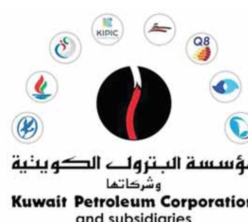
مؤسسة البترول الكويتية وشركاؤها Kuwait Petroleum Corporation and subsidiaries

رويترز: قالت مصادر تجارية إن مؤسسة البترول الكويتية زادت عطاءاتها الفورية لمبيعات زيت الوقود عالي الكبريت هذا الشهر.