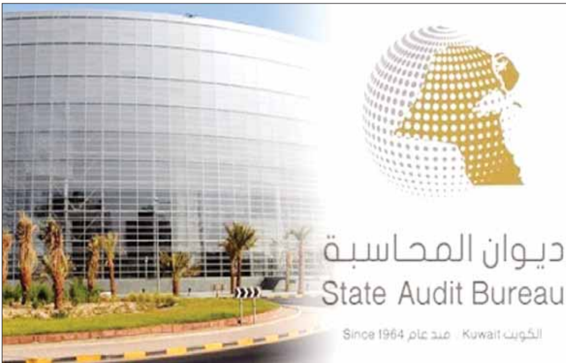
ديوان المحاسبة State Audit Bureau الكويت - منذ عام 1964

تسجيل أرامل جدد لأحد أصحاب المعاشات... دون وجود مستندات تؤيد زواجه بهن