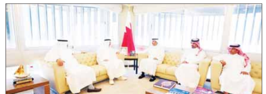
وزير العدل البحريني مستقبلاً الوفد القضائي الكويتي

■ بعث سمو رئيس مجلس الوزراء الشيخ أحمد النواف ببرقية تعزية إلى أمير دولة قطر الشقيقة الشيخ تميم بن حمد آل ثاني عبر فيها سموه عن خالص تعازيه وصادق مواساته بوفاة المغفور لها بإذن الله تعالى الشيخة مريم بنت جاسم بن حمد آل ثاني.