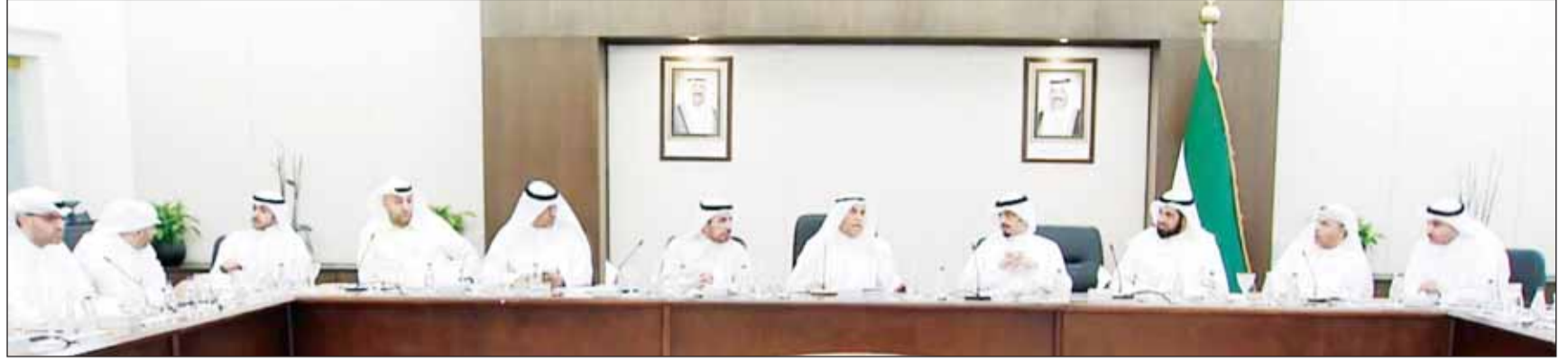
جانب من الاجتماع التنسيقى للنائب الذى عقد برئاسة السعدون

وجه النائب مبارك الحجرف سؤالا إلى نائب رئيس مجلس الوزراء وزير الدولة لشؤون مجلسي الوزراء والأمة عيسى الكندري عن مركز التواصل الحكومي. وسأل، كم تبلغ الميزانية المخصصة للمركز خلال السنوات الثلاث الماضية؟ مع تزويده بكشف موضع فيه الميزانية المخصصة لكل عام والمصرفات بالتفصيل، وبأخر الصرف في ميزانية المركز؟ وتزويده بكشف موضع فيه المصرفات خلال السنوات الثلاث الماضية، وبآخر للعقد التي أبرمها المركز، وكم تبلغ قيمة العقود وأسماء الشركات، وبصورة ضوئية من الهيكل التنظيمي له.