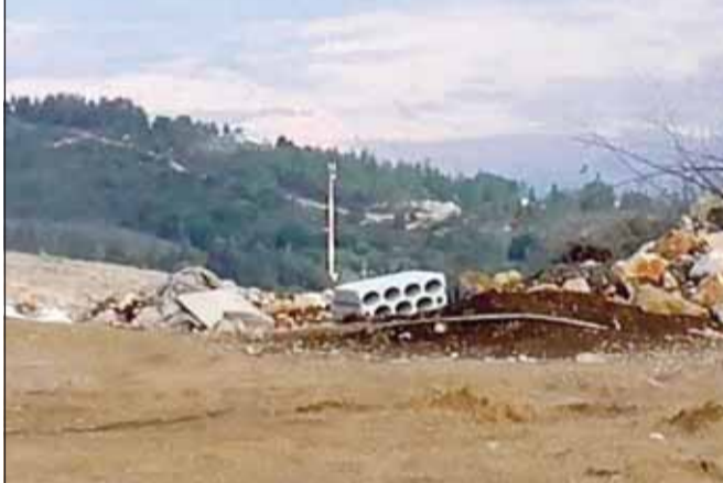
عنصر من "حزب الله" اللبناني يطلق قذيفة صاروخية تجاه موقع إسرائيلي وفي إطار قصف مستوطنة "يفتاه" بصاروخين مضادين للدروع

والاستعدادات التي تقوم بها من أجل وضع خطة طوارئ لمواجهة ما قد يحصل هي خطوة وقائية أساسية من باب الحيطة لأننا في مواجهة عدو نعرف تاريخه الدموي.