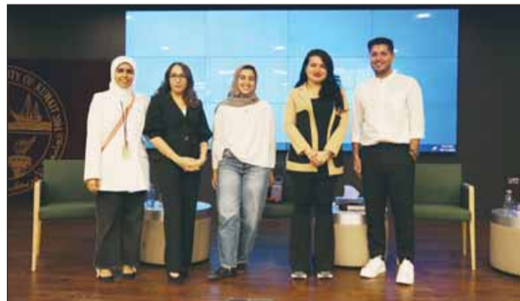
المندوبون في الحلقة النقاشية

المستقبل الذي يجعل حماية البيئة أولوية. وأكد البيان أن تفاني الجامعة في تعزيز ثقافة الاستدامة لا يتجلى فقط في مناهجها الدراسية، لكن أيضاً في مختلف المبادرات والمناقشات، إذ تعمل على غرس المسؤولية البيئية والاجتماعية في طلبتها، والمجتمع بشكل عام، كما تواصل تقديم مساهمات كبيرة نحو مستقبل أكثر استدامة ومسؤولية.