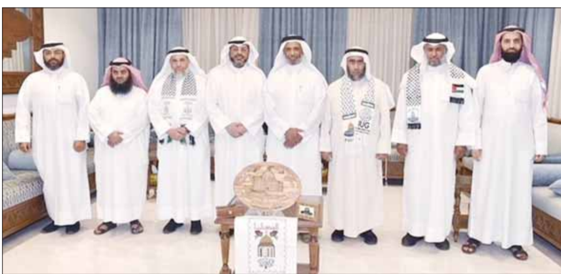
المتحدثون في مؤتمر نقابة الأئمة والخطباء

□ الطواري: نحمل على عاتقنا مسؤولية إبقاء قضية فلسطين حية بالأذهان