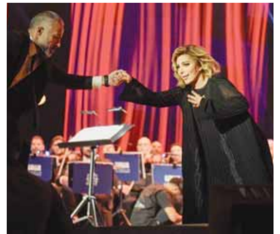
أصالة في حفل الرياض

ونهدت أصالة، وأكملت طريقها ناحية الجمهور لأخذ الوردة، وعادت إلى المسرح بشكل بطيء خشية تكرار السقوط. وأطلت أصالة، بفستان أسود أشبه ما يكون بالعباءة، مرصعا