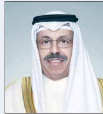
سمو الشيخ أحمد النواف

■ بعث سمو رئيس مجلس الوزراء الشيخ أحمد النواف ببرقية تعزية إلى أمير دولة قطر الشقيقة الشيخ تميم بن حمد آل ثاني عبر فيها سموه عن خالص تعازيه وصادق مواساته بوفاة المغفور لها بإذن الله تعالى الشيخة مريم بنت جاسم بن حمد آل ثاني.