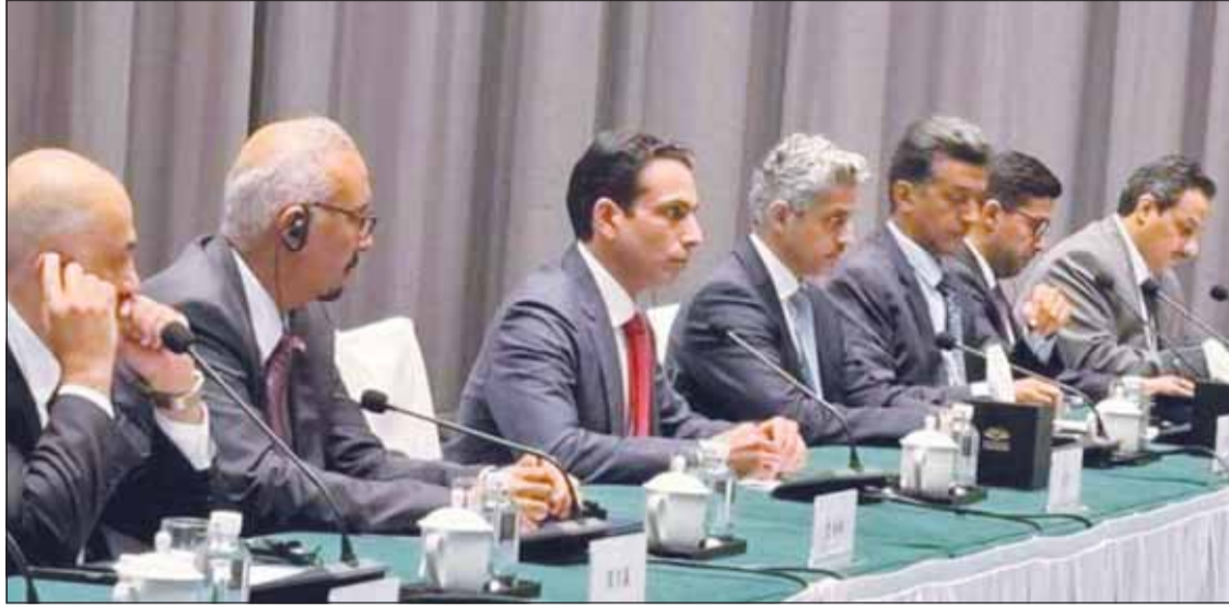
جانب من المباحثات الكويتية - الصينية المشتركة

■ ميناء مبارك الكبير فرصة استثمارية لآفاق تعاون عبر فتح خطوط ملاحية مباشرة وتعزيز سلاسل التوريد ■ حريصون على زيادة التعاون غير النفط مع الصين في البناء والمنطقة الحرة والطاقة المتجددة