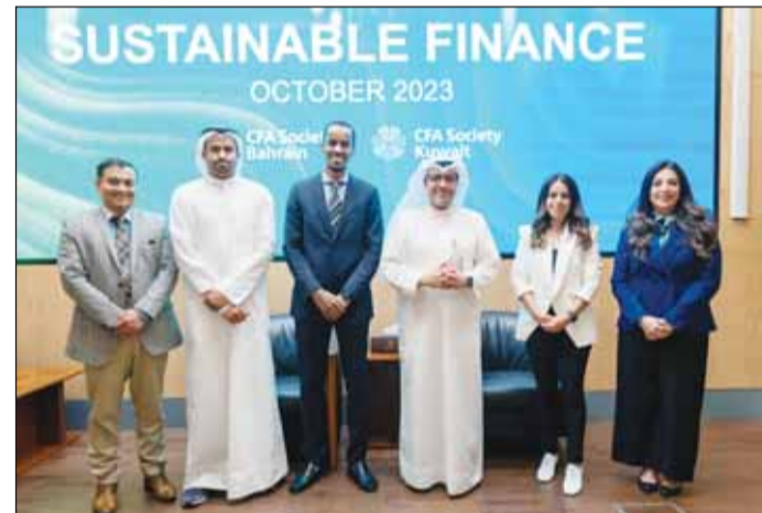
جانب من فعاليات الجلسة التوعوية