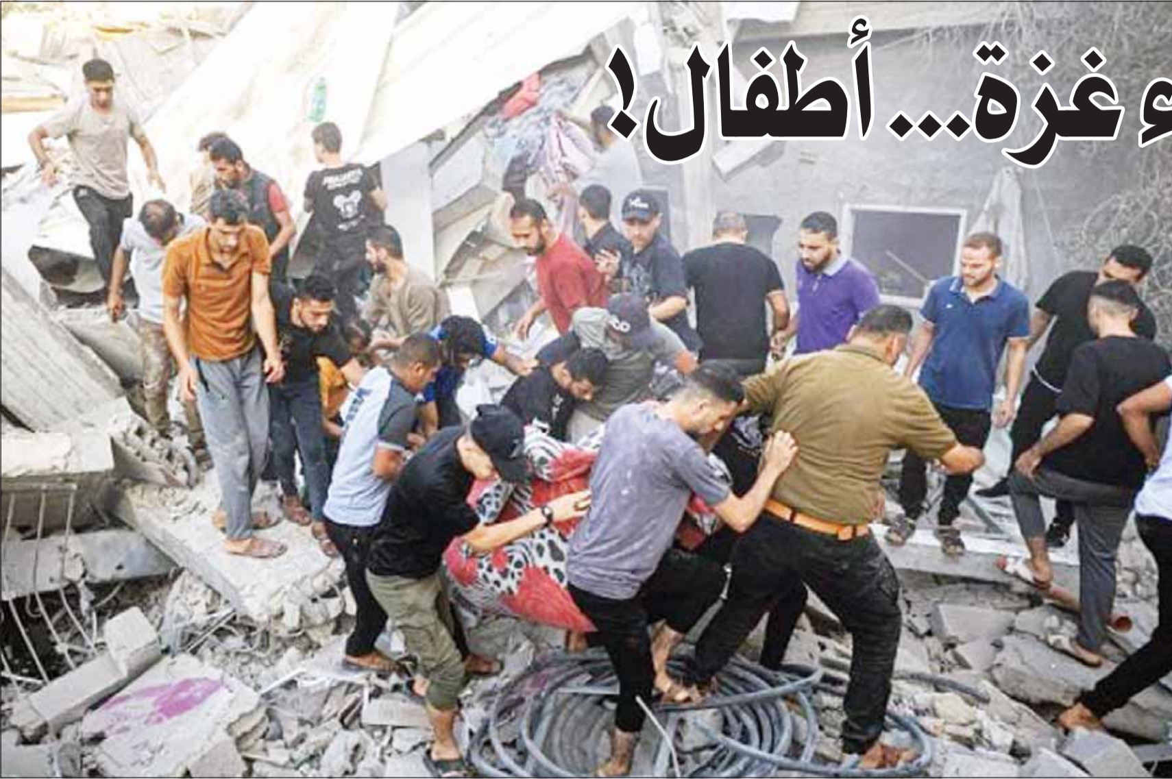
فلسطينيون ينتشلون ضحايا من تحت الأنقاض في غارات إسرائيلية استهدفت ثلاثة منازل في رفح جنوبي القطاع