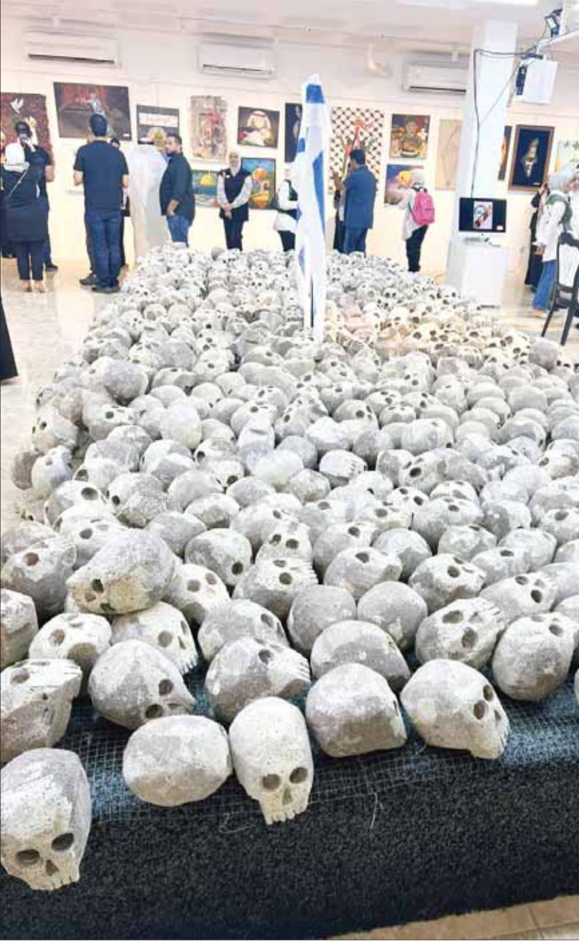
"الجمام" لوحة رمزية عن البشاعة الإسرائيلية