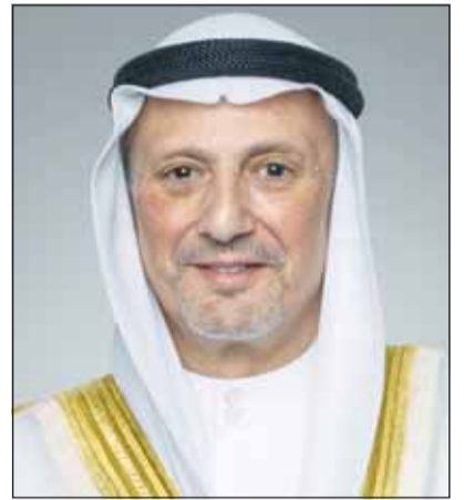
الشيخ سالم العبدالله

من موقف مبدئي وثابت تجاه القضية الفلسطينية