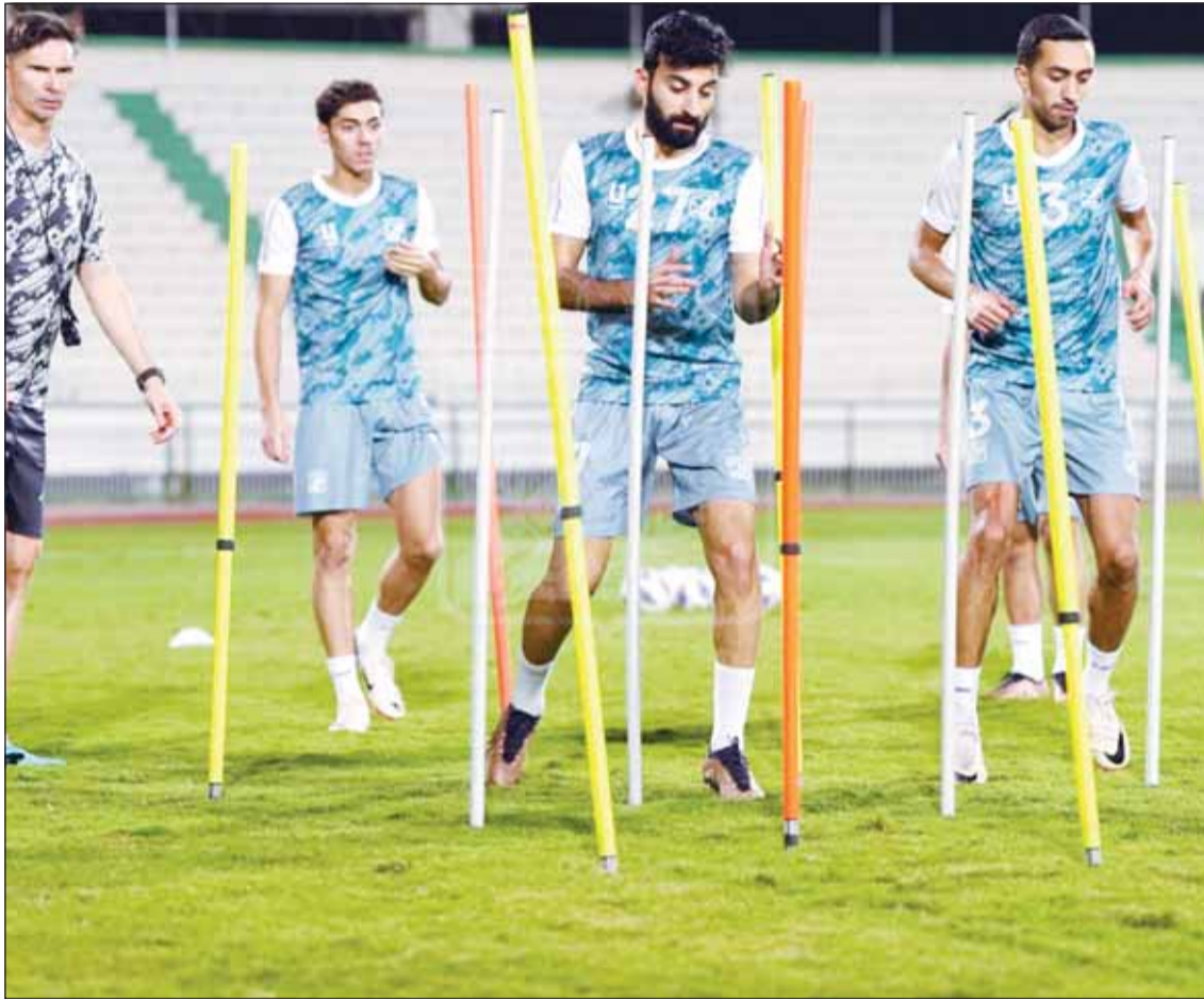
برداريتش يتابع تدريبات لاعبيه أول من أمس

ويطمح العربي الى استغلال عاملي الأرض والجمهور، وتحقيق انتصار يمكنه