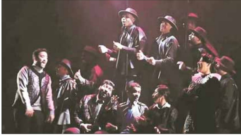
مشهد من "الساعة التاسعة"

بالأمر المستغرب على مبدع شامل قدم الكثير لفرقة المسرح الكويتي وللحركة المسرحية وأيضاً عطائه الفنية المتعددة التي ترسخه كواحد من أبرز نجوم جيله.