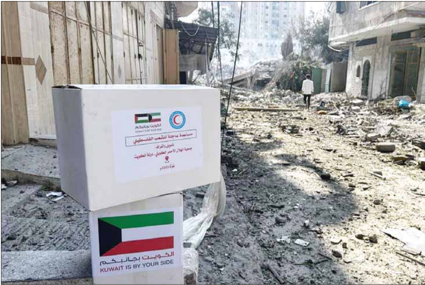
المساعدات الكويتية في الطليعة رغم الدمار