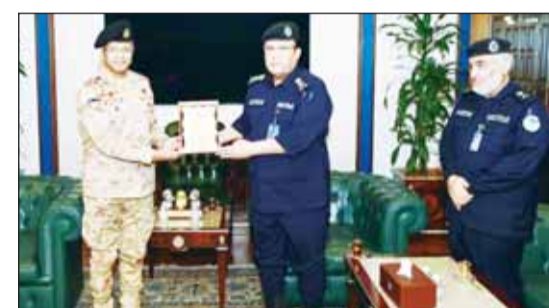
الفريق أنور البرجس والعميد تاج سيف الاسلام

الموقعة بين الجانبين. وأعرب العميد سيف الاسلام عن أهمية ما تم بحثه من موضوعات التي تؤدي إلى مزيد من ترسيخ التعاون، مؤكداً على قوة ومتانة العلاقات بين البلدين الصديقين.