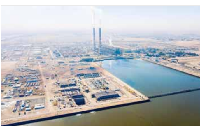
محطة الوحة الغربية الحالية

وأوضحت المصادر أن القدرة الانتاجية الحالية لـ 7 محطات تابعة لوزارة