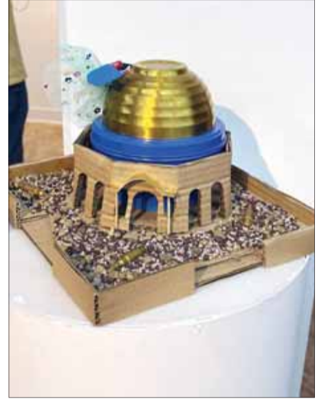
مجسم للمسجد الأقصى