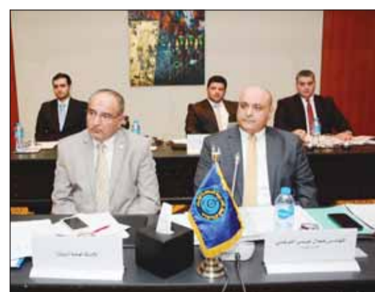
مشاركة "أوابك" في الاجتماع

الأمانة العامة بدور الوسيط بين الشركات المنبثقة عن المنظمة والشركات الوطنية ومخرجاتها. وأوضح أن نتائج العام 2022 تشير إلى تحقيق الشركات العربية المنبثقة أرباحاً إجمالية صافية تجاوزت 235 مليون دولار ليكون بذلك "عام الأرباح القياسية". وعقد الاجتماع بحضور ممثلي الشركة العربية البحرية لنقل البترول والشركة العربية لبناء وإصلاح السفن والشركة العربية للاستثمارات البحرية والتجارية والشركة العربية للخدمات البترولية والشركة العربية لخدمات الاستكشاف الجيوفيزيائي.