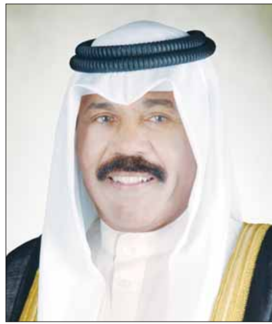
سمو أمير البلاد الشيخ نواف الأحمد

■ بعث سمو ولي العهد الشيخ مشعل الأحمد ببرقية تعزية إلى أمير دولة قطر الشقيقة الشيخ تميم بن حمد آل ثاني عبر فيها سموه عن خالص تعازيه وصادق مواساته بوفاة المغفور لها بإذن الله تعالى الشيخة مريم بنت جاسم بن حمد آل ثاني، مجتهداً سموه إلى المولى تعالى أن يتغمدها بواسع رحمته ويسكنها فسيح جناته.