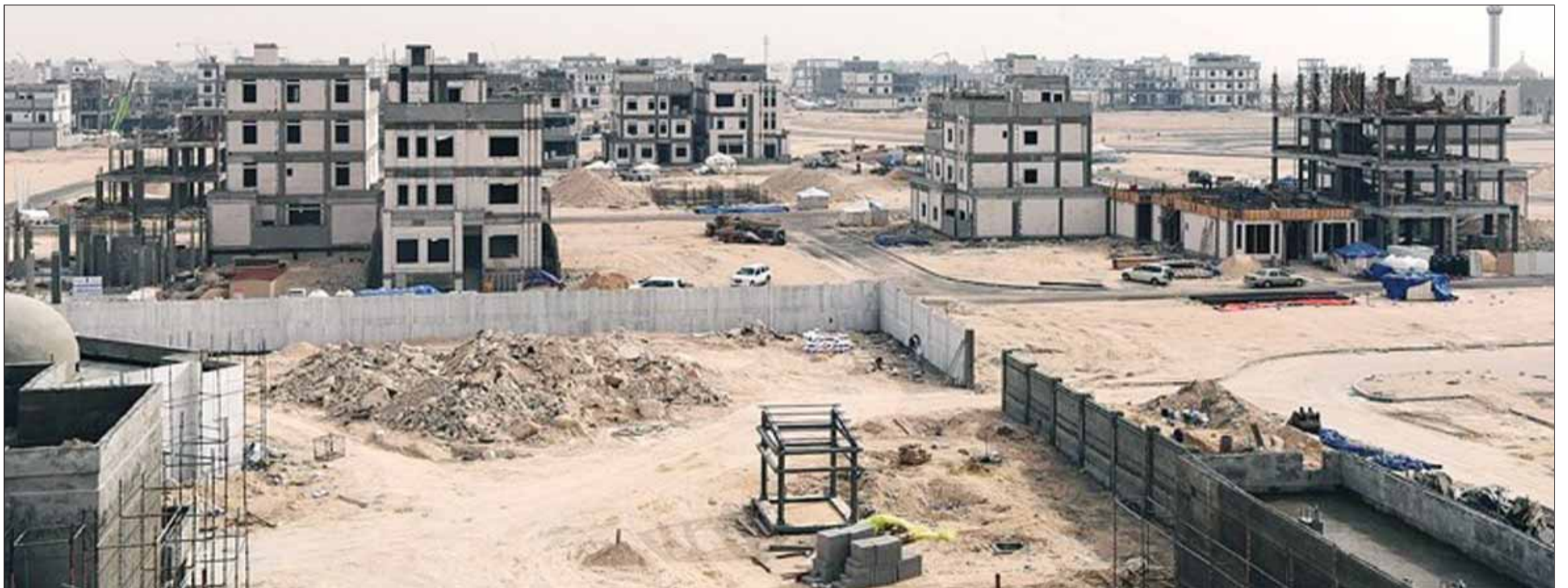
مشروع مدينة المطلاع