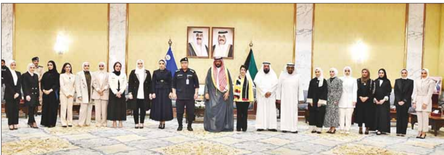
الشيخ طلال الخالد والفريق أنور البرجس وفارعة عمادي متوسطين بالباحث القانونيين

المواطنين والمقيمين، وتطبيق القانون على الجميع بمسطرة واحدة. كما أكد أهمية مواصلة التحصيل العلمي والاستفادة من تجارب المحققين والمحققات الأقدم، والاستماع إلى نصائحهم لاكتساب المزيد من المعرفة والخبرات لتحقيق التميز في العمل، متمنياً لهم التوفيق في حياتهم العملية المقبلة.