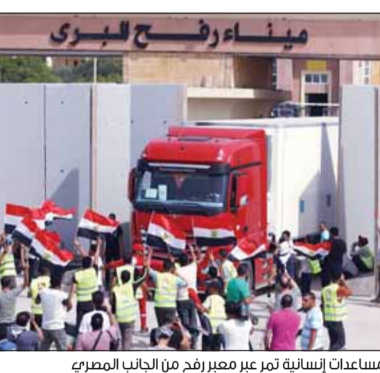
شاحنات تحمل مساعدات إنسانية تمر عبر معبر رفح من الجانب المصري

من جهتها، أعلنت الهند إرسالها نحو 6,5 طن من المواد الطبية و32 طنا من المساعدات الإغاثية، وقال المتحدث باسم وزارة الشؤون الخارجية الهندية إريندنام باجشي إن طائرة تابعة لسلاح الجو الهندي في طريقها إلى مطار العريش محملة بمساعدات بلاده الإنسانية إلى الشعب الفلسطيني.