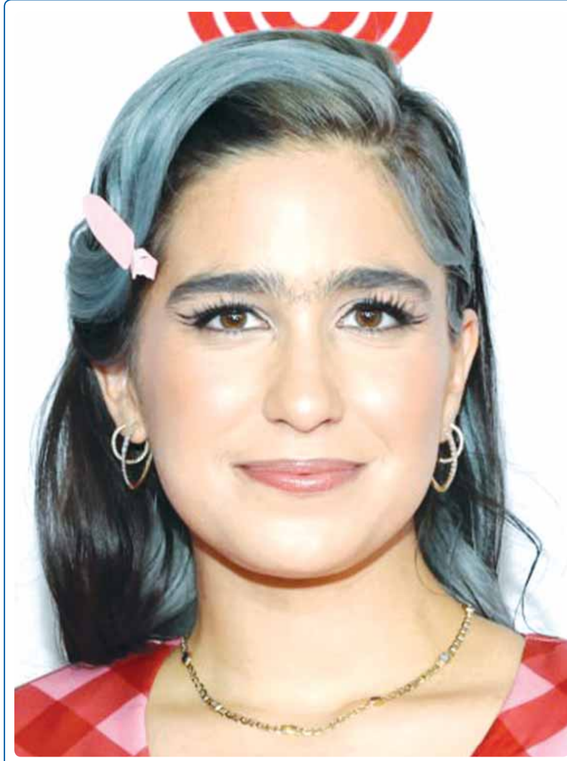
عازرة الأرياء الأميركية جيميني هيرانديز خلال حضورها حفل "آي هارت فيبيستا لائتيا في" في ميامي

نعم، نحن، وكما نقول بالعامية "الحق ربي" فلا تزعلون منا اذا تذكرنا الماسي، لكننا اليوم نكررها تعض الكويت على الجرح، لان الدم العربي واحد، ولان لا وجهة لنا ولا طريق من اجل الخلاص مما يعيشه العرب الا تحرير فلسطين، وان يعيش الفلسطيني على ارضه معززا ومتمحررا من كل القيود التي يفرضها الصهيوني عليه، والا فان العالم العربي سيبقى يريز تحت نير الاستقلال.