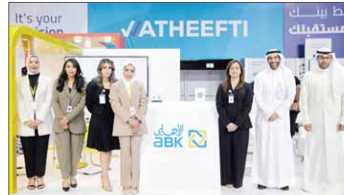
فريق "الأهلي" خلال مشاركته بالمعرض

يلعبه الشباب في بناء مستقبل الكويت، وقد حصلنا خلال المعرض على فرصة للقاء أفضل المواهب المحلية، وجذب عدد كبير من المهتمين بالعمل في القطاع المصرفي إلى صفوف البنك". وأوضحت أن المشاركة في المعرض لا تعود بالإيجاب على البنك فحسب، بل على المجتمع والاقتصاد الكويتي ككل،