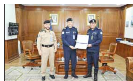
اللواء الرقيب كرم العميد الأمير بحضور العميد العداوني

خلفية ضبط مستودع كبير لتخزين أجهزة عوادم السيارات