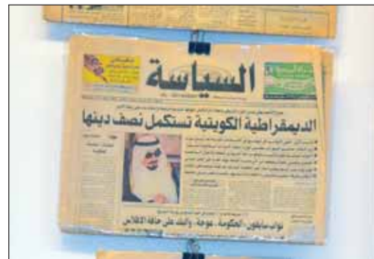
عدد "السياسة" الصادر بعد منح المرأة حقوقها حاضراً في الملتقى

على المضي قدماً في دعم كافة المبادرات الوطنية والمجتمعية التي من شأنها أن تسهم في تعزيز حقوق الإنسان وكفالة الحقوق المدنية والسياسية بما يتفق مع المعهود والمواثيق الدولية وما نصت عليه التشريعات الكويتية. وذكر أن مبادرة "ساندهم" أتت بشراكة استراتيجية مع جمعية البناء البشري للتنمية الاجتماعية، ووزارة الداخلية التي تتشرف على المؤسسات الإصلاحية، لتتيح المجال للمجتمع المدني والقطاع الخاص في الكويت، للمساهمة في مشاريع تخدم المجتمع بكافة فئاته. وأكد أنها دعوة حقيقية للتعبير عن الواجب الوطني والإنساني للمساهمة في الارتقاء بتقديم الخدمات الإنسانية لهذه الفئة وتوفير البيئة الصالحة والكرامة وقت اجتيازهم في المؤسسات الإصلاحية.