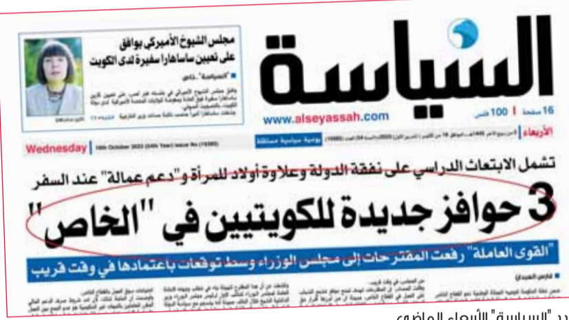
عدد "السياسة" الأربعاء الماضي

تأكيداً للخبر الذي تصدره "السياسة" الأربعاء الماضي (18 أكتوبر الجاري)، بعنوان "3 موافز جديدة للكويتيين في الخاص"، وفي خطوة تؤكد صدق مساعي الحكومة في دعم العمالة الوطنية وتشجيعها على الالتحاق بالقطاع الخاص ومساواتهم بالعاملين في القطاع الحكومي، وافق مجلس الوزراء على استمرار صرف دعم العمالة الوطنية للمريض ومرافق المريض العاملين في القطاع الخاص أثناء العلاج بالخارج. وقال مركز التواصل الحكومي عبر حسابيه على منصة (x)، إن "مجلس الوزراء وافق في اجتماعه الذي عقد أمس على قرار بشأن استمرار صرف العلاوة الاجتماعية (دعم العمالة) للعاملين في القطاع الخاص الصادر بشأنهم قرار من الجهات الصحية المختصة بالعلاج بالخارج أو مرافقة