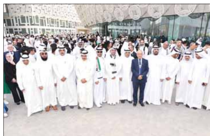
مسؤولو جامعة الكويت وأعضاء هيئة التدريس خلال الوقفة التضامنية

حضور مدير جامعة الكويت بالإذابة أ. د. فايز الظفيري، نظمت جامعة الكويت أمس بالتعاون مع جمعية أعضاء هيئة التدريس والاتحاد الوطني لطبقة الكويت وقفة تضامنية إنسانية يوم التضامن مع غزة" دعما للشعب الفلسطيني وأحداث غزة، وذلك أمام مبنى الإدارة الجامعية وقاعة (الدانة) في مدينة صباح السالم الجامعية. تأتي الوقفة التضامنية تأكيداً على موقف دولة الكويت من القضية الفلسطينية وتضامناً مع أهالي غزة ودعم صمودهم ضد الاحتلال الصهيوني.