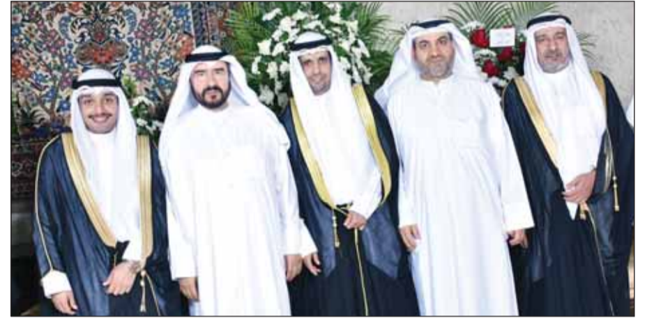
سعودون حماد قدم التهاني