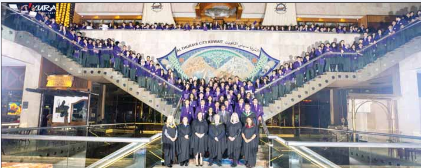
صورة جماعية للمكتمزين