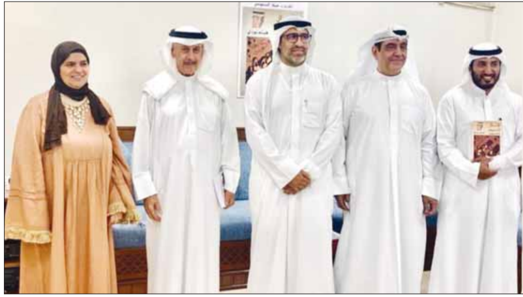
خلال مشاركته في إحدى المناسبات

وأضاف بودي، رواية "درب السنع" يبدو أنها لفتت انتباه المنتج والمخرج صادق بيهاني، الذي أبدى رغبته في تحويلها إلى عمل فني درامي، لم يحدد بعد إذا ما كان فيلماً سينمائياً كونه معروفاً بإنتاجه للأفلام السينمائية أو ربما مسلسل محدود الحلقات وكلاهما "مقدور عليه"، لأن الرواية جلي بالكثير من القصص