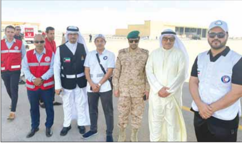
السير غانم الغانم ومسؤولو الهلال الأحمر المصري وسلطات مدينة العريش يستقبلون الطائرة الكويتية

القاهرة - كونا، حطت أولى طائرات الجسر الجوي الإغاثي الكويتي في مطار العريش الدولي في شمال سيناء أمس محملة بمساعدات إنسانية عاجلة للشعب الفلسطيني يقطع غزة الذي يتعرض لعدوان إسرائيلي وحشي خلف آلاف الضحايا والجرحى. وكان في استقبال الطائرة سفير الكويت في القاهرة ومندوبها الدائم لدى جامعة الدول العربية غانم الغانم حين وصولها، إلى جانب مسؤولين من الهلال الأحمر المصري وسلطات مدينة العريش. وقال مبعوث الهلال الأحمر الكويتي خالد الزيد لـ"كونا" إن طائرة النقل التابعة للقوة الجوية الكويتية حطت في مطار العريش تمهيدا لنقل المعونة إلى قطاع غزة متضمنة شحنة إغاثية متنوعة، ومستلزمات طبية، و3 سيارات إسعاف، وجميعها تتناسب مع الاحتياجات الأساسية التي تتطلبها مثل هذه الأحوال.