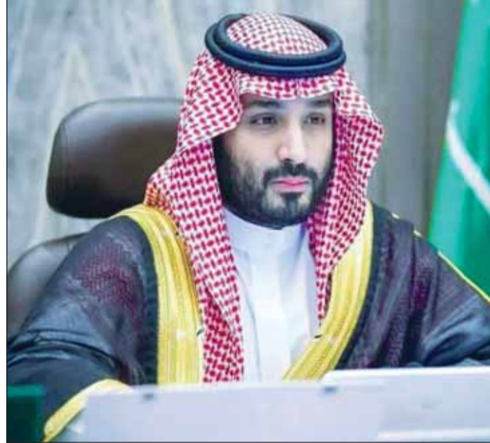
الأمير محمد بن سلمان

وقال ولي العهد، "بطولة كأس العالم للرياضات الإلكترونية هي الخطوة الطبيعية التالية في رحلة السعودية لتصبح المركز العالمي الأول للألعاب والرياضات الإلكترونية، وستقدم تجربة لا مثيل لها، تفوق ما هو متعارف عليه في القطاع". وستكون هذه البطولة رافداً رئيسياً في تحقيق مساعي استراتيجية قطاع الألعاب والرياضات الإلكترونية، والمساهمة في تحقيق أكثر من 50 مليار ريال للخارج المحلي بحلول عام 2030، وتوفير 39 ألف فرصة عمل جديدة في القطاع، وتحويل مدينة الرياض إلى عاصمة للألعاب الإلكترونية، كما أنه من المقرر أن تقام البطولة في صالات مغلقة، مصحوبة بالعديد من الأنشطة والفعاليات، لتكون فرصة فريدة في جذب شريحة جديدة من الزائرين المهتمين بقطاع الألعاب الإلكترونية وتنشيط القطاع السياحي في مدينة الرياض خلال فصل الصيف.