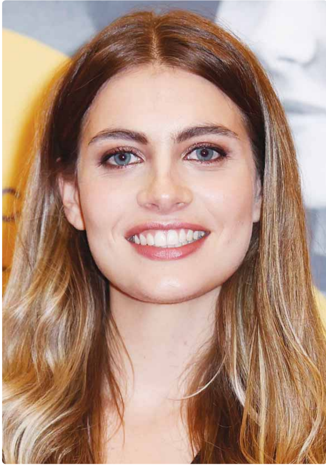
الممثلة الإيطالية سفيغا ماريان خلال حضورها مهرجان روما السينمائي

لا بد من موقف حازم رسمي يلقي ما اسموه ساحة الإرادة، ويعيد الأمور إلى طريقها الصحيح، من خلال جمعيات النفع العام، وبإشراف الدولة لاستعادة هيبتها... زين.