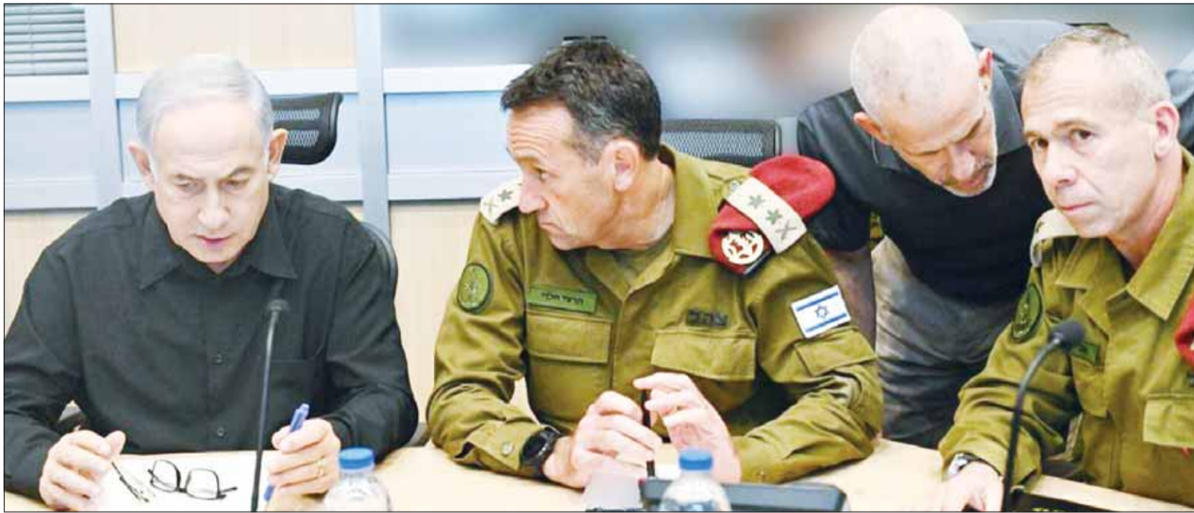
رئيس وزراء حكومة الاحتلال بنيامين نتانياهو يجتمع مع كبار القادة العسكريين لتقييم الحرب على غزة

دائم ورفض سياسة التجويع الإسرائيلية، معتبرة إدخال كميات محدودة جداً من المساعدات إلى قطاع غزة خلال اليومين الماضيين، لا يغطي الحاجات المتزايدة في ظل العدوان الهجمي والمحصار المتواصل، محذرة من تداعيات ما تشهده غزة من نقص حاد في المواد الغذائية والدواء والوقود الآخذ في النفاذ من المستشفيات كافة. من جانبها، أدانت الرئاسة الفلسطينية استمرار العدوان الإسرائيلي، مضيفة أن ما يجري في غزة يتوافق مع استمرار عمليات الاقتحام والقتل في الضفة الغربية، التي أسفرت عن مقتل 95 فلسطينياً، وقال الناطق نبيل أبو ردينة "حذرنا مراراً من الاستفزازات الإسرائيلية في القدس واقتحامات المسجد الأقصى وغياب الدور الأميركي الضائع على إسرائيل"، مؤكداً ضرورة إيجاد أفق سياسي حتى لا تتفجر المنطقة بأسرها. بدورها، أعربت دول مجلس التعاون الخليجي عن أسفها لعدم تمكن مجلس الأمن من اعتماد قرار متوافق عليه يضع حداً للتداعيات والانتهاكات الفظيرة للأوضاع في غزة، معلنة تقديم 100 مليون دولار لغزة، مؤكداً في رسالة إلى رئيس مجلس الأمن