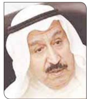
د. يحيى السمييط

السمييط: المواطن يمكن أن يتقبل السكن في شقة إذا كان التصميم جيداً