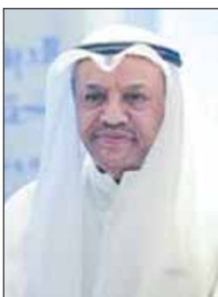
السفير جاسم المبارك

وأوضح المبارك في كلمة ألقاها خلال حفل إطلاق المبادرة إن هذه الخطوة تستهدف تحسين سبل العيش الكريم، واحترام حقوق النزلاء، وتعزيز الإدارة العادلة للمنشآت الإصلاحية، باعتبار تلك المنشآت بمثابة مرافق إعادة تأهيلهم، تطبق من خلالها القواعد الأساسية لمعاملة السجناء التي اعتمدها الأمم المتحدة عام 1955. وأشار إلى أن الديوان الوطني لحقوق الإنسان منذ إنشائه دأب