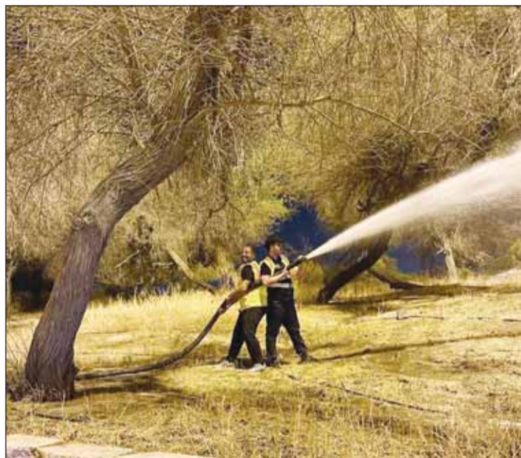
فريق الصيانة يروي المزروعات المهملة

الموسوي: استراتيجية جديدة بروية واضحة لتلافي جميع المعوقات