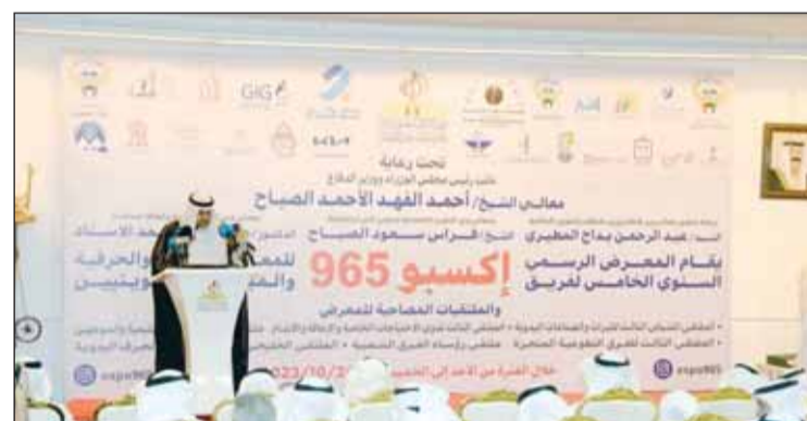
وكيل وزارة الدفاع يلقيه كلمة الافتتاح بالإنابة عن الشيخ أحمد الفهد

وأشار إلى أن مثل هذه الفعاليات التراثية مدعاة فخر ويجب الحفاظ عليها في دأمة للخطوات المبدولة في شأن الحفاظ على