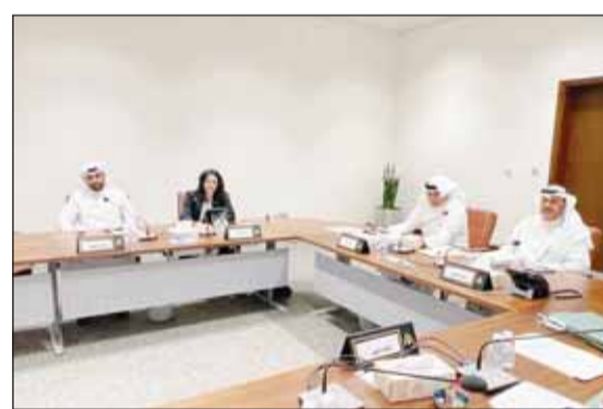
جانب من اجتماع لجنة محافظة الاحمدية في المجلس البلدي

والشؤون الإسلامية تخصيص موقع مسجد ومواقف سيارات بمنطقة مبارك الكبير ضمن القطعة رقم 7، وعلى مشروع القطع التنظيمية لأجزاء العقارات غير المنظمة بالقطعة رقم 9 منطقة الفتيطيس ضمن محافظة مبارك الكبير. إلى ذلك، حفظت اللجنة طلب وزارة الداخلية استحداث مدخل ومخرج للقطعة رقم 1 بمنطقة صباح السالم من الطريق رقم 3 الفاصل بين القطعتين 1 و4.