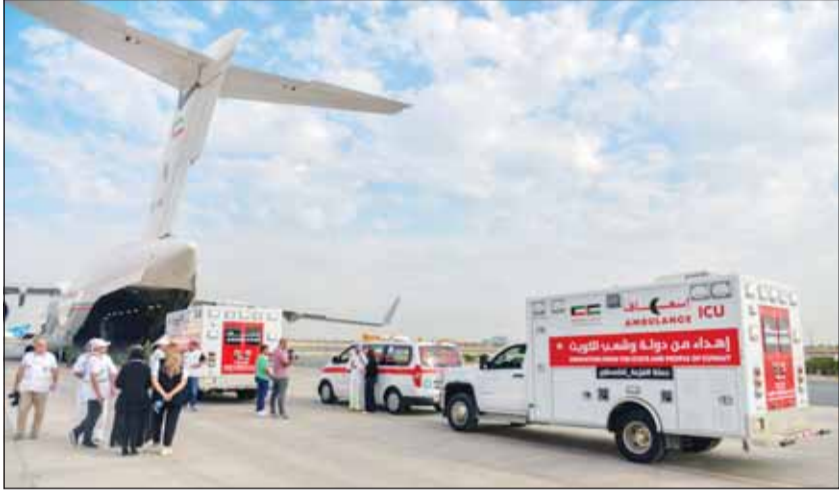
جانب من عملية تحميل سيارات الإسعاف علمت متن الطائرة

الحساوي: مستشفيات غزة تضررت كثيراً وهي بحاجة للدواء والأجهزة الطبية والوقود