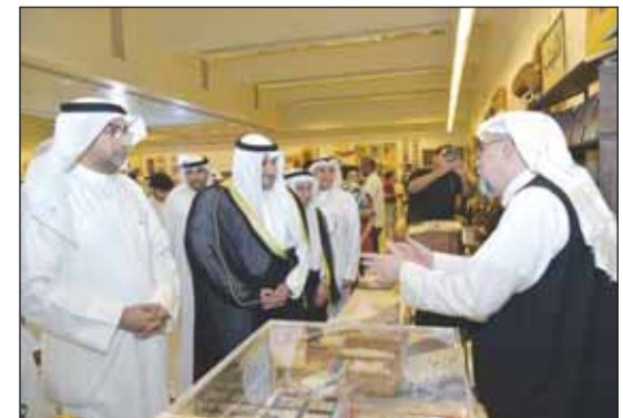
... وفي حديث مع القائمين علمه أحد أجنحة المعرض