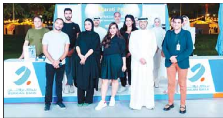
فريق برقان في المعرض

لضمان ترسيخ علاقة مستدامة مع المجتمع بهدف الارتقاء بالاقتصاد الوطني. ومن خلال جناحه الخاص في المعرض، حرص البنك على ضمان أقصى استفادة للزوار ورؤاد الأعمال على حد سواء، حيث عمل موظفوه على التعريف بكافة التفاصيل المتعلقة بالخدمات والمنتجات التي يوفرها للعملاء والمصممة لتواكب تطلعاتهم بأسلوب سهل وآمن وتوفر الراحة لهم عند إنجاز معاملاتهم الشخصية والتجارية. أما بالنسبة لرؤاد الأعمال، فقد ركز موظفو البنك على الحلول المخصصة لهم، على غرار منصة "تجاري"، إضافة إلى أجهزة نقاط البيع، وبوابة الدفع الإلكتروني، كما نظم البنك مجموعة من المسابقات وقدم