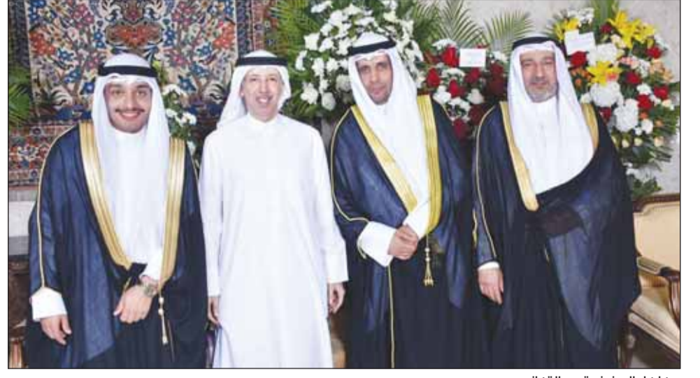
مهلهل المصنف قدم التهاني