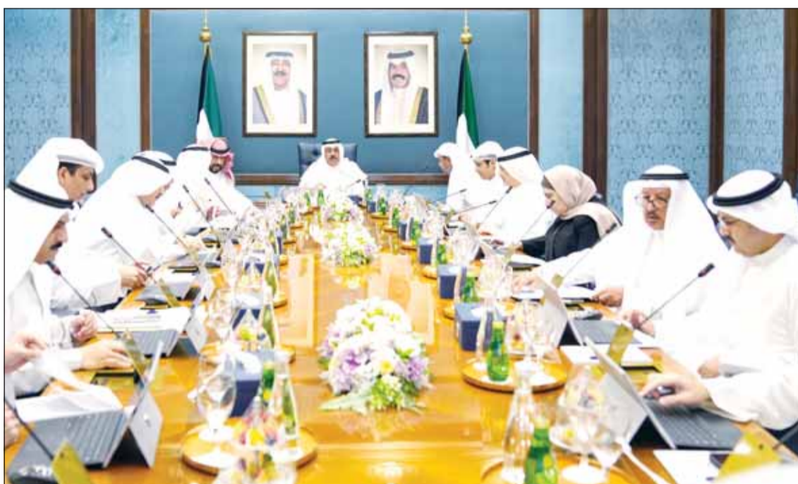
سمو الشيخ أحمد النواف مترشحاً لاجتماع مجلس الوزراء الأسبوعي

استمرار صرف دعم العمالة للمريض ومرافقه في "الخاص" أثناء العلاج بالخارج