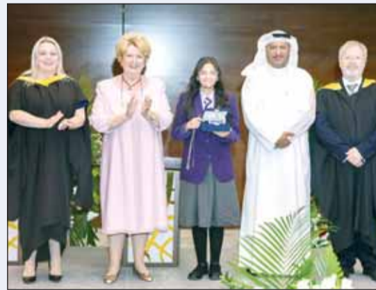
تكريم طالبة فائزة بالجائزة الخاصة