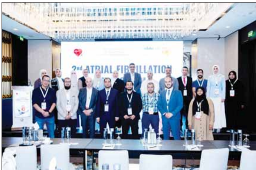
أطباء المركز المشاركون بالنقطة

المصابون بالسمنة والسكر والجلطات الأكثر عرضة للإصابة بالمرض