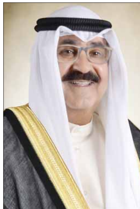
سمو ولي العهد الشيخ مشعل الأحمد

استقبل سمو ولي العهد الشيخ مشعل الأحمد بقصر بيان أمس، سمو رئيس مجلس الوزراء الشيخ أحمد النواف. كما استقبل سموه رئيس المجلس الأعلى للقضاء ورئيس محكمة التمييز المستشار د. عادل بورسلي. واستقبل سموه نائب رئيس مجلس الوزراء وزير الدفاع الشيخ أحمد الفهد. من جهة أخرى، يغادر سمو ولي العهد الشيخ مشعل الأحمد والوفد الرسمي المرافق لسموه أرض الوطن اليوم الثلاثاء متوجهين إلى المملكة المتحدة الصديقة وذلك تلبية للدعوة الرسمية من الملك تشارلز الثالث ملك المملكة المتحدة لبريطانيا العظمى وإيرلندا الشمالية الصديقة.