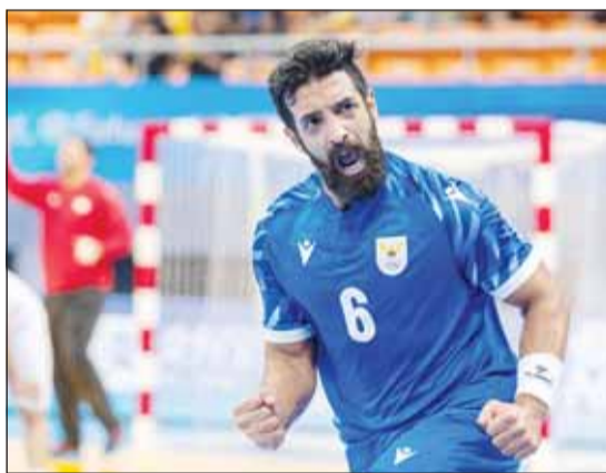
أزرق اليد يبحث عن اول انتصار اليوم