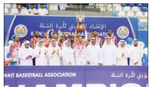
تنويه "الكويت" بكأس السوبر لكرة السلة

توج نادي الكويت بطلا لكأس السوبر المحلي لكرة السلة للمرة السابعة بتغلبه على نظيره القادسية بنتيجة (82-113) في نهائي النسخة الثامنة الذي أقيم مساء اول من امس ليؤكد هيمنته التاريخية على البطولة.