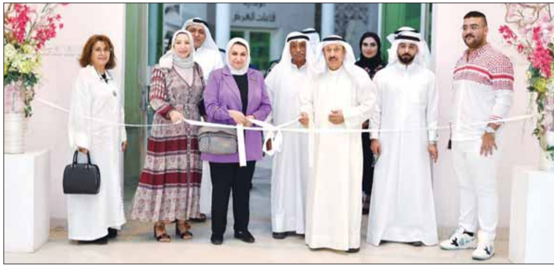
جانب من افتتاح المعرض