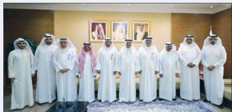
أعضاء الوفد القضائي الكويتي خلال زيارة نظرائهم في البحرين

أكد وكيل محكمة التمييز المستشار إسحاق الكندري أمس أهمية تبادل الزيارات والخبرات والمعلومات بين القطاعات المعنية بدول مجلس التعاون الخليجي لما لها من انعكاسات "إيجابية" في توسيع آفاق التعاون المشترك.