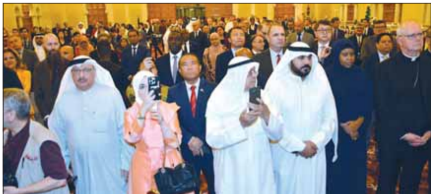
حنشد ديبلوماسي وشعبي مهنتاً بالمناسبة