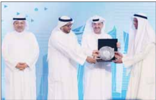
الحسيني والسلمان يكرمان الخشتي علمه دعم زين

للعام السادس على التوالي، أعلنت زين عن رعايتها لمُنعدى الحكومة الإلكترونية، والذي أتى هذا العام بنسخته العاشرة تحت شعار "مستقبل الحوسبة السحابية بدولة الكويت"، ونظمه اتحاد المكاتب الهندسية والدور الاستشارية الكويتية بالتعاون مع الجهاز المركزي لتكنولوجيا المعلومات تحت رعاية وزير الدولة لشؤون البلدية ووزير الدولة لشؤون الاتصالات فهد الشعله.