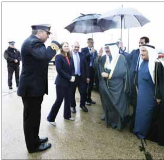
سمو ولي العهد حقيماً مُؤتبعه لدمه مُفادرتة المملكة المتحدة

وقال سموه في برقية شكر بعث بها إلى الملك تشارلز الثالث ملك المملكة المتحدة لبريطانيا العظمى وإيرلندا الشمالية الصديقة، "أود في ختام زيارتي الرسمية لبلدكم الصديق أن أتوجه إليكم بأعمق مشاعر الشكر وأصدق معاني الامتنان لما لاقيته وأعضاء الوفد المرافق من لندن جلالكم من استقبال ودي وحفاوة بالغة طوال فترة زيارتنا المثمرة". وأضاف: إذ أؤكد سعادتي بإتاحة الفرصة للقاء بجلالكم قاننا في دولة الكويت نعلّق أهمية كبيرة على تعزيز روابط الصداقة التاريخية والستراتيجية وتطوير سبل التعاون المتميزة القائمة بين بلدينا الصديقين التي تمتد جذورها لقراءة مئة وخمسة وعشرين عاماً، مريصين على الارتقاء بها في جميع المجالات الحيوية المهمة إلى آفاق أوسع وأرحب بما يحقق أهداف بلدينا المرجوة وتطلعات شعبيهما المنشودة، مقدرين عالياً