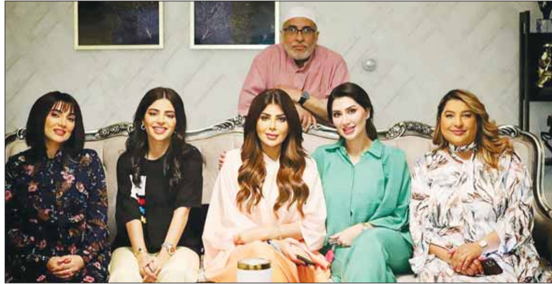
كواليس مميزة في تصوير مسلسل "خواتي غناتي"