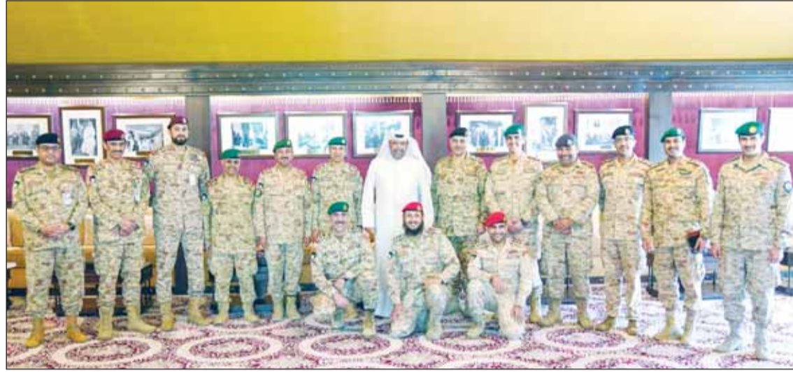
الشيخ أحمد الفهد متوسطاً قيادات القوات العسكرية الكويتية في المملكة

مشاركتنا العسكرية في السعودية تعزز مفهوم العمل الجماعي المشترك بين قوات التعاون المسلحة