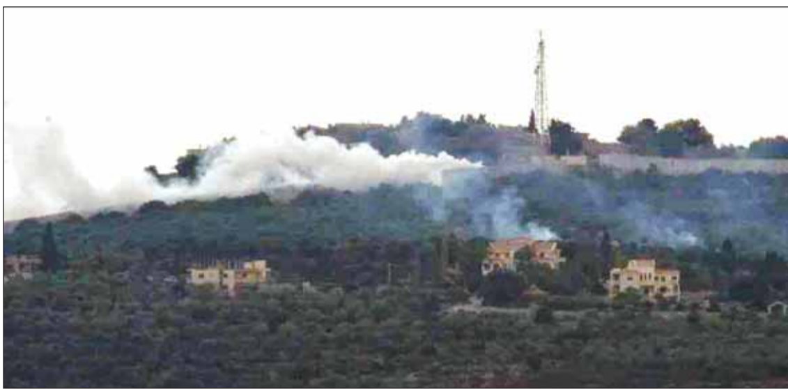
الدخان يتصاعد فوق المباني في قرية مارون الراس بجنوب لبنان

وأشار إلى أن أطراف الممانعة هم علّة اللعل وقد دمروا كل مقومات الصمود التي كان يمتدّع بها لبنان وعطلوا انتخابات الرئاسة ويعتجبون لإفراغ المؤسسات كافة عبر تعطيل التعيينات ومن ثم يأخذون البلاد إلى حرب من دون تأمين أدنى متطلبات المواجهة، وفي المقابل، نرى عدم قدرة المواطن اللبناني على الصمود أبداً ولا سيّماً أنه في الوقت الراهن ويعيد من الحرب يعاني على كل الأصعدة إذ أنه بحاجة ماسة للمساعدة في تأمين الدواء والاستشفاء والخبز والوقود والكهرباء والمياه وما إلى هنالك من متطلبات الحياة اليوميّة والأساسيّة". ودعا النائب أشرف ريفي، اللبنانيين، إلى تحييد لبنان عسكرياً عن أي خراب أو دمار والالتفات حول لبنان معتبراً من غير المقبول أن تضع الدولة اللبنانية القرار في أيدي الميليشيا وإلى التطبيق الشامل للقرار1701 وتحجيب لبنان أن يكون ساحة للاستعمار الإقليمي. وفيما بدأ العديد من السفارات العربية والأجنبية بإبلاغ رعاياها، تزامناً مع إعلان عدد من شركات الطيران وقف رحلاتها إلى بيروت، التقى وزير الصحة في حكومة تصريف الأعمال فراس الأبيض، المنسقة الخاصة للأمم المتحدة في لبنان يوانا فرونتسكا وعرض معها الأوضاع العامة ووضع القطاع الصحي. وجال الأبيض مع فرونتسكا في غرفة عمليات الطوارئ الصحية في الوزارة، حيث اطّلعها على آلية العمل فيها وخطة الوزارة تحسباً لاي تطوّر على الساحة اللبنانية.