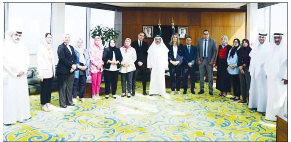
وزير العدل فالح الرقبة متوسماً الوفد القضائي الجزائري

وصفت الشّيخة جواهر هذه الانتهاكات "بأبشع أنواع جرائم الحرب والجرائم ضد الإنسانية" مؤكدة أن التهجير القسري والفصل العنصري وجب وصول المساعدات الإنسانية تعد انتهاكا جسيما للقانون الدولي الإنساني.