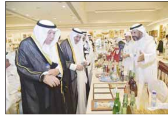
محافظ مبارك الكبير محمود بوشهري في جولة بالمعرض

أكد محافظ مبارك الكبير محمود بوشهري أهمية دعم الحرفيين والجهود الرامية للحفاظ على التراث وحرف الأبناء والأجداد، مشيداً بمشاركة دول مجلس التعاون في معرض فريق "اكسبو965".