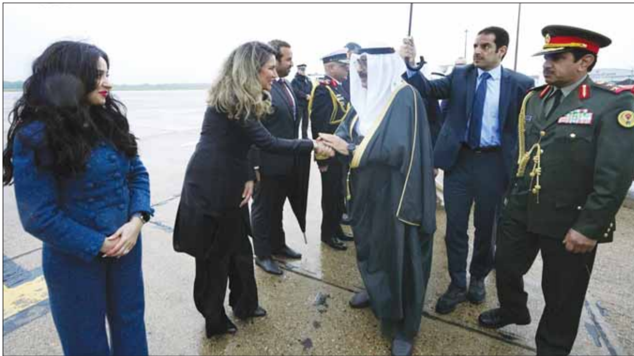
سمو ولي العهد الشيخ مشعل الأحمد مصافحاً أركان السفارة ورؤساء المكاتب المُملّحة في لندن

ملتزمون بمواصلة العمل من أجل شراكة بريطانية-كويتية أكثر قوة نُعلّق أهمية كبيرة على تعزيز روابط الصداقة التي تمتد لقراءة 125 عاماً