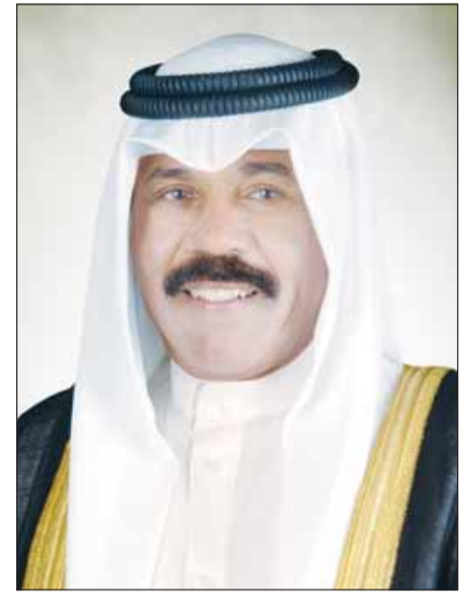
سمو أمير البلاد الشيخ نواف الأحمد

بعث سمو أمير البلاد الشيخ نواف الأحمد، ببرقية تعزية إلى الرئيس جوزيف آر بايدين رئيس الولايات المتحدة الأمريكية الصديقة، أعرب فيها سموه عن خالص تعازيه وصادق مواساته بضحايا حادث إطلاق النار الذي وقع في مدينة ولستون بولاية مين وأسفر عن سقوط العديد من الضحايا والمصابين، راجياً سموه للضحايا الرحمة وللمصابين سرعة الشفاء والعافية. كما بعث سمو أمير البلاد ببرقية تهنئة إلى الرئيس الدكتور ألكسندر فان دير بيلين رئيس جمهورية النمسا الصديقة، عبر فيها سموه عن خالص تهنائه بمناسبة العيد الوطني لبلاده، متمنياً سموه له بموفق الصحة والعافية ولجمهورية النمسا وشعبها الصديق كل التقدم والازدهار.