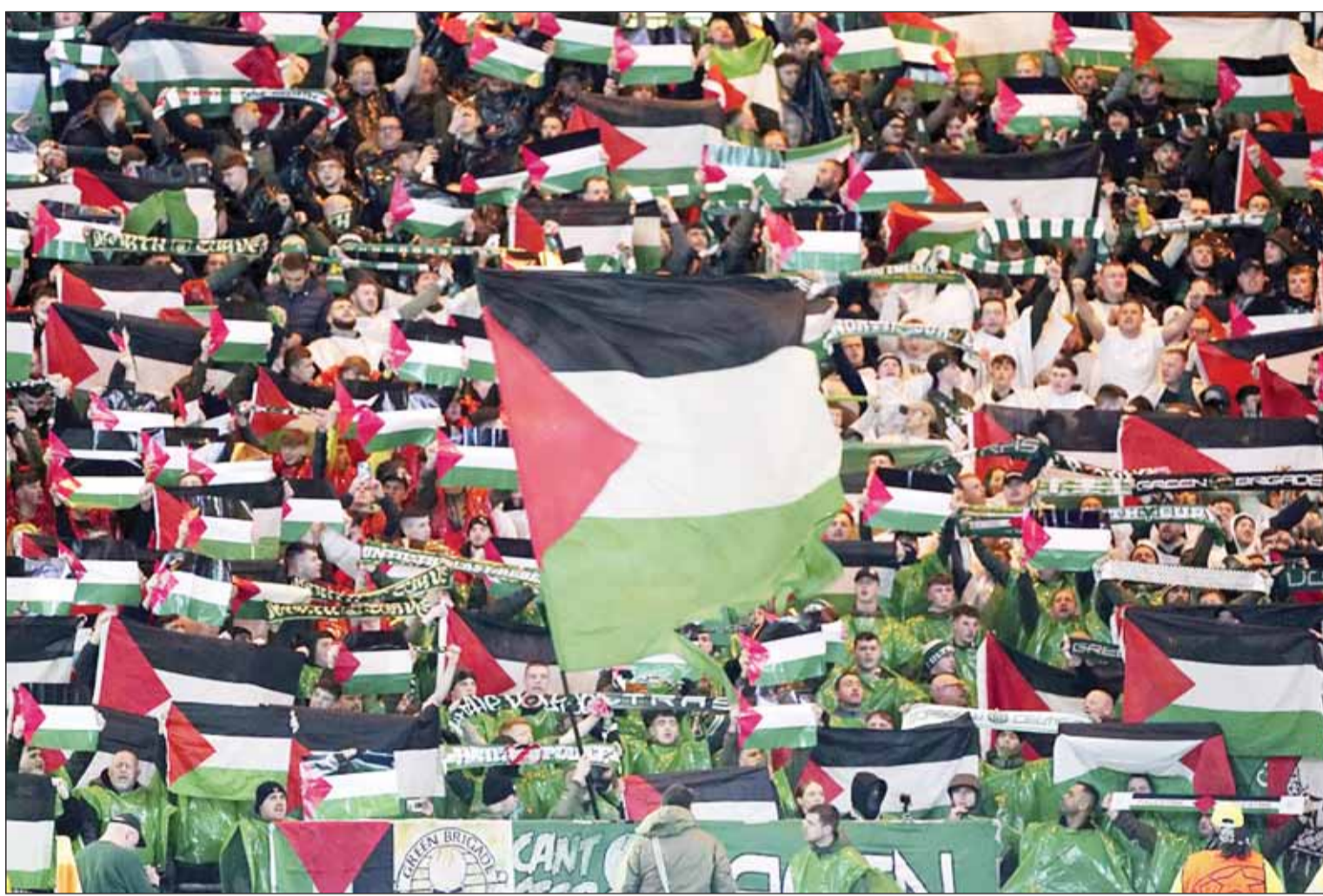
جماهير سلتيك الإسكتلندي ترفع العلم الفلسطيني في لقاء أتلتيكو مدريد بدوري الأبطال

أما أتلتيكو مدريد الإسباني، فقد صدارة المجموعة الخامسة، بتعادله إيجابياً خارج قواعده 2-2 أمام سيلتك الإسكتلندي. وحصد "الأتلتي" التعادل الثاني له في المجموعة في 3 مباريات، مقابل فوز وحيد، ليتنازل عن صدارة المجموعة ليفينورد هولندي (6 نقاط).