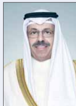
سمو الشيخ أحمد النواف

بعث سمو رئيس مجلس الوزراء الشيخ أحمد النواف ببرقية تعزية إلى الرئيس جوزيف آر بايدين رئيس الولايات المتحدة الأمريكية الصديقة، ضمنها سموه خالص تعازيه وصادق مواساته بضحايا حادث إطلاق النار الذي وقع في مدينة ولستون بولاية مين. كما بعث سموه ببرقية تهنئة إلى الرئيس الدكتور ألكسندر فان دير بيلين رئيس جمهورية النمسا الصديقة بمناسبة العيد الوطني لبلاده.