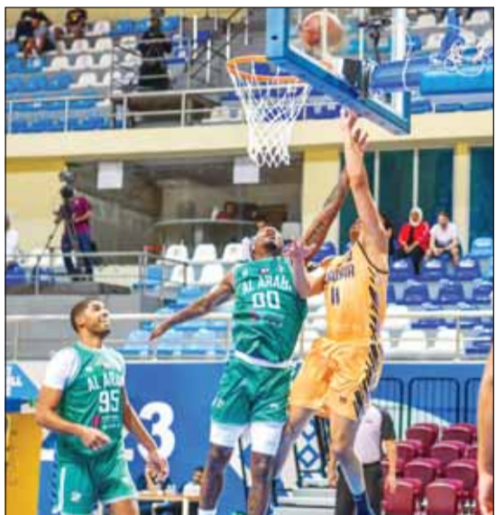
الأصفر هزم الأخضر

تغلب ناديا القادسية والصلبيخات على نظيريهما العربي واليرموك اول من أمس في انطلاق منافسات بطولة الدوري الكويتي العام لكرة السلة الـ61 موسم (2023 - 2024) والتي تشهد مشاركة 9 أندية.