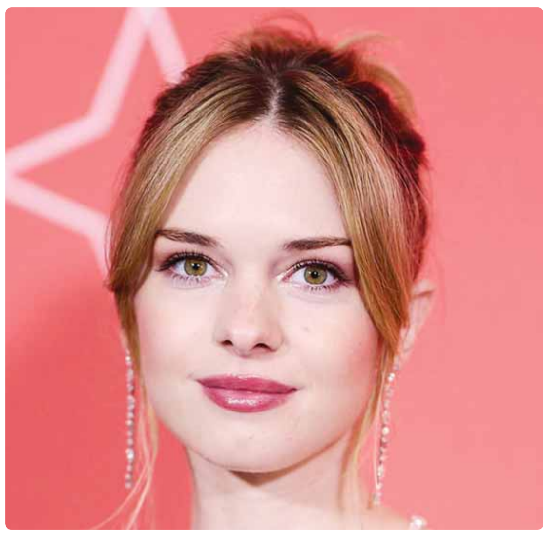
الممثلة الإسبانية ستيليا ديل كارمن بانديراس خلال تصوير "RABAT Magic Cosmos" في مدريد

وفقاً لرأي المتخصصين بعلم الاجتماع، فإن الكوارث تستخرج أفضل ما لدى الإنسان من مشاعر طيبة، ويعزو أحد المفكرين الأجانب سبب حدوث الكوارث أن الله يريدنا ان نتعاطف ونترامم فيما بيننا، فلا يجمع الناس بعضهم بعضاً، ويتعاطفون إلا بعد ظهور الكارثة.