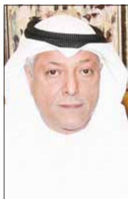
عبد الله الصبيح

وأشار البيان إلى أن عائد هذا القرض سيتم استخدامه لتمويل المشاريع الاجتماعية الموهلة بموجب إطار التمويل المستدام في مصر" والذي تم الإعلان عنه في قمة المناخ بشرم الشيخ في نوفمبر 2022، بما في ذلك نفقات ميزانية الصحة والتعليم المتوافقة مع أهداف الأمم المتحدة للتنمية المستدامة في مجال "الصحة الجيدة والرفاهية" و "التعليم الجيد".