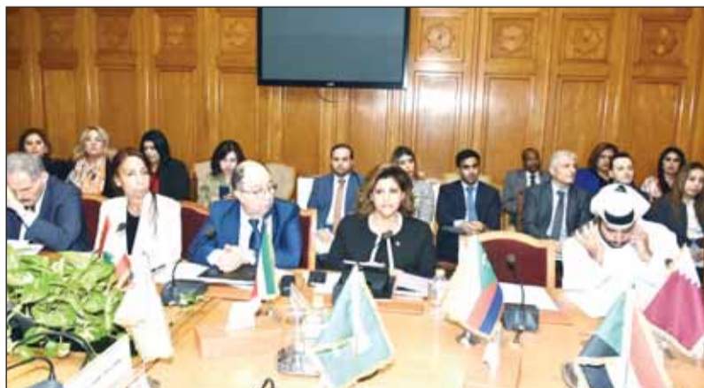
السفيرة الشّيخة جواهر إبراهيم الدعيج خلال الاجتماع الطارئ

ولفتت إلى أن قوات الاحتلال الاسرائيلي تتفنن في هجماتها وترتكب جرائم دولية حرمتها القوانين والمواثيق الدولية بما فيها قتلون الحرب، فالعدوان والإبادة الجماعية وجريمة الحرب والجرائم ضد الإنسانية جميعها ماثلة أمامنا في غزة. وأشارت إلى أن كل هذا يحدث أمام صمت رهيب من دعاة حقوق الإنسان والإنسانية ومن كانوا يدعون أنفسهم بالمدافعين عن حقوق الإنسان فلا تخنديد ولا شجب ولا استنكار فبدا واضحا وبالأدلة القاطعة مدى تسييس حقوق الإنسان والكيل بمكيالين والانتقائية في توجيه التهم.