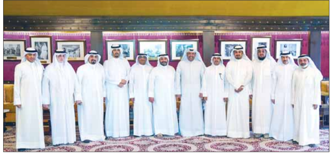
الوزير الشيخ أحمد الفهد والسفير الشيخ صباح الناصر يتوسطان أركان السفارة في الرياض

نعمه الأمن والأمان والرفعة والازدهار، وللعلاقات الأخوية والتاريخية بين البلدين الشقيقين المزيد من التطور والنماء. وكان في وداعه بمطار الملك خالد الدولي نائب وزير الدفاع السعودي الأمير عبدالرحمن بن محمد، وأشارت إلى أن نائب رئيس مجلس الوزراء ووزير الدفاع الشيخ أحمد الفهد، والوفد الرسمي المرافق له، عادوا إلى البلاد ظهر أمس الخميس.