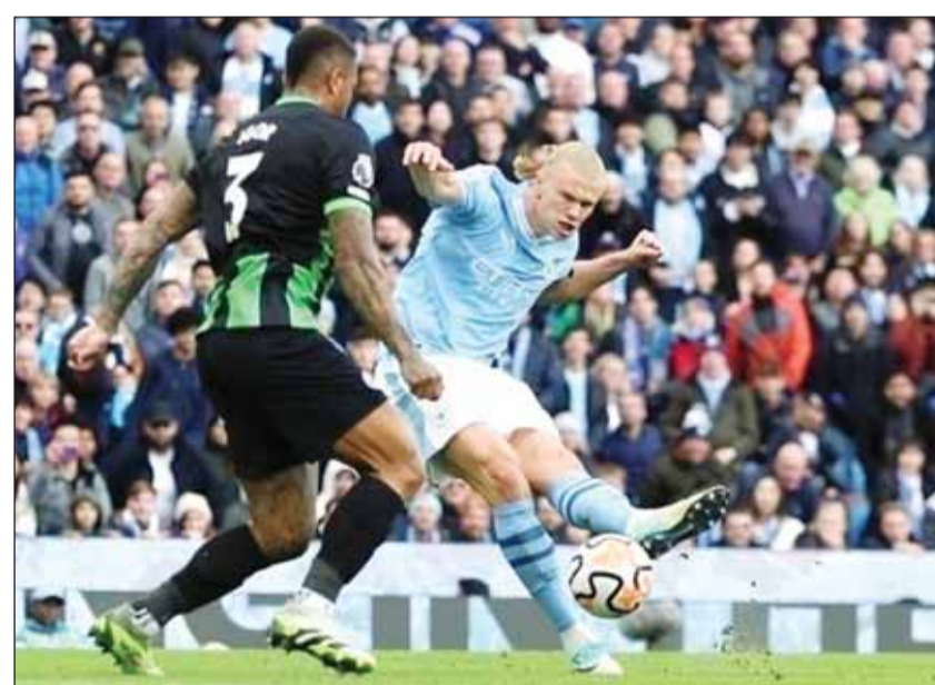
هالاند يناقض ميسي على الكرة الذهبية

الأبطال. وبلغ الرصيد الإجمالي لهالاند مع مانشستر سيتي في الموسم الماضي إلى 52 هدفاً في 53 مباراة بمختلف البطولات، كما يواصل اللاعب سجله المميز مع الفريق في الموسم الحالي، والذي أحرز فيه حتى الآن 9 أهداف وصنع هدفين في أول 13 مباراة بمختلف البطولات. وفي المقابل، توج ميسي في الموسم الماضي مع فريقه السابق باريس سان جيرمان بلقب الدوري الفرنسي للموسم الثاني على التوالي، ولكن فرص ميسي في المنافسة على الجائزة ستمتد في المقام الأول على إنجاز المونديال مع المنتخب الأرجنتيني خاصة أنه لعب دوراً بارزاً في عودة اللقب العالمي لمنتخب بلاده بعد غياب دام 36 عاماً.