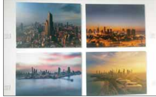
من الصور الفوتوغرافية