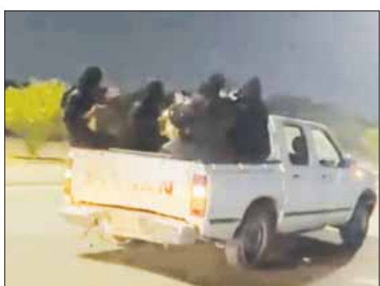
النساء يضرين الدفوف في صندوق الـ "وانيت"

الرياض- وكالات، أثار مقطع لفرقة نسائية الجدل بين السعوديين على مواقع التواصل الاجتماعي خلال الساعات الماضية.