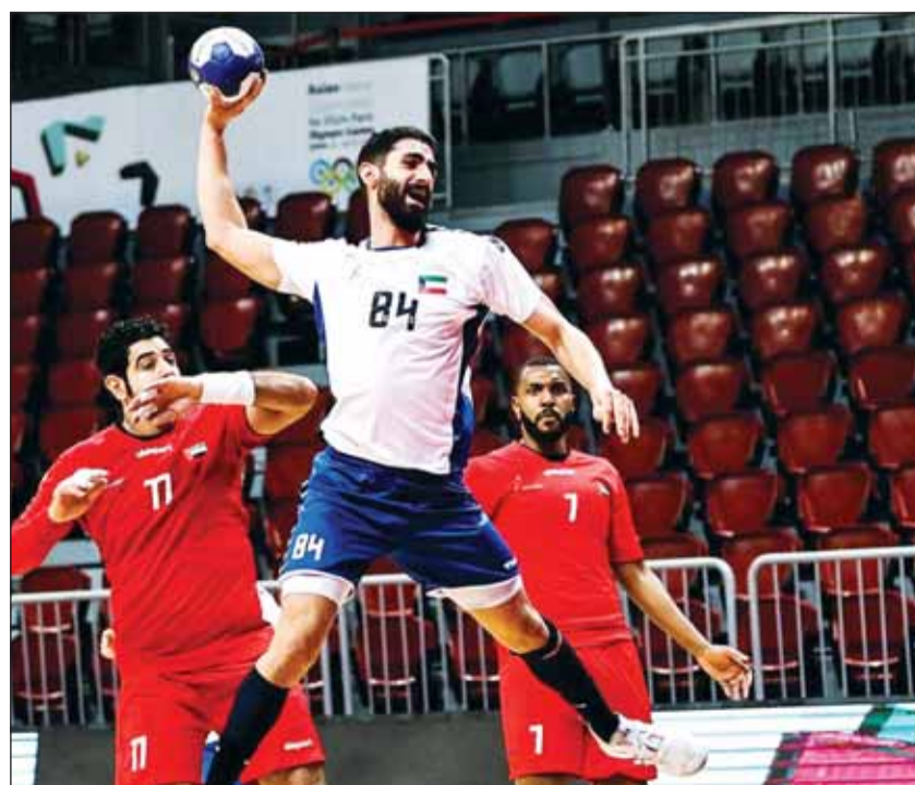
دشنته ينجبيل بمراهمة الإمارات

فاز بها على الأهلي القطري بنتيجة 35-26. والتشخيص الأولي للإصابة، أوضح أن فاسيلي يعاني من إصابة بالانكسر، وهو ما يوضح بشكل جلي بعد إجراء الأشعة، ومن المتوقع أن يغيب اللاعب لمدة تتراوح بين أسبوعين إلى ثلاثة.