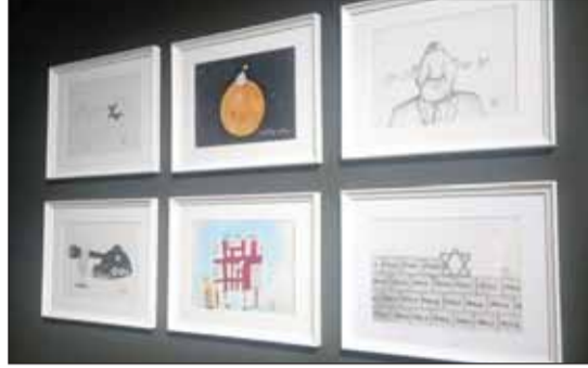
من معرض الفن الفلسطيني