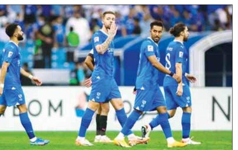
الهلال يواجه الأهلي ببطوح الفوز

وبالرغم من إقامة مونديال 2022 في أواخر العام الماضي، دخلت البطولة ضمن عناصر التقييم للنسخة الجديدة من الكرة الذهبية، كونها أقيمت للمرة الأولى في منتصف الموسم الكروي من ناحية، كما أنها لم تكن ضمن عناصر التقييم للنسخة الماضية من الجائزة. وضمت قائمة المرشحين للجائزة هذا العام 30 لاعباً من بينهم الفرنسي كريم بنزيمة