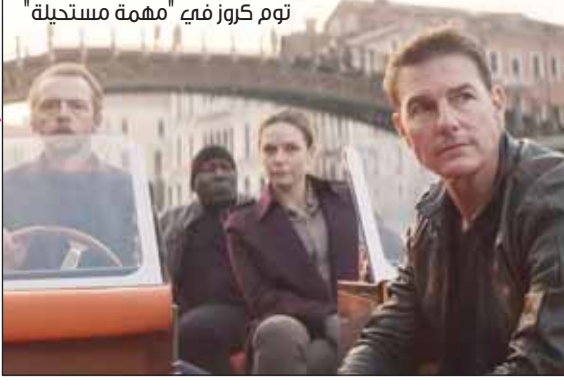
توم كروز في "مهمة مستحيلة"

قررت شركة "بارامونت بيكتشرز"، تأجيل الجزء الثامن من سلسلة أفلام "Mission: Impossible" لمدة عام، نظرا لإضراب الكتاب والممثلين عن العمل شهورا عدة، ورغم انتهاء إضراب الكتاب، مازال إضراب الممثلين مستمرا سعيا للإفلاق منصف مع الاستديوهات الكبرى، لذا لم يتمكن الممثلون من العودة لاستكمال فيلم