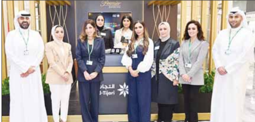
فريق البنك التجاري خلال تواجده في مجمع العاصمة

والتعامل مع البنوك. والبنك التجاري الكويتي يحرص دائماً على توفير أفضل الخدمات والخدمات المصرفية والخصومات مع شركائهم التجاريين بما يحقق الاستفادة لعملائه على مدار العام، حيث يمكن للعملاء الاطلاع على جميع المزايا التي يوفرها البنك من خلال صفحة البنك على الإنترنت .