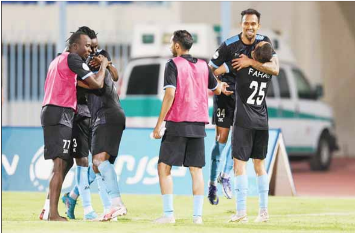
السالمية يبحث عن فوزه الثاني تواليًا

استعداد لاعبيه الثقة، واحراز ثاني فوز بالمسابقة. تعويض الإخفاق وفي لقاء الغد، يسعى العربي الثنائي (11 نقطة) إلى تعويض إخفاقه في كأس