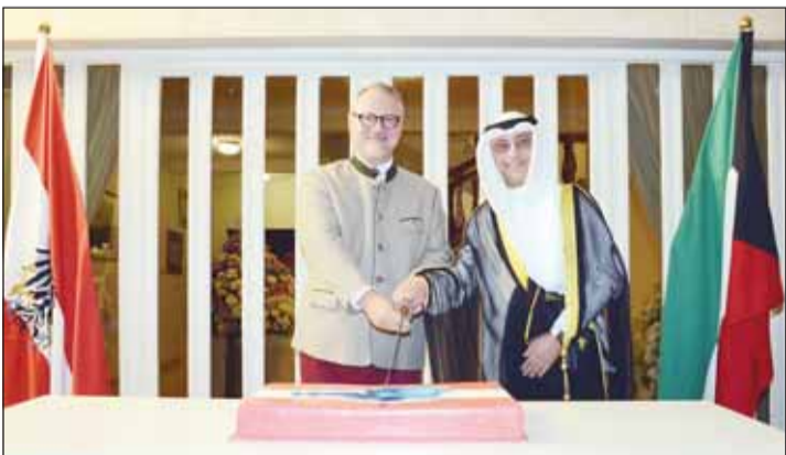
السفير نبيل دخيل وسفير النمسا يقضعان قالب الحلوى