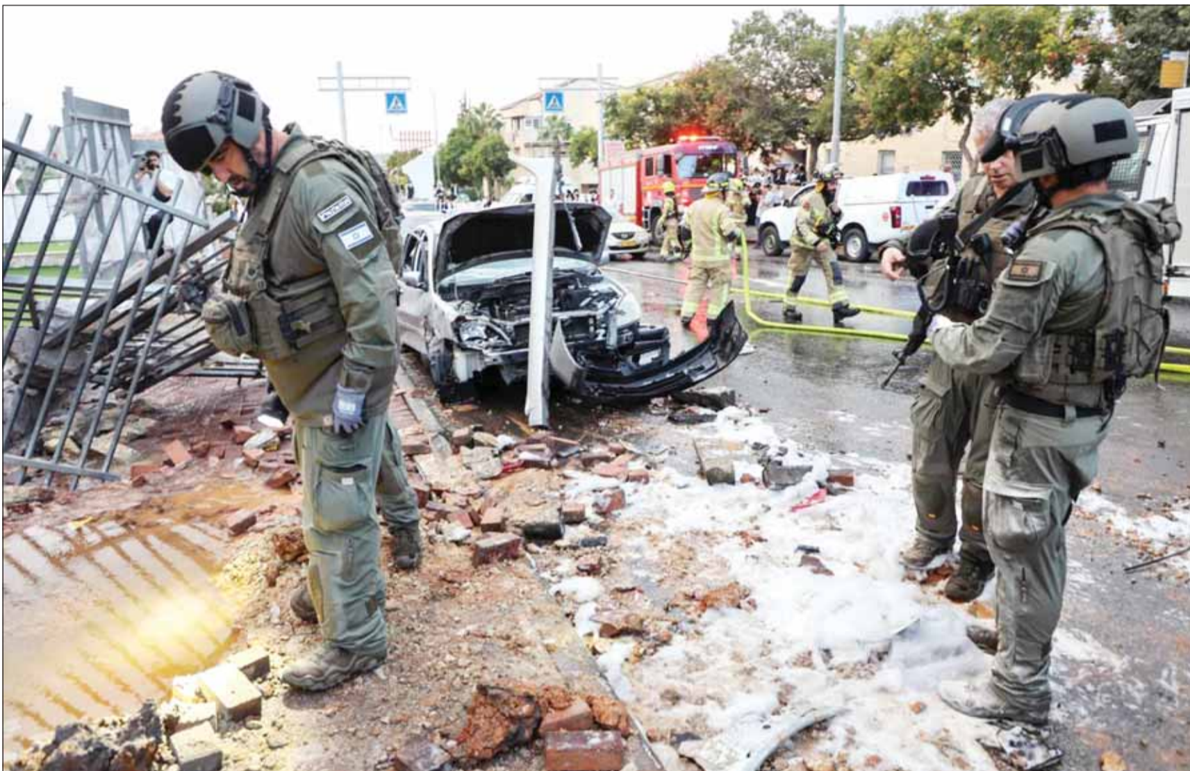
شرطة الاحتلال الإسرائيلي تتفقد موقع هجوم صاروخي من غزة على بلدة بمسوطنة غوش عتصيون

عشرات الشهداء والجرحى في سلسلة غارات هي الأعنف وقصف محيط مستشفى الشفاء والإندونيسي