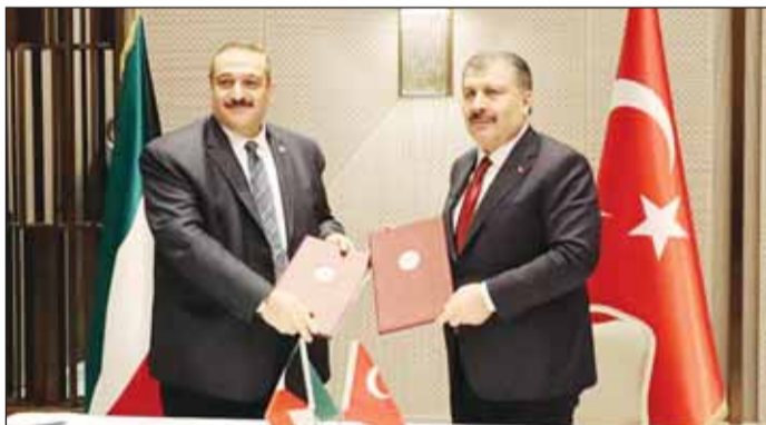
وزير الصحة د. أحمد العوضي ونظيره التركي يتبادلان مذكرة التفاهم

■ أكد وزير الصحة د. أحمد العوضي أن تركيا والكويت تشتركان في علاقة وثيقة ومثمرة على مستويات عدة، منها المجال الصحي. جاء ذلك في كلمة ألقاها خلال رئاسته وفد الكويت في أعمال المؤتمر الطبي التركي التاسع في مدينة إسطنبول، بناء على دعوة من نظيره التركي، بمشاركة الوكيل المساعد لشؤون الخدمات الصحية الخارجية، والوكيل المساعد لشؤون الأدوية والتجهيزات الطبية. وذكرت "الصحة" في بيان لها أمس أن المؤتمر الذي أقيم على مدار ثلاثة أيام، وشارك فيه نحو 14 وزير صحة من مختلف البلدان، ناقش عددا من الدراسات حول استخدام "الذكاء الاصطناعي في المجال الصحي"، كما تفلله الكثير من اللقاءات الثنائية بين الوفود المشاركة. وأفادت أن الوزير العوضي التقى على هامش المؤتمر وزير الصحة التركي فخر الدين خوجه، مؤكدا خلال اللقاء عمق العلاقات بين البلدين والشعبين الشقيقين. وذكرت أن الاجتماع ناقش اتفاق التعاون الصحي الواسع بين البلدين وسبل تعزيزه وتطويره، مشيرة إلى توقيع مذكرة تفاهم تعرف بـ"خطاب النوايا" Letter of Intent، استندت على اتفاقية التعاون في مجال الصحة بين حكومتي البلدين، الموقعة في 12 فبراير 2008. وأوضحت أن مجالات تعزيز التعاون والتنسيق بين الجانبين، وفق اتفاقية التعاون، تتضمن عددا من أوجه التعاون منها: تبادل المعلومات والخبرات بشأن تعزيز النظم الصحية، والتعاون بمجال خدمات الرعاية الصحية في حالات الطوارئ وإدارة الكوارث،