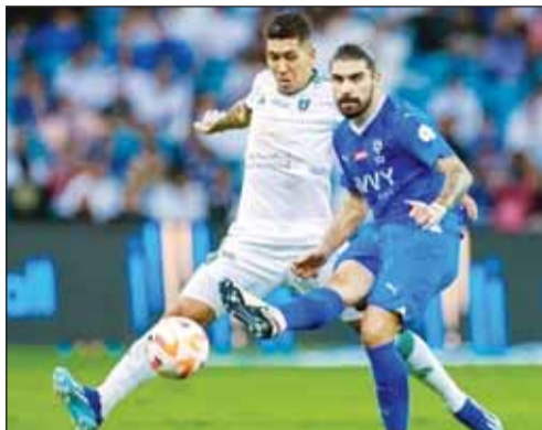
الهلال يتصدر دوري روشن

إلى الدرجة الأدنى التي قضى فيها موسماً واحداً. وبهذا الفوز، رفع الهلال رصيده إلى 29 نقطة في صدارة الترتيب، فيما تجهد رصيد الأهلي عند 22 نقطة في المركز الخامس.