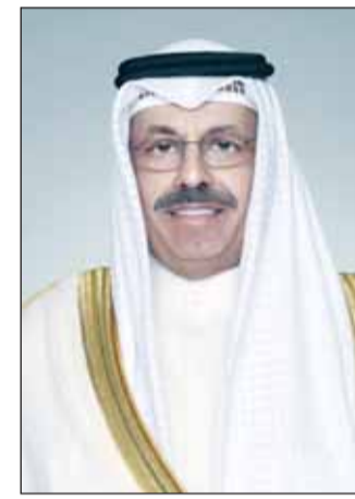
سمو الشيخ أحمد النواف

■ أكد وزير الصحة د. أحمد العوضي أن تركيا والكويت تشتركان في علاقة وثيقة ومثمرة على مستويات عدة، منها المجال الصحي. جاء ذلك في كلمة ألقاها خلال رئاسته وفد الكويت في أعمال المؤتمر الطبي التركي التاسع في مدينة إسطنبول، بناء على دعوة من نظيره التركي، بمشاركة الوكيل المساعد لشؤون الخدمات الصحية الخارجية، والوكيل المساعد لشؤون الأدوية والتجهيزات الطبية. وذكرت "الصحة" في بيان لها أمس أن المؤتمر الذي أقيم على مدار ثلاثة أيام، وشارك فيه نحو 14 وزير صحة من مختلف البلدان، ناقش عددا من الدراسات حول استخدام "الذكاء الاصطناعي في المجال الصحي"، كما تفلله الكثير من اللقاءات الثنائية بين الوفود المشاركة. وأفادت أن الوزير العوضي التقى على هامش المؤتمر وزير الصحة التركي فخر الدين خوجه، مؤكدا خلال اللقاء عمق العلاقات بين البلدين والشعبين الشقيقين. وذكرت أن الاجتماع ناقش اتفاق التعاون الصحي الواسع بين البلدين وسبل تعزيزه وتطويره، مشيرة إلى توقيع مذكرة تفاهم تعرف بـ"خطاب النوايا" Letter of Intent، استندت على اتفاقية التعاون في مجال الصحة بين حكومتي البلدين، الموقعة في 12 فبراير 2008. وأوضحت أن مجالات تعزيز التعاون والتنسيق بين الجانبين، وفق اتفاقية التعاون، تتضمن عددا من أوجه التعاون منها: تبادل المعلومات والخبرات بشأن تعزيز النظم الصحية، والتعاون بمجال خدمات الرعاية الصحية في حالات الطوارئ وإدارة الكوارث،