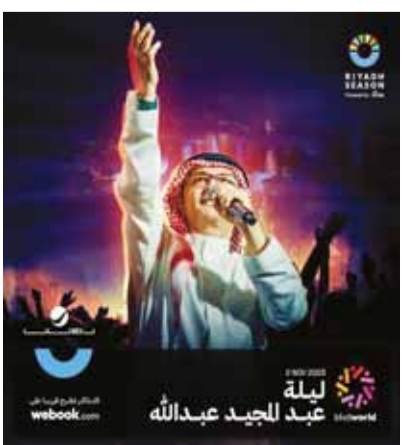
بوستر ليلة عبدالمجيد عبدالله

غانائية، أعلن عنها آل الشيخ، في تغريدة سابقة، موضحاً أن ليلة عبدالمجيد عبدالله ستكون مفاجأة لجمهور موسم الرياض في بوليفارد وورلد، وكتب "راح تكون مفاجأة لجمهور موسم الرياض في بوليفارد وورلد يوم 2 نوفمبر المقبل. وعلق آل الشيخ، على فيديو يظهر لقطات من تشييد ملعب المملكة أرينا الذي استغرق العمل فيه شهرين، قائلاً: "بهمة السعوديين التي لا حدود لها... ودعم من مولاي حفظه الله وسمو سيدي قائداً الملهم وعراب الرؤية... تسابق الزمن لكي نحوز على رضاكم". من جهة، ذكر موقع نادي الهلال، أن شركة نادي الهلال أنهت إجراءات الاتفاق مع الهيئة العامة للترفيه، ليكون بموجبها