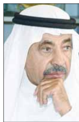
عبد العزيز سعود البابطين

من الشعر والشعراء العرب، فلقد عاش شعراونا العرب قضايا امتنا بكل أحاسيسهم ومشاعرهم يفرغون لإنجازاتها وانتصاراتها الرائعة فتفوح قصائدهم بأريج زك فيه عبق النصر والاعتزاز بالهوية ويحزنون إذا ما أطاطت بأمتهم النكبات والمصائب وما أكثرها!