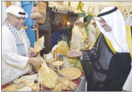
وزير الشؤون فراس المالك في جولة بالمعرض

وأوصى المشاركون بإنشاء فريق تطوعي خليجي وإعلان اشارة الفريق الذي سيسعى لتحقيق التوصيات الموجودة وأن تكون الكويت مقرا له.