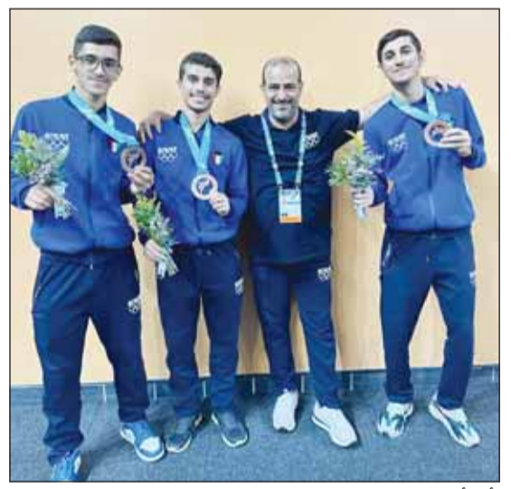
تألق أبطال المبارزة فيم الرياض

جميع اللاعبين المشاركين كانوا على قدر المسؤولية التي أسندت لهم بالظهور المشرف وتمثيل الكويت خير تمثيل مضيفاً أن المنافسة كانت قوية بين لاعبي الدول المشاركة.