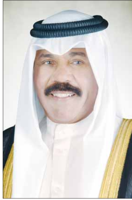
سمو أمير البلاد الشيخ نواف الأحمد