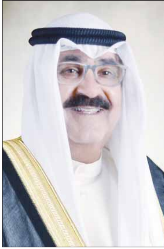
سمو ولي العهد الشيخ مشعل الأحمد

■ بعث سمو ولي العهد الشيخ مشعل الأحمد ببرقية تهنئة إلى الرئيس بيتر بافيل، رئيس جمهورية التشيك الصديقة، ضمنها سموه خالص تهانیه بمناسبة العيد الوطني لبلاده وراجيا له دوام الصحة والعافية. كما بعث سموه ببرقية تهنئة إلى سوزان دوغان ني راين، الحاكم العام لسانت فينسنت والغرينادين الصديقة، ضمنها سموه خالص تهانیه بمناسبة العيد الوطني لبلاده وراجيا لها دوام الصحة والعافية.