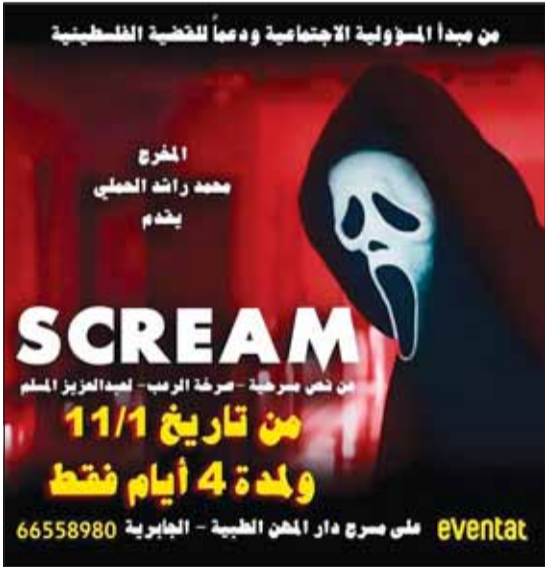
بوستر مسرحية "scream"

فخرت الآه معبرة صادقة مؤلمة وموجعة، الأغنية فضعت لمونتاج خاص عن كل أطفال غزة، الذين تساقطوا مثل قطرات الندى ونحسبهم عند الله طيوراً في الجنة من الرضعية في يومها الناهم حتى جمع الأعمار. يقول نوري، هذا أقل ما يمكن أن نقدمه، حيث لا نملك إلا الدعاء ونصرة الصوت، رسالتنا أثقلت عواتقنا ولم يعد بمقدورنا الكفء بمشاهد القتل والقمع والأشلاء المتطيرة للأطفال، لعل صوتنا يصل إلى كل من يحمل في قلبه ذرة إنسانية وتتوقف هذه المجازر والابادة الجماعية.