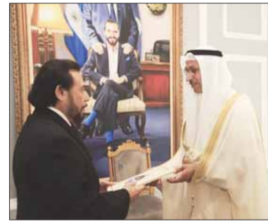
السفير صلاح الحداد يُقدم أوراق اعتماده لثاني رئيس السفادور

■ نهبويرك - كونا، قدم سفير دولة الكويت لدى المكسيك صلاح الحداد أوراق اعتماده سفيراً موقفاً فوق العادة وغير مقيم لدى السفادور إلى نائب رئيس السفادور فيليكس أويوا.