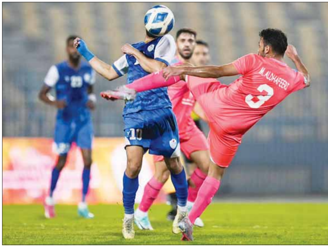
السالمية هزم الشباب بالدور الممتاز

ويدرك مدرب "الأبيض" الصربي بوريس يونيك ان