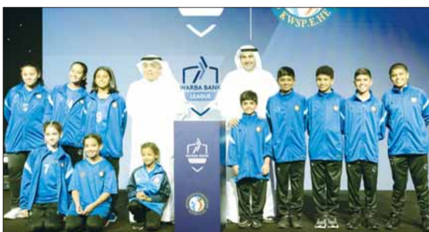
حفل انطلاق دوري وربة

من أجلها ممثلة في تطوير وعودة الرياضة المدرسية إلى سابق عهدها. وأكد المقصود في تصريحه الصحافي خلال الحفل على أن الشراكة الاستراتيجية بين الاتحاد الكويتي الرياضي المدرسي والتعليم العالي مع بنك وربة مهمة جداً، إذ تأتي امتداداً لسلسلة الطموحات والإنجازات التي تحققت منذ إنشاء الاتحاد، وتهدف إلى تعزيز الرياضة المدرسية والتعليم العالي وبناء جيل رياضي قوي يمكنه تمثيل بلدنا بفرح على المستوى المحلي والإقليمي والعربي والدولي. وأشار المقصود إلى أن الاتحاد الكويتي الرياضي المدرسي والتعليم العالي يسعى دائماً إلى التعاون المشترك مع الجهات الحكومية ومؤسسات القطاع الخاص