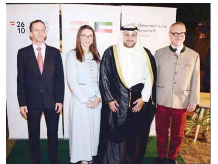
وكيل الدفاع " الشيخ د. عبدالله المشعل مهنتاً

وأشار إلى أنه منذ اجتماعنا العام هنا الماضي، كان من دواعي سرورنا أن نرحب بأكثر من 40 ألف مواطن كويتي زاروا النمسا، مبيناً أنه منذ سبتمبر، بدأنا بإصدار تأشيرة شينغن لمدة 5 سنوات لجميع المواطنين الكويتيين الذين يسافرون إلى النمسا، وهذا سيجعل السفر أسهل بكثير وأكثر ملاءمة، لأن التأشيرة صالحة لمدة 5 سنوات.