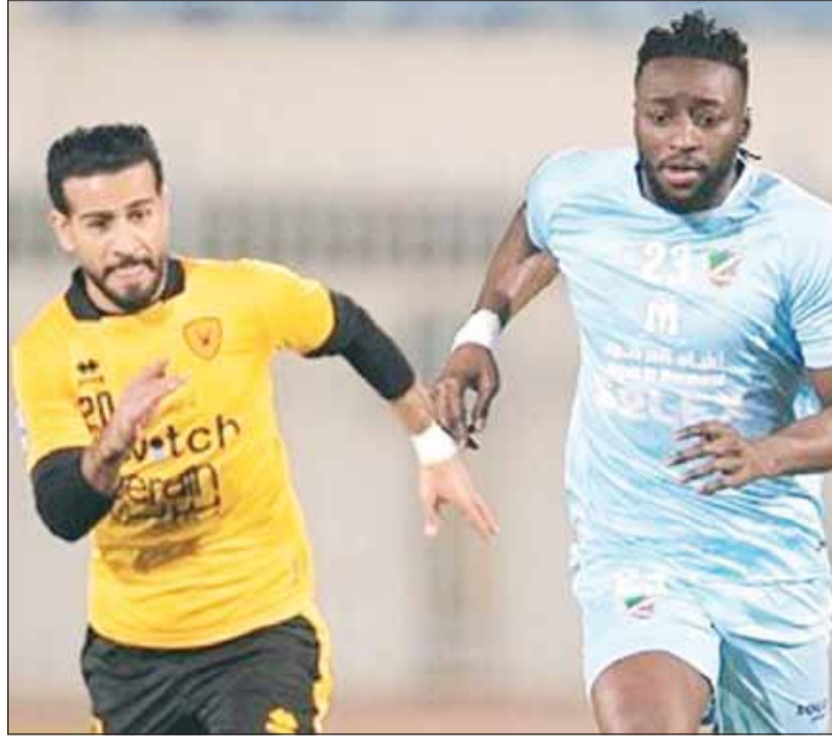
القادسية والسالمية في قمة مباريات الدوري