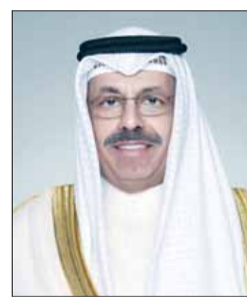
سمو الشيخ أحمد النواف

■ بعث سمو رئيس مجلس الوزراء الشيخ أحمد النواف ببرقية تهنئة إلى الرئيس تشان سانتوفي رئيس جمهورية سورينام الصديقة بمناسبة العيد الوطني لبلاده.