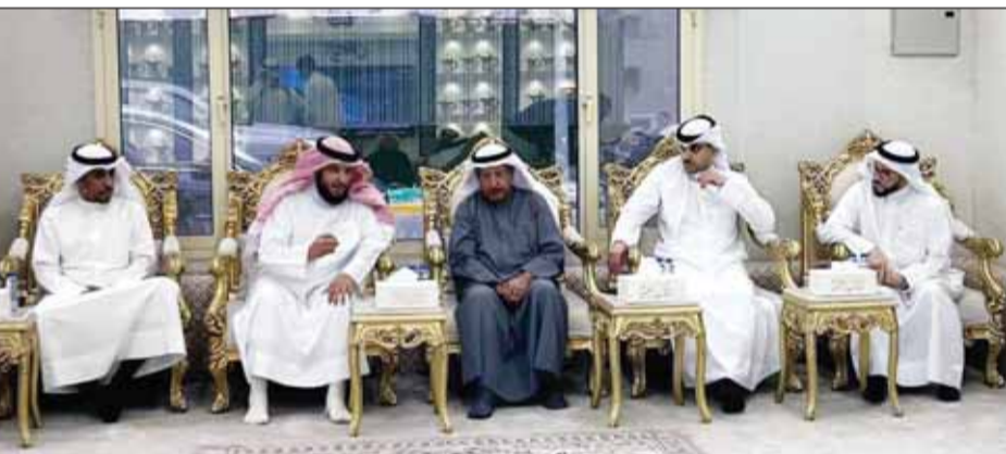
الرقبة والجمهور وقياديو "السكنية" خلال اللقاء مع المواطنين

تستحق بحثها واتخاذ ما يمكن بشأنها في القريب العاجل بعد استكمال الأطر القانونية والفنية والإدارية لها. وبينت أنه في نهاية الجولة تقدم الوزير بشكره للنائب فايز الجمهور وللمواطنين وللجهاز الفني المشرف على تنفيذ المشروع كما أصدر توجيهه لمدير المؤسسة بالتكليف برفع تقرير عاجل له خلال الأسبوع المقبل حول مطالبات المواطنين والإجراءات اللازمة لتحقيقها.