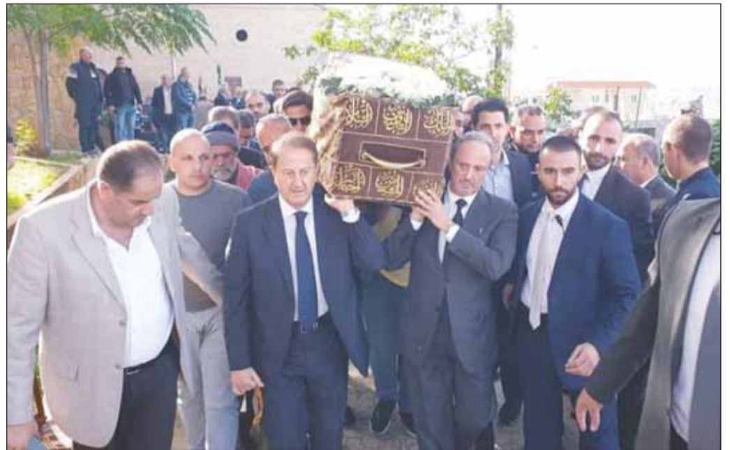
الوزير الشيخ سالم العبدالله في مقدمة المشيعين

وعبر شيخ العقل خلال تقديمه التعزية عن "واجب الوقوف إلى جانب هذه العائلة الكريمة المعطاءة وعائلة الكويت الكبرى والدولة، حيث الوفاء يقتضي منا الشكر الدائم لهذا البلد العربي الشقيق، الذي وقف إلى جانب لبنان إبان المحن والظروف الصعبة التي مرّ ويمرّ بها، وفي امتحاننا في بلدهم الثاني".