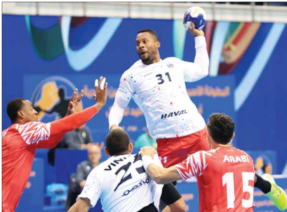
جانب من مباراة الكويت والعربي القطري