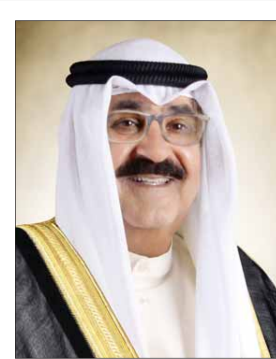
سمو ولي العهد الشيخ مشعل الأحمد

لديها، بما يضمن استمرار وضعيتها كدولة غير حائزة على السلاح النووي. وشدد على حق جميع الدول بإنتاج وتطوير واستخدام الطاقة النووية للأغراض السلمية، في إطار ما نصت عليه معاهدة عدم انتشار الأسلحة النووية. وتطرق إلى بعض النقاط الواردة في تقرير مدير عام الوكالة في 15 نوفمبر الجاري، والتي أكدت مجدداً تأثر عمليات التحقق والرصد التي تقوم بها الوكالة منذ توقيت إيران في 23 فبراير 2021 عن تنفيذ التزاماتها المتعلقة بالمجال النووي، بموجب خطة العمل الشاملة المشتركة، وفقاً لقرار مجلس الأمن 2231، بما في ذلك البروتوكول الإضافي.