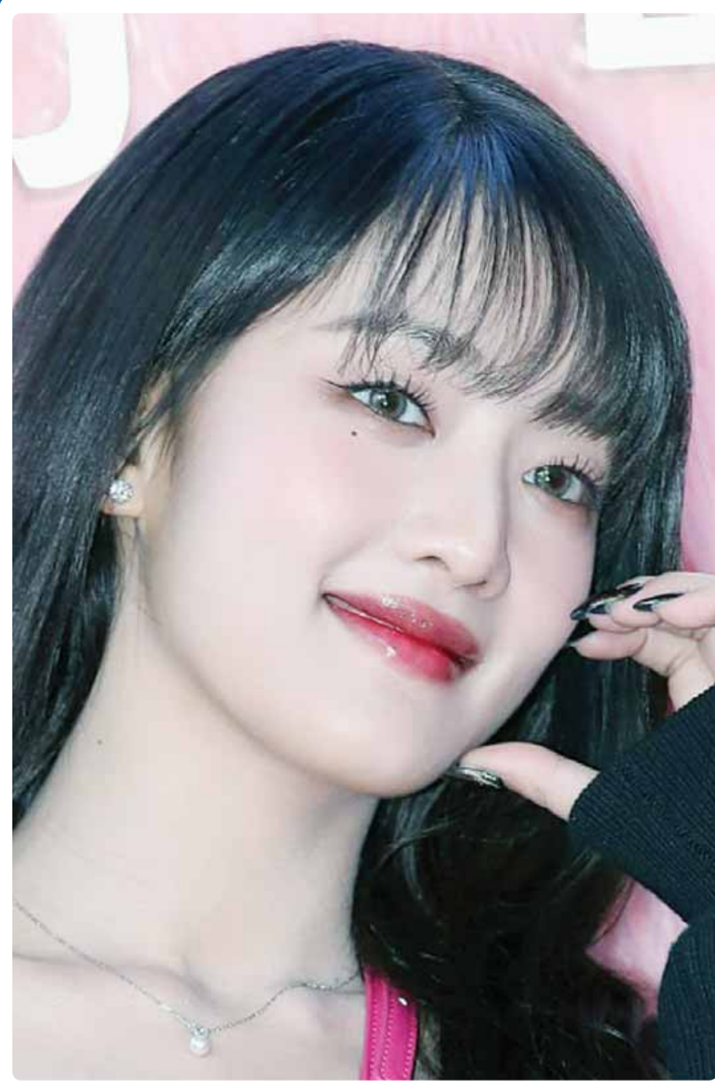
الممثلة الكورية مي ني خلال حضورها عرض "GI-DLE" في سول

الاصراب شر من دون خير، هذه الحقيقة التي يجب ان يعرفها من لا يعرفها، اما الذي يعرفها فيجب ان يحذر منها! حتى الاصراب التي تزعم انها اسلامية هي شر على الاسلام والمسلمين، وخطر على الامة من اعدائها، فهذا "داعش" ومشتقاته في سورية، قاين هو عما يجري بغزة، وهذا "حزب الله" على حدود فلسطين، فمادنا فعل لغزة واهلها، وهؤلاء هم "الاخوان المسلمون"، في غزة نفسها، اين هم من المعارك؟ نقول هذا الكلام، وندعمه بالأدلة، لمن يصق لمقترح تعديل نظام التصويت إلى تصويت القوائم، الذي هو عبارة عن ضوء اخضر لدخول الحزبية إلى الكويت، فمن يرضى بذلك، ومن يسحب البلاد وأهلها إلى مستنقع الحزبية المقيتة؟ مشكلة المشكلات حين نستورد اسوأ ديمقراطيات العالم من اجل ان نقضي على الصوت الواحد، الذي بفضل الله انقذ البلاد من شر محقق، شعر به الأمير الراحل، وما هم يعيدون الكرة بشكل جديد، ليس حرصا على البلاد واهلها، لكن انتقاماً من الصوت الواحد. فهل هناك من يمي ويستشعر الخطر المقبل، فيقف بوجهه حرصا على البلاد وتجنباً للتجربة اللبنانية... زين؟