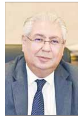
السفير أسامة شلتوت