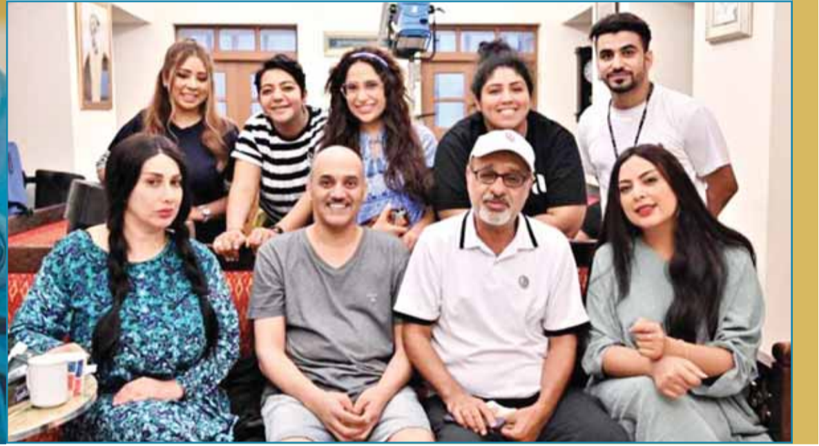
ميس في تصوير مسلسل "لعبة السعادة"

المفارقات نتيجة الامتلاك بزمام العمل، فتناول التعاطي مع المشكلات إما بمواجهتها أو الخضوع لها. وبسوالها عن أميبتها كممثلة في الإضافة على حوارها والسيناريو المكتوب، أكدت النجمة العراقية، يهمني في المقام الأول قراعتي للشخصية والتعمق بها وبلوغ محطات الأخيرة، الاهتمام بتفاصيلها وإلى أين سيذهب بها المؤلف ضمن سيناريو الأحداث، هنا عندما أجد بأن النص يتحمل إضافة جملة طريقة أتقدم بمقترح الإضافة بموافقة المؤلف والمخرجة، وقد اشتغلت على اختيار "كراكتر" خاص سيكتشفه المشاهدون عند عرض العمل.