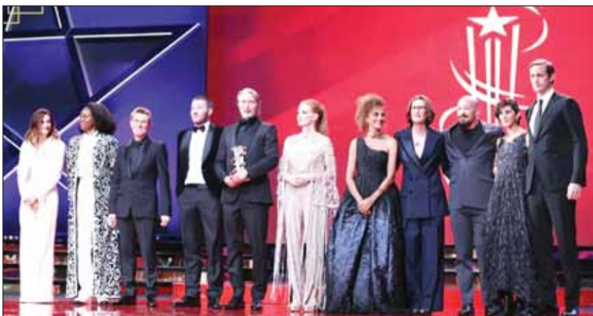
لجنة التحكيم في افتتاح مهرجان مراكش

خاصة على أدواره"، وقام بتسليمه جائزة "النجمة الذهبية". وسيلقي دافو، الجمهور المغربي خلال جلسة مُرتقبة ضمن فعاليات المهرجان، وكذلك سيفعل المخرج الروسي أندريه زيفياغوينستيسيف والممثلة تيلدا سوينتون والممثل فيفو مورتنسن. ويتنافس في المسابقة الرسمية أربعة عشرة فيلماً لمخرجين ناشئين للفوز بـ"النجمة الذهبية"، الجائزة الكبرى في المهرجان المغربي. وستعرض خلال المهرجان مجموعة من الأفلام خارج إطار المسابقة الرسمية، بينها "كورو أوتلار أوستون (2023) للمخرج التركي نوري بيلغي جيلان، "لا كيميرا" (2023) للمخرجة الإيطالية أليس روراك، ونسخة مُحدّثة من فيلم "المخدوعون" (1972) للمخرج المصري توفيق صالح.