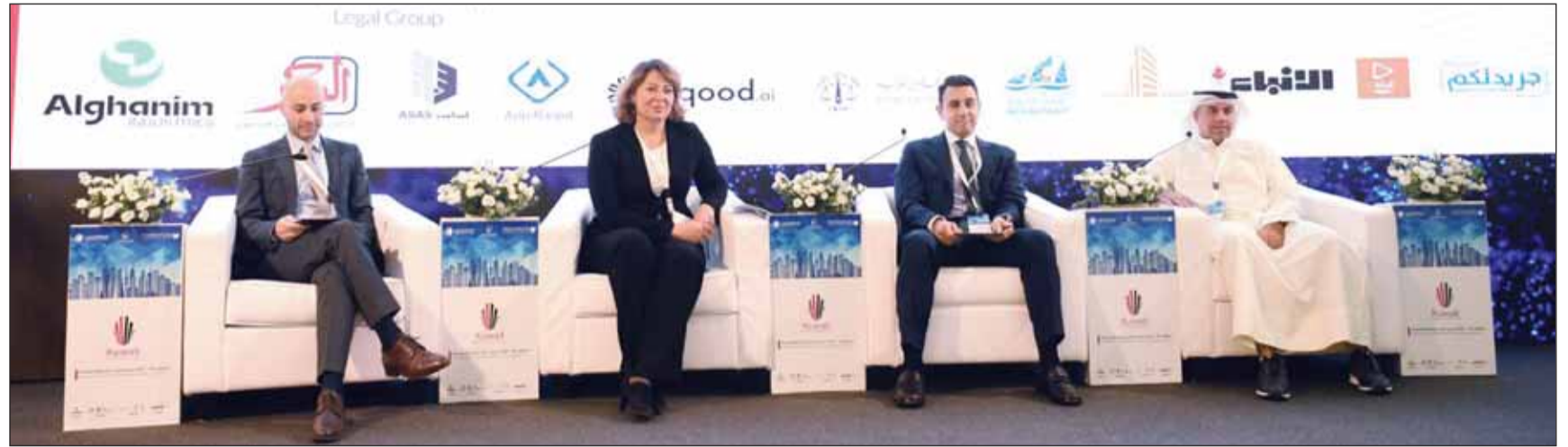
جانب من الجلسات

المستقبلية والبنية التحتية اللازمة لنمو الاقتصاد. وبين أن توجيه الاستثمار الأجنبي إلى الكويت يعد مساهمة فعالة في تنوع مصادر الدخل الوطني.