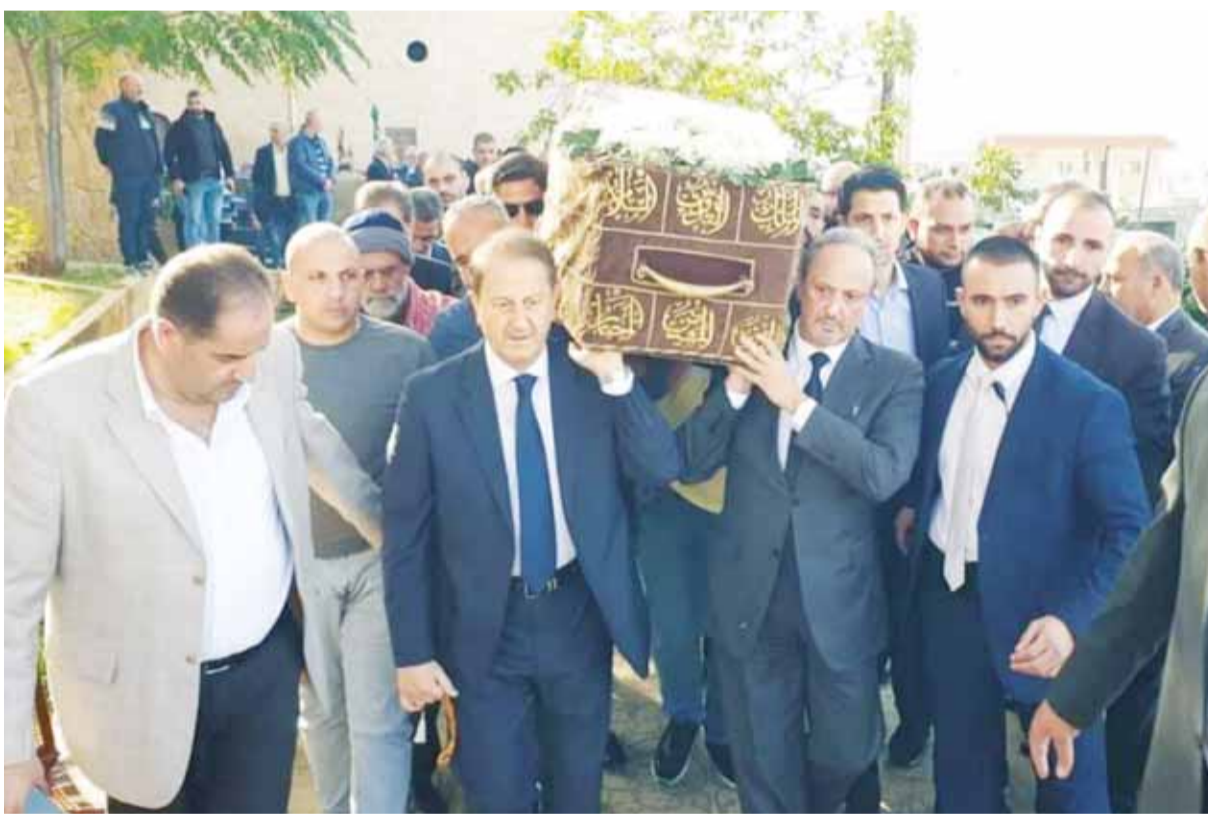
تشجيع مهيب لوالدة وزير الخارجية في عكار شمال لبنان 02