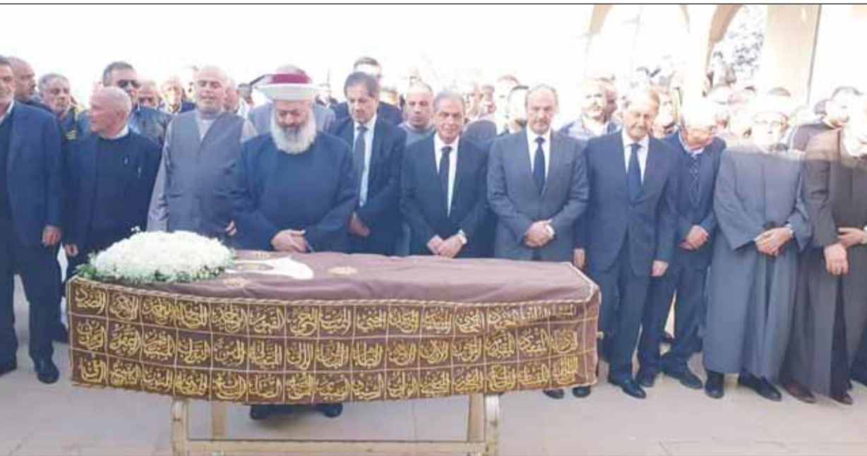
مفتي عكار يوم المصليين خلال الصلاة على الفقيدة

□ أبي المنى: الوفاء يقتضي منا شكر الكويت لوقوفها إلى جانب لبنان بالمحن والظروف الصعبة