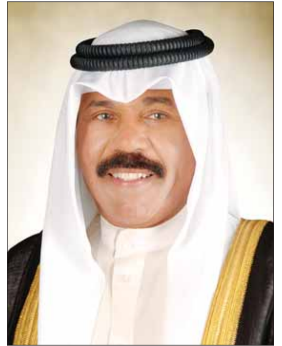
سمو أمير البلاد الشيخ نواف الأحمد

■ بعث سمو أمير البلاد الشيخ نواف الأحمد، ببرقية تهنئة إلى الرئيس تشان سانتوفي، رئيس جمهورية سورينام الصديقة، عبر فيها سموه عن خالص تهانيه بمناسبة العيد الوطني لبلاده، متمنياً سموه له موفور الصحة والعافية ولجمهورية سورينام وشعبها الصديق كل التقدم والازدهار.