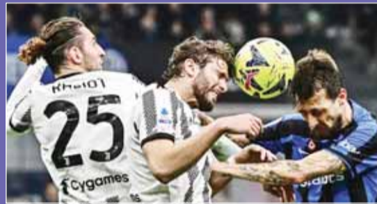
السيدة العجوز تستضيف الأضلاع اليوم

■ تتجه انظار عشاق كرة القدم الإيطالية اليوم، إلى ملعب "أليانز ستاديوم" بمدينة تورينو معقل يوفنتوس، لمعالجة ديربي "كسر العظم" والذي يستضيف من خلاله يوفنتوس، خصمه اللدود إنتر ميلان في قمة مباريات المرحلة 13 لبطولة الدوري الإيطالي.