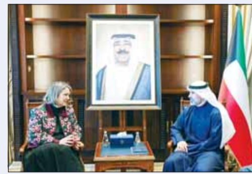
الشيخ جراح الجابر مستقبلاً سفيرة أستراليا ملبيا كلب

الى ذلك استقبل نائب وزير الخارجية رئيس البعثة الإقليمية للجنة الدولية للصلب الأحمر لدول مجلس التعاون لدول الخليج العربية مامادو سو.