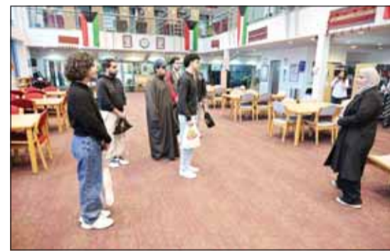
خلال الجولة الترفيحية داخل الحرم الجامعي

الطلبة بخوض التحديات والتجارب المختلفة التي تساعدهم على اكتشاف ذاتهم وتحقيق أحلامهم، مهيناً ضرورة الاستفادة من جميع محطات المرحلة الجامعية من خلال الالتزام بالمرونة واكتساب المعرفة. وخلال الأسبوع الأول، نظم مكتب الحياة الطلابية العديد من الأنشطة، بما في ذلك ليلة سينمائية