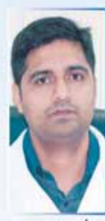
د/ شجاهان BDS, MDS الاسنان