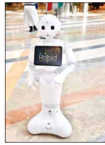
روبوت أحد مشروعات الخريجين

دشن مركز التدريب الهندسي والفيزيائي في كلية الهندسة والبتترول بجامعة الكويت معرض التصميم الهندسي الذي يدعم من مؤسسة الكويت للتقدم العلمي ومشاركة 325 من مهندسي الكلية وذلك تحت رعاية مدير جامعة الكويت بالإنابة د. مشاري الحربي. وأكد الحربي في تصريح لـ الصحفيين أن المعرض الذي يستمر ثلاثة أيام يضم 90 مشروعاً هندسياً في العديد من المسارات منها العلوم والتقنية والرقمية لمواكبة التطورات التكنولوجية الحديثة، كما يتضمن مشاريع في مجال البنى التحتية والاعتماد على الطاقة المتجددة والنظيفة للحفاظ على البيئة المستدامة والميكنة الإنتاجية الهندسية.