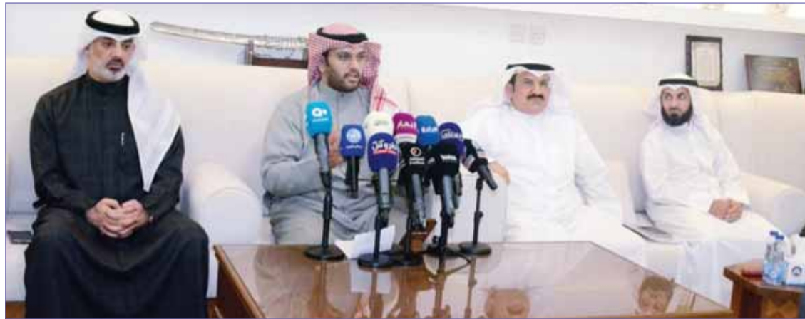
جانب من المؤتمر الصحافي للأندية الملغى إشهارها

وعن الهدر المالي قال الوليد، أن البيدان يصور للشارع الرياضي أن