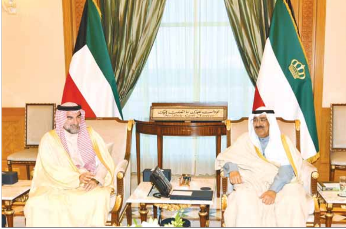
سمو الأمير الشيخ مشعل الأحمد مستقبلاً محافظ صندوق الاستثمارات العامة السعودي ياسر الرميان