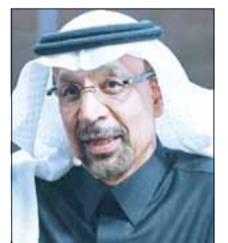
وزير الاستثمار السعودي خالد الفالح

وأوضح وزير الاستثمار السعودي، خالد الفالح، إن فرص الاستثمار في السعودية في كافة القطاعات تقدر بنحو 3 تريليونات دولار. وأضاف الفالح خلال مقابلة مع "العربية Business"، على هامش منتدى الاستثمار التركي السعودي في اسطنبول، أن القطاع الخاص التركي لديه ميزة نسبية في عدد من القطاعات أبرزها قطاع العقارات والإنشاءات. وقال الوزير إن أبرز الفرص الاستثمارية على المدى القصير تتمثل في قطاعات التشييد والبناء، حيث يبلغ حجم العقود التي سيتم ترسيبتها في السنوات القليلة القادمة نحو 1,8 تريليون دولار، من أجل إنشاء المشاريع لتحقيق مستهدفات الرؤية وأهداف اقتصاد مستدام.