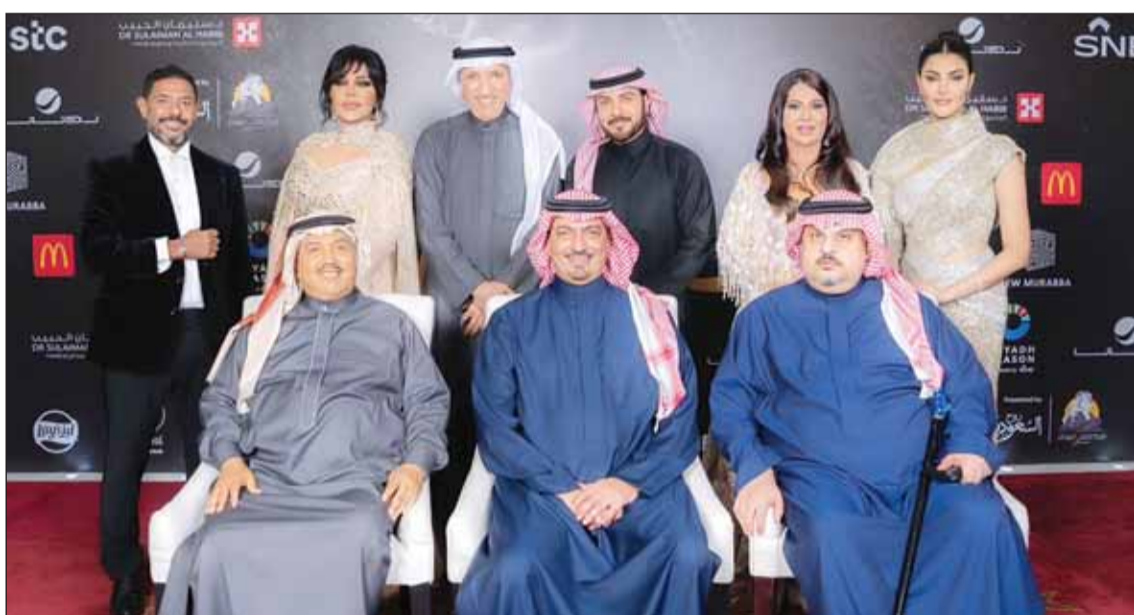
تجموع الحفل المميز بالرياض