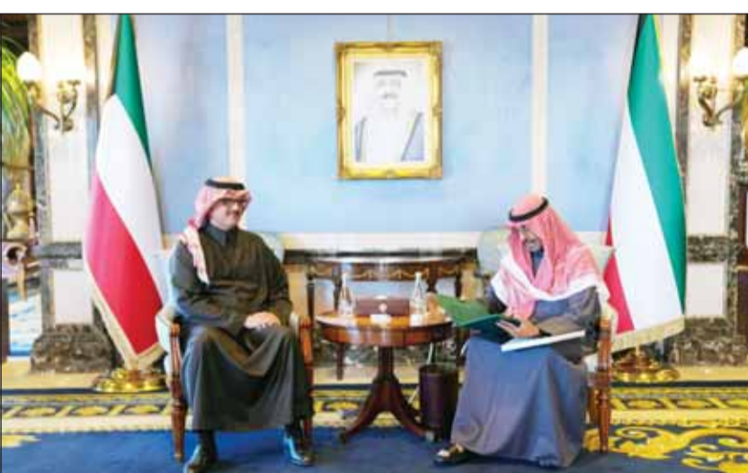
سمو الشيخ د.محمد الصباح لادم تسلمه رسالة ولي العهد السعودي من السفير الأمير سلطان بن سعد

في موازاة ذلك، بعث سمو رئيس الوزراء الشيخ الدكتور محمد الصباح برفيقة تهنئة إلى الرئيس أداما بارو رئيس جمهورية غامبيا الصديقة بمناسبة العيد الوطني لبلاده.