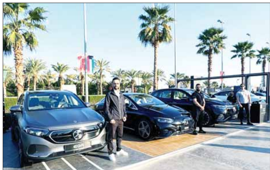
أحدث موديلات مرسيدس بنز الكهربائية

عام 2024، ويبرز هذا الخيار الابتكاري التزامنا بتوفير حلول متكاملة لمستخدمي السيارات الكهربائية. وفي ربيعها لعام 2039، حددت مرسيدس بنز هدفاً لجعل أسطول سياراتها الجديدة خالياً من الكربون الصافي على مدى الحياة الكاملة للمركبات بحلول عام 2039. وبحلول نهاية هذا العقد، ستقدم العلامة التجارية سيارات كهربائية بالكامل في أماكن السوق التي تسمح بذلك.