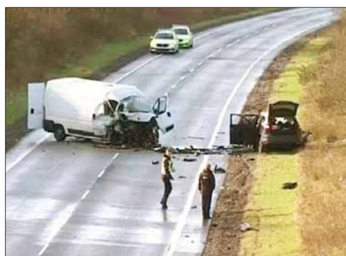
الحادث الذي تفجأ الشرطي فيه بوفاة زوجته (مواقم)

■ لندن - وكالات، أصيب شرطي بريطاني بالصدمة بعدما اكتشف أن زوجته كانت من بين ضحايا حادث سير الذي كان متوجهاً للتحقيق فيه. إذ بينما كان ضابط الشرطة في طريقه إلى مكان الحادث المروع الذي توفي فيه شخصان، أبلغه زملاؤه أن زوجته من بين الضحايا.