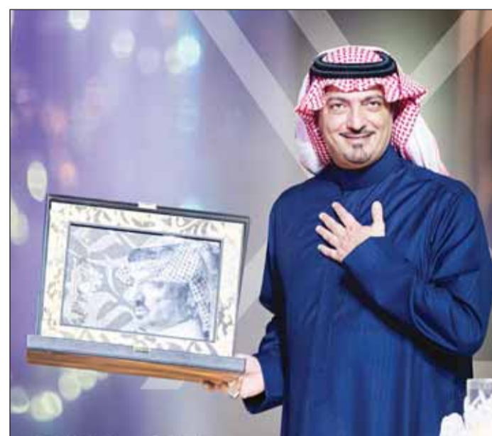
الأمير الشاعر سعود بن عبدالله

منصة "X"، كما انتشرت مقاطع مميزة كان أبرزها تفاعل الأمير عبدالرحمن بن مساعد والأمير سعود بن عبدالله والأمير نواف بن فيصل بن فهد، مع أداء الأغنية الوطنية "قلبي تولع بالرياض". يذكر أن الأمير الشاعر سعود بن عبدالله، قضى 37 عاماً في كتابة الشعر والقصيد بالساحة الفنية، وتميزت قصائده بالأطر القصصي، ونقلها إلى الجمهور أجمع نجوم الفن والغناء في العالم العربي، ولعل من أجمل ما كتب أميريت "مولد أمه" الذي يُعد أشهر أميريت في تاريخ المهرجان الوطني للتراث والثقافة في العام 1990.