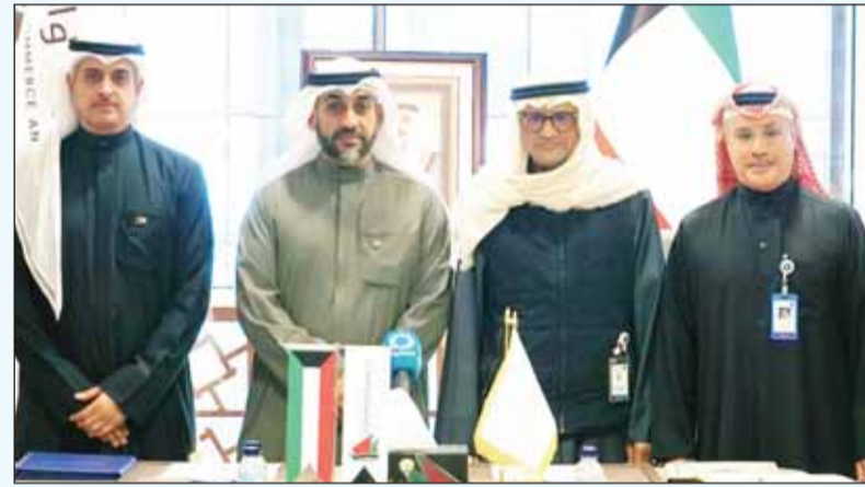
ذلال توقيع مذكرة التفاهم

والتكامل في آليات العمل وإجراءاته وضماناً لإنجاز الأعمال على أكمل وجه وأسرع مدة ممكنة يتطلبها النشاط التجاري، وبما يكفل الوضوح والشفافية وتخفيفاً للأعباء الإجرائية على موظفي ومراجعي الجهات الحكومية في الدولة، فقد جاءت مذكرة التفاهم الجديدة هذه لتحديث أطر التعاون المستجدة بين الوزارة والهيئة على ضوء صدور العديد من قرارات تعديل اللائحة التنفيذية للقانون رقم (7) لسنة 2010 بشأن إنشاء هيئة أسواق المال وتنظيم نشاط الأوراق المالية، وتعديلات القانون رقم (1) لسنة 2016 بإصدار قانون الشركات والمرخصة والشركات المدرجة وغير المدرجة وذلك منذ تأسيسها وانتهاء عقد الجمعيات العامة لها وتصفياتها ومرافقو الحسابات المسجلين لدى الهيئة ومكاتب التدقيق الشرعي المسجلين لدى الهيئة. وفي سياق سعي كل من الوزارة والهيئة لتحديث كافة مذكرات التفاهم والاتفاقيات مع الجهات الأخرى في الدولة، وذلك تحقيقاً للتوازن