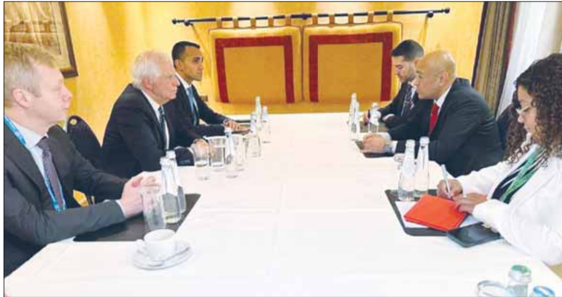
الأمين العام لمجلس التعاون الخليجي جاسم البديوي والممثل السامي للاتحاد الأوروبي جوزيب بوريل خلال اجتماعهما في ميونخ

وبحث الوزير البحريني، العلاقات الثنائية والمستجدات الدولية، مع وزراء خارجية أيسلندا، ولاتفيا، والكويت، والمالديف، إضافة إلى لقاءات عقدها مع الرئيس التنفيذي لشركة أوراكل، والمبعوث الخاص للاتحاد الأوروبي إلى منطقة الخليج لويجي دي مايو، إضافة إلى لقائه رئيس إقليم كردستان العراق، نجيب فرحان بارزاني.