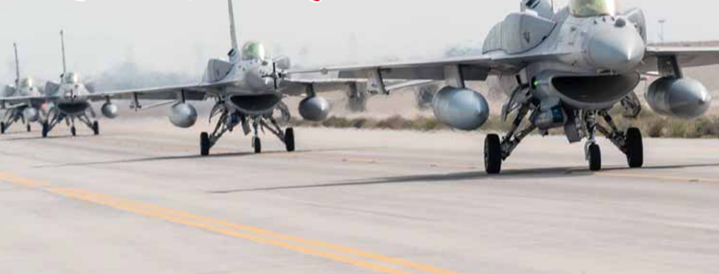
صورة نشرتها وزارة الدفاع السعودية من ختام مناورات "رمح النصر 2024" الجوية بمشاركة 9 دول التي اختتمت أمس

المشاركة، من خلال تنفيذ تمرين تكتيكي مشترك ومختلط، يحاكي التهديدات الإقليمية ويوحد مفاهيم العمليات الجوية المشتركة متعددة الأبعاد في بيئة حرب إلكترونية متقدمة.