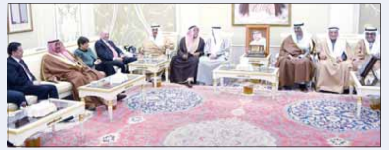
سمو الشيخ ناصر المحمد مستقبلاً رئيس مجلس الأعيان الأردني فيصل الفايز

استقبل سمو الشيخ ناصر المحمد في قصر الشويخ ظهر أمس، رئيس مجلس الأعيان بالملكة الأردنية الهاشمية فيصل عاكف الفايز، وذلك بمناسبة زيارته للبلاد.