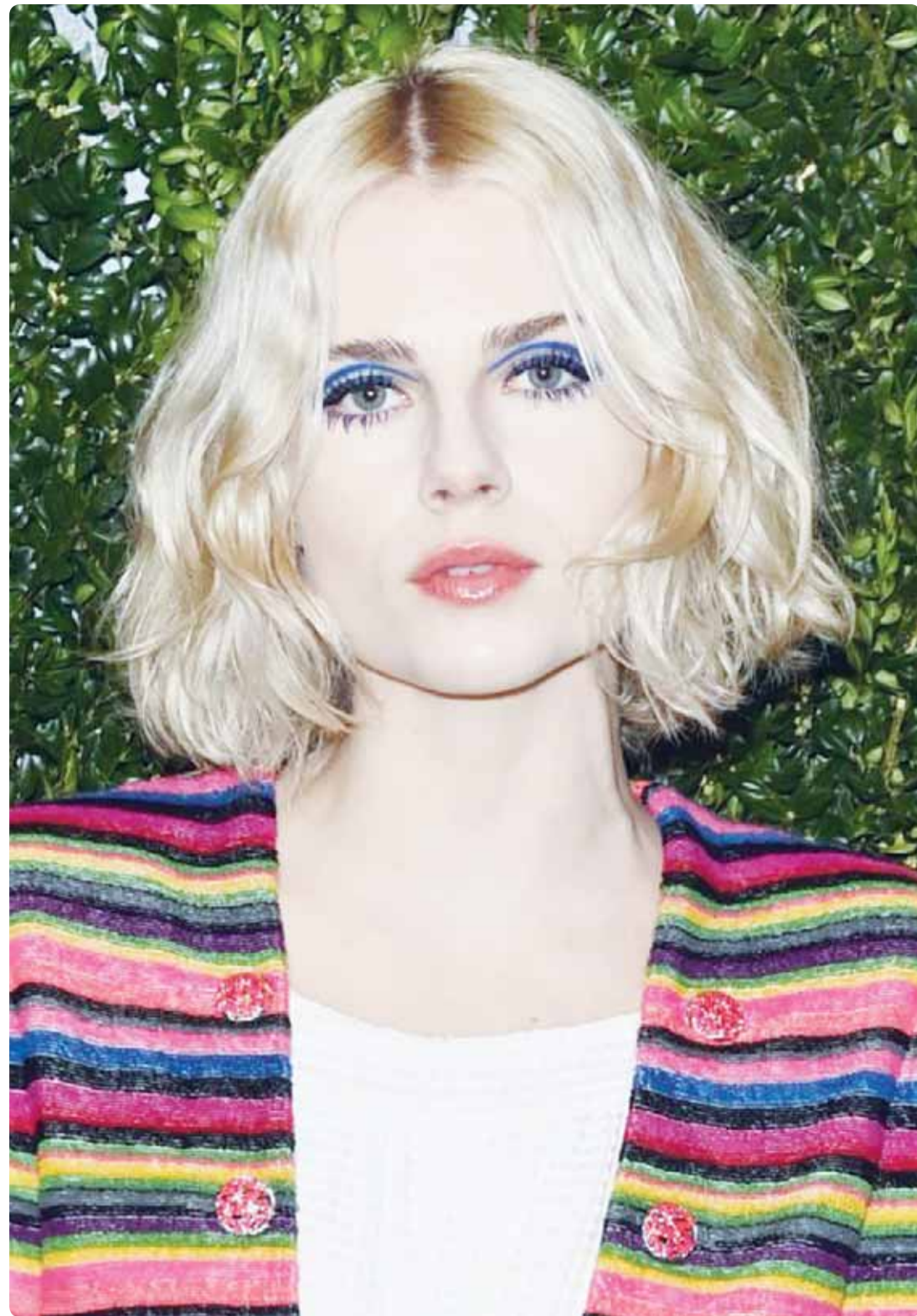
الممثلة البريطانية لوسيه بوينتون خلال حضورها حفل "تشارلز فينش وشانيل" في لندن

وهذا ما حصل فلا الحكومات المتعاقبة التي ضيعنا اسماء وزرائها، حتى اصبح في كل "فريج"، وزير سابق، فلا هي أرضت طموحنا، ولا مخرجات الانتخابات تنم عن حسن اختيار، فكان الله في عون الكويت وأهلها...زين.