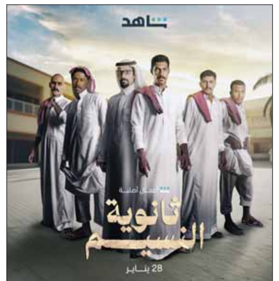
بوستر "ثانوية النسيم"