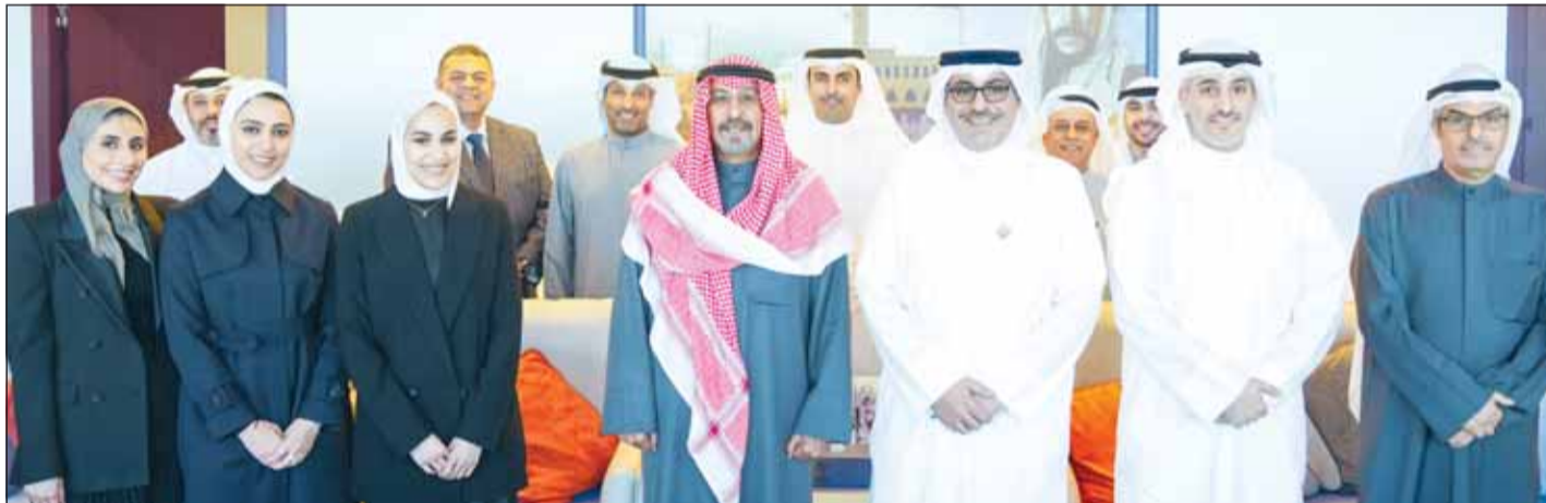
سمو الشيخ د.محمد الصباح والشيخ أحمد مشعل الأحمد بتوسط مسؤولي جهاز متابعة الأداء الحكومي

استقبل سمو أمير البلاد الشيخ مشعل الأحمد بقصر السيف صباح أمس سمو رئيس مجلس الوزراء الشيخ الدكتور محمد الصباح. كما استقبل سموه بقصر السيف ظهر أمس نائب رئيس الحرس الوطني الشيخ فيصل النواف. واستقبل سموه ظهر أمس نائب رئيس مجلس الوزراء وزير الدفاع ووزير الداخلية بالوكالة الشيخ فهد اليوسف. على خط مواز، استقبل سمو أمير البلاد الشيخ مشعل