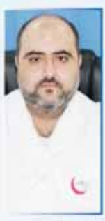
د/ ايهم BDS الاسنان