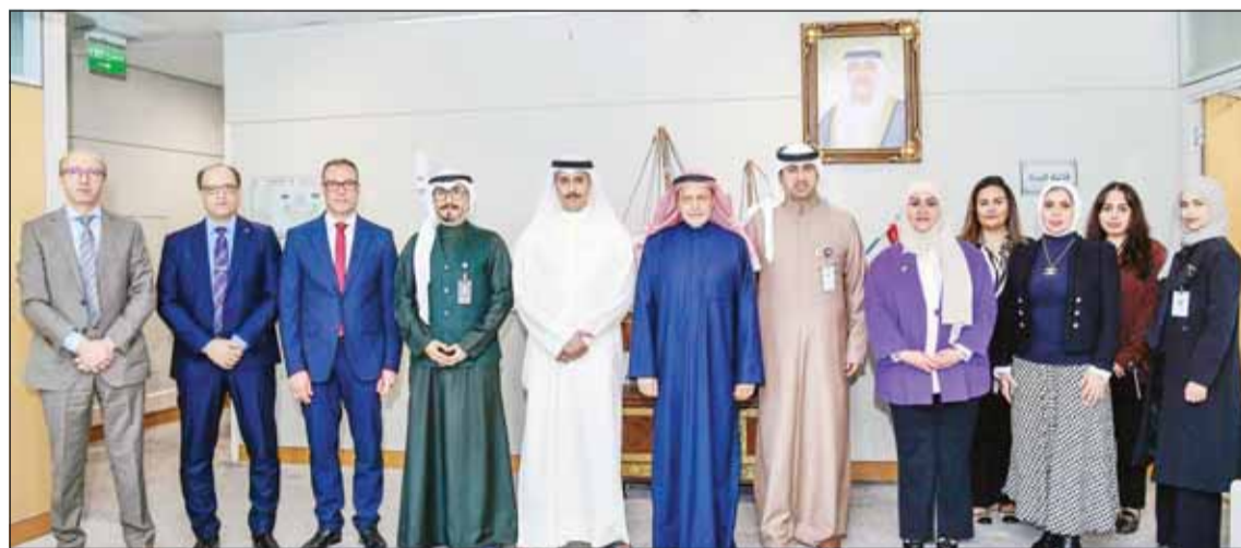
وزير النفط مع القادات النفطية

حيث قام أعضاء اللجنة من المعهد العربي للتخطيط بتقديم عرض تقديمي حول الاستراتيجية الممتدة لوزارة النفط. وشهد الوزير خلال اللقاء على ضرورة أن تتفق استراتيجية وزارة النفط الجديدة أفضل الممارسات المتبعة في التخطيط الاستراتيجي بهدف توفير خارطة طريق شاملة ومتكاملة لتحقيق الأهداف الموسومة، وأن تكون متناغمة مع رؤية واستراتيجية مؤسسة البترول الكويتية وشركائها التابعة لعام 2040.