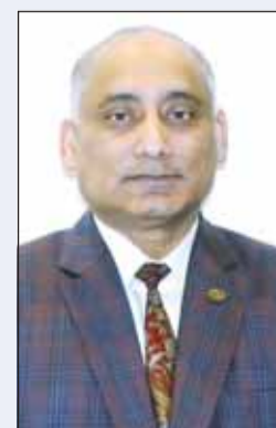
ام ديه عشيق الزمان

هنا سفير بنغلاديش لدى الكويت اللواء "متقاعد" ام دي عشيق الزمان الكويت اميرا وحكومة وشعبا بأعيادها الوطنية، متمنياً لها دوام التقدم والازدهار. وقال عشيق الزمان، نيابة عن شعب وحكومة بنغلاديش وبالأصالة عن نفسي، أود أن أقدم إلى شعب وحكومة دولة الكويت الشقيقة بأحر التهانئ والتبريكات بمناسبة العيد الوطني الثالث والسبعين المجيد، والذي ألى 33 لتحرير دولة الكويت.