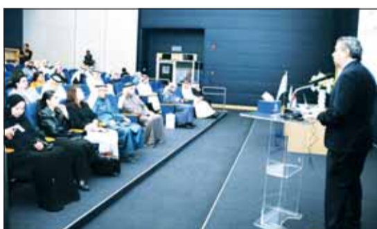
د. أليخاندرو بونسي يتحدث في الورشة

على المستوى الوطني، وقد بلغ عدد الدول التي قاسها المؤشر عام 2023 "142" دولة واملت دولة الكويت المركز 52 عالمياً. وأردت المهمل في تصريح "للسياسة" أن مؤشر سيادة القانون يركز على 8 عوامل رئيسية مقسمة إلى 44 عاملاً فرعياً، وهي القيود المفروضة على السلطات الحكومية، غياب الفساد، الحكومة المفتوحة، الحقوق الأساسية، النظام والأمن، الإنفاذ التنظيمي، العدالة المدنية، والعدالة الجنائية. وافتمت المهمل بالتأكيد على أن