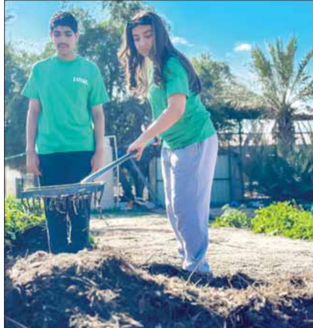
جانب من برنامج لويك