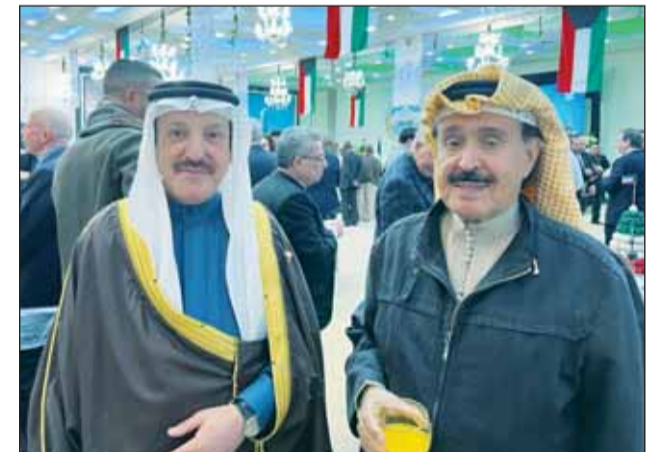
العميد أحمد الجارالله والسفير البدريني خالد المسلم