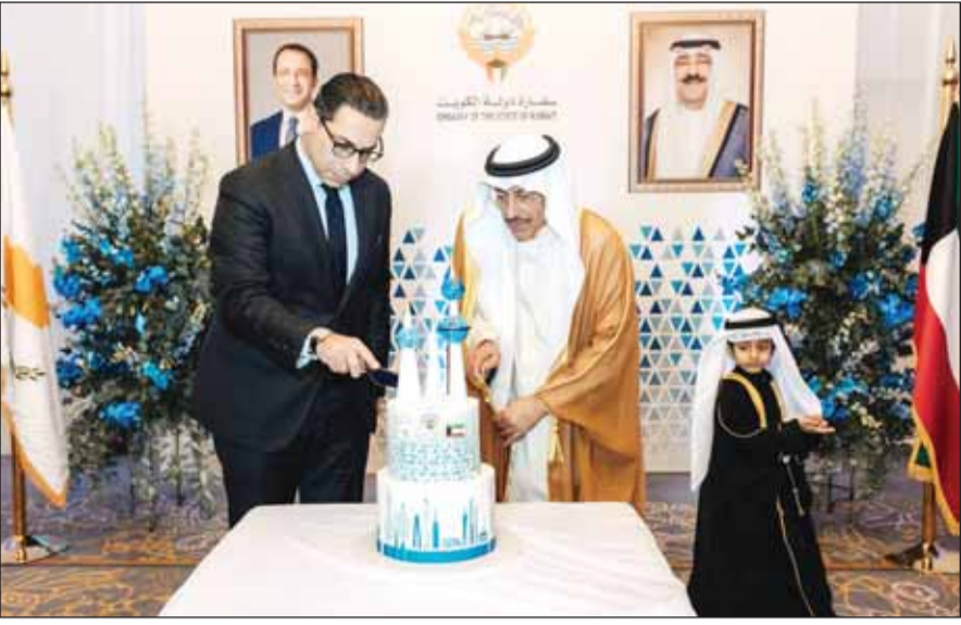
وزير الخارجية ممثل الرئيس القبرصي يشارك السفير الخرافي قطع قالب الحلوم