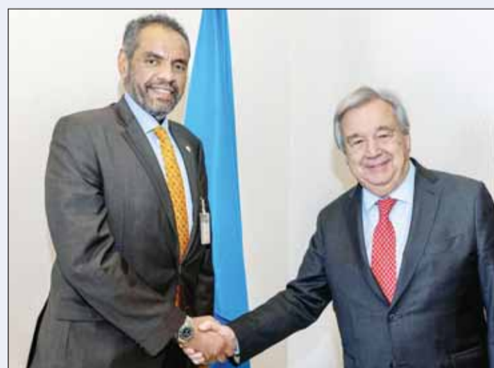
وزير الخارجية عبدالله اليحيا والأمين العام للأمم المتحدة أنطونيو غوتيريش

وأكد اليحيا على ضرورة وقف الجرائم التي تقوم بها قوات الاحتلال الإسرائيلي بحق الأشقاء الفلسطينيين وما يسببه العدوان من كارثة إنسانية دامية مشدداً على أهمية حماية الشعب الفلسطيني الشقيق ومساندته في حصوله على كامل حقوقه وإقامة دولته المستقلة والوصول إلى حل عادل ودايم