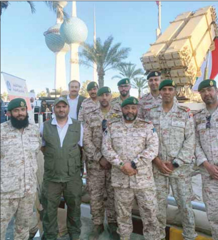
العميد يوسف مشاري، العبيدان متوسطا المشاركين في المعرض

أكد أمر مجموعة التفقيش والتخلص من المتفجرات في الجيش الكويتي العميد ركن يوسف العبيدان ان الكويت عانت من الانغام والمتفجرات بعد التحرير لغاية اليوم، مشيراً الى ان مجموعة التفقيش والتخلص من المتفجرات ازلت وطهرت ما يقارب المليون و800 الف لغم ضد الافراد و الدبابات، بالإضافة الى مايزيد عن 3 ملايين جسم متفجر منها البلاطات والأسلحة والقنابل اليدوية وقذائف وصواريخ وجميع الاسلحة والذخائر من مخلفات الحرب. وقال العبيدان في تصريح لـ "السياسة" على هامش معرض وزارة الدفاع في شارع الخليج بمناسبة الاعياد الوطنية "فرقنا تعمل على مدار الساعة"، موضحاً ان