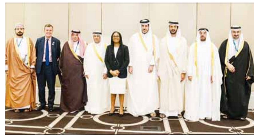
صورة جماعية للمشاركين في الاجتماع

ترأس وزير المالية وزير دولة للشؤون الاقتصادية والاستثمار الدكتور أنور المضف وفد الكويت المشارك في الاجتماع الوزاري المشترك بين دول مجلس التعاون لدول الخليج العربية والمملكة المتحدة حول مفاوضات اتفاقية التجارة الحرة بين الجانبين الذي استضافته إمارة أبوظبي. وذكرت وزارة المالية الكويتية في بيان أنه تم خلال الاجتماع مناقشة أهم الموضوعات التي تتضمنها الاتفاقية والاتفاق على خارطة طريق للتوصل إلى اتفاقية تجارة حرة بين دول المجلس والمملكة المتحدة لما لها من أهمية لتحقيق مصالح