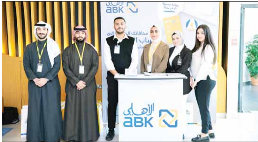
فريق البنك الأهلي