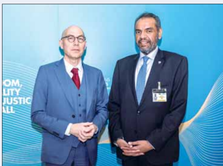
... ومع المفوض السامي للأمم المتحدة لحقوق الإنسان فولكر تورك

على خط مواز، التقى وزير الخارجية عبدالله اليحيا بوزير الدولة للتعاون الدولي جوزة الخارجية في دولة قطر الشقيقة لولوة الخاطر، حيث تناول اللقاء مناقشة مستجدات الأوضاع في الأراضي الفلسطينية المحتلة والتطورات الخطيرة في قطاع غزة وسبل تعزيز التعاون المشترك في تقديم المساعدات الإنسانية للشعب الفلسطيني الشقيق والتباحث في سبل وقف الجرائم التي تقوم بها قوات الاحتلال الإسرائيلي بحق الفلسطينيين وما يسببه العدوان من كارثة إنسانية دامية.