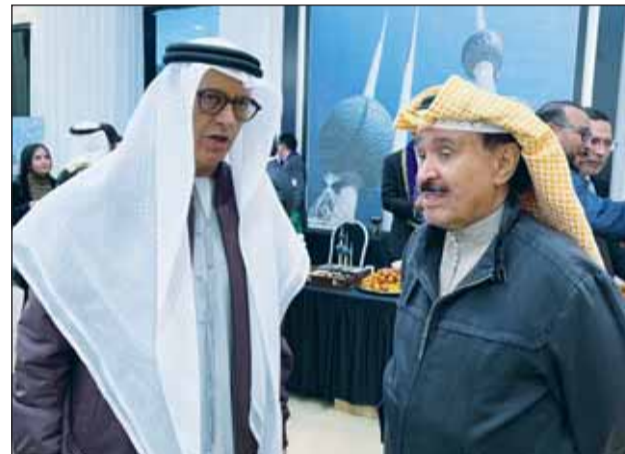
السفير الإماراتي العمري الظاهري وحديث مع رئيس التحرير

أقامت سفارة دولة الكويت لدى المملكة المغربية حفل استقبال بمناسبة العيد الوطني الـ63 والذكرى الـ33 ليوم التحرير، بحضور وزيرة الاقتصاد والمالية وإصلاح الإدارة المغربية نادية العلوي، وعدد من السفراء وروساء البعثات الدبلوماسية، وكبار المسؤولين، والعميد رئيس التحرير أحمد الجارالله، وأركان السفارة، وحشد من