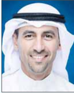
نواف سعود الصباح

الخطية التابعة قيامهم بتعطيل إجراءات الترقية والترقية بسبب تزامن تلك الفترة مع التقييمات السنوية للعاملين. وقالت المصادر بأن مؤسسة البترول الكويتية تعمل جاهدة لتكويته الشركات الخطية التابعة فضلا عن تشجيعها على الشركات الخاصة العاملة في قطاع الخدمات البترولية بحضور وزارة العمل بنسبة 30% للعائلة الوطنية، موضحة بأن تعليمات الرئيس التنفيذي لـ "البترو" الوطنية" الشيخ نواف سعود الصباح تشدد دائما على ضمان حقوق العمالة الوطنية سواء في "البترو" الكويتية أو الشركات التابعة.