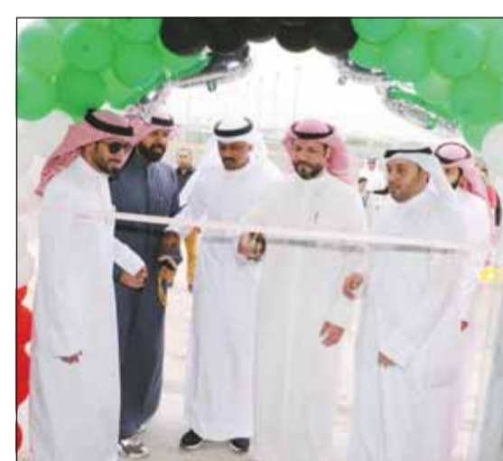
قيادات الجمعية خلال حفل الافتتاح

وأكد أن مجلس الإدارة حرص كل الحرص على تأمين جميع الخدمات وفق خطة زمنية مدروسة تكفل الاستعمال بإطلاقها على أعلى المستويات، وبأساليب ومواصفات رائدة في مجال العمل في قطاع الجمعيات التعاونية.