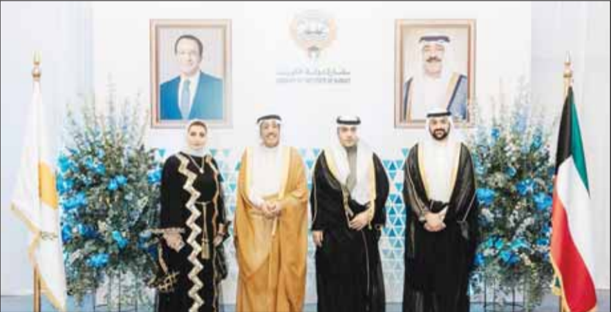
السفير عبدالله الخرافي متوسطاً أركان السفارة

وأكد السفير عبدالله الخرافي في كلمته خلال الحفل عمق العلاقات الثنائية بين البلدين الصديقين، كما قدم هدية تذكارية لممثل الرئيس القبرصي.