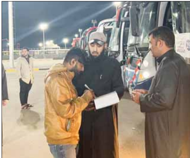
مدير إدارة الحج والعمرة خلال تفقده الحملات