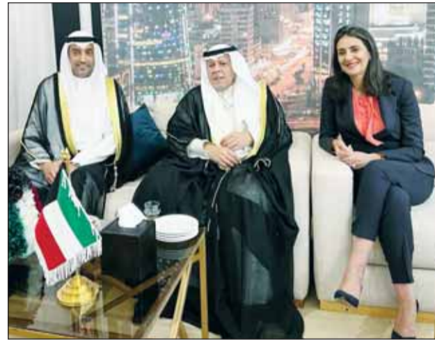
الوزيرة نادية العلوي والسفير عبداللطيف اليحيا والمستشار دجيل الخربنج