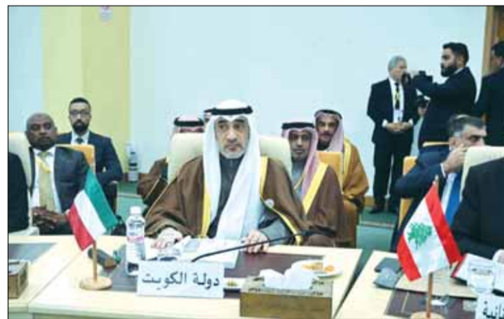
الشيخ فهد اليوسف خلال الدورة 41 لمجلس وزراء الداخلية العرب

الأفة التي تستهدف في المقام الأول شبابنا ثروة الأمة وعمادها واستنزاف مقدراتنا" مشدداً على أن التعاون بين الأجهزة الأمنية يعد سلاحاً فعالاً في وأد مخططات تلك المصائب الإجرامية. وأكد ضرورة مواصلة جهود دحر "الإرهاب" وتجهيز مناع تمويله ومنع نشر أفكاره وتجنيد صفار السن واتخاذ ما يلزم من تدابير لحماية أبنائنا من خطرهم وتبصيرهم بانحراف هذا الفكر الضال. أضاف: "لا نغفل عن مواجهة الجريمة المنظمة في شتى صورها وفاضة غسل الأموال وتلك التي تستهدف اختراق البيانات والمعلومات التي تعد حرب هذا العصر مما فرض تحديات جديدة على أجهزتنا الأمنية لتحقيق الأمن السيبراني ومكافحة الجرائم الإلكترونية لتوفير بيئة آمنة للمعلومات".