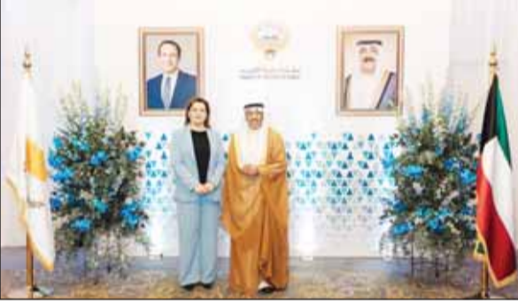
الوزيرة د.أثينا تقدم التهانئ للسفير الخرافي

أقامت سفارة الكويت لدى قبرص حفل استقبال بمناسبة العيد الوطني الـ63 ويوم التحرير الـ33، بحضور وزير الخارجية القبرصية د.كونستانطينوس كومبوس ممثلاً للرئيس القبرصي فريسيو دوليدس ووزير الطاقة القبرصي جورج باباناستاسيو، وزيرة التعليم والرياضة والشباب د.أثينا ميخيليدو، ووزيرة التربية والتعليم والشباب إلى جانب عدد من المسؤولين وعميدة السلك الدبلوماسية في قبرص السفيرة اللبنانية كلود المحجل وسفراء عرب وأجانب.