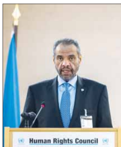
وزير الخارجية عبدالله اليحيا يلقيه كلمته

في كلمة أخرى كان وزير الخارجية عبدالله اليحيا