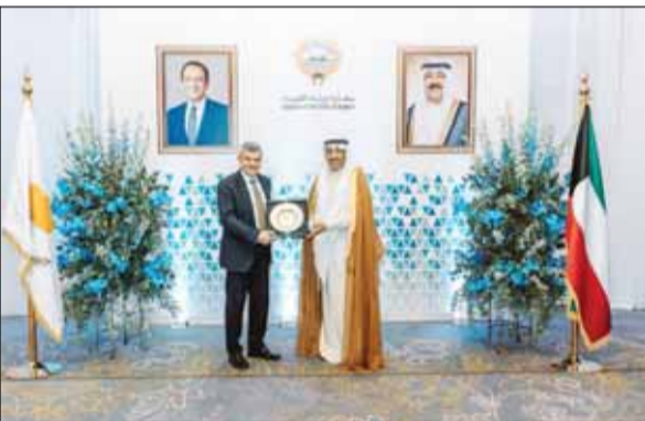
السفير عبدالله الخرافي مكرما وزير الطاقة باباناستاسيو