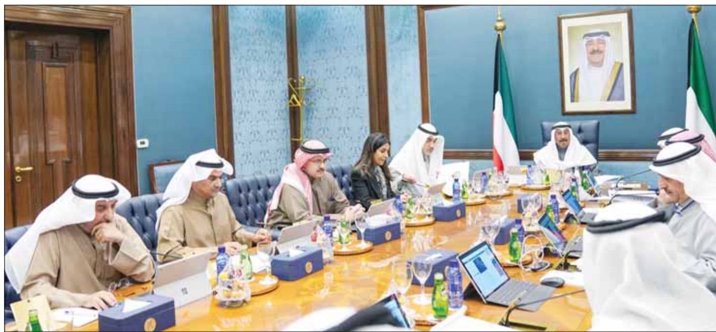
سمو رئيس مجلس الوزراء الشيخ د.محمد الصباح مترشحاً لاجتماع المجلس