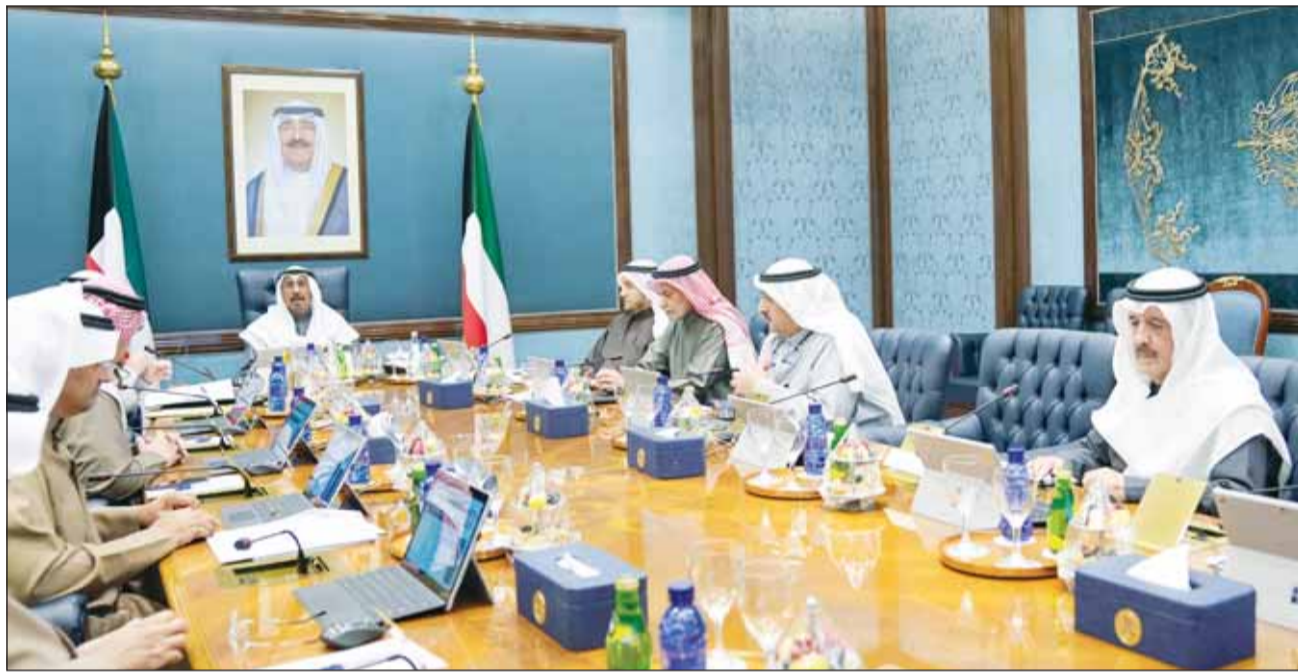
سمو رئيس مجلس الوزراء الشيخ د.محمد الصباح مترشحاً اجتماع المجلس

فيما استقبل سمو أمير البلاد الشيخ مشعل الأحمد أمس، سمو رئيس الوزراء الشيخ الدكتور محمد الصباح، أعلن الناطق الرسمي باسم الحكومة عامر العجمي أن مجلس الوزراء وافق خلال اجتماعه أمس على مشروع مرسوم يدعو الناخبين لانتخاب أعضاء مجلس الأمة 2024 في الرابع من أبريل المقبل ورفعته إلى سمو أمير البلاد الشيخ مشعل الأحمد. وأوضح أن مرسوم الدعوة للانتخابات سينشر في الجريدة الرسمية يوم الأحد 3 مارس، على أن يُفتح باب الترشح في اليوم التالي (4 مارس)، لافتاً إلى أن آخر يوم لتنازل المرشحين عن الترشح سيكون في 28 من الشهر نفسه. في السياق، أكدت مصادر مطلعة أن توقيت الانتخاب