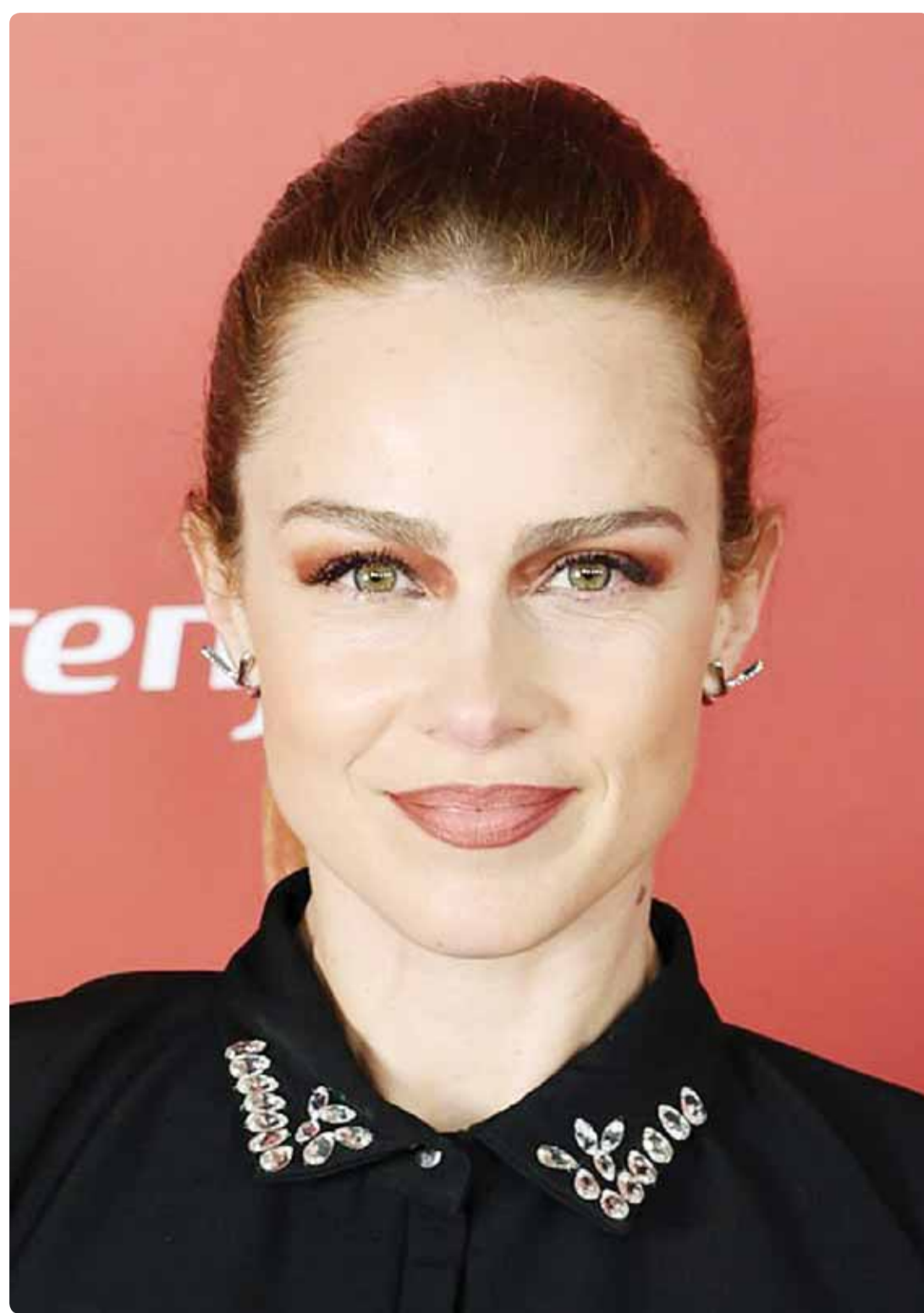
الممثلة الاسبانية كارلا نيبوتو خلال حضورها حفل توزيع جوائز "Fotogramas De Plata" في مدريد

كما نؤكد على أهمية إنشاء النصب التذكاري لشهادتنا الأبرار، تقديراً وتكريماً لهم على تضحياتهم في سبيل الوطن، علماً ان القرار في هذا الشأن من مجلس الوزراء في إنشائه في 8/8/2022، ونأمل أن يتحقق هذا المطلب. نسأل الله ان يديم الأمن والأمان، والاستقرار للكويت وشعبها تحت قيادة صاحب السمو الأمير، حفظه الله. اللهم ارحم شهداءنا الأبرار.