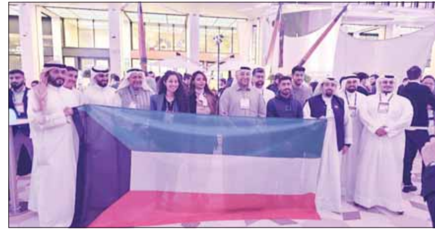
وزير الدولة لشؤون الشباب داود معرفي مع المشاركين من مركز صباح الأحمد عقب قمة (ويب قطر 2024)

وأضاف معرفي أن وجود المبادرين الكويتيين المشاركين في هذه القمة واحتكاكهم مع مبادرين ومخترعين ورواد أعمال من مختلف دول العالم يساهم في تبادل الخبرات والاستفادة منها لاسيما في مجال ريادة الأعمال والتكنولوجيا الحديثة.