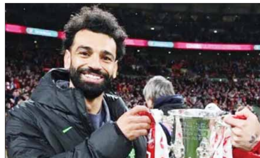
محمد صلاح مع كأس الرابطة

وبين، انه "سيتم تخصيص ستوديو قبل اللقاء بقيادة سيف زاهر وهاني محتوت، سيضم نخبة من النجوم السابقين على رأسهم البرتغالي مانويل جوزيه وحسام غالي وطازم إمام".