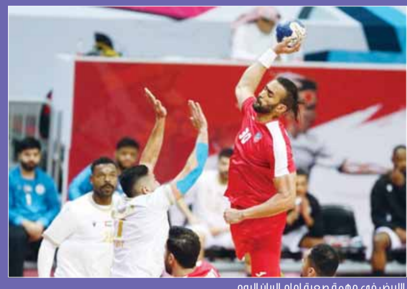
الأبيض في مهمة صعبة امام الريان اليوم

وتعتبر مواجهة اليوم مهمة للعميد حامل لقب البطولة، كون الفوز على الريان سيضمن له التأهل لدور نصف النهائي بعيداً عن نتائج