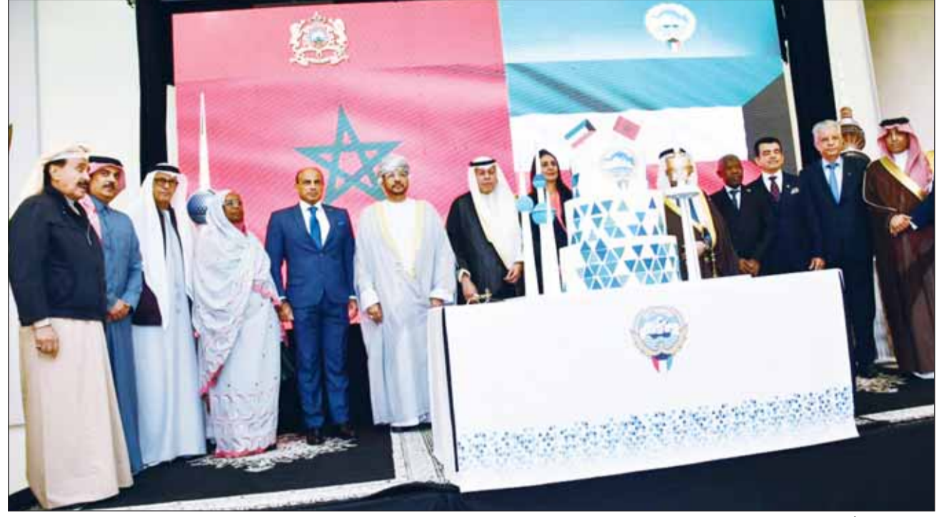
كبار الحضور يشاركون السفير يحيى قطع قالب الحلوم