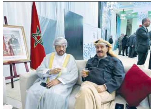
العميد أحمد الجارالله والسفير العماني خالد بامخالف