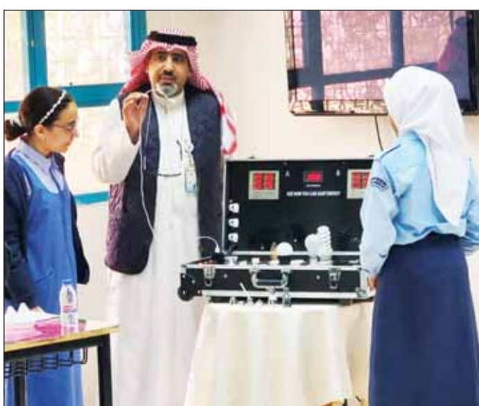
جانب من محاضرات الترشيد في المدارس

وأشارت المصادر إلى أن العمليات التشغيلية لمياه توضع لرقابة شديدة من إدارتي الأعمال الكيميائية والبكتريولوجية التابعة للمركز وعلى مدار الساعة، مبيحة أن المختبرات