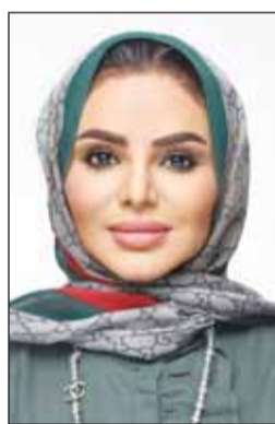
د أمثال الحويلة