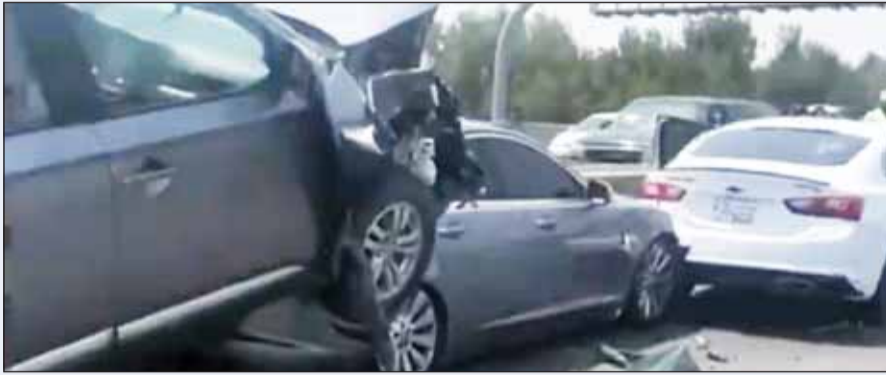
المركبات المتصادمة على "السادس"

مع حادث تصادم وقع بين 6 مركبات مقابل (مجمع 360)، اسفر عن 3 إصابات وجرى نقل المصابين إلى المستشفى للعلاج وإبعاد المركبات المتصادمة من على الطريق.