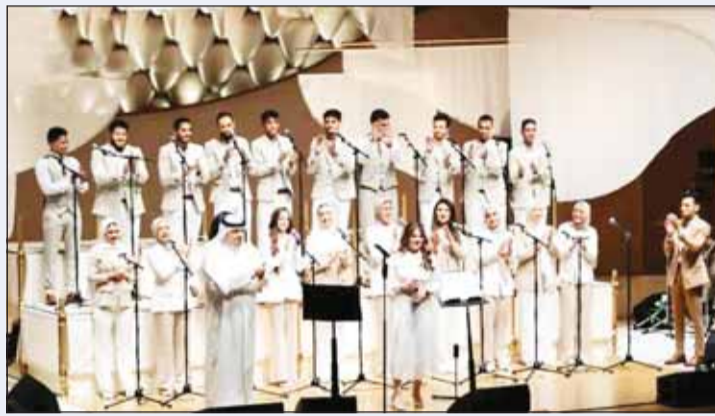
هدهود وكورال "روح الشرق" في حفل مشترك

يجمعه معهم لقاء غنائي مجدداً. عن الأصوات الموجودة في الساحة الغنائية من أبناء الجيل الجديد، أوضح الفنان هدهود، أن الكويت أرض خصبة للمبدعين وهناك أصوات رائعة من الجيل الجديد لكنهم بحاجة إلى فرص حقيقية لكي يتمكنوا من تقديم أعمال تحمل قيمة مع استخدام أدوات الأغنية المعروفة، ومن يتابع الساحة سيجد أن هناك مجموعة كبيرة منهم تقدم أعمالاً مميزة والجمهور يستمع لها ويقبل على أغنياتها، لافتاً إلى أن صناعة الأغنية تحتاج نوعاً من الفكر حتى يكون هناك رسالة حقيقية لها، لأن هناك غناء كثير بكل مكان في ظل وجود