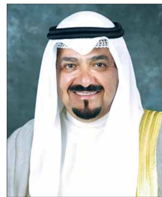
الشيخ أحمد العبدالله

في البداية، قال شيخ قبيلة الهواجر محمد بن شبعان الهاجري إن تولى الشيخ أحمد العبدالله رئاسة الحكومة خطوة جيدة إلى الأمام، لافتاً إلى ضرورة قيام السلطة التشريعية بمد يد التعاون مع رئيس الوزراء الجديد لتحريك عجلة التنمية وتحقيق الإصلاح الاقتصادي المنشود.