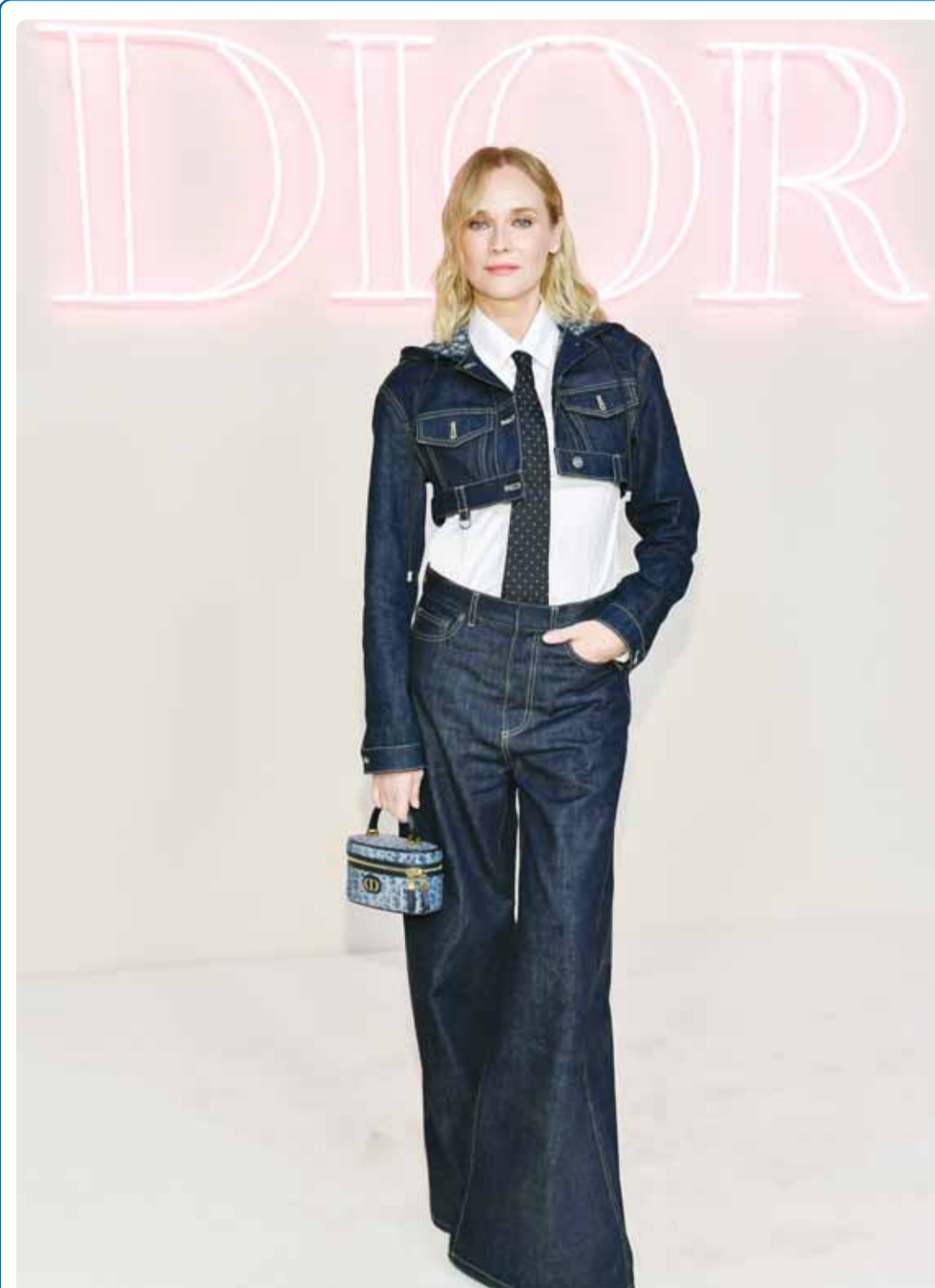
الممثلة الألمانية ديان كروغر خلال حضورها عرض أزياء ديور في نيويورك

كما لا بد من الأخذ بعين الاعتبار أن هناك أولويات تهم المواطن، على رأسها تحسين مستواه المعيشي، وينبغي أن يتعامل معها بمصداقية ووضوح، والله الموفق.