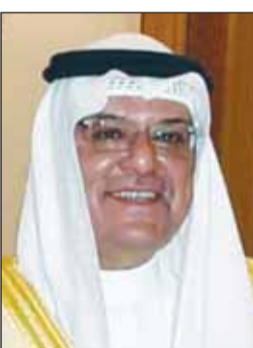
الشيخ حمد سالم الحمود

هنا محافظ الأحمدى الشيخ حمد سالم الحمود، الشيخ أحمد العبدالله بصدر الأمر الأميري بتعيينه رئيساً لمجلس الوزراء، وتكليفه بترشيح أعضاء الحكومة الجديدة. وقال المحافظ في برقية، يطيب لي وبمناسبة الثقة