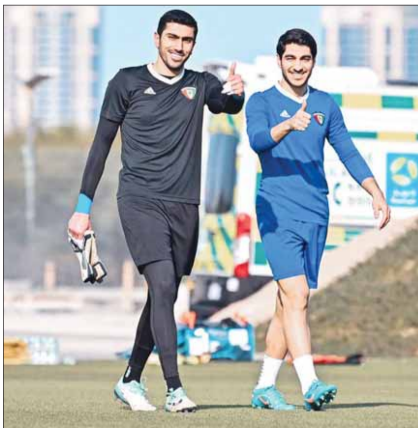
الأزرق جاهز لمواجهة المنتخب الفيتنامي