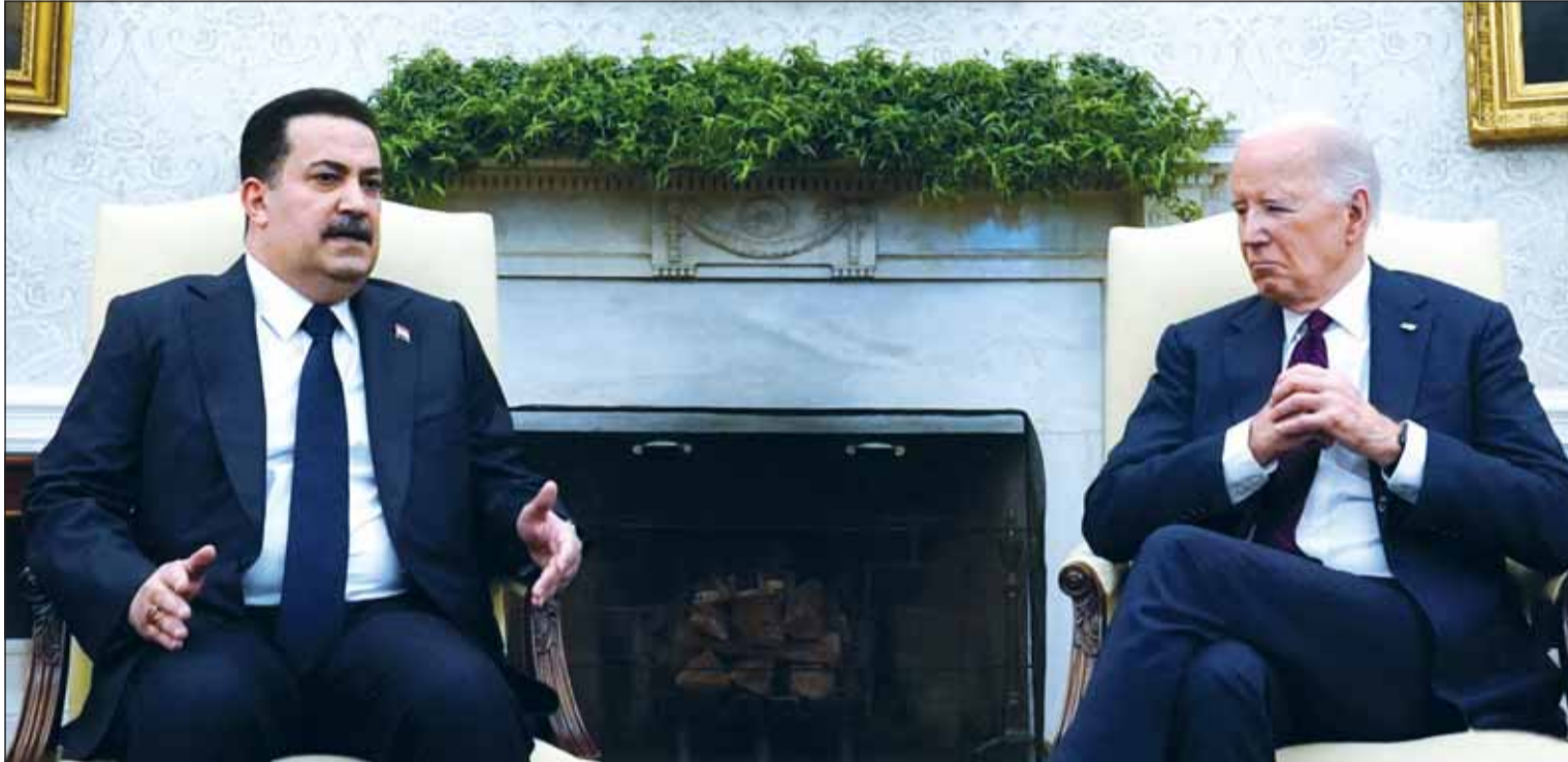
الرئيس الأميركي جو بايدن مستقبلاً رئيس الوزراء العراقي محمد شياع السوداني في البيت الأبيض

من جانبه، أشاد رئيس الوزراء السوداني بجهود وشكر التعاون المشترك لشراء العراق خدمات عسكرية باستخدام آلية الدفع المرنة الجديدة، وأكد أهمية تسريع عمليات إعادة اللاجئين العراقيين وتسهيل إعادة إدماجهم بشكل آمن، وناقش الجانبان الجهود المبذولة لتحديث قوات الأمن العراقية بما في ذلك قوات البشمركة وبناء قدراتها، من خلال مجموعة واسعة من أنشطة التدريب والتجهيز التي تدعم قوات الأمن الممولة من صندوق التدريب لمكافحة داعش "سي إي تي أف".