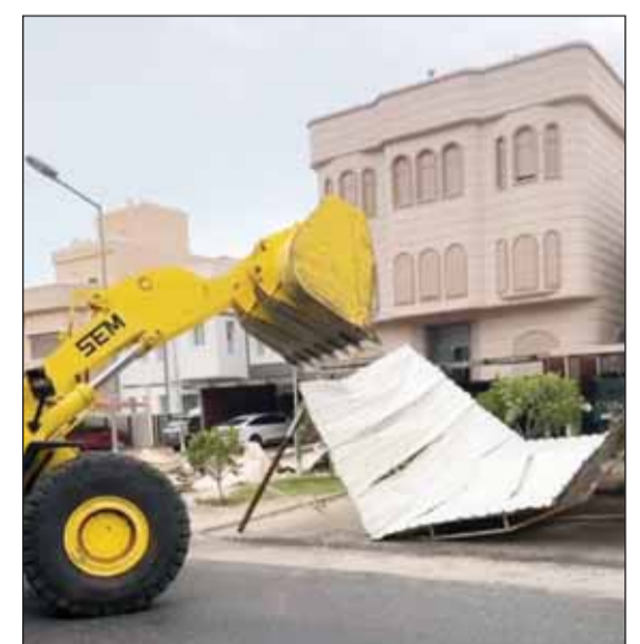
لهدر البلدية يزيل المظلات المخالفة في محافظة مبارك الكبير

أعلنت إدارة العلاقات العامة في بلدية الكويت عن بدء حملات ميدانية مكثفة خلال شهر أبريل الجاري لإزالة أي تعديات مقامة على أملاك الدولة في جميع المحافظات، بالتعاون مع أقسام إزالة المخالفات بآفرع البلدية في المحافظات. وأوضحت أن الحملات الميدانية التي ستفندها الفرق الرقابية تشمل المناطق الصناعية والتجارية الاستثمارية وتعديات مناطق البر.