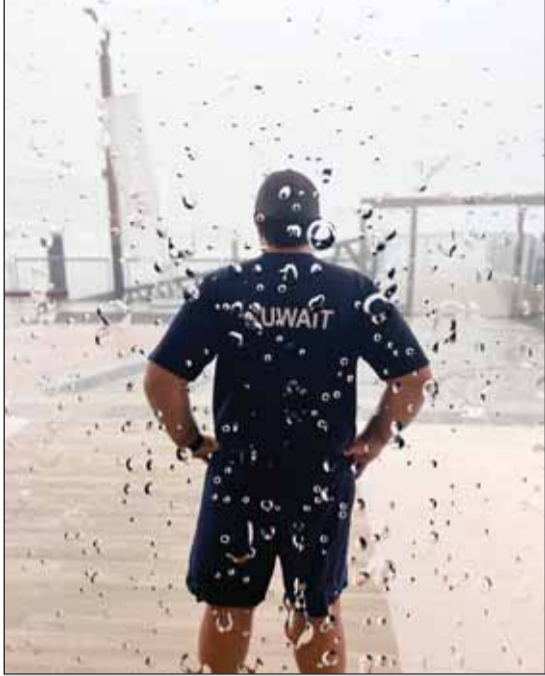
الأحوال الجوية بالإمارات أجلت مباريات القدم