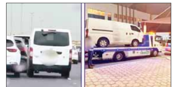
مركبة المتهم بعد حجزها