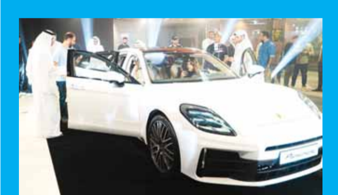
الحضور يستكشرون سيارة الباناميرا الجديدة