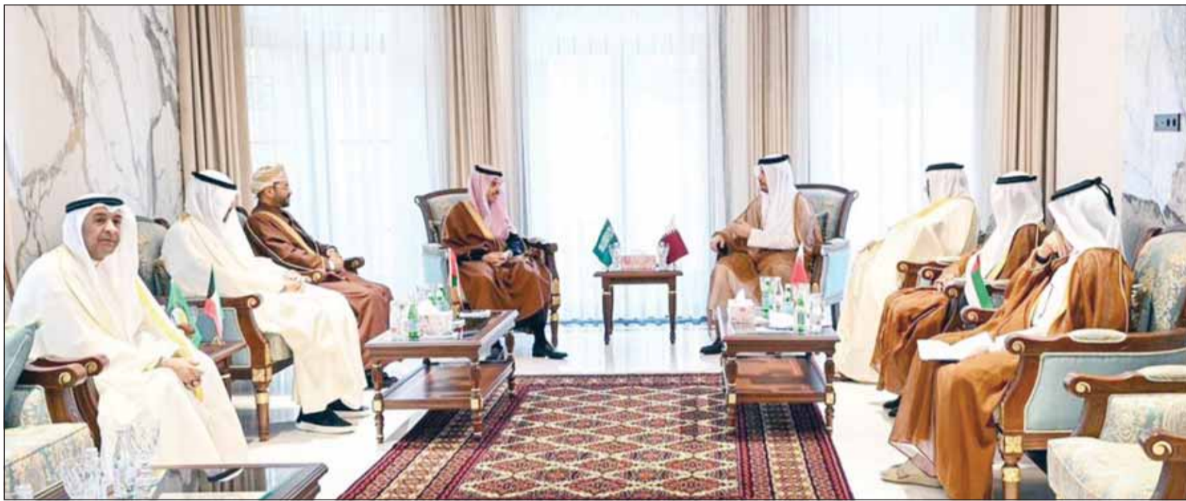
وزراء خارجية دول مجلس التعاون الخليجي خلال اجتماعهم الاستثنائي بسفارة قطر فيع شققند على هامش الاجتماع الوزاري المشترك بين مجلس التعاون ودول آسيا الوسطى

الرياض، عواصم - وكالات، شدد وزراء خارجية دول مجلس التعاون الخليجي على أهمية خفض التصعيد بين إيران وإسرائيل، وبشكل فوري للمحافظة على أمن واستقرار المنطقة وتجنب شعوبها مخاطر الحروب.