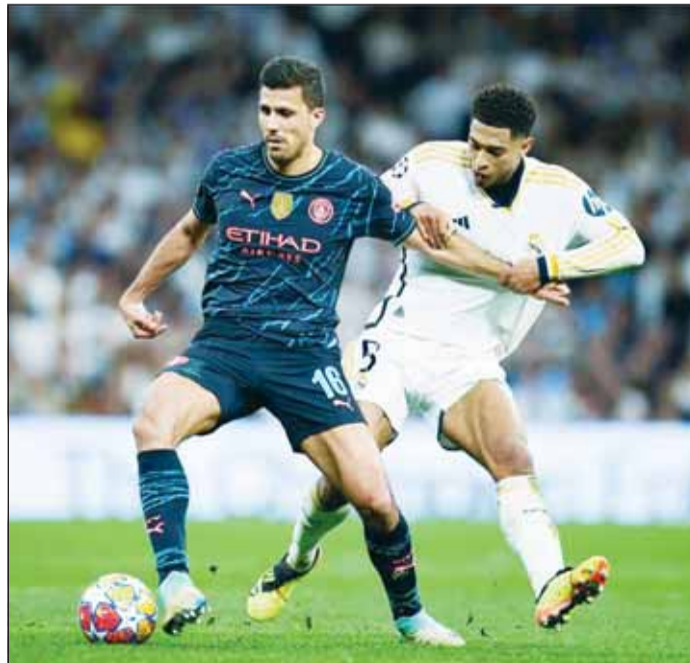
ليلة الحسم فيه دوري الأبطال اليوم

ريال مدريد، صاحب الرقم القياسي في عدد مرات الفوز بالبطولة برصيد 14 لقباً، في الطريق نحو المباراة النهائية التي تجرى في الأول من يونيو المقبل على ملعب (ويمبلي) العريق في العاصمة البريطانية لندن. وصرح هاينز لصحيفة (مونشر ميركور) الألمانية أمس، بأن بايرن ميونخ بإمكانه الصعود للدور المقبل. وقال هاينز: "مع المستوى الذي ظهرنا به في مباراة الذهاب أمام أرسنال، أعتقد أن الفريق قادر على تحقيق ذلك؛ نحن بايرن ميونخ". وأضاف رئيس بايرن "بالطبع أنت بحاجة دائماً للقليل من الحظ في دوري أبطال أوروبا، لكن حقيقة أننا قادرون على الصعود أمام متصدر الدوري الإنجليزي". ويعتبر دوري أبطال أوروبا بمثابة الفرصة الأخيرة لبايرن لتجنب أول موسم منذ عام 2012 دون أي لقب.