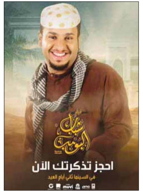
احجز تذكرة الآن

يشهد فيلم "شباب البومب" إقبالا واسعا من الجمهور ويحقق إيرادات قياسية في صالات السينما السعودية والأردنية. وبعد نجاح سلسلة "شباب البومب" لسنوات طويلة على شاشة التلفزيون، يكمل فيلم "شباب البومب" مسيرة النجاح في السينما. وشارك الفنان السعودي فيصل العيسى، تدوينة عبر حساباته الاجتماعية كشف فيها عن النجاح الكبير للفيلم، وكتب، "فيلم شباب البومب، يحقق أرقاماً قياسية في شباك تذاكر العيد، حيث تجاوزت مبيعاته 100 ألف تذكرة في أول أربعة أيام فقط، ما شاء الله تبارك الله". وينتظر بدء عرض الفيلم في الكويت، الإمارات، البحرين،