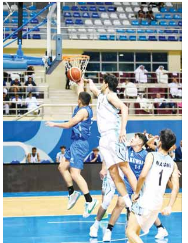
تألق منتخبات السلة للمراحل الستية

من جانبه يريد القادسية الذي يقوده المدرب الأمريكي ستيفنغ تأكيد تفوقه على كأظمة وحسم التأهل إلى المباراة النهائية دون اللجوء إلى لقاء ثالث بينهما. وتغلب الأصفر على خصمه في جميع المواجهات بينما هذا الموسم ما يجعله مرشحا