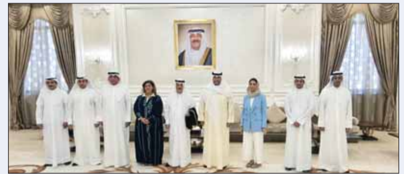
الوزير فيصل الفريدي يترأس الوفد الكويتي المشارك في مؤتمر مسقط

في دول مجلس التعاون والاردن ومصر، إضافة إلى الامانة العامة لمجلس التعاون، وجامعة الدول العربية، ومكتب الأمم المتحدة المعني بالمخدرات والجريمة، ووزارة الخارجية الأميركية والاتحاد الافريقي، ورابطة دول جنوب شرق آسيا. وقالت في المنتدى يهدف إلى تبادل الخبرات وأفضل الممارسات في مجال مكافحة الاتجار بالأشخاص من منظور دول الشرق الأوسط المراعي لطبيعتها الجغرافية والاقتصادية والقانونية الخاصة بها، كما يهدف إلى خلق رؤية موحدة لمكافحة جريمة الاتجار بالأشخاص.