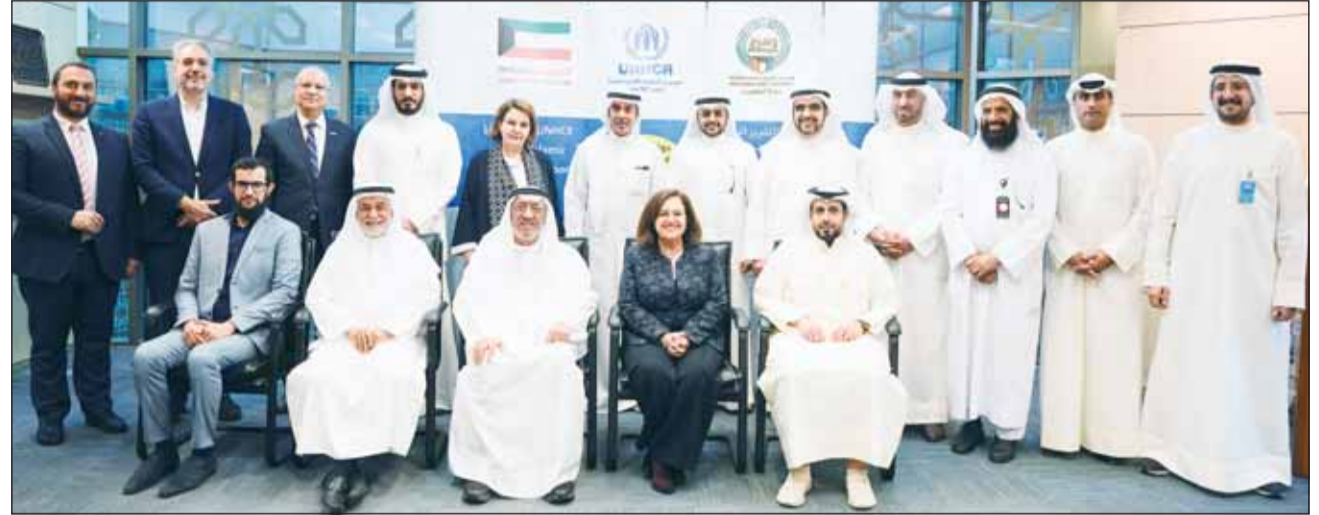
صورة جماعية علم هامش الملتقى

تأكيداً على دوره الفاعل وحرصه على دعم المجتمعات التي يعمل فيها وينتمي إليها، شارك المركز المالي الكويتي "المركز" في الملتقى والجلسة النقاشية بعنوان "مساهمة العمل الخيري الإسلامي في الاستجابة لأزمات النزوح"، بتنظيم من المفوضية السامية للأمم المتحدة لشؤون اللاجئين بالتعاون مع بيت الزكاة الكويتي، وبرعاية وحضور السفير حمد سليمان المشعان، مساعد وزير الخارجية للتنمية والتعاون الدولي وبحضور عدد من مثلي الجهات الحكومية والقطاع الخاص والسلك الدبلوماسي والهيئات الخيرية الشريفة للمفوضية.