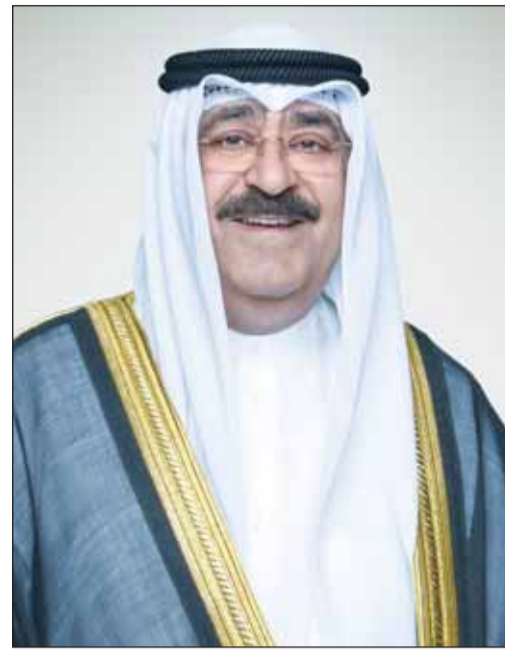
سمو أمير البلاد الشيخ مشعل الأحمد

■ بعث سمو الشيخ الدكتور محمد الصباح رئيس مجلس الوزراء المكلف بتصريف العاجل من الأمور، ببرقية تهنئة إلى بيتر بيلغريني الرئيس المنتخب في جمهورية سلوفاكيا الصديقة ضمنها سموه خالص تهانيه بمناسبة فوزه بالانتخابات الرئاسية في جمهورية سلوفاكيا الصديقة.