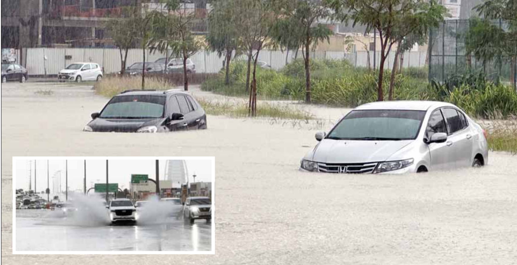
صور اجتاحت منصات التواصل الاجتماعي ووسائل الإعلام لغرق شوارع دبي والإمارات في المياه جراء عاصفة ترافقت مع أمطار بمستوى لم تشهده البلاد منذ 75 عاماً

بمركبته بالرغم من قوة جريان المياه وارتفاع منسوبها الناجم عن تواصل تساقط مياه الأمطار الغزيرة، مضيفة أنه فور تلقي البلاغ تم توجيه الفرق المختصة للمكان وانتشال جثمان المواطن، مهيبه بالمواطنين البقاء في منازلهم وعدم الخروج إلا للضرورة مع أهمية الابتعاد عن مناطق جريان الأودية وعدم المجازفة بأي شكل من الأشكال بالدخول إليها. في غضون ذلك، أعلنت الرئاسة التركية أن الرئيس رجب طيب أردوغان أعرب في محادثة هاتفية مع الرئيس الإماراتي الشيخ محمد بن زايد عن تضامنه مع الإمارات في كارثة الفيضانات التي تلويها.