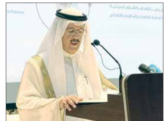
وزير العدل خلال إلقائه كلمته

■ مسقط - كونا، أكد وزير العدل وزير الأوقاف والشؤون الإسلامية فيصل الغريب أمس أن الكويت تولي اهتماماً بالغاً بالتصدي لجريمة الاتجار بالأشخاص عبر سن القوانين والتشريعات التي تعاقب مرتكبي تلك الجرائم بعقوبات رادعة، وتحفظ حقوق الضحايا، وتضمن حمايتهم. وقال الغريب في كلمة ألقاها في انطلاق أعمال الدورة الخامسة للمنتدى الحكومي لمكافحة الاتجار بالأشخاص في الشرق الأوسط التي تستضيفها العاصمة العمانية مسقط لمدة يومين إن "دولة الكويت وفي إطار سعيها الحثيث نحو تجريم جميع أنماط الاتجار بالأشخاص أصدرت القانون 91 لسنة 2013 بشأن مكافحة الاتجار بالأشخاص وتهريب المهاجرين، واشتمل على تعريف يتفق في مضامينه كلية مع التعريف الوارد ببروتوكول منع وقوع ومعاينة الاتجار بالبشر، وخاصة النساء والأطفال، إضافة إلى تجريم ومعاينة مرتكبي تلك الجرائم بعقوبات رادعة. وذكر أن مجلس الوزراء قام بإصدار قرار اعتماد