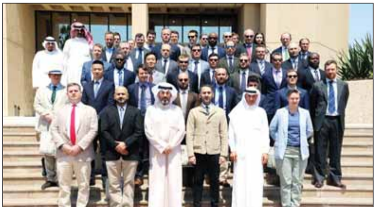
صورة تذكارية للوفد البريطاني مع مسؤولي الصندوق الكويتي للتنمية