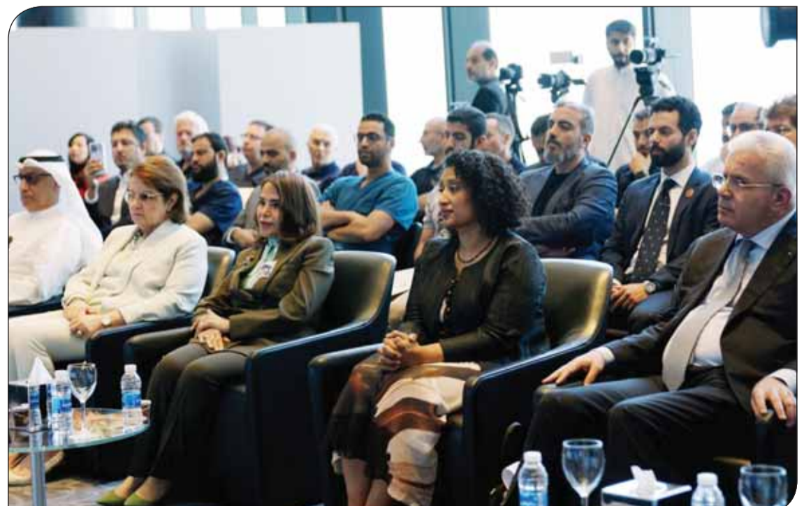
من اليمين سفير فلسطين لدى الكويت وممثلة السفارة البريطانية وشيخة البحر ومها البرجس