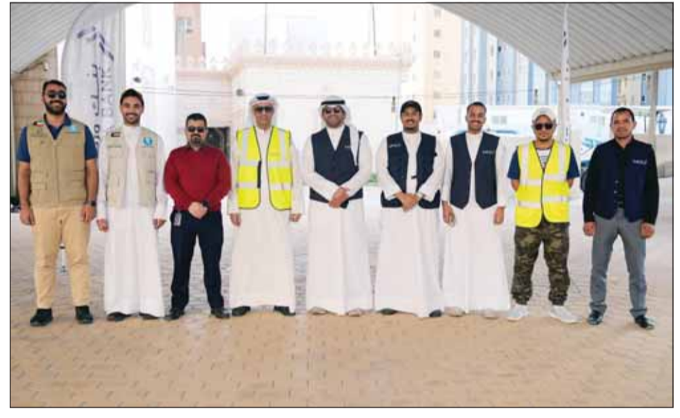
فريق عمل البنك

■ اختتم بنك وربة برنامج مبادراته التي أطلقها خلال شهر رمضان المبارك 2024، والذي تضمن العديد من الأنشطة والمساهمات الاجتماعية الهادفة إلى التواصل اليومي مع مختلف فئات المجتمع من خلال مساهماته المختلفة والأعمال التطوعية والخيرية بما يعود عليهم بالنفع ومد يد العون، وقد حث برنامج هذا العام بالكثير من الأنشطة والفعاليات سواء التي تستهدف العملاء أو الجمهور بصفة عامة من المواطنين والمقيمين سعياً لتقديم نموذج يحتذى به في مجال المسؤولية المجتمعية والتنمية المستدامة، وسعياً منه إلى تأصيل العمل التطوعي بين موظفيه ونشر ثقافة التطوع في المجتمع، حيث شكل بنك وربة فريقه التطوعي المكون من مجموعة من موظفيه من مختلف الإدارات للمشاركة في مبادراته خلال الشهر الفضيل، معرباً عن جاهزية وحماسة الفريق للقيام بواجباته تجاه المجتمع