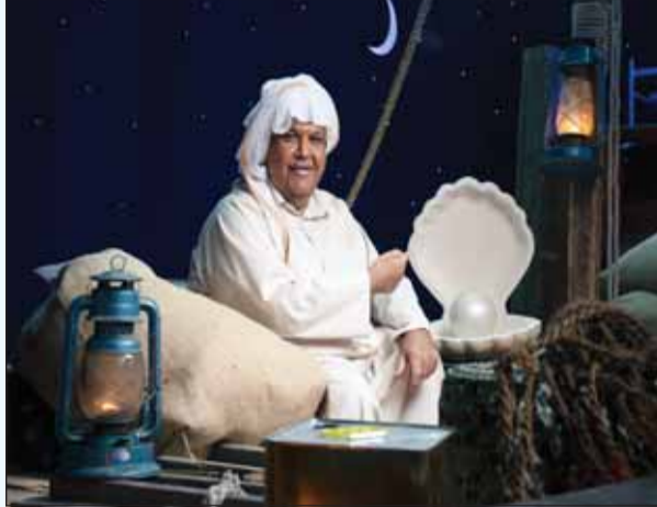
نبيل شحيل خلال تصوير إعلان مليونير الدانة

■ مع انتهاء شهر رمضان الفضيل، اختتم بنك الخليج حملته الاعلانية بالتعاون مع النجم الغنائي المحبوب نبيل شحيل، والتي شهدت تصوير 3 إعلانات في قالب فكاهي، حصدت نحو 32 مليون مشاهدة على مختلف وسائل التواصل الاجتماعي.