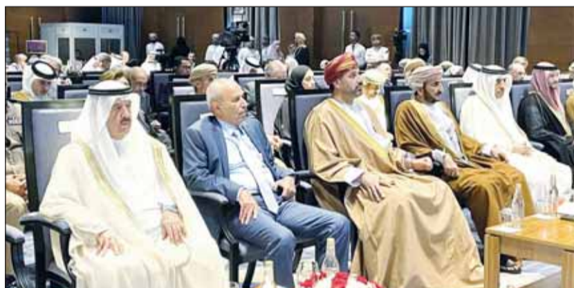
الوزير فيصل الغريب في مقدمه حضور المنتدى الحكومي لمكافحة الاتجار بالأشخاص