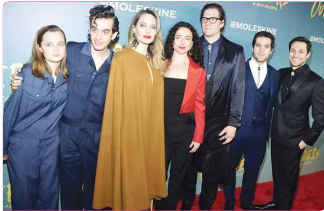
جولي وفيفيان مع بعض فريق مسرحية "The Outsiders"

والبريطانية، مع بعض المقربين من نجمة هوليوود جولي، وعلمت عن طريقهم أن أنجلينا، تعمل حالياً على مجموعة جديدة من المشاريع خارج مجال السينما والفن عمومًا، حيث ترغب جولي، بتعزيز نشاطها التجاري في مجموعة من المجالات المختلفة، لكي تتاح لها فرص الاستثمار في مجال العمل، خلال السنوات التي ستقضيها بعد اعتزالها العمل السينمائي بشكل قاطع والتفرغ للعمل الإنساني التطوعي وكذلك أسرتها، مثلما أعلنت أكثر من مرة.