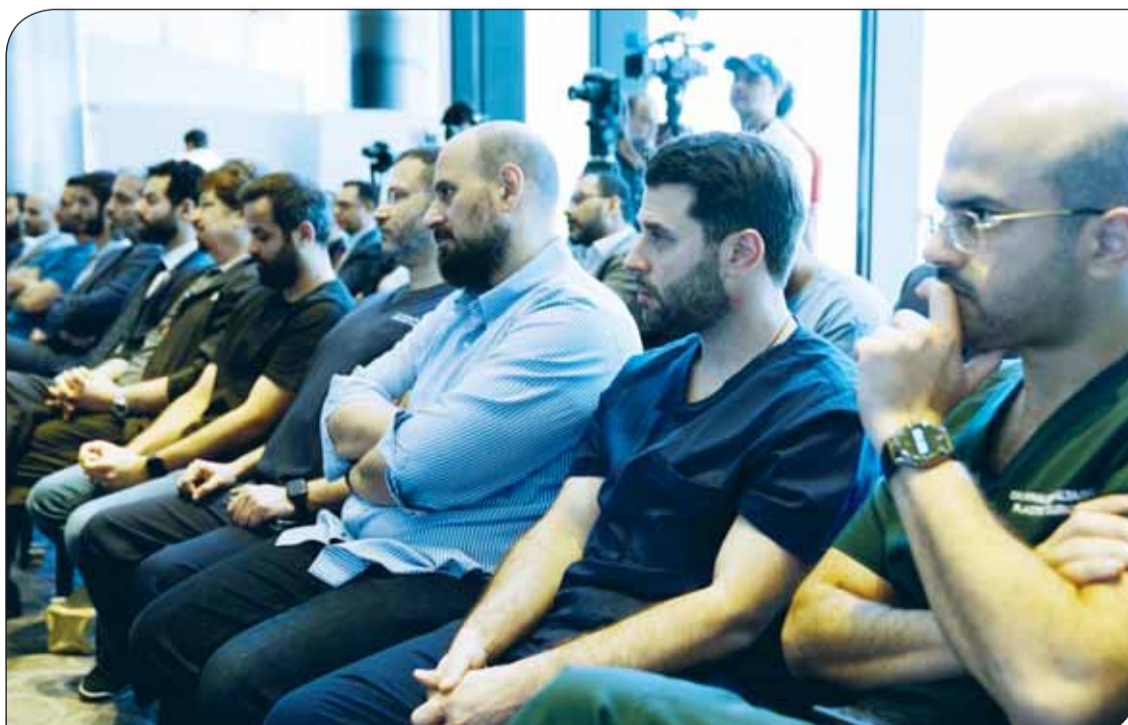
الكوادر الطبية الكويتية خلال ختام البرنامج التدريبي

وفي كلمته رحب الصقر بالحموض، معبراً عن سعادة البنك بهذا التعاون مع جمعية الهلال الأحمر الكويتي (David Nott foundation)، الذي يأتي ضمن شراكة البنك الاستراتيجية مع الجمعية والتي يسعى من خلالها إلى دعم مبادرات الجمعية الإنسانية داخل دولة الكويت وفارجها. وأوضح أنه في إطار جهود بنك الكويت الوطني الرامية لإغاثة أهلنا في قطاع غزة، ودعمهم في وجه العدوان الإسرائيلي، جاءت رعاية البنك لهذا التعاون بين جمعية الهلال الأحمر الكويتي ومؤسسة ديفيد نوت البريطانية التي