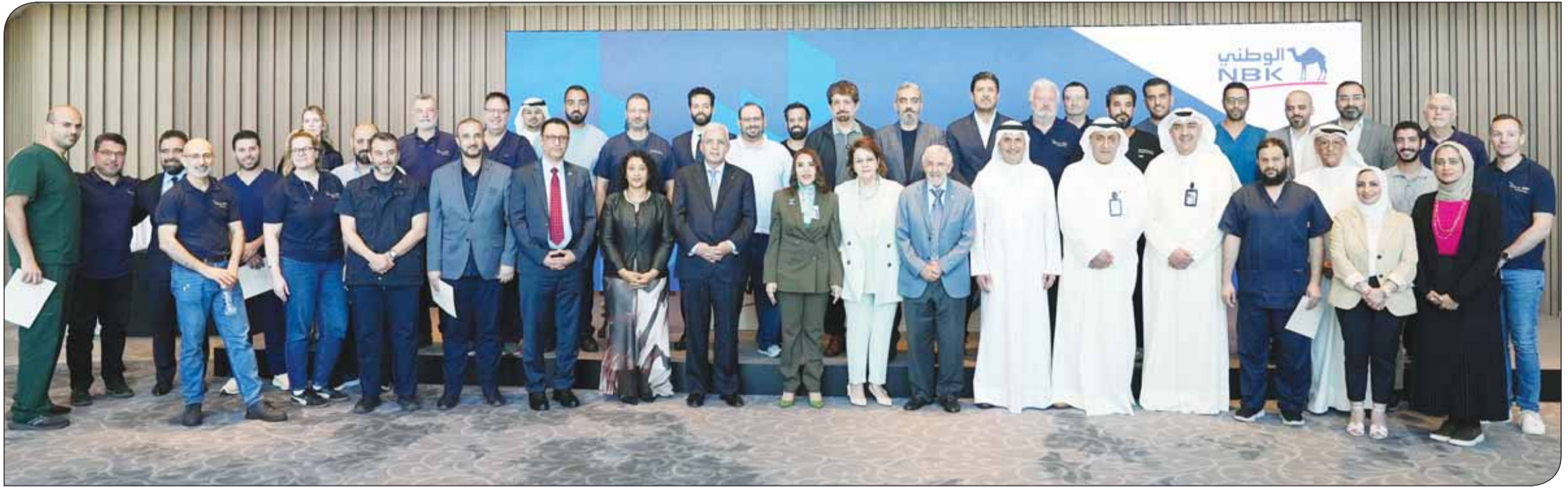
لقطة جماعية للادارة التنفيذية