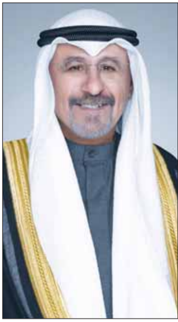
سمو الشيخ د.محمد الصباح