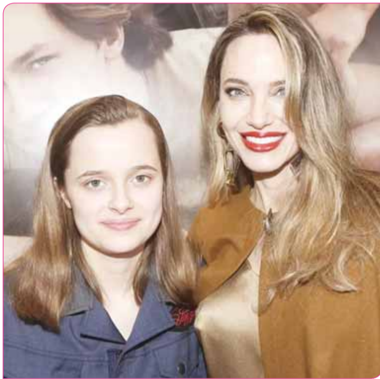
أنجلينا جولي وابنتها فيفيان