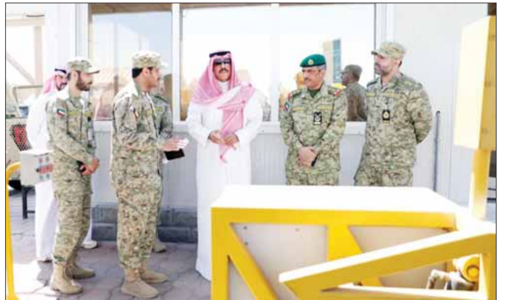
نائب رئيس الحرس الوطني الشيخ فيصل النواف متفقاً أحد المواقع

لمجلس الوزراء وترشيح أعضاء مجلس الوزراء. وقال الحرس الوطني في بيان إن الشيخ النواف أعرب في البرقية عن سروره بهذه المناسبات، داعياً الله تعالى أن يوفق الشيخ العبدالله "لما فيه خير وطننا العزيز وأن يعينه على مواصلة المسيرة الوطنية التي تتسم بالجهد المخلص والعطاء الصادق لتحقيق آمال وطموحات أبناء الكويت المخلصين". وإبتغى إلى الله سبحانه وتعالى أن يمتع الشيخ العبدالله بموفقية الصحة وتتمام العافية "وأن يحفظ كويتنا العزيزة ويديم عليها وعلى شعبها نعم الأمن والأمان والاستقرار والتقدم والازدهار في ظل القيادة الحكيمة لسمو أمير البلاد، القائد الأعلى للقوات المسلحة".