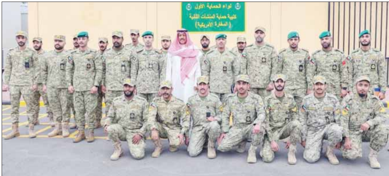
الشيخ فيصل النواف متوسلاً فباط وعناصر حماية السفارة الأميركية