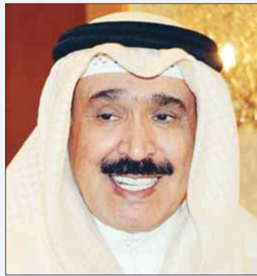
العميد رئيس التحرير أحمد الجارالله