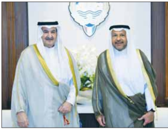
محافظ الفروانية الشيخ عذبي الصباح مستقبلاً الشيخ دعيج الجابر

■ استقبل محافظ الفروانية الشيخ عذبي الصباح بمكتبه صباح أمس في ديوان عام المحافظة الشيخ دعيج جابر العلي ومحافظ حولي علي الأصفر ومحافظ مبارك الكبير سابقاً محمود بوشهري والدكتور براك النون ومختار منطقة العمرية سعد الطشة ومختار صباح الناصر بدر سحاب حيث هنأوه بمنصبه الجديد، متمنين له التوفيق والسداد في مهام عمله.