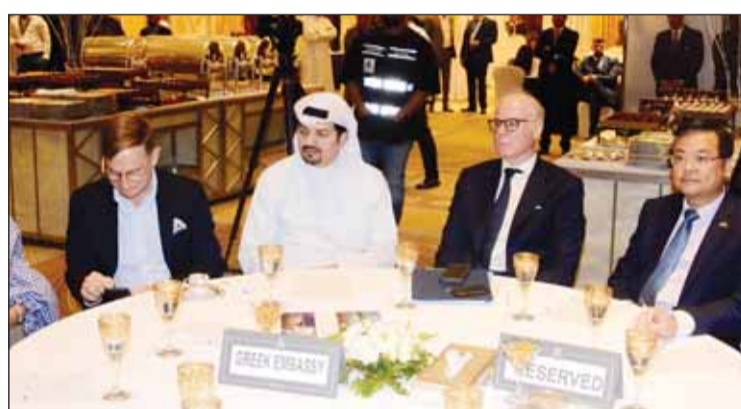
جانب من المشاركين في الورشة

وذكر أن السياحة تشكل الركيزة الصلبة للاقتصاد اليوناني الذي يسجل الآن نمواً كبيراً، مبرحاً عن دهشته من مدى معرفة من يلتقيهم من الكويتيين بالمناطق اليونانية ومديتهم عن ذكرياتهم فيها، منها بالروابط التاريخية التي كانت "تربطنا منذ العصر المهنستي عندما وضع الإسكندر الأكبر بصمته على هذه الأرض". وأشار إلى أن ما يميز اليونان كوجهة سياحية، يكمن في حقيقة أنه يمكن زيارتها على مدار العام، وليس بشكل خاص