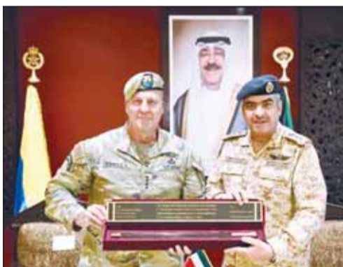
رئيس الأركان وقائد القيادة المركزية الأميركية

بحث رئيس الأركان العامة للجيش الفريق الركن طيار بندر المزين في ديوان رئاسة الأركان مع قائد القيادة المركزية الأميركية الفريق أول مايكل كوريليا والوفد المرافق له أهم الموضوعات ذات الاهتمام المشترك وسبل تعزيزها وتطويرها بين البلدين الصديقين.