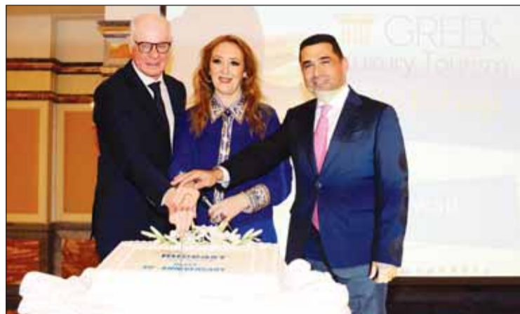
سفير اليونان يشارك في قطع قالب الحلوى

نظمت السفارة اليونانية ورشة عمل بعنوان "السياحة الفاخرة" للتعريف بمقومات السياحة في جزر اليونان، بمشاركة نائب حاكم منطقة كريت كوتسو غلو، إلى جانب عدد كبير من ممثلي أكبر المنتجعات اليونانية الفاخرة، الذين حضروا هذا الحدث من أجل نقل تجاربهم في صناعة السياحة إلى زملائهم الكويتيين وكذلك إقامة شراكات معهم.