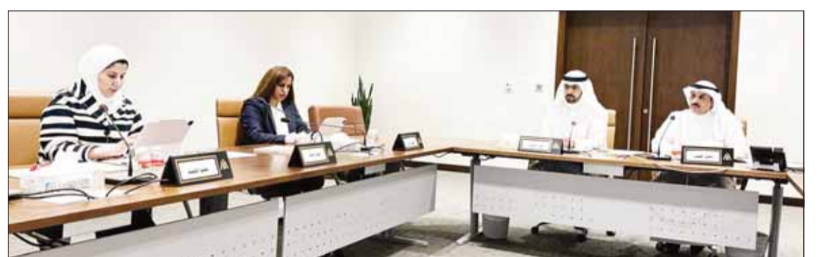
جانب من اجتماع لجنة محافظة الجھراء في المجلس البلدي