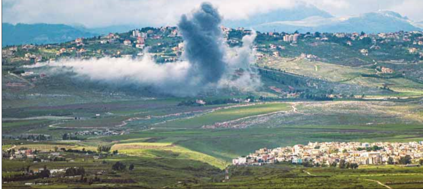
دخان يتصاعد علمه الجانب اللبناني من الحدود بين إسرائيل ولبنان بعد غارة إسرائيلية