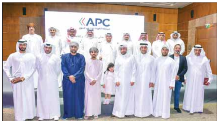
الفائزون بمسابقة التصوير الجوي مع أعضاء لجنة التحكيم

■ أعلنت شركة "دي جي إي" عن أسماء الفائزين المشاركين بمسابقة الكويت للتصوير الجوي التي نظمتها فرع الشركة في الكويت بنسختها الثالثة خلال حفل أقامته أول من أمس برعاية وزير الاعلام والثقافة عبدالرحمن المطيري، وبحضور ممثل الوزير، وكيل وزارة الاعلام المساعد لقطاع الخدمات الإعلامية والإعلام الجديد سعد العازمي، وبمشاركة عدة جهات حكومية ووافضة. وضمت المسابقة مشاركات من جميع دول الخليج، لإبراز جمالية طبيعتها من بر وبحر وسماء وتضاريس وعمران، من خلال أكثر من 1000 صورة مشاركة في 3 فئات؛ الأبيض والأسود - الطبيعية والحياة الفطرية - المدن والعمران، حيث تم اختيار 3 فائزين وفائز رابع لجائزة التميز من كل فئة من بعد التصفيات التي صفت 10 متاهلين في كل فئة. وحصل على جائزة التميز من فئة الأبيض والأسود المتسابق عبدالله العبيدي من السعودية بينما