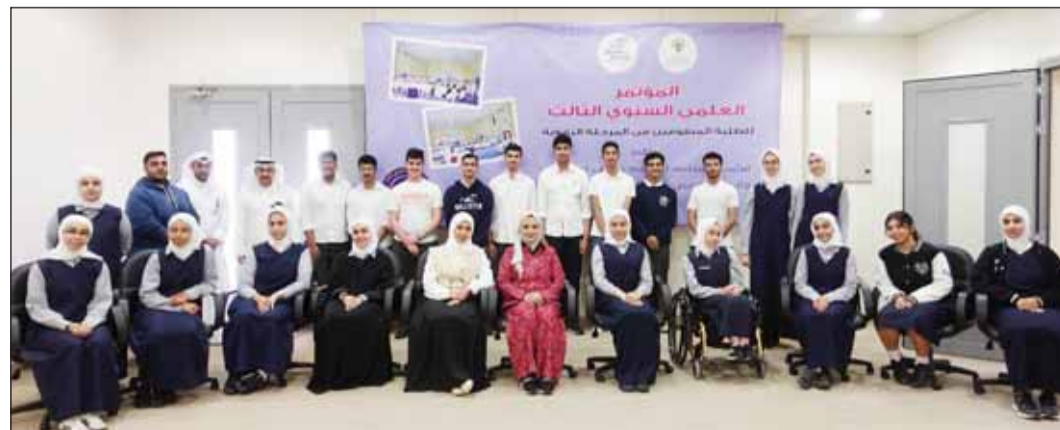
جانب من الطلبة المشاركين في المؤتمر

شملت عدة محاور منها الفرص المتاحة للطلاب المعوقين والمعوقات التي تواجهها إلى جانب كيفية تنمية الثقافة العلمية والمهارات التي يحتاجها والعوامل التي تساهم في استمرار مستواه العلمي.