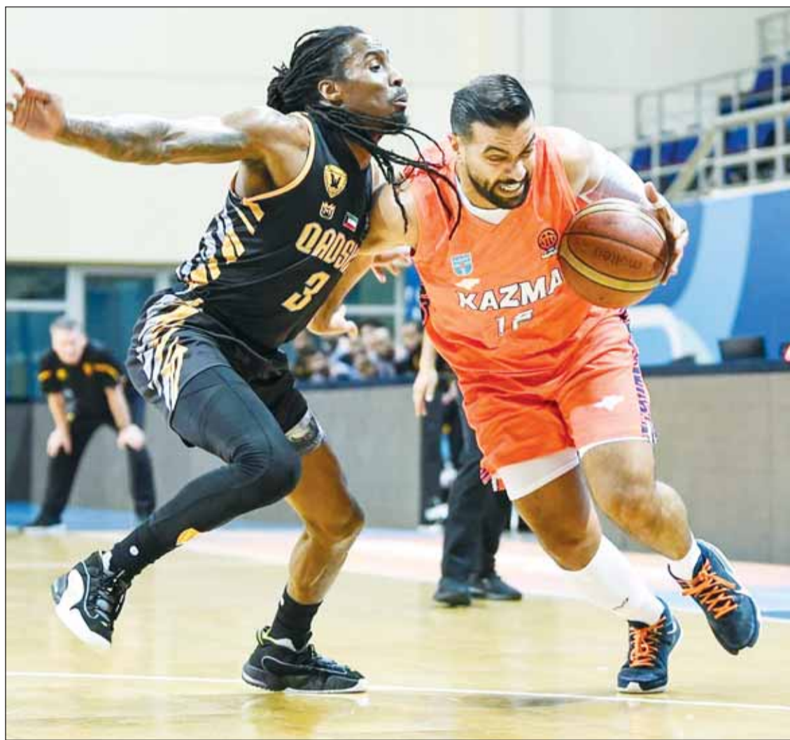
البرتقالي أجبر الأصفر على الذهاب لمباراة فاصلة