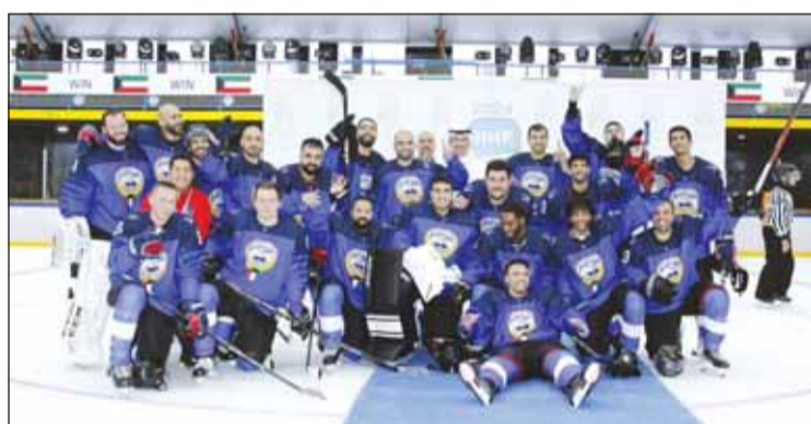
أزرق الهوكي يأمل بالانتقال للمستوى الثالث

يطمح منتخبنا الوطني لهوكي الجليد، لحصد لقب بطولة كأس العالم لهوكي الجليد للرجال (2024) للمستوى الرابع، عندما يلتقي منتخب أندونيسيا في السادسة من مساء اليوم ضمن ختام البطولة، يسبق لقاء ماليزيا ومغوليا في الخامسة مساءً.