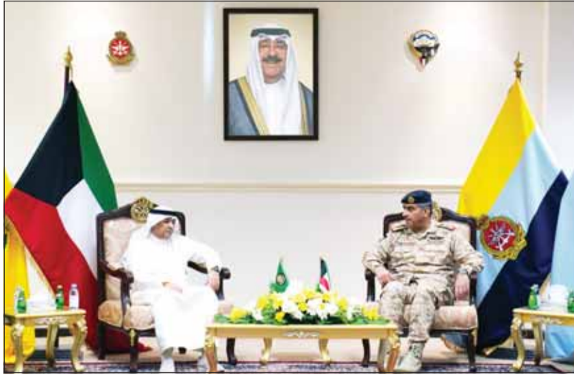
رئيس الأركان مستقبلاً الأمين العام لمجلس التعاون الخليجي