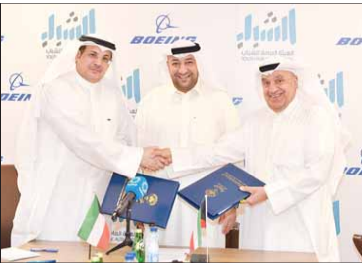
جانب من مراسم توقيع اتفاقية "الشباب" و"بوينغ" بحضور الوزير د. داود معرفي

وتنمّن الحرس الكبير للوزير معرفي على سرعة إنجاز هذا الأمر، إذ سيحرص الطرفان على تنفيذه على أعلى مستوى.