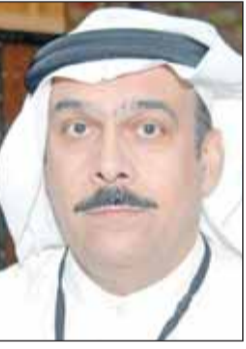
المستشار نصر آل هيد

■ قضت محكمة الاستئناف خلال جلستها برئاسة المستشار نصر سالم آل هيد بحبس مواطن يعمل موظفًا في بنك 5 سنوات بعدما استولى على 100 ألف دينار من حساب وافد.