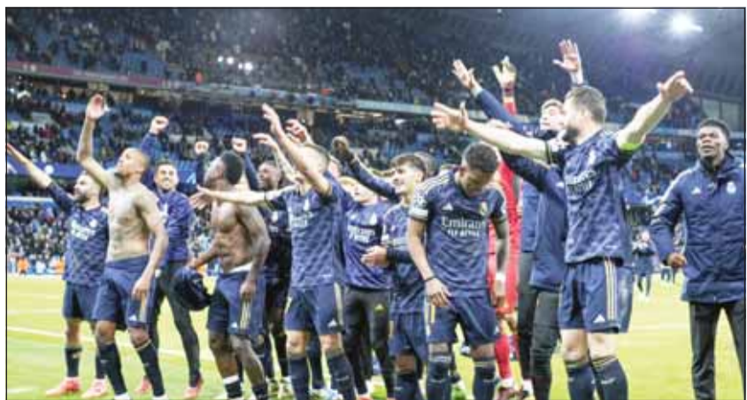
فرحة نجوم الميرنغفيه بالتأثر من السيتيه