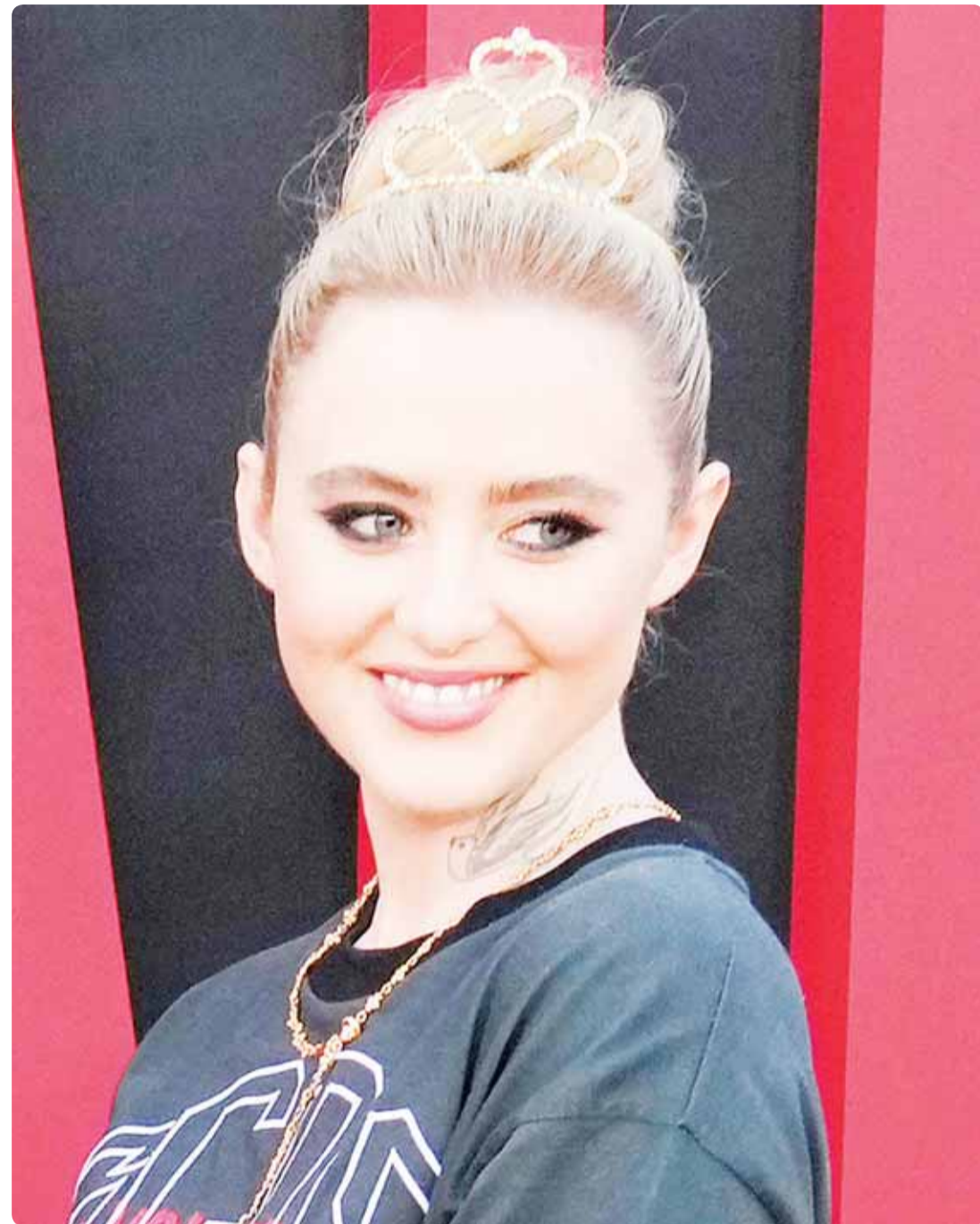
الممثلة الاميريكية كاثارين نيبوتن خلال حضورها عرض فيلم "بيغيل" في لوس أنجلوس