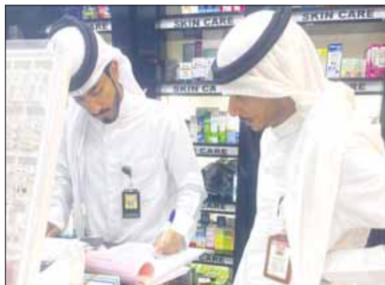
الفريق الرقابي خلال تدوير إحدى المخالفات

وأضاف: إن فرق البلدية تقوم بهذه الجولات على مدار الشهر خلال الفترتين الصباحية والمسائية لرصد جميع المخالفات، مؤكداً أن الفرق لن تدخر جهداً في رصد ومتابعة المخالفين للشروط واللوائح والأنظمة المعمول بها في البلدية للحد من كل المظاهر السلبية بجميع المناطق. وأشار إلى استمرار حملات إزالة التعديات على أراضي الدولة في مناطق البر جنوب وشمال البلاد، مبيحاً أن قسم إزالة المخالفات بمحافظة الأحمدية ينفذ حملة واسعة جنوب مدينة صباح الأحمد لإزالة تعديات على أراضي الدولة على طريق (أم صق) وأسفرت الحملة عن إزالة محميات خاصة مسورة بأسلاك شائكة وأسواق عشوائية لبيع الأعلاف.