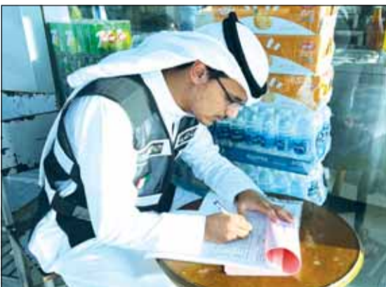
... وخلال تسجيل مخالفة