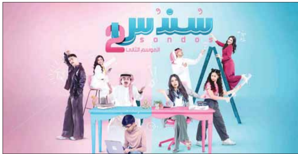
بوستر "سندس 2"