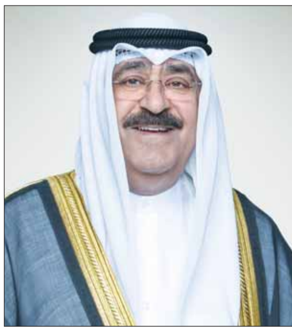
سمو أمير البلاد الشيخ مشعل الأحمدم

متمنياً سموه له موفقور الصحة والعافية ولجمهورية زيمبابوي وشعبها الصديق كل التقدم والازدهار.