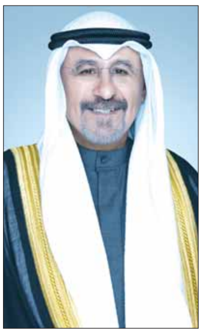
سمو الشيخ د.محمد الصباح