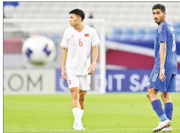
الأزرق مطالب بعهور أوزبكستان غداً