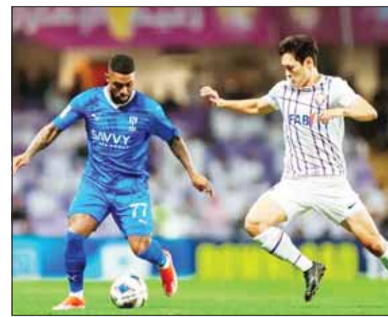
العين أوقف انتصارات الهلال

■ أوقف العين الإماراتي سلسلة الانتصارات التاريخية لضيفه الهلال السعودي بعدما هزّمه 2-4 أول من أمس، في ذهاب نصف نهائي دوري أبطال آسيا بمباراة كان بطلها المغربي سفيان رحيمي بعد تسجيله "هاتريك" لأصحاب الأرض.