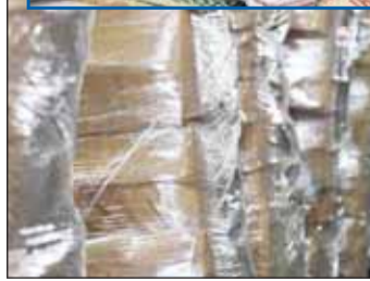
الكراتين المضبوطة وفيه الإطارات مجموعة من أكياس التنباك

■ تمكن رجال الجمارك بميناء الشويخ من ضبط نحو 2,5 مليون كيس من مادة التنباك، بإجمالي نحو 5 أطنان، قادمة من دولة خليجية بهدف إدخالها إلى البلاد. وفي التفاصيل، ضبط رجال الجمارك - إدارة التفقيش والاستيداع الجمركي حوطين بحجم 40 قدماً قادمين من دولة خليجية، وتحمل بياناً جمركياً «بطانيات»، حيث تم العثور بالحاوية الاولى على 672 كرتونًا، وكل كرتون يحتوي على 20 خيشة تنباك، كل منها تحتوي على 25 باكييتًا، وزن الباكييت 50 غرامًا.