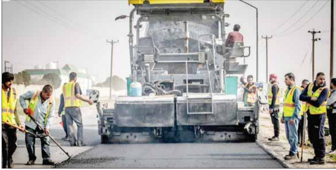
جانب من عمليات الصيانة العاجلة للطرق

الطرق في المناطق الزراعية بالمنطقة الشمالية الذي تبلغ كلفته 1,911 مليون دينار من المقرر انتهائه في 27 أغسطس المقبل.