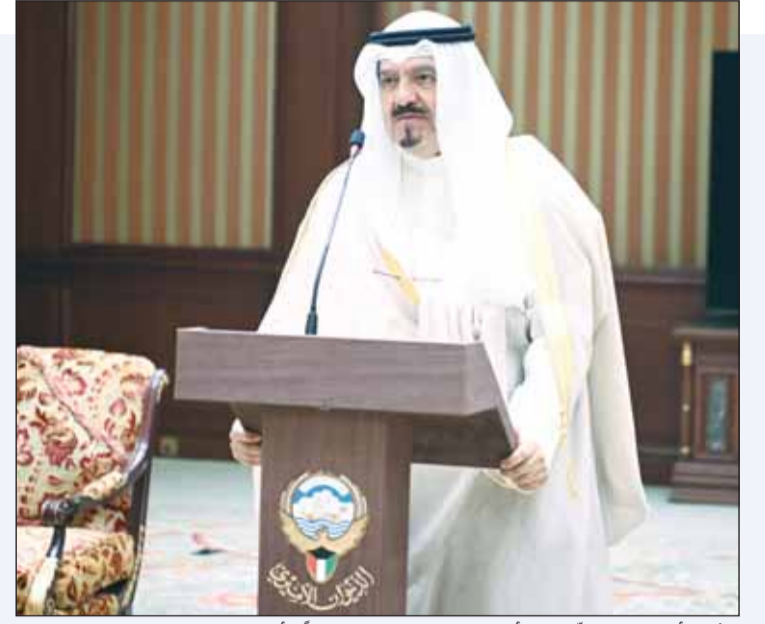
الشيخ أحمد العبدالله خلال أدائه اليمين الدستورية نائباً للأمير

لمجلس الوزراء، وبناء على ما تقتضيه المصلحة العامة، أمرنا بالآتي، "يعين الشيخ أحمد العبدالله نائباً للأمير طوال فترات غياب سمو الأمير عن البلاد، ويستمر العمل بهذا الإجراء إلى حين تعيين ولي العهد، ويلقى كل نص يتعارض مع أحكام هذا الأمر، وعلى رئيس مجلس الوزراء تنفيذ هذا الأمر، ويبلغ مجلس الأمة به، ويعمل به من تاريخ صدوره وينشر في الجريدة الرسمية".