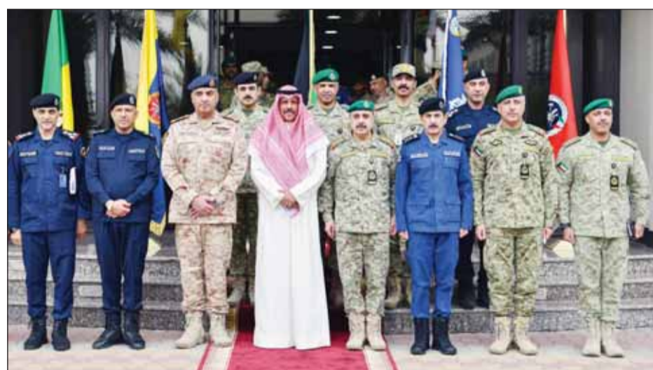
الشيخ فيصل النواف متوسلاً قيادات الجهات المشاركة خلال افتتاح التمرين

الإطفاء العام، تجسداً لأهمية العمل المشترك وتبادل الخبرات وتوحيد المفاهيم العملياتية المشتركة في إدارة الأزمات والطوارئ. على خط مواز، أشاد رئيس قوة الإطفاء العام الفريق خالد المكراد بالجاهزية والقدرة التي تم تنفيذها في تمرين مراكز القيادة ( درع ) المشترك صباح أمس. وأكد المكراد أن مثل هذه التمارين تساهم في التكامل بين الجهات العسكرية وتعزز الأمن المجتمعي لتطور القدرات في مجال إدارة الكوارث والأزمات للمحافظ على أمن الوطن، مضيفاً أن جميع إمكانات قوة الإطفاء العام تحت تصرف الحرس الوطني والجيش ووزارة الداخلية لتحقيق الأهداف المرجوة من هذه التمارين.