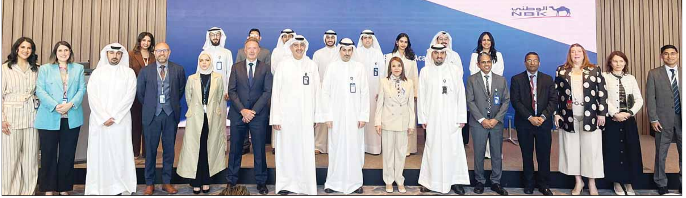
قيادات البنك مع الخريجين

العلاني: الكويت لديها جيل موهوب وواعد يمتلك مهارات وقدرات احترافية في التقنية والرقمنة