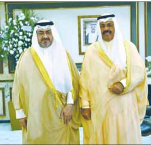
محافظ العاصمة مسبقاً سمو الشيخ أحمد النواف

استقبل محافظ العاصمة الشيخ عبدالله سالم العلي في مكتبه في ديوان عام المحافظة صباح أمس سمو رئيس مجلس الوزراء الأسبق الشيخ أحمد النواف لتقديم التهنئة بمناسبة توليه الثقة السامية، وتسلمه مهام عمله محافظاً لمحافظة العاصمة.