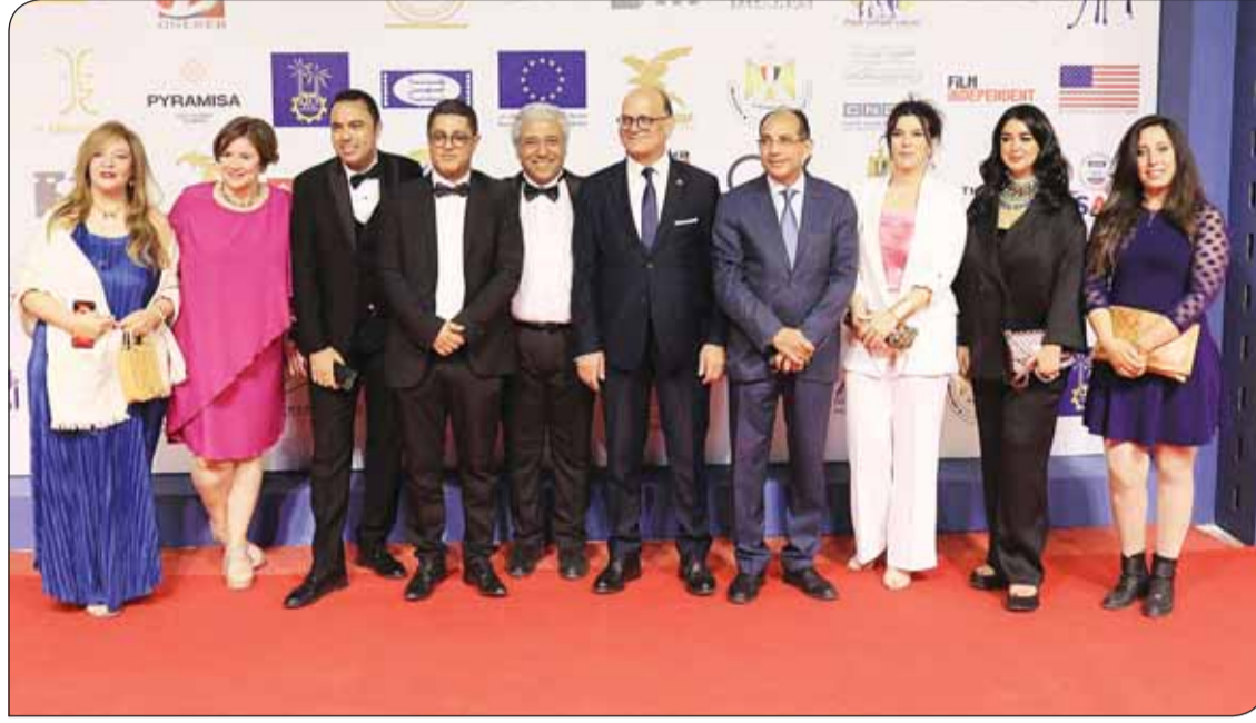
إدارة مهرجان "أسوان أفلام المرأة" وبعض الضيوف