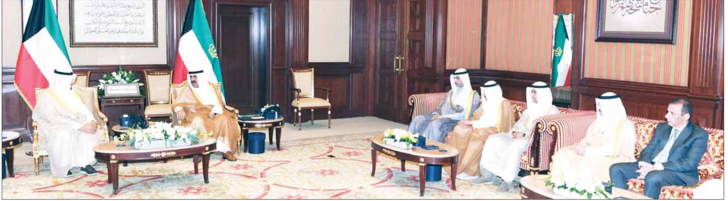
سمو أمير البلاد الشيخ مشعل الأحمد لأمه استقباله الشيخ أحمد عبدالله بحضور كبار المسؤولين بالديوان الأميري