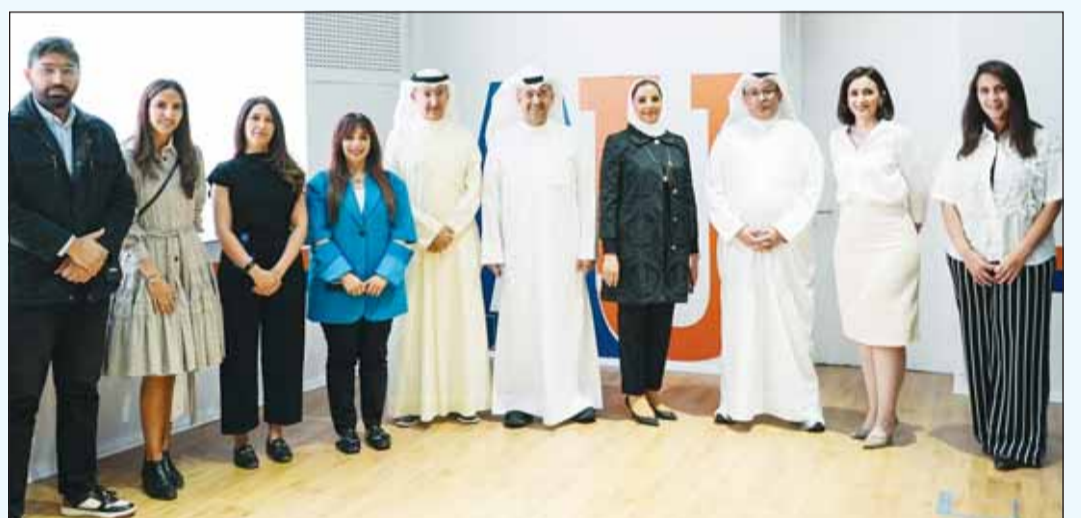
الخشيبة متوسطاً مسؤولي زين والجامعة الأسترالية خلال حفل افتتاح المنتدى

بتسريع المئات من الشركات الناشئة، والتي نجح العديد من أصحابها بدخول سوق العمل والتنافس فيه حتى اليوم، ليس في الكويت فحسب، بل وفي المنطقة، وفي الـ 24 شهراً السابقة، جمعت الشركات الناشئة المشاركة في برنامج ZGI ما يفوق 17,6 مليون دولار من الاستثمارات. كما حصص برنامج ZGI العام الماضي على جائزة "أفضل مبادرة لتمكين نظم الأعمال بالمنطقة" من مجلة "Entrepreneur الشرق الأوسط" المرموقة، وهي الجائزة التي أعت تقديرها وتأكيداً لإنجازات زين في تسريع منظومة الشركات التكنولوجية الناشئة وتمكين المبادرين في الكويت والمنطقة. كما توهم زين إيماناً عميقاً بأهمية مفهوم الابتكار، وصلته الوثيقة بنجاح أي شركة ناشئة ونموها المستدام، ولهذا فقد أطلقت زين مبادراتها "وطن الابتكار" لتشمل جميع جهودها ومبادراتها لتعزيز الابتكار في المجتمع. وتستهدف هذه المبادرة الشباب والمبادرين بشكل خاص، وتسعى لتقديم جيل متمكن رقمياً لديه القدرة على مواكبة متطلبات سوق العمل الحديث، ومن خلال شركات زين المثمرة مع العديد من الشركات على المستوى المحلي والإقليمي والعالمي.