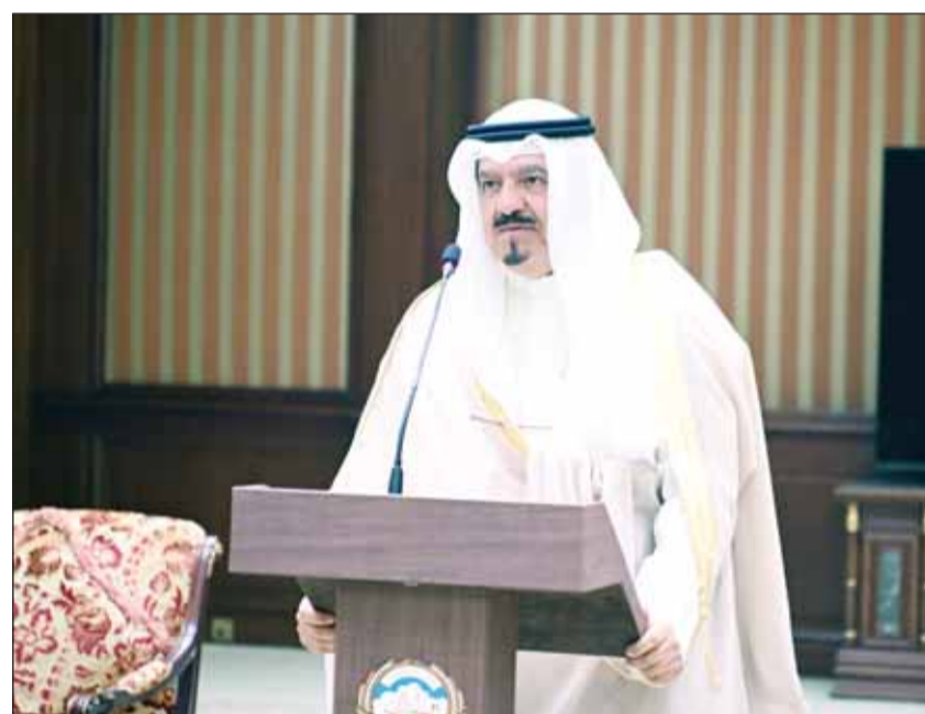
الشيخ أحمد عبدالله يؤدي اليمين الدستورية

استقبل سمو أمير البلاد الشيخ مشعل الأحمد رئيس مجلس الوزراء المكلف بتشكيل الحكومة الجديدة الشيخ أحمد عبدالله أداء اليمين الدستورية بمناسبة تعيينه نائباً للأمير خلال فترات غيابه خارج البلاد، وحضر مراسم أداء القسم كبار المسؤولين بالديوان الأميري. وكان أمر أميري صدر في وقت سابق أمس بتعيين الشيخ عبدالله نائباً للأمير، وجاء في نص الأمر الأميري، أنه بعد الاطلاع على الدستور، وعلى قانون توارث الإمارة رقم 4 لسنة 1964، وعلى الأمر الأميري الصادر بتاريخ 22 جمادى الآخرة 1445 هجري الموافق 4 يناير 2024 بتعيين رئيس مجلس الوزراء وعلى الأمر الأميري الصادر بتاريخ 12 رجب 1445 هجري الموافق 24 يناير 2024م بتعيين نائب للأمير، وعلى الأمر الأميري الصادر بتاريخ 6 شوال 1445 هجري الموافق 15