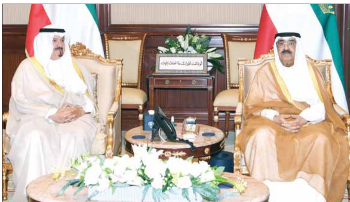
سمو الأمير الشيخ مشعل الأحمد مستقبلاً رئيس مجلس الوزراء المكلف الشيخ أحمد عبدالله