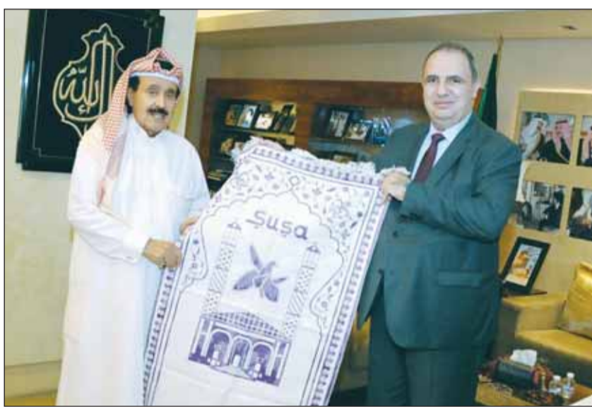
العميد الجار الله يتلقى واحدة من الهدايا التذكارية من سفير أذربيجان