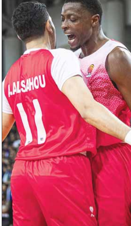
لاعبو سلة الكويت نجحوا فيه هزيمة المنامة

الربع الأول 27-16. متقدماً بفارق 9 نقاط 63-54. وتحسن أداء المنامة في بداية الربع الثاني وتمكن من تقليص الفارق وذلك بعد تراجع أداء الكويت، 6 نقاط 40-34. وعاد الأبيض إلى فرض سيطرته في الربع الثالث