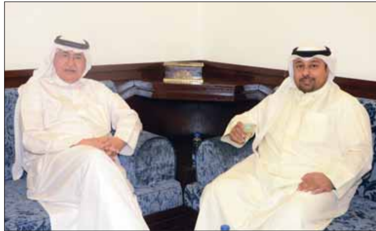
د.عبد الوهاب الفوزان وسليمان البعيجان

عقب وزير الصحة الأسبق د. عبدالوهاب الفوزان وشدد على ضرورة قيام وزارة الكهرباء بتفعيل الضبطية القضائية للقضاء على السلوكيات الخاطئة في التعامل مع خدمة الكهرباء والماء ومنها غسل السيارات والمنازل بالمياه من قبل الخدم في المنازل وغيرها من السلوكيات السلبية، مشيراً إلى أن تكلفة الكهرباء والماء قليلة في الكويت ما يجعل البعض يهدر في استهلاكه ولا بد من معالجة هذه المشكلة لتوفير المبالغ الطائلة على الدولة.