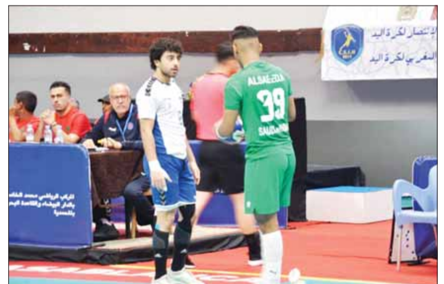
اليد خسر من الأخضر السعودي

السعودية مع المغرب، وغدا الجولة الأخيرة بلقاء الكويت والجزائر، والمغرب مع تونس.