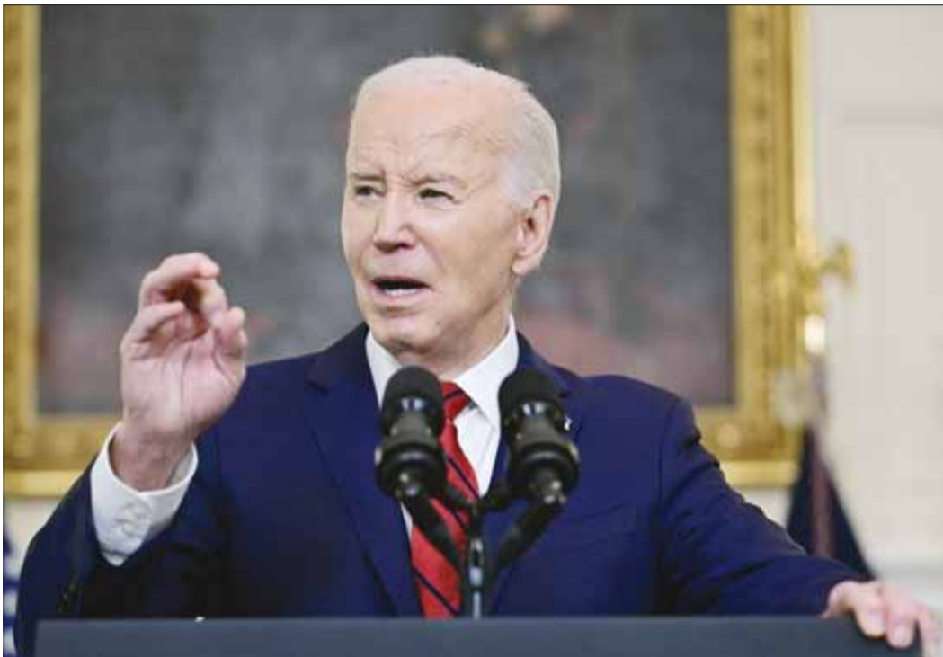
الرئيس الأميركي جو بايدن معلنا تصديقه على قانون للأمن القومي لتقديم مساعدات إلى أوكرانيا وإسرائيل (وكالات)

■ غزة، عواصم - وكالات، أعلن جيش الاحتلال الإسرائيلي أمس، أن قواته شحنت لواءين احتياطيين إضافيين، استعدادا لاجتياح مدينة رفح، وكان تم نشر الأولوية في السابق على حدود دولة الاحتلال مع لبنان، غير أنه في الأسابيع الأخيرة، تدرت على عمليات في قطاع غزة، وقال الجيش في بيان "تدريب الجنود على فنون قتالية وتعلموا الأفكار والدروس الرئيسية من القتال والمناورات البرية في قطاع غزة حتى الآن".