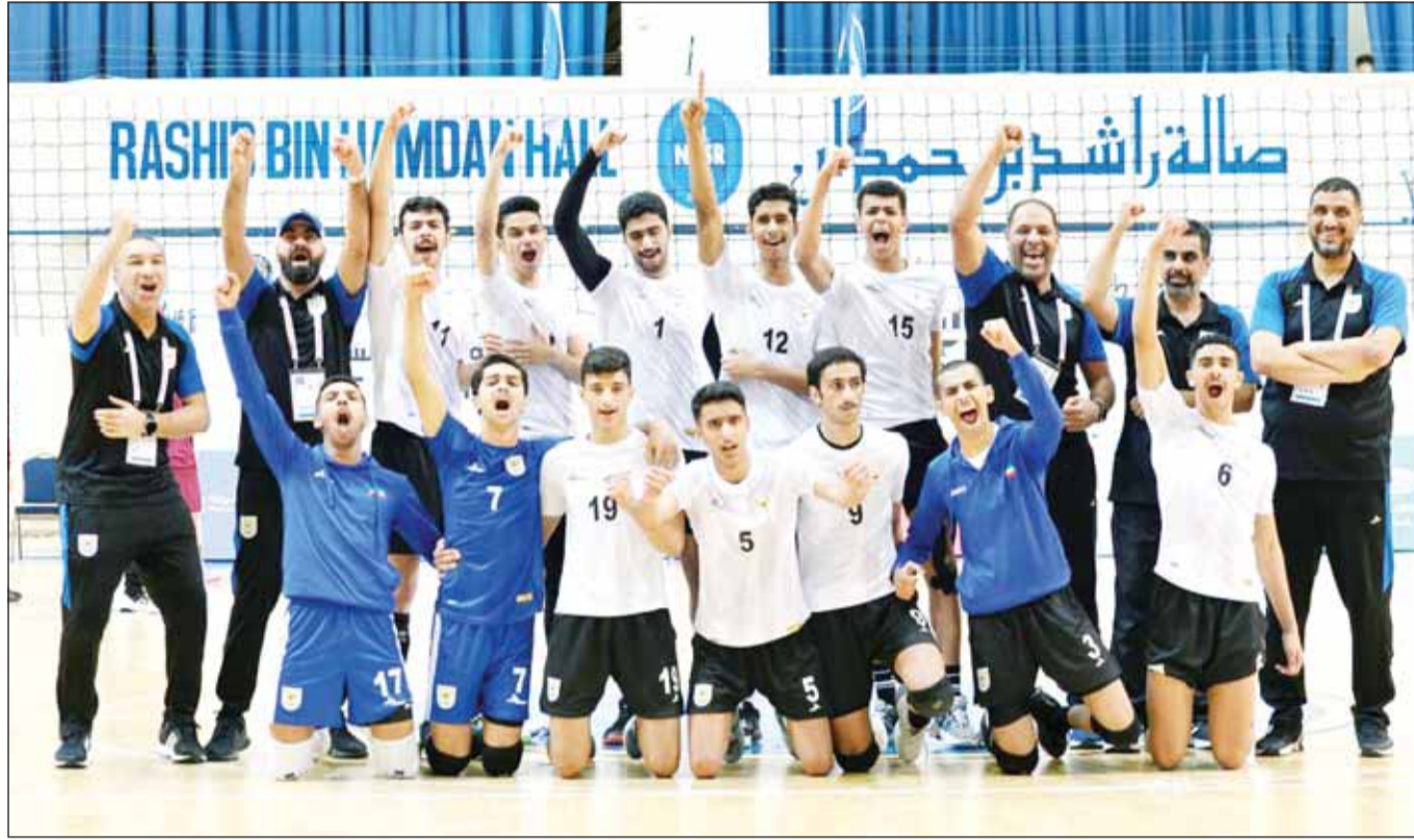
فرحة أزرق الطائرة بالفوز على الصنابير في "الألعاب الخليجية"

من جانب آخر، يصل اليوم وفد منتخب كرة السلة الثلاثية 3x3 الدورة في اجتماعها قبل تعديل مباريات في حال تطلب الأمر بحيث تكون المباراة الأخيرة هي مباراة تتويج المرشح الأول للفوز باللقب.