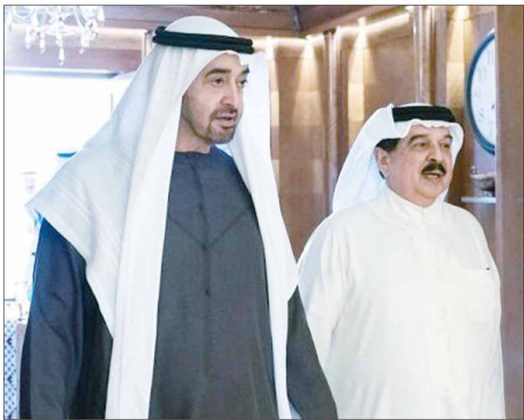
الرئيس الإماراتي الشيخ محمد بن زايد مستقبلاً العاهل البحريني الملك حمد بن عيسى في أبوظبي (مواقع)