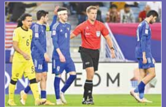
فرحة لاعبي الأزرق بالهدف الأول

وقال بيكسي في مؤتمر صحفي عقب المباراة "أن لاعبي المنتخب بحاجة إلى الوقت لتحقيق المزيد من الانتصارات خاصة أنهم لاعبون جيدين ولديهم موهبة إلا أنهم تنقصهم الخبرة مشيداً على أهمية تطوير اللاعبين لتحقيق الانتصارات".