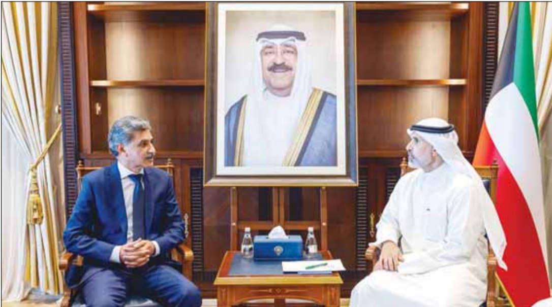
الشيخ جراح الجابر مستقبلاً سفير باكستان مالك فاروق

من جهة أخرى، استقبل نائب وزير الخارجية السفير الشيخ جراح الجابر أمس سفير الجمهورية الجزائرية الديمقراطية الشعبية نور الدين مريم بمناسبة انتهاء فترة عمله سفيراً لبلادها لدى دولة الكويت.