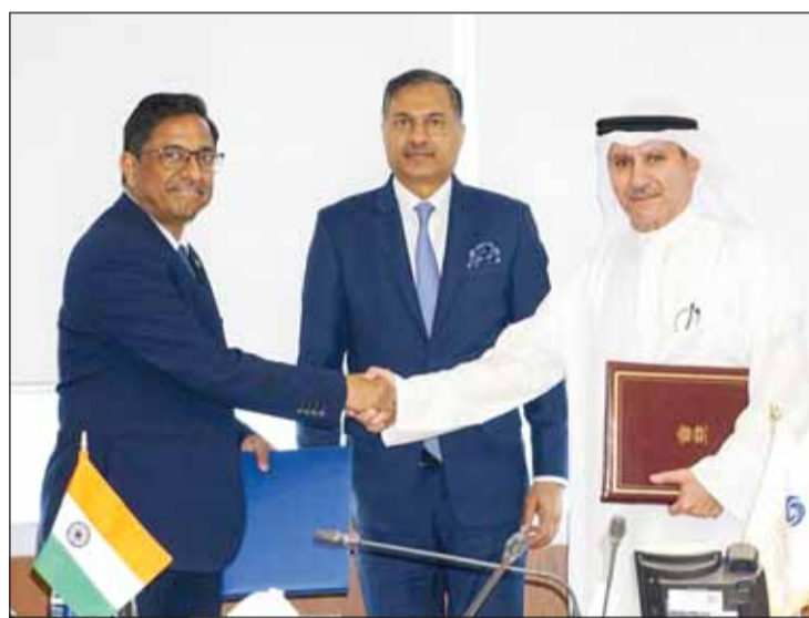
صورة جماعية خلال توقيع الاتفاقية