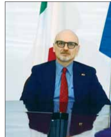
السفير لورنزو مورينيتي