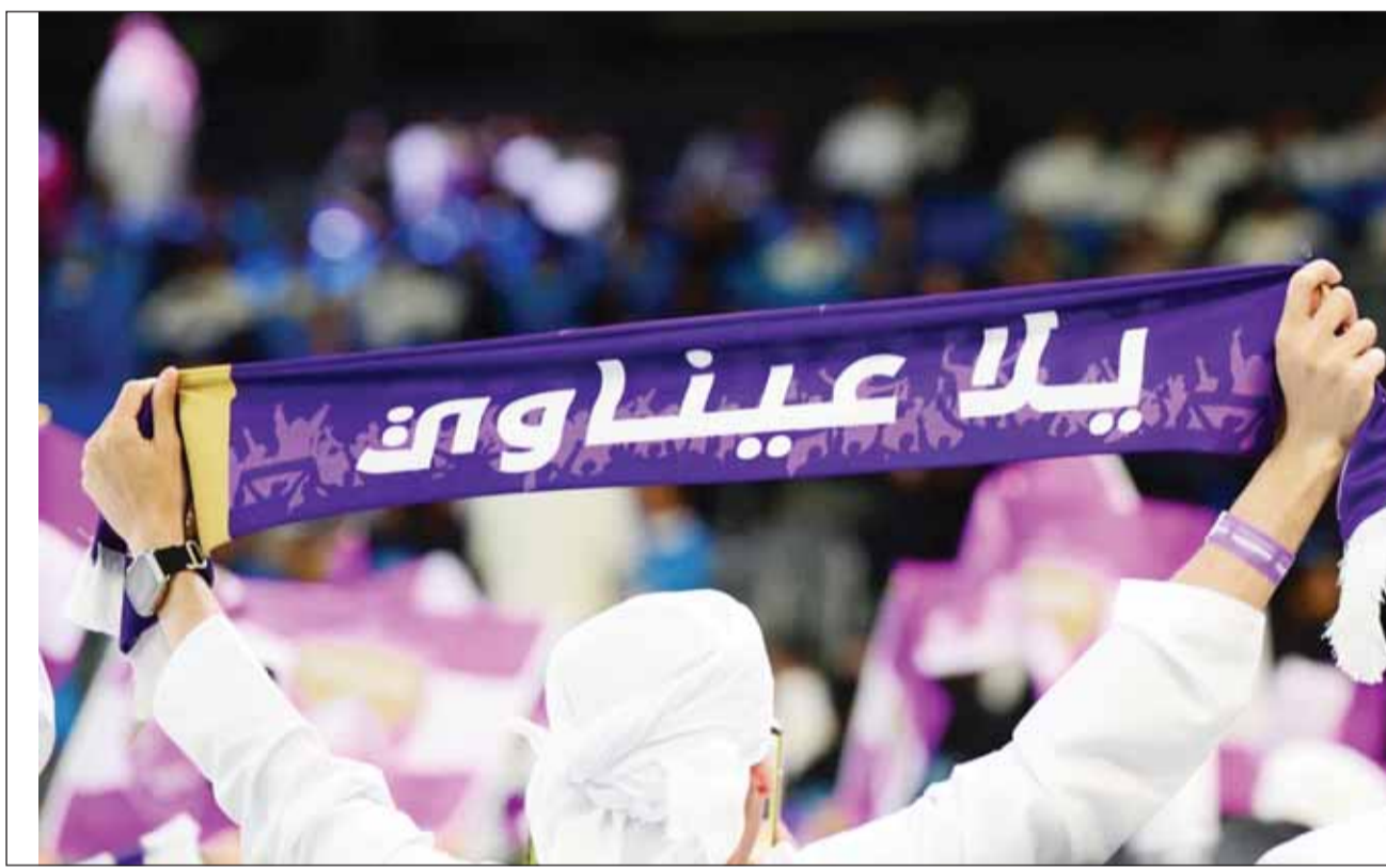
العين حقق المطلوب بالتأهل لنهائيه آسيا عن جدارة

ورفع أرسنال رصيده إلى 77 نقطة لينفرد بالصدارة متفوقاً بثلاث نقاط عن ليفربول الذي لعب في وقت متأخر من مساء أمس ضد إيفرتون. وتجمد رصيد تشيلسي عند 47 نقطة في المركز التاسع بعد تلقيه الخسارة رقم 11 في بطولة الدوري.