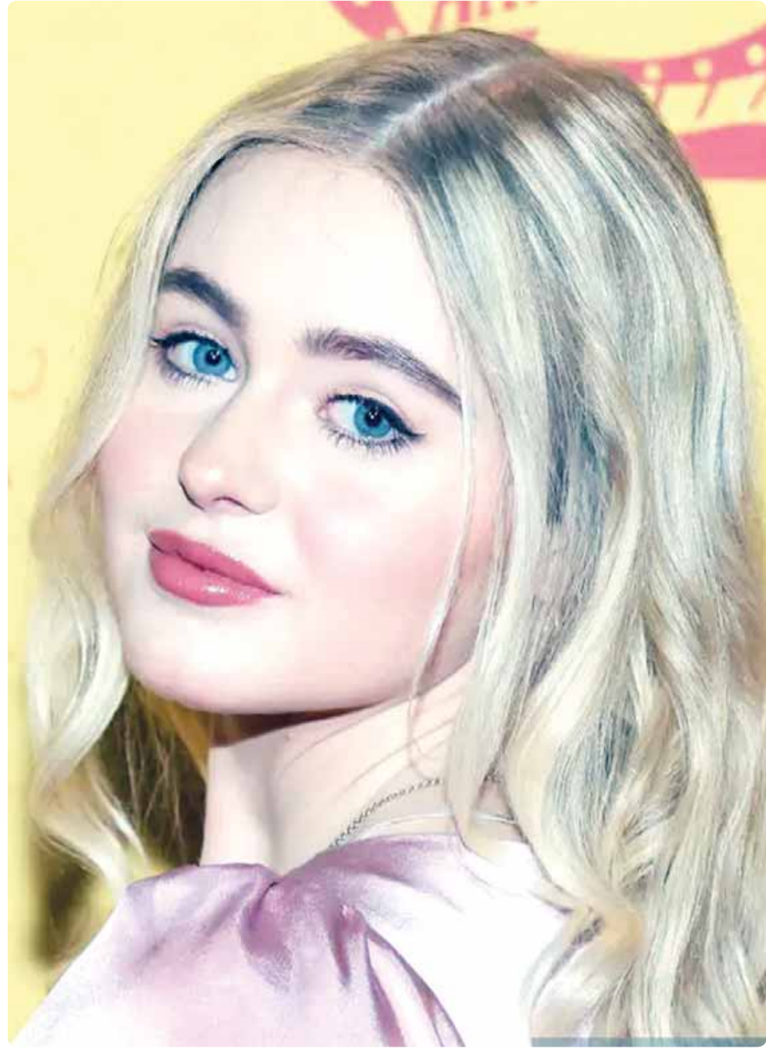
الممثلة الأميركية إيزابلا كروفيتي خلال حضورها العرض الأول لفيلم "Boy Kills World" في نيويورك