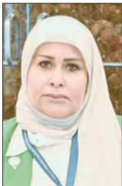
الشيخة تماضر الصباح

وأوضحت الشیخة تماضر الصباح أن الإعلام البترولي نوع من وسائل الإعلام التي تهتم بتغطية الأخبار والمعلومات المتعلقة بصناعة النفط والغاز ويشمل ذلك تقارير عن إنتاج النفط والغاز وأسعار البترول والشركات النفطية والتكنولوجيا البترولية وغيرها من المواضيع ذات الصلة.