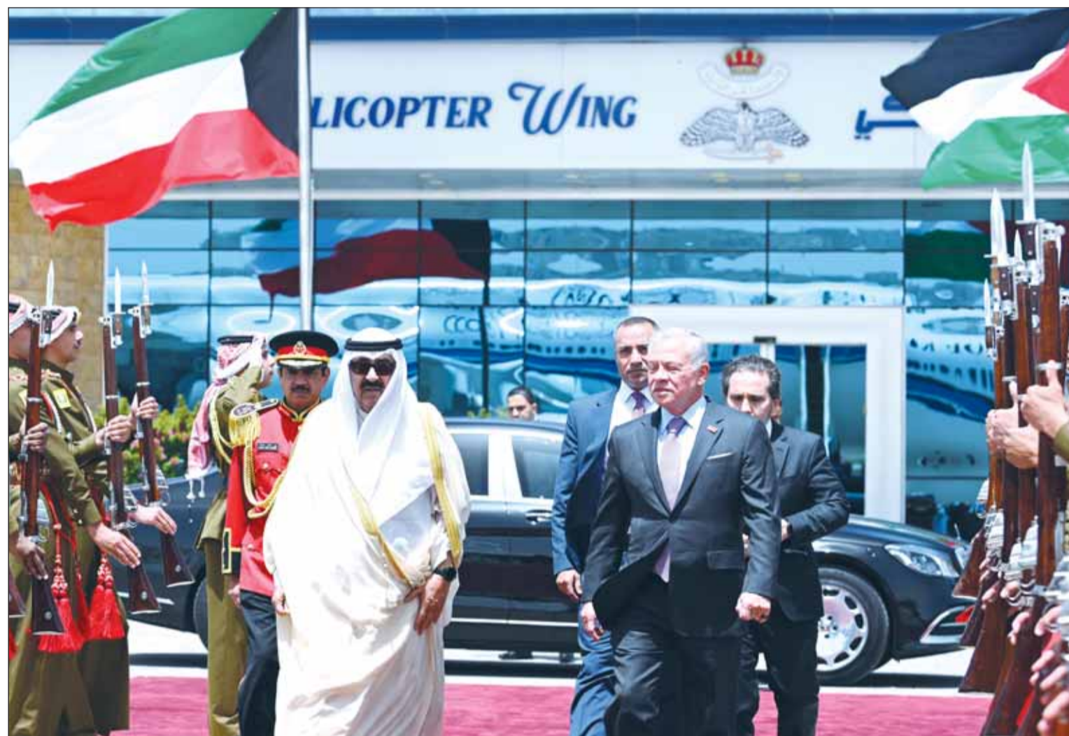
سمو أمير البلاد الشيخ مشعل الأحمد مغادراً العاصمة الأردنية "عمان" بعد زيارة دولة وفيه وداعه العاهل الأردني الملك عبدالله الثاني

■ عمان - كونا، بعث سمو أمير البلاد الشيخ مشعل الأحمد ببرقية شكر إلى الملك عبدالله الثاني بن الحسين ملك المملكة الأردنية الهاشمية الشقيقة جاء فيها "نود أن نزجي لجلالتكم بالغ الشكر والتقدير على ما أظننا به وأعضاء الوفد المرافق من حفاوة استقبال وحسن وقادة عهدناهما على المملكة الشقيقة قيادة كريمة وشعباً مضيافاً، وعكسا عمق الروابط الأخوية والعلاقات المتميزة التي تجمع بلدنا وشعبينا الشقيقين".