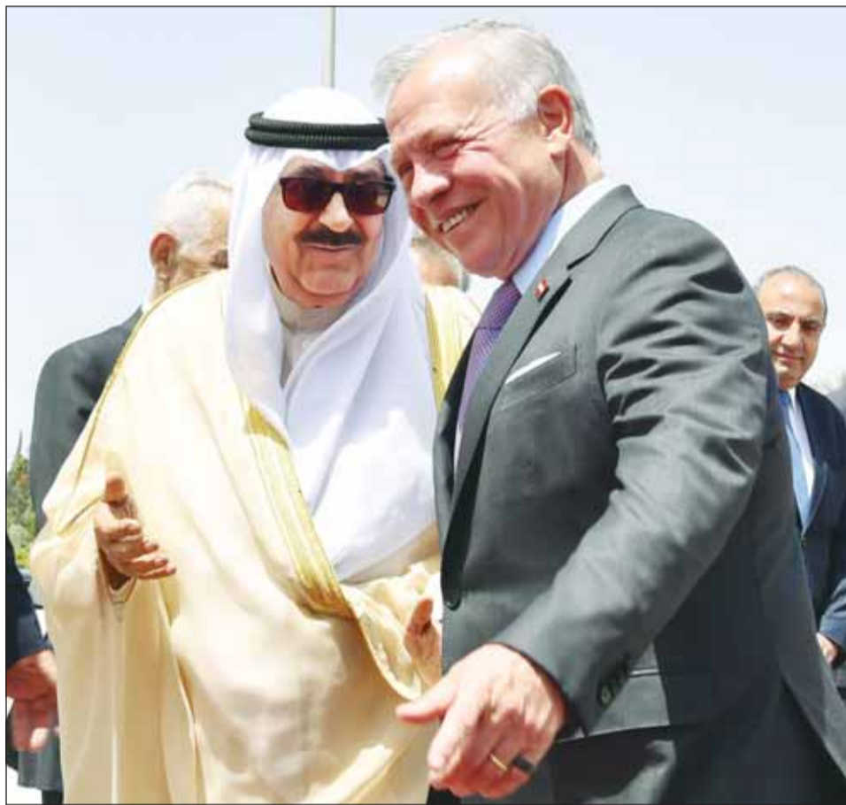
سمو الأمير الشيخ مشعل الأحمد لدى مغادرته الأردن وفيه وداع سموه الملك عبدالله الثاني

أكد سمو أمير البلاد الشيخ مشعل الأحمد أن "زيارة الدولة" التي قام بها سموه والوفد المرافق له إلى الأردن تأتي توطيداً للتعاون المثمر البناء بين البلدين، وتجسيدا لحرصهما على الارتقاء به على الأصدقاء كافة وفي شتى المجالات، بما يخدم مصالحهما المشتركة، ويحقق تطلعات الشعبين. وقال سموه في برفقة شكر بعث بها أمس إلى عاهل الأردن الملك عبدالله الثاني بن الحسين: "إننا إذ نغادر الأردن بعد زيارة دولة، نود أن نزيج لكم بالغ الشكر والتقدير على ما أظننا به وأعضاء الوفد المرافق من حفاوة استقبال وحسن وقادة عهدناهما على المملكة - قيادة كريمة وشعباً مضيافاً - وعكسا عمق الروابط الأخوية والعلاقات المتميزة التي تجمع بلدينا وشعبينا. وأضاف سموه، كما أود أن أعبر عن بالغ امتناني وشكري على التهمة 13