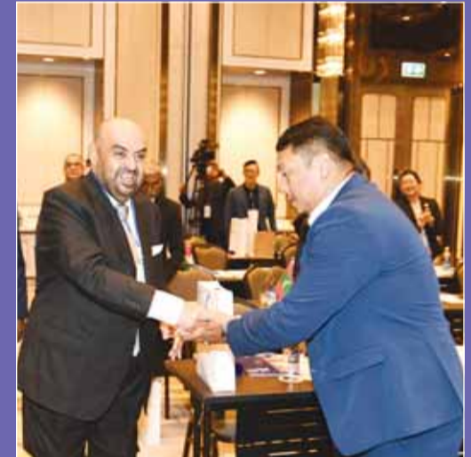
البدر يتلقى التهانيت بمناسبة تجديد الثقة

من جهته رفع الشيخ خالد البدر الصباح اسمي آيات التهناتي والتبريكات إلى القيادة السياسية وعلى رأسها سمو أمير البلاد