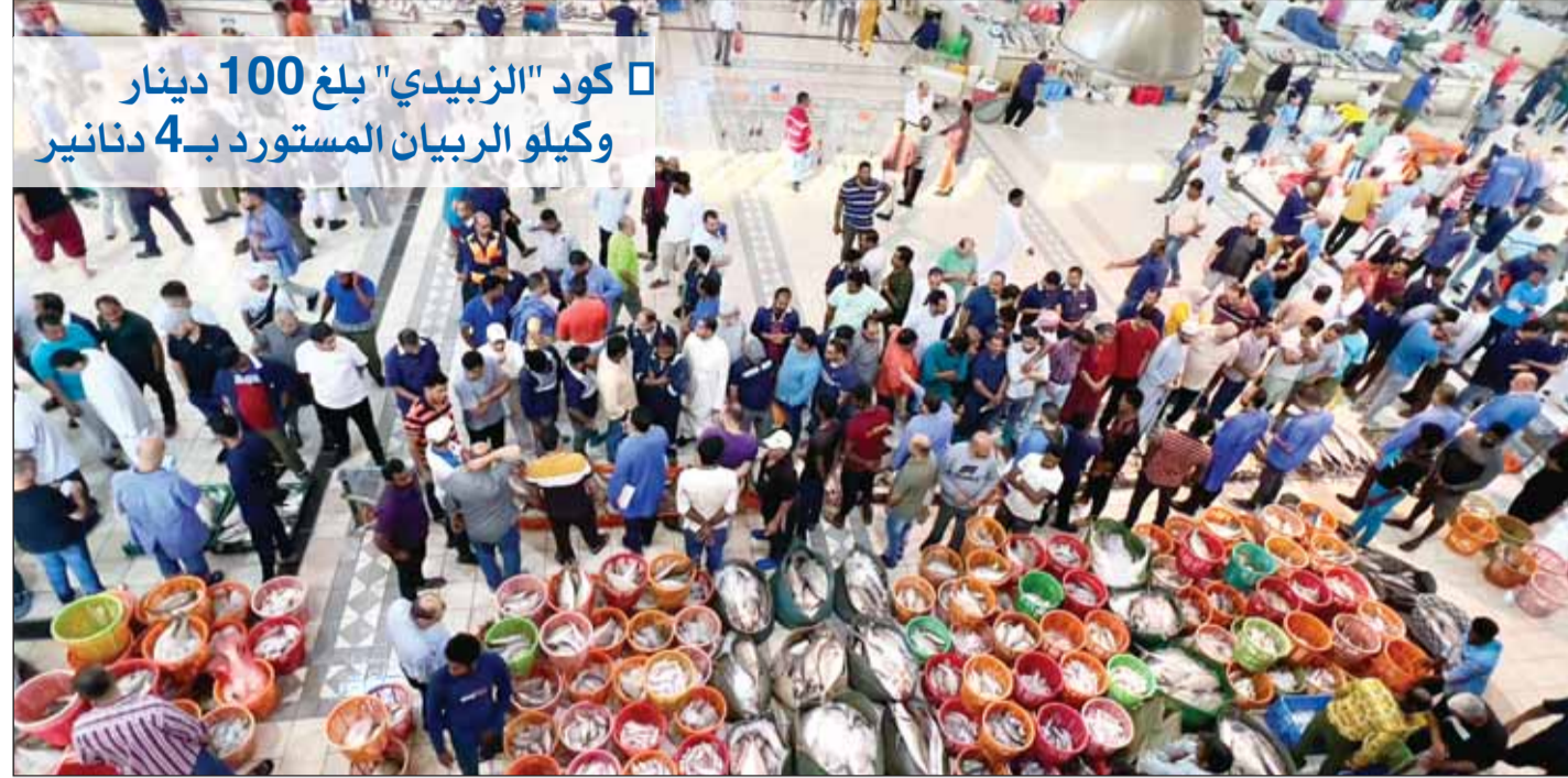
□ كود "الزبيدي" بلغ 100 دينار وكيلو الربيان المستورد بـ4 دنانير