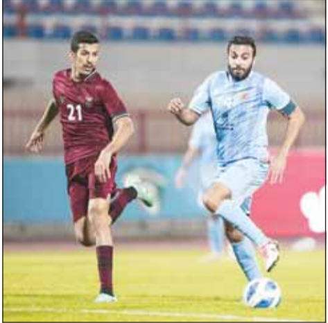
اللقاء يتجدد بين السماوي والعنابي