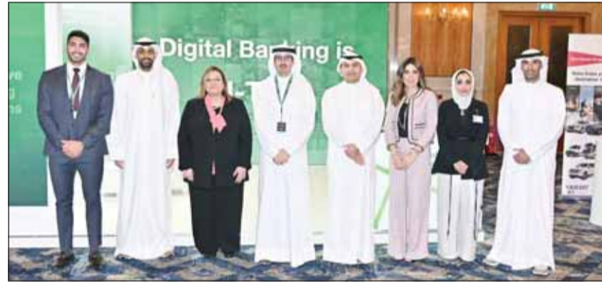
رئيس مجلس الإدارة الشيخ أحمد دعيح الصباح وإلهام محفوظ رئيس الجهاز التنفيذي مع الإدارة التنفيذية

حول دور الابتكار في تعزيز وإثراء بيئة الأعمال في الكويت. وتناول الدعيج بعض الأمثلة على الابتكارات الناجحة التي يمكن أن تفتح الباب أمام ضخ المزيد من الاستثمارات لتمويل مشاريع الشراكة في ظل زيادة الابتكار الرقمي في الكويتي.