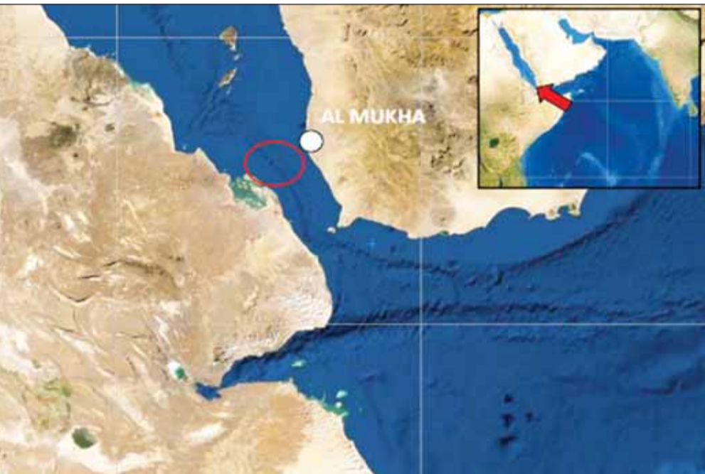
خريطة نشرتها هيئة عمليات التجارة البحرية البريطانية لموقع تعرض سفينة لهجوم قبالة سواحل المخا (كس)

ضد العدوان الأمريكي البريطاني المساند، مؤكدا استمرار قواتهم في تنفيذ المزيد من العمليات العسكرية حتى رفع الحصار ووقف العدوان عن الشعب الفلسطيني في غزة.