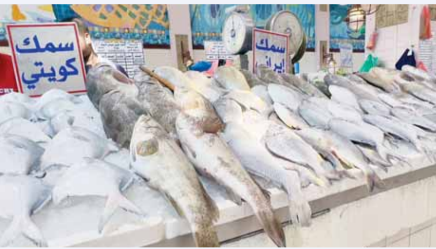
المعروض من "الزبيدي" في سوق السمك أمس قليل

أعلن وزير الدولة لشؤون مجلس الأمة وزير الدولة لشؤون الشباب وزير الدولة لشؤون الاتصالات داود معرفي، استمرار قراره بإمالة مدير عام الهيئة العامة للرياضة يوسف البيدان إلى التحقيق.