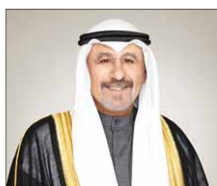
سمو الشيخ د.محمد الصباح

بعث سمو الشيخ الدكتور محمد الصباح رئيس مجلس الوزراء المكلف بتصريف العاجل من الأمور، ببرقية تهنئة إلى الرئيس جوليوس مادا بيو رئيس جمهورية سيراليون الصديقة بمناسبة العيد الوطني لبلادها. كما بعث سموه ببرقية تهنئة إلى الرئيس فور إسوزيمنا نياسينغبي رئيس جمهورية توغو الصديقة بمناسبة العيد الوطني لبلادها. وبعث سموه ببرقية تهنئة إلى الرئيس سيريل رامافوزا رئيس جمهورية جنوب أفريقيا الصديقة بمناسبة العيد الوطني لبلادها. كما بعث سموه ببرقية تهنئة إلى الملك فيليم ألكسندر ملك مملكة نيدرلاندز الصديقة بمناسبة العيد الوطني لبلادها. وبعث سمو الشيخ الدكتور الصباح ببرقية تهنئة إلى الرئيسة سامية صلومو حسن رئيسة جمهورية تنزانيا المتحدة الصديقة بمناسبة العيد الوطني لبلادها.