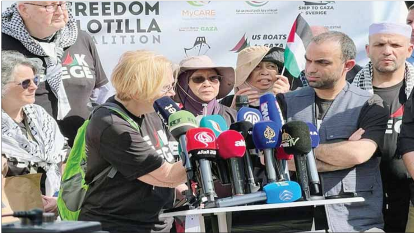
اللجنة الدولية لكسر الحصار عن غزة تعلن تأجيل انطلاق "أسطول الحرية 2" بسبب إجراءات تعنت فرضها الاحتلال الإسرائيلي (وكالات)