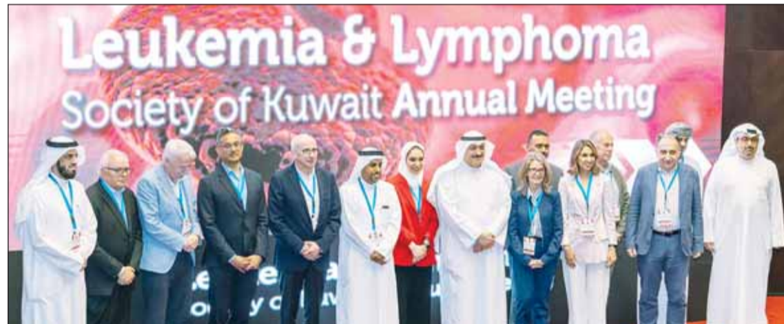
وزير الصحة د.احمد العوضي متوسماً المشاركين في الملتقى

واضاف ان الملتقى يناقش عددا من المواضيع أهمها علاجات الفط الأول لسرطان الغدد الليمفاوية وأهمية أشعة المسح النووي الجزيئي في علاج سرطان العنق الليمفاوية وتشخيص وعلاج سرطان الدم الحاد والمزمن واضطرابات خلايا البلازما وعلاجات الخلية في الكويت والتقنيات التي غيرت بشكل ايجابي نهج العلاج. وأكد حرص الوزارة على دعم هذه النوعية من اللقاءات العلمية وورش العمل لما لها من دور كبير في رفع الكفاءة العلمية والعملية لموظفي الوزارة لارتقاء بالمنظومة الصحية وتحسين الخدمات الصحية المقدمة. وأشار العوضي الى تسخير الوزارة الكثير من الامكانيات لخدمة مرضى السرطان من خلال توفير أحدث الأدوية والأجهزة الطبية وتدريب الطواقم الطبية على استخدام أحدث البروتوكولات الصحية لما لها من أهمية كبيرة في الارتقاء بجودة الخدمات الطبية المقدمة.