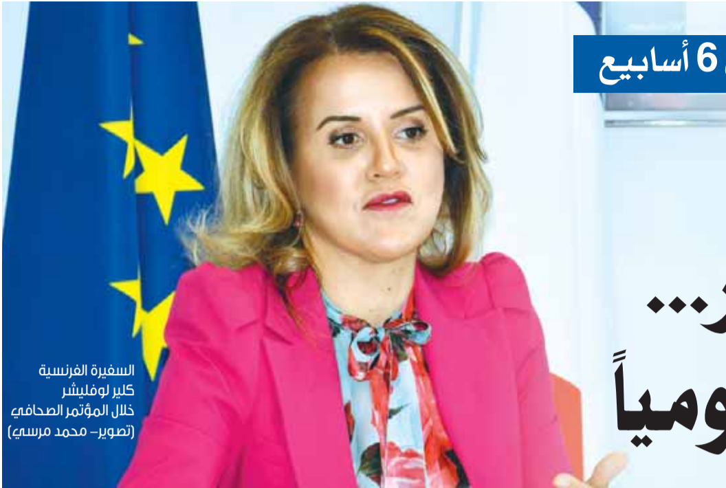
السفيرة الفرنسية كلير لوفليشر خلال المؤتمر الصحفي