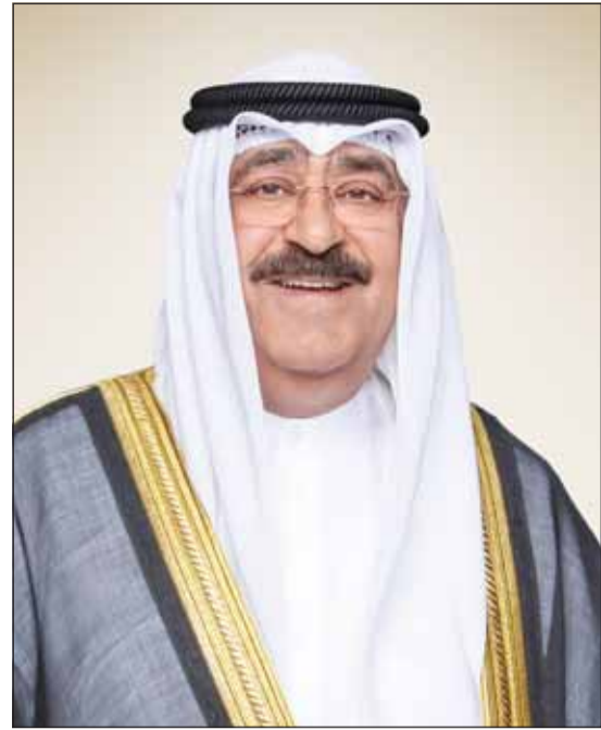
سمو أمير البلاد الشيخ مشعل الأحمد