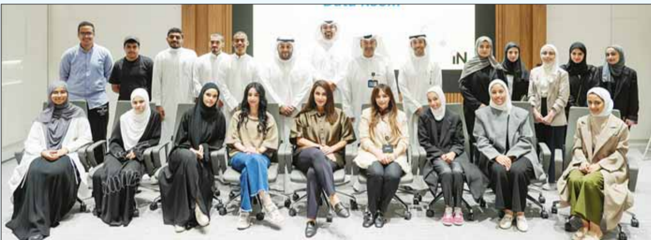
الطالبة والطالبات مع مسؤولي زين ومركز صباح الأحمد للموهبة

المستثمرين، وتطوير الاستراتيجيات والمنتجات والخدمات، كما أتاحت الفرصة للطلبة لخوض تجربة التمارين العملية لتأسيس مشاريعهم الخاصة، والتدريب على استعراضها أمام المستثمرين لجذب فرص التعاون والنمو. كما أتت هذه الخطوة استكمالاً للتعاون المتميز ما بين زين وقسم علوم المعلومات بكلية العلوم الحياتية، والتي شهدت أواخر العام الماضي استضافة زيارة ميدانية لطلبة وطالبات الدراسات العليا إلى مركز زين للبيانات بمنطقة الصباحية، والتي أسهمت في توسيع مداركهم وتقديم الفرصة لهم للتعرف عن قرب على جهود زين في دعم رحلة التحول الرقمي في الكويت. وتُضاف هذه الخطوة إلى سلسلة البرامج والمبادرات التي تقدمها كل من زين ومركز صباح الأحمد للموهبة والإبداع تحت مظلة شراكتهما بهدف تحقيق عديد من الأهداف الاستراتيجية المُستدامة ضمن رؤيتهما المشتركة، مثل دعم الابتكارات وزيادة الأعمال، وتمكين أصحاب الشركات الناشئة، وتعزيز بيئة الإبداع، والاستثمار في المهارات الرقمية لدى الشباب.