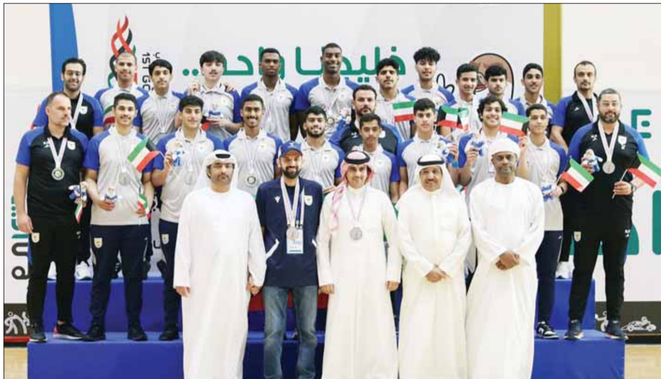
تتويج أزرق اليد بالميدالية الفضية