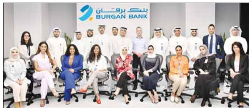
صورة للمشاركين في البرنامج

ليرنينغ لبرنامجاً لتطوير الموظفين الحالي والمصمم لتلبية احتياجاتهم بشكل كامل على المستويين الشخصي والمهني، فمن خلال تسجيل موظفينا الطموحين من مختلف الأقسام في برنامج الاستثمار وإدارة الثروات، سنضمن تحقيق التناغم بينهم من أجل تقديم خدمة مصرفية استثنائية لعملائنا من ذوي الملاحة المالية العالية، مؤكدة على أهمية تعزيز ثقافة النمو والتطوير في بنك برقان لجذب أفضل الكفاءات، حيث يعتبر البنك رأسماله البشري أساساً لنموه المستمر وريادته في القطاع المصرفي.