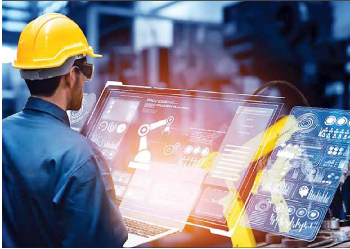
الصناعة ركيزة التمويل الاقتصادي

عن بنك الكويت المركزي لعام 2023، تراجع إجمالي التمويل الشهري المقدم من البنوك المحلية إلى قطاع الصناعة (المجموع) خلال العام المالي 2023 بنسبة 31 في المئة وبقية 466 مليون دينار، ليهيبط من 1,499 مليار دينار بنهاية عام 2022 إلى 1,033 مليار دينار في عام 2023. ويبلغ التمويل للقطاع اعلى مستوياته في شهر ديسمبر 2023 بعد ان بلغ 198,9 مليون دينار.