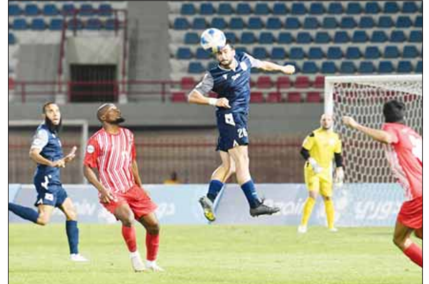
لقاء سابق لليرموك والصلبيخات