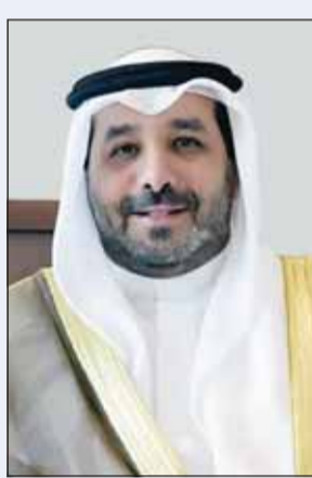
الشيخ صباح الناصر

الدولي للوصول إلى استقرار الاقتصاد في منطقة الشرق الأوسط في ظل الأحداث والصراعات التي تشهدها. وأشاد السفير الشيخ صباح ناصر بالدور الكبير الذي تقوم به المملكة العربية السعودية وجهودها البارزة في استضافة الكثير من المنتديات والاجتماعات الدولية بهدف تحقيق السلام والازدهار والأمن والرفاه للمنطقة والعالم. وتشمل أجندة المنتدى الذي تستضيفه المملكة اليوم وغدا مناقشة الاتفاقيات بشأن النمو الشامل والدكاء الاصطناعي والسياسات الصناعية والابتكار والسياسة الاقتصادية إلى جانب نقص الاستثمار طويل الأمد في التنمية البشرية.