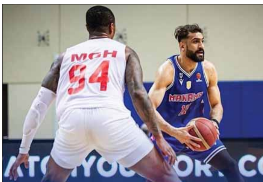
المنامة نجح في تحقيق الفوز على الكويت