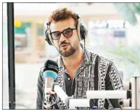
ساموزين في "مارينا"

وحيا الخطوط الحمراء في حياته الشخصية والمهنية، أوضح زين، أن هناك قيم ومبادئ لا يمكن تجاوزها، سواء على مستوى التواصل مع الجمهور أو التعامل مع الشائعات والاتقادات عبر منصات التواصل الاجتماعي. كما أكد أهمية احترام خصوصيته وخصوصية عائلته، وأن هناك حدوداً واضحة للتفاعل مع المعجبين والمتابعين، مما يعكس مدى تماسكه بالأخلاق الفنية والشخصية في حياته.