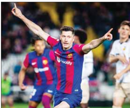
ليفاندوفسكي سجل 16 هدفاً في "الليغا"

مع فريق تشافي هيرنانديز في دوري أبطال أوروبا (1-5) أمام فيكتوريا بلزن). وفي ذلك اليوم، أصبح أيضاً أول لاعب يسجل ثلاثية في دوري أبطال أوروبا مع ثلاثة فرق مختلفة، حيث حقق ذلك سابقاً مع بروسيا دورتموند وبايرن ميونخ. وسمحت له أهدافه الثلاثة ضد "الخفافيش" بتخطي حاجز 350 هدفاً كمتعرف في مسابقات الدوري، وأصبح في جميعه 351 هدفاً، موزعة بين "البوندسليغا" (312) والليغا (39)، دون احتساب باقي المسابقات. وبالإضافة إلى ذلك، وصل ليفاندوفسكي إلى 23 هدفاً مع برشلونة هذا الموسم (16 في الليغا، و3 في دوري أبطال أوروبا، و2 في كأس الملك و2 في كأس السوبر الإسباني)، بإجمالي 10 أهداف عن تلك التي حققها في الموسم الماضي مع برشلونة (23 في الليغا، و5 في دوري أبطال أوروبا و2 في كأس الملك، و2 في كأس السوبر الإسباني و1 في الدوري الأوروبي). وفي ذلك الوقت، سجل ليفاندوفسكي 33 هدفاً في 46 مباراة (بمعدل 0,72 هدف في المباراة).