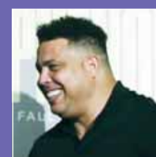
الظاهرة رونالدو نازاريو

واتفق رونالدو (47 عاماً) مع شركة "بي.بي.ديجيو" سبورتس على بيع الحصة البالغة 90 بالمئة التي استحوذ عليها عام 2021 مقابل 70 مليون دولار من خلال شركته "تارا سبورتس" البرازيل، بينما لم يتم تقديم تفاصيل حول المبلغ الذي ستدفقه الشركة مقابل ذلك.