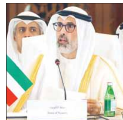
الشيخ جراح الجابر يلقي كلمة