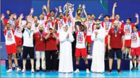
طالب والذباب يتوجان أشبال العميد