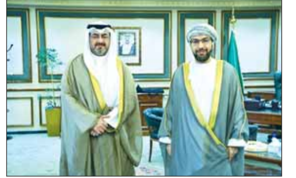
محافظ العاصمة مستقبلاً سفير عمان

استقبل محافظ العاصمة الشيخ عبدالله سالم العلي بديوان عام المحافظة أمس سفير سلطنة عمان لدى الكويت د. صالح الخروصي لتنهئته بمنصبه الجديد. وقالت المحافظة في بيان لها إن السفير الخروصي أعرب خلال الزيارة عن تمنيائه للمحافظ بالتوفيق والسداد. وأعرب المحافظ عن شكره وتقديره لمشاعره الطيبة، متمنياً له دوام الصحة والعافية وللشقيقة عمان وشعبها الكريم دوام الامن والاستقرار.