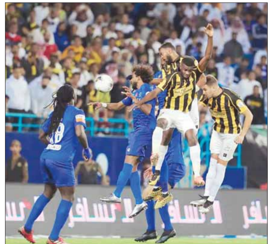
"الزعيم" عقدة "التراب" خلال السنوات الأخيرة

■ حرم الهلال نظيره اتحاد جدة من 8 بطولات خلال العقد الأخير، إذ كان سبباً في الفوز بكأسين أمامه وأنهى مشواره في 6 مسابقات، وذلك قبل مواجهتهما في نصف نهائي كأس الملك أمس. وبدأت سلسلة انتصارات الهلال على الاتحاد في الكؤوس في 2014 عندما فاز عليه 2-3 في ثمن نهائي كأس ولي العهد، وفي العام اللاحق انتهى مشوار الاتحاد في كأس الملك بعد خسارته بنصف النهائي 1-4 أمام الهلال ذاته. ومقق الهلال كأس السوبر السعودية 2018 بالعاصمة البريطانية لندن عقب فوزه على الاتحاد 1-2، وبعد عام واحد انتهى مشوار الاتحاد بدوري أبطال آسيا 2019 عقب خسارته أمام الهلال ذاته 1-3 بمجموع المباراتين. وفي الموسم الماضي خرج الاتحاد من كأس الملك عقب خسارته أمام الهلال 0-1 في نصف النهائي، وفي الموسم الحالي كان الهلال سبباً في خروج الاتحاد من 3 بطولات خلال 8 أشهر. ففي بداية الموسم خرج الاتحاد من كأس الملك سلمان للأندية العربية بعد خسارته أمام الهلال 1-3 في ربع النهائي، وفي الشهر الأخير خرج الاتحاد من بطولتين بسبب الهلال، إذ خرج أمامه في ربع نهائي دوري أبطال آسيا بنتيجة 0-4 بمجموع المباراتين وأخيراً فاز عليه في نهائي كأس الدرعية للسوبر السعودي 1-4 مطلع الشهر الجاري.