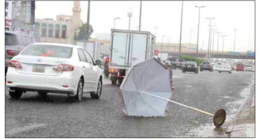
طق يا مطر طق