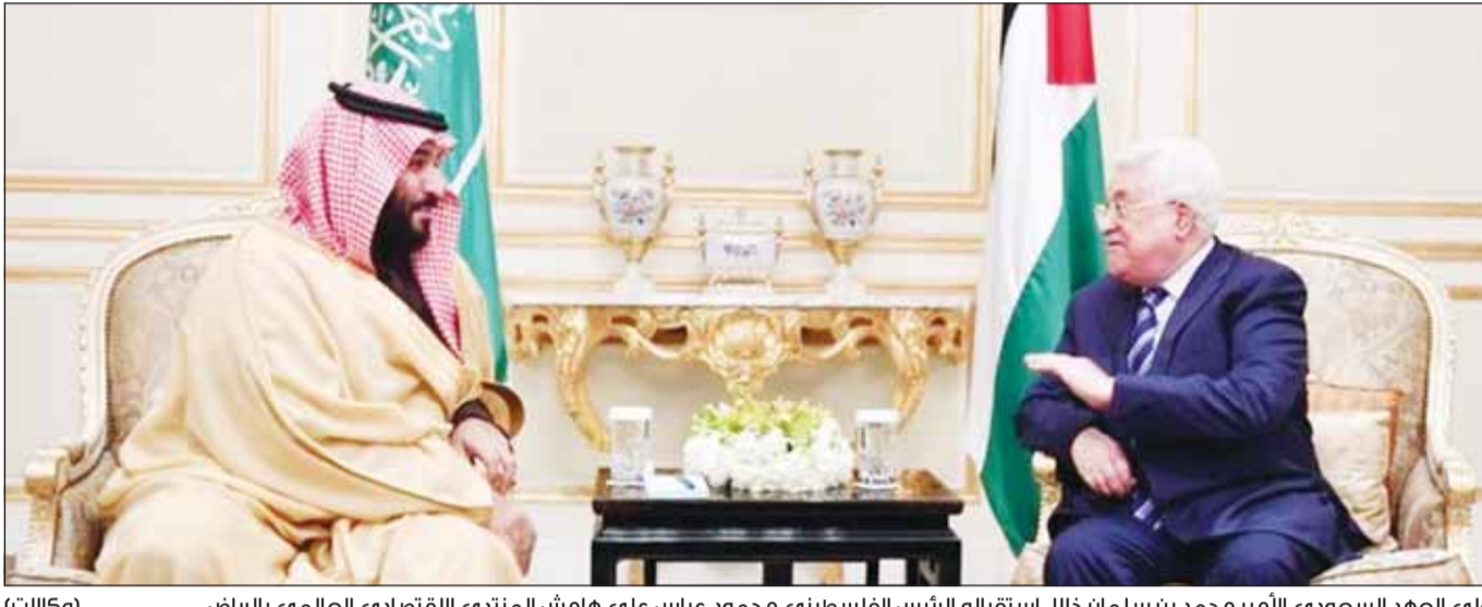
ولي العهد السعودي الأمير محمد بن سلمان خلال استقباله الرئيس الفلسطيني محمود عباس على هامش المنتدى الاقتصادي العالمي بالرياض

وشارك في الاجتماع الذي عقد على هامش المنتدى الاقتصادي العالمي، وزراء خارجية وممثلي كل من البحرين، والبرتغال، والاتحاد الأوروبي، والجزائر، والأردن، وألمانيا، والإمارات العربية المتحدة، وإسبانيا، وإيرلندا، وإيطاليا، وبلجيكا، وتركيا، وجامعة الدول العربية، وسلوفاكيا، وفرنسا، وفلسطين، وقطر، ومصر، والمملكة المتحدة، حيث تشهد العاصمة السعودية الرياض حراكاً سياسياً واقتصادياً، بمشاركة أوروبية ودولية واسعة، وتأتي قضية غزة وفخض التصعيد في الشرق الأوسط على رأس الملفات.