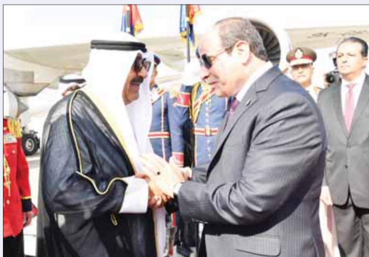
سمو أمير البلاد لدم وصوله القاهرة والرئيس المصري علم رأس مستقبلي المطيري.

القاهرة - "كونا"، وصل سمو أمير البلاد الشيخ مشعل الأحمد والوفد الرسمي المرافق لسموه عصر أمس إلى العاصمة المصرية "القاهرة" وذلك في زيارة دولة. وكان في مقدمة مستقبلي سموه على أرض المطار الرئيس عبدالفتاح السيسي رئيس جمهورية مصر العربية الشقيقة. وتشكلت بعثة الشرف المرافقة لسموه برئاسة وزير الاتصالات وتكنولوجيا المعلومات عمرو أحمد طلع. كما كان في استقبال سموه سفير الكويت لدى مصر العربية غانم الفانم ومندوب الكويت الدائم لدى جامعة الدول العربية السفير طلال المطيري.