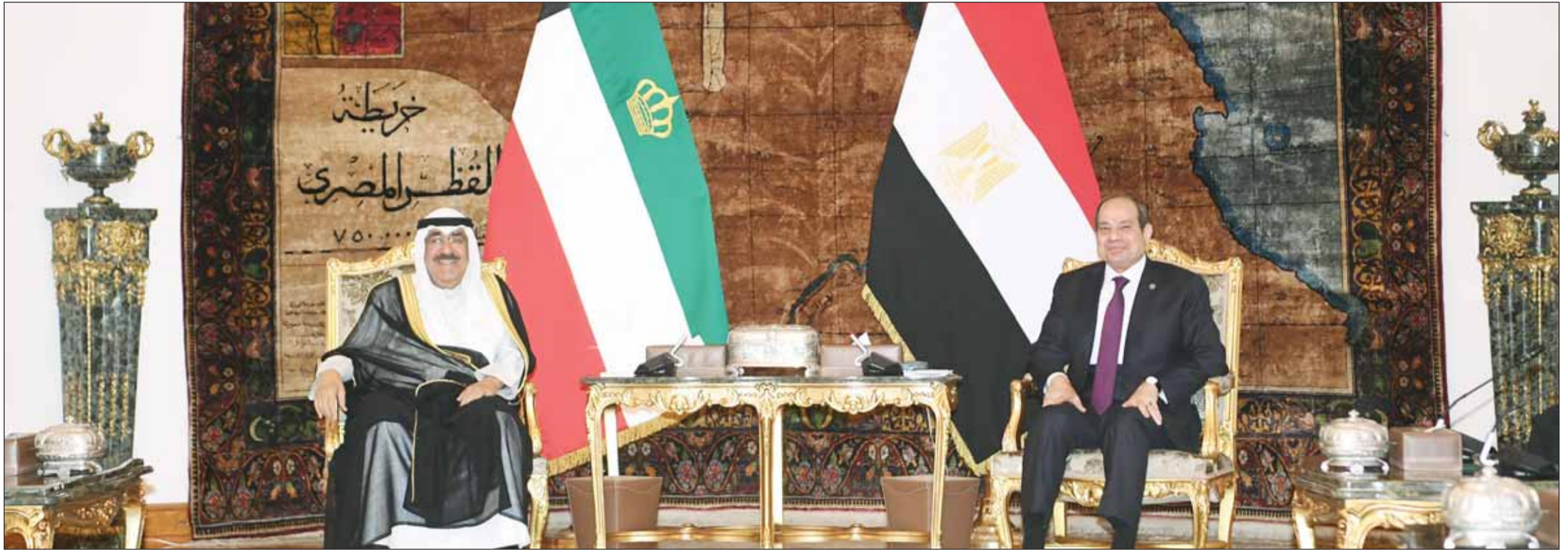
سمو أمير البلاد الشيخ مشعل الأحمد والرئيس المصري عبدالفتاح السيسي يتأسان جلسة المباحثات الرسمية بين البلدين