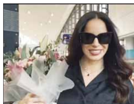
آمال ماهر وصلت جدة

يكون الحضور كبيراً في حفلها الأول، خصوصاً أن الأصوات العربية النسائية تكررت كثيراً في السنوات الماضية، والجمهور يبحث عن التنوع.