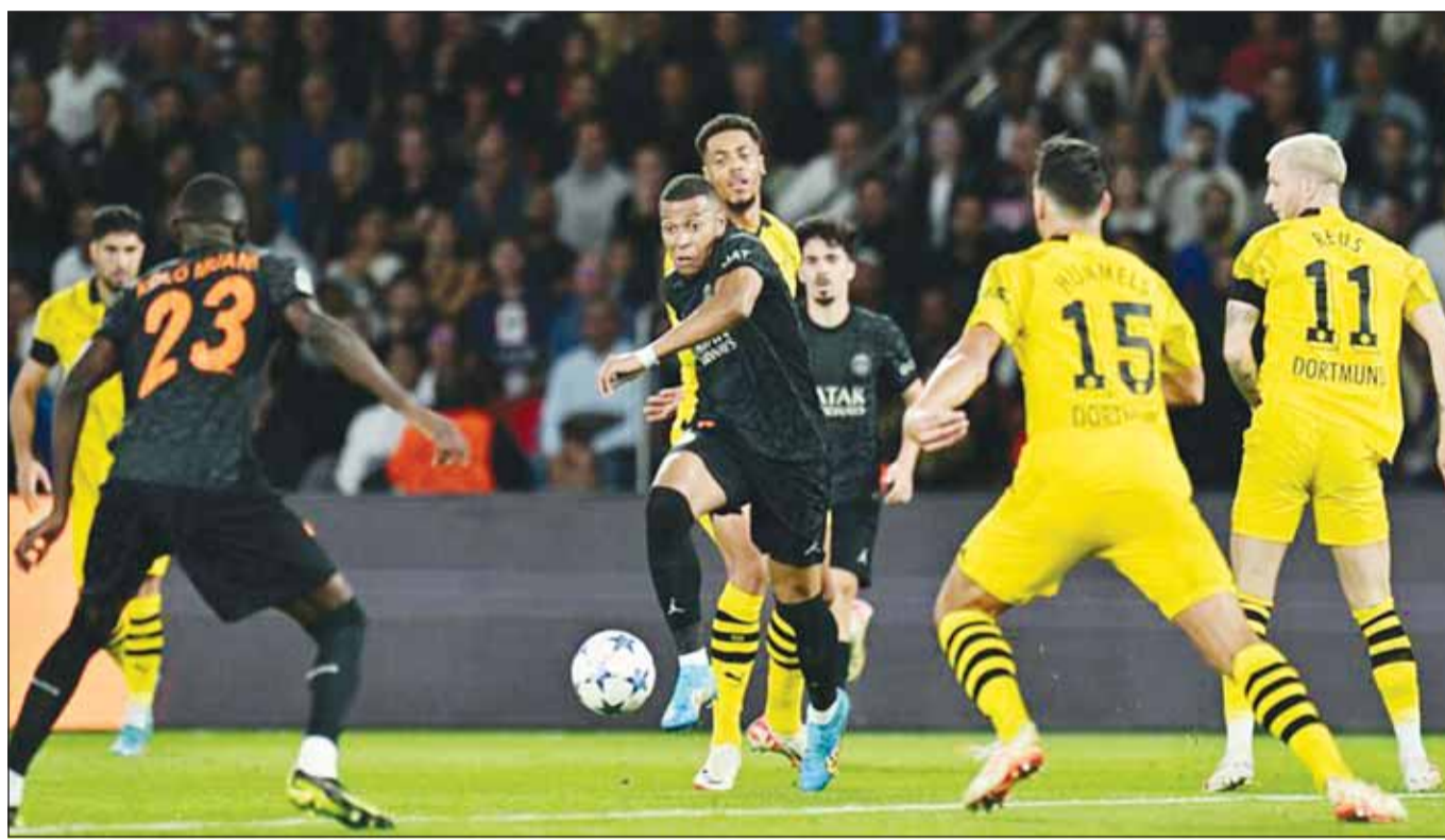
جانب من مواجهة الفريقين في دور المجموعات

■ يستضيف بوروسيا دورتموند الألماني فريق باريس سان جيرمان الفرنسي في الساعة العاشرة مساءً اليوم ضمن الذهاب الدور نصف النهائي من بطولة دوري أبطال أوروبا. وسبق للفريقين أن التقيا في دور المجموعات، فاز باريس ذهاباً 2-0 صفر، وتعادلاً في الاياب 1-1. ورغم أن دورتموند تعرض لخسارة 4-1 أمام لايبزيغ في آخر مباريات الفريق قبل مواجهة سان جيرمان، إلا أن إدين ترزيتش مدرب الفريق يرغب في الفوز والتأهل للمباراة النهائية. وسيفتقد ترزيتش لجهود سيستيان هالر مهاجم الفريق، فيما تحوم الشكوك حول مشاركة دونيل مالين في اللقاء، بينما تأكدت عودة إمرى تشان وإيان ماتسين للفريق. من جانبه، يعتقد سان جيرمان في هذه المباراة جهود برسنيل كيميبيسي وسيرجيو ريكو، مع العلم أنهما ليسا من المرشحين لبدء اللقاء من الأساس لغياهما عن الفريق منذ بداية الموسم.