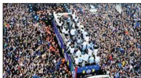
من احتفالات الإنتر باللقب

■ احتفل إنتر ميلان بلقب الدوري الإيطالي بشكل "صاخب"، الأحد، باستخدام حافلة مفتوحة جابت أنحاء المدينة. لكن ما لفت الأنظار، هو انخراط عدد من نجوم إنتر في أنشطة "مناهضة وسافرة" من الغريم إيه سي ميلان. وكان المدافع الهولندي ديخزل دامفريس "بطل الشعب"، حيث حمل لافتة تظهره وهو يجر كلباً مقيداً، وضع عليه وجه المدافع الفرنسي ثيو هيرنانديز، لاعب أي سي ميلان. وكان هيرنانديز قد دخل في مشادة مع دامفريس في ديربي الأخير، حيث طرد اللاعبان، مما أوجع الخلف بينهما. ووصف دامفريس وزميله في الفريق ماركوس تورام، هيرنانديز، بالـ"كلب"، في بث مباشر على وسائل التواصل الاجتماعي، وهو ما شكل استفزازاً بين جماهير الفريقين. كما رفع لاعب خط وسط إنتر دافيدي فراتيسي، لافتة كتب عليها "Milanista Chiacchierone"، التي تعني أن مشجع ميلان "يحب قول الهراء كثيراً".