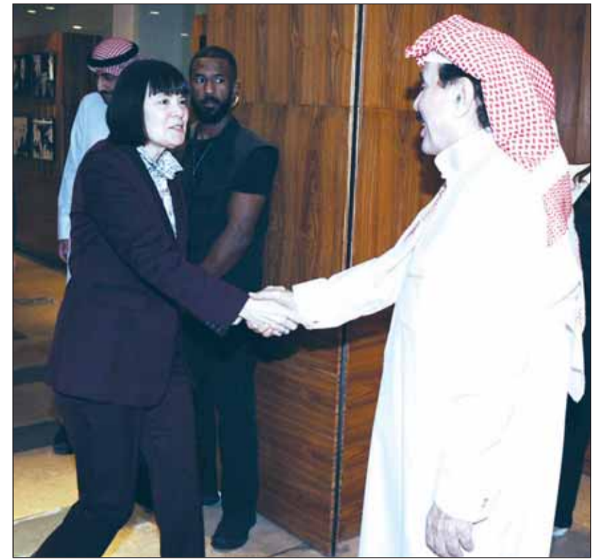
العميد الجارالله مصافحاً السفيرة الأميركية كارين ساساهارا لدم دخولها دار "السياسة"