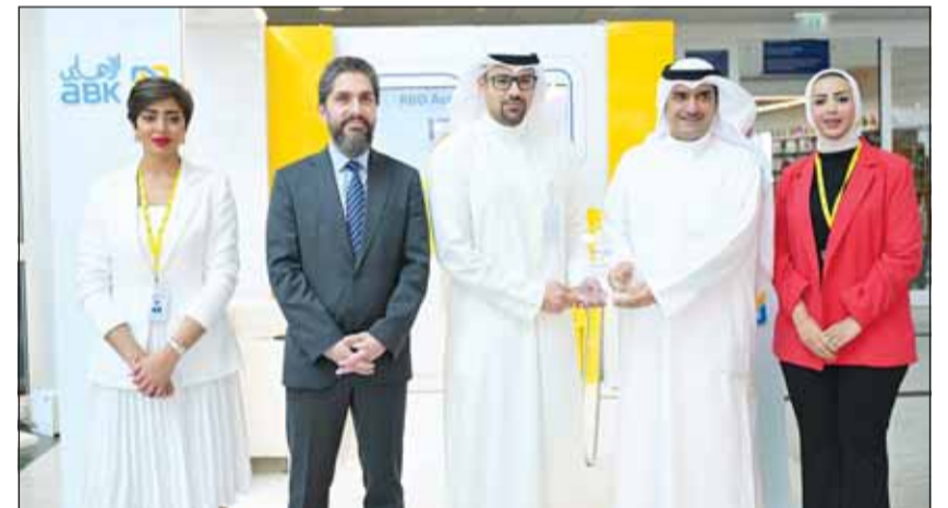
تكرم ممثلها البنك خلال المعرض

وأوضحت أن المعارض الوظيفية التي تقام في الجامعات تشكل أهمية كبيرة للبنك وجميع الجهات المشاركة فيها للتعرف على المواهب والتعريف بالفرص الوظيفية المتاحة لهم، والمزايا الوظيفية التي يتم تقديمها لهم مما يعود بالنفع والإيجاب على جميع الجهات. وسلطت الأريش الضوء على سعي البنك المتواصل من أجل جذب الكفاءات الوطنية إلى صفوفه، وتوفير بيئة عمل صحية لتطوير قدراتهم من خلال برامج التدريب المتخصصة سواء التي يتم عقدها حضورياً أو عبر الإنترنت، مبيحة أنه تم ترويج جهود البنك بالحصول على لقب أفضل مكان للعمل في القطاع المصرفي داخل دولة الكويت من قبل مجلة إنترناشيونال فاينانس خلال عام 2023.