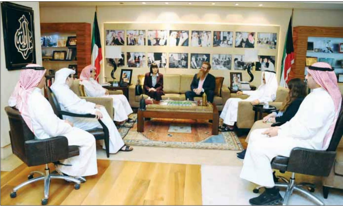
العميد رئيس التحرير أحمد الجارالله مستقبلاً السفيرة الأميركية كارين ساساهارا بحضور نائب رئيس التحرير سليمان الجارالله والزميلين سعود وعبد العزيز الفرغان