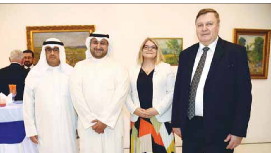
الشيخ عبدالله المشعل والسفير صادق معرفي مع سفيره الاتحاد الأوروبي والتشيك خلال الحفل