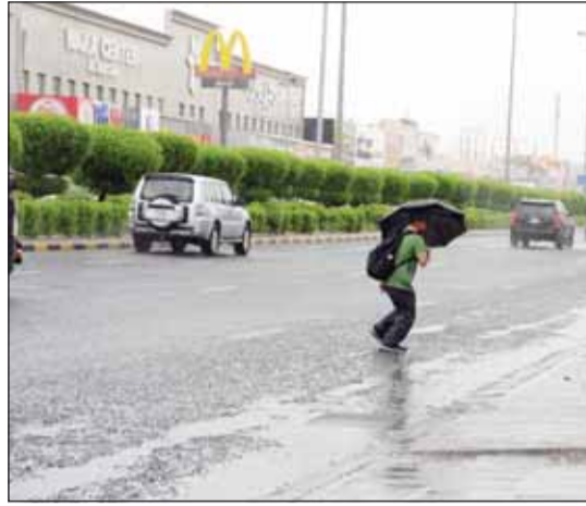
هبوب تحت المطر