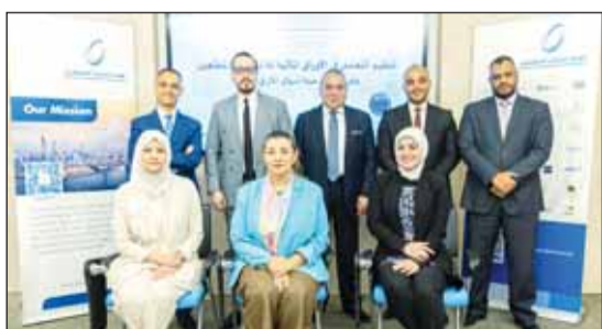
المشاركون في البرنامج التدريبي

■ عقد اتحاد شركات الاستثمار، من خلال ذراعه التدريبية مركز دراسات الاستثمار في الاتحاد في نشر الوعي والمعرفة لموظفي شركات الاستثمار وكافة الممارسين بما يخص الجوانب الإدارية والقانونية والفنية المتعلقة بعمل الشركات، حيث تهدف البرنامج إلى تسليط الضوء على أفضل الممارسات بشأن إجراءات التعامل في الأوراق المالية للأشخاص المطلعين، مما يمكن المشاركين من تجنب أي مخالفات قد تؤثر على مصالح وموجبات البورصة.