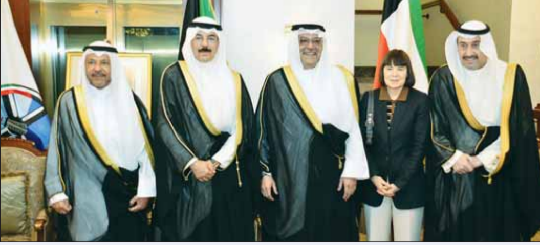
محافظ الاحمدى مستقبلاً الشيخ محمد الخالد والشيخ فيصل المالك والشيخ عذبة ناصر العنزي والسفيرة الأميركية

الشيخ مشعل الأحمد، وأوضح أنه تقدم المهنيين في قصر الضيافة الذي فاض بمجموع الأهل والاصدقاء، محافظو العاصمة ومبارك الكبير والفروانية والجهراء، وعدد من رؤساء وأعضاء البعثات الدبلوماسية من الدول الشقيقة والصديقة، كما قدم عدد كبير من المخترعين والوجهاء ورجال الأعمال والمواطنين المهني والتطريكات لمحافظ الاحمدى متعنياً له التوفيق والسداد في أداء مهامه.