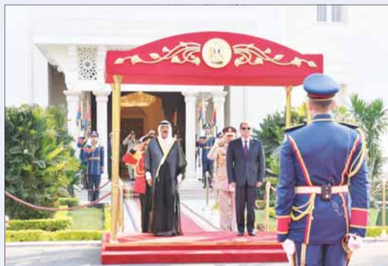
سمو الأمير الشيخ مشعل الأحمد والرئيس عبدالفتاح السيسي لدم عزف السلامين الوطنيين الرسمي المرافق لسموه.

القاهرة - كونا، أقيمت بقصر الاتحادية عصر أمس، مراسم الاستقبال الرسمية لسمو أمير البلاد الشيخ مشعل الأحمد، ذلك بمناسبة زيارة دولة لسموه لجمهورية مصر العربية. ولدى وصوله الموكب الرسمي إلى قصر الاتحادية نفخت الأبراق وأطلقت المدفعية إمدى وعشرين طلقة ترحيباً بقدوم سموه. بعدها تم عزف السلام الوطني لدولة الكويت والسلام الجمهوري لجمهورية مصر العربية الشقيقة. ثم تفضل سموه بمصافحة عدد من كبار المسؤولين بالحكومة المصرية كما قام الرئيس المصري عبدالفتاح السيسي بمصافحة أعضاء الوفد الرسمي المرافق لسموه.