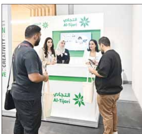
جانب من المعرض الوظيفي في الجامعة

■ أعلنت شركة الاتصالات الكوي، أنها أكملت بنجاح عملية الحصول على شهادة لمعايير ISO رقم 9001:2015 لأنظمة إدارة الجودة (QMS)، و ISO 14001:2015 لأنظمة الإدارة البيئية (EMS)، و ISO 27001:2022 لنظام إدارة أمن المعلومات (ISO)، و ISO 20000-2018 لأنظمة إدارة خدمات تكنولوجيا المعلومات (ITSM)، و ISO 22301:2019 لأنظمة إدارة استمرارية الأعمال (BCMS)، وإرشادات إدارة المخاطر ISO 31000:2018 (RM). وتأتي هذه الشهادات بعد عملية تدقيق شاملة وقوية تجريها إحدى هيئات إصدار الشهادات الدولية الرائدة في العالم. وفي بيان لها، أشارت stc إلى أن عملية الاعتماد، التي يديرها فريق ضمان الجودة والأمن السيبراني والمخاطر والاستدامة وتكنولوجيا المعلومات بمشاركة عدة قطاعات أخرى في الشركة، كشفت أن الممارسات والإجراءات المطبقة داخل الشركة تتوافق مع أفضل معايير ممارسات ISO. وخلال عملية التقييم، قدم الفريق المتطلبات اللازمة التي تتطلبها معايير ISO الدولية، مع التأكد من الالتزام بالسياسات والإجراءات الداخلية. تم تسليم المتطلبات والإجراءات الموثقة إلى هيئة التصديق المستقلة للتحقق منها قبل التقييم. وتأتي شهادات ISO هذه بمثابة شهادة على النهج المستمر الذي تتبعه stc لتنفيذ السياسات والمبادئ التوجيهية للحفاظ على جميع العمليات المتعلقة بالأعمال. في حين أن خطة الاستراتيجية