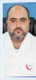
د/ ايمم BDS الأسنان