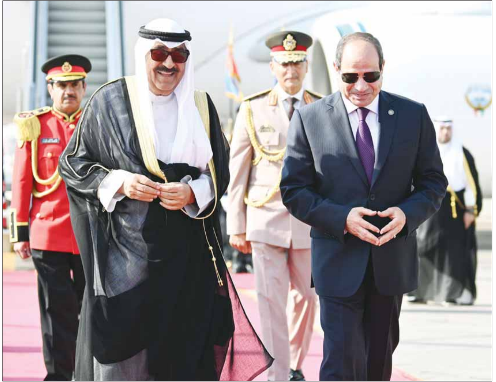
سمو الأمير الشيخ مشعل الأحمد لدى وصوله إلى القاهرة وفي استقباله الرئيس المصري عبدالفتاح السيسي

المباحثات تناولت سبل تعزيز العلاقات الراسخة بين الشعبين بما يحقق تطلعاتهما