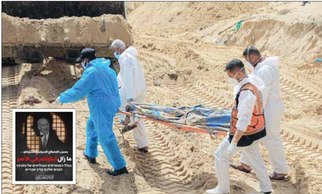
طاقم فلسطينية تعيد دفن جثامين شهداء غزة بعد أن كمرتها جرافات الاحتلال في مقابر جماعية