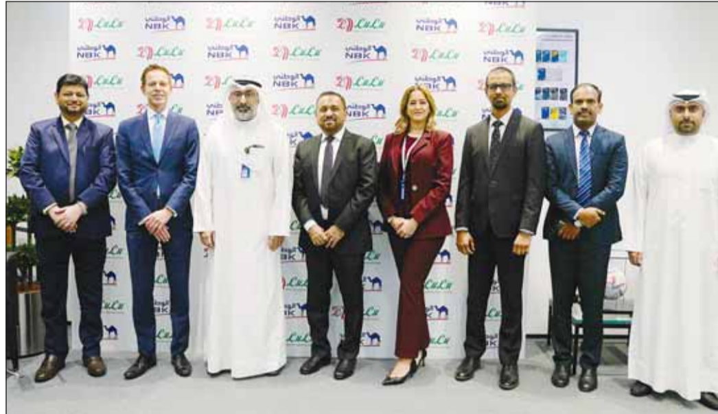
صورة جماعية لفريق البنك الوطني مع فريق لولو هايبر

أما على صعيد القطاع الاستثماري (أي الشقق والمباني السكنية)، فقد ساهم الأداء القوي الذي شهده القطاع في مارس الماضي بدعم المبيعات، وذلك على الرغم من أنها بقيت عند مستويات معتدلة خلال هذا الربع، كما أنها ما زالت أقل بنسبة 9% مقارنة بالفترة المماثلة من 2023. وسجل مؤشر أسعار العقارات والذي يعتمد على بيانات المعاملات الأسبوعية الصادرة عن وزارة العدل، زيادة هامشية بنسبة 0,4% على أساس ربع سنوي في الربع الأول من عام 2024.