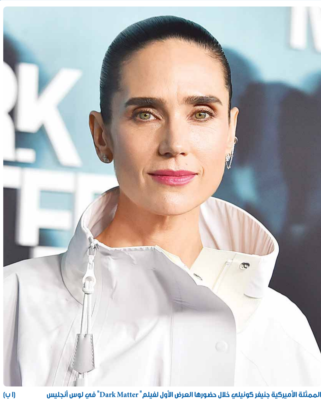
الممثلة الأميركية جينيفر كونييلي خلال حضورها العرض الأول لفيلم "Dark Matter" في لوس أنجلوس

أسأل الله أن يحفظ الشعب الفلسطيني من حماقتك، ومن بطش الكيان الصهيوني.