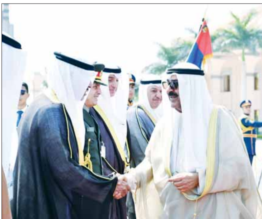
سمو الأمير مضافاً مودعيه

منحى "قلادة النيل" بادرة كريمة تحمل معاني المودة الصادقة والتقدير الأخوي التي نبادلكم إياها