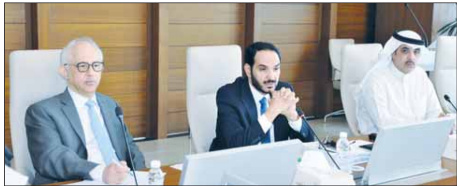
جانب من اجتماع مجلس الجامعة

اعتماد مقترح قسم الرياضيات بكلية العلوم الحصول على الاعتماد الأكاديمي