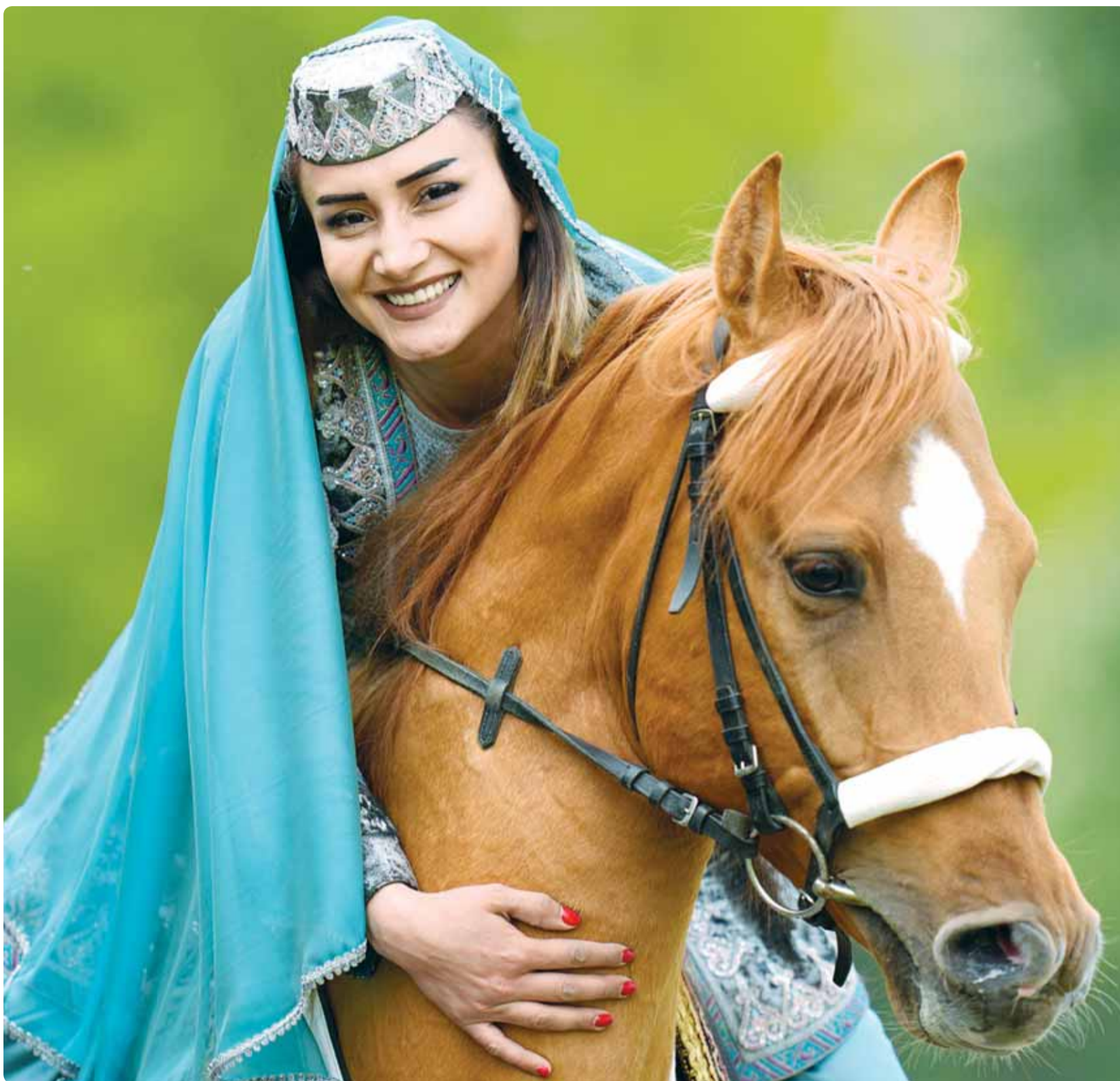
النجمة الأذربيجانية خياليا أحمدوفا تمتطي حصاناً خلال السباق الملكي البريطاني للخيل في وندسور

الصحة العامة خط أخطر، وهي مسؤولية الجهات المعنية للمحافظة على سلامة المجتمع. نسأل الله ان يحفظ الكويت وشعبها بقيادة صاحب السمو الأمير، حفظه الله ورعاه. اللهم ارحم شهداءنا الأبرار.