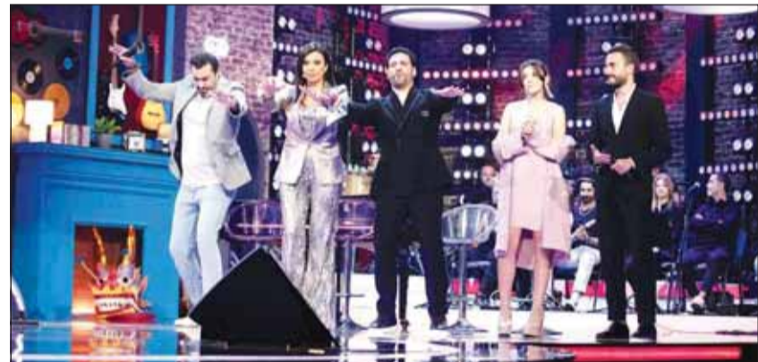
نجوم "الليلة دوب"

تحت ضغط وقت محدود للإجابة، وتضم كل حلقة تحدياً ثابتاً هو "كاراوكي مش أوكي"، حيث يتنافس النجوم من خلال أدوار فنية يختارها لهم الحظ. أما الحمدي الأخير "غني أو تتغسل"، فهو اختبار طريف لقدرة النجوم على أداء أشهر الأغنيات. يُعرض برنامج "الليلة دوب - That's my Jam" على MBC1، كل أربعاء الساعة العاشرة ليلاً بتوقيت الرياض، كما يُعرض في اليوم ذاته عبر "MBC العراق"، عند العاشرة ليلاً بتوقيت العراق.