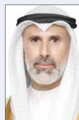
الشيخ جابر الجابر

ترأس نائب وزير الخارجية السفير الشيخ جراح الجابر اجتماع مجلس السلكين الدبلوماسي والقطري في ديوان عام وزارة الخارجية بمشاركة مساعدي وزير الخارجية أعضاء المجلس، حيث تم بحث الموضوعات الواردة على جدول الأعمال.