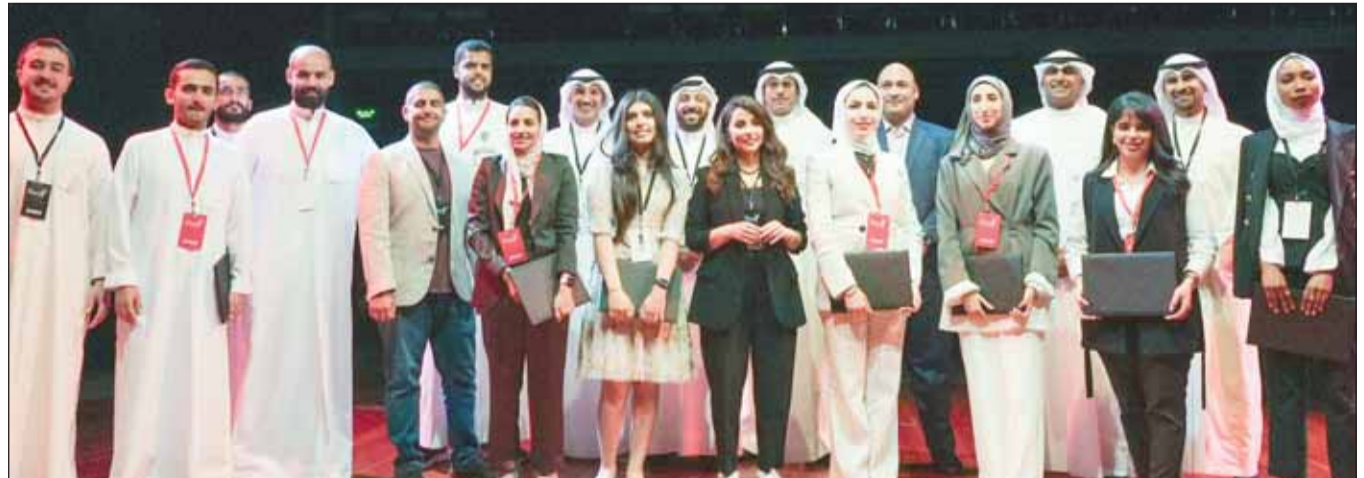
صورة تجمع الفائزين والمنظمين والمدرسين

طوال الموسم الثالث الذي انطلق أواخر العام الماضي، استضاف مركز زين للابتكار ZINC جميع الجلسات التدريبية الخاصة بالبرنامج، والذي استهدف الطلبة والطالبات الجامعيين وحديتي الفرج، ووفر لهم المساحة للتعبير عن آرائهم، وإيصال رسائلهم وأفكارهم بشكل فعال، وتدريبهم على فن الإلقاء الخطابية المؤثرة أمام الجمهور.