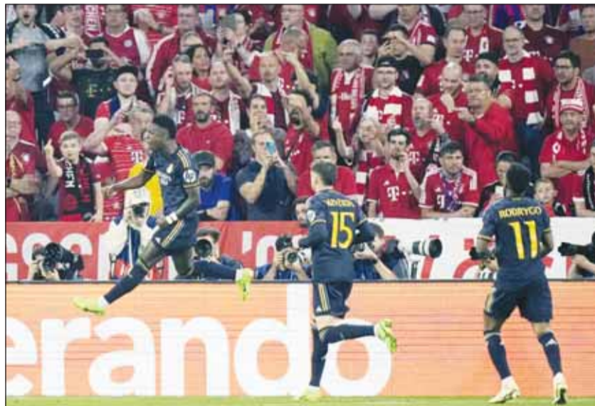
فرقة فينيسيوس بهدف التعادل في شبك البايرن

بينما تأهل ريال مدريد، الفائز باللقب 14 مرة، إلى قبل النهائي بإقصاء مانشستر سيتي حامل اللقب بركلات الترجيح. وأشاد توماس توخيل مدرب بايرن ميونخ بفعلية منافسه ريال مدريد أمام المرعى. وقال "النتيجة كما شاهدتم ولا تستحق إهدار الوقت للتفكير فيها". وأضاف: "لقد فعلها ريال مدريد من قبل، سجل هدفين من فرصتين، لسنا أول فريق يعاني من ذلك، لديهم اللمسة الأخيرة". وتابع "كانت بدايتنا قوية ثم فقدنا إيقاعنا قليلاً، كان ينبغي أن نسجل الهدف الثالث لكننا لم نتحل بالفعلية الكافية ثم منحناهم ركلة جزاء".