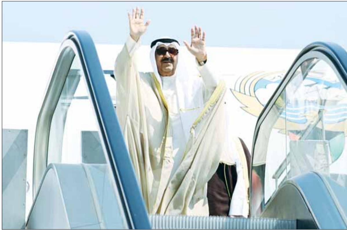
سموه الأمير الشيخ مشعل الأحمد محبياً الرئيس المصري والمودعين قبيل مغادرته مصر

للتواصل مع رئيس التحرير عبر فيسبوك وتويتر Ahmed aljarallah @Ahmedaljarallah