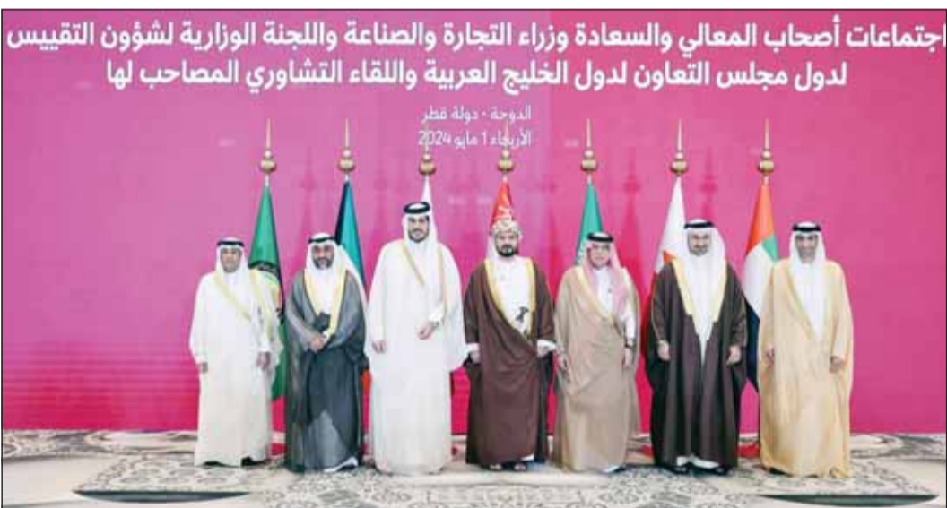
لقطة جماعية لوزراء التجارة والصناعة الخليجيين في الدوحة