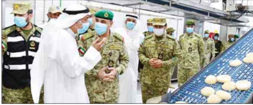
وكيل الحرس الوطني خلال تفقده مجربات التمرين

اللواء مهندس عصام نايف وفق البيان إن التمرين عقد على مدى ثلاثة أيام ونفذه مركز إسناد أجهزة الدولة بالتعاون مع وحدات المعاون للإسناد الإداري وتم خلاله تقديم الدعم عبر الفرق المدربة لعدد من الجهات الموقع بينها وبين الحرس الوطني بروتوكولات تعاون. وأشاد اللواء نايف بقدرة الفرق المدربة في مركز إسناد أجهزة الدولة على تنفيذ المهام الموكلة إليها بأسرع وقت وباحترافية عالية والتزامها بتطبيق إجراءات الأمن والسلامة لضمان نجاح عمليات التدريب وتأكيد جاهزية العالية في تطبيق المهام الحيوية الموكلة إلى المركز.