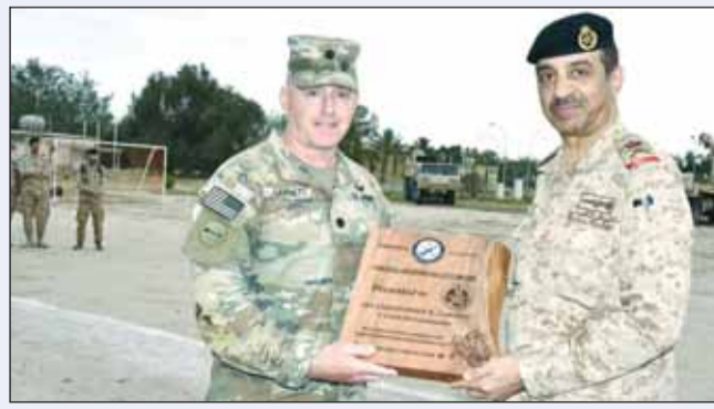
تكريم أحد الضباط الأميركيين

أقام الجيش الكويتي أمس حفلاً ختامياً للموسم التدريبي 2023-2024 لسلاح الدفاع الجوي، بمشاركة سلاح الدفاع الجوي الأميركي، برعاية وحضور آمر سلاح الدفاع الجوي اللواء الركن خالد سعد. وقالت وزارة الدفاع في بيان لها إن برنامج الحفل اشتمل على عدة فعاليات ومسابقات، منها تسطيع قوادف الباتريوت، وفك وتركيب السلاح، ونشاطات رياضية متنوعة مع القوات الأميركية الصديقة. وذكر البيان أن مثل هذه الفعاليات تساهم في تعزيز روح المنافسة وتبادل الخبرات والعمل المشترك بين الجانبين. وفي ختام الحفل قام آمر سلاح الدفاع الجوي بتكريم المتميزين من منتسبي السلاح.