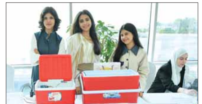
زينة وسارة وجوان من مدرسة منيرة عثمان السعيد الفائزة بالمركز الأول