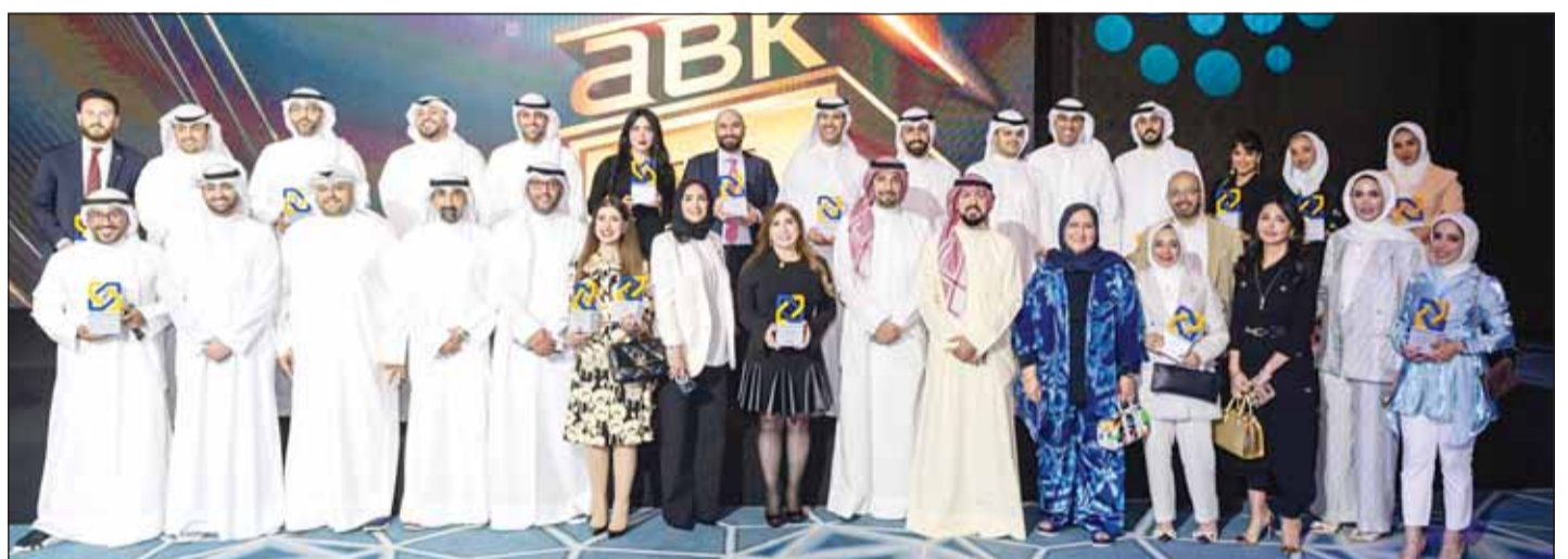
احتفاء بنجاحات فريق العمل

نظم البنك الأهلي الكويتي حفل الموظفين المميزين السنوي بمشاركة الإدارة التنفيذية، كمبرون شكر وتقدير على الأداء المتميز الذي أظهره خلال عام 2023، والتعرف على أبرز الإنجازات التي سجلها البنك على مدار العام الماضي.