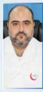
د/ إهم BDS الأسنان