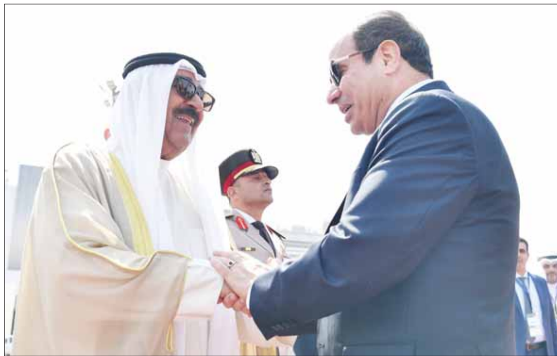
سمو الأمير الشيخ مشعل الأحمد مودعاً الرئيس المصري

سموه عاد إلى البلاد وأبرق إلى الرئيس المصري مؤكداً أن الزيارة تعزز التعاون المثمر البناء