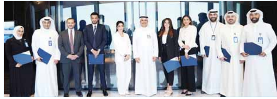
الإدارة التنفيذية لبنك الكويت الوطني تكرم فريق التواصل الرقمي 09