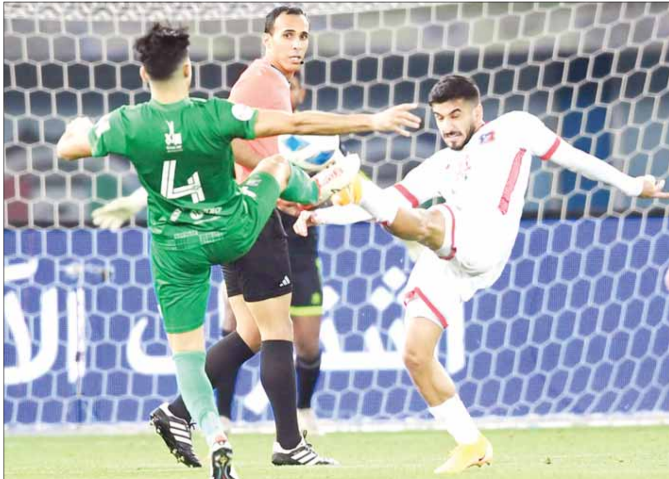
الصراع يحتدم الليلة بين الكويت والعربي

كأس الأمير 21 مايو الجاري. في المقابل، يأمل الفصيح تحت قيادة مدربه السوري فراس الخطيب في تعويض خسارته بالجملة الماضية أمام العربي، واستعادة نفمة الفوز، لاسيما في ظل التراجع الذي ظهر على الفريق في الجولات الماضية.