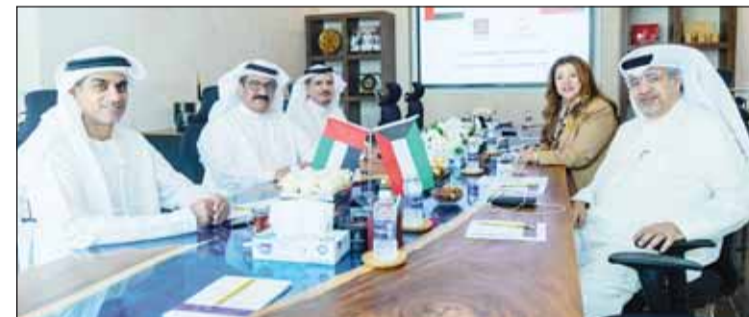
جانب من اللقاء المشترك بمقر اتحاد الشركات

توسيع الأسواق واستكشاف الفرص الجديدة، خاصة في دول مثل الكويت، والقيمة المضافة التي قدمها اتحاد شركات الاستثمار في هذا الصدد بمشاركته في الملتي، مؤكداً على أهمية الشركات الاستراتيجية والتعاون المستقبلي.