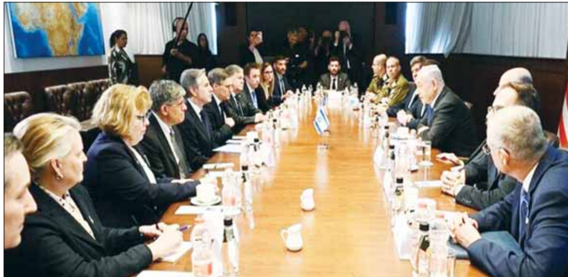
جانب من اجتماع رئيس وزراء الاحتلال الصهيوني بنيامين نتانيا هو ووزير الخارجية الأميركي أنتوني بليكن أمس

من جانبه، عبر القيادي في "حماس" يوسف حمدان عن اعتقاده بأن العرض الإسرائيلي الأخير يقترب من موقف الحركة وشروطها، لكنه لا يزال يتضمن بنودا ملقمة قد تؤدي لتفجير الاتفاق عند التنفيذ، قائلا إن وصف الورقة الإسرائيلية بأنها تتضمن عرضا سخيا للضغط على الحركة لقبول العرض كما هو لا يؤثر على روية "حماس" الواضحة، ولن تنوقف عند التوصلات، وستتعامل مع الأمور على حقيقتها دون مبالغة أو استخفاف، وهذا ما عبرنا عنه بأننا نتعامل بمسؤولية مع الورقة المقدمة وننتظر رد إسرائيل على ملاحظتنا.