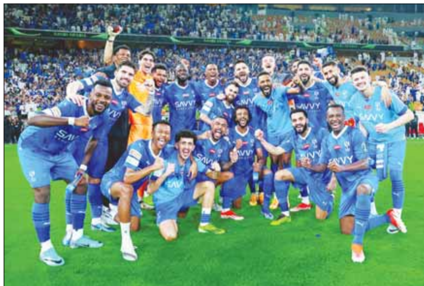
الزيم أقصم الأتبي من كأس الملك

■ تأهل الهلال إلى نهائي كأس الملك بفوزه المثير على اتحاد جدة 1-0 أول من أمس في المربع الذهبي للبطولة، في ثالث وصول له إلى المباراة الختامية على التوالي.