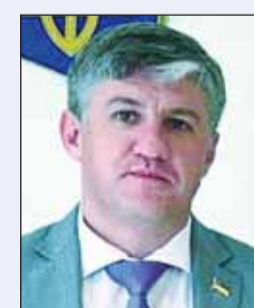
د. أوليكساندر بالانوتسا

يذكر أن عدداً من الصحف الأوكرانية تداولت مرسوم إعفاء السفير بالانوتسا من منصبه، والذي أصدره الرئيس الأوكراني بدون ذكر أي تفاصيل عن سبب الإعفاء.