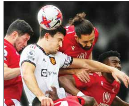
الإصابات الدماغية تهدد الاتحاد الإنكليزي

رفعت مجموعة مكونة من 35 لاعب كرة قدم سابقين، العديد منهم من الدوري الإنكليزي، دعوى قضائية ضد بعض مؤسسات كرة القدم الإنكليزية بسبب الإصابات الدماغية التي لحقت بهم أثناء ممارسة هذه الرياضة. وقرر اللاعبون مقاضاة الاتحاد الإنكليزي واتحاد ويلز والدوري الإنكليزي، الذي يتولى مسؤولية الدرجات من الثانية إلى الرابعة، ومجلس الاتحاد الدولي، المسؤول عن وضع قواعد كرة القدم، لكنهم "مهملين" في حماية اللاعبين من الإصابات الدماغية الناتجة عن ضربات الرأس بالكرة. وظل فترة استمرار هذه الدعوى، توفي 6 مدعين، من بينهم أسطورة توتنهام سابقاً، ومدرب المنتخب الوطني الإيرلندي، ومدرب توتنهام