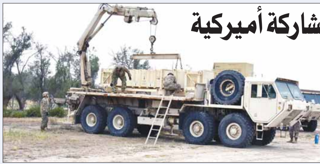
جانب من فعاليات الحفل الختامي