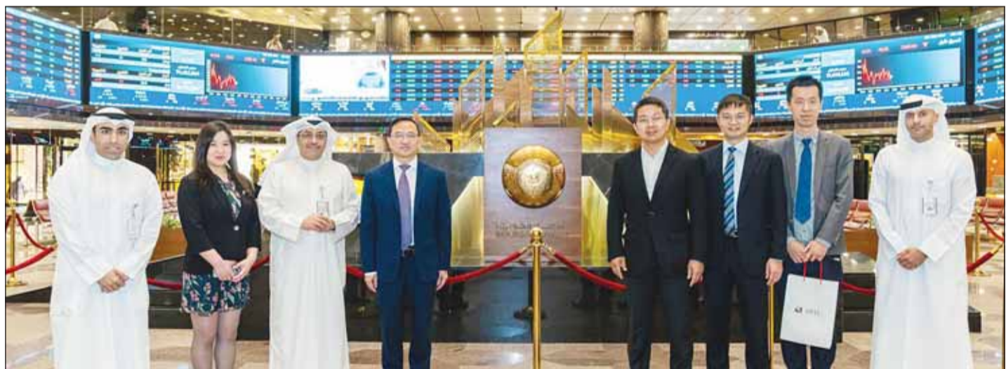
الوفد الصيني خلال زيارة بورصة الكويت

قبل "آرتي كابيتال" بدعم من مستثمري المجموعة العالميين.