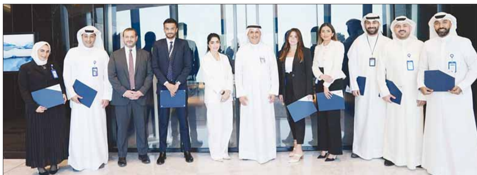
تكريم فريق إدارة التواصل الرقمي من قبل نائب رئيس مجلس الإدارة والرئيس التنفيذي لمجموعة بنك الكويت الوطني عصام الصقر

وكان للوطني تواجد إذاعي على مدار العام بمشاركة اتحاد مصارف الكويت، كما نظم "الوطني" مسابقات لتثقيف الجماهير حول أحدث أساليب الاحتيال عبر الإنترنت عبر صفحاته في وسائل التواصل الاجتماعي، وكذلك خلال العديد من الفعاليات المختلفة التي قام بتنظيمها ورعايتها، حيث قدم جوائز وصلت قيمتها إلى 500 د.ك، كما تم نشر أكثر من 60 مقطع فيديو على مدار العام عبر المنصات الإلكترونية التي تحظى بمشاهدة في الأكبر على مستوى البنوك الكويتية.