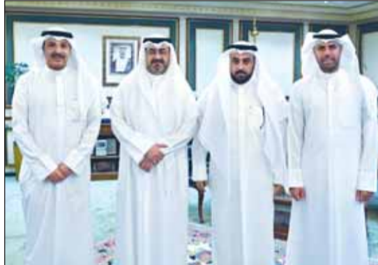
محافظ العاصمة متوسطا العازمي والمتنوق والقباسية

استعرض الحضور مع المحافظ انضمام مدينة الدسمه الى شبكة المدن الصحية الإقليمية وتطبيقها للمعايير الدولية في هذا الشأن. من جانبه، أعرب المحافظ عن شكره وتقديره لأعضاء اللجنة على تهانئهم ومشاعرهم الطيبة، وأثنى على جهودهم الواضحة في الارتقاء بالمنطقة وتعاونهم الدؤوب مع المحافظة لخدمة وطننا وتلبية لمطالبات أبناء المنطقة، مؤكداً أن المحافظة لن تألو جهداً في معالجة جميع المشاكل التي تعاني منها بعض مناطق المحافظة بالشراكة والتنسيق مع مختلف الجهات المعنية.