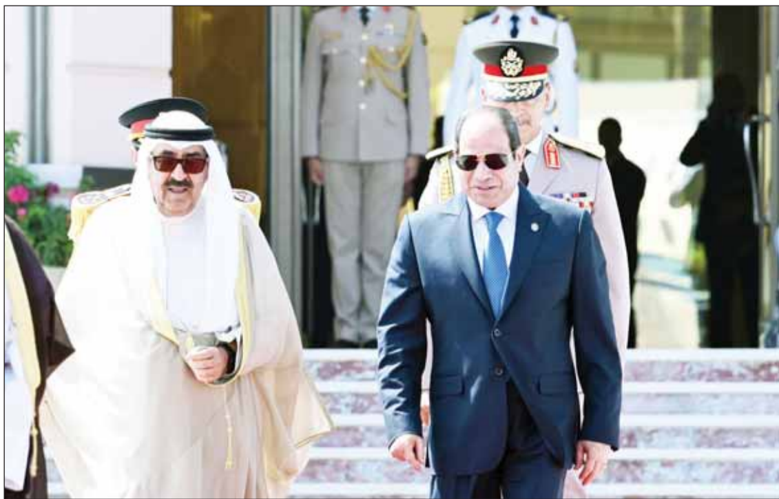
سمو الأمير الشيخ مشعل الأحمد لدى مغادرته القاهرة والرئيس عبدالفتاح السيسي في مقدمة مودعيه