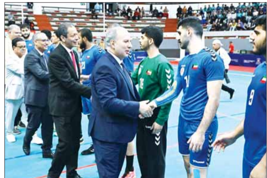
مسؤولو الرياضة المغربية يكرمون أزرق اليد