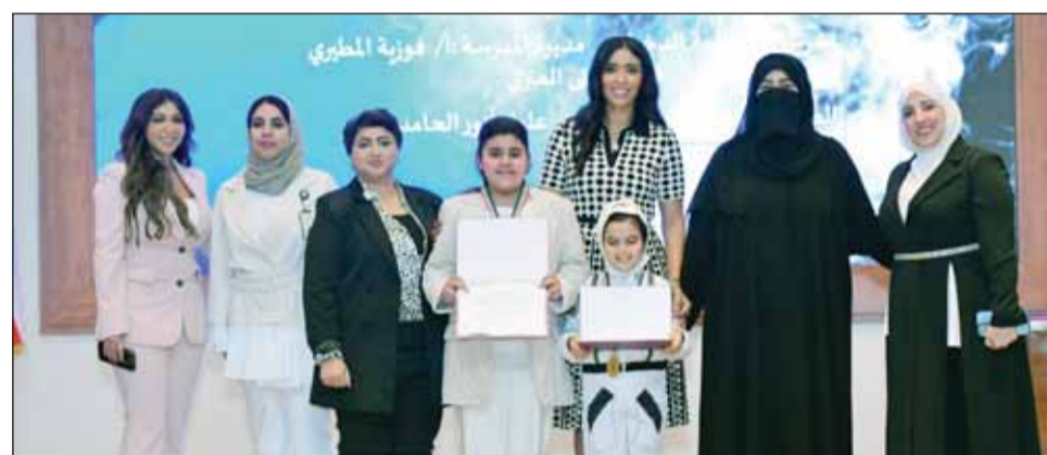
تكرم "ابتدائية فاطمة الدخيل" الفائزة بالمركز الأول عن قصة أشجار القمر أرتيميس

ملحوظ في التطور التقني السريع وزيادة فرص الابتكار والنمو في مختلف المجالات بالإضافة إلى رفع الجودة وزيادة الإمكانيات وكفاءة الأعمال وتحسين الإنتاجية.