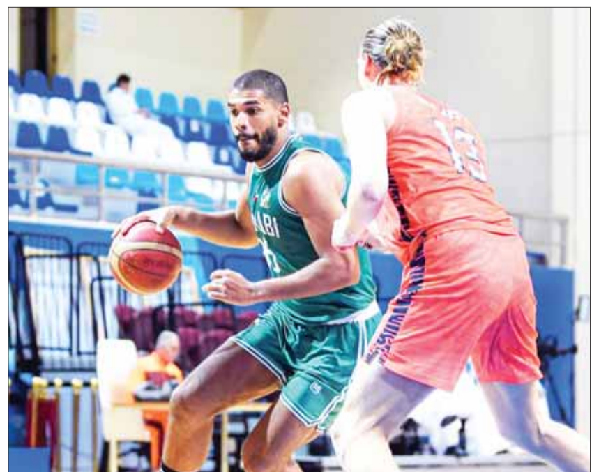
هجوم من العربي ودفاع من كاظمة

واخذت المباراة طابع القوة منذ انطلاقها تبادل بها الفريقان التقدم حتى انتهى الربع الأول بالتعادل 25-25، قبل أن يتقدم كاظمة في الربع