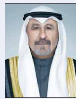
سمو الشيخ د. محمد الصباح

محمد الصباح ببرقية تعزية إلى أخيه الأمير محمد بن سلمان بن عبدالعزيز آل سعود ولي العهد رئيس مجلس الوزراء في المملكة العربية السعودية الشقيقة، أعرب فيها عن خالص تعازيه وصادق مواساته بوفاة المغفور له بإذن الله تعالى الأمير بدر بن عبدالمحسن بن عبدالعزيز، بعث سمو الشيخ الدكتور