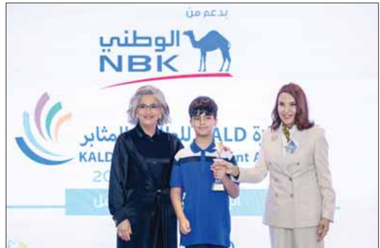
تكريم احد المتميزين

استراتيجيتنا للاستدامة، والتي يشكل التعليم عنصراً مهماً وأساسياً فيها". وشددت على أن بنك الكويت الوطني لن يألو جهداً في دعم الجمعيات الخيرية ومؤسسات رعاية الأطفال، كما سيحافظ على موقعه القيادي بين مؤسسات القطاع الخاص من خلال التزامه برعاية البرامج الاجتماعية الهادفة في مجالات