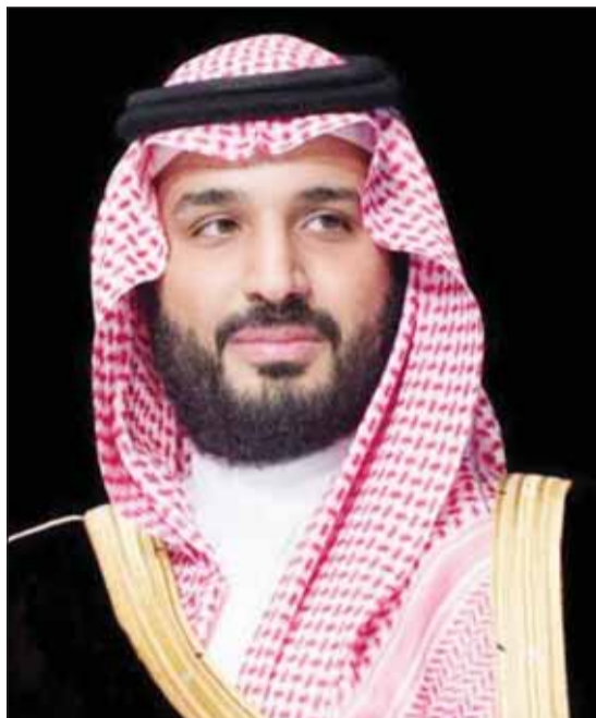
ولي العهد السعودي الأمير محمد بن سلمان