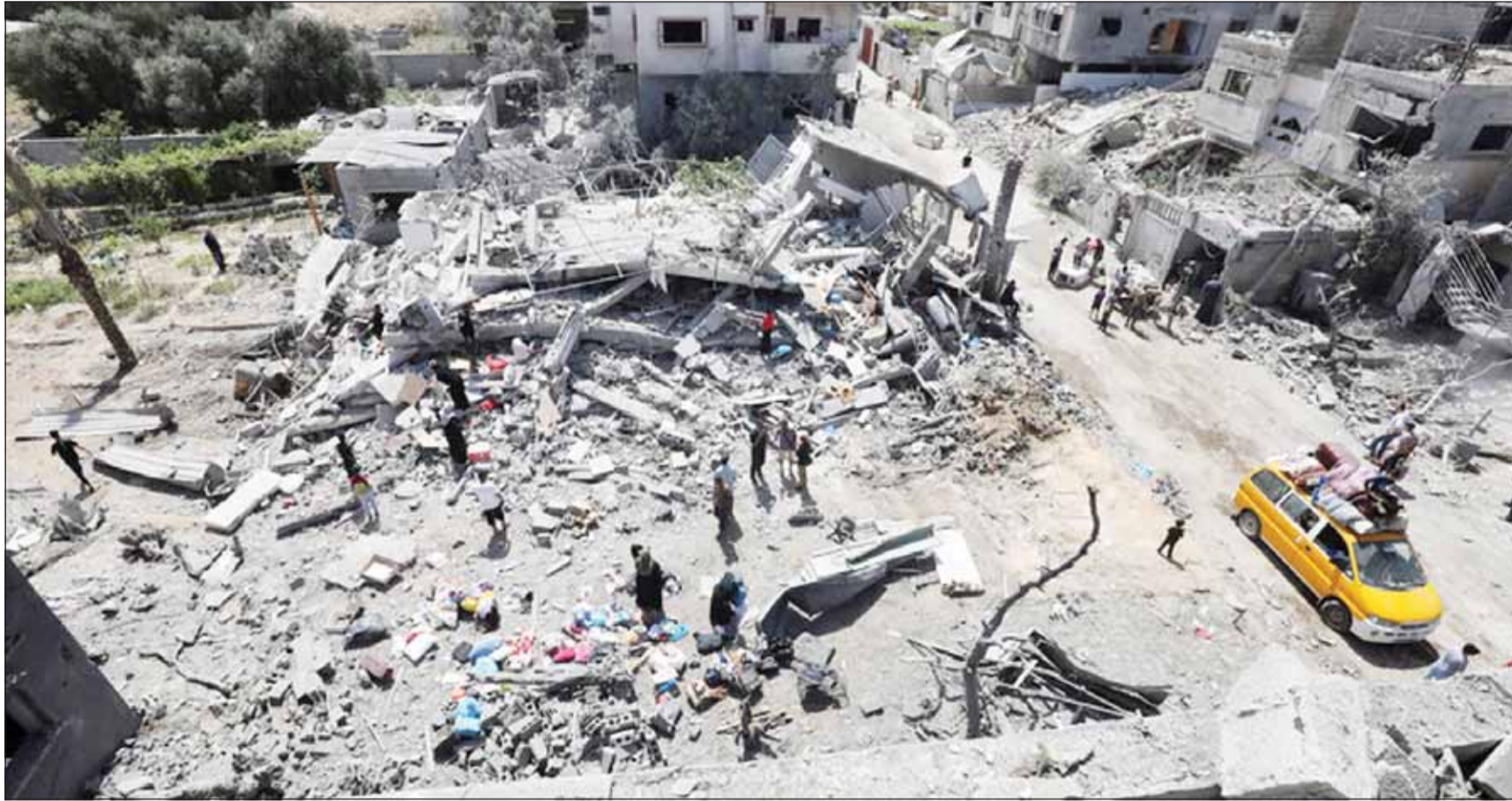
آثار الدمار شيع غزة بعد آخر قصف جوي إسرائيلي

■ رام الله، عواصم - وكالات، وصل وفد من حركة حماس إلى مصر أمس، برئاسة نائب رئيس الحركة في غزة خليل الحية، ومن المتوقع أن يصل إلى العاصمة المصرية وفد إسرائيلي أيضاً، لمواصلة المفاوضات بشأن اتفاق هدنة مع إسرائيل في قطاع غزة، بحسب ما أكدت قناة القاهرة الإخبارية.