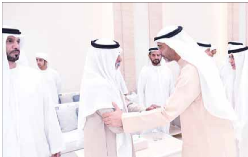
الشيخ محمد العبدالله معزياً أسرة آل نهيان بوفاة الشيخ طحنون بن محمد