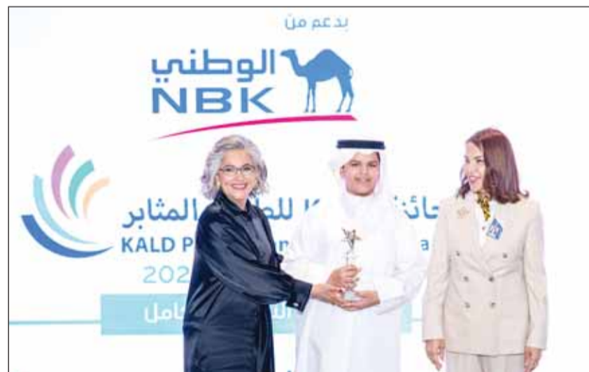
...وتكريم طالب آخر

الجائزة تركز على تقييم الطلبة وفقاً للجهد والمثابرة وليس على الإنجاز فقط