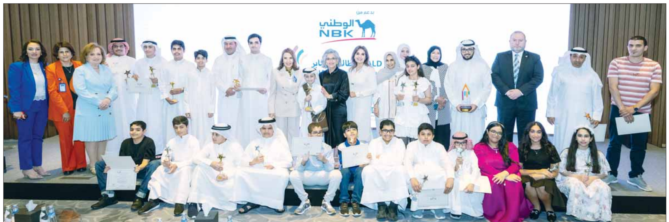
لقطة جماعية خلال تكريم الطلاب

وفي كلمة لها خلال الحفل، قالت البحر: "يسرنا في بنك الكويت الوطني أن نعتقل بكوكبة جديدة من الطلاب المتأثرين الفائزين بجائزة الجمعية الكويتية لاختلافات التعلم (KALD) للعام الدراسي 2023-2024"، مؤكدة أن