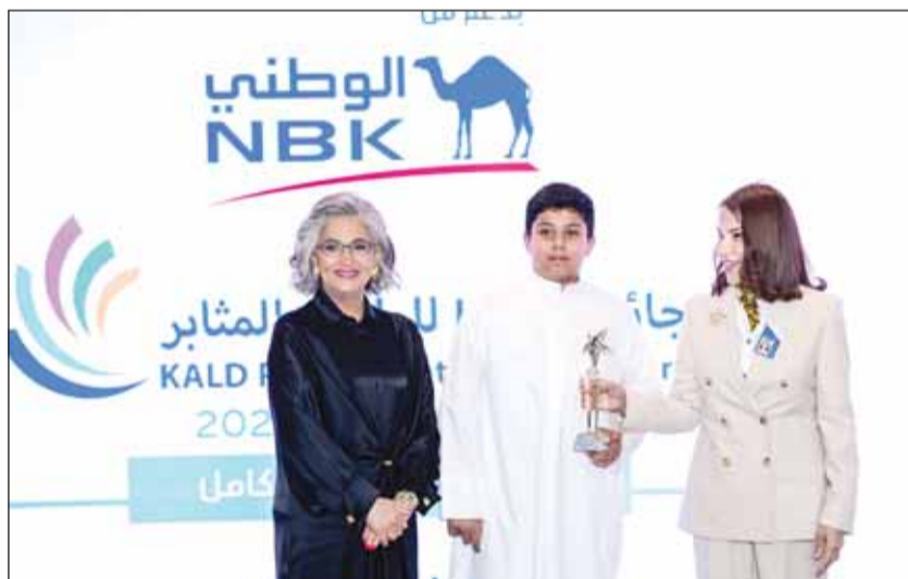
تكريم أحد الطلاب