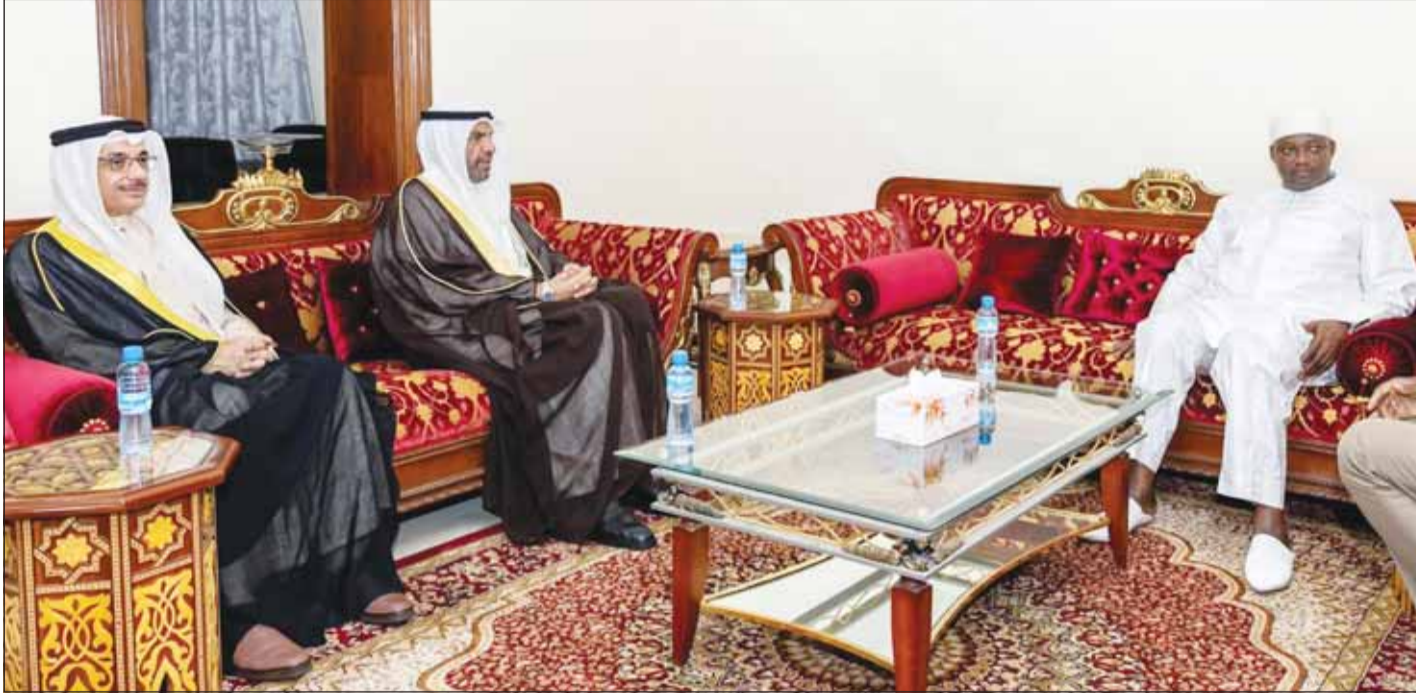
الرئيس الغامبيي أداما بارو خلال اجتماعه مع ممثل سمو أمير البلاد وزير الخارجية عبدالله البديا

الأحد 26 شوال 1445 هـ - الموافق 5 مايو (أيار) 2024 م (السنة 55) العدد (19550)