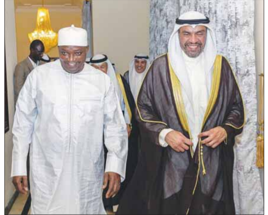
ممثل سمو الأمير مع رئيس غامبيا