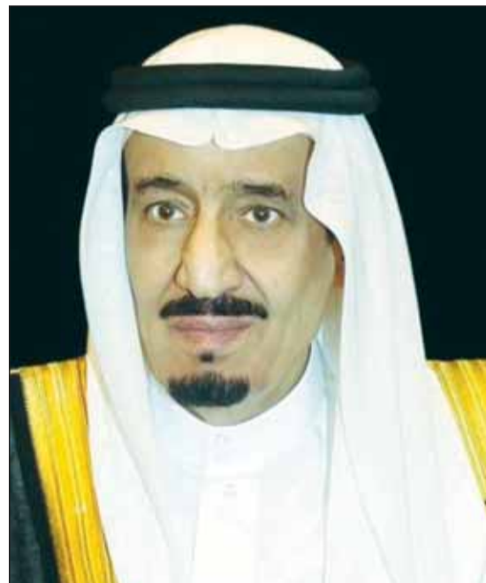
خادم الحرمين الشريفين الملك سلمان بن عبدالعزيز