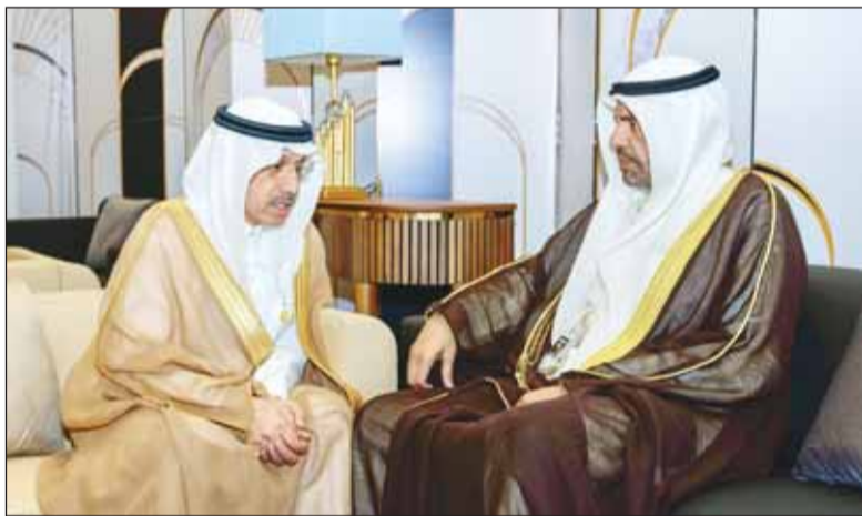
الوزير عبدالله اليحيا مع د. محمد الجاسر

التقى ممثل سمو أمير البلاد الشيخ مشعل الأحمد، وزير الخارجية عبدالله اليحيا، مع رئيس مجموعة البنك الإسلامي للتنمية الدكتور محمد الجاسر، وذلك على هامش أعمال الدورة الخامسة عشر لمؤتمر القمة الإسلامية لمنظمة التعاون الإسلامي. وأوضحت وزارة الخارجية في بيان صحافي أمس، أنه جرى خلال اللقاء بحث أوجه تعزيز التعاون بين دولة الكويت والبنك الإسلامي في مجالات التنمية الاقتصادية والاجتماعية، وأطر تمكين العمل المشترك بما يدعم مسيرة التقدم والازدهار ويمتق التطورات والأهداف المنشودة والتكامل الاقتصادي الإقليمي.