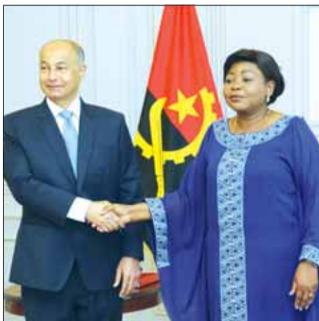
حسين المسلم واسبرنسا ديكوستا

أكد رئيس الاتحاد الدولي للسباحة حسين المسلم، أن الوقت قد حان، لاستضافة أفريقيا لبطولة العالم للسباحة للناشئين، على هامش لقائه معالي نائب رئيس جمهورية انغولا السيدة اسبرنسا ديكوستا.