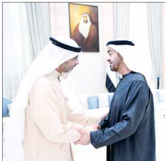
ممثل سمو الأمير يقدم العزاء لرئيس الإمارات الشيخ محمد بن زايد

الإمارات العربية المتحدة الشقيقة بالعاصمة أبوظبي. وكان ممثل سمو أمير البلاد الشيخ مشعل الأحمد وزير شؤون الديوان الأميري الشيخ محمد عبدالله المبارك غادر البلاد أمس متوجهاً إلى دولة