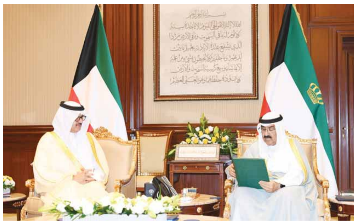
الأمير تسلم دعوة ولي عهد السعودية لانضمام الكويت إلى منظمة المياه 03

في سياق مع الزمن، يسعى رئيس الحكومة المكلف الشيخ أحمد عبدالله إلى استكمال تشكيلته الوزارية بالبحث عن الخائب المحلل الذي يضع حداً للإجراءات الدستورية المرتبطة برفض النواب الانضمام إلى الحكومة، التي باتت وفقاً لمصادر ثقة - "قاب قوسين أو أدنى"، علمت "السياسة" أن نواباً طرحوا على زميل لهم أمس دخول الحكومة "موقتاً" ليتسنى عقد الجلسة الافتتاحية، وبعدها "لكل حادث حديث"، مبيحة أن هذه الفكرة قيد الدرس. وذكرت المصادر أن بعض النواب يرون في توزيع النائب المحلل دافعاً للموول دون حل المجلس الذي كان نتاج انتخابات مفصلية أعادت معظم النواب الإصلاحيين في المجلس السابق المنحل، في وقت كشفت المصادر عما أسمته "صراع أقطاب وكسر عظم" يقف وراء رفض عدد من النواب دخول الحكومة وتالياً خروج الأخيرة إلى النور، مشيرة الانتماء: 13