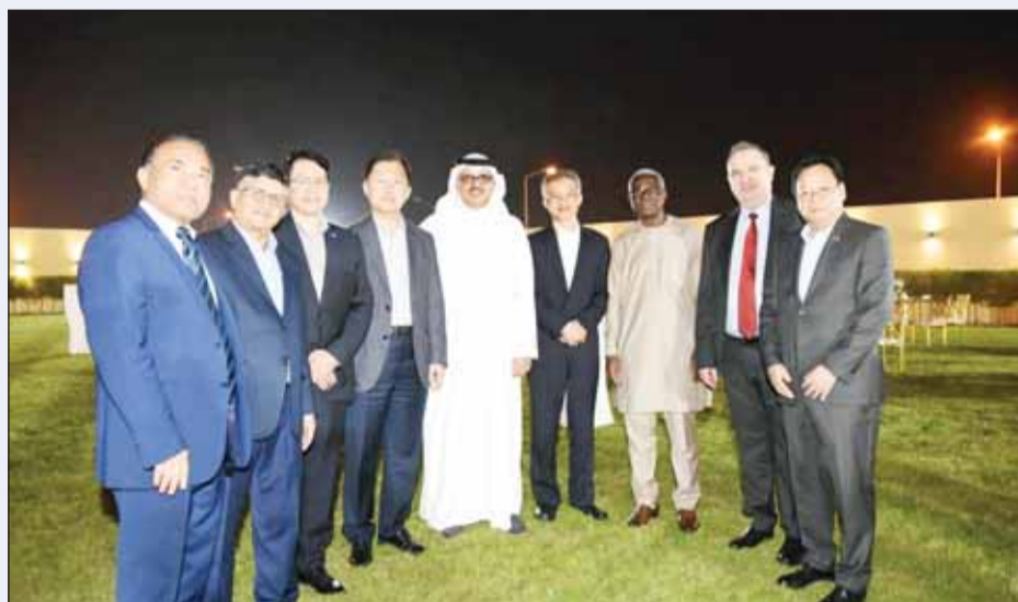
السفير الأمير سلطان بن سعد متوسطاً عدداً من السفراء والدبلوماسيين