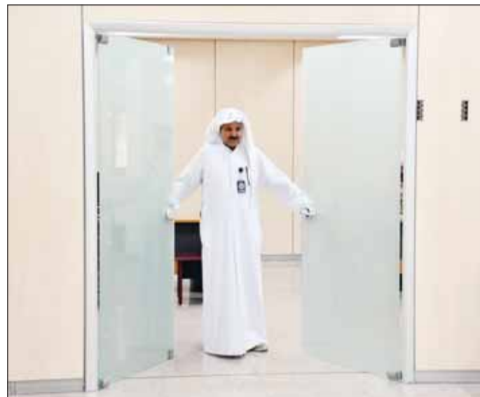
إغلاق باب الترشح لـ "تكميلية البلدي"

أضاف، يمكن للمرشح بعد استكمال ترشيحه التوجه لبلدية الكويت لاستخراج رخصة مقر انتخابي مؤقت، مقرأً للدكتور، وأضر لللائحة، مقتنماً بالتشديد على الالتزام بالتعليمات.