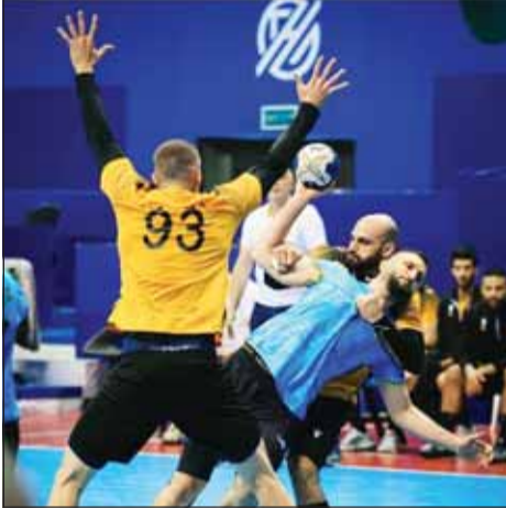
الأصفر أراح السماوي من الوصافة