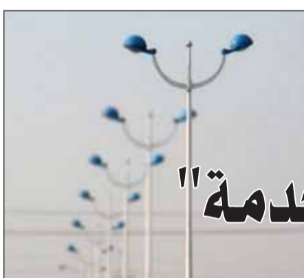
استفاد 55% من الطاقة الكهربائية لكشافات الشوارع

ومدير إدارة شؤون العاملين في الدفع بإنجاز أعمال التقايم السنوية لموظفي الوزارة لتصل المكافأة لمستحقها قبل بداية الصيف الجاري. من جهة أخرى، كشفت المصادر عن استنزاف 55 في المئة من الطاقة الكهربائية في كشافات أعمدة إنارة الشوارع المصنوعة من الزئبق والصوديوم التي لاتزال موجودة حالياً في عدد كبير من شوارع المناطق السكنية. وأوضحت أن الوزارة ممثلة في قطاع شبكات التوزيع الكهربائية قد انتهت من التجهيز لطرح مناقصة لتوريد كشافات LED في جميع مناطق البلاد - المرحلة الثانية والتي تشمل نحو 24 منطقة بجميع المحافظات. وبيّنت المصادر أن خطوة إلال لمبات الصوديوم بأخرى