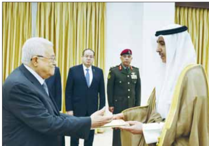
السفير حمد المري يقدم أوراق اعتماده إلى الرئيس محمود عباس

وفي هذا السياق، ذكرت رئاسة الوزراء الفلسطينية في بيان أن مصطفى قدم الشكر والتقدير لدولة الكويت بقيادة وشعباً على الدعم الإغاثي والإنساني للمكوث وللأمة العربية.