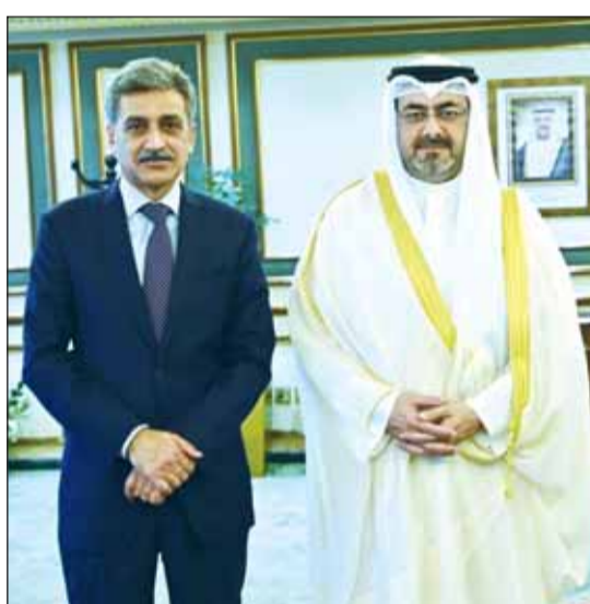
محافظ العاصمة خلال لقائه سفير باكستان

واستعرض المحافظ مع مسؤولي النظافة آلية الارتقاء بمستوى النظافة والخدمات العامة في مختلف مناطق العاصمة، وتكثيف الجولات الميدانية لمعالجة شكاوى المواطنين وتعزيز الدور الرقابي لمعالجة أوجه القصور في تلك المناطق.