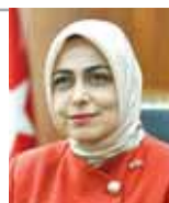
بقلم: طوبه نور سونم

أعلنت مؤسسة الكويت للتقدم العلمي أسماء الفائزين بجائزة الكويت في دورتها الـ 42 لعام 2023، والتي تمنحها المؤسسة سنوياً للعلماء الكويتيين والعرب ممن حققوا إنجازات بارزة ومساهمات علمية وفكرية متميزة في مسيرتهم البحثية على المستوى العالمي. وقالت المؤسسة في بيان صحفي أمس إن إعلان أسماء الفائزين جاء بعد اعتمادها من مجلس الإدارة ومجلس الجوائز في المؤسسة وبناء على توصيات لجان تحكيم متخصصة. وأضافت أنه في مجال العلوم الأساسية عن