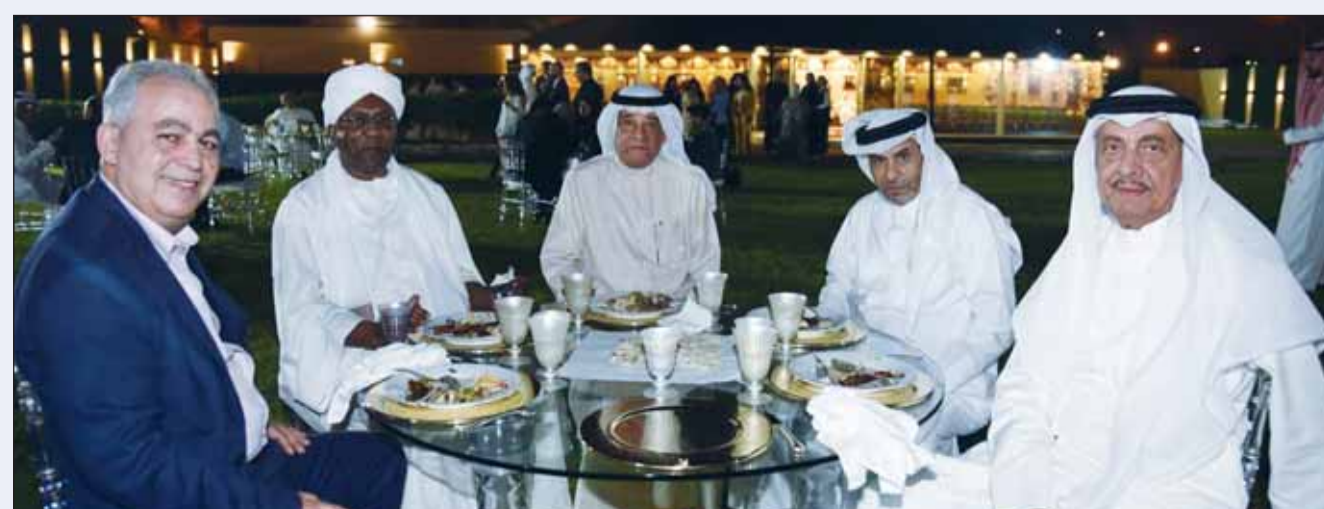
جانب من الحضور في اليوم الدبلوماسي المفتوح

بدورهم، أعرب الدبلوماسيون عن تقديرهم لهذا اليوم وثنموا جهود السفارة السعودية لدى البلاد في الحرص على إقامتها، واصفينها بالفرصة المثالية أنها فرصة مثالية لتعزيز سبل التواصل والتلازم بين الأشقاء والتبادل المعرفي والثقافي والاجتماعي ومناقشة مختلف القضايا.