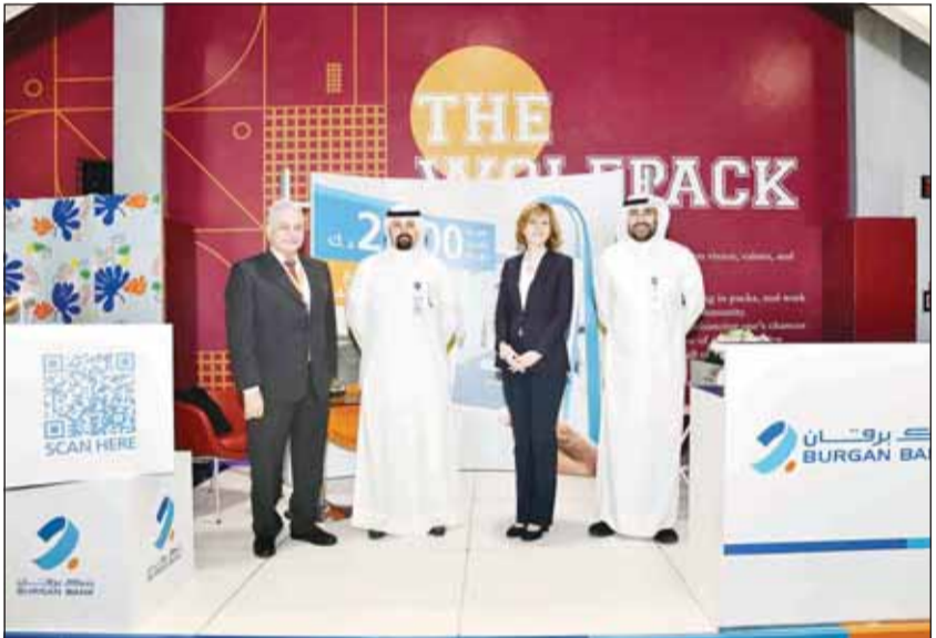
جناح برقان في المعرض

"سعداء بالمشاركة مرة أخرى في معرض النمو الوظيفي السنوي للجامعة الأميركية في الكويت. نحن ندرك صعوبة عملية البحث عن وظيفة في بداية المشوار الوظيفي، ولذلك فإن موظفي الموارد البشرية في بنك برقان يبادروا إلى الإجابة عن جميع الاستفسارات التي طرحها الطلبة، كما أجرى فريق البنك العديد من المقابلات الشخصية مع بعض الطلاب الموهوبين والمرشحين للعمل في البنك".