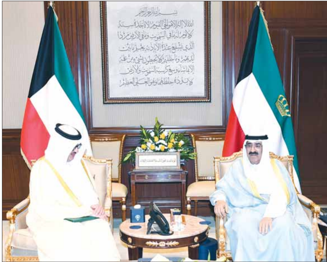
سمو الأمير الشيخ مشعل الأحمد خلال تسلمه رسالة ولى العهد السعودي من سفير خادم الحرمين الأمير سلطان بن سعد