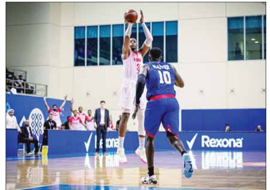
العديد لحسم لقب الغرب اليوم

في سياق متصل، حدد فلورنتينو بيريز، رئيس ريال مدريد، موعد انتقال الميرنجي بحصوله