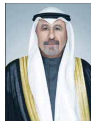
سمو الشيخ د. محمد الصباح

وحمل الرئيس عباس السفير المري تحياته إلى سمو أمير البلاد الشيخ مشعل الأحمد وتمنياته للكويت مزيداً من التقدم والنجاح في ظل الحكم الرشيد لسمو الأمير وقيادة سموه الحكيمة. من جهته، أعرب السفير المري في تصريح لـ "كونا" عقب تقديم أوراق اعتماده عن بالغ اعتزازه بالثقة السامية ومنحه شرف تمثيل دولة الكويت لدى دولة فلسطين بصفتها سفيراً غير مقيم.