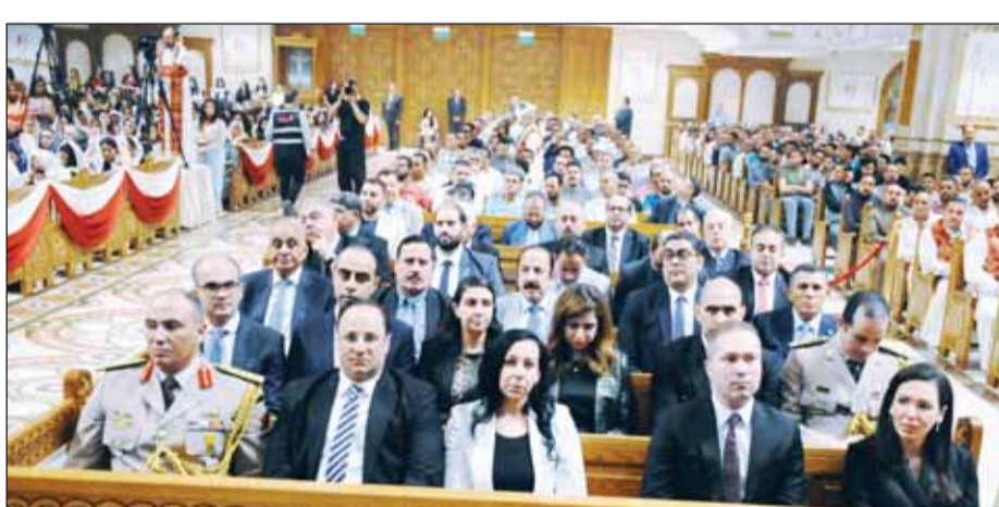
البعثة المصرية الدبلوماسية تتقدم الحضور خلال مراسم القداس