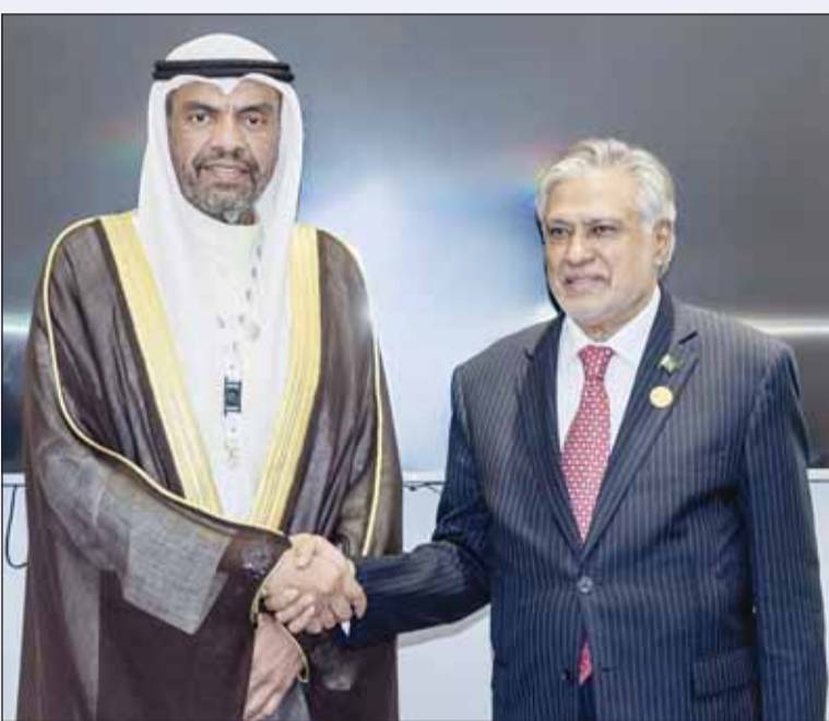
وزير الخارجية مع نظيره الباكستاني

جدة - كونا، أكد ممثل سمو أمير البلاد الشيخ مشعل الأحمد الجابر، وزير الخارجية عبدالله الجعيا، أن الأمة الإسلامية تواجه في هذه الفترة أخطاراً تنذر بمرحلة جديدة مليئة بالتحديات، مبيّناً أن الكويت حذرت مراراً من تبعات تقاعس المجتمع الدولي وتعاطيه مع القضية الفلسطينية وفق معايير مزدوجة. جاء ذلك في كلمة الكويت التي القاها الجعيا أول من أمس أمام أعمال الدورة الـ15 لمؤتمر القمة الإسلامية لمنظمة التعاون الإسلامي التي افتتحت أعمالها أمس في مدينة بانجول عاصمة جمهورية غامبيا الصديقة. ونقل الجعيا الذي ترأس وفد دولة الكويت المشارك في القمة في بداية كلمته تحيات سمو أمير البلاد لقادة الدول الأعضاء في المنظمة، ودعوات سموه الصادقة بالتفويض لأعمال القمة، ودعم سموه لما تصبو إليه دولنا وشعوبنا الإسلامية من تعزيز لروابط التعاون وأواصر التضامن في العالم الإسلامي.