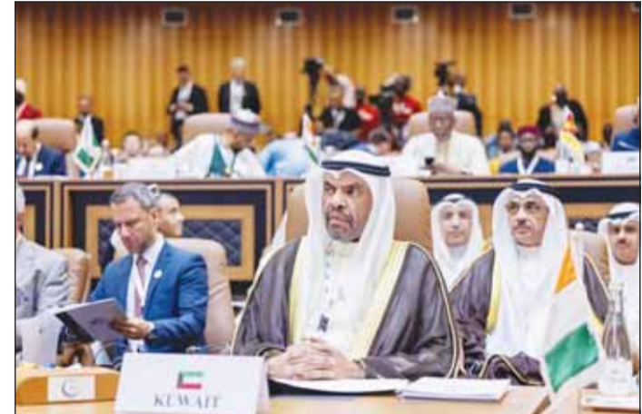
ممثل الأمير مترأساً الوفد الكويتي في القمة الإسلامية

غير مسبوقه، لا تعترف بحدود جغرافية لأثارها وتندرج بمرحلة جديدة مليئة بالتحديات التي لا يمكن لأي دولة بمفردها مواجهتها والتغلب عليها. وأوضح أن أهم هذه التحديات وأخطرها هو استمرار العدوان الذي يتكبده الشعب الفلسطيني الشقيق على يد القوة القائمة بالاحتلال في الأراضي الفلسطينية، وسط عزج مجلس الأمن عن القيام بمسؤولياته ووقوف المجتمع الدولي في فشل فاضح أمام أكبر اختبار للقيم والمبادئ. وأكد أن دولة الكويت حذرت مراراً من تبعات تعاطي المجتمع الدولي مع القضية الفلسطينية وفق معايير مزدوجة، وتقايسه عن إيجاد حل سلمي عادل وشامل ونهائي لهذه القضية وعدم رده إسرائيل السلطة القائمة بالاحتلال من ممارساتها الإجرامية وانتهاكاتها المستمرة. واعتبر أن هذا التحدي الخطير يستدعي توحيد مواقف الدول الإسلامية ومضاعفة جهودها من أجل استنهاض مسؤولية المجتمع الدولي نحو وضع حد للجرائم والانتهاكات الإسرائيلية، وتنفيذ قرارات الشرعية الدولية، وتوفير الحماية الدولية للمدنيين، ومساءلة ومحاسبة المسؤولين الإسرائيليين عن الجرائم التي ترتكب ضد الشعب الفلسطيني.