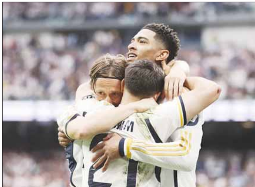
فرحة لاعبي ريال مدريد بالفوز على قادش

على لقب الدوري الإسباني، بعد ان قرر تأجيل اعتقالات الفريق المعتادة بالليغا عند نافورة سيبيليس، لعدم تشتيت انتباه اللاعبين واستنزافهم جسدياً وعاطفياً قبل موقعة بايرن ميونخ في اياب نصف نهائي دوري أبطال أوروبا بعد غد الاربعاء.