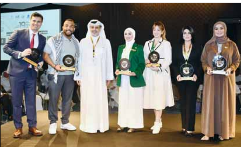
ماضي الخميس متوسطاً عدداً من المشاركين فيم الجلسات

أن هذه الخطوة تتسق مع مواقف دولة الكويت تجاه فلسطين خصوصاً في هذه الظروف القاسية والصعبة، حيث نطمح أن نقدم لفلسطين ما تستحقه.