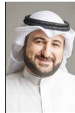
الشيخ د. عبدالله المشعل

■ كرم وكيل وزارة الدفاع الشيخ د. عبدالله مشعل الصباح الدفعة الأولى من منتسبي وزارة الدفاع الذين أنموا فترة تدريبهم العلمي في كلية القانون الكويتية العالمية بموجب اتفاقية التعاون المشتركة بين الجهتين.