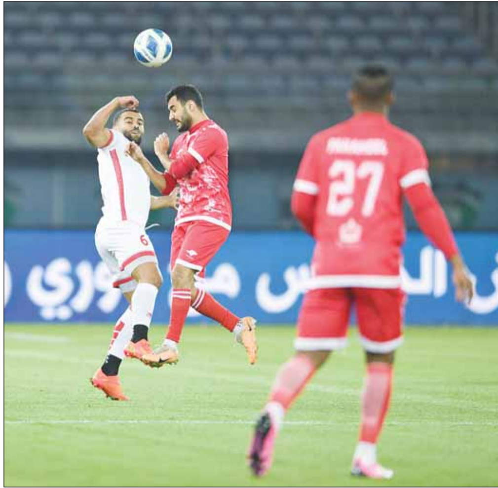
الفحيحيل أجبر الكويت على التعادل باللقاء الأخير