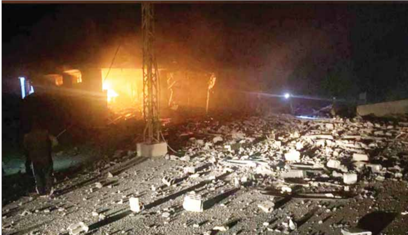
آثار الغارة الإسرائيلية على بعلبك اللبنانية

بيروت - وكالات، أفادت وكالة الأنباء اللبنانية الرسمية، بإصابة 3 لبنانيين في غارة جوية إسرائيلية استهدفت فجر أمس بلدة السفري في بعلبك شرق لبنان. ونكرت الوكالة أن "الطيران الحربي المعادي شن غارة حوالي الساعة الواحدة والنصف من فجر أمس على معمل في بلدة السفري، ما أدى إلى سقوط 3 جرحى مدنيين، وتدمير المبنى المستهدف". وقال الجيش الإسرائيلي في بيان، إن طائرات مقاتلة إسرائيلية، قصفت خلال الليل مجمعا لحزب الله في منطقة السفري بالقرب من بعلبك شمال شرقي لبنان. وأضاف الجيش الإسرائيلي أنه قصف أيضا مواقع تابعة لحزب الله في رامية وعيتا الشعب، ومروحين وجبل بلاط بجنوب لبنان الليلة الماضية. بدوره، أعلن "حزب الله"، استهداف مقر قيادة فرقة الجولان التابعة للجيش الإسرائيلي بصواريخ الكاتيوشا، ردا على الغارة الإسرائيلية هذه الليلة التي استهدفت بعلبك شمال شرقي لبنان. وقال حزب الله في بيان، إنه "دعما للشعب الفلسطيني الصامد في قطاع غزة وإسنادا لمقاومته الجاسلة والشريفة، وردا على اعتداء العدو الذي طال منطقة البقاع قصف مجاهدو المقاومة الإسلامية عند الساعة 09:00 أمس، مقر قيادة فرقة الجولان "210"، في قاعدة نفع