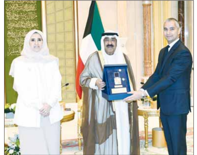
صاحب السمو مكرماً محافظ مصرف البحرين خالد حميدان

التحول الرقمي، وتعد حافزاً لمواصلة مسيرة المصرف، وإنجازاً يضاف إلى سلسلة إنجازات قطاع الخدمات المالية للمملكة البحرين على الصعيد الإقليمي والدولي، في العهد الزاهر لملك البحرين حمد بن عيسى، وبدعم مستمر من ولي العهد رئيس مجلس الوزراء الأمير سلمان بن حمد. واختتم حميدان كلمته بالدعاء "أن يحفظ دولة الكويت حكومة وشعباً تحت ظل قيادة سموكم الحكيم وأن يقيكم ذفراً لها ولشعبها الشقيق".