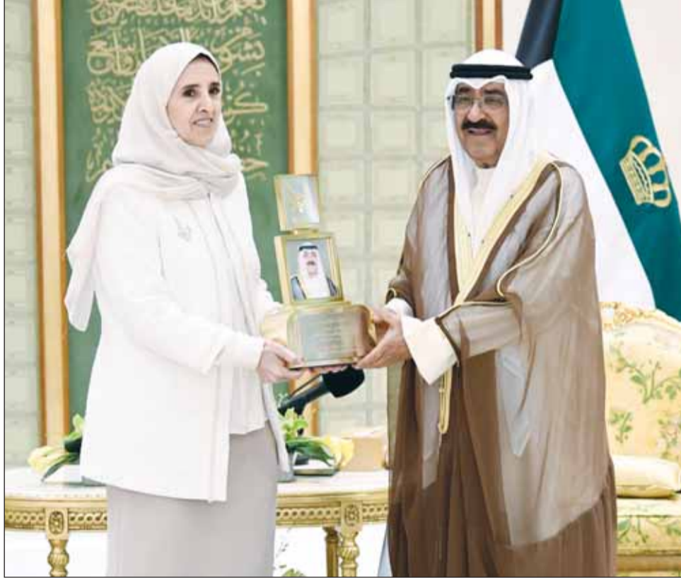
سمو أمير البلاد يتسلم تكريماً من الشبيخة عايدة السالم