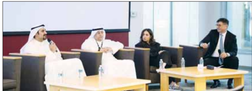
المشاركون في الحلقة النقاشية