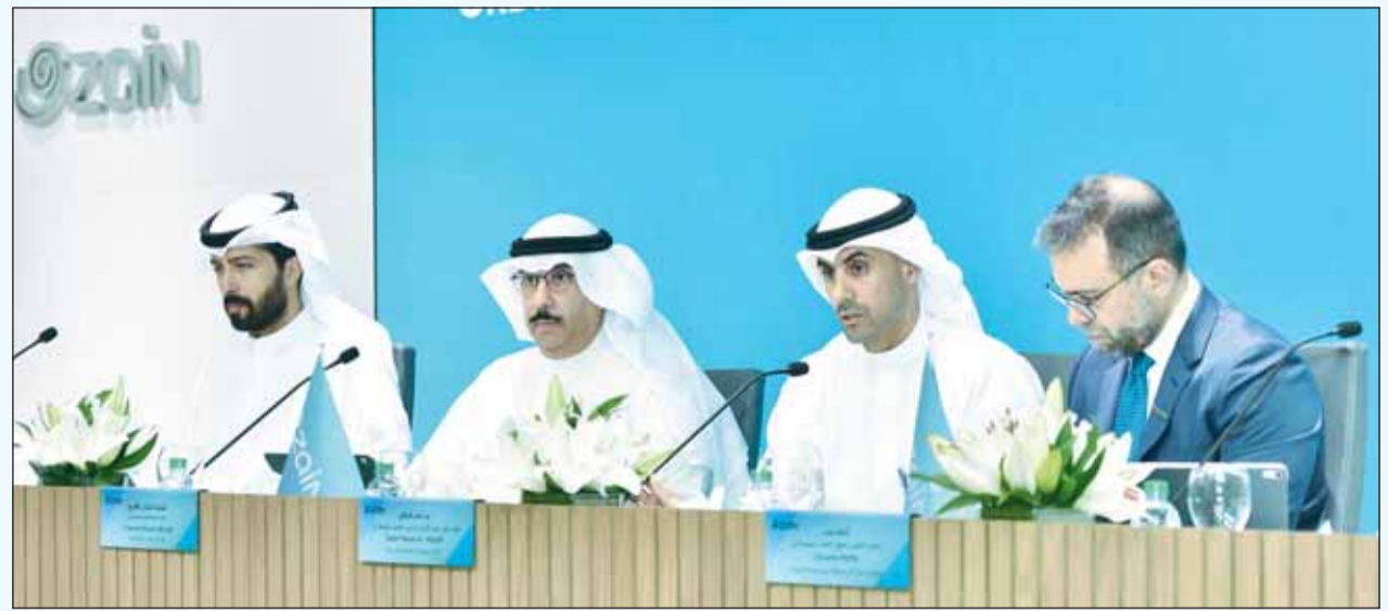
جانب من الجمعية العمومية