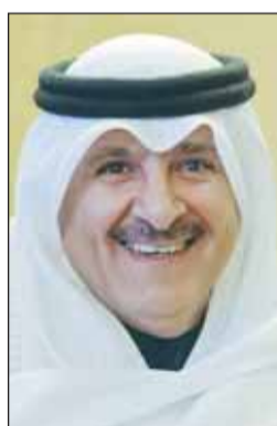
السفير وائل العنزي

البلدان مسيرة ثرية بالإنجازات والمحطات المفصلية في تاريخهما، وأثبتت التجربة متانتها وقوتها، وتحظى برعاية طيب أردوغان.