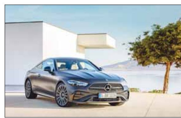
انطلاق سيارة CLE الجديدة من "مرسيدس-بنز" في الكويت 08

قضت محكمة الجنايات بحبس مواطنين اثنين 5 سنوات مع الشغل والنفاذ في قضية تسريب اختبارات الثانوية العامة من خلال "غروب واتساب" مقابل مبالغ مالية. ووجهت النيابة العامة تهمة غسل الأموال بالحصول على أموال بطرق غير مشروعة. وكانت تحريات المباحث سبق أن كشفت عن ضلوع