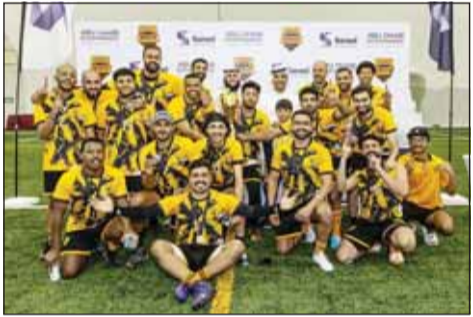
تتويج فريق القادسية لكرة العلم

■ حقق فريق كرة العلم بنادي القادسية، لقب بطولة كأس الأندية العربية والتي اختتمت مؤخرًا في العاصمة الإماراتية أبوظبي، بفوزه في المباراة النهائية على فريق المصري بنتيجة 4-4. وأشاد نائب رئيس الاتحاد الآسيوي لكرة القدم الأمريكية السابق الشيخ مشعل طلال الفهد، بالمستويات اللاحقة التي قدمها لاعبو نادي القادسية لكرة العلم والتي أهلتهم للحصول على كأس بطولة الأندية العربية. مضيفاً أن القادسية بلاعبيه المواطنين تفوق على مختلف الأندية المشاركة بالرغم من استعانتها بالعناصر الأجنبية المتمرسه باللعبة. وأشار الفهد أن المشاركة في هذه البطولة والحصول عليها تعد عاملاً مهماً وحافزاً للاعبين للدخول في مختلف الاستحقاقات القارية والدولية المقبلة ومنها التصفيات المؤهلة إلى أولمبياد لوس أنجلوس 2028.