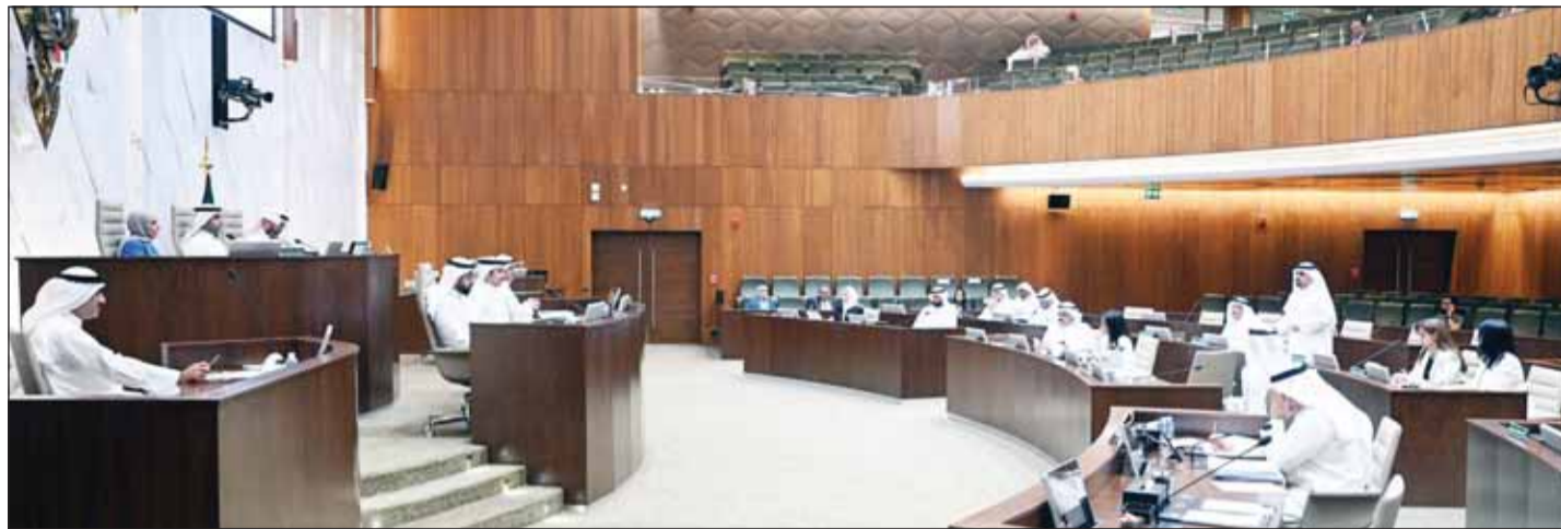
جانب من جلسة المجلس البلدي