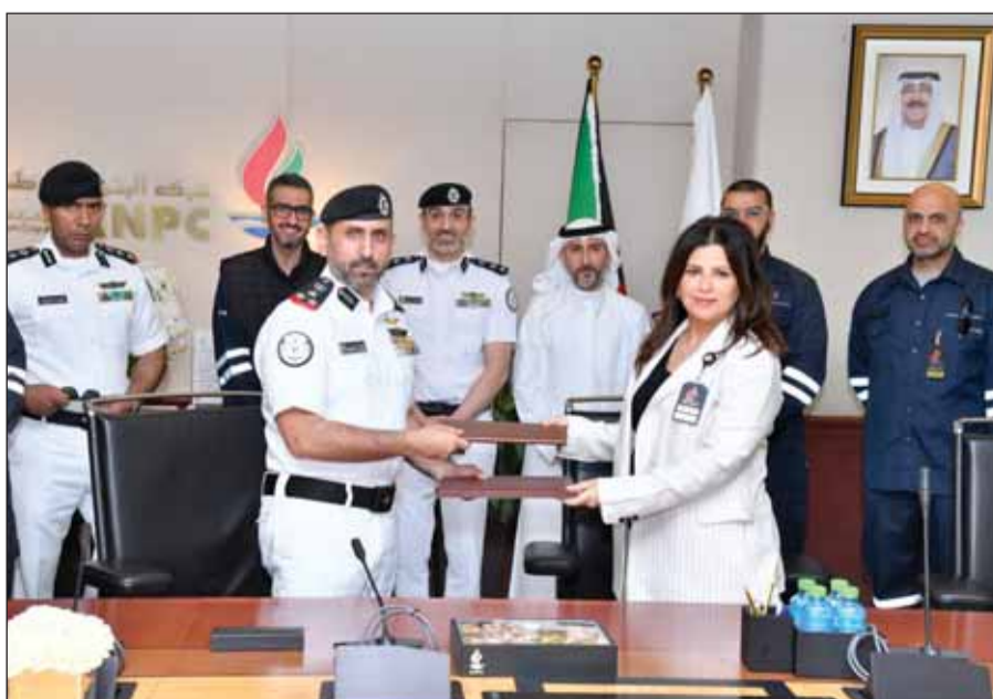
صورة جماعية على هامش توقيع البروتوكول

والتنموي على أكمل وجه. وذكر أن الإدارة العامة لخفر السواحل مقبلة على مرحلة جديدة من العمل الأمني بتوجيهات من صاحب السمو أمير البلاد الشيخ مشعل أحمد الجابر الصباح حفظه الله ورعاه، منوهاً إلى أن الإدارة تعتمد على التكنولوجيا والتحول الرقمي، ولديها منظومة إدارية متطورة لحماية السواحل الكويتية. جدير بالذكر أن البروتوكول يتضمن عدداً من البنود، من بينها تشجيع وتعزيز التعاون والتفاهم المشترك، وتطوير خطط الإسناد والطوارئ والتخطيط العملي، وتنظيم دورات تدريبية، وتنفيذ تمارين مشتركة، وتطوير آلية فعالة للسيطرة والاتصال والتنسيق بين غرف العمليات أثناء الحوادث والمخالفات الطارئة.