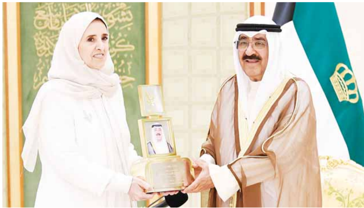
الأمير كرم الفائزين بجائزة سالم العلي للمعلوماتية... ويزور تركيا اليوم 03-02

صرف "ممتازة" 9 آلاف موظف في "الأشغال" الشهر الجاري محمد غانم