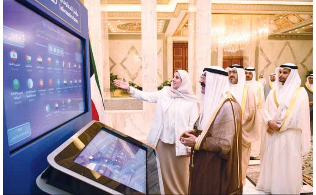
سمو الأمير الشيخ مشعل الأحمد يدشن النسخة الجديدة من مشروع مؤشر المعلوماتية

السالم: الطفرة الرقمية الهائلة وضعتنا أمام مسؤولية سدّ الفجوة التقنية وصون الخصوصية