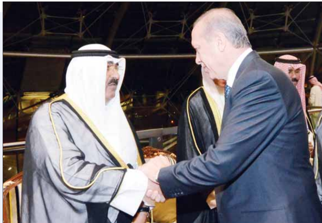
سمو أمير البلاد الشيخ مشعل الأحمد والرئيس التركي رجب طيب أردوغان (أرشيف)