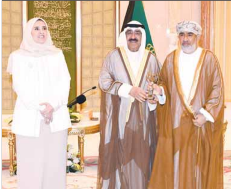
سمو الأمير مكرماً د.خليفة البروانة

حميدان: جائزة مرموقة تمثل اعترافاً بالإنجازات والجهود المبذولة وتحفز لمواصلة المسيرة