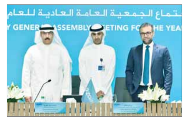
بدر الخرافي: "زين" نجحت في التوسع باستثماراتها وتعظيم حقوق المساهمين 11