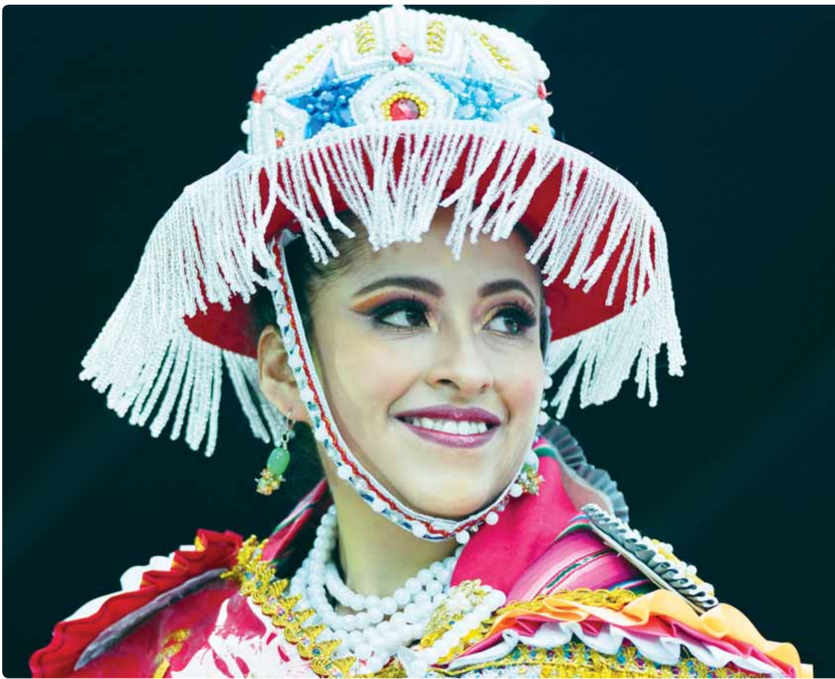
بوليفية مشاركة في مسابقة ملكة القوة العظمى في العاصمة لاباز