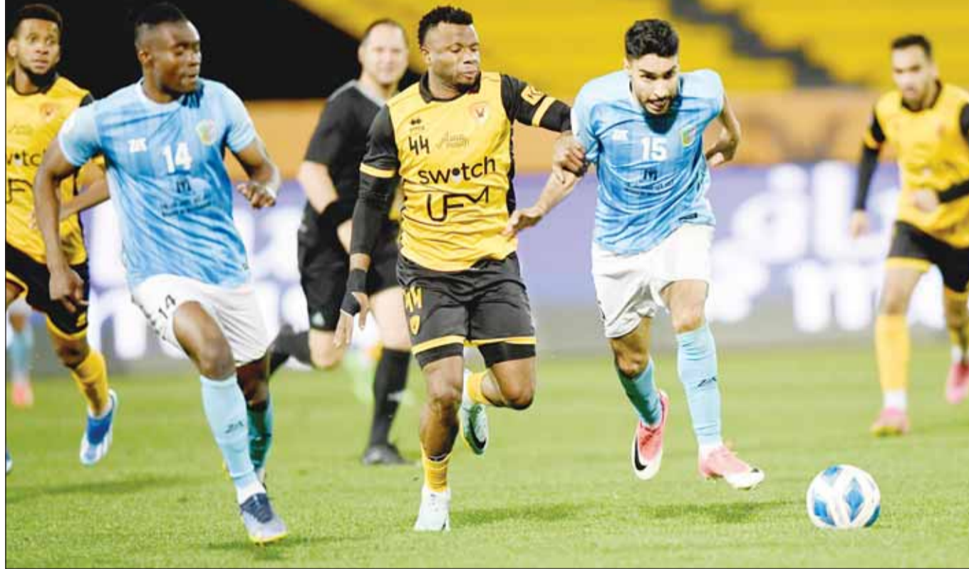
السلمية الهادي يحاول المرور من جيولا في لقاء سابق

اي نقطة، في حال أراد "التمسك" بأمل المنافسة على اللقب. على الجانب الآخر، يسعى السالمية الرابع (31 نقطة)، تحت إشراف ميسا إلى إثبات وجوده، ومواصلة الإعداد للنهائي، والتمسك بالمركز الرابع.