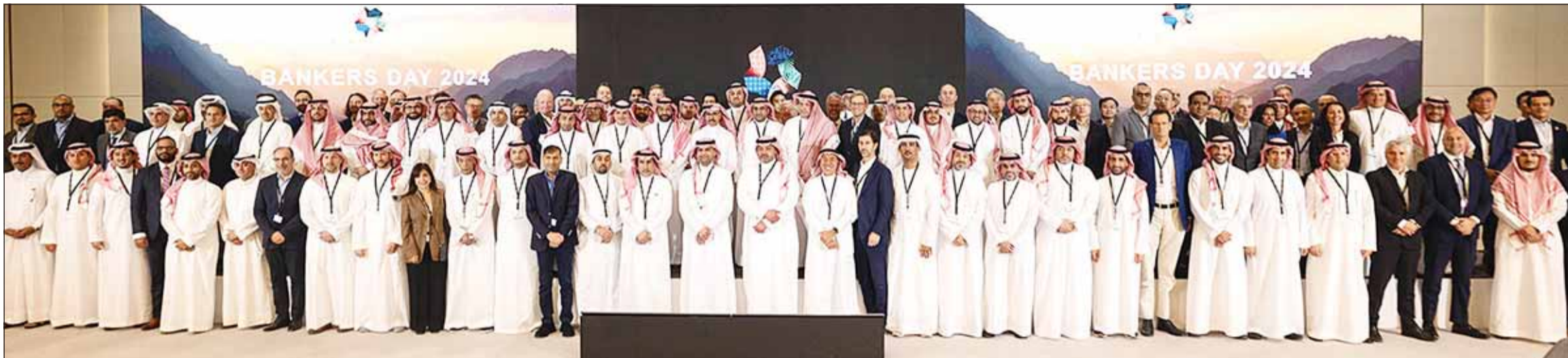
صورة جماعية لقيادات المصارف الإقليمية والعالمية

□ نؤكد تعزيز تواجدنا الإقليمي والاستفادة من خبرتنا لاقتناص الفرص بالسوق السعودي