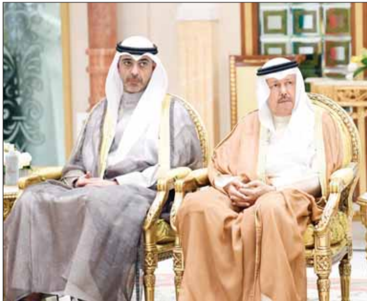
أحمد الفهد والشيخ محمد العبدالله

ووصل سموه إلى مكان الحفل حيث استقبل بكل عناية وترحيب من قبل رئيس مجلس أمناء الجائزة الشبيخة عايدة سالم العلي وأعضاء اللجنة المنظمة العليا، وتفضل سمو الأمير بتدشين النسخة الجديدة من مشروع مؤشر المعلوماتية. وقالت رئيسة مجلس أمناء الجائزة في كلمة ألقاها بالمناسبة: "أقف أمام سموكم اليوم لاستقبال المشهد الحضاري من مولانا في عصر التحويلات وتحقق المعلومات، إذ نجد أنفسنا على شفا تحول كبير تغلغل فيه التكنولوجيا الرقمية فأمدت طفرة هائلة