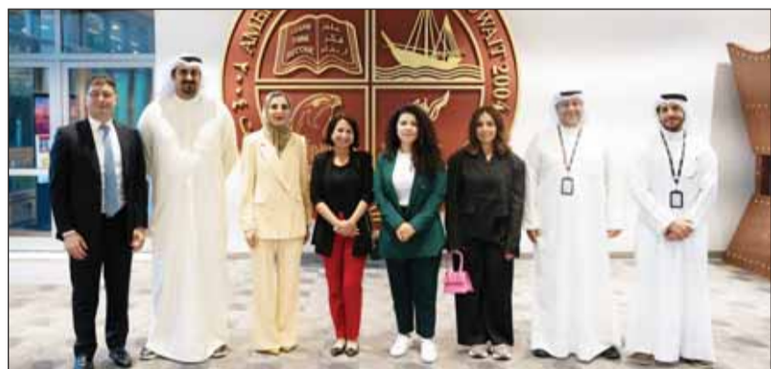
صورة جماعية لعملي HSBC AUK

استضاف مكتب شؤون الخريجين والتطوير الوظيفي بالجامعة الأميركية في الكويت AUK بالتعاون مع أمديست، الرئيس التنفيذي وكبار أعضاء بنك HSBC الشرق الأوسط المحدود بالكويت، بهدف تمكين وتوجيه الطلبة نحو العمل في القطاع الخاص، حيث أقيمت سلسلة من الحلقات النقاشية بعنوان "مسارات المستقبل - الوظائف والفرص في القطاع الخاص".