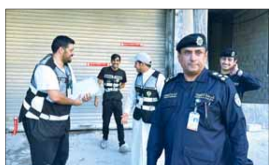
العميد أشرف الأمير يتابع مجريات الحملة ميدانياً