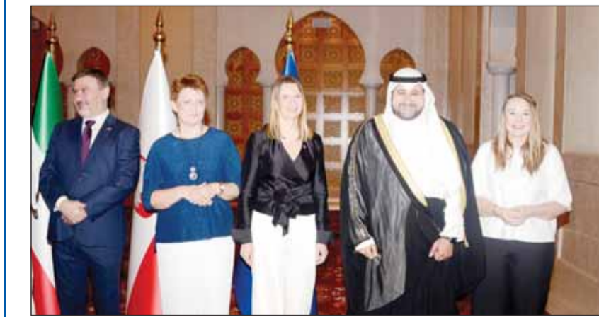
وكيل وزارة الدفاع الشيخ د.عبدالله المشعل مهنتاً

أشاد وكيل وزارة الدفاع الشيخ الدكتور عبدالله المشعل بالعلاقات الكويتية - البولندية، منوهاً بعزم ومتانة هذه العلاقات بين البلدين الصديقين، وما تشهده من تطور مستمر على مختلف الأصعدة. وقالت وزارة الدفاع إن وكيل الوزارة شارك في احتفالية السفارة البولندية لدى البلاد، جريا على عاداته بمشاركة الدول الشقيقة والصديقة في احتفالاتهم الوطنية، وذلك بمناسبة عيدها الوطني تلبية لدعوة القائم بالأعمال. وقالت الوزارة إن وكيل "الدفاع" أعرب عن خالص تهنئته وصادق تمنياته لبولندا الصديقة بهذه المناسبة الوطنية، مؤكداً مساعدته بعمق ومتانة العلاقات وتطورها المستمر. وذكرت أنه حضر الحفل أيضاً أمر سلاح الدفاع الجوي اللواء الركن خالد درج سعد، وعدد من الضباط الكويتيين الفريجين من الأكاديمية البحرية البولندية.