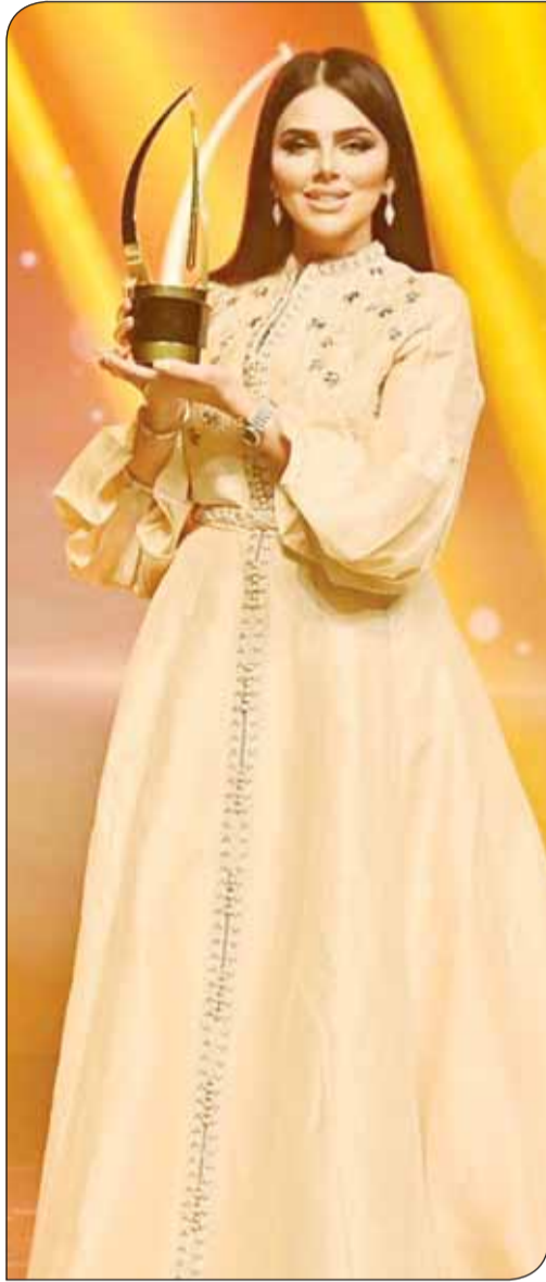
هيا مُكرمة في مهرجان الإذاعة والتلفزيون

تجربة جديدة قررت فوضها للتعرف على ثقافات جديدة وربما جمهور جديد، وعنها تقول، لم يكن ما يعرف بالإعلام الجديد المتوقع في جهاز الموبايل يستهويني، إذ اعتدت منذ أن وطأت قدمي ساحة الإعلام تحمل المسؤولية في برنامج تلفزيوني متكامل، لذا بدأت مواجهة الملتقى وأنا ما زلت في بدايتي، وبالتالي لم يكن تأخر دخولي منصات "الميديا" تخوفاً أو رهبة إنما اختيار الممتوى