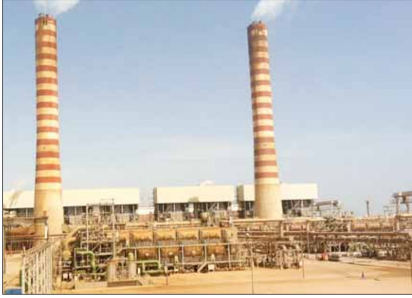
جانب من محطة الزور الجنوبية