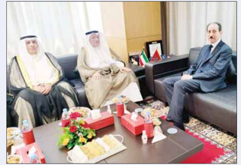
المستشار بورسلي خلال أحد لقاءاته في المغرب