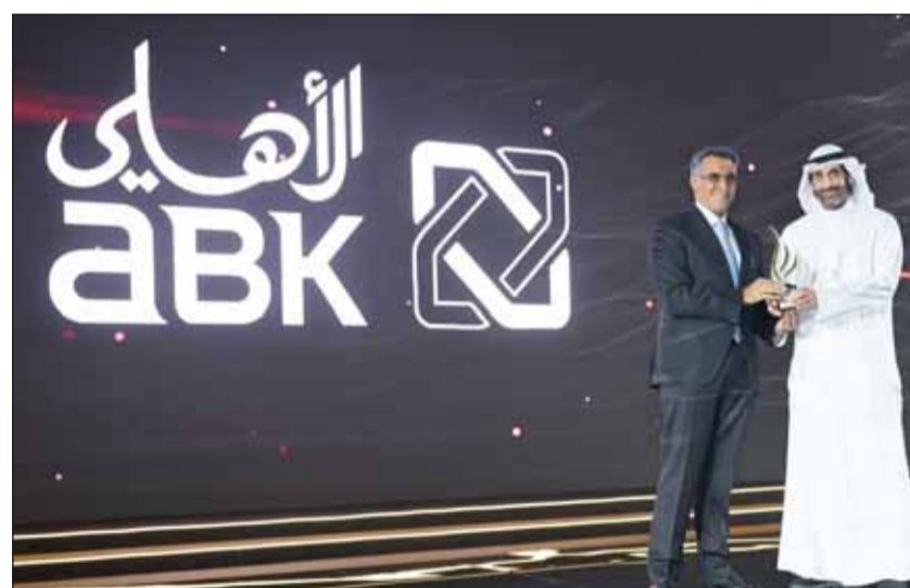
تكريم البنك في الحفل الختامي للمعرض

البنك في الحفل، لإفاحة إلى أهمية المعرض الذي تنظمه سنوياً، والذي يتيح الفرصة للتعرف على الطلبة وإهتمامهم الوظيفية، من أجل السعي لتلبيتها بأفضل طريقة ممكنة. وشكل هذا الحدث منصة محورية للطلاب والخريجين والمتخصصين من مختلف القطاعات للتواصل واستكشاف الفرص الوظيفية، في وقت أكد البنك الأهلي الكويتي من خلال رعايته ومشاركته في المعرض دوره الرئيسي في تعزيز ثقافة التميز في الصناعة المصرفية.