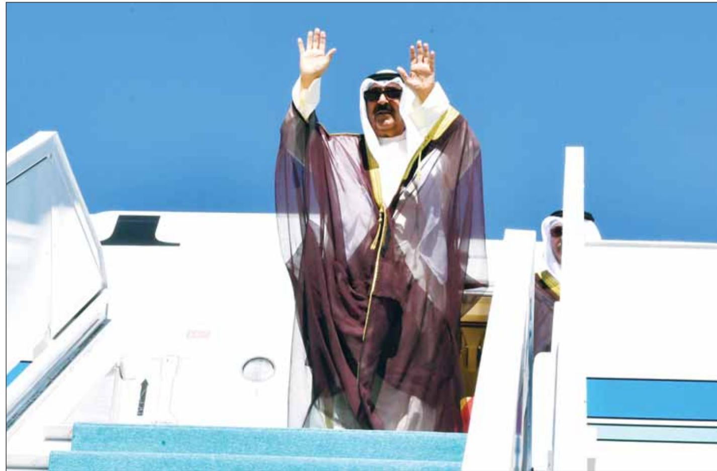
سمو أمير البلاد الشيخ مشعل الأحمد محييا مودعيه عقب صعوده الطائرة مغادرا تركيا