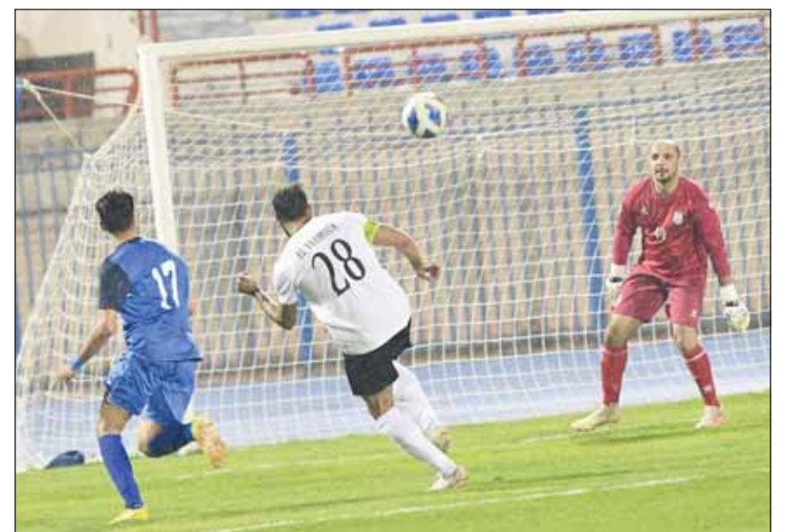
هدف التضامن نقطة أمام اليرموك للتأهل