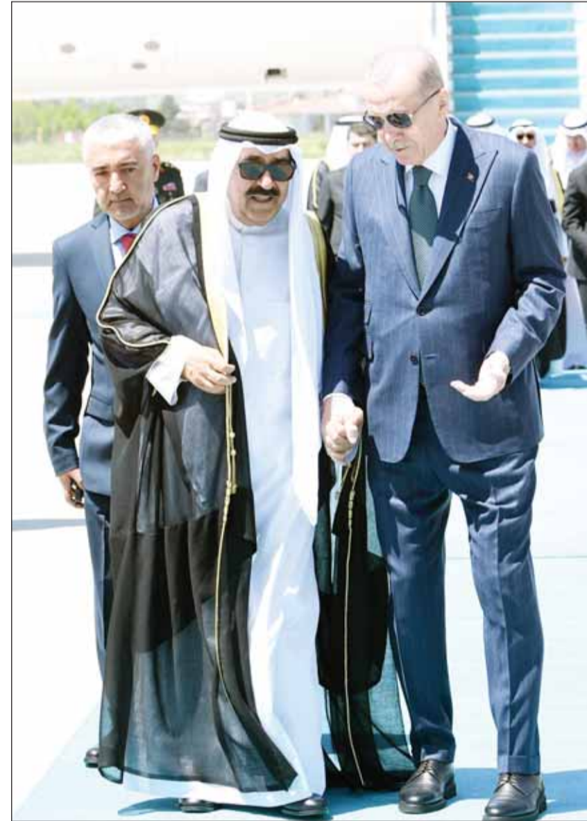
سمو الأمير الشيخ مشعل الأحمد والرئيس رجب طيب أردوغان خلال زيارة سموه لتركيا

المتبادلة من مصلحة البلدين، وبحث الزعيمين التعاون بين البلدين في مجالات الدبلوماسية والصحة والثقافة والسياحة والتعليم. وأكد الرئيس أردوغان على استمرار دعم تركيا لسيادة الكويت وسلامتها الإقليمية وأمنها وأن الاتصالات بين البلدين ستستمر بشكل وثيق على جميع المستويات. وذكر البيان أن الهجمات الإسرائيلية على الفلسطينيين الأبرياء في قطاع غزة كانت أيضاً ضمن ملفات اللقاء حيث أكد الرئيس أردوغان أن «موقف الكويت ضد الظلم الإسرائيلي يتمتع بالأهمية»، وأن هذا الموقف يضيف قوة للقضية الفلسطينية، لافتاً إلى أن تركيا تسعى جاهدة منذ البداية من أجل التوصل إلى وقف دائم لإطلاق النار. كما أشار الرئيس أردوغان إلى أهمية تطوير التعاون بين مجلس التعاون الخليجي ومنظمة الدول التركية، مؤكداً في هذا الإطار أهمية دعم الكويت لهذه الجهود وأن ذلك سيؤدي إلى فتح نوافذ فرص جديدة.