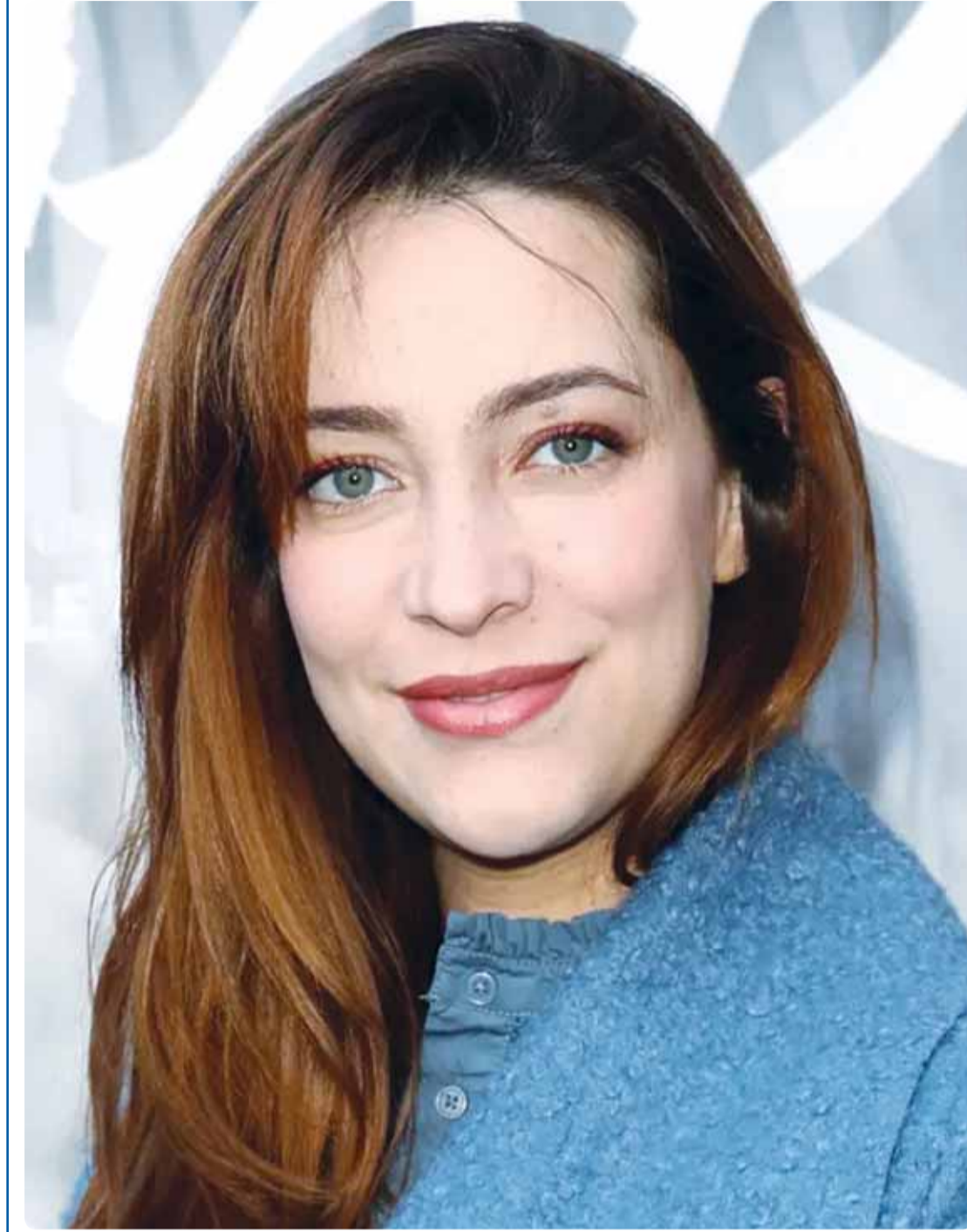
الممثلة الايطالية مارغريتا تيبيري خلال حضورها العرض الأول لفيلم "Accattaroma" في روما

في كويت الماضي لم نكن نعرف المستشار الوافد، كان مستشارونا منا وفينا، وكانت الأمور تسير بشكل صحيح، خصوصا علاقة المواطن بالدولة، ولم يشترك احد، ولم يتقدم مواطن من الروتين، وكان هناك قرار مناسب يتخذ في الوقت المناسب. ارجعوا إلى تاريخ الكويت الحديث، على الأقل قبيل ظهور النفط حتى مرحلة ظهوره، تجنون ضالتكم، فمن نظم سوق العمل في السابق ينظمه حاليا، من دون الرجوع إلى سعادة المستشار...زين.