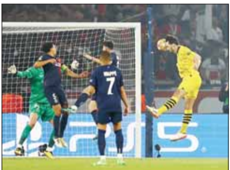
ماتس هوملز لحظة تسجيل الهدف الوحيد

تأهل بوروسيا دورتموند الألماني إلى نهائي دوري أبطال أوروبا للمرة الأولى منذ 11 عاماً وذلك بعدما كرر فوزه بهدف دون رد على مضيفه باريس سان جيرمان أول من أمس على ستاد بارك دي برانس (حديقة الأمراء) في إياب نصف النهائي.