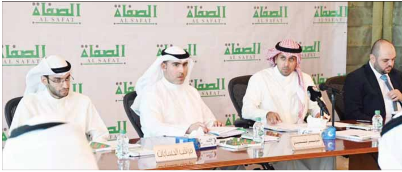
جانب من الجمعية العمومية

فازت شركة الصفاء للاستثمار بجائزة أفضل عملية اندماج بين شركتين استثماريين لعام 2023 - دول الخليج العربي (Best Merger and Acquisition in the Investment Sector - GCC region) من Business Outlook وحصلت الشركة على هذه الجائزة في ظل تنفيذ عملية الاندماج التي تمت بفترة قياسية وبتناجج مذهلة أهمها سرعة وسلاسة العملية الانتقالية سواء بالعمليات المالية والمساهمين، بالإضافة إلى إبقاء نسبة كبيرة من الموظفين في أماكنهم ومناصبهم مع حفظ حقوق الجميع.