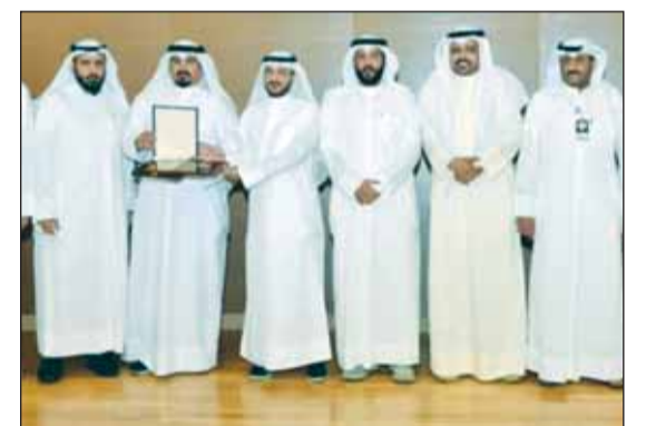
وكيل وزارة الاوقاف بدر المطيري يكرم الجهات المشاركة