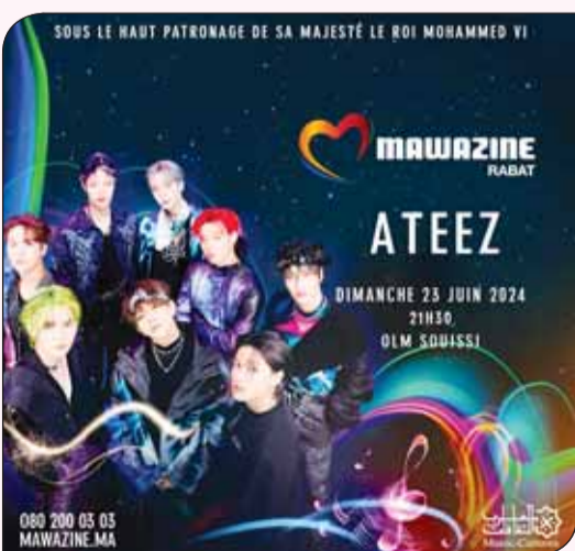
فرقة "Ateez" الكورية