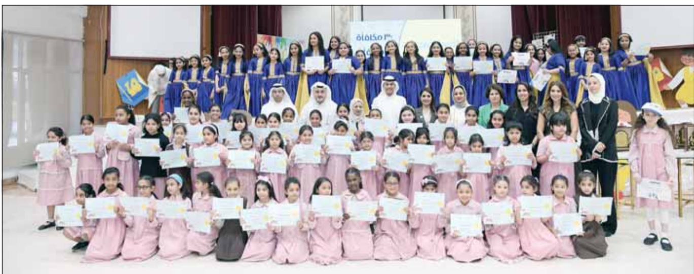
لقطة جماعية مع طلاب مدرسة عمرة بنت زرم الابتدائية للبنات

وقال المرزوق، "سعيدون جداً بالتفاعل الكبير للطلبة والطالبات في مدارس الكويت المتعلقة مع برنامج Bankee خلال أول عام دراسي لتطبيقه