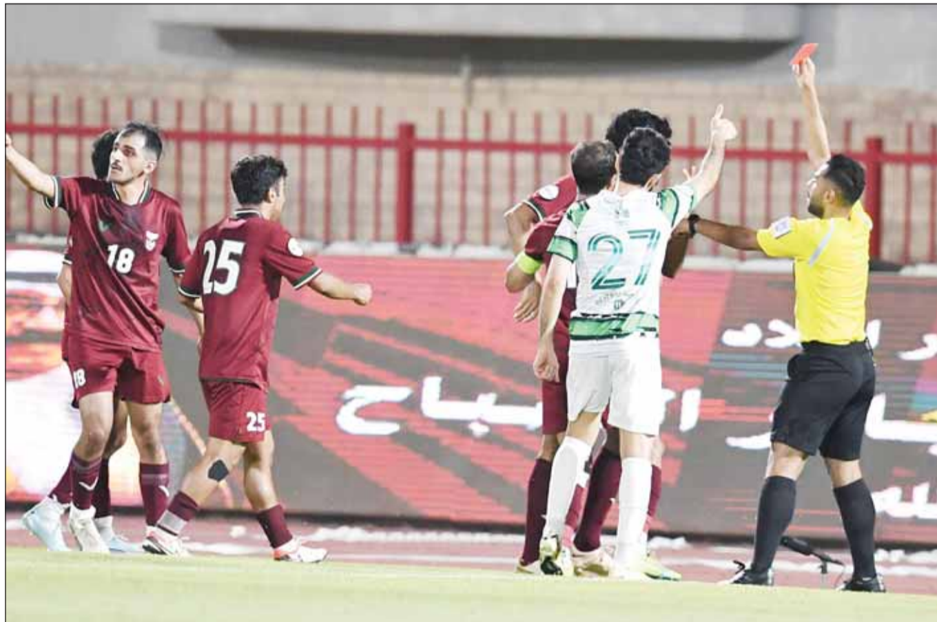
خمس حالات طرد بالجملة السادسة

محافظة المتصدرين على المستوى الممتاز، وحضور "رغبة الفوز في أداء الفريقين.