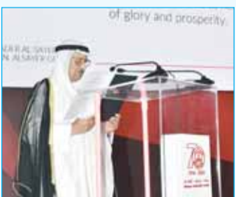
"مجموعة السائر" تحفل بمرور 70 عاماً على التأسيس 14