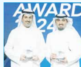
"الوطني" يحصد 6 جوائز للتميز المصرفي من مجلة "ميد" العالمية 10