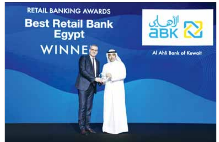
استلام جائزة أفضل بنك للتجزئة في مصر

وشدد على أهمية جائزة أفضل بنك بحماية العملاء ومكافحة الاحتيايل، قائلاً