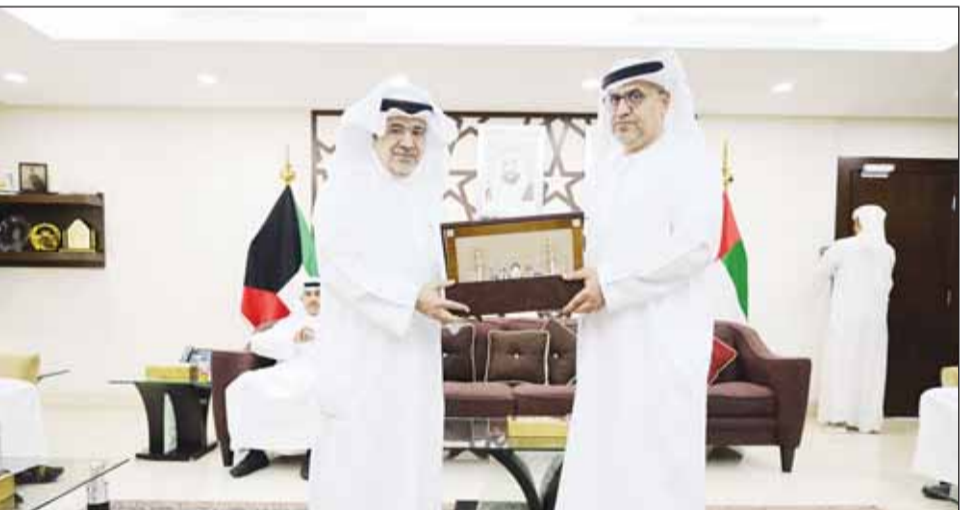
السفير الإماراتي مكرمًا رئيس الاتحاد

الخاص كشريك استراتيجي في خطط التنمية المملّية. ويؤمن الاتحاد بأن القطاع الخاص يلعب دوراً محورياً في قيادة النشاط الاقتصادي، وتشجيع روح المنافسة، وزيادة مستويات الكفاءة الإنتاجية. ويعدّ هذا التكريم بمثابة شهادة على متانة العلاقات الأخوية التي تربط دولة الكويت بدولة الإمارات العربية المتحدة. ويؤكد اتحاد شركات الاستثمار على التزامه بدعم جميع المبادرات التي تسهم في تعزيز هذه العلاقات وتطويرها في مختلف المجالات. ويؤكد اتحاد شركات الاستثمار على أهمية الحوار المستمر والعمل المشترك بين البلدين الشقيقين لتحقيق النمو والتنمية المستدامة في المنطقة. ويؤمن الاتحاد بأن التعاون الاقتصادي بين الكويت والإمارات سيُسهم بشكل كبير في تحقيق التطلعات المشتركة للبلدين وتعزيز مكنتهما على الصعيد العالمي. ويشيد اتحاد شركات الاستثمار بجهود سفارة دولة الإمارات العربية المتحدة في تعزيز العلاقات الاقتصادية بين البلدين.