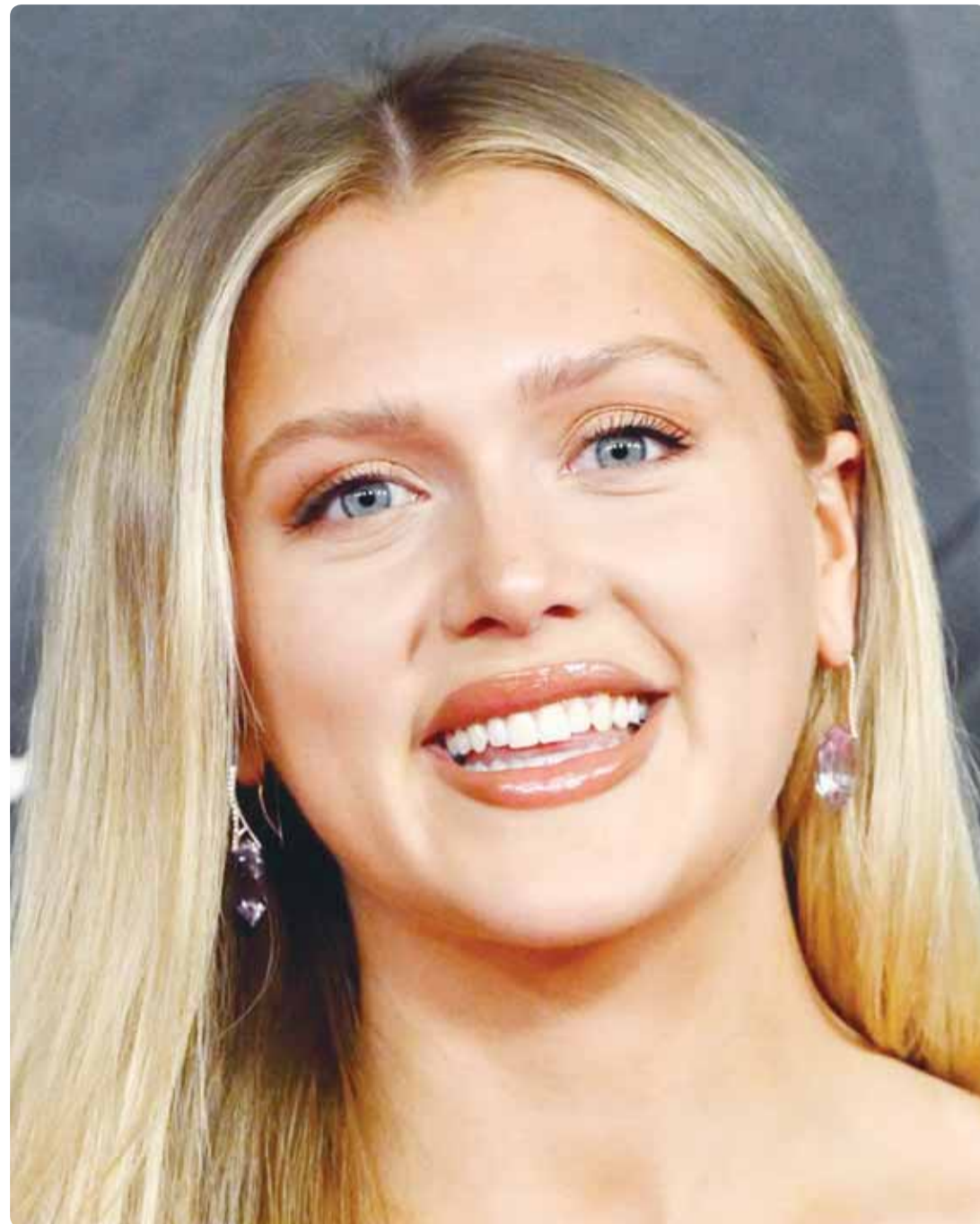
الممثلة الأميركية كلوي مارس خلال حضورها حفل "قوة الحب" في لاس فيغاس

كذلك قال البعض إنه "بذل أن يتجول هذا الأسد في الغاية أو في محمية مع رفقات دريه من اللوات... مراهقون يتجولون معه وسط منطقة الجادرية ببغداد، دون حساب ولا اعتبار"، في حين وصف آخرون المشهد بالـ "مهزلة". يذكر أن القانون في العراق يمنع اقتناء الحيوانات المفترسة، ويعاقب بالحبس ثلاث سنوات مع غرامة ثلاثة ملايين دينار كل من يقتني حيوانا مفترسا ويتركه يتجول في الشوارع، والأماكن العامة.