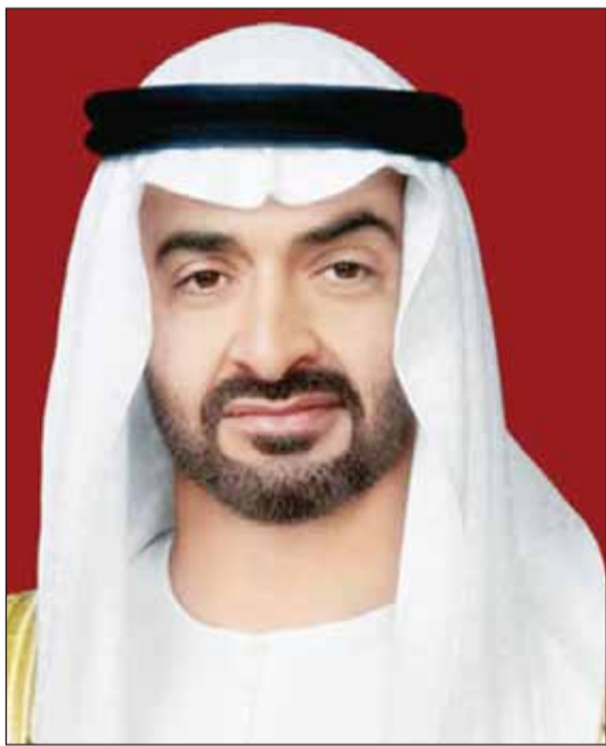
رئيس الإمارات الشيخ محمد بن زايد

نقف إلى جانب الكويت في الإجراءات والقرارات كافة التي اتخذتموها