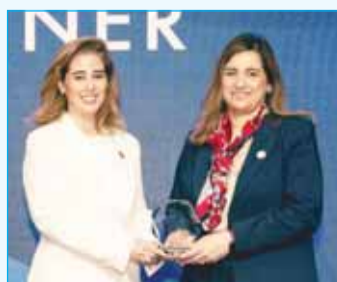
"الخليج" الأفضل في تنفيذ مبادرات "التنوع والشمولية" و"تمكين المرأة" 12