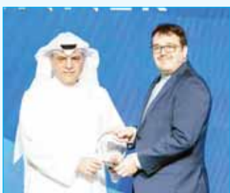
"ميد" تمنح عادل الماجد جائزة "أفضل رئيس تنفيذي" في المنطقة 13