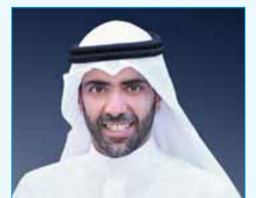
"أولاد علي الغانم للسيارات" تحقق 6,3 مليون دينار أرباحاً في الربع الأول 09