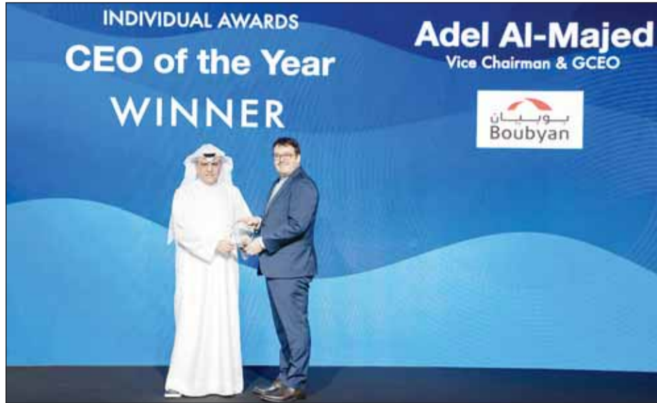
الماجد خلال تسلم الجائزة

إفريقيا "MENA Islamic Banker of the year" لعام 2022 من مجلة ميد، وجائزة "المساهمة المميزة في التمويل الإسلامي" Outstanding Contribution to Islamic Finance، لعام 2021 من مجلة غلوبل فاينانس العالمية تقديراً لجهوده في القطاع الاقتصادي الهيو، وتحديداً منذ وصوله إلى منصبه القيادي في بنك بوبيان في العام 2009. وجائزة الشخصية المصرفية العربية لعام 2021 من قبل اتحاد المصارف العربية، ليكون بذلك أول مصرفي كويتي يتم اختياره للتكريم الذي يعتبر الأعلى الذي يمنحه الاتحاد لأصحاب الإنجازات المتميزة في القطاعين المالي والمصرفي العرب.