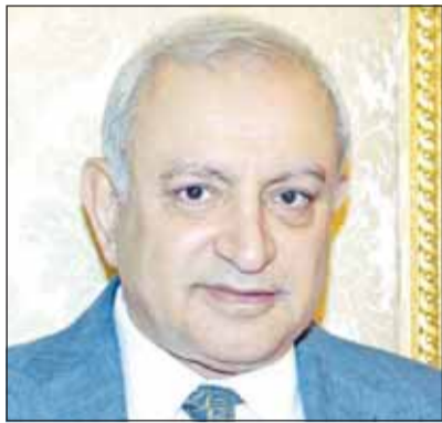
د. بدر العيسى

□ العيسى: سموه اتخذ القرار الصعب بعد استفاد المحاولات التوجيهية لإخماد الحريق