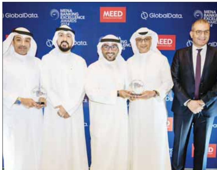
ممثلو البنك خلال استلام الجوائز

وتماشياً مع التزامه برضا الموظفين ونموهم، يواصل البنك الأهلي الكويتي إعطاء الأولوية للأنشطة الداخلية والمبادرات وفرص التدريب لرعاية وتطوير موظفيه. ويؤمن البنك بشكل راسخ بأن الاستثمار في الموظفين يعد أمراً أساسياً لتحقيق النجاح والنمو المستمر. ويظل البنك الأهلي الكويتي ملتزماً بتوفير بيئة عمل تعزز نمو الموظفين وتطويرهم وتسهم بتقدمهم الوظيفي. ومن خلال فرص التعلم والتطوير المستمر يضمن البنك تزويد موظفيه بالمهارات والمعرفة اللازمة للتفوق في أدوارهم والمساهمة في نجاحه المستمر.