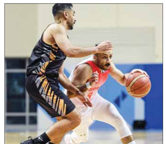
الكويت نجح فيه تحقيق أول فوز على القادسية

في المقابل، يأمل الفحيحيل خامس الترتيب (27 نقطة)، أن يتمكن من استعادة طريق الانتصارات، بعد أن فقدتها في الجولات الثلاث