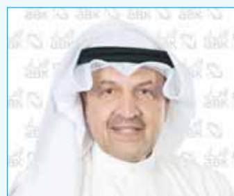
"الأهلي" أفضل بنك بحماية العملاء في الكويت... والأفضل بالتجزئة في مصر 11