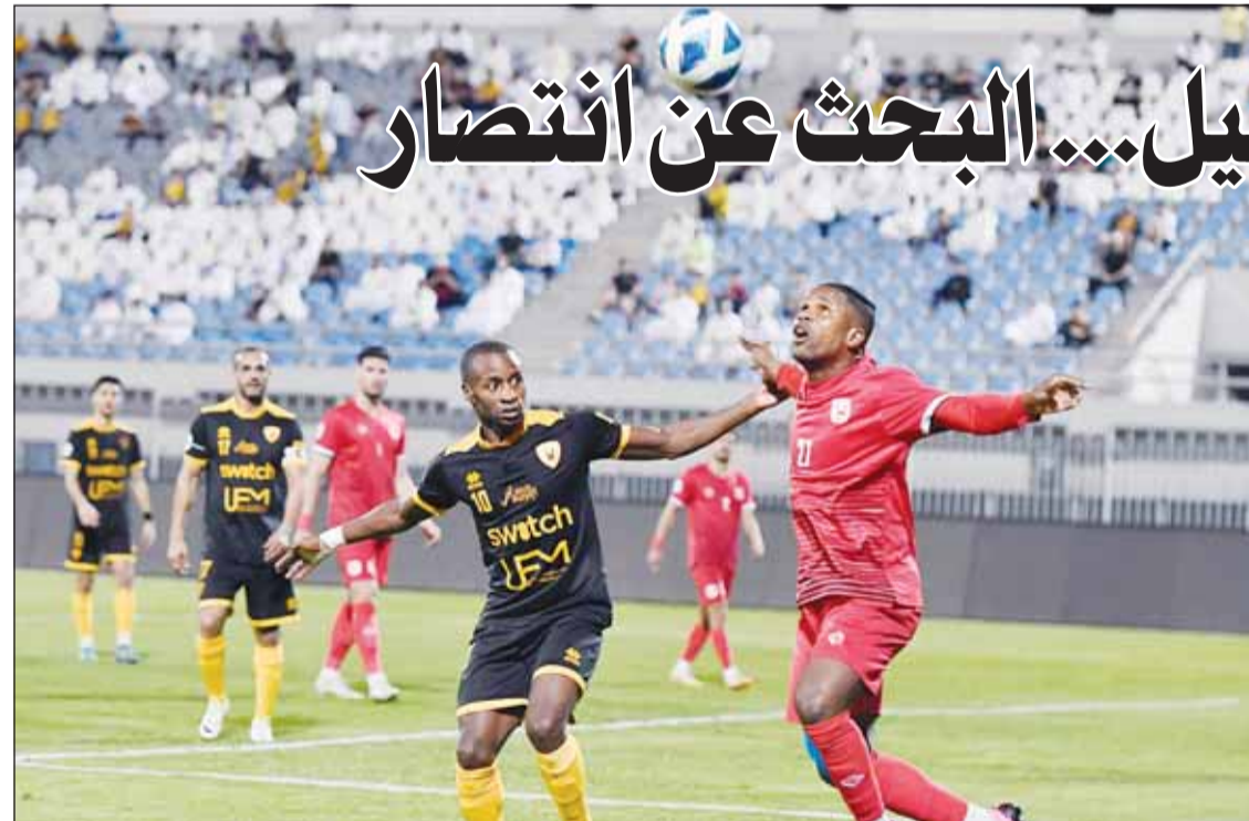
القادسية والفحيحيل يسعيان إلى استعادة نغمة الفوز