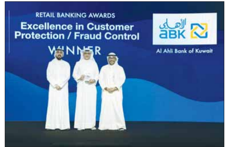
الاحتفال بلقب أفضل بنك بحماية العملاء ومكافحة الاحتيايل في الكويت