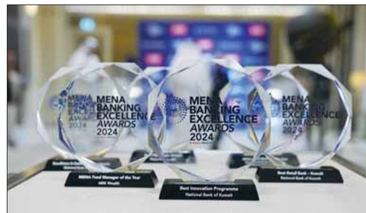
بنك الكويت الوطني يحصد 6 جوائز مرموقة للتميز المصرفي

المصرفية الشخصية في تحقيق تلك الإنجازات، وتقديم تجربة مصرفية رقمية وشاملة لا تلبى احتياجات العملاء فقط، بل تتفوق توقعاتهم. وتعترف هذه الجائزة بالقيادة الاستثنائية والتفاني في تقديم أفضل الخدمات المصرفية إضافة إلى العمل باستمرار على وضع أهداف طموحة وتنفيذ استراتيجيات مبتكرة لم يكن لها تأثير كبير على عملاء بنك الكويت الوطني فحسب، بل على المشهد المصرفي الكويتي والإقليمي كما تسلط الضوء على التأثير طويل الأمد لمساهمات العثمان كمثال لقادة القطاع