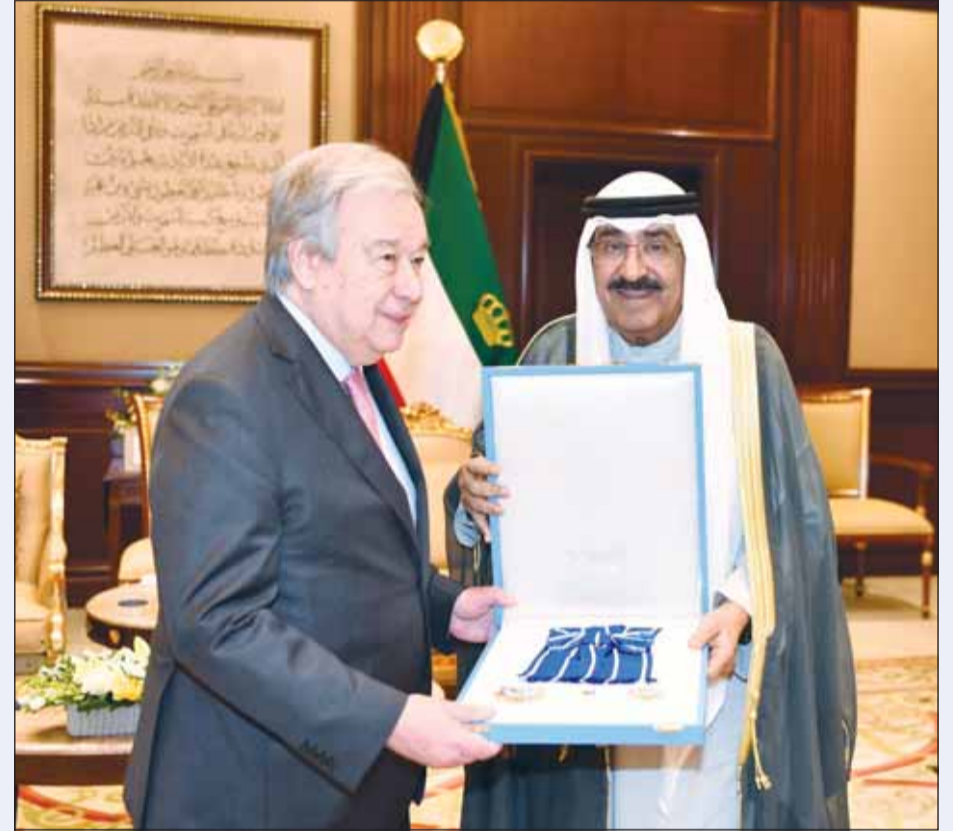
سمو أمير البلاد الشيخ مشعل الأحمد يمنح الأمين العام للأمم المتحدة أنطونيو غوتيريش وسام الكويت ذا الوشاح