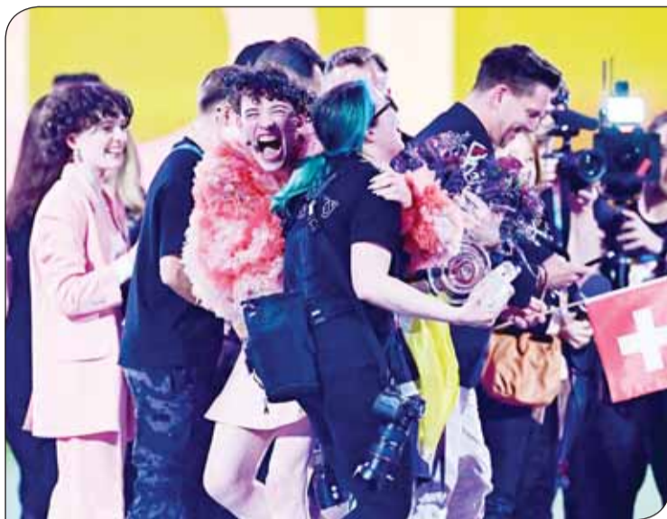
احتفال الفوز بلقب "يوروبينج" 2024

ولاحظ الخبير في "يوروبينج" أندراس أونيفورس أن عدداً من الأغنيات هذه السنة يتناول الصحة النفسية، "إذ يقول كثر من الفنانين الشباب إنهم ليسوا على ما يرام خصوصاً في ما يتعلق بهويتهم كما هي حال السويسري نيمو".