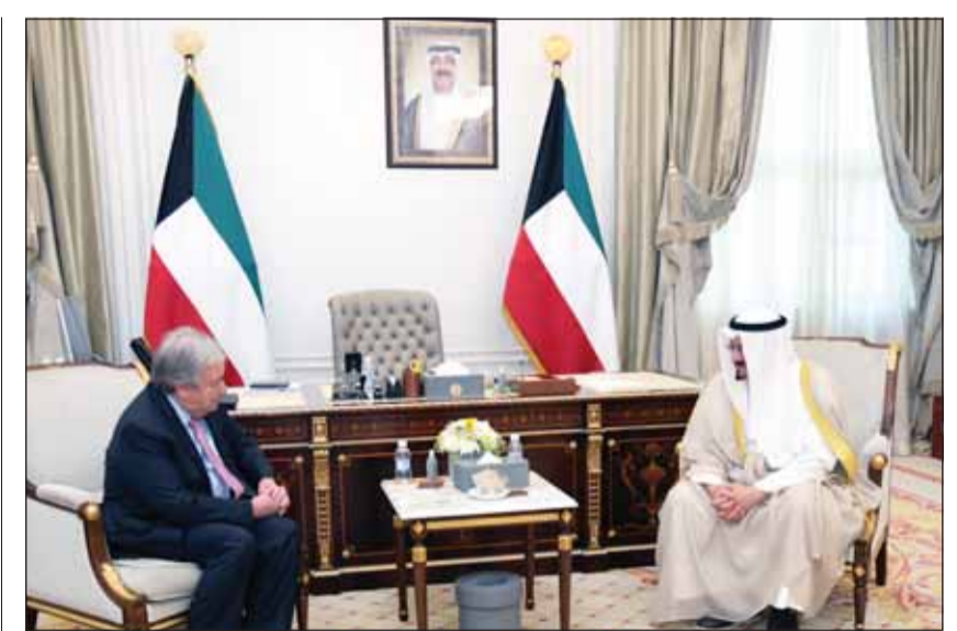
الشيخ أحمد العبدالله وغوتيريش خلال المباحثات

والإيواء، والصحة، والتعليم، والتمكين الاقتصادي. وأوصى المشاركون بإطلاق نداء إنساني عاجل ومناشدة لجميع قادة الدول والحكومات، وقيادات الهيئات والمؤسسات الدينية، وروساء المنظمات الدولية على مستوى العالم، للدخول العاجل من أجل وقف الكارثة الإنسانية المستمرة في قطاع غزة. كما طالبوا أطراف النزاع بإحترام القانون الدولي الإنساني، والالتزام بحماية المدنيين والعاملين في الميدان الإغاثية،