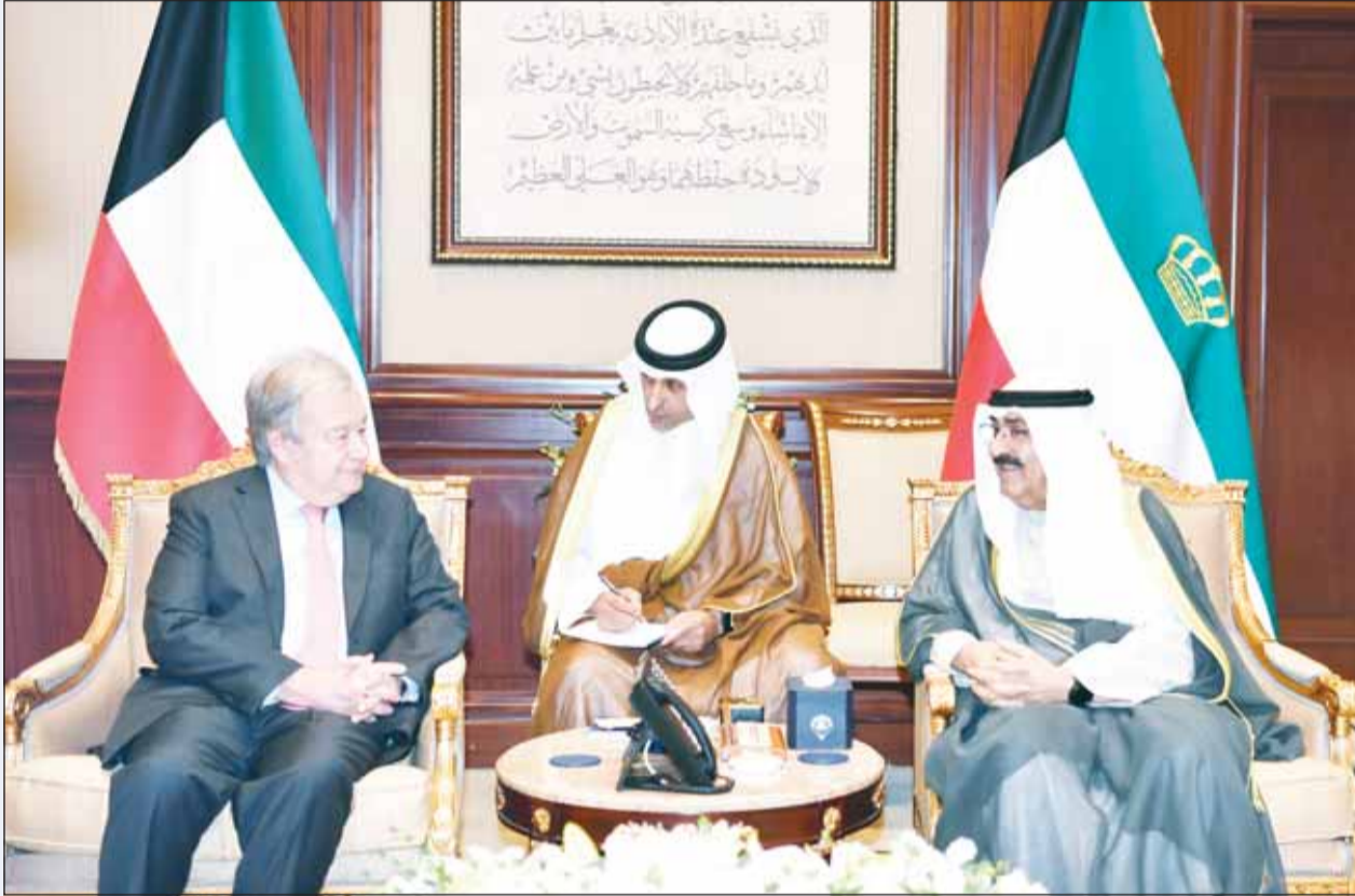
سمو الأمير لدمه استقبله الأمين العام للأمم المتحدة أنطونيو غوتيريش