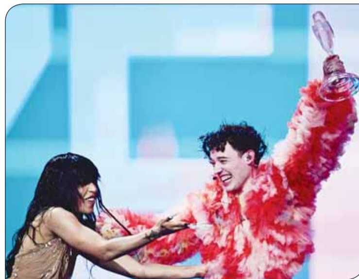
تتويج السويسري نيمو

بينما أطلق حزب سومار اليساري الإسباني المتطرف الذي تعدّ رئيسه يولاندا دياز