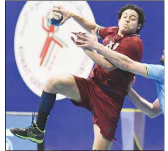
العنابي لم يتأهل للممتاز

وأقيم دوري اليد للموسم الحالي 2023-2024 بنظام جديد بعد انسحاب الجبراء والشباب، ما حدا باتحاد اللعبة لإقامة الدوري بنظام "الدمج" وبمشاركة 14 نادياً، وبعد ختام الجولة الأخيرة، تتأهل الفرق الست الأوائل للعب في الدوري "الممتاز" والذي سيقيم بنظام "الذهاب والإياب" على أن تشارك الأندية الست بنقاطها التي