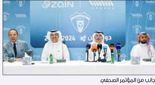
جانب من المؤتمر الصحفي