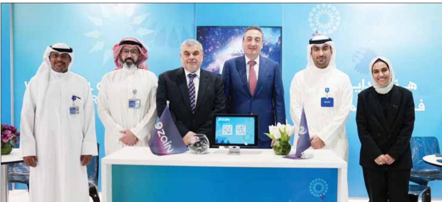
رئيس الجامعة د. جورج بيشوشيه مع فريق زين للموارد البشرية

الشركة من القطاعات الهامة التي تلعب دوراً جوهرياً في الدفع بعجلة الاقتصاد الوطني. ورعت زين مؤخرًا معرض الفرص الوظيفية العاشر لجامعة AUM بتنظيم مركز التطوير الوظيفي (توطين)، وهو إحدى أكبر وإبرز المعارض الوظيفية في البلاد، وشهد هذا العام مشاركة أكثر من 50 جهة محلية وعالمية لتوفير فرصها الوظيفية على خريجي الجامعة والباحثين عن العمل.