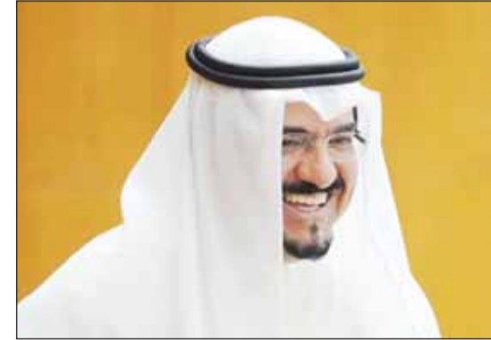
رئيس الوزراء الشيخ أحمد عبدالله

أبصرت حكومة الشيخ أحمد عبدالله النور، مساء أمس، إذ أصدر سمو أمير البلاد الشيخ مشعل الأحمد مرسوماً أميرياً بتشكيل الوزارة الجديدة برئاسة الشيخ أحمد عبدالله الأحمد الصباح وتضم 13 وزيراً، وضم التشكيل الجديد عودة 9 وزراء من الحكومة السابقة مع تغيير في بعض المقائب، وهم: الشيخ فهد اليوسف نائباً أول لرئيس مجلس الوزراء ووزيراً للدفاع ووزيراً للداخلية، وشريفة المعوشري نائباً لرئيس مجلس الوزراء ووزيراً دولة لشؤون مجلس الوزراء، والدكتور عماد العتيبي نائباً لرئيس مجلس الوزراء ووزيراً للنظف،