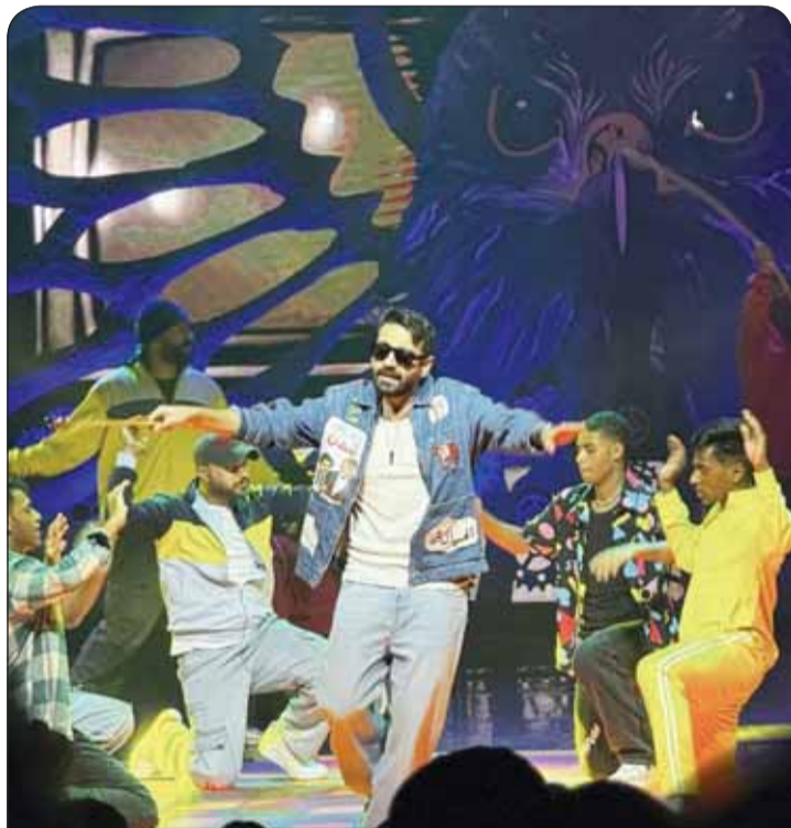
مشهد استعراضى من المسرحية