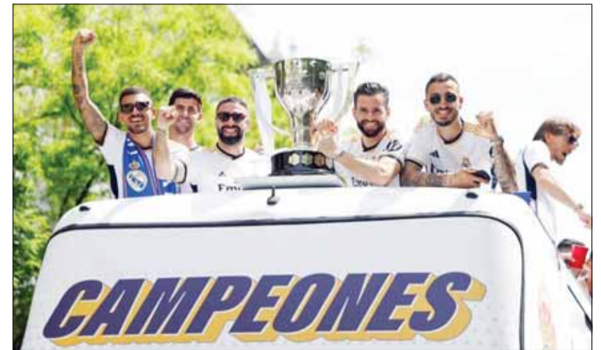
نجوم الميرينغية يحتفلون بكأس الدوري الإسباني

واقطب الألماني توني كروس نجم وسط الريال الجماهير، قائلاً: "واثق من أننا سنعود إلى هنا في غضون ثلاثة أسابيع. واحتشد الآلاف من المشجعين لاستقبال حافلة الفريق التي طافت أرجاء العاصمة قبل توجهها إلى مكان الاحتفال التقليدي للنادي في ميدان سيبيليس.