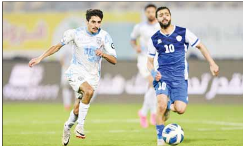
الفرصة الأخيرة للجبراء أمام الشباب اليوم