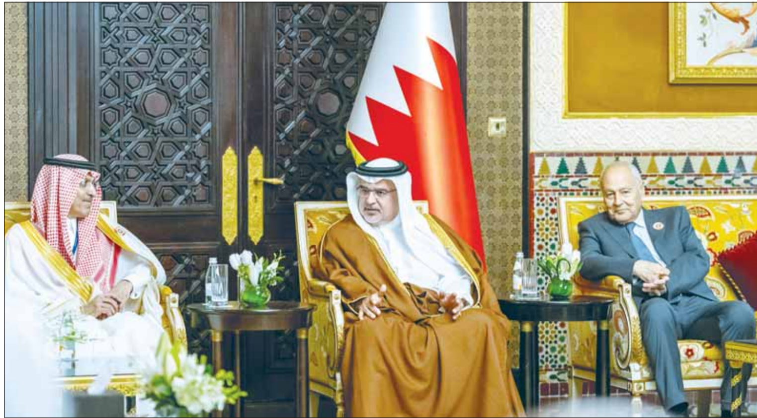
واي العهد البحريني الأمير سلمان بن حمد مستقبلاً الأمين العام للجامعة العربية أحمد أبو الغيط ورؤساء الوفود المشاركة في الاجتماعات التحضيرية للقمة العربية

المنامة، عواصم - وكالات، دعا وزير الاقتصاد البحريني الأمير سلمان بن خليفة إلى ضرورة التدخل الفوري لإيصال المساعدات إلى قطاع غزة ومنع توسع العمليات العسكرية وتداعياتها على أرواح المدنيين للحفاظ على الأمن الإقليمي، مؤكداً في كلمته الترحيبية أمام اجتماع المجلس الاقتصادي والاجتماعي على المستوى الوزاري التحضيري لمجلس جامعة الدول العربية على مستوى القمة في المنامة أمس، أهمية العمل مع الدول العربية ومع شركائنا من الهيئات المالية الدولية والمنظمات المتخصصة للتغلب على الوضع الإنساني المتفاقم في فلسطين، ودعم السلام العادل والدائم والشامل في منطقة الشرق الأوسط بمصالح الشعب الفلسطيني على حقوقه المشروعة. وشدد الوزير على أن التحديات العالمية الراهنة تستدعي تضافر الجهود المشتركة لتعزيز التكامل الاقتصادي والاجتماعي في المنطقة، من خلال دعم مشاريع البنية التحتية والنقل والطاقة والأمن الغذائي والتي تعزز من قدرتنا الاقتصادية وتسهم في رفع مستوى التكامل العربي، قائلًا إن استضافة المملكة للاجتماع، تأتي تأكيداً على ما يوليه الملك حمد بن عيسى من دعم ورعاية للعمل العربي المشترك، ولكن ما من شأنه أن يعزز التضامن العربي. ونظراً لاتخاذ القمة وسط ظروف دقيقة ورجية في ظل ازدياد حدة التحديات السياسية والاقتصادية والاجتماعية والتغيرات المناخية لاسيما مع تزايد شدة النزاعات والحروب الراهنة التي أثرت بشكل كبير على الاقتصاد العالمي وأصبحت تهدد حاضر ومستقبل الشعوب العربية، فإن الأمر يحتم ضرورة التكاتف الدولي العربية حول بعضها لاتخاذ قرارات