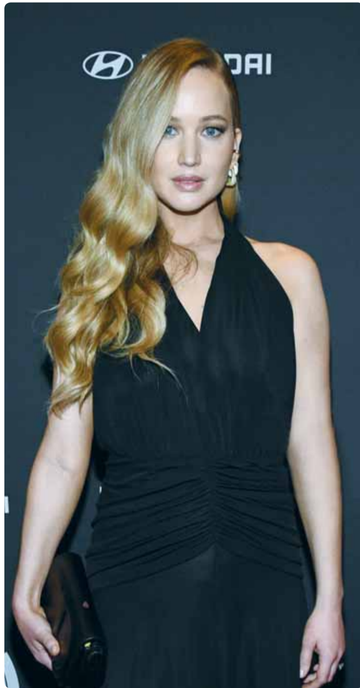
الممثلة الأميركية جينيفر لورانس خلال حضورها حفل توزيع جوائز "GLAAD Media" في نيويورك

وهذا ما زاد من اهمية الخطاب، وجعله مهماً جداً، حتى ان الناس انتبهوا لكل كلمة وردت فيه، وأعدوا الاستماع اليه اكثر من مرة، رغم أنه أذيع في يوم عطلة رسمية، والقرارات المهمة غالباً ما تتخذ بأيام العمل الرسمي، إلا ان الحكم لا يعرف الرامة... زين.