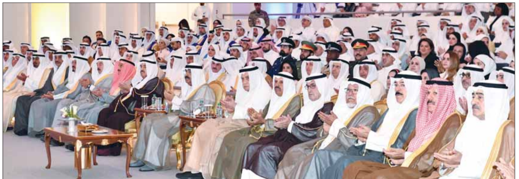
سمو أمير البلاد وكبار الشيوخ والمسؤولين في مقدمة الحضور

برعاية وحضور سمو أمير البلاد الشيخ مشعل الأحمد، أقيم صباح أمس حفل افتتاح مدينة صباح السالم الجامعية وتكريم أوائل الخريجين المتفوقين من حملة الإجازة الجامعية والدراسات العليا للأعوام الجامعية 2018/2019 - 2019/2020 - 2020/2021 في جامعة الكويت، وذلك على مسرح الدانة بمدينة صباح السالم الجامعية.