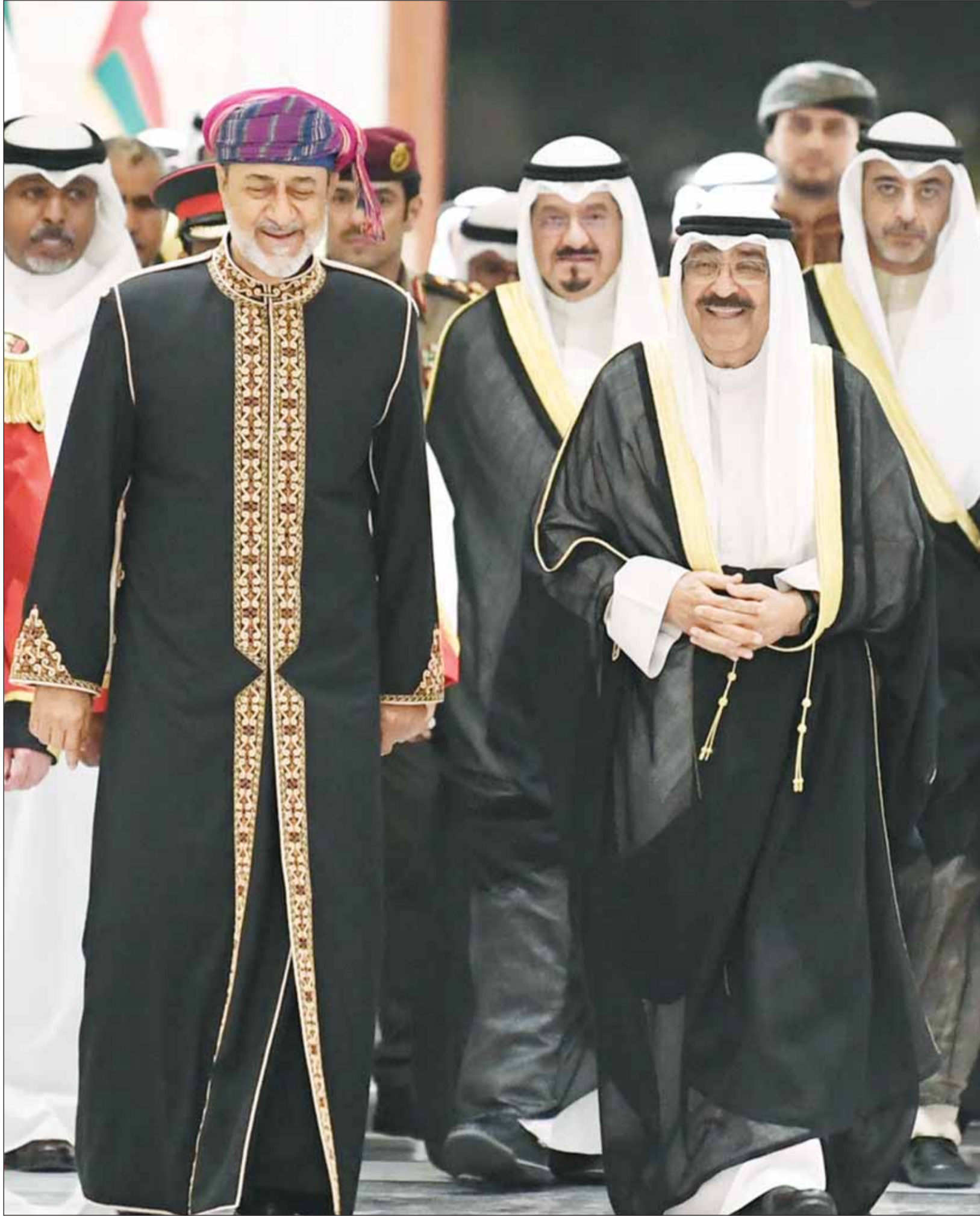
سمو الأمير الشيخ مشعل الأحمد والسلطان هيثم بن طارق قبيل جلسة المباحثات