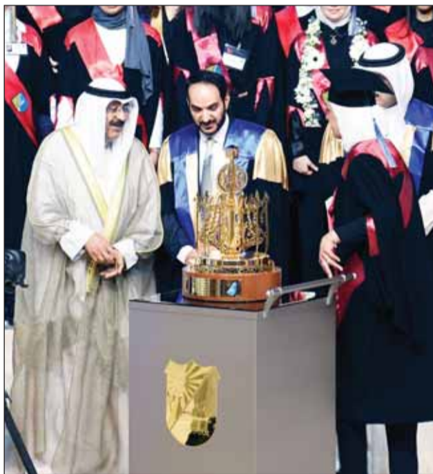
سمو أمير البلاد يتسلم هدية تذكارية