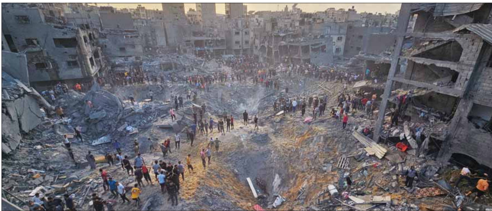
فلسطينيون يبحثون عن ضحايا وسط حفرة عميقة بعد غارات جوية إسرائيلية عنيفة على مخيم جناباليا للاجئين في شمال قطاع غزة

حمية: وضعنا حداً لعربدة العدو... و"حزب الله" يستهدف بركة ريشا وتكنة يفتاح