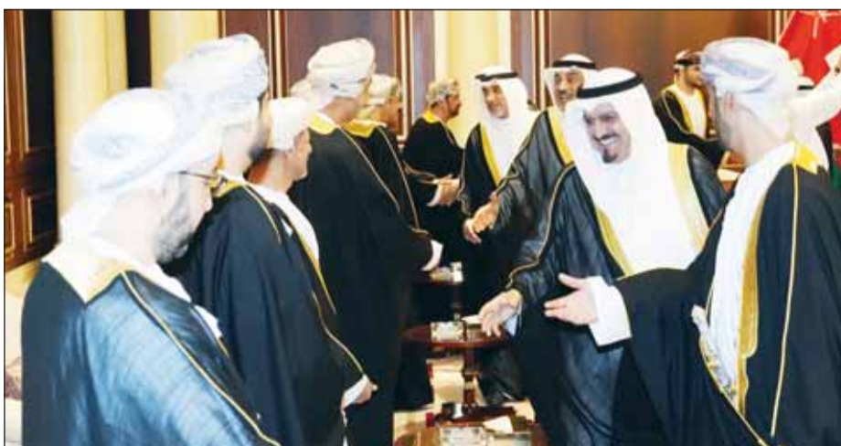
الشيخ أحمد عبدالله و سمو الشيخ صباح الخالد والشيخ فهد اليوسف يرحبون بالوفد العماني

عقدت، في قصر بيان، مساء أمس، جلسة المباحثات الرسمية بين الكويت وسلطنة عمان، ترأس فيها سمو أمير البلاد الشيخ مشعل الأحمد الجانب الكويتي، فيما ترأس سلطان عمان هيثم بن طارق الجانب العماني، ومضور رئيس مجلس الوزراء الشيخ أحمد عبدالله وعدد من كبار المسؤولين في البلدين.