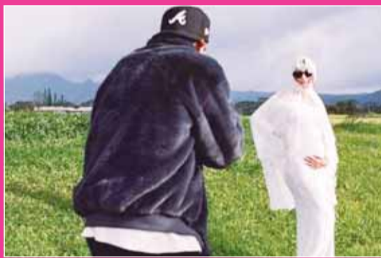
بيبير يوثق بكاميرته حمل زوجته هايلى

يذكر أن بيبير، أثار قلق متابعيه، أخيراً لمواجهته صعوبات نفسية، وبذلت زوجته هايلى، جهدا كبيرا في دعمه وموازنته، وأيدى جمهور بيبير، قلقا واستغفر عن سبب بقاء جاستن في الصور "السيلفي"، التي شاركها عبر حساباته، خصوصا أنه لم يذكر سببا لدموعه الغزيرة، ثم تجاوز بيبير، حالة الحزن والبكاء بقضاء عطلة سريعة مع زوجته في هاواي، وتم تصوير الزوجين من قبل بعض المعجبين، حيث التقطوا صورا لهما جالسين معا في مطعم، وبدأ واضحا أن جاستن اجتاز مرحلة الاكتئاب مع ظهور الإبتسامة على وجهه، وأظهرت الصور اقتراب المعجبات منهن. يذكر أنه في وقت سابق، كشف بيبير، عن تعاطيه المخدرات وأنه أصبح سيئا للغاية لدرجة أن الأمر فرج عن نطاق السيطرة، بعدما كان يعتمد بشكل كامل على المشيش قبل أن يتقل إلى العقاقير، وغيرها، لكن بعد فترة من إدراك مدى سوء إدمانه، قرر بيبير أن يتغير ويخضع للعلاج من الإدمان.