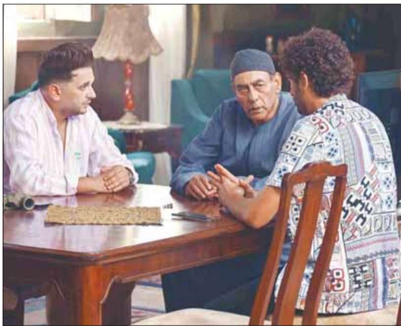
أحمد بدير في مشهد من مسلسل الرعب الكوميدي

من أعمال شاهد الأصلية، يُعرض الموسم الثاني من مسلسل "البيت بيتي" حاليا على "شاهد".