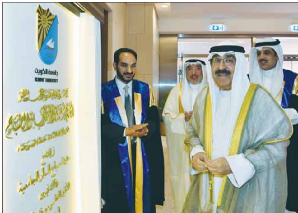
صاحب السمو خلال إزاحة الستارة عن اللوحة التذكارية لافتتاح مدينة صباح السالم الجامعية