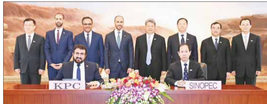
صورة جماعية للجانين بعد توقيع الاتفاقية

العالمي في المحافظة على العلاقات التجارية وتنميتها مع كبار عملائها. وتجدر الإشارة إلى أن الصين تستورد 29٪ من إجمالي صادرات النفط الخام الكويتي، مما يضعها في المرتبة الأولى للوجهات المستوردة للنفط الكويتية. العام 2025.