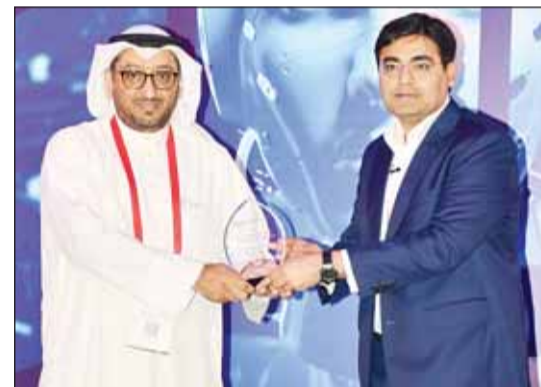
د.عمار الحسيني خلال تكريمه أحد ممثلي الجهات المشاركة

أعلن المدير العام للجهاز المركزي لتكنولوجيا المعلومات بالتكليف الدكتور عمار الحسيني أن الجهاز يكثف على إعداد استراتيجية وطنية للذكاء الاصطناعي في أجهزة الدولة.