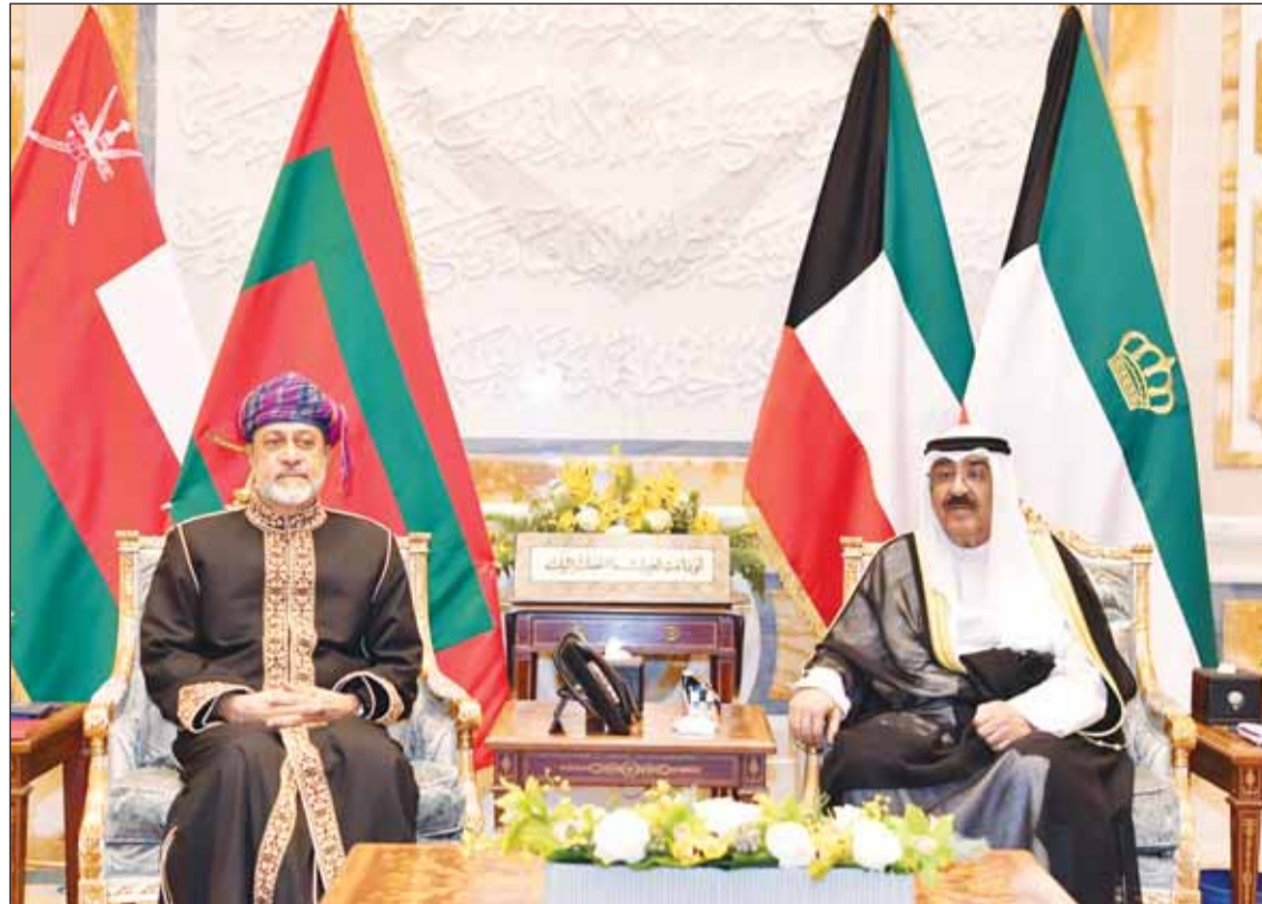
سمو أمير البلاد الشيخ مشعل الأحمد و سلطان عمان هيثم بن طارق يتراسان جلسة المباحثات