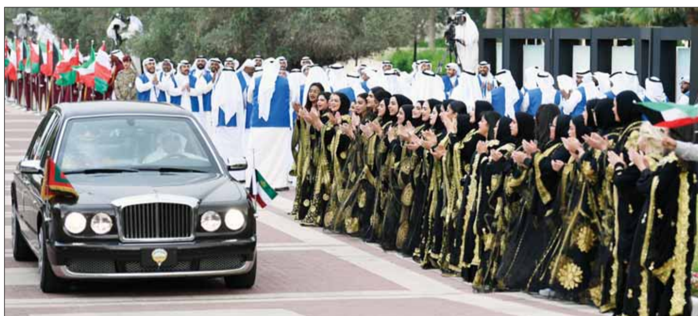
جانب من الاستقبال الحافل للموكب الذي يقبل سمو الأمير و سلطان عمان إلى قصر الضيافة

المباحثات تناولت توسيع أطر التعاون بين البلدين بما يخدم مصالحهما المشتركة