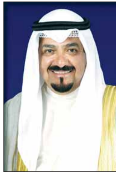
الشيخ أحمد العبدالله

بعث رئيس مجلس الوزراء الشيخ أحمد العبدالله ببرقية تهنئة الى سمو الشيخ محمد بن زايد آل نهيان رئيس دولة الإمارات العربية المتحدة الشقيقة بمناسبة الذكرى الثانية لتولي سموه مقاليد الحكم.