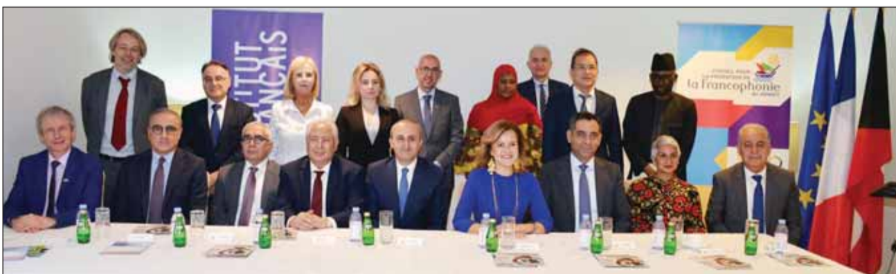
لقطة جماعية لسفراء الفرانكفونية

ولفت إلى أن الحضارة الغربية بعد الحرب العالمية الثانية نجحت في أن تصنع منظومة قيمية رافعة، تمكنت من خلالها من إيجاد نظام عالمي يحفظ السلم الدولي، وجنب البشرية حروباً كانت وشيكة بين المعسكر الرأسمالي والمعسكر الشيوعي، في وقت كان سياق التسلسل والتنافس على اقتناء أسلحة الدمار الشامل على أشدهما، ونجح هذا النظام في وقف كل التوترات بين الدول النووية خلال منتصف القرن الماضي. ورحب سموه بالناطقين بالفرانكفونية والمحبين لها، مقدماً الشكر والتقدير لكل من ساهم في تنظيم الأمسية، للحفاظ على الوتيرة السنوية للاحتفال باليوم العالمي للفرانكفونية بالكويت، مضيفاً، إنها مناسبة نحتفل بها كل عام منذ العقد الماضي، وملتقي بلغيف من أعضاء السلك الدبلوماسية والسياسيين والأدباء والفنانين ورجال الإعلام.