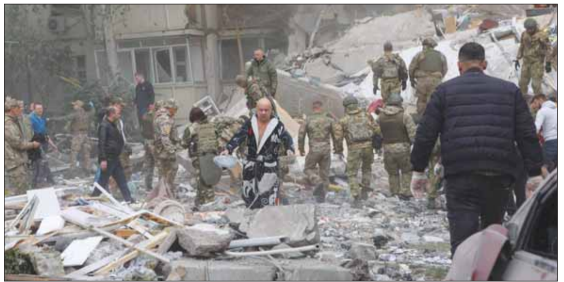
آثار التدمير فيه أحد المواقع بأوكرانيا

■ موسكو، عواصم - وكالات، أكد وزير الخارجية الروسي سيرغي لافروف أنه إذا كان الغرب يريد القتال لصالح أوكرانيا في ساحة المعركة فإن روسيا مستعدة لذلك، قائلا "إذا أرادوا أن تكون المواجهة في ساحة المعركة، فستكون في ساحة المعركة". وفي جلسة برلمانية عن إعادة ترشيحه للمنصب في حكومة جديدة يجري تشكيلها بعد أن بدأ بوتين هذا الشهر فترة رئاسية جديدة مدتها ست سنوات، انتقد لافروف محادثات سترجي الشهر المقبل في سويسرا بشأن السلام في أوكرانيا دون مشاركة روسيا، مشيها الموقف بتوبيخ تلميذ يقر مصيره المعلوم من كونها خارج الغرفة، قائلا "لا يمكنك التحدث مع أي أحد بهذه الطريقة، وخاصة معنا"، مضيفاً "الموتير يتلخص هدفه في تكرار توجيه إندار لروسيا".