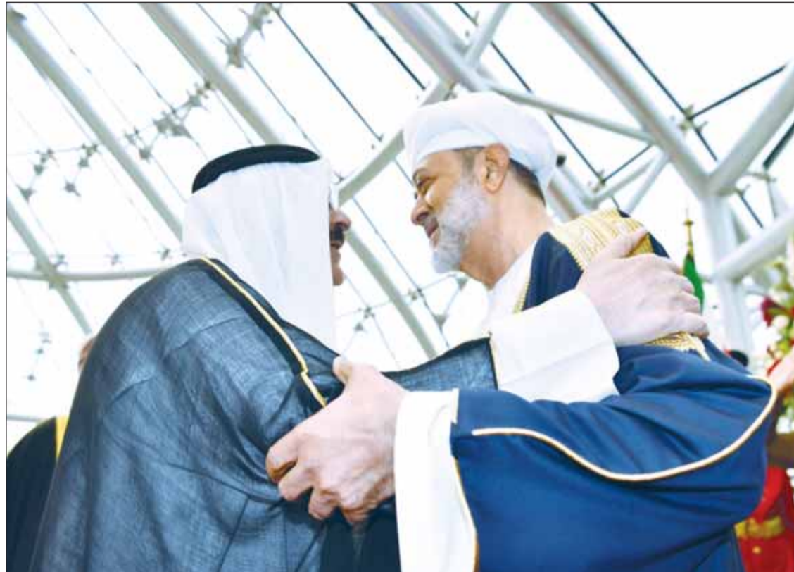
سمو الأمير الشيخ مشعل الأحمد مرحباً بالسلطان هيثم بن طارق

ترأسها سمو الأمير والسلطان هيثم بن طارق تناولت العلاقات الأخوية المتميزة وسبل تعزيزها وتنميتها