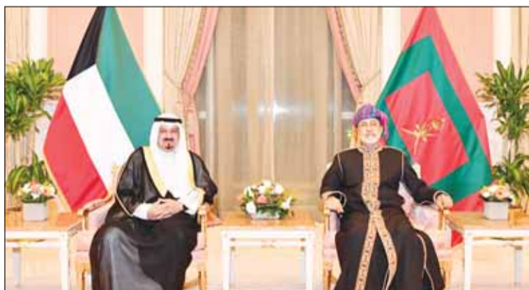
السلطان هيثم بن طارق مستقبلاً رئيس مجلس الوزراء الشيخ أحمد عبدالله

استقبل السلطان هيثم بن طارق المعظم سلطان سلطنة عمان، مساء أمس، الشيخ أحمد عبدالله رئيس مجلس الوزراء، وذلك بمقر إقامة جلالة في قصر بيان.