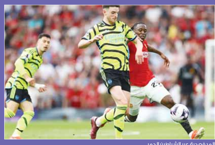
المدفعية عبر الشباطين الحمر

في سياق متصل، قال مدرب أرسنال ميكيل أرتيتا "أنا سعيد حقاً، لأن كل شيء على المحك ولا مجال للأخطاء منذ يناير الماضي، ويعتبر علينا مواصلة الانتصارات. وتابع المدرب الإسباني "لعبنا في ملعب خاص، وتاريخنا به لم يكن يبعث على التفاؤل، لكننا وجدنا طريقة لتحقيق الفوز وهو ما يعكس رغبتنا القوية لتحقيق الانتصار. وأوضح "كنا نعرف جيدا عواقب التعادل، لقد بدأنا بشكل جيد وسجلنا هدفاً، ولكن بعده بدأنا نلعب بحفظ شديد، لم يروق لي ذلك، وعندما حاولنا تغيير الإيقاع وجدنا صعوبة كبيرة في ذلك. وتابع "بحكم خبراتي على مدار 20 عاماً في الدوري الإنجليزي، فإن أي فريق بإمكانه الفوز على منافسه، فهذه البطولة تتسم بالزمامة والاحترام بشكل استثنائي في جميع المباريات.