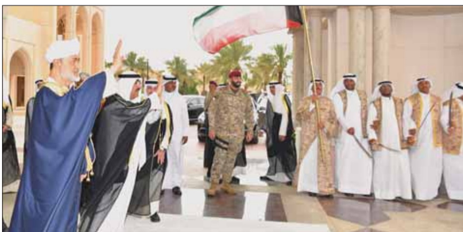
سمو الأمير و سلطان عمان يحييان فرقة العرضة والمستقبلين

يرافق السلطان هيثم بن طارق وفد رسمي يضم كلا من شهاب بن طارق آل سعيد نائب رئيس الوزراء لشؤون الدفاع وبلعرب بن هيثم آل سعيد وفالد بن هلال الجوسعي وزير ديوان البلاط السلطاني والفريق أول سلطان بن محمد النعماني وزير المكتب السلطاني ومحمد بن فيصل الجوسعي وزير الداخلية ويدر بن محمد الجوسعي وزير الخارجية والدكتور حمد بن سعيد العوفي رئيس المكتب الخاص وعبدالسلام بن محمد المرشدي رئيس جهاز الاستثمار العماني وقيس بن محمد اليوسف وزير التجارة والصناعة وترويج الاستثمار.