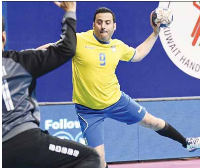
الساحل يطمح لتحقيق فوزه الأول