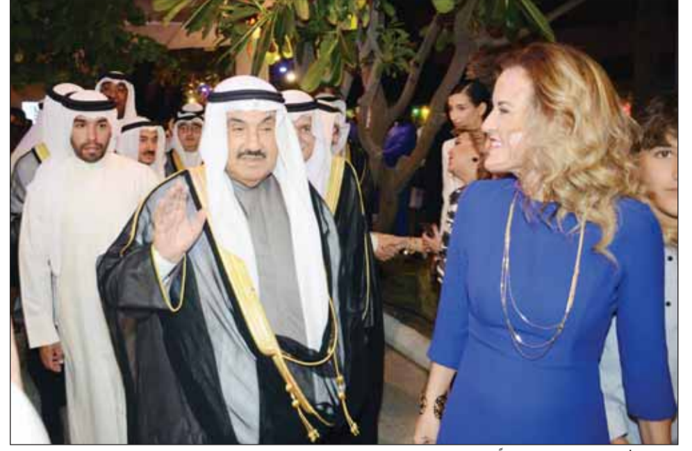
سمو الشيخ ناصر المحمد محبياً الحضور