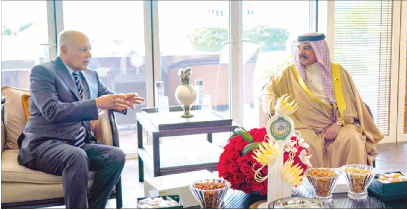
العاهل البحريني الملك حمد بن عيسى مستقبلاً الأمين العام لجامعة الدول العربية أحمد أبو القيط

وأشار زكي إلى أن الاجتماع ناقش عددا من البنود والموضوعات المهمة منها خطة الاستجابة الطارئة للتعامل مع التداعيات الاقتصادية والاجتماعية لعدوان الاحتلال الاسرائيلي على فلسطين ودعوة الدول والمنظمات ووكالات التنمية للمساهمة في تمويل وتنفيذ الخطة، كما رحب المجلس في اجتماعه التحضيري بالخطوات التي تم اتخاذها في سبيل تفعيل اشغال مجلس وزراء الامن السيبراني، وناقش التقدم المحرز في استكمال منطقة التجارة الحرة العربية الكبرى واقامة الاتحاد الجمركي العربي، ودعا الدول الأعضاء إلى دعم انضمام جامعة الدول العربية بصفة مراقب إلى منظمة التجارة العالمية. وقال إن الأمين العام للجامعة العربية أحمد أبو القيط أشار في كلمته أمام الاجتماع الوزاري الاقتصادي والاجتماعي إلى الظروف العصيبة التي تمر بها الأمة العربية، لاسيما العدوان المستمر على فلسطين منذ ما يزيد عن سبعة أشهر وما نتج عنه من تداعيات وخسائر اقتصادية واجتماعية ما يستدعي وجود تحرك سياسي عربي ودولي للتخفيف من معاناة الشعب الفلسطيني، مشيراً إلى أن المجلس تميز بوجود نقاشات مثمرة تهدف إلى تعزيز العمل العربي المشترك وخدمة مصالح الشعوب العربية.