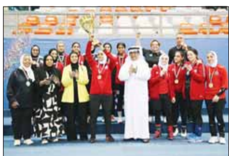
المرزعة يتوج لاعبات سلوى الصباح بالكأس