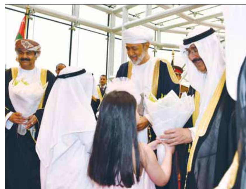
استقبال بالورد لسمو الأمير و سلطان عمان