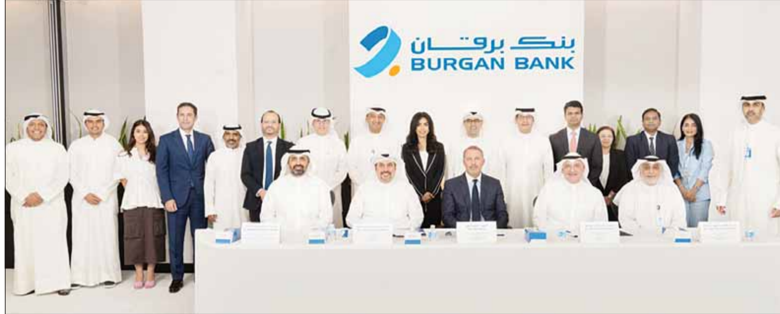
صورة جماعية خلال حفل إطلاق الإصدار

"كامكو إنفست" و"الخليج" لعبا دور مديري الإصدار المشتركين ووكيلي الاكتتاب