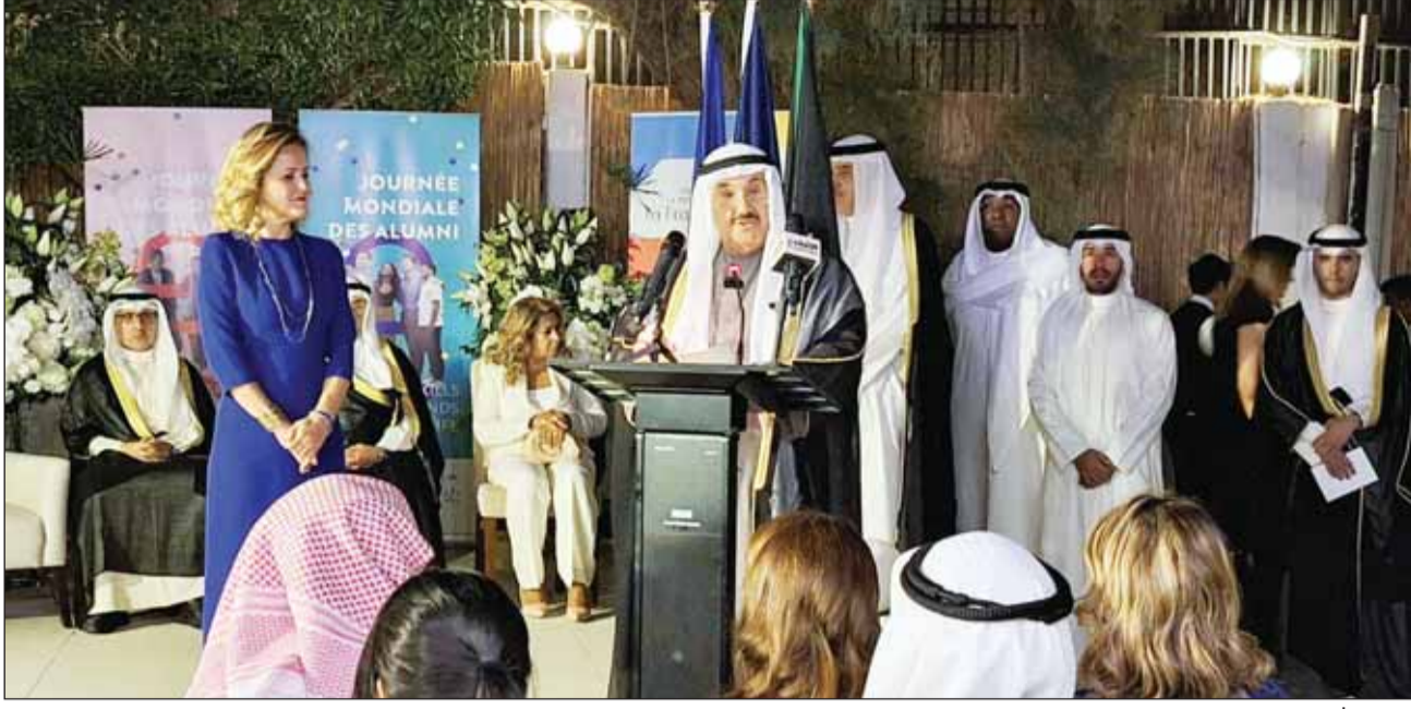
سمو الشيخ ناصر المحمد يلقي كلمته