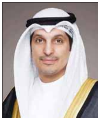
عبد الرحمن المطير

وثنان المفرج، جهود وزير الإعلام والثقافة عبدالرحمن بداح المطيري، وقيادات وزارة الإعلام، ودور كافة