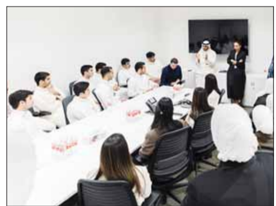
جانب من فعاليات الجولة