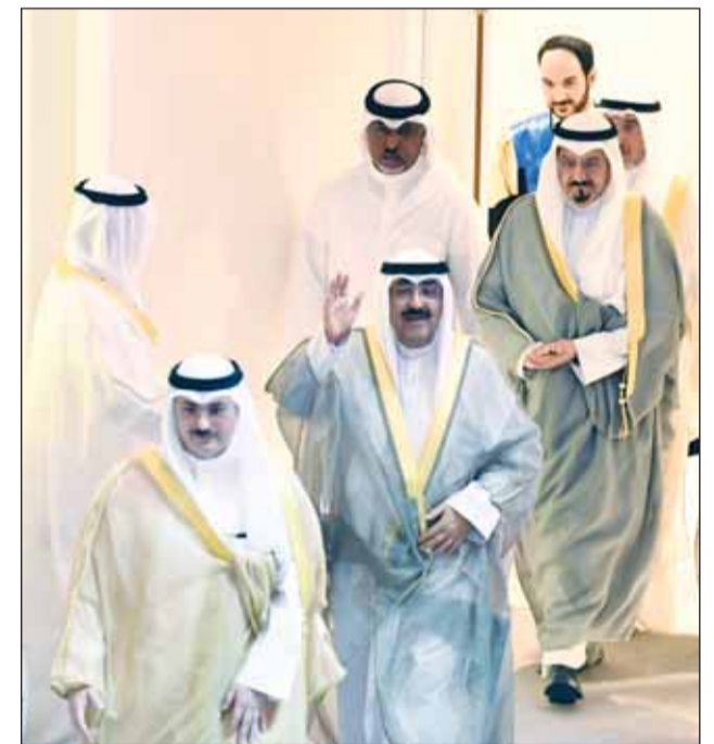
سمو الأمير محيياً الحضور