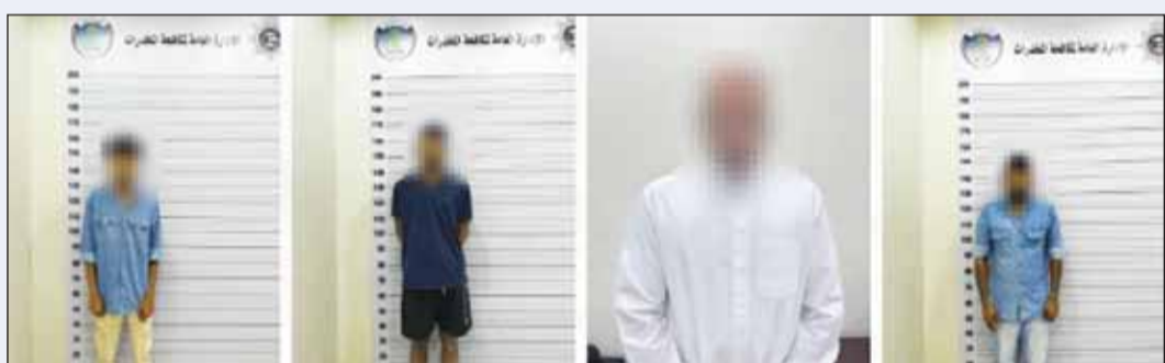
المتشبهون بعد ضبطهم

من الماريغوانا، و50 غراما من مادة الحشيش المخدرة، بالإضافة إلى 21 غرام كوكايين، وست عب زيت الماريغوانا، و27 غراما من الفطر المخدر وسجارتين الكترونييتين من مادة الماريغوانا، وثلاث قطع من ملويات الماريغوانا و10 زجاجات خمرة.