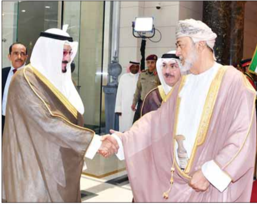
السلطان هيثم بن طارق مصافحاً رئيس الوزراء الشيخ أحمد العبدالله