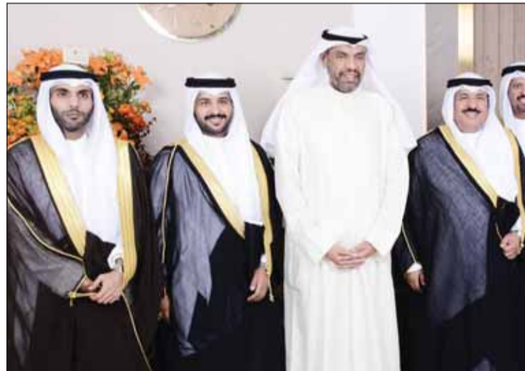
الوزير عبدالله اليحيى مهنتاً