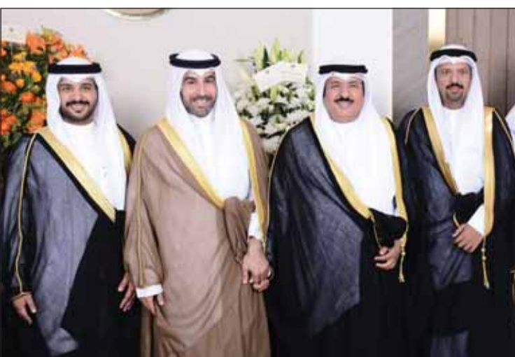
الشيخ صباح أحمد الصباح يبارك