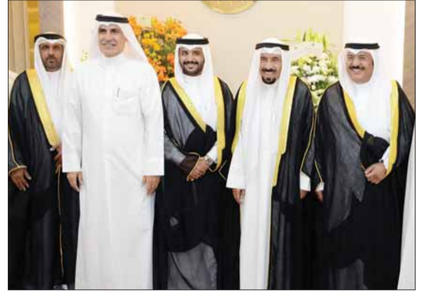
الشيخ علي الجابر قدم التهاني