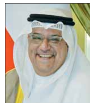
الشيخ حمد سالم الحمود

المنامة - كونا، أكد سفير الكويت لدى مملكة البحرين الشيخ ثامر الجابر أن انعقاد القمة العربية الـ 33 في العاصمة البحرينية المنامة، يأتي في توقيت دقيق وتاريخي. وشدد السفير الصباح في تصريحه إلى كونا، على أهمية انعقاد القمة لتعزيز العمل العربي في مواجهة التحديات الراهنة بما يخدم مصلحة الأمة العربية، مؤكداً أن التعاون والترابط بين الدول العربية خيار ستراتيحي لتحقيق الأمن والسلام والاستقرار والتنمية للشعوب العربية. وقال: إن القمة المقبلة ستحمل في طياتها العديد من القضايا العربية الملحة كالقضية الفلسطينية والأمن