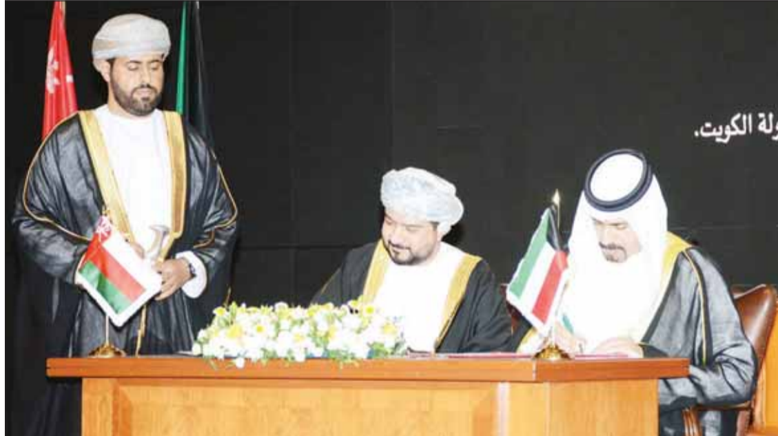
جانب من توقيع مذكرات التفاهم