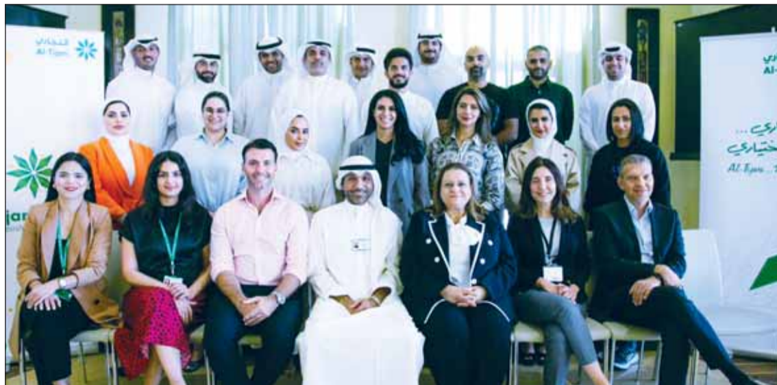
صورة جماعية لعمه هامش فعاليات البرنامج

عالمية مرموقة لعقد برامج تدريبية تواكب استراتيجية البنك ورويته في تنمية أصوله البشرية، ويحرص البنك إلى عقد مثل هذه البرامج المتميزة والمشاركة فيها بغرض تطوير وتنمية مهارات الموظفين والقيادات الواعدة في البنك.