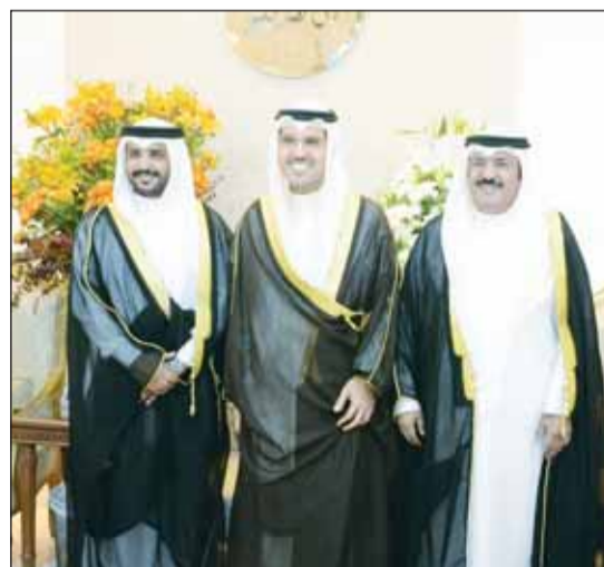
الشيخ صباح ناصر المحمد يبارك