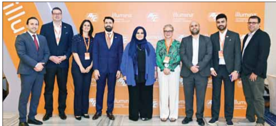
القائمون على المؤتمر

الناشئة في شركة لومينا، أنا كاريرا، "في الماضي، استغرقت عملية تتبع تسلسل الجينوم البشري بأكمله ما يقرب من 10 سنوات، أما اليوم، فياستخدام أحدث تقنياتنا، يمكننا تسلسل 128 جينوما بشرياً خلال 48 ساعة فقط مما يفتح آفاقاً لعقبة جديدة لفهم الأمراض الوراثية".