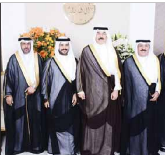
تهنئة من الشيخ محمد الخالد