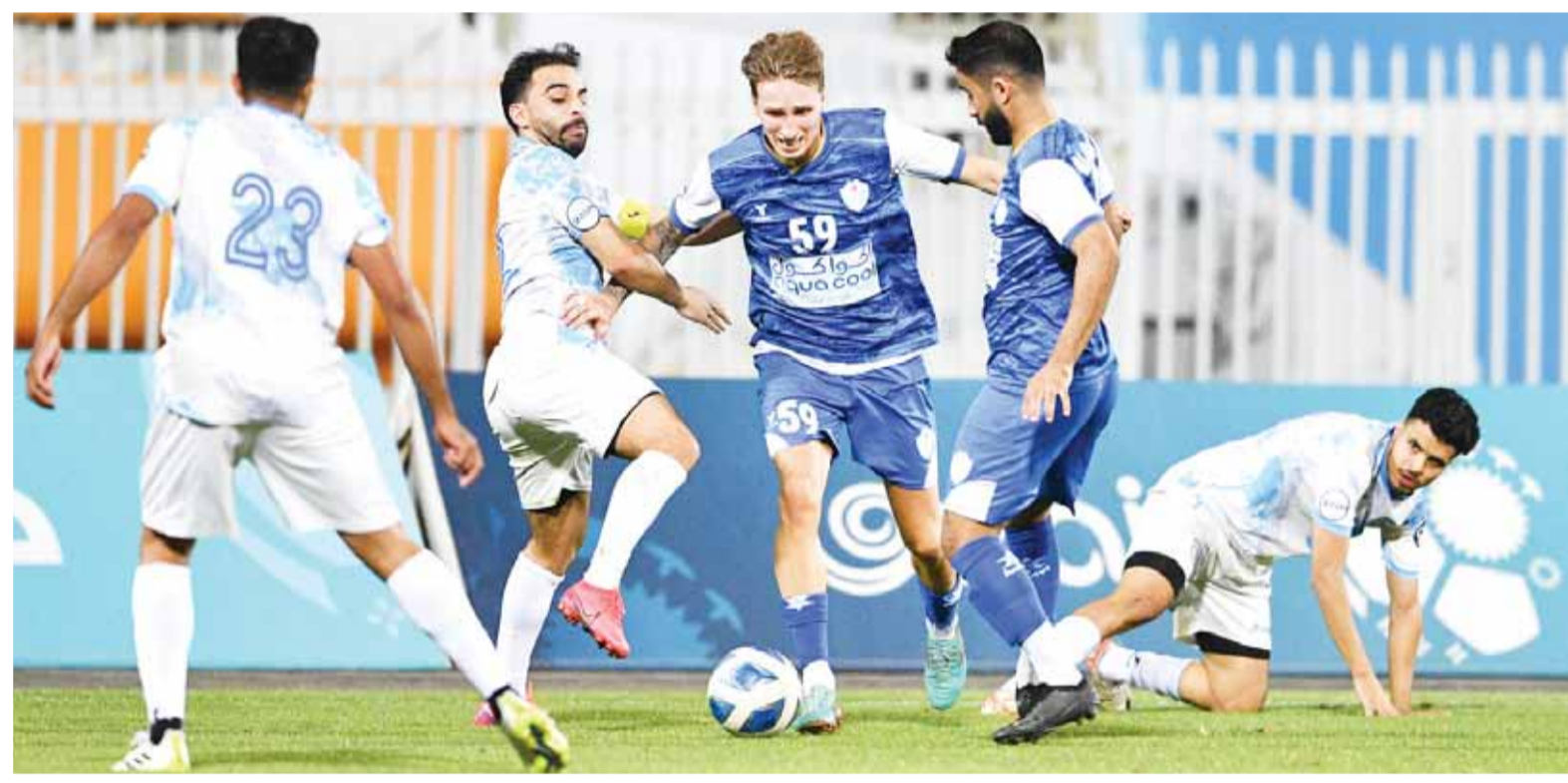
الجهراء دفع ثمن الفرص الضائعة أمام الشباب