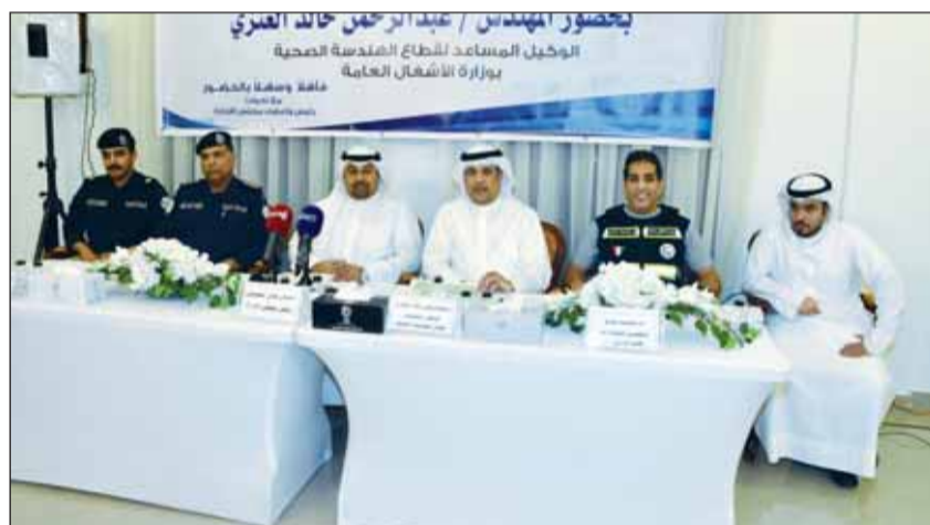
العنزي والعبيجان والقطان وحلو خلال الندوة

وأوضح أنه تم تحديد الصعوبات التي ستواجه الأعمال منها وجود المباني الخدمية والكثافة المرورية، كذلك ضيق الشوارع ووجود المظلات أمام المنازل، لافتاً إلى أن من بين الصعوبات التي ستواجه الأعمال أيضاً وقوف السيارات على الأرصفة وأوقات الدوام الرسمي خلال فصل الصيف والذي تحدده وزارة الشؤون حيث سيتم الالتزام بها احتراماً لقوانين الدولة، كما سيتم إيقاف الأعمال أوقات الذروة المرورية بالتعاون والتنسيق مع وزارة الداخلية.