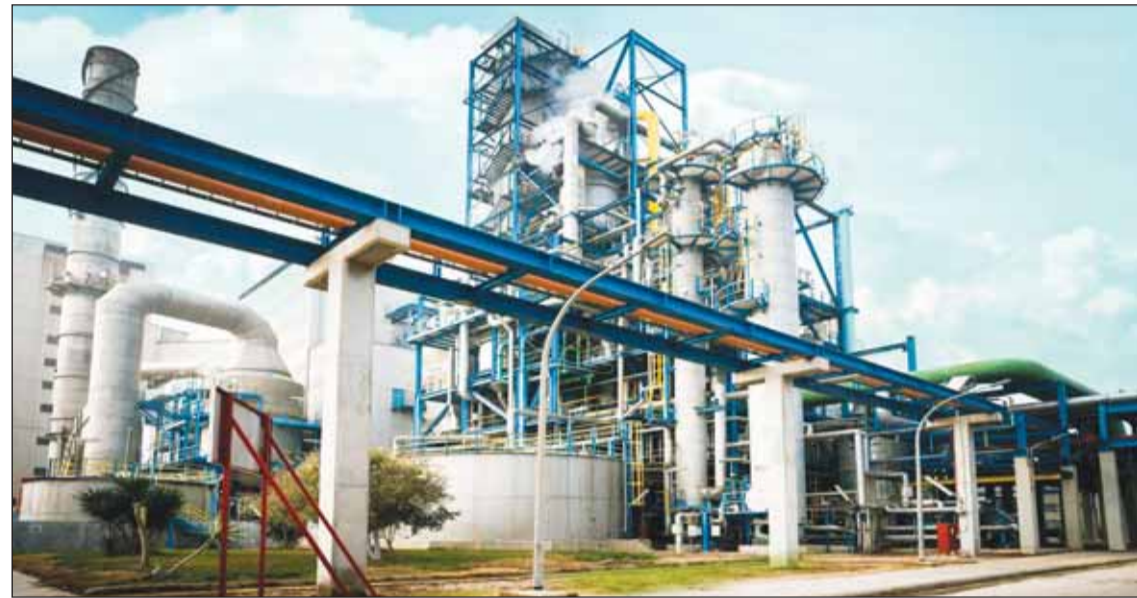
مصنع الاسكندرية للأسمدة