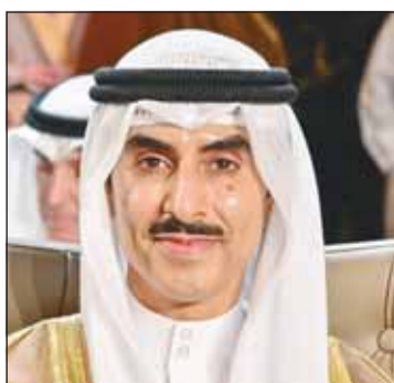
الشيخ ثامر الجابر

والاستقرار في المنطقة والتنمية المستدامة واتخاذ القرارات اللازمة للمحافظة على تقوية الروابط وكيان الأمة العربية ومستقبل الشعوب. وذكر أن دولة الكويت بقيادة سمو أمير البلاد الشيخ مشعل الأحمد تولي أهمية خاصة للبيت العربي وفي مقدمتها دعم الحق الفلسطيني وذلك ما جعلت عليه الكويت في ماضيها بثوابتها العربية الراضة وحاضرها ومستقبلها. وأشاد بالجهود المتميزة لمملكة البحرين في الإعداد والتنظيم وخلق الأجواء العربية وصولاً إلى نجاح قمة المنامة، مؤكداً دعم الكويت للبحرين في إنجاح هذه القمة الاستثنائية في كل المحافل الدولية.