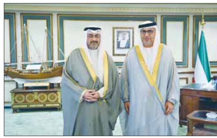
محافظ العاصمة الشيخ عبدالله العلي مستقبلاً سفير الإمارات د.مطر النيايدي

افتتح رئيس مجلس إدارة الهيئة الخيرية الإسلامية العالمية، والمستشار الخاص للأمين العام للأمم المتحدة د.عبدالله المعتوق أعمال الاجتماع التاسع عشر للجمعية العامة للهيئة الخيرية الإسلامية العالمية معلناً عن بلوغ مخصصات الهيئة لدعم غزة حتى اليوم 5,4 مليون دولار، إذ عملت الهيئة على تمويل 54 مشروعاً بالشراكة مع الجمعيات الخيرية الكويتية والمنظمات الفلسطينية العاملة في غزة والهلال الأحمر التركي الداخل الفلسطيني. وقال المعتوق، على مدى أكثر من 7 شهور، لم تتوقف آلة القتل والبطش الصهيوني على غزة الأبية، وازاء هذا العدوان، استنفرت الهيئة جهودها وتدخلاتها الإنسانية من أجل مواكبة الوضع الإنساني المأساوي والكارثي في القطاع على مساري جمع التبرعات، ودراسة المشاريع الواردة من غزة، والعمل على سرعة تأمين الاحتياجات الأساسية من المساعدات الطبية والغذائية ومستلزمات الإيواء الضرورية والعاجلة للمدنيين والطواقم الطبية وفرق الدفاع المدني، حيث بلغت مخصصات الهيئة لدعم غزة حتى اليوم 5,4 ملايين دولار. وأضاف، إن الهيئة عملت على تمويل 54 مشروعاً بالشراكة مع الجمعيات الخيرية الكويتية والمنظمات الفلسطينية العاملة