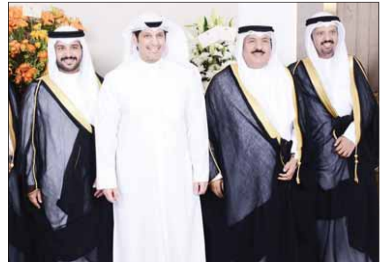
الوزير عبدالرحمن المطيري يبارك