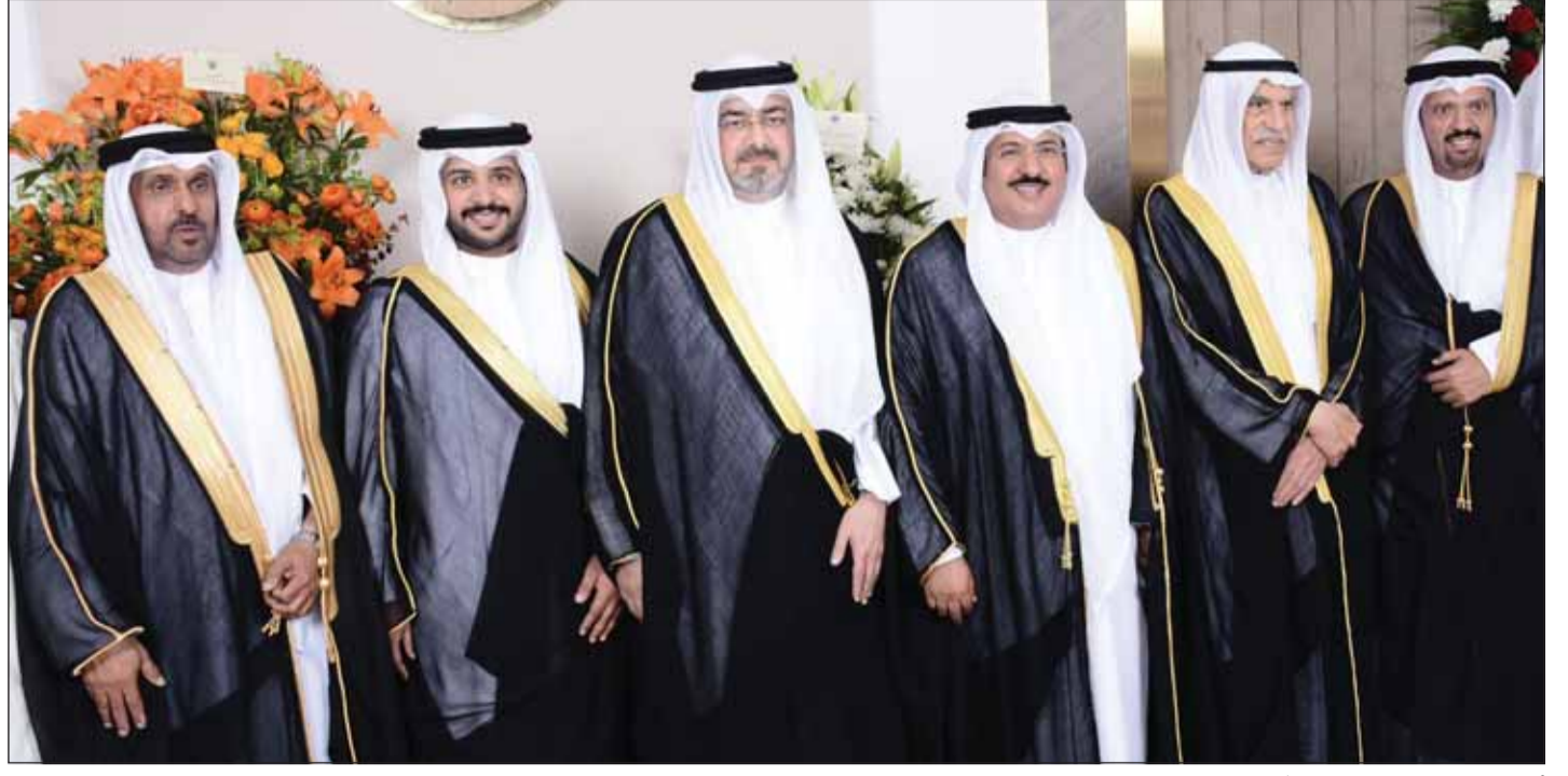
أحمد السعدون والشيخ عبدالله السالم يهنئان