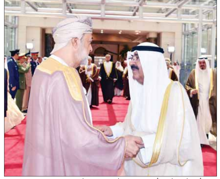
سمو الأمير الشيخ مشعل الأحمد والسلطان هيثم بن طارق وحديث ودمي قبيل المغادرة