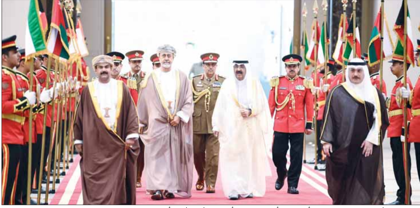
سلطان عُمان هيثم بن طارق لدى مغادرته البلاد أمس وعلمه رأس مودعيه سمو أمير البلاد الشيخ مشعل الأحمد