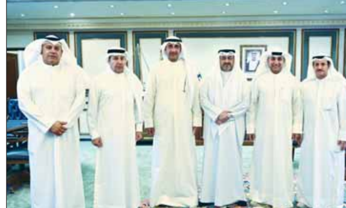
الشيخ عبدالله سالم العلي مستقبلاً جمعية الضباط المتقاعدين