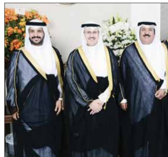
الشيخ فراس المالک قدم التهاني