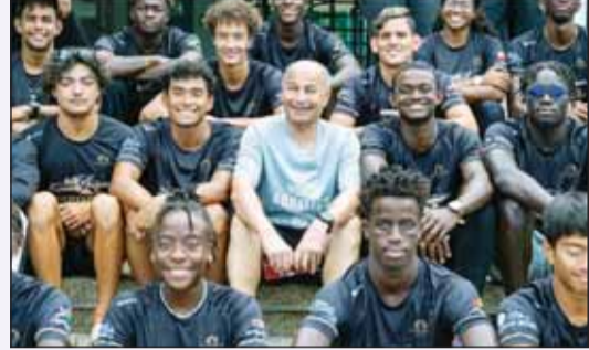
المسلم مع سباحو آسيا وأفريقيا

يستعد سباحو آسيا وأفريقيا واوشيانيا، لمنافسات دورة الألعاب الأولمبية والتي ستطلق يوم 26 يوليو المقبل في باريس، عبر إقامة التدريبات اليومية المكثفة في مقر الاتحاد الدولي للألعاب المائية للتطوير في جزيرة بوكيت التايلاندية. وتعتبر هذه التدريبات، أحد برامج الاتحاد الدولي لتطوير السباحة في العالم، حيث يشارك في التدريبات في بوكيت 38 سباحاً يمثلون 38 دولة من آسيا وأفريقيا. يذكر بأنه تم تأسيس مراكز تدريب وتطوير أخرى في البحرين، وهنغاريا، والولايات المتحدة وأستراليا وفرنسا. كما تم اعتماد هذه الخطة بعد تولي حسين المسلم رئاسة الاتحاد الدولي بعام 2021 في العاصمة القطرية الدوحة.