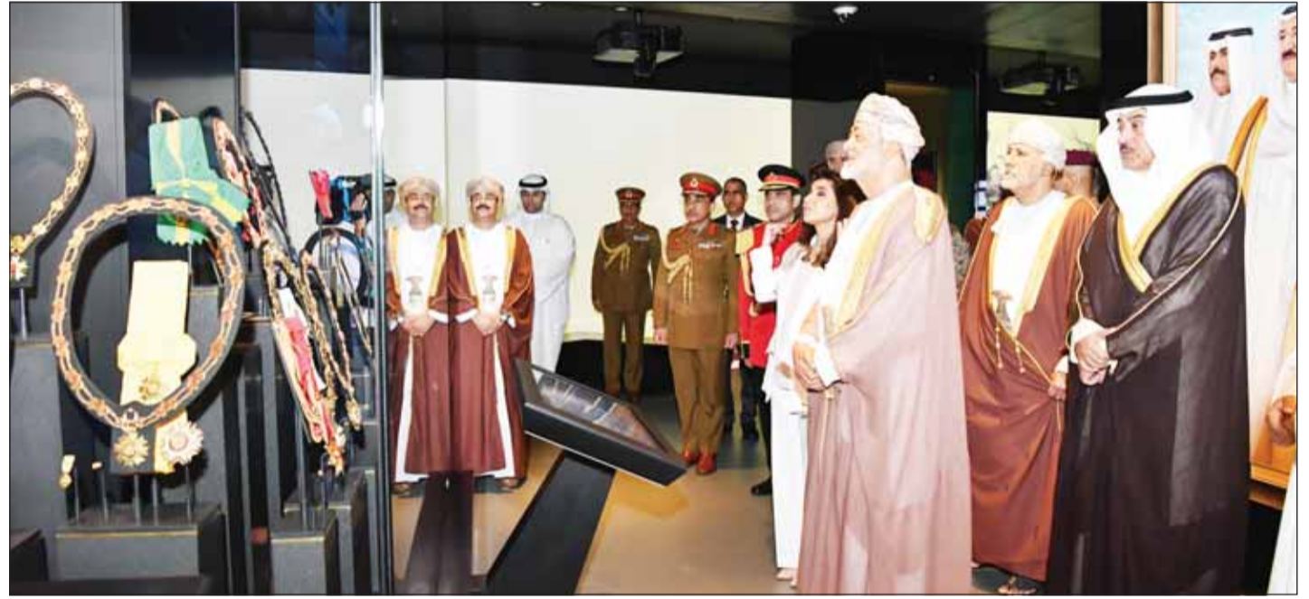
السلطان هيثم بن طارق والوفد المرافق أمام أحد مقتنيات متحف قصر السلام

وكان في استقباله وزير شؤون الديوان الأميري الشيخ محمد العبدالله، وقام السلطان بجولة في أرواء قصر السلام، حيث اطلع على ما يحتويه من مقتنيات ووثائق تاريخية وجوانب مهمة من تاريخ وحضارة الكويت والقاعات الرئيسية المكونة لمتحف قصر السلام وهي متحف الكويت عبر مكافها ومتحف تاريخ قصر السلام ومتحف الحضارات التي سكنت الكويت. بعدها تفضل بالتوقيع على سجل الشرف.