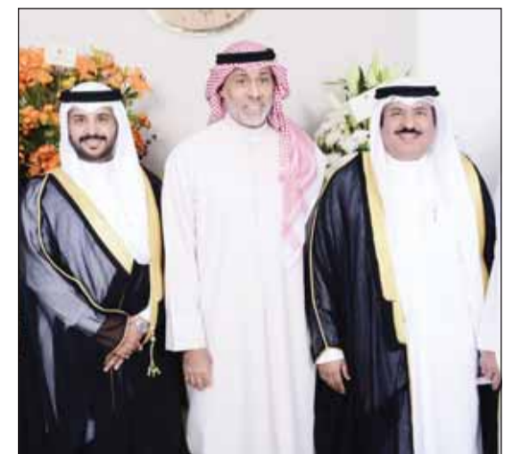
الشيخ عبدالله النواف يبارك