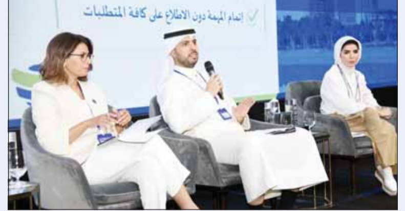
جانب من الحلقة النقاشية

وأشار المحاضرون إلى أهمية البرنامج في بناء القدرات البحثية وتمفيزها لتنمية الطاقات الوطنية من خلال خلق فرص تمويل البحوث، ونقل المعرفة المطلوبة للباحثين والمختصين وصناع القرار في الكويت، وتيسير التبادل العلمي والثقافي وتعزيز مشاركة وتبادل الخبرات بين الكويت وجامعة لندن للاقتصاد