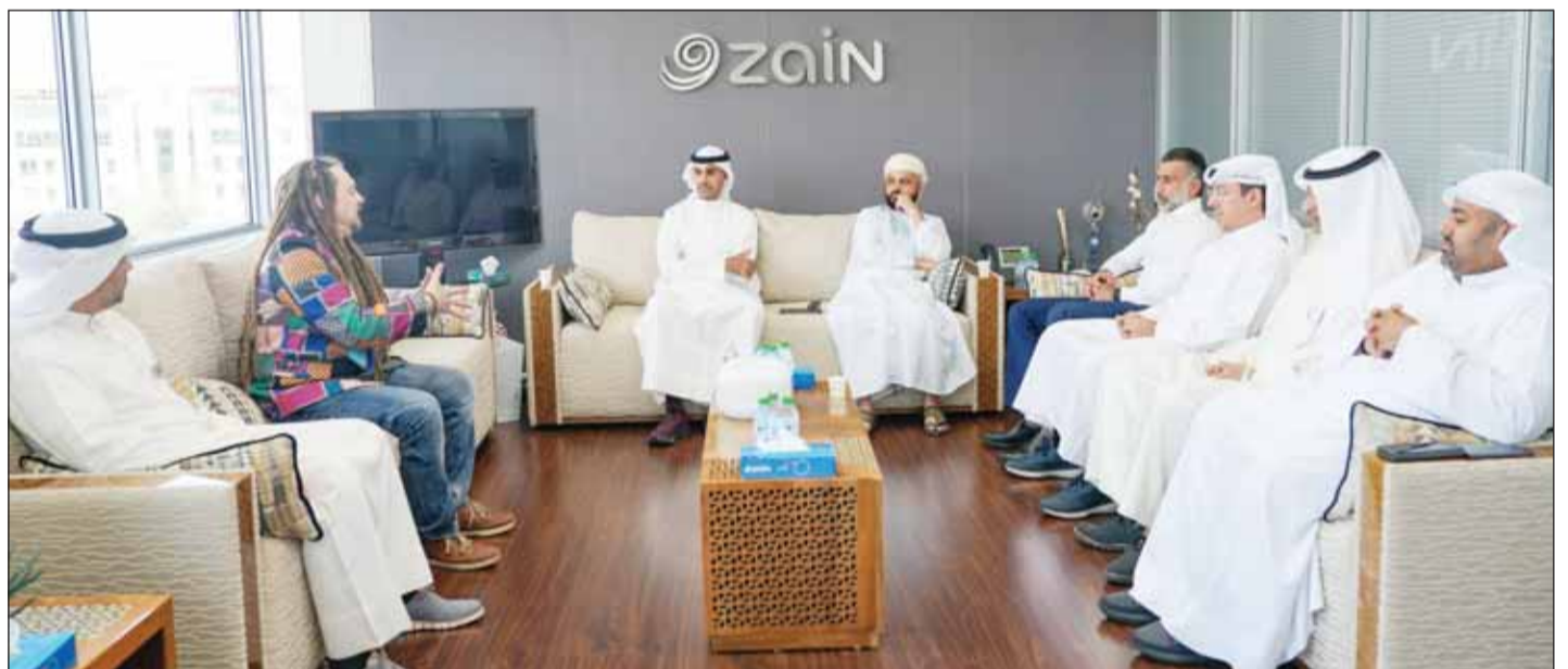
نيبفو التقى مع مدير الخرافية ومسؤولي الإدارة التنفيذية في "زين"

بهدف تقديم هذه التجربة العالمية المميزة للمجتمع الكويتي وتحقيق أكبر قدر من الفائدة للزيارة الأولى لبيرتراند نيبفو إلى منطقة الشرق الأوسط. وتضمنت الزيارة جلسة خاصة لموظفي زين وموظفي الشركة الاستراتيجيين استضافتها الشركة في مقرها الرئيسي، وجلسة عامة لمحتي التكنولوجيا ورؤاد الأعمال أقيمت في فندق فورسيزونز، وجلسة خاصة لطلبة وطلبات المرحلة الجامعية استضافتها جامعة الخليج للعلوم والتكنولوجيا. ولد بيرتراند نيبفو في عائلة اشتهرت بمهيمتها في قيادة الأعمال، ورث عنها حبه بالابتكار منذ صغره، وعكف منذ العام 2005 على تنمية شغفه بتقنيات الواقع الافتراضي (VR) والواقع المُمزج (AR) عندما أسس شركته الناشئة Vrvana. وقد أحدث مسيرته مُنعطفاً هاماً عندما تعاون هو وفريقه مع شركة Apple العالمية في كاليفورنيا،