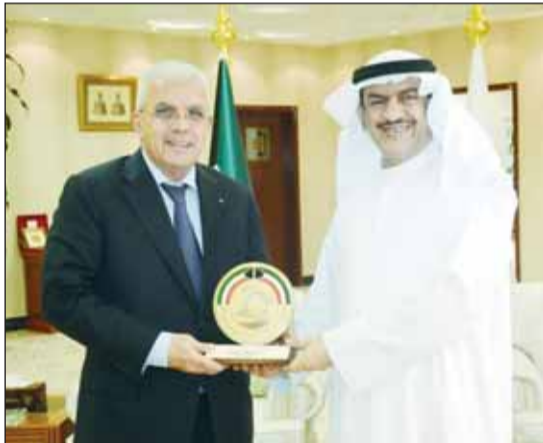
محافظ الجھراء مستقبلاً السفير الفلسطيني