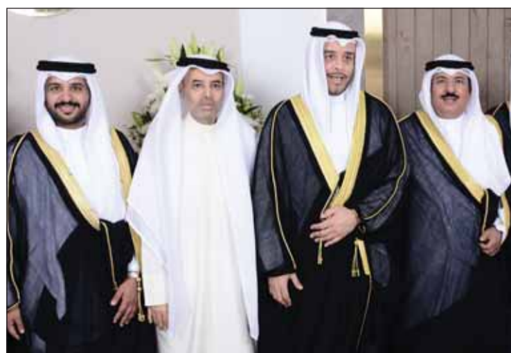
الشيخ عذبة الصباح ومبارك الحجرف يهنئان