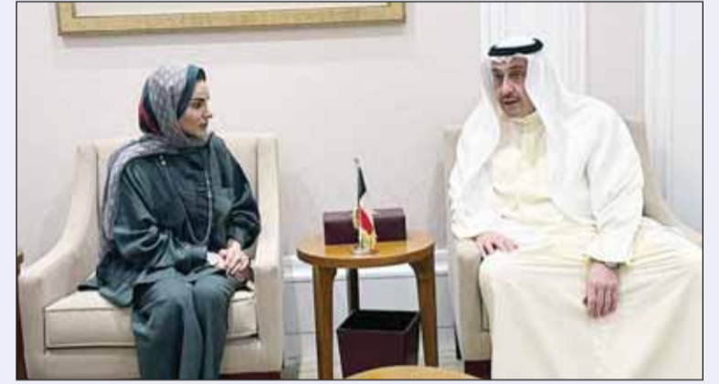
الشيخ فيصل الحمود خلال لقائه الوزيرة أمثال الحويلة

التقى المستشار في الديوان الأميري الشيخ فيصل الحمود وزير الشؤون الاجتماعية والعمل وشؤون الأسرة والطفولة ووزيرة الدولة لشؤون الشباب الدكتورة أمثال الحويلة حيث تناولت اللقاء القيادة السياسية وتمنى لها التوفيق والسداد في أداء مهام عملها وحمل الأمانة الوطنية بمسئولية تليها العقيدة الوزارية لشؤون الشباب. وتبادل الحمود والوزيرة الحويلة الأمانيات حول الاهتمام بالشباب وتوخي جميع