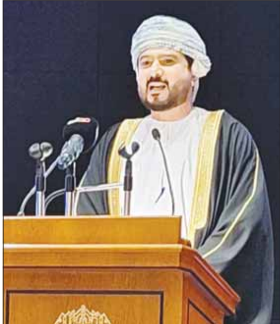
وزير التجارة العماني قيس اليوسف

اليوسف: نستهدف تنويع الواردات وتعزيز الصادرات واستكشاف الفرص الصناعية المشتركة