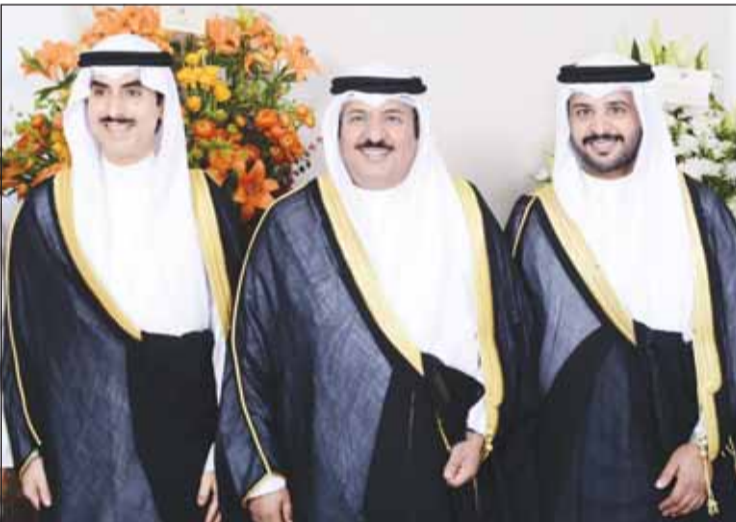
وتهنئة من الشيخ ثامر الجابر