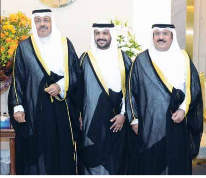
سمو الشيخ أحمد النواف مع المعرس ووالده