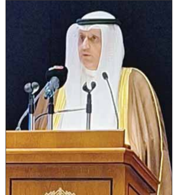
وزير التجارة عمر العمر