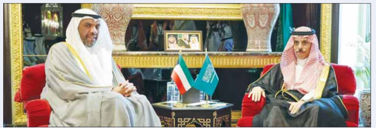
وزير الخارجية عبد الله اليحيا خلال لقائه نظيره السعودي الأمير فيصل بن فرحان

الانسانية للشعب السوداني ومساندته في محنته التي يمر بها. من جانبه، جدد الوزير اليحيا التزام الكويت بالوقوف مع السودان ودعم وحدتها واستقرارها وسلامة أراضيها وإعادة الأمن والأمان إلى ربوع السودان الشقيق ومساندته وصولاً إلى حل يقضي لإنهاء الأزمة التي يعيشها الشعب السوداني الشقيق. كما تناول اللقاء أطر التنسيق المشترك حيال تعزيز العمل العربي المشترك وغيرها من الملفات الثنائية والإقليمية.