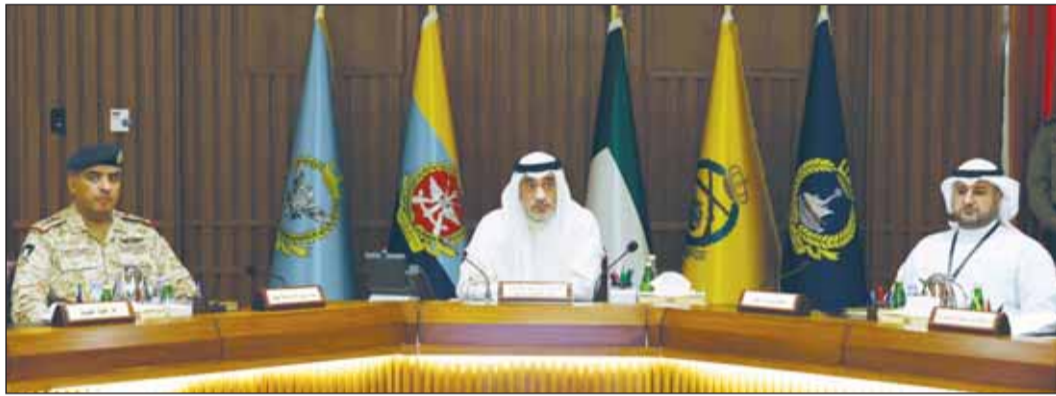
الشيخ فهد اليوسف مترئساً للاجتماع ومتوسطاً رئيس الأركان ووكيل وزارة الدفاع

تجديد الثقة الغالية محل تكليف ومسؤولية.. وأمانة أعاننا الله على حملها