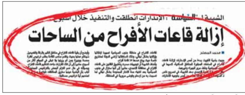
خبر "السياسة" المنشور فيه عدد أمس

ودعا ملك خيام قاعات الأفراح المقامة على أراضي الدولة إلى سرعة إزالتها قبل انقضاء مهلة الإنذار، مؤكداً أن الفرق الرقابية لن تتوانى في تنفيذ عملية الإزالة بعد انقضاء مهلة الإنذار.